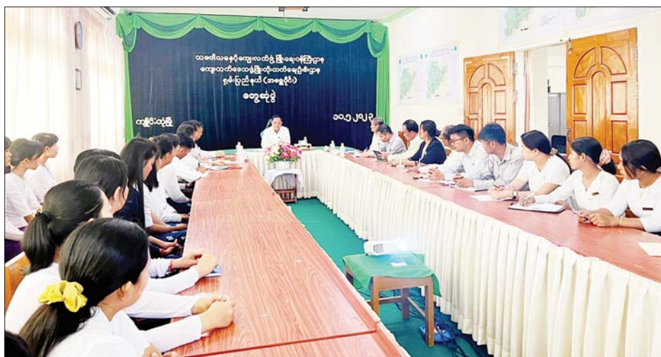
နည်းဥပဒေ၊ လုပ်ထုံးလုပ်နည်းများ၊ ဌာနအလိုက် မူဝါဒများ၊ လုပ်ငန်းတာဝန်များကို သိရှိနားလည်ပြီး စေတနာအရင်းခံ၍ ကြိုးပမ်းဆောင်ရွက်ကြစေလို

သမဝါယမနှင့် ကျေးလက်ဖွံ့ဖြိုးရေးဝန်ကြီးဌာန ပြည်ထောင်စုဝန်ကြီး ဦးလှမိုးသည် မေ ၁၁ ရက် နံနက်ပိုင်းက ရှမ်းပြည်နယ်(အရှေ့ပိုင်း) ကျိုင်းတုံမြို့ ကျေးလက်ဒေသ ဖွံ့ဖြိုးတိုးတက်ရေးဦးစီးဌာနရုံး အစည်းအဝေးခန်းမတွင် ဝန်ကြီးဌာနအောက်ရှိ ဦးစီးဌာနများမှ ဝန်ထမ်းများနှင့် တွေ့ဆုံသည်။