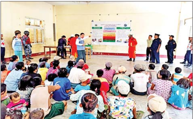
မေ ၁၁ ရက်တွင် ဧရာဝတီတိုင်းဒေသကြီး လပွတ္တာမြို့နယ်အတွင်းရှိ မီးသတ်တပ်ဖွဲ့ဝင်များက သဘာဝဘေးအန္တရာယ်ဆိုင်ရာ အသိပေးနှိုးဆော်ခြင်းနှင့် အသိပညာပေးခြင်းကို ဇေရွှေလေးဆိုင်ကလုန်းရပ်တန့် ဆောင်ရွက်ကြစဉ်။