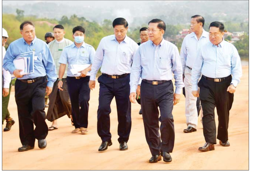
နိုင်ငံတော်စီမံအုပ်ချုပ်ရေးကောင်စီဥက္ကဋ္ဌ နိုင်ငံတော်ဝန်ကြီးချုပ် ဗိုလ်ချုပ်မှူးကြီးမင်းအောင်လှိုင် ကျိုင်းတုံလေယာဉ်ကွင်း လေယာဉ်ပြေးလမ်းအဆင့်မြှင့်တင်နိုင်ရေးလုပ်ငန်း ဆောင်ရွက်နေမှုများကို ကြည့်ရှုစစ်ဆေးစဉ်။