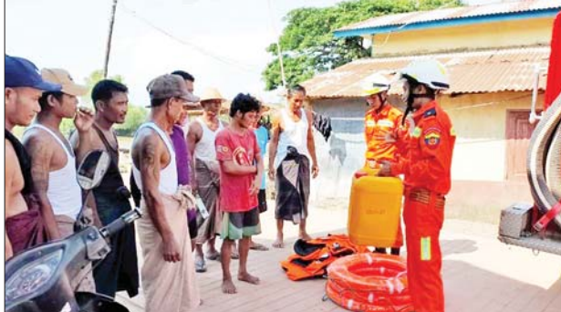
မေ ၁၁ ရက်တွင် မွန်ပြည်နယ် မုဒုံမြို့နယ် မီးသတ်တပ်ဖွဲ့ဝင်များက သဘာဝဘေးအန္တရာယ်ဆိုင်ရာ အသိပေးနှိုးဆော်ခြင်းနှင့် အသိပညာပေးခြင်းများကို ကမာအုပ်ကျေးရွာ၌ ဆောင်ရွက်ကြစဉ်။