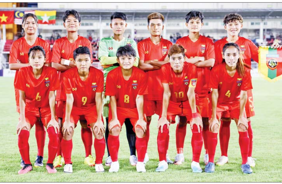
မြန်မာအမျိုးသမီးအသင်း ကစားသမားများကို တွေ့ရစဉ်။

ရန်ကုန် မေ ၁၁ (၃၂)ကြိမ်မြောက် ဆီးဂိမ်းအမျိုးသမီးဘောလုံး ပြိုင်ပွဲ ဆီမီးဖိုင်နယ်ပွဲစဉ်များကို မေ ၁၂ ရက်(ယနေ့) တွင် ကျင်းပမည်ဖြစ်ပြီး မြန်မာအသင်းသည် ထိုင်း အသင်းနှင့် ယှဉ်ပြိုင်ကစားရမည်ဖြစ်သည်။ ယှဉ်ပြိုင်ကစားမည် ဆီမီးဖိုင်နယ်ပွဲစဉ်များကို မေ ၁၂ ရက် မြန်မာ စံတော်ချိန် ညနေ ၆ နာရီခွဲတွင် တစ်ချိန်တည်း ကျင်းပမည်ဖြစ်ပြီး မြန်မာအသင်းနှင့် ထိုင်းအသင်း၊ လက်ရှိချန်ပီယံ ဗီယက်နမ်အသင်းနှင့် အိမ်ရှင် ကမ္ဘောဒီးယားအသင်း ယှဉ်ပြိုင်ကစားမည်ဖြစ်သည်။ မြန်မာအသင်းနှင့် ထိုင်းအသင်းသည် ၂၀၁၉ ဆီးဂိမ်း ပြိုင်ပွဲတွင် ဆီမီးဖိုင်နယ်တွင် တွေ့ဆုံပြီးနောက် တစ်ကျော့ပြန် ပြန်လည်တွေ့ဆုံခြင်းဖြစ်သည်။ မြန်မာအသင်းသည် ယခုပြိုင်ပွဲတွင် အုပ်စုကျပ် အတွင်း ကျရောက်ခဲ့သော်လည်း ကျော်ဖြတ်နိုင်ခဲ့ပြီး ဆီမီးဖိုင်နယ်သို့ တက်ရောက်လာခြင်းဖြစ်သည်။ စာမျက်နှာ ၁၇ ကော်လံ ၁ သို့ ၀