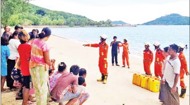
မေ ၁၁ ရက်တွင် တနင်္သာရီတိုင်းဒေသကြီး ကော့သောင်းမြို့နယ် အတွင်းရှိ မီးသတ်တပ်ဖွဲ့ဝင်များက သဘာဝဘေးအန္တရာယ်ဆိုင်ရာ အသိပေးနှိုးဆော်ခြင်းနှင့် အသိပညာပေးခြင်းများကို ကော့သောင်းမြို့နယ် ပုလဲတုံတုံးကျေးရွာကမ်းခြေ၌ ဆောင်ရွက်ကြစဉ်။

နေပြည်တော် မေ ၁၁ ပြည်ထဲရေးဝန်ကြီးဌာနကွပ်ကဲမှုအောက်ရှိ မီးသတ်ဦးစီးဌာနမှ မုန်တိုင်းဘေးအန္တရာယ် ကျရောက်လာပါက ကူညီကယ်ဆယ်ရေးလုပ်ငန်းများ၊ အရေးပေါ်ရှာဖွေကယ်ဆယ်ရေး လုပ်ငန်းများနှင့် အရေးပေါ် ပြုစုခြင်း၊ အရေးပေါ်ရွှေ့ပြောင်းပေးခြင်း လုပ်ငန်းများကို လျင်မြန်စွာ တုံ့ပြန်ဆောင်ရွက်နိုင်ရေးအတွက် တိုင်းဒေသကြီး/ ပြည်နယ်အသီးသီး၌ ကြိုတင်ပြင်ဆင်ခြင်း လုပ်ငန်းများ၊ ရှာဖွေကယ်ဆယ်ရေး လုပ်ငန်းသုံးပစ္စည်းကိရိယာများ၊ ရိက္ခာများ အသင့် စုဖွဲ့ထားရှိခြင်းများကို အရှိန်အဟုန်ဖြင့် ဆောင်ရွက်လျက်ရှိသည်။