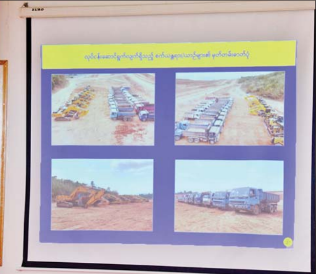
နိုင်ငံတော်စီမံအုပ်ချုပ်ရေးကောင်စီဥက္ကဋ္ဌ နိုင်ငံတော်ဝန်ကြီးချုပ် ဗိုလ်ချုပ်မှူးကြီးမင်းအောင်လှိုင်အား ကျိုင်းတုံလေဆိပ်ရင်းလင်းဆောင်၌ ဒုတိယဝန်ကြီးချုပ်နှင့် ပြည်ထောင်စုဝန်ကြီး ဗိုလ်ချုပ်ကြီးတင်အောင်စန်းက ရှင်းလင်းတင်ပြစဉ်။

☆ ရှေ့ဖုံးမှ ထို့နောက် လေဆိပ်ရင်းလင်းဆောင်တွင် ဒုတိယဝန်ကြီးချုပ်နှင့် ပိုဆောင်ရေးနှင့် ဆက်သွယ်ရေး ဝန်ကြီးဌာန ပြည်ထောင်စုဝန်ကြီး ဗိုလ်ချုပ်ကြီး တင်အောင်စန်း၊ စစ်ထောက်ချုပ် ဒုတိယ ဗိုလ်ချုပ်ကြီး ကျော်စွာလင်းနှင့် စစ်အင်ဂျင်နီယာညွှန်ကြားရေး မှူးရုံး ညွှန်ကြားရေးမှူး ဗိုလ်မှူးချုပ် ဇော်နိုင်ဦးတို့က ကျိုင်းတုံလေဆိပ် သမိုင်းအကျဉ်းနှင့် လေဆိပ် ဆိုင်ရာများ၊ လေယာဉ်ပြေးလမ်း နှင့် လေဆိပ်အဆင့်မြှင့်တင်နိုင် မည့်အခြေအနေများ၊ ဆက်လက် ဆောင်ရွက်သွားမည့် လျာထား