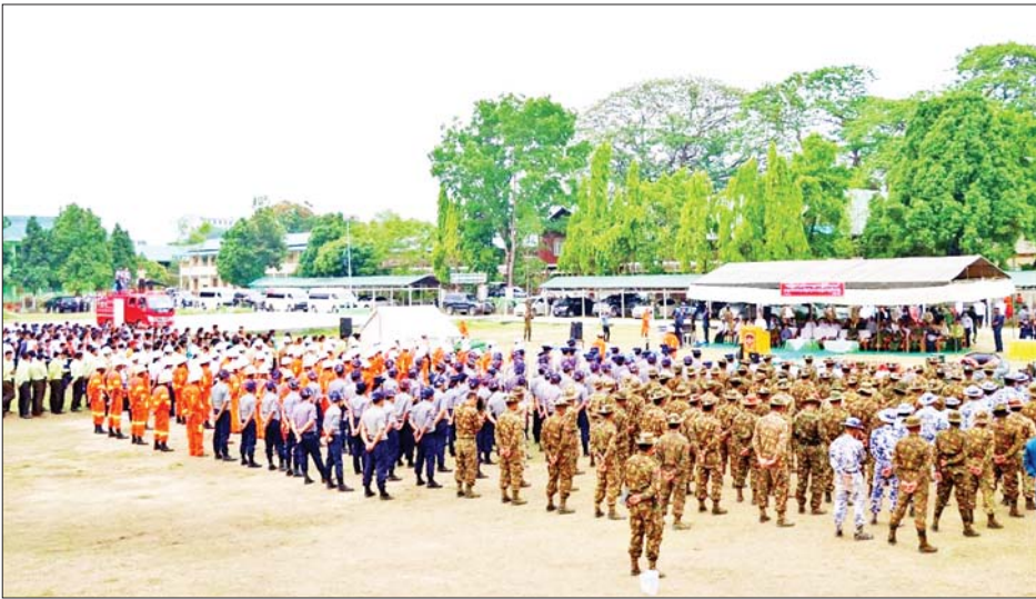
ကချင်ပြည်နယ်ဝန်ကြီးချုပ် ဦးခက်ထိန်နန် မြစ်ကြီးနားမြို့ရှိ အမှတ်(၁)အခြေခံပညာ အထက်တန်း ကျောင်း အားကစားကွင်း၌ မုန်တိုင်းဘေးအန္တရာယ်တုံ့ပြန်နိုင်ရေးအတွက် ရှာဖွေကယ်ဆယ်ရေး တပ်ဖွဲ့ဝင်များအား အမှာစကားပြောကြားစဉ်။

ထိုသို့ ဆောင်ရွက်လျက်ရှိရာ မေ ၁၀ ရက်နှင့် ယနေ့တို့တွင် ကချင်ပြည်နယ် မြစ်ကြီးနားမြို့ရှိ အမှတ်(၁) အခြေခံပညာအထက်တန်းကျောင်း အားကစားကွင်း၌လည်းကောင်း၊ မွန်ပြည်နယ် ပေါင်မြို့နယ် အလုပ်ကျေးရွာရှိသာယာကုန်းကျောင်း တိုက်၌လည်းကောင်း၊ ရန်ကုန်တိုင်းဒေသကြီး မင်္ဂလာဒုံမြို့နယ်ရှိ နယ်မြေခံတပ်၌ လည်းကောင်း၊