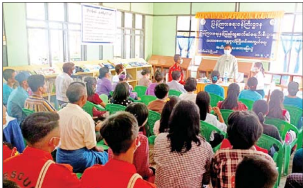
လက်ကမ်းစာစောင်များကို တက်ရောက်လာသူများအား ဖြန့်ဝေပေး ခဲ့ကြောင်း သိရသည်။

ယင်းနောက် မီးသတ်တပ်ဖွဲ့ဝင်များက မုန်တိုင်းဖြစ်ပွားပြီးနောက် ရှာဖွေကယ်ဆယ်ရေးလုပ်ငန်းများကို သရုပ်ပြသဆောင်ရွက်ခြင်း၊ ပြန်ကြားရေးနှင့် ပြည်သူ့ဆက်ဆံရေးဦးစီးဌာနမှ မုန်တိုင်းဘေး၊ ရေဘေး နှင့် ငလျင်ဘေးဆိုင်ရာ အသိပညာပေးနံရံကပ်စာစောင်နှင့် စာအုပ် များကို ခင်းကျင်းပြသခဲ့ပြီး မုန်တိုင်းဘေးအန္တရာယ်ဆိုင်ရာအသိပညာပေး