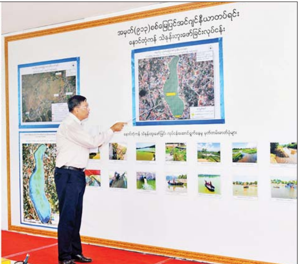
နိုင်ငံတော်စီမံအုပ်ချုပ်ရေးကောင်စီဥက္ကဋ္ဌ နိုင်ငံတော်ဝန်ကြီးချုပ် ဗိုလ်ချုပ်မှူးကြီးမင်းအောင်လှိုင်အား နောင်တုံကန်ပြုပြင်ထိန်းသိမ်းထားရှိမှုအခြေအနေများကို တာဝန်ရှိသူတစ်ဦးက ရှင်းလင်းတင်ပြစဉ်။