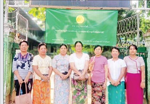
ရန်ကုန်တိုင်းဒေသကြီး ဗဟန်းမြို့နယ်တွင် အခြေခံပညာကျောင်း အသီးသီး၌ ကျောင်းအပ်နှံနိုင်ရေးပိုစတာများ စိုက်ထူခြင်းလှုပ်ရှားမှုများ ပြုလုပ်ရာ မေ ၁၀ ရက် နံနက်ပိုင်းက အမှတ်(၂)အခြေခံပညာအလယ်တန်း ကျောင်း၌ စိုက်ထူပေးကြစဉ်။ မြို့နယ်(ပြန်/ဆက်)