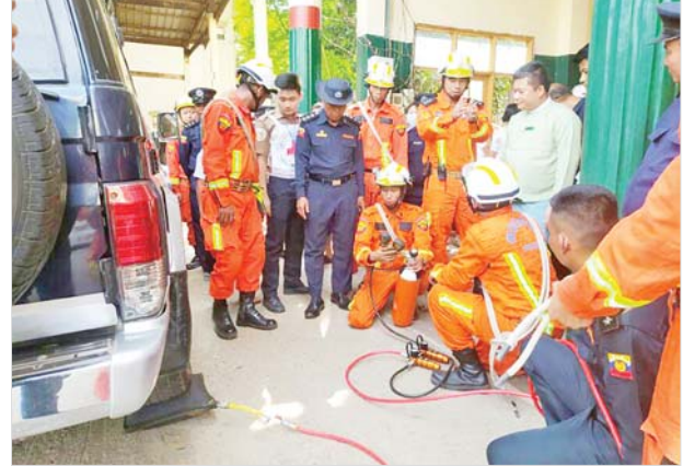
အင်းစိန်မြို့နယ်၌ သဘာဝဘေးကယ်ဆယ်ရေးလုပ်ငန်းများ ဆောင်ရွက်နိုင်ရန် ပြင်ဆင်ထားရှိမှုကို တာဝန်ရှိသူများ ကြည့်ရှု စစ်ဆေးစဉ်။

ပေါက်ခေါင်းမြို့နယ်၊ ပေါင်းတည်မြို့နယ်၊ သဲကုန်းမြို့နယ်နှင့် ရွှေတောင် မြို့နယ်တို့ရှိ မီးသတ်စခန်း လေးခုတို့တွင်လည်းကောင်း၊ မွန်ပြည်နယ် ကျိုက်ထိုမြို့နယ်၊ ကျိုက်မရောမြို့နယ်၊ ချောင်းဆုံမြို့နယ်၊ ဘီးလင်း မြို့နယ်၊ မော်လမြိုင်မြို့နယ်၊ မုဒုံမြို့နယ်၊ ရေးမြို့နယ်၊ သံဖြူဇရပ်မြို့နယ် တို့ရှိ မီးသတ်စခန်း ၁၀ ခု တို့တွင်လည်းကောင်း၊ တနင်္သာရီတိုင်းဒေသကြီး ပုလောမြို့နယ်၊ ဘုတ်ပြင်းမြို့နယ်၊ လောင်းလုံးမြို့နယ်၊ သရက်ချောင်း မြို့နယ်တို့ရှိ မီးသတ်စခန်း လေးခုတို့တွင်လည်းကောင်း၊ ရခိုင်ပြည်နယ် ကျောက်ဖြူမြို့နယ်နှင့် စစ်တွေမြို့နယ်တို့ရှိ မီးသတ်စခန်း နှစ်ခုတို့တွင် လည်းကောင်း၊ ရန်ကုန်တိုင်းဒေသကြီး ဒဂုံမြို့သစ်(အရှေ့ပိုင်း) မြို့နယ် နှင့် ရွှေပြည်သာမြို့နယ်တို့ရှိ မီးသတ်စခန်း နှစ်ခုတို့တွင်လည်းကောင်း၊ ဧရာဝတီတိုင်းဒေသကြီး မြန်အောင်မြို့နယ်နှင့် အင်္ဂပူမြို့နယ်တို့ရှိ မီးသတ်စခန်း နှစ်ခုတို့တွင်လည်းကောင်း မုန်တိုင်းဘေးအန္တရာယ် ကျရောက်လာပါက ကူညီကယ်ဆယ်ရေးလုပ်ငန်းများဆောင်ရွက်နိုင် ရေး၊ ရှာဖွေကယ်ဆယ်ရေးလုပ်ငန်းများ ဆောင်ရွက်နိုင်ရေးနှင့် အရေးပေါ် ပြုစုခြင်းလုပ်ငန်းများ ဆောင်ရွက်နိုင်ရေးတို့အတွက် အသင့်ကြိုတင် ပြင်ဆင်ဇာတ်တိုက်လေ့ကျင့်မှုများ ဆောင်ရွက်လျက်ရှိကြောင်းနှင့် သက်ဆိုင်ရာတိုင်းဒေသကြီး/ ပြည်နယ်များ၊ ခရိုင်များ၊ မြို့နယ်များ အလိုက် ပြည်သူများအနေဖြင့် မုန်တိုင်းဘေးအန္တရာယ်နှင့် ပတ်သက်၍ ကြိုတင်ကာကွယ်နိုင်ရေးအတွက် အသိပေးနှိုးဆော်ခြင်းများ ဆောင် ရွက်လျက်ရှိကြောင်း သိရသည်။ သတင်းစဉ်