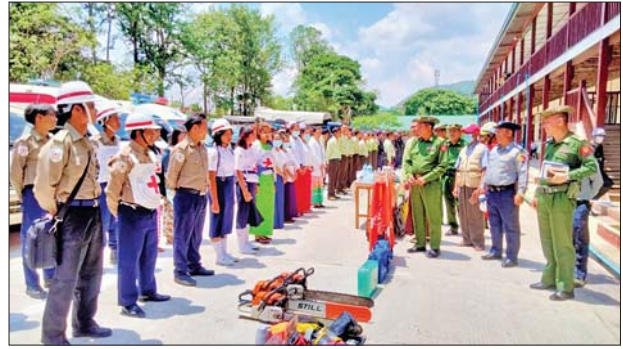
ကလေးမြို့နယ်၌ သဘာဝဘေးကယ်ဆယ်ရေးလုပ်ငန်းများ ဆောင်ရွက်နိုင်ရန် လူမှုရေးအသင်းအဖွဲ့များ စုဖွဲ့ဆောင်ရွက်ခြင်းနှင့် လိုအပ်မည့် ပစ္စည်းကိရိယာများ ကြိုတင်စီစဉ်ဆောင်ရွက်ထားမှုကို တာဝန်ရှိသူများ ကြည့်ရှုစစ်ဆေးစဉ်။

ပြည်ထဲရေးဝန်ကြီးဌာနကွပ်ကဲမှုအောက်ရှိ မီးသတ်ဦးစီးဌာနမှ မုန်တိုင်းဘေးအန္တရာယ် ကျရောက်လာပါက ကူညီကယ်ဆယ်ရေး လုပ်ငန်းများ ဆောင်ရွက်နိုင်ရေး၊ ရှာဖွေကယ်ဆယ်ရေးလုပ်ငန်းများ