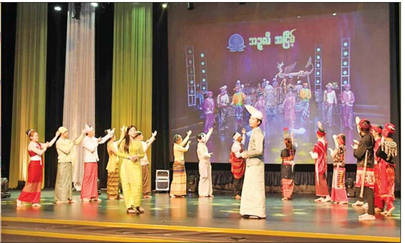
ပြည်ထောင်စုဝန်ကြီး ဦးမောင်မောင်အုန်းနှင့် တာဝန်ရှိသူများ မြန်မာ့အသံနှင့် ရုပ်မြင်သံကြားဝန်ထမ်းများ၏ ဖျော်ဖြေတင်ဆက်မှုကို ကြည့်ရှုအားပေးစဉ်။

ရိုက်ကူး ထုတ်လွှင့်ပြသရေးအပြင် အခမ်းအနားမှူးများ ပါဝင် ဆောင်ရွက်မှု၊ ဖျော်ဖြေရေး အစီအစဉ်များကိုလည်း အဆင့် အတန်းရှိရှိ တင်ဆက်နိုင်မှုတို့ဖြင့် လမ်းကြောင်းမှန်ပေါ်သို့ ရောက်ရှိ နေပြီဖြစ်ကြောင်း၊ မြန်မာ့အသံနှင့် ရုပ်မြင်သံကြားသို့ ရောက်ရှိလာ သည့် ဝန်ထမ်းသစ်များအားလုံးကို လှိုက်လှဲနွေးထွေးစွာ ကြိုဆိုပါ ကြောင်း၊ နိုင်ငံတော်မီဒီယာ၏ ရည်မှန်းချက်ကို အကောင်အထည် ဖော်ဆောင်ရွက်မည့် ဝန်ထမ်းများ ဖြည့်တင်းနိုင်ခြင်းဖြစ်၍ ခွန်အား သစ်များ ရရှိခြင်းပင်ဖြစ်ကြောင်း၊ ဝန်ထမ်းဖြစ်လာသည်နှင့် ဝန်ထမ်း တစ်ယောက်၏ စည်းမျဉ်း စည်းကမ်းများကို လိုက်နာရမည့် အပြင် ပေးအပ်သောတာဝန်ကို လည်း ကောင်းမွန်ကျေပွန်စွာ ထမ်းဆောင်ရမည် ဖြစ်ကြောင်း၊