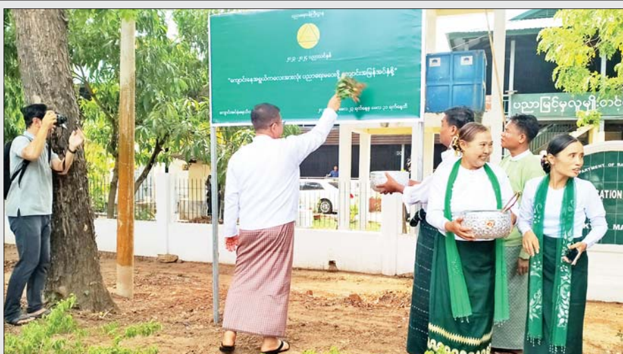
မွန်ပြည်နယ် ကျိုက်မရောမြို့နယ်၌ ကျောင်းအပ်နှံရေးသီတင်းပတ် မြေစိုက်ပိုစတာစိုက်ထူခြင်းကို မေ ၉ ရက် နံနက် ၉ နာရီက အခြေခံပညာအထက်တန်းကျောင်းရှေ့၌ ကျင်းပရာ မွန်ပြည်နယ် ဝန်ကြီးချုပ် ဦးအောင်ကြည်သိန်း မြေစိုက်ပိုစတာအား အမွှေးနံ့သာရည်များ ပက်ဖျန်း၍ စိုက်ထူပေးစဉ်။ မြို့နယ်(ပြန်/ဆက်)