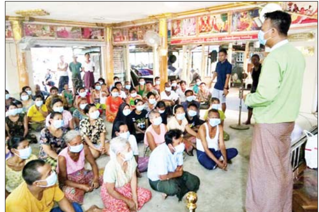
တွေ့ကြုံရတတ်သည့် လျှပ်စစ်အန္တရာယ်တို့ကို အသေးစိတ်ဆွေးနွေး ရှင်းလင်းပြောကြားခဲ့ကြောင်း သိရသည်။