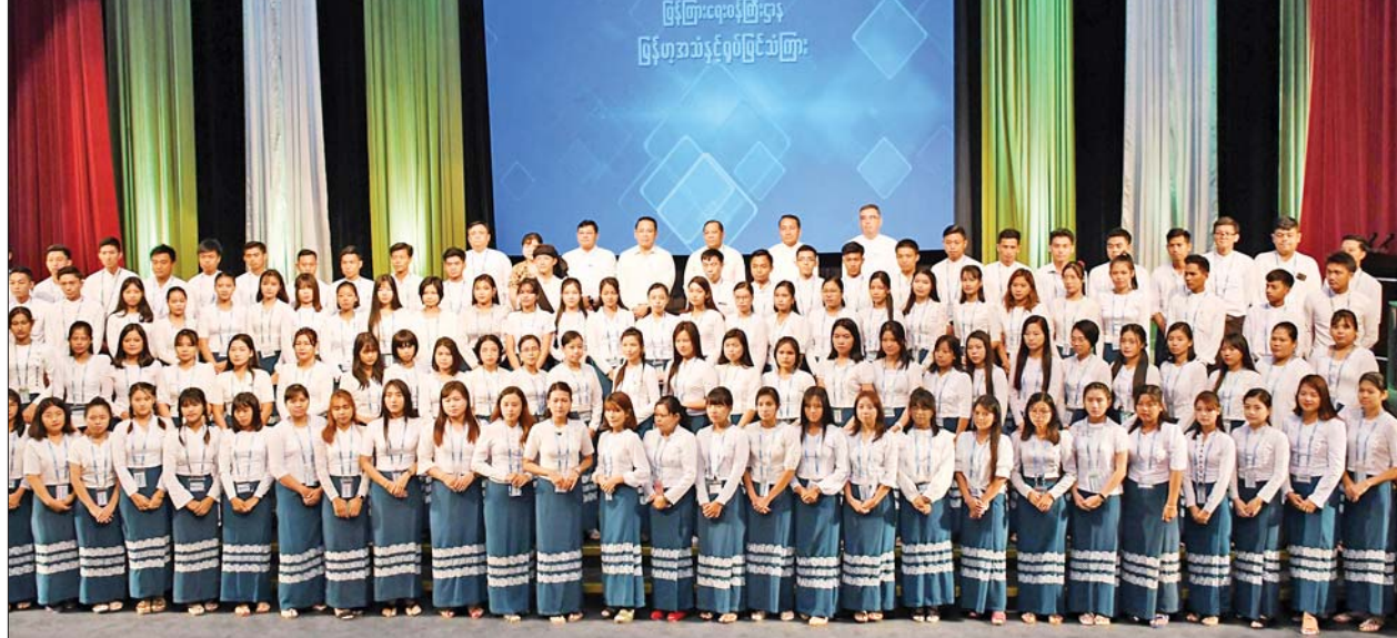
ပြည်ထောင်စုဝန်ကြီး ဦးမောင်မောင်အုန်းနှင့် တာဝန်ရှိသူများ မြန်မာ့အသံနှင့် ရုပ်မြင်သံကြားဝန်ထမ်းသစ်များနှင့်အတူ မှတ်တမ်းတင် ဓာတ်ပုံရိုက်ကြစဉ်။

ကြည့်ရှုစစ်ဆေး ဆက်လက်၍ မြန်မာ့အသံနှင့် ရုပ်မြင်သံကြားရှိ လူပျိုဆောင်၊ အပျိုဆောင်နှင့် အိမ်ထောင်သည် လိုင်းခန်းများသို့ သွားရောက်ကာ နေထိုင်စားသောက်မှု အခြေအနေ များကို ကြည့်ရှုစစ်ဆေးပြီး မီးဘေး အန္တရာယ် မဖြစ်ပေါ်စေရေး ကြိုတင် ကာကွယ်ဆောင်ရွက် သွားရန်နှင့် အိမ်ရာဝင်းအတွင်း သန့်ရှင်း သာယာလှပစေရေး ပေါင်းစပ် ဆောင်ရွက်သွားရန် မှာကြားခဲ့သည်။