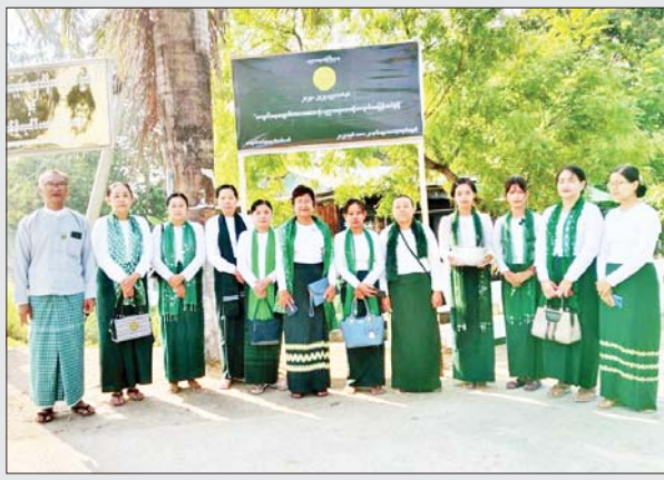
ဧရာဝတီတိုင်းဒေသကြီး လေးမျက်နှာမြို့နယ် ဗိုလ်ချုပ်လမ်းဆုံ တွင် ကျောင်းအပ်နှံရေးလှုပ်ရှားမှုဆိုင်ဘုတ်စိုက်ထူပွဲကို မေ ၁၀ ရက် နံနက်ပိုင်းက ပြုလုပ်စဉ်။ မြို့နယ်(ပြန်/ဆက်)