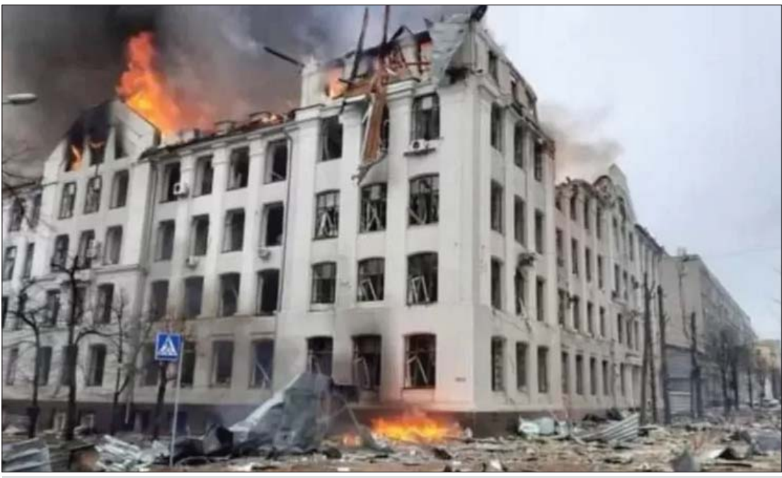
ရုရှား-ယူကရိန်း ပဋိပက္ခကြောင့် ယူကရိန်းနိုင်ငံ ဒုတိယအကြီးဆုံးမြို့ဖြစ်သည့် ခါကီဗ်မြို့၌ ပျက်စီးသွားသော အဆောက်အအုံကို တွေ့ရစဉ်။

ယူကရိန်း-ရုရှား ပဋိပက္ခနဲ့အတူ ယနေ့ ကမ္ဘာ့ပဋိပက္ခပေါင်းစုံရဲ့ တရားခံ အစစ်ကို မြင်အောင်ကြည့်သင့်ပါတယ်။ သမိုင်းမှာ အမေရိကန်နဲ့ အနောက်အုပ်စု ဟာ ရုရှားကို အချိန်ပြည့် ရန်လိုခဲ့ကြ တယ်။ ကမ္ဘာကြီးငြိမ်းချမ်းရေးအတွက် ပူးပေါင်း အလုပ်လုပ်ကြရမယ့်အစား ရုရှားကို အမြဲဆန့်ကျင်ခဲ့ကြတယ်။ ယူကရိန်းသမ္မတ ဇာလန်စကီးကိုယ်တိုင် နှစ်ပေါင်းများစွာ သူပြည်သူနဲ့ အထူး သဖြင့် ယူကရိန်းလူငယ်တွေကို ရုရှား လူမျိုးတွေအပေါ် မုန်းတီးနေအောင် စိတ်ဓာတ်ရေးရာအရ ဝါဒဖြန့်ရိုက်သွင်း ထားခဲ့ကြတယ်။ အတိတ်က ညီအစ်ကို တွေလိုနေခဲ့ကြတဲ့ ရုရှားတွေကိုဆန့်ကျင် ပြီး အနောက်အုပ်စုအလိုကျ ရုရှား ဆန့်ကျင်ရေးစာပေတွေကို ယူကရိန်း ကျောင်းတွေမှာ သင်ကြားပို့ချခဲ့ကြတဲ့ အထောက်အထားများစွာ ရှိပါတယ်။