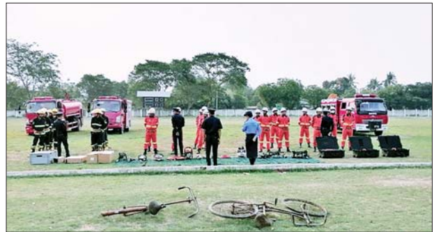
ယင်းမာပင်မြို့နယ်၌ သဘာဝဘေးအန္တရာယ် ကျရောက်ပါက ရှာဖွေကယ်ဆယ်ရေးလုပ်ငန်းများ ဆောင်ရွက်နိုင်ရန် ပစ္စည်းကိရိယာ များ အသင့်စုဖွဲ့ထားရှိမှုနှင့် လက်တွေ့သရုပ်ပြခြင်းဆောင်ရွက်စဉ်။

ဆောင်ရွက်နိုင်ရေးနှင့် အရေးပေါ်ပြုစုခြင်းလုပ်ငန်းများဆောင်ရွက် နိုင်ရေးတို့အတွက် တိုင်းဒေသကြီး/ ပြည်နယ်အသီးသီး၌ ကြိုတင် ပြင်ဆင်ခြင်းလုပ်ငန်းများကို အရှိန်အဟုန်ဖြင့် ဆောင်ရွက်လျက်ရှိသည်။ ထိုသို့ဆောင်ရွက်လျက်ရှိရာ ယနေ့တွင် ပဲခူးတိုင်းဒေသကြီး