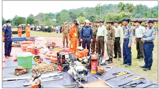
တန့်ယန်းမြို့နယ်၌ သဘာဝဘေးကယ်ဆယ်ရေးလုပ်ငန်းများ ဆောင်ရွက်နိုင်ရန် ပြင်ဆင်ထားရှိမှုနှင့် လိုအပ်မည့်ပစ္စည်းကိရိယာ များ ကြိုတင်စီစဉ်ဆောင်ရွက်ထားမှုကို တာဝန်ရှိသူများ ကြည့်ရှု စစ်ဆေးစဉ်။

ဆောင်ရွက်နိုင်ရေးနှင့် အရေးပေါ်ပြုစုခြင်းလုပ်ငန်းများဆောင်ရွက် နိုင်ရေးတို့အတွက် တိုင်းဒေသကြီး/ ပြည်နယ်အသီးသီး၌ ကြိုတင် ပြင်ဆင်ခြင်းလုပ်ငန်းများကို အရှိန်အဟုန်ဖြင့် ဆောင်ရွက်လျက်ရှိသည်။ ထိုသို့ဆောင်ရွက်လျက်ရှိရာ ယနေ့တွင် ပဲခူးတိုင်းဒေသကြီး