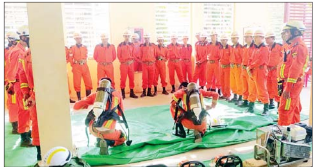
ခရမ်းမြို့နယ် မီးသတ်ဦးစီးဌာနမှ တပ်ဖွဲ့ဝင်များက မုန်တိုင်း အန္တရာယ် ကျရောက်ပါက အလျင်အမြန်တုံ့ပြန်ဆောင်ရွက်နိုင်ရေး ဇာတ်တိုက်လေ့ကျင့်ခြင်းများ ဆောင်ရွက်စဉ်။

ပေါက်ခေါင်းမြို့နယ်၊ ပေါင်းတည်မြို့နယ်၊ သဲကုန်းမြို့နယ်နှင့် ရွှေတောင် မြို့နယ်တို့ရှိ မီးသတ်စခန်း လေးခုတို့တွင်လည်းကောင်း၊ မွန်ပြည်နယ် ကျိုက်ထိုမြို့နယ်၊ ကျိုက်မရောမြို့နယ်၊ ချောင်းဆုံမြို့နယ်၊ ဘီးလင်း မြို့နယ်၊ မော်လမြိုင်မြို့နယ်၊ မုဒုံမြို့နယ်၊ ရေးမြို့နယ်၊ သံဖြူဇရပ်မြို့နယ် တို့ရှိ မီးသတ်စခန်း ၁၀ ခု တို့တွင်လည်းကောင်း၊ တနင်္သာရီတိုင်းဒေသကြီး ပုလောမြို့နယ်၊ ဘုတ်ပြင်းမြို့နယ်၊ လောင်းလုံးမြို့နယ်၊ သရက်ချောင်း မြို့နယ်တို့ရှိ မီးသတ်စခန်း လေးခုတို့တွင်လည်းကောင်း၊ ရခိုင်ပြည်နယ် ကျောက်ဖြူမြို့နယ်နှင့် စစ်တွေမြို့နယ်တို့ရှိ မီးသတ်စခန်း နှစ်ခုတို့တွင် လည်းကောင်း၊ ရန်ကုန်တိုင်းဒေသကြီး ဒဂုံမြို့သစ်(အရှေ့ပိုင်း) မြို့နယ် နှင့် ရွှေပြည်သာမြို့နယ်တို့ရှိ မီးသတ်စခန်း နှစ်ခုတို့တွင်လည်းကောင်း၊ ဧရာဝတီတိုင်းဒေသကြီး မြန်အောင်မြို့နယ်နှင့် အင်္ဂပူမြို့နယ်တို့ရှိ မီးသတ်စခန်း နှစ်ခုတို့တွင်လည်းကောင်း မုန်တိုင်းဘေးအန္တရာယ် ကျရောက်လာပါက ကူညီကယ်ဆယ်ရေးလုပ်ငန်းများဆောင်ရွက်နိုင် ရေး၊ ရှာဖွေကယ်ဆယ်ရေးလုပ်ငန်းများ ဆောင်ရွက်နိုင်ရေးနှင့် အရေးပေါ် ပြုစုခြင်းလုပ်ငန်းများ ဆောင်ရွက်နိုင်ရေးတို့အတွက် အသင့်ကြိုတင် ပြင်ဆင်ဇာတ်တိုက်လေ့ကျင့်မှုများ ဆောင်ရွက်လျက်ရှိကြောင်းနှင့် သက်ဆိုင်ရာတိုင်းဒေသကြီး/ ပြည်နယ်များ၊ ခရိုင်များ၊ မြို့နယ်များ အလိုက် ပြည်သူများအနေဖြင့် မုန်တိုင်းဘေးအန္တရာယ်နှင့် ပတ်သက်၍ ကြိုတင်ကာကွယ်နိုင်ရေးအတွက် အသိပေးနှိုးဆော်ခြင်းများ ဆောင် ရွက်လျက်ရှိကြောင်း သိရသည်။ သတင်းစဉ်