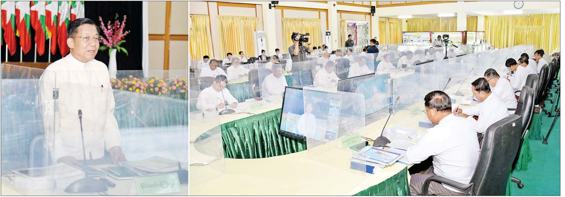
နိုင်ငံတော်စီမံအုပ်ချုပ်ရေးကောင်စီ ဥက္ကဋ္ဌ နိုင်ငံတော်ဝန်ကြီးချုပ် ဗိုလ်ချုပ်မှူးကြီး မင်းအောင်လှိုင် စိုက်ပျိုးစွမ်းအားမြှင့်တင်ရေးအစည်းအဝေးတွင် အမှာစကားပြောကြားစဉ်။

ရှေ့ဖုံးမှ တက်ရောက်ကြပြီး တိုင်းဒေသကြီးနှင့် ပြည်နယ် အစိုးရအဖွဲ့ ဝန်ကြီးချုပ်များက ဗီဒီယိုကွန်ဖရင့်စနစ် ဖြင့် တက်ရောက်ကြသည်။