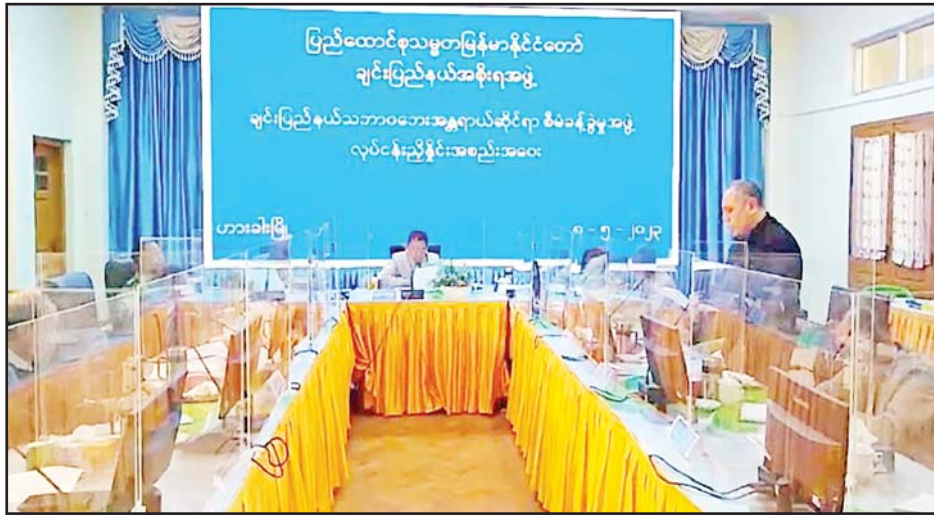
ချင်းပြည်နယ် သဘာဝဘေးအန္တရာယ်ဆိုင်ရာ စီမံခန့်ခွဲမှုအဖွဲ့ လုပ်ငန်းညှိနှိုင်းအစည်းအဝေးကျင်းပစဉ်။

တိုင်းဒေသကြီးနှင့် ပြည်နယ် သဘာဝဘေးအန္တရာယ်ကာကွယ်ရေးနှင့် အရေးပေါ်တုံ့ပြန်ရေးကော်မတီ၏ လုပ်ငန်းညှိနှိုင်းအစည်းအဝေးများကို ယနေ့နံနက်ပိုင်းတွင် ရန်ကုန်တိုင်းဒေသကြီး ဒဂုံမြို့နယ်ရှိ ရန်ကုန်တိုင်းဒေသကြီး အစိုးရအဖွဲ့ရုံး မင်္ဂလာခန်းမ၌လည်းကောင်း၊ ချင်းပြည်နယ်အစိုးရအဖွဲ့ရုံး အစည်းအဝေးခန်းမ၌လည်းကောင်း အသီးသီးပြုလုပ်ကြရာ သက်ဆိုင်ရာ တိုင်းဒေသကြီးနှင့် ပြည်နယ်များမှ ဝန်ကြီးချုပ်များ၊ တိုင်းစစ်ဌာနချုပ်များမှ တိုင်းမှူးနှင့် အဖွဲ့ဝင်များ၊ ဌာနဆိုင်ရာတာဝန်ရှိသူများ၊ သဘာဝဘေးအန္တရာယ်ကာကွယ်ထိန်းချုပ်ရေးနှင့် အရေးပေါ်တုံ့ပြန်ရေး ကော်မတီအဖွဲ့ဝင်များနှင့် တာဝန်ရှိသူများတက်ရောက်ကြသည်။