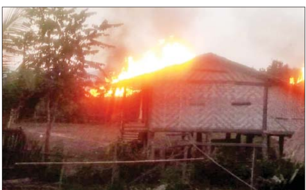
KIA အဖွဲ့မှ အကြမ်းဖက်မှုကို လိုလားသူများနှင့် PDF အမည်ခံ အကြမ်းဖက် သမားများက လက်နက်ကြီးများဖြင့် ပစ်ခတ်မှုကြောင့် သာယာကုန်းကျေးရွာရှိ လူနေအိမ်များမီးလောင်နေမှုပုံ။