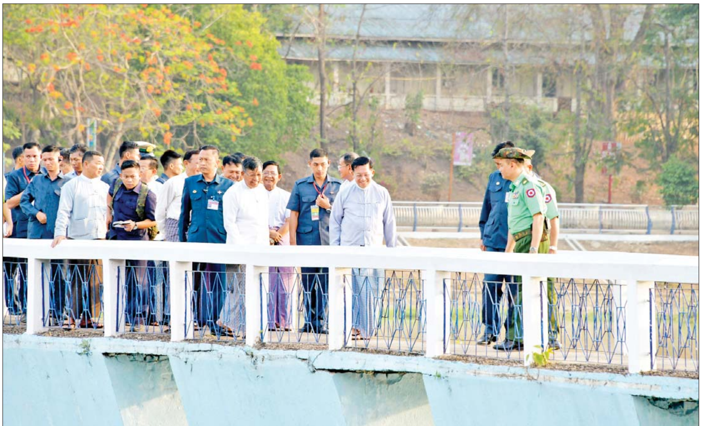
နိုင်ငံတော်စီမံအုပ်ချုပ်ရေးကောင်စီဥက္ကဋ္ဌ နိုင်ငံတော်ဝန်ကြီးချုပ် ဗိုလ်ချုပ်မှူးကြီး မင်းအောင်လှိုင် ပျဉ်းမနားမြို့ ကန်တော်မင်္ဂလာရှမ်းကန် အဆင့်မြှင့်တင်ဆောင်ရွက်နေမှုကို ကြည့်ရှုစစ်ဆေးစဉ်။

ရှင်းလင်းတင်ပြမှုများအပေါ် နိုင်ငံတော်စီမံအုပ်ချုပ်ရေးကောင်စီဥက္ကဋ္ဌ နိုင်ငံတော်ဝန်ကြီးချုပ်က ကန်တော်မင်္ဂလာရှမ်းကန်သည် ပျဉ်းမနားမြို့၏ ကျက်သရေဆောင် ကန်တော်တစ်ခုဖြစ်ပြီး အမည်နာမနှင့် လိုက်ဖက်ညီအောင် မင်္ဂလာရှိသည့် ကန်တော်တစ်ခုဖြစ်ရမည်ဖြစ်ကြောင်း၊ အဆင့်မြှင့်တင်ခြင်း လုပ်ငန်းများကို ဆောင်ရွက်ရာ၌ လုပ်ငန်းဆောင်ရွက်မှုအဆင့်အလိုက် စနစ်တကျဆောင်ရွက်သွားရန် လိုကြောင်း၊ နိုင်ငံ၏မြို့တော်ဖြစ်သည့် နေပြည်တော်ကို သာယာလှပမှုရှိစေရေး၊ လူနေမှုအဆင့်အတန်း မြင့်မားစေရေး ဆောင်ရွက်လျက်ရှိသကဲ့သို့ ပျဉ်းမနားမြို့ကိုလည်း ယခင်ကထက် သာယာလှပပြီး အဆင့်မီသည့် မြို့တစ်မြို့ဖြစ်အောင် ဆောင်ရွက်ရမည်ဖြစ်ကြောင်း၊ ထိုသို့ဆောင်ရွက်ရာတွင် မြို့နေပြည်သူလူထုကလည်း ဝိုင်းဝန်းပူးပေါင်းပါဝင် ဆောင်ရွက်ကြရန် လိုကြောင်း၊ ကန်အဆင့်မြှင့်တင် တူးဖော်ခြင်း