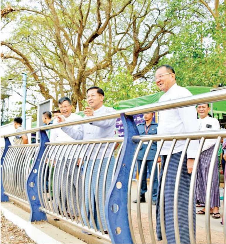
နိုင်ငံတော်စီမံအုပ်ချုပ်ရေးကောင်စီဥက္ကဋ္ဌ နိုင်ငံတော်ဝန်ကြီးချုပ် ဗိုလ်ချုပ်မှူးကြီးမင်းအောင်လှိုင် ပျဉ်းမနားမြို့ ကန်တော်မင်္ဂလာရမ်းကန်တွင် ခေတ်မီစက်ယန္တရားများအသုံးပြု၍ သဲနန်းတူးဖော်ရေးလုပ်ငန်းများ ဆောင်ရွက်နေမှုကို ကြည့်ရှုစစ်ဆေးစဉ်။