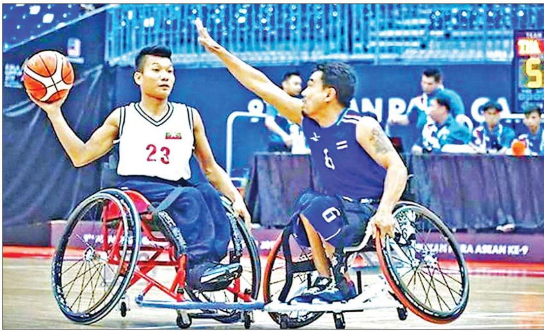
(၁၁) ကြိမ်မြောက် အာဆီယံမသန်စွမ်းအားကစားပြိုင်ပွဲတွင် မြန်မာနိုင်ငံ မသန်စွမ်းအားကစားအဖွဲ့မှ ဝင်ရောက်ယှဉ်ပြိုင်နေစဉ်။

၂၀၂၃ ခုနှစ် ဇွန်လ ၃ ရက်နေ့မှ ၉ ရက်နေ့အထိ ကမ္ဘောဒီးယားနိုင်ငံ၌ ကျင်းပပြုလုပ်မည့် (၁၂) ကြိမ်မြောက် အာဆီယံ မသန်စွမ်းအားကစားပြိုင်ပွဲ (12 th ASEAN Para Games) ကို မြန်မာနိုင်ငံ မသန်စွမ်းသူများ အားကစားအဖွဲ့