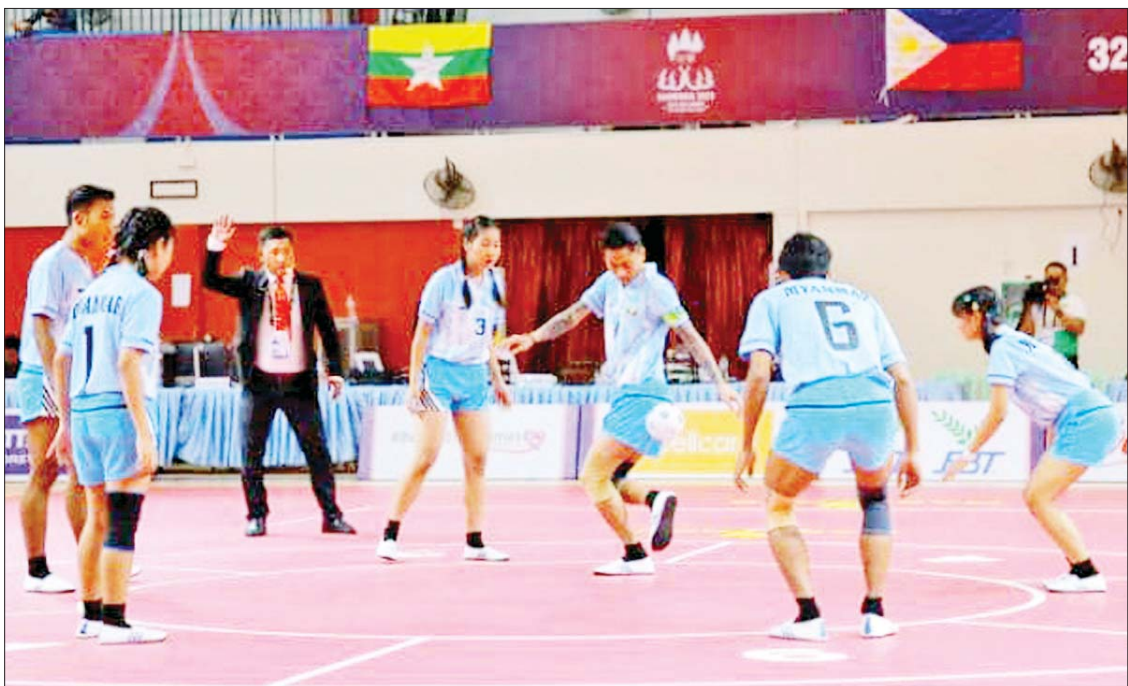
Linking Event-3 အမျိုးသား + အမျိုးသမီးပြိုင်ပွဲတွင် ရွှေတံဆိပ်ဆုရ မြန်မာခြင်းလုံးအသင်း ယှဉ်ပြိုင်နေစဉ်။