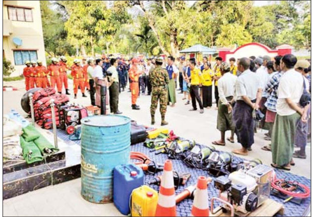
လူနှင့် အသက်ကယ်ပစ္စည်းများအသုံးပြု၍ ဆက်တိုက်လေ့ကျင့်မှု ပြုလုပ်ခဲ့ကြောင်း သိရသည်။

လုပ်ငန်းများ၊ ပြည်သူများ ကျယ်ကျယ်ပြန့်ပြန့်သိရှိစေရေး အသိပေးနှိုးဆော်ခြင်း၊ မုန်တိုင်းကျရောက်ပြီး ရှာဖွေကယ်ဆယ်ရေးလုပ်ငန်းများ ဆောင်ရွက်ခြင်း၊ ကယ်ဆယ်ရေးစခန်းများတွင် ကျန်းမာရေးနှင့် စားဝတ်နေရေးများ ကူညီဆောင်ရွက်ခြင်းလုပ်ငန်းများ၊ ရေပြင်ကယ်ဆယ်ရေးလုပ်ငန်းများ ဇာတ်တိုက်လေ့ကျင့်နေမှုများကို ကြည့်ရှု၍ လိုအပ်သည်များကို ပေါင်းစပ်ညှိနှိုင်းဆောင်ရွက်ပေးသည်။ ထို့နောက် မြို့နယ်မီးသတ်ဦးစီးဌာန ဦးစီးမှူး ဦးဆောင်၍ မီးသတ်တပ်ဖွဲ့ဝင်များ၊ ကြက်ခြေနီတပ်ဖွဲ့ဝင်များ၊ ရပ်ကွက်/ကျေးရွာ အုပ်ချုပ်ရေးမှူးများက သဘာဝဘေးအန္တရာယ်များဖြစ်သည့် မုန်တိုင်းအန္တရာယ်နှင့် ရေကြီးခြင်းတို့ ဖြစ်ပေါ်လာပါက အမြန်ဆုံး ကူညီကယ်ဆယ်နိုင်ရေးအတွက် ရေပြင်ရှာဖွေကယ်ဆယ်ခြင်းလုပ်ငန်းအဆင့်ဆင့်ကို