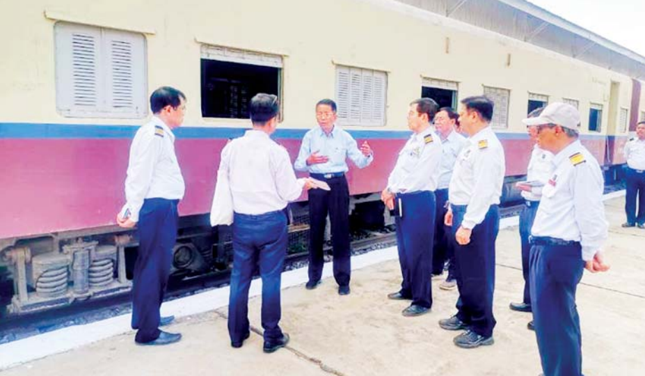
Compaction ကောင်းအောင် ဆောင်ရွက်ရန်၊ လုပ်ငန်းများ အချိန်မီပြီးစီးရေး ဆောင်ရွက်ရန်၊ မြင်းခြံ-ပုဂံ ရထားလမ်းပိုင်းရှိ တော၊ ချုံနွယ်များ

ပို့ဆောင်ရေးနှင့် ဆက်သွယ်ရေးဝန်ကြီးဌာန ဒုတိယဝန်ကြီး ဦးအောင်မြိုင်သည် တာဝန်ရှိသူများ နှင့်အတူ မေ ၄ ရက်မှ ၆ ရက်အထိ သာစည်-မြင်းခြံ ရထားလမ်းပိုင်း အဆင့်မြှင့်တင်နေမှု၊ မြင်းခြံ-ပုဂံ နှင့် ပုဂံ-ကျောက်ပန်းတောင်း-တောင်တွင်းကြီး ရထားလမ်းပိုင်းများ၊ ရထားလမ်း တံတားများနှင့် ဘူတာများကို စစ်ဆေးသည်။ ဒုတိယဝန်ကြီးသည် သာစည်-မြင်းခြံ ရထားလမ်းပိုင်း အဆင့်မြှင့်တင်နေမှုကို ပန်းအိုင် ဘူတာမှ မြင်းခြံဘူတာအထိ RBE ရထားဖြင့် လိုက်ပါစီးနင်း၍ စစ်ဆေးခဲ့ပြီး ကွန်ကရစ်ဖိလီယာတုံးများ သတ်မှတ် အကွာအဝေးအတိုင်းထည့်သွင်းရန်၊ သံလမ်းများ စနစ်တကျခင်းကျင်းရန်၊ အရည်အသွေး ပြည့်မီသော လမ်းခင်းကျောက်များ စံချိန်စံညွှန်းအတိုင်းထည့်သွင်းရန်၊ ဆွေးမြည့်နေသည့် သစ်သားဖိလီယာများ လဲလှယ်ရန်၊ ရထားလမ်းတာပေါင် ရေတိုက်စားပြီး ကျဉ်းသောနေရာများတွင် တာပေါင်မြေဖို့ပြီး