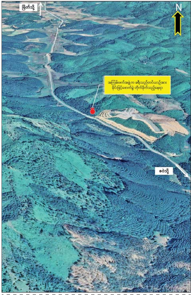
မြိတ်မြို့မှ မောတောင်သို့ ထွက်ခွာလာသည့် ခရီးသည်တင်မော်တော်ယာဉ်အား PDF အမည်ခံ အကြမ်းဖက်သမားများက လက်လုပ်မိုင်းဖြင့် ဖောက်ခွဲတိုက်ခိုက်ခဲ့သည့် မော်တော်ယာဉ်ပုံ။