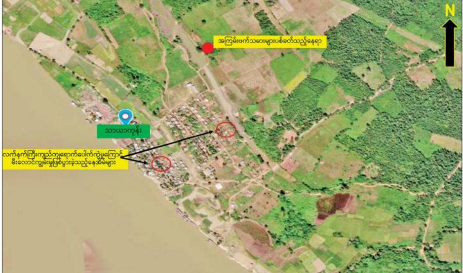
KIA အဖွဲ့မှ အကြမ်းဖက်မှုကိုလိုလားသူများနှင့် PDF အမည်ခံအကြမ်းဖက်သမားများက လက်နက်ကြီးများဖြင့် ပစ်ခတ်မှုကြောင့် မီးလောင်မှုဖြစ်ပွားခဲ့သည့် သာယာကုန်းကျေးရွာပြပုံ။

တိုက်ခိုက်ခဲ့ရာ အကြမ်းဖက်သမားများက ကျေးရွာ၏ အနောက်မြောက်ဘက်သို့ ဆုတ်ခွာထွက်ပြေးသွားခဲ့ကြောင်းနှင့် အဆိုပါအကြမ်းဖက်သမားများ ပစ်ခတ်တိုက်ခိုက်ခဲ့သည့် လက်နက်ကြီးကျည်များသည် ကျေးရွာအတွင်းကျရောက် ပေါက်ကွဲမှုကြောင့် မီးကူးစက်လောင်ကျွမ်းခဲ့ရာ လူနေအိမ် ၁၅ လုံး မီးလောင်ပျက်စီးခဲ့ကြောင်း သိရသည်။ ထိုသို့ အပြစ်မဲ့အရပ်သားပြည်သူများ နေထိုင်ရာ ကျေးရွာအတွင်းသို့ လက်နက်ကြီးများဖြင့်ပစ်ခတ်တိုက်ခိုက်ခဲ့သည့် အကြမ်းဖက်သမားများကို ဖမ်းဆီးအရေးယူနိုင်ရေးနှင့် နယ်မြေဒေသတည်ငြိမ်အေးချမ်းရေးအတွက် လုံခြုံရေးတပ်ဖွဲ့ဝင်များက လိုအပ်သည့် လုံခြုံရေးလုပ်ငန်းစဉ်များ ဆက်လက် ဆောင်ရွက်လျက်ရှိကြောင်း သိရသည်။ သတင်းစဉ်