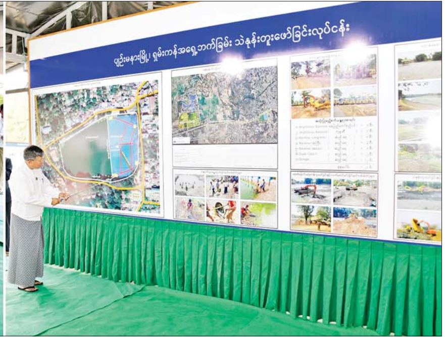
နိုင်ငံတော်စီမံအုပ်ချုပ်ရေးကောင်စီဥက္ကဋ္ဌ နိုင်ငံတော်ဝန်ကြီးချုပ် ဗိုလ်ချုပ်မှူးကြီး မင်းအောင်လှိုင်အား နေပြည်တော်ကောင်စီဥက္ကဋ္ဌ ဦးတင်ဦးလွင်က ရှင်းလင်းတင်ပြစဉ်။