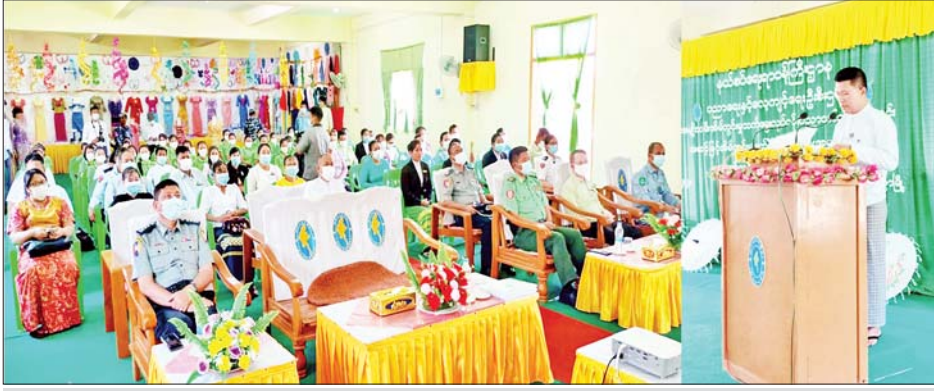
ဧရာဝတီတိုင်းဒေသကြီးဝန်ကြီးချုပ် ဦးတင်မောင်ဝင်း အမျိုးသမီးအိမ်တွင်းမှုသက်မွေးလုပ်ငန်း ပညာသင်တန်းကျောင်း လပွတ္တာသင်တန်းဖွင့်ပွဲအခမ်းအနားတွင် အမှာစကားပြောကြားစဉ်။

နေပြည်တော် မေ ၈ နယ်စပ်ရေးရာ ဝန်ကြီးဌာန ပညာရေးနှင့် လေ့ကျင့်ရေးဦးစီးဌာန ကွပ်ကဲမှုအောက်ရှိအမျိုးသမီးအိမ်တွင်းမှု သက်မွေးလုပ်ငန်းပညာသင်တန်းကျောင်း ၂၄ ကျောင်း၌ နယ်စပ်ဒေသအပါအဝင် အလုပ်အကိုင် အခွင့်အလမ်း နည်းပါးသောဒေသများမှ အမျိုးသမီးငယ်များအား အဆင့်မြင့် စက်ချုပ်ပညာရပ်များ သင်ကြား တတ်မြောက်စေခြင်းဖြင့် လူမှုစီးပွားဘဝ ဖွံ့ဖြိုးတိုးတက်ပြီး မိသားစု အပိုင်ငွေရရှိနိုင်စေရေး၊ အသက်မွေးဝမ်းကျောင်းလုပ်ငန်း အဖြစ် အထည်ချုပ်စက်ရုံများတွင် ဝင်ရောက် လုပ်ကိုင်နိုင်ရေးနှင့် ကိုယ်ပိုင်စက်ချုပ်ဆိုင်များ ဖွင့်လှစ် အဆင့်မြင့် အိမ်တွင်းမှုစက်ချုပ် သင်တန်း၊ ရိုးရာဂျပ်ခတ်သင်တန်း၊ အခြေခံလက်ရက်ကန်းသင်တန်း၊ ဟိုတယ်ဝန်ဆောင်မှု ဆိုင်ရာ သင်တန်းများကို ယနေ့နံနက်ပိုင်း တွင် ဖွင့်လှစ်သည်။ ထိုသို့ ဖွင့်လှစ်ရာ လှိုင်ကော်မြို့ သင်တန်းကျောင်းတွင် ကယား ပြည်နယ်ဝန်ကြီးချုပ် ဦးဇော်