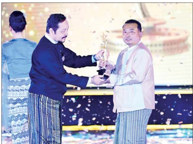
အကောင်းဆုံးရုပ်ရှင်တည်းဖြတ်ဆု (၂၀၂၂)ကို ကြည်သာ လက်ခံရယူစဉ်။