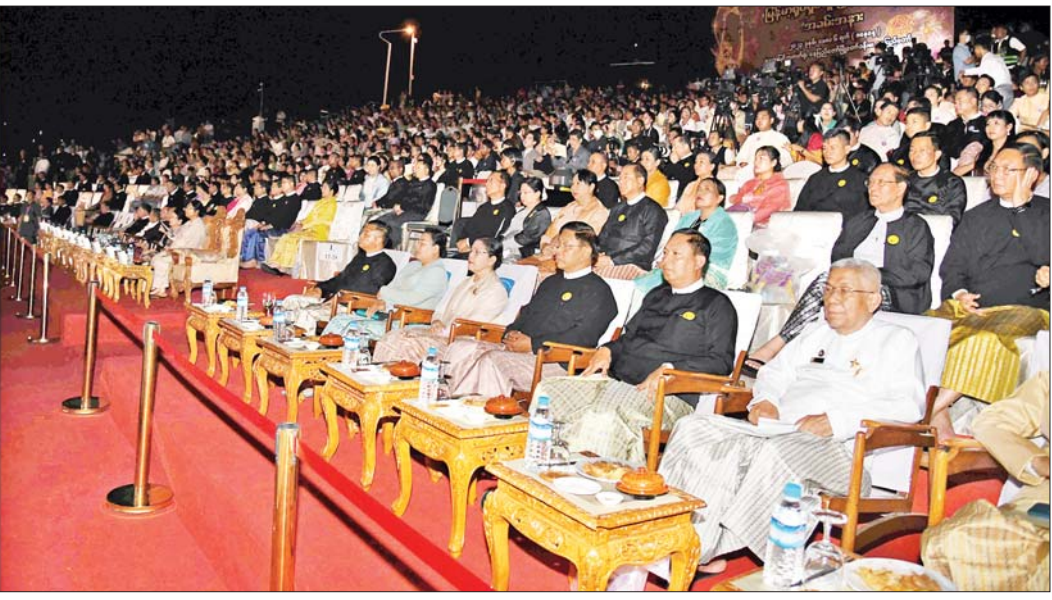
နိုင်ငံတော်စီမံအုပ်ချုပ်ရေးကောင်စီဒုတိယဥက္ကဋ္ဌ ဒုတိယဝန်ကြီးချုပ် ဒုတိယဗိုလ်ချုပ်မှူးကြီးစိုးဝင်း ၂၀၁၉ ခုနှစ်၊ ၂၀၂၀ ပြည့်နှစ်နှင့် ၂၀၂၂ ခုနှစ်များအတွက် မြန်မာ့ရုပ်ရှင်ထူးချွန်ဆု ချီးမြှင့်ပွဲ အခမ်းအနားတွင် အမှာစကားပြောကြားစဉ်။

တွေ့ဆုံဂုဏ်ပြုခွင့်ရသည့်အတွက် မိမိအနေဖြင့် များစွာဂုဏ်ယူ ဝမ်းမြောက်မိပါကြောင်း။ မြန်မာ့လွတ်လပ်ရေးကြိုးပမ်းမှု ကာလကတည်းက စတင် ပေါ်ပေါက်လာခဲ့သည့် မြန်မာ့ ရုပ်ရှင်သမိုင်းသည် ၂၀၂၀ ပြည့်နှစ် တွင် နှစ်ပေါင်း(၁၀၀)ပြည့်ခဲ့ပြီး ယခုဆိုရင် (၁၀၁)နှစ် တိုင်ခဲ့ပြီဖြစ် ပါကြောင်း။