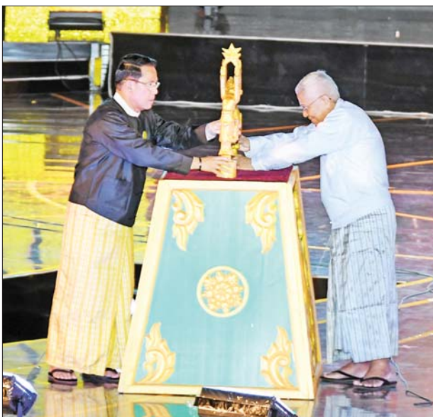
၂၀၁၉ ခုနှစ်၊ ၂၀၂၀ ပြည့်နှစ်နှင့် ၂၀၂၂ ခုနှစ်တို့အတွက် မြန်မာ့ရုပ်ရှင်ထူးချွန်ဆုချီးမြှင့်ပွဲအခမ်းအနားကို ပြည်ထောင်စုဝန်ကြီး ဦးမောင်မောင်အုန်းနှင့် မြန်မာနိုင်ငံ ရုပ်ရှင်အစည်းအရုံးဥက္ကဋ္ဌ အကယ်ဒမီများရှင် ဦးကြည်စိုးထွန်းတို့က အကယ်ဒမီရွှေစင်ရုပ်တုကို ဒစ်ဂျစ်တယ်စက်ခလုတ်ခုံပေါ်တွင် စိုက်ထူဖွင့်လှစ်ပေးကြစဉ်။

စဉ်ဆက်မပြတ်လေ့လာ ထိုသို့ ဖန်တီးပေးနိုင်စွမ်းရှိရန် အတွက်လည်း ရုပ်ရှင်အနုပညာ ရှင်၊ အတတ်ပညာရှင်များက ခေတ်နှင့်အညီ ပြောင်းလဲတိုးတက် နေသည့် အနုပညာရပ်ဆိုင်ရာ လုပ်ငန်းများကို စဉ်ဆက်မပြတ် လေ့လာပြီး အနာဂတ်တွင် နိုင်ငံ တကာအဆင့်မီ ရုပ်ရှင်အနုပညာ ရုပ်များကို ဖန်တီးနိုင်ကြရန်လည်း တိုက်တွန်းလိုပါကြောင်း၊ ထိုသို့ ဖန်တီးရင်း တစ်ဖက်ကလည်း မိမိတို့၏ အမျိုးသားယဉ်ကျေးမှု စရိုက်လက္ခဏာများကိုလည်း ထိန်းသိမ်းကာကွယ်စောင့်ရှောက် သွားကြရမည် ဖြစ်ပါကြောင်း၊ ထိုသို့ဖန်တီးရင်း၊ ထိန်းသိမ်းကာ ကွယ်စောင့်ရှောက်ရင်း ရုပ်ရှင် အနုပညာရှင်၊ အတတ်ပညာရှင် များဘဝနှင့် နေ့စဉ်လူမှုစီးပွားဘဝ ရုန်းကန်ရာတွင်လည်း မိမိတို့ကို ချစ်ခင်လေးစား တန်ဖိုးထားကြ သည့် ရုပ်ရှင်ချစ်ပရိသတ်အများစု တို့အပေါ် တုံ့ပြန်တန်ဖိုးထား