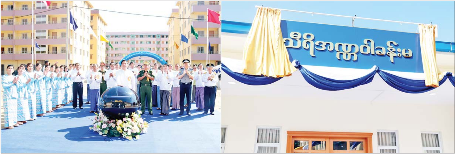
နိုင်ငံတော်ကောင်စီဝင် ဒုတိယဝန်ကြီးချုပ်နှင့် ပြည်ထောင်စုဝန်ကြီး ဗိုလ်ချုပ်ကြီးတင်အောင်စန်း သီရိအတ္ထဝါခန်းမသစ်ဆိုင်းဘုတ်အား စက်ခလုတ်နှိပ်ဖွင့်လှစ်ပေးစဉ်။

နေပြည်တော် မေ ၆ နိုင်ငံတော်ကောင်စီဝင် ဒုတိယဝန်ကြီးချုပ်နှင့် ပို့ဆောင်ရေးနှင့် ဆက်သွယ်ရေး ဝန်ကြီးဌာန ပြည်ထောင်စုဝန်ကြီး ဗိုလ်ချုပ်ကြီး တင်အောင်စန်းသည် ရန်ကုန်မြို့ မင်္ဂလာတောင်ညွန့်မြို့နယ် ကူးတို့ဆိပ်ရပ်ကွက်ရှိ မြန်မာ့ဆိပ်ကမ်း အာဏာပိုင် စက်ဆန်းမိသားစု ဝန်ထမ်းအိမ်ရာသစ်နှင့် သီရိအတ္ထဝါခန်းမဆောင်သစ် ဖွင့်ပွဲ အခမ်းအနား တက်ရောက်ဖွင့်လှစ်သည်။