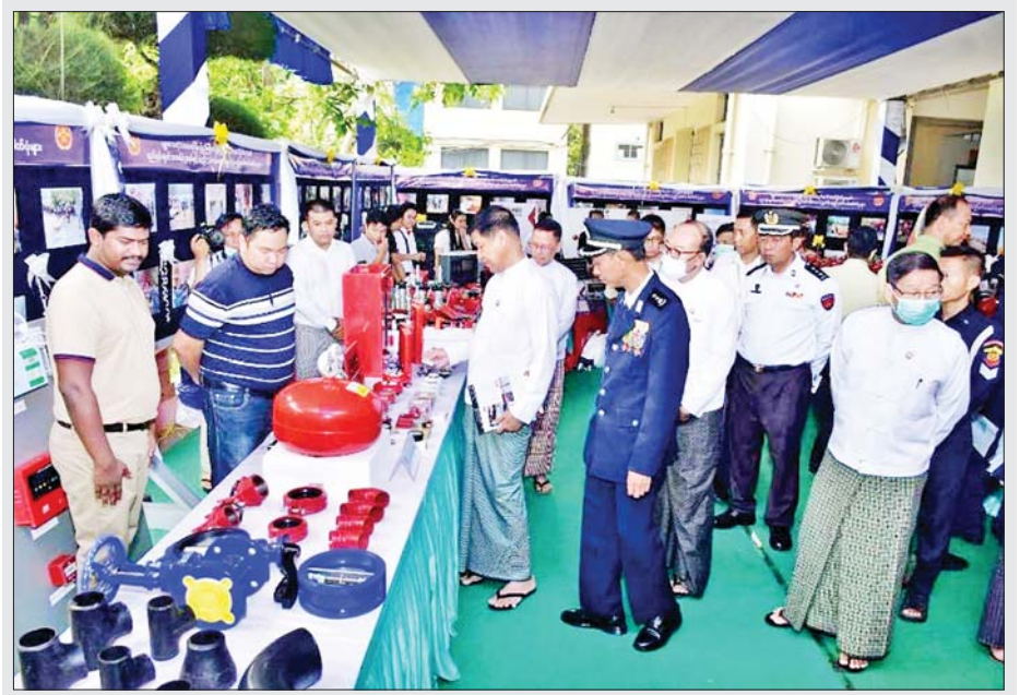
မေ ၅ ရက်ကကျင်းပသည့် (၇၇)နှစ်မြောက် မြန်မာနိုင်ငံမီးသတ်တပ်ဖွဲ့နေ့အခမ်းအနားတွင် မန္တလေးတိုင်းဒေသကြီး ဝန်ကြီးချုပ် ဦးမျိုးအောင်နှင့် တာဝန်ရှိသူများ မီးငြိမ်းသတ်ရေးနှင့် ရှာဖွေကယ်ဆယ် ရေးပစ္စည်းကိရိယာများ ခင်းကျင်းပြသထားမှုကို ကြည့်ရှုစဉ်။

သင်တန်းသားကို ပုံနှိပ်စာအုပ်များအားလည်း ကောင်း ပေးအပ်လှူဒါန်းရာ တာဝန်ရှိသူများက လက်ခံရယူကြပြီး ဂုဏ်ပြုမှတ်တမ်းလွှာများ ပြန်လည် ပေးအပ်ကြသည်။ ထို့နောက် ပြည်နယ်ဝန်ကြီးချုပ်၊ တိုင်းမှူးနှင့် တာဝန်ရှိသူများက ဗုဒ္ဓဘာသာကလျာဏ ယုဝအသင်း (YMBA)မှ ကျောင်းသား ကျောင်းသူများ၏ (၃၈)ဖြာမင်္ဂလာတေးကဗျာ သရုပ်ဖော်ဖျော်ဖြေမှုအား ကြည့်ရှုအားပေးခဲ့ကြောင်း သိရသည်။ သတင်းစဉ်