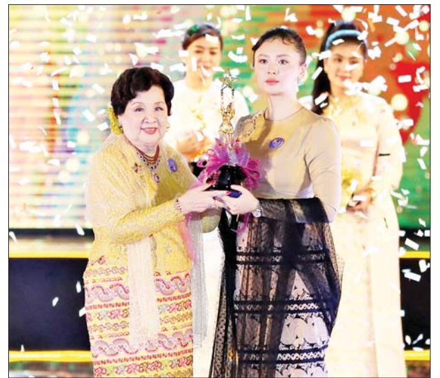
အကောင်းဆုံးအမျိုးသမီးဇာတ်ဆောင်ဆု(၂၀၂၂)ကို ရွှေမုံရတီ လက်ခံရယူစဉ်။

★ စာမျက်နှာ ၆ မှ တိုးတက်နေသည်ကို သိရ၍ ဝမ်းသာမိပါကြောင်း။ ယနေ့ကျင်းပသည့် ၂၀၁၉ ခုနှစ်၊ ၂၀၂၀ ပြည့်နှစ်၊ ၂၀၂၂ ခုနှစ်တို့ အတွက် မြန်မာ့ရုပ်ရှင်ထူးချွန်ဆု ချီးမြှင့်ပွဲအခမ်းအနားတွင် ရုပ်ရှင် အနုပညာလောကကို ဦးဆောင် နေကြသည့် အနုပညာရှင်ကြီးများ နှင့်အတူ အနုပညာမောင်နှမများ နှင့် ရုပ်ရှင်ချစ်ပရိသတ်များ အားလုံး ပျော်ပျော်ရွှင်ရွှင်ဖြင့် မြင်တွေ့ကြရသည့်အတွက် နိုင်ငံ တော်၊ ပြည်သူနှင့်အနုပညာရှင် တို့၏ စုစည်းအားနှင့် အေးချမ်း ပျော်ရွှင်သည့် ခံစားမှုရသများကို ဝေမျှပေးနိုင်သည့်ပွဲဟု ခံစားမိပါ ကြောင်း။ မြန်မာ့ရုပ်ရှင်ထူးချွန်ဆု ချီးမြှင့် နိုင်ရေးအတွက် မြန်မာနိုင်ငံရုပ်ရှင် အစည်းအရုံးက မြန်မာ့ရုပ်ရှင် ထူးချွန်ဆု အကဲဖြတ်စံချိန်စံညွှန်း များနှင့်အညီ စိစစ်ရွေးချယ်ပြီး ယနေ့ညတွင် ဆုချီးမြှင့်ပေးသွား မည်ဖြစ်သည့်အတွက် ဇာတ်ကား အသီးသီးတွင်၊ ကျရာအနုပညာ ကဏ္ဍအသီးသီးတွင် ပါဝင် စွမ်းဆောင်ထားကြသည့် အနု ပညာရှင်၊ အတတ်ပညာရှင်များနှင့် ရုပ်ရှင်ချစ်သူပရိသတ်များအားလုံး ရင်ခုန်နေကြမည်ဟု ထင်မိပါ ကြောင်း။ ယခုနှစ်ကျင်းပသည့် အခမ်း အနားတွင် ထူးခြားမှုတစ်ခုအနေ ဖြင့် ရုပ်ရှင်ထူးချွန်ဆုများသာမက နိုင်ငံတကာ ရုပ်ရှင်ထူးချွန်ဆုပေးပွဲ