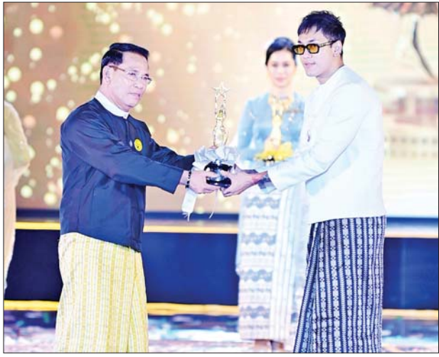
ပြည်ထောင်စုဝန်ကြီး ဦးမောင်မောင်အုန်း အကောင်းဆုံး အမျိုးသားဇာတ်ပို့ဆု (၂၀၁၉)ရရှိသည့် ရွှေထူးအား အကယ်ဒမီ ရွှေစင် ရုပ်တု ပေးအပ်ချီးမြှင့်စဉ်။