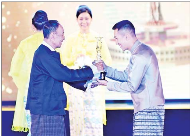
အကောင်းဆုံးရုပ်ရှင်ဇာတ်ပုံဆု (၂၀၁၉)ကို အာကာတိုး လက်ခံရယူစဉ်။