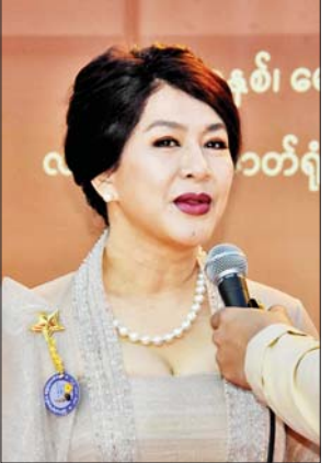
အကယ်ဒမီ ထွန်းအိန္ဒြာဗိုလ်

ရပါတယ်။ ကျွန်မအနေနဲ့ အကယ်ဒမီရခဲ့တဲ့ နှစ်တွေထဲမှာ ၁၉၉၆ ခုနှစ်က ပထမဆုံးရခဲ့တဲ့နှစ် ပေါင်းလိုက်တော့ ဆန်ခါတင် စာရင်းမှာ အများကြီးပါပဲ။ တော်တဲ့ သူတွေ အကယ်ဒမီဆုရဖို့ အလား