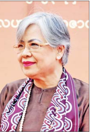
အကယ်ဒမီ ဆွေဇင်ထိုက်

အကယ်ဒမီ ရန်အောင် ရွှေကြိုတွေကတော့ သုံးနှစ်စာ ဖြစ်တဲ့အတွက် အယောက် ၄၀ ဖြစ်သွားပါတယ်။ အတော်လေး လည်း စိစစ်ရွေးချယ်ခဲ့ရပါတယ်။ ကလေးတွေအားလုံးကလည်း ပျော်ကြတယ်။ အကယ်ဒမီပေးပွဲ တွေ အတော်များများလည်း တက်ခဲ့ဖူးပါတယ်။ အကယ်ဒမီ တွေလည်း ရခဲ့ဖူးတယ်ဆိုပေမယ့် အခုနှစ်ကတော့ အရင်နှစ်တွေနဲ့ မတူဘဲ တင်ဆက်မှုတွေလည်း တွေ့ရတယ်။ သုံးနှစ်စာဆိုတဲ့ အတွက် ဆုအမျိုးအစားတစ်ခုမှာ သုံးယောက်ရတာကို တွေ့ရမယ် ဆိုတော့ ပျော်စရာကောင်းပါ တယ်။ မြန်မာ့ရုပ်ရှင်ကိုချစ်တဲ့ ပရိသတ်တွေရှိလို့ မြန်မာ့ ရုပ်ရှင်က ရှင်သန်နေရတာဖြစ် ပါတယ်။ ရုပ်ရှင်အနုပညာရှင်တွေ၊ အတတ်ပညာရှင်တွေ အားလုံးက ပရိသတ်ရဲ့ အားပေးမှုအပေါ်