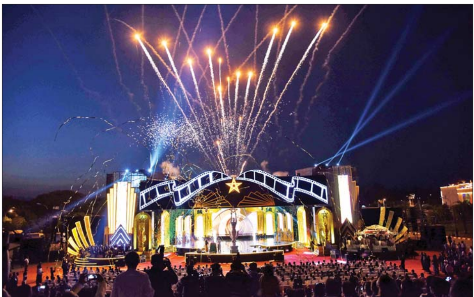
၂၀၁၉ ခုနှစ်၊ ၂၀၂၀ ပြည့်နှစ်နှင့် ၂၀၂၂ ခုနှစ်တို့အတွက် မြန်မာ့ရုပ်ရှင်ထူးချွန်ဆုချီးမြှင့်ပွဲအခမ်းအနားကို ပြည်ထောင်စုဝန်ကြီး ဦးမောင်မောင်အုန်းနှင့် မြန်မာနိုင်ငံ ရုပ်ရှင်အစည်းအရုံးဥက္ကဋ္ဌ အကယ်ဒမီများရှင် ဦးကြည်စိုးထွန်းတို့က အကယ်ဒမီရွှေစင်ရုပ်တုကို ဒစ်ဂျစ်တယ်စက်ခလုတ်ခုံပေါ်တွင် စိုက်ထူဖွင့်လှစ်ပေးကြစဉ်။

မြန်မာနိုင်ငံ ရုပ်ရှင် အစည်းအရုံး ဥက္ကဋ္ဌ အကယ်ဒမီများရှင် ဦးကြည်စိုးထွန်းက ဝမ်းမြောက်စကား ပြောကြားစဉ်။