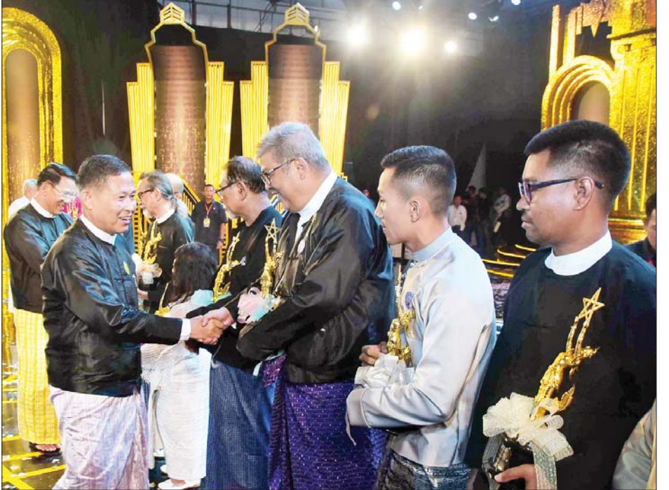
နိုင်ငံတော်စီမံအုပ်ချုပ်ရေးကောင်စီဒုတိယဥက္ကဋ္ဌ ဒုတိယဝန်ကြီးချုပ် ဒုတိယဗိုလ်ချုပ်မှူးကြီး စိုးဝင်း အကယ်ဒမီဆုရရှိသူများအား ရင်းရင်းနှီးနှီး လိုက်လံနှုတ်ဆက်စဉ်။

ယခုကျင်းပသည့် မြန်မာ့ရုပ်ရှင်ထူးချွန်ဆုချီးမြှင့်ပွဲအတွက် ၂၀၁၉ ခုနှစ်တွင် ရုံတင်ပြသခဲ့သည့် မြန်မာ့ရုပ်ရှင်ဇာတ်ကားပေါင်း ၉၇ ကား၊ ၂၀၂၀ ပြည့်နှစ်တွင် ရုံတင်ပြသခဲ့သည့် မြန်မာ့ရုပ်ရှင်ဇာတ်ကားပေါင်း ၂၁ ကားနှင့် ၂၀၂၂ ခုနှစ်တွင် ရုံတင်ပြသခဲ့သည့် မြန်မာ့ရုပ်ရှင်ဇာတ်ကားပေါင်း ၂၀ တို့ကို မြန်မာ့ရုပ်ရှင်ထူးချွန်ဆု စိစစ်အကဲဖြတ်ရေးအဖွဲ့က အဆင့်ဆင့်အကဲဖြတ်ပြီး ယင်းဇာတ်ကားများအထဲမှ အကောင်းဆုံးရုပ်ရှင်ဇာတ်ကားများကို ရွေးချယ်၍ ထူးချွန်ဆုများကို ပေးအပ်ချီးမြှင့်ခြင်းဖြစ်သည်။ မြန်မာ့ရုပ်ရှင် ထူးချွန်ဆုကို ၁၉၅၂ ခုနှစ်မှစတင်၍ ချီးမြှင့်ခဲ့ရာ ဇာတ်ကားဆု၊ အမျိုးသားပညာသည်ဆုနှင့် အမျိုးသမီးပညာသည်ဆု သုံးမျိုးကိုသာ ချီးမြှင့်ခဲ့ပြီး