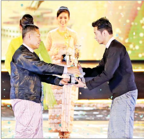
နိုင်ငံတော်စီမံအုပ်ချုပ်ရေးကောင်စီဒုတိယဥက္ကဋ္ဌ ဒုတိယဝန်ကြီးချုပ် ဒုတိယဗိုလ်ချုပ်မှူးကြီး စိုးဝင်း အကောင်းဆုံးအမျိုးသား ဇာတ်ဆောင်ဆု(၂၀၂၀) ရရှိသူ စိုင်းစိုင်းခမ်းလှိုင်အား အကယ်ဒမီ ရွှေစင်ရုပ်တု ပေးအပ်ချီးမြှင့်စဉ်။