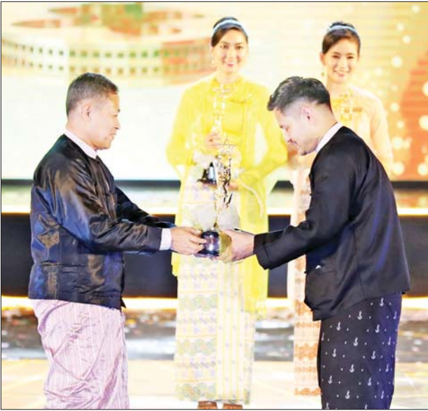
နိုင်ငံတော်စီမံအုပ်ချုပ်ရေးကောင်စီဒုတိယဥက္ကဋ္ဌ ဒုတိယဝန်ကြီးချုပ် ဒုတိယဗိုလ်ချုပ်မှူးကြီး စိုးဝင်း အကောင်းဆုံးအမျိုးသား ဇာတ်ဆောင်ဆု(၂၀၁၉) ရရှိသူ မြင့်မြတ်အား အကယ်ဒမီ ရွှေစင်ရုပ်တု ပေးအပ်ချီးမြှင့်စဉ်။