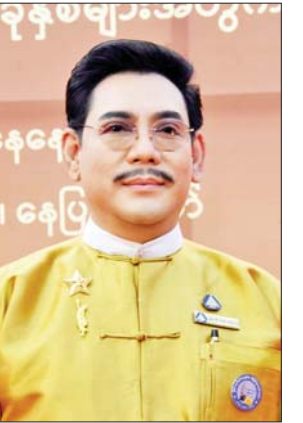
အကယ်ဒမီ ရန်အောင်

အကယ်ဒမီ နန္ဒာလှိုင် အကယ်ဒမီဆိုတာ အနုပညာ သမားတိုင်း ရချင်ကြတဲ့ ဆုတစ်ခု ပါပဲ။ အင်တိုက်အားတိုက်နဲ့ သုံးနှစ်စာပေးမယ့် ဒီလိုနှစ်မျိုးမှာ ဘယ်သူတွေရရ ဝမ်းသာမှာပါ။ ကျွန်မ အကယ်ဒမီရတဲ့နှစ်က လည်း အကယ်ဒမီပေးပွဲကို နေပြည်တော်မှာပဲ ကျင်းပခဲ့ တာပါ။ ပရိသတ်တွေနဲ့ အခုလို ပြန်လည်တွေ့ဆုံရတာ ဝမ်းသာပါ တယ်။