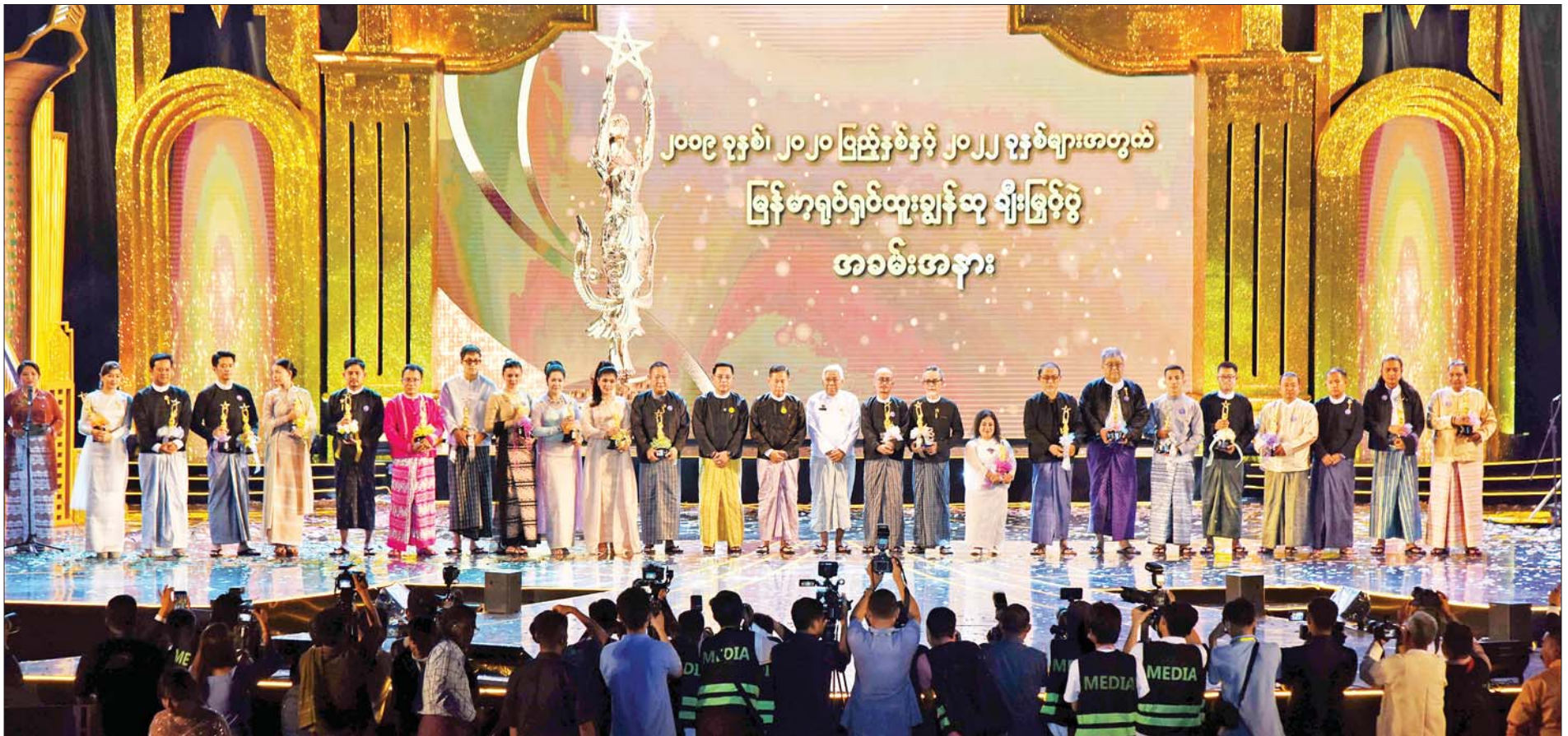
နိုင်ငံတော်စီမံအုပ်ချုပ်ရေးကောင်စီဒုတိယဥက္ကဋ္ဌ ဒုတိယဝန်ကြီးချုပ် ဒုတိယဗိုလ်ချုပ်မှူးကြီးစိုးဝင်းနှင့် အဖွဲ့ဝင်များ ၂၀၁၉ ခုနှစ်၊ ၂၀၂၀ ပြည့်နှစ်နှင့် ၂၀၂၂ ခုနှစ်များအတွက် မြန်မာ့ရုပ်ရှင်ထူးချွန်ဆုရရှိသူ များနှင့်အတူ စုပေါင်းမှတ်တမ်းတင်ဓာတ်ပုံရိုက်စဉ်။