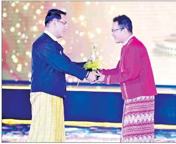
ပြည်ထောင်စုဝန်ကြီး ဦးမောင်မောင်အုန်း အကောင်းဆုံး အမျိုးသားဇာတ်ပို့ဆု (၂၀၂၀)ရရှိသည့် အုန်းသီးအား အကယ်ဒမီ ရွှေစင်ရုပ်တု ပေးအပ်ချီးမြှင့်စဉ်။