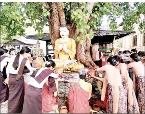
ယင်းမာပင်မြို့၌ ညောင်ရေသွန်းပွဲတော် ကျင်းပစဉ်။ ခရိုင်(ပြန်/ဆက်)