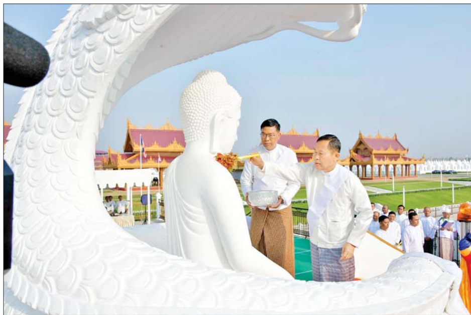
နိုင်ငံတော်စီမံအုပ်ချုပ်ရေးကောင်စီဒုတိယဥက္ကဋ္ဌ ဒုတိယဝန်ကြီးချုပ် ဒုတိယဗိုလ်ချုပ်မှူးကြီးစိုးဝင်း မုစလိန္န ဗုဒ္ဓရုပ်ပွားတော်မြတ်အား ပရိတ်နံ့သာရည်များဖြင့် ပက်ဖျန်းပူဇော်စဉ်။