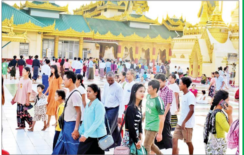
သထုံရွှေစာရံစေတီတော်မြတ်ကြီး၌ ဘုရားဖူးပြည်သူများဖြင့် စည်ကားလျက်ရှိသည်ကို တွေ့ရစဉ်။ ခရိုင်(ပြန်/ဆက်)