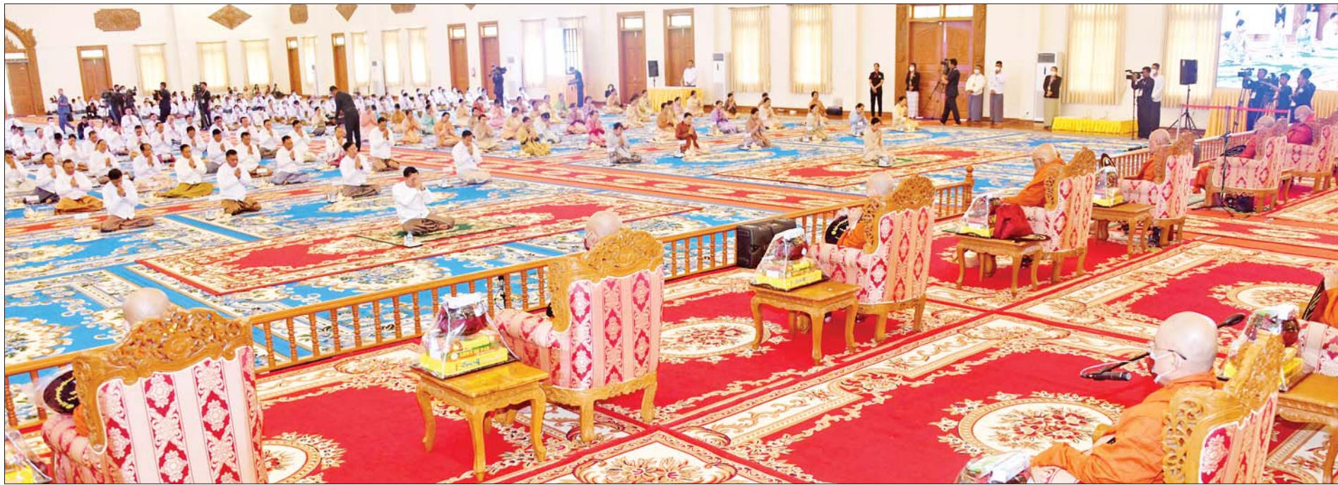
နိုင်ငံတော်စီမံအုပ်ချုပ်ရေးကောင်စီဥက္ကဋ္ဌ နိုင်ငံတော်ဝန်ကြီးချုပ်ဗိုလ်ချုပ်မှူးကြီး မင်းအောင်လှိုင်နှင့် ဇနီး ဒေါ်ကြူကြူလှအမှူးပြုသော ဧည့်ပရိသတ်များက နိုင်ငံတော်သံဃမဟာနာယကအဖွဲ့ အကျိုးတော်ဆောင် သန်လျင်မြို့ မင်းကျောင်းဆရာတော်ထံမှ ငါးပါးသီလ ခံယူဆောက်တည်ကြစဉ်။