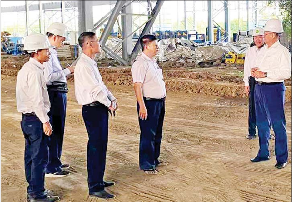
ဝန်ထမ်းများအနေဖြင့် နိုင်ငံတော်နှင့် စက်မှုကဏ္ဍ ဖွံ့ဖြိုးတိုးတက်ရေးအတွက် သံမဏိထုတ်လုပ်သည့် လုပ်ငန်းများကို ဆောင်ရွက်နေခြင်းဖြစ်၍ စီမံကိန်း လုပ်ငန်းများ အောင်မြင်အောင် ဆောင်ရွက်နိုင်ရေး စည်းလုံးညီညွတ်စွာဖြင့် ကြိုးစားဆောင်ရွက်ရန်၊ ထို့ပြင် သံမဏိထုတ်လုပ်သည့် နည်းစဉ်များကိုလည်း ကျေညက်အောင်လေ့လာ၍ အချင်းချင်းမျှဝေရန်၊ ဝန်ထမ်းတစ်ဦးချင်းအနေဖြင့် မိမိကိုင်တွယ်မောင်းနှင် ရသည့်စက်ပစ္စည်းများ စက်စွမ်းအားပြည့် လည်ပတ် နိုင်ရေးအတွက်လည်း စဉ်ဆက်မပြတ်လေ့လာသင်ယူ သွားကြရန်နှင့် အပူချိန်များ မြင့်တက်နေသဖြင့် ကျန်းမာရေးအသိ သတိဖြင့် ရောဂါများ မဖြစ်ပွား စေရေး ဂရုတစိုက်နေထိုင်ကြရန် မှာကြားခဲ့ကြောင်း သိရသည်။ သတင်းစဉ်

ဘေးအန္တရာယ် ကင်းရှင်းစွာဖြင့် ဆောင်ရွက်နိုင်ရေး အတွက် ဝန်ထမ်းများအနေဖြင့် သတ်မှတ်ဝတ်စုံ အပြည့်အစုံဝတ်ဆင်ကြရန်နှင့် တာဝန်ရှိသူများက ကြီးကြပ်ဆောင်ရွက်သွားရန်၊ လျှပ်စစ်ကြောင့် မီးဘေး အန္တရာယ် မဖြစ်ပွားစေရေးအတွက် စက်ရုံအတွင်း သွယ်တန်းထားရှိသည့် ဝါယာကြိုးများ စနစ်တကျ တပ်ဆင်ထားမှု ရှိ မရှိနှင့် ဘေးအန္တရာယ်ကင်းရှင်း စွာဖြင့် အသုံးပြုနိုင်ခြင်း ရှိ/မရှိ တို့ကို စက်မှုကြီးကြပ် ရေးနှင့် စစ်ဆေးရေးဦးစီးဌာနက စစ်ဆေးပေးရန်၊ စက်ရုံအတွင်းရှိ မီးလောင်ရန်လွယ်ကူသည့် အမှိုက်၊ ခြံနွယ်များကို ရှင်းလင်းထားရန်၊ မီးဘေးစီမံချက်များ ရေးဆွဲပြီး ဇာတ်တိုက်လေ့ကျင့်ထားရန်နှင့် မီးငြိမ်း သတ်ရေးအထောက်အကူပစ္စည်းများအား ပြည့်စုံ အောင် ဖြည့်ဆည်းထားရန်။