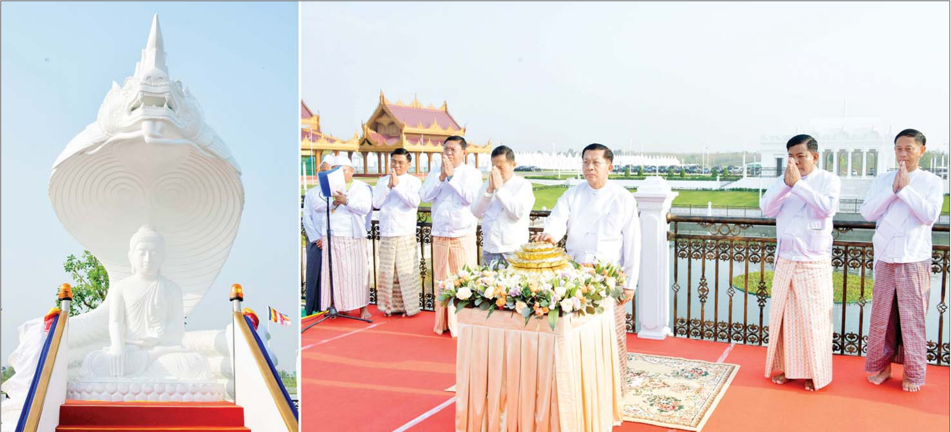
ဦးဆောင်ဘုရားဒါယကာ နိုင်ငံတော်စီမံအုပ်ချုပ်ရေးကောင်စီဥက္ကဋ္ဌ နိုင်ငံတော်ဝန်ကြီးချုပ် ဗိုလ်ချုပ်မှူးကြီး မင်းအောင်လှိုင် မာရဝိဇယဗုဒ္ဓဥယျာဉ် ဝတ္ထုကံတော်အတွင်း၌ ကဆုန်လပြည့်ကုသိုလ်တော်အဖြစ် ဗုဒ္ဓရုပ်ပွားတော်မြတ်အား မုစလိန္ဒ နဂါးရုံဘုရားကျောင်းဆောင်တော်သို့ မင်္ဂလာစက်ခလုတ်နှိပ်၍ ပင့်ဆောင်စဉ်။