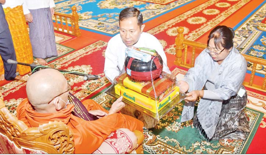
နိုင်ငံတော်စီမံအုပ်ချုပ်ရေးကောင်စီ ဒုတိယဥက္ကဋ္ဌ ဒုတိယဝန်ကြီးချုပ် ဒုတိယဗိုလ်ချုပ်မှူးကြီး စိုးဝင်းနှင့် ဇနီး ဒေါ်သန်းသန်းနွယ်တို့ နိုင်ငံတော်သံဃမဟာနာယကအဖွဲ့ ဒုတိယဥက္ကဋ္ဌ မြင်းခြံမြို့ သီရိမာလာကျောင်း ကိုးဆောင်ကျောင်းတိုက်ဆရာတော်ထံ လှူဖွယ်ပစ္စည်းများ ဆက်ကပ်လှူဒါန်းစဉ်။