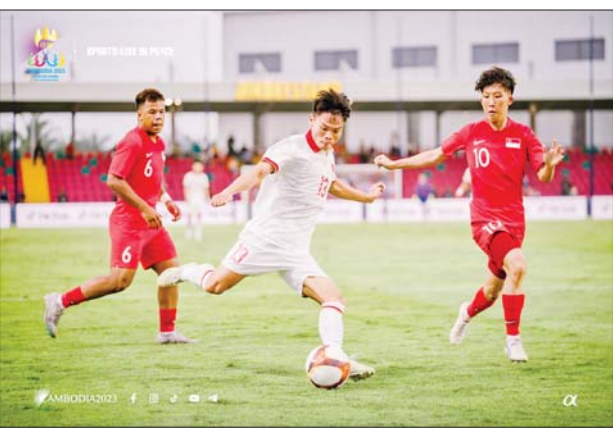
ဗီယက်နမ်နှင့် စင်ကာပူအသင်းတို့ ယှဉ်ပြိုင်နေစဉ်။