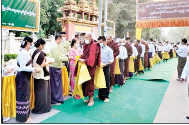
စဉ့်ကူးမြို့၌ သံဃာတော် (၁၀၈) ပါးအား အရက်ဆွမ်းဆက်ကပ် လှူဒါန်းပွဲနှင့် ဆွမ်းဆန်တော်စုပေါင်းလောင်းလှူပွဲ ကျင်းပစဉ်။ မြို့နယ်(ပြန်/ဆက်)