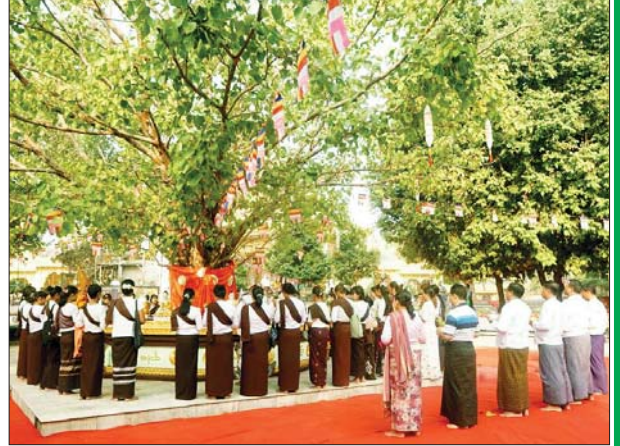
အင်းစိန်မြို့ ကျောက်တော်ကြီးဘုရားရင်ပြင်တော်၌ ကဆုန် ညောင်ရေသွန်းလောင်းပူဇော်ပွဲ ကျင်းပစဉ်။ ညောင်ဟိန်း