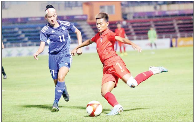
မြန်မာနှင့် ဖိလစ်ပိုင်အသင်းတို့ ယှဉ်ပြိုင်နေစဉ်။

ပူဇွန်ကမ္ဘာ တားဆီးရာ ဖြေရှာတစ်ခု တောပြုစု