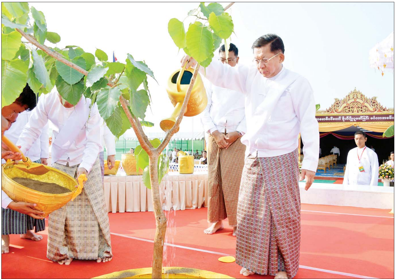
ဦးဆောင်ဘုရားဒါယကာ နိုင်ငံတော်စီမံအုပ်ချုပ်ရေးကောင်စီဥက္ကဋ္ဌ နိုင်ငံတော်ဝန်ကြီးချုပ် ဗိုလ်ချုပ်မှူးကြီးမင်းအောင်လှိုင် မဟာဗောဓိပင်တော်ကို စိုက်ပျိုး၍ မြေဆီ မြေလွှာ မြေဩဇာများ ကျွေးမွေးကာ ရေစင်ရေသန့်များ သွန်းလောင်းစဉ်။

ထို့နောက် အခမ်းအနားများက မဟာဗောဓိ ရုက္ခရော ပနပူဇာ ဂါထာကို ဖတ်ကြားပြီး ဦးဆောင်