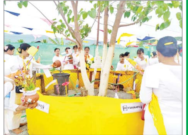
ပေါင်မြို့နယ်၌ ညောင်ရေသွန်းပွဲတော် ကျင်းပစဉ်။ မြို့နယ်(ပြန်/ဆက်)