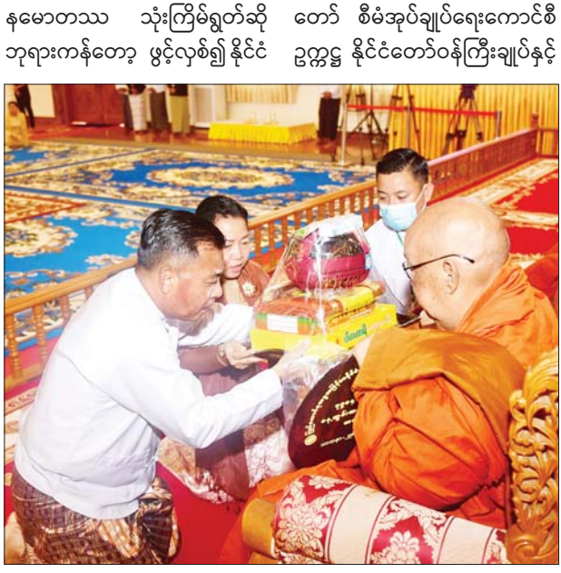
နိုင်ငံတော်စီမံအုပ်ချုပ်ရေးကောင်စီ တွဲဖက်အတွင်းရေးမှူး ဒုတိယဗိုလ်ချုပ်ကြီး ရဲဝင်းဦးနှင့်ဇနီးတို့ ဆရာတော်ထံ လှူဖွယ်ပစ္စည်းများ ဆက်ကပ်လှူဒါန်းစဉ်။

နမောတဿ သုံးကြိမ်ရွတ်ဆို တော် စီမံအုပ်ချုပ်ရေးကောင်စီ ဘုရားကန်တော့ ဖွင့်လှစ်၍ နိုင်ငံ ဥက္ကဋ္ဌ နိုင်ငံတော်ဝန်ကြီးချုပ်နှင့် ဇနီး အမှူးပြုသော ဧည့်ပရိသတ် များက နိုင်ငံတော်သံဃမဟာ နာယကအဖွဲ့ အကျိုးတော်ဆောင် သန်လျင်မြို့ မင်းကျောင်း ဆရာတော်ထံမှ ငါးပါးသီလ ခံယူ ဆောက်တည်ကြပြီး သံဃာတော် အရှင်သူမြတ်များ ရွတ်ပွား သရဇ္ဈာယ်တော်မူသော မေတ္တာသုတ် ပရိတ်တရားတော်များကို နာယူ ကြည့်ညိကြသည်။ ဆက်ကပ်လှူဒါန်း ယင်းနောက် နိုင်ငံတော်စီမံ အုပ်ချုပ်ရေးကောင်စီဥက္ကဋ္ဌ နိုင်ငံ တော်ဝန်ကြီးချုပ်နှင့် ဇနီးတို့က နိုင်ငံတော် သံဃမဟာနာယက အဖွဲ့ အကျိုးတော်ဆောင် သန်လျင်မြို့ မင်းကျောင်း ဆရာတော်ထံ လှူဖွယ်ပစ္စည်း များ ဆက်ကပ်လှူဒါန်းသည်။ စာမျက်နှာ ၇ သို့ □