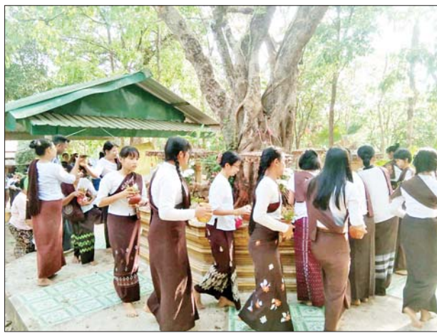
ဘီးလင်းမြို့နယ်၌ ညောင်ရေသွန်းပွဲတော် ကျင်းပစဉ်။ မြို့နယ်(ပြန်/ဆက်)