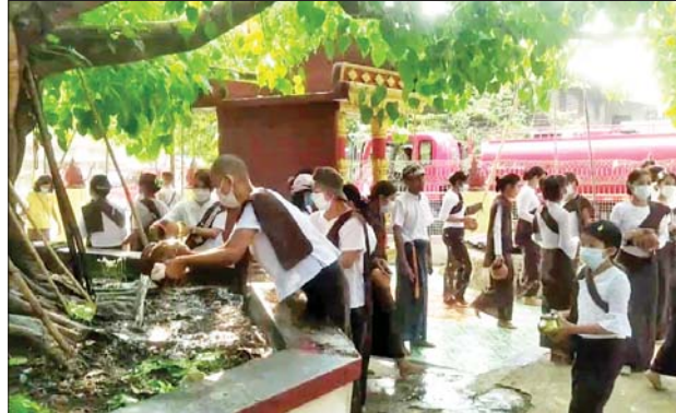
မြောင်းမြမြို့၌ ရှေးဟောင်းသမိုင်းဝင် စကြာသီဟ၊ စကြာနန္ဒ ဘုရားဝင်းအတွင်း ညောင်ရေသွန်းပွဲတော် ကျင်းပစဉ်။ ခရိုင်(ပြန်/ဆက်)