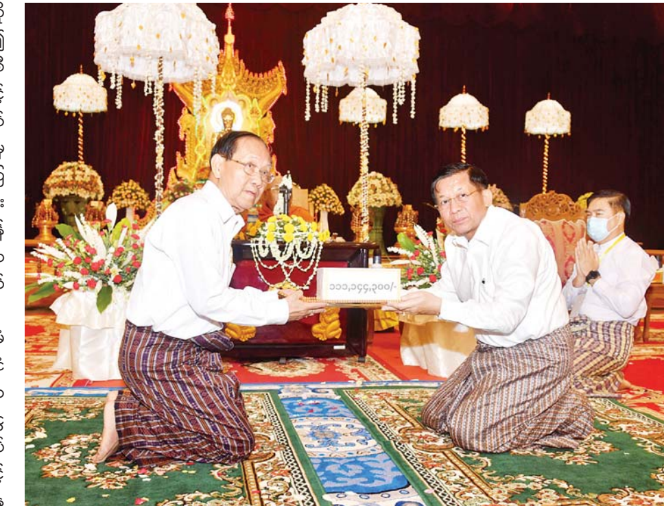
နိုင်ငံတော်စီမံအုပ်ချုပ်ရေးကောင်စီဥက္ကဋ္ဌ နိုင်ငံတော်ဝန်ကြီးချုပ် ဗိုလ်ချုပ်မှူးကြီး မင်းအောင်လှိုင် ဓမ္မပူဇာ နဝကမ္မအလှူတော်ငွေကျပ် ၁၁၁၁ သိန်းကျော်ကို ပေးအပ်လှူဒါန်းစဉ်။

နမောတဿ သုံးကြိမ်ရွတ်ဆိုဘုရားကန်တော့ ဖွင့်လှစ်၍ နိုင်ငံတော်စီမံအုပ်ချုပ်ရေးကောင်စီဥက္ကဋ္ဌ နိုင်ငံတော်ဝန်ကြီးချုပ်နှင့် ဇနီး အမျိုးပြုသော ဧည့်ပရိသတ်များက မြင်းခြံဆရာတော်ကြီးထံမှ ငါးပါးသီလခံယူ ဆောက်တည်ကြပြီး သီတဂူဆရာတော်ကြီးဟောကြားတော်မူသည့် ကဆုန်လပြည့်ဗုဒ္ဓနေ့ဆိုင်ရာ ဓမ္မကထာဒေသနာတော်ကို ရိုသေလေးမြတ်စွာ နာယူကြသည်။ ယင်းနောက် နိုင်ငံတော်စီမံအုပ်ချုပ်ရေးကောင်စီဥက္ကဋ္ဌ နိုင်ငံတော်ဝန်ကြီးချုပ်နှင့် ဇနီးတို့က ဓမ္မပူဇာ နဝကမ္မအလှူတော်ငွေကျပ် ၁၁၁၁ သိန်းကျော်ကို ပေးအပ်လှူဒါန်းရာ သာသနာရေးနှင့် ယဉ်ကျေးမှု ဝန်ကြီးဌာန ပြည်ထောင်စုဝန်ကြီး ဦးကိုကိုက ကပိယကာရကအဖြစ်လက်ခံရယူသည်။ ထို့နောက် သီတဂူဆရာတော်ကြီးထံမှ အနုမောဒနာတရား