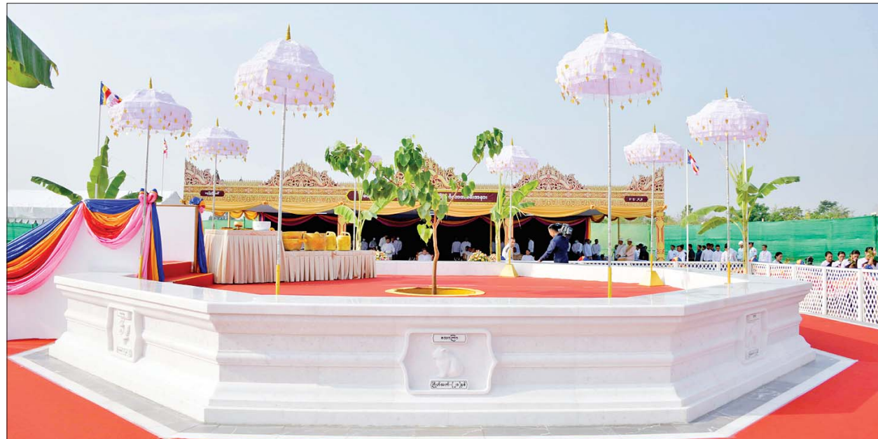
ကဆုန်လပြည့်ဗုဒ္ဓနေ့ ကုသိုလ်တော်အဖြစ် မာရဝိဇယဗုဒ္ဓဥယျာဉ်တော်အတွင်း မဟာဗောဓိပင်တော် စိုက်ပျိုးပူဇော်ထားရှိမှုကို တွေ့ရစဉ်။

အမျှဝေစာတမ်းလွှာကို ဖတ်ကြား၍ မေတ္တာပြု အမျှပေးဝေပြီး “ဗုဒ္ဓသာသနံ စိရတိဋ္ဌတု” သုံးကြိမ် ရွတ်ဆိုဆုတောင်းကာ အခမ်းအနားကို ရုပ်သိမ်းလိုက်သည်။