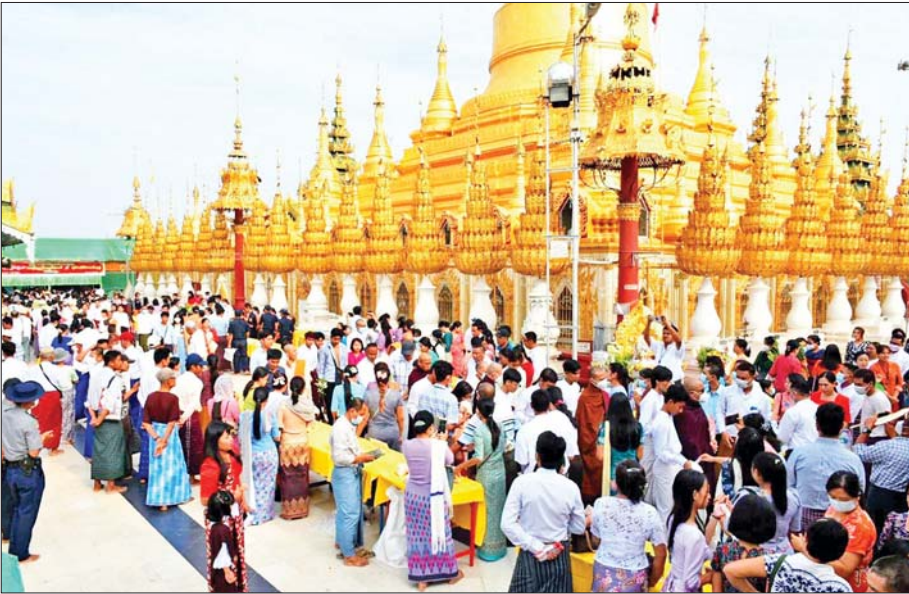
ပြည်မြို့ လေးဆူဓာတ်ပျော် ရွှေဆံတော်စေတီတော်မြတ်ကြီး၌ ဆွမ်းဆန်စိမ်း လောင်းလှူပွဲကိုစိုး(ပြည်) ကျင်းပစဉ်။