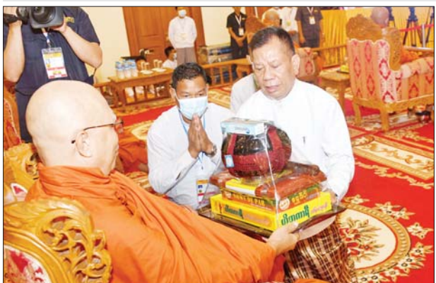
နိုင်ငံတော်စီမံအုပ်ချုပ်ရေးကောင်စီအဖွဲ့ဝင် ဦးမောင်ကို ဆရာတော်ထံ လှူဖွယ်ဝတ္ထုပစ္စည်းများ ဆက်ကပ်လှူဒါန်းစဉ်။