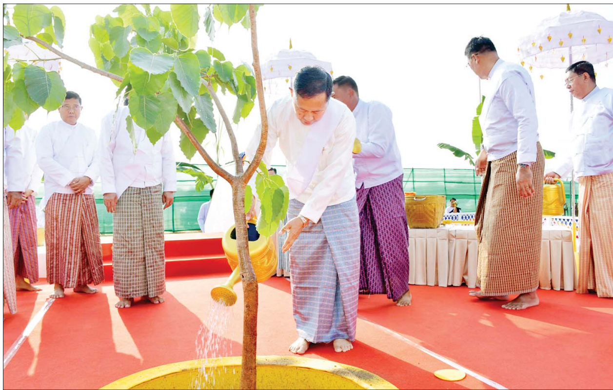
နိုင်ငံတော်စီမံအုပ်ချုပ်ရေးကောင်စီဒုတိယဥက္ကဋ္ဌ ဒုတိယဝန်ကြီးချုပ် ဒုတိယဗိုလ်ချုပ်မှူးကြီးစိုးဝင်း မဟာဗောဓိပင်တော်အား ရေစင်ရေသန့်များ သွန်းလောင်းစဉ်။