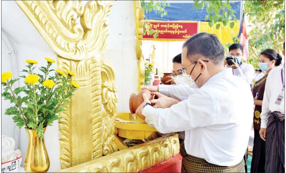
အနားသို့တက်ရောက်လာသူများက သတ်မှတ်ထားသည့်နေရာတို့မှ အဖွဲ့လိုက် မဟာဗောဓိညောင်ပင်အား ကဆုန်ညောင်ရေသွန်းလောင်း၍ အမွှေးနံ့သာရည်များပက်ဖျန်းပူဇော်ကာ အခမ်းအနားကို ရုပ်သိမ်းလိုက်သည်။ သတင်းစဉ်

ညွှန်ကြားရေးမှူးချုပ်များ၊ အရာရှိကြီးများနှင့် ဇနီးများ၊ တာဝန်ရှိသူများ၊ ဝန်ထမ်းများနှင့် မိသားစုဝင်များ တက်ရောက်ကြသည်။ ဦးစွာ နိုင်ငံတော်စီမံအုပ်ချုပ်ရေးကောင်စီအဖွဲ့ဝင် ဒုတိယဝန်ကြီးချုပ်နှင့် ပြည်ထောင်စုဝန်ကြီး ဒုတိယဗိုလ်ချုပ်ကြီးစိုးထွန်းနှင့် နေပြည်တော်အတွင်းရှိ ရုပ်ပွားတော်မြတ်အား ပန်း၊ ရေချမ်း၊ ဆီမီးတို့ ကပ်လှူပူဇော်ကြသည်။ ထို့နောက် အခမ်းအနားမှူးက ကဆုန်ညောင်ရေသွန်းလောင်းပူဇော်ရန် ပန်ကြားသည့် မဟာဗောဓိရုက္ခသိဉ္စနုပူဇာ ဂါထာတော်ကို ဖတ်ကြားပူဇော်သည်။ ယင်းနောက် ပြည်ထောင်စုဝန်ကြီး ဒုတိယဗိုလ်ချုပ်ကြီးစိုးထွန်းနှင့် ဦးစီးဌာနများမှ