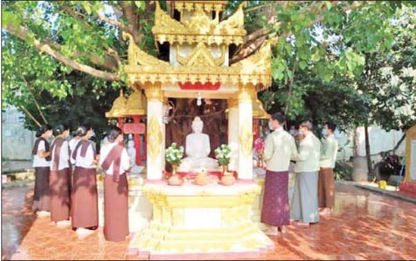
မိုးညိုမြို့နယ်၌ အထွေထွေအုပ်ချုပ်ရေးဦးစီးဌာန ဝန်ထမ်း မိသားစုများက ညောင်ရေသွန်းပွဲတော် ကျင်းပစဉ်။ ကိုမင်း(ပြန်/ဆက်)