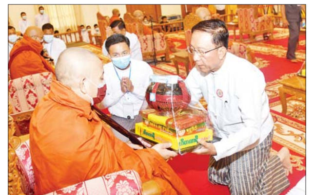
ဒုတိယဝန်ကြီးချုပ်နှင့် ပြည်ထောင်စုဝန်ကြီး ဦးဝင်းရှိန် ဆရာတော်ထံ လှူဖွယ်ဝတ္ထုပစ္စည်းများ ဆက်ကပ်လှူဒါန်းစဉ်။