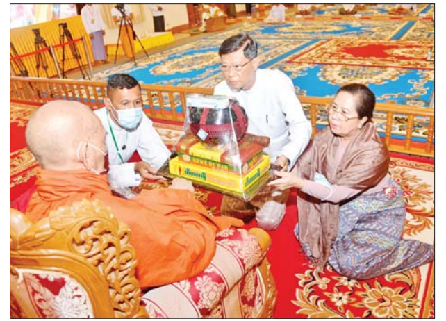
နိုင်ငံတော်စီမံအုပ်ချုပ်ရေးကောင်စီအဖွဲ့ဝင် ဒုတိယဝန်ကြီးချုပ်နှင့် ပြည်ထောင်စုဝန်ကြီး ဗိုလ်ချုပ်ကြီး မြထွန်းဦးနှင့် ဇနီးတို့က ဆရာတော်ထံ လှူဖွယ်ဝတ္ထုပစ္စည်းများ ဆက်ကပ်လှူဒါန်းစဉ်။