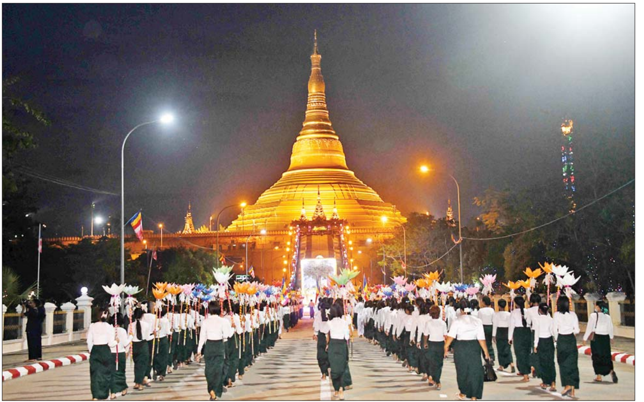
ဥပ္ပါတသန္တီစေတီတော်မြတ်ကြီးအား ဆီမီးတိုင်များ ကိုင်ဆောင်၍ လှည့်လည်ပူဇော်ရာတွင် ဝန်ကြီးဌာနများမှ ဝန်ထမ်း ပူဇော်ခဲ့ကြောင်း သိရသည်။ ကျောင်းသား ကျောင်းသူများနှင့် စုစုပေါင်း ၁၀၈၀ ဖြင့် လှည့်လည် သတင်းစဉ်

တိုင်များကို ကိုင်ဆောင်ထားသည့် ကျောင်းသား ကျောင်းသူများက စေတီတော်မြတ်ကြီး၏ အနောက်ဘက်မှခန့်ခွဲ၍ လှည့်ကောင်း၊ မြတ်စွာဘုရား ပရိနိဗ္ဗာန် စံတော်မူခြင်းယာဉ်နှင့် သာသနာ့အလံများ၊ ဆီမီးတိုင်များကို ကိုင်ဆောင်ထားသည့် ဝန်ကြီးဌာနများမှ ဝန်ထမ်းများက တောင်ဘက်မှခန့်ခွဲ၍လှည့်ကောင်း ရောက်ရှိနေရာယူကြသည်။ စိုက်ထူပူဇော် ထိုနေ့က သာသနာ့အလံများ၊ ဆီမီးတိုင်များကို ကိုင်ဆောင်ထားသည့် ကျောင်းသားကျောင်းသူများနှင့် ဝန်ကြီးဌာနများမှ ဝန်ထမ်းများသည် သက်ဆိုင်ရာ မှခန့်ခွဲပြီးမှတစ်ဆင့် စေတီတော်မြတ်ကြီး ရင်ပြင်တော်ပေါ်သို့ တစ်ပြိုင်တည်း တက်ရောက်၍ သတ်မှတ်နေရာများ၌ အလံတိုင်များနှင့် ဆီမီးတိုင်များကို စိုက်ထူပူဇော်ကြသည်။