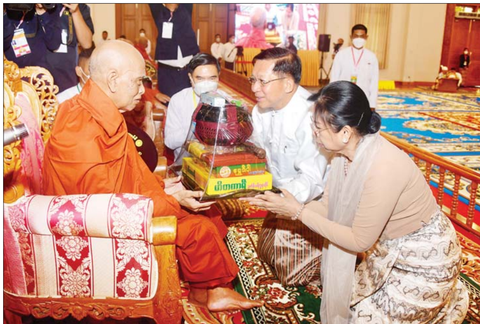
နိုင်ငံတော်စီမံအုပ်ချုပ်ရေးကောင်စီဥက္ကဋ္ဌ နိုင်ငံတော်ဝန်ကြီးချုပ် ဗိုလ်ချုပ်မှူးကြီး မင်းအောင်လှိုင်နှင့် ဇနီး ဒေါ်ကြူကြူလှတို့ နိုင်ငံတော်သံဃမဟာနာယကအဖွဲ့ အကျိုးတော်ဆောင် သန်လျင်မြို့ မင်းကျောင်း ဆရာတော်ထံ လှူဖွယ်ပစ္စည်းများ ဆက်ကပ်လှူဒါန်းစဉ်။

ဗိုလ်ချုပ်မှူးကြီး စိုးဝင်းနှင့် ဇနီး ဒေါ်သန်းသန်းနွယ်၊ ကောင်စီ အတွင်းရေးမှူး၊ တွဲဖက်အတွင်း ရေးမှူးနှင့် ဇနီး၊ ကောင်စီဝင်များ နှင့် ဇနီးများ၊ ပြည်ထောင်စုအဆင့် ပုဂ္ဂိုလ်များ၊ ပြည်ထောင်စုဝန်ကြီး များနှင့် ဇနီးများ၊ နေပြည်တော် ကောင်စီ ဥက္ကဋ္ဌ၊ ကာကွယ်ရေး ဦးစီးချုပ်ရုံးမှ တပ်မတော်အရာရှိ ကြီးများ၊ နေပြည်တော်တိုင်း စစ်ဌာနချုပ်တိုင်းမှူးနှင့် တာဝန်ရှိ သူများ တက်ရောက်ကြည့်ညိကြ သည်။