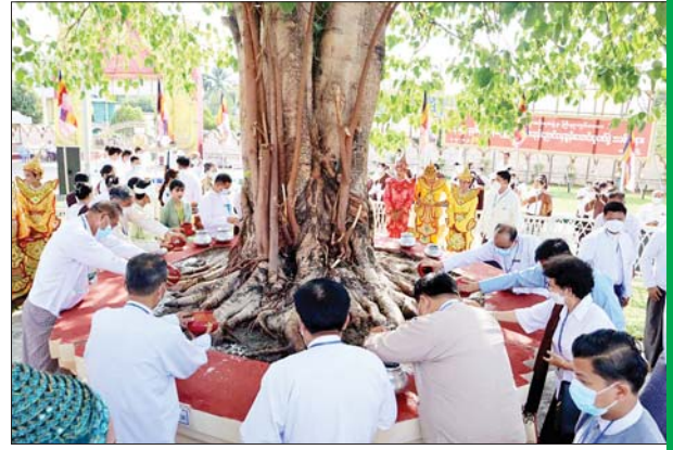
ထားဝယ်မြို့၌ ကဆုန်ညောင်ရေသွန်းလောင်းပူဇော်ပွဲ ကျင်းပ စဉ်။ တိုင်းဒေသကြီး (ပြန်/ဆက်)