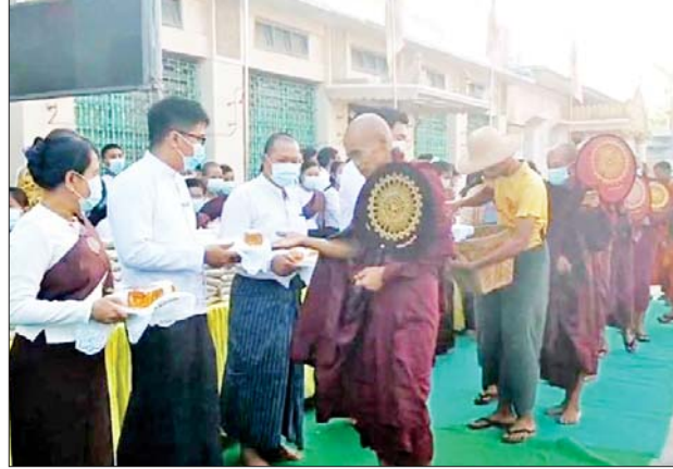
ကျိုပျော်မြို့၌ ဆွမ်းဆန်စိမ်းလောင်းလှူပွဲ ကျင်းပစဉ်။ ခရိုင်(ပြန်/ဆက်)