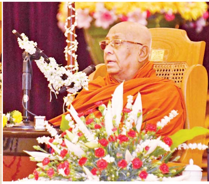
နိုင်ငံတော်ဩဝါဒါစရိယ သောဠသမ ရွှေကျင်သာသနာပိုင်ဆရာတော် သီတဂူကမ္ဘာ့ဗုဒ္ဓတက္ကသိုလ်များ၏အဓိပတိ အဘိဓမ္မေဟာရဋ္ဌဂုရု အဘိဓမ္မေဟာ သဒ္ဓမ္မဇောတိက ဒေါက်တာ ဘဒ္ဒန္တ ဉာဏိဿရက ကဆုန်လပြည့်ဗုဒ္ဓနေ့ဆိုင်ရာ ဓမ္မကထာဒေသနာတော်ကို ဟောကြားတော်မူစဉ်။