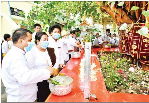
ပြည်မြို့ လေးဆူဓာတ်ပျော် ရွှေဆံတော်စေတီတော်မြတ်ကြီး၌ ကဆုန်ညောင်ရေသွန်းပွဲတော် ကျင်းပစဉ်။ ကိုဆက်(ပြန်/ဆက်)