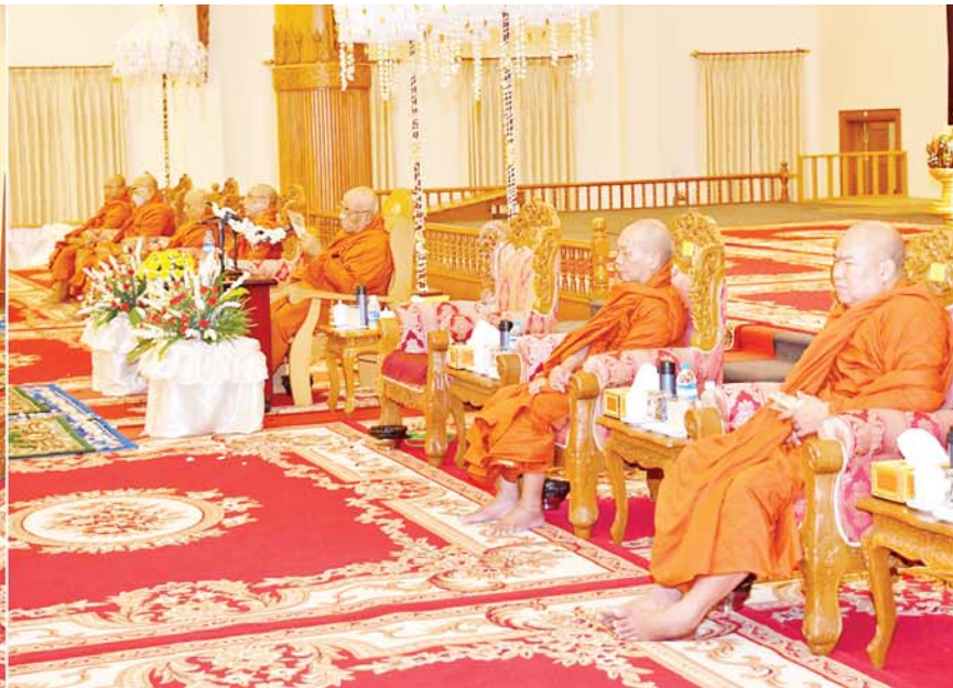
နိုင်ငံတော်စီမံအုပ်ချုပ်ရေးကောင်စီဥက္ကဋ္ဌ နိုင်ငံတော်ဝန်ကြီးချုပ် ဗိုလ်ချုပ်မှူးကြီးမင်းအောင်လှိုင်နှင့် ဇနီး ဒေါ်ကြူကြူလှအမျိုးပြုသော ဧည့်ပရိသတ်များ နိုင်ငံတော်သံဃမဟာနာယကအဖွဲ့ ဒုတိယဥက္ကဋ္ဌ မြင်းခြံမြို့ ကိုးဆောင်တိုက် သီရိမာလာကျောင်း ကိုးဆောင်ကျောင်းတိုက် ပဓာနနာယကဆရာတော် အဂ္ဂမဟာပဏ္ဍိတ ဘဒ္ဒန္တဇောတိပါလထံမှ ငါးပါးသီလခံယူဆောက်တည်ကြစဉ်။