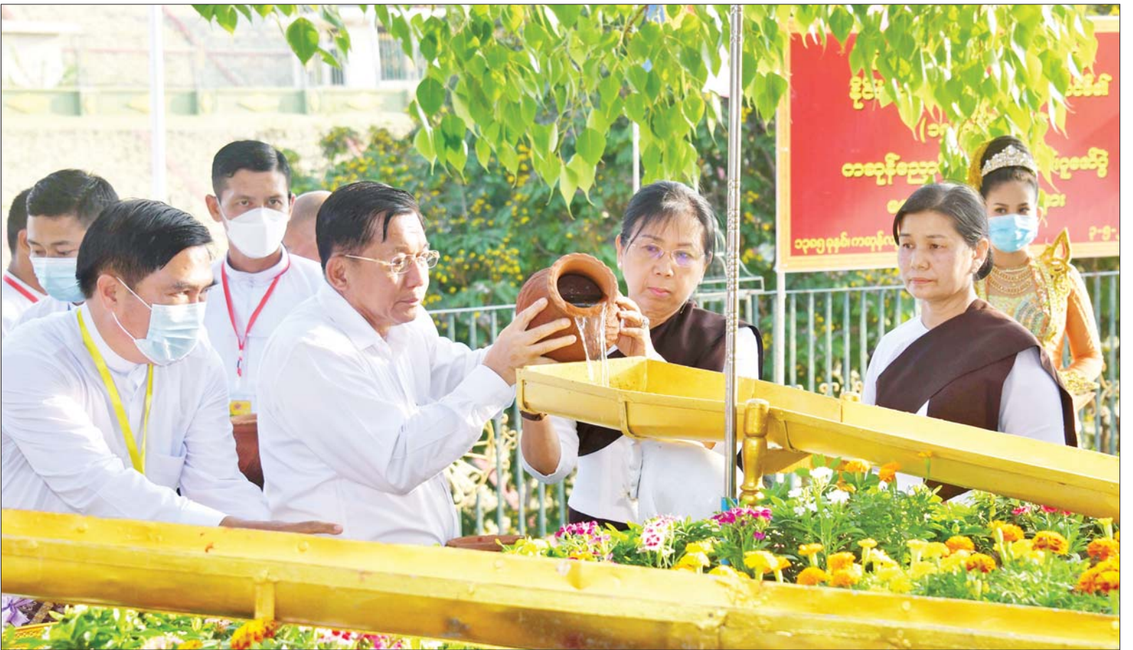
နိုင်ငံတော်စီမံအုပ်ချုပ်ရေးကောင်စီဥက္ကဋ္ဌ နိုင်ငံတော်ဝန်ကြီးချုပ် ဗိုလ်ချုပ်မှူးကြီး မင်းအောင်လှိုင်နှင့် ဇနီးဒေါ်ကြူကြူလှတို့ ဥပယုတသန္တိစေတီတော်မြတ်ကြီး ပရိဝုဏ်တော်အတွင်းရှိ မဟာဗောဓိညောင်ပင်အား ညောင်ရေသွန်းလောင်းပူဇော်စဉ်။

နေပြည်တော် မေ ၃ ဗုဒ္ဓဘာသာ မြန်မာလူမျိုးတို့၏ ၁၂ လရာသီပွဲတော်တွင် တစ်ခုအပါအဝင်ဖြစ်သည့် မြန်မာ သက္ကရာဇ် ၁၃၈၅ ခုနှစ် ကဆုန်လပြည့်ဗုဒ္ဓနေ့ဖြစ်သော ယနေ့ ကျရောက်သည့် ကဆုန်ညောင်ရေ သွန်းပွဲတော်တွင် နေပြည်တော် ဥပယုတသန္တိစေတီတော်မြတ်ကြီး ပရိဝုဏ်တော် မြောက်ဘက်အရပ်ရှိ မဟာဗောဓိညောင်ပင်တော်များအား (၁၅)ကြိမ်မြောက်ကဆုန်ညောင်ရေသွန်းလောင်းပူဇော်ခြင်း မင်္ဂလာအခမ်းအနားကို ယနေ့ညနေပိုင်းတွင် ကျင်းပပြုလုပ်ရာ နိုင်ငံတော်စီမံအုပ်ချုပ်ရေးကောင်စီဥက္ကဋ္ဌ နိုင်ငံတော်ဝန်ကြီးချုပ် ဗိုလ်ချုပ်မှူးကြီး မင်းအောင်လှိုင်နှင့်ဇနီး ဒေါ်ကြူကြူလှ တို့က မဟာဗောဓိညောင်ပင်တော်များကို ညောင်ရေသွန်းလောင်း ပူဇော်ကြသည်။