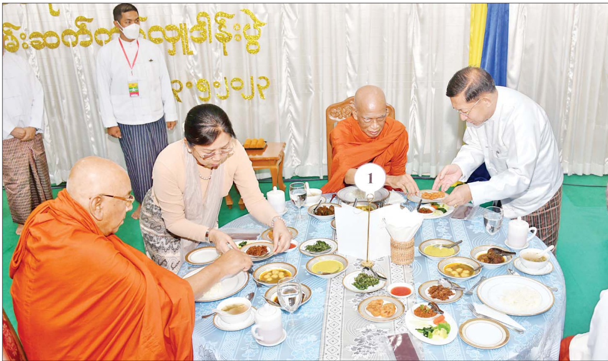
နိုင်ငံတော်စီမံအုပ်ချုပ်ရေးကောင်စီဥက္ကဋ္ဌ နိုင်ငံတော်ဝန်ကြီးချုပ်ဗိုလ်ချုပ်မှူးကြီးမင်းအောင်လှိုင်နှင့် ဇနီး ဒေါ်ကြူကြူလှတို့က ဆရာတော်၊ သံဃာတော်များကို နေ့ဆွမ်းဆက်ကပ်လှူဒါန်းစဉ်။