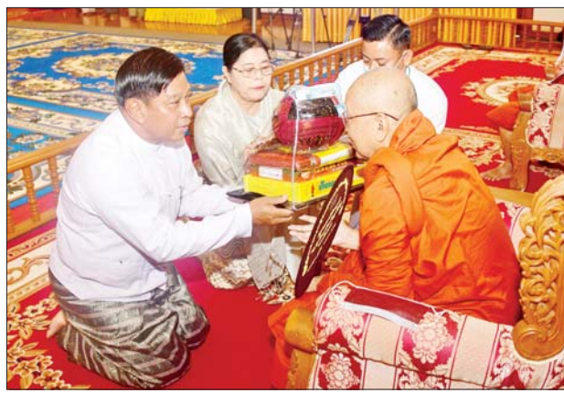
နိုင်ငံတော်စီမံအုပ်ချုပ်ရေးကောင်စီအဖွဲ့ဝင် ဒုတိယဝန်ကြီးချုပ်နှင့် ပြည်ထောင်စုဝန်ကြီး ဗိုလ်ချုပ်ကြီး တင်အောင်စန်းနှင့် ဇနီးတို့က ဆရာတော်ထံ လှူဖွယ်ဝတ္ထုပစ္စည်းများ ဆက်ကပ်လှူဒါန်းစဉ်။