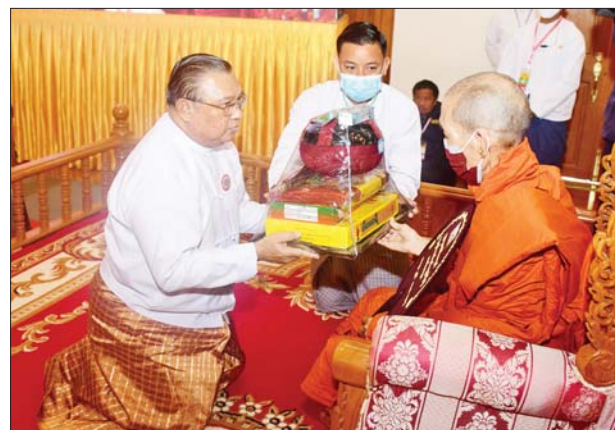
နိုင်ငံတော်စီမံအုပ်ချုပ်ရေးကောင်စီအဖွဲ့ဝင် ဦးဝဏ္ဏမောင်လွင် ဆရာတော်ထံ လှူဖွယ်ဝတ္ထုပစ္စည်းများ ဆက်ကပ်လှူဒါန်းစဉ်။