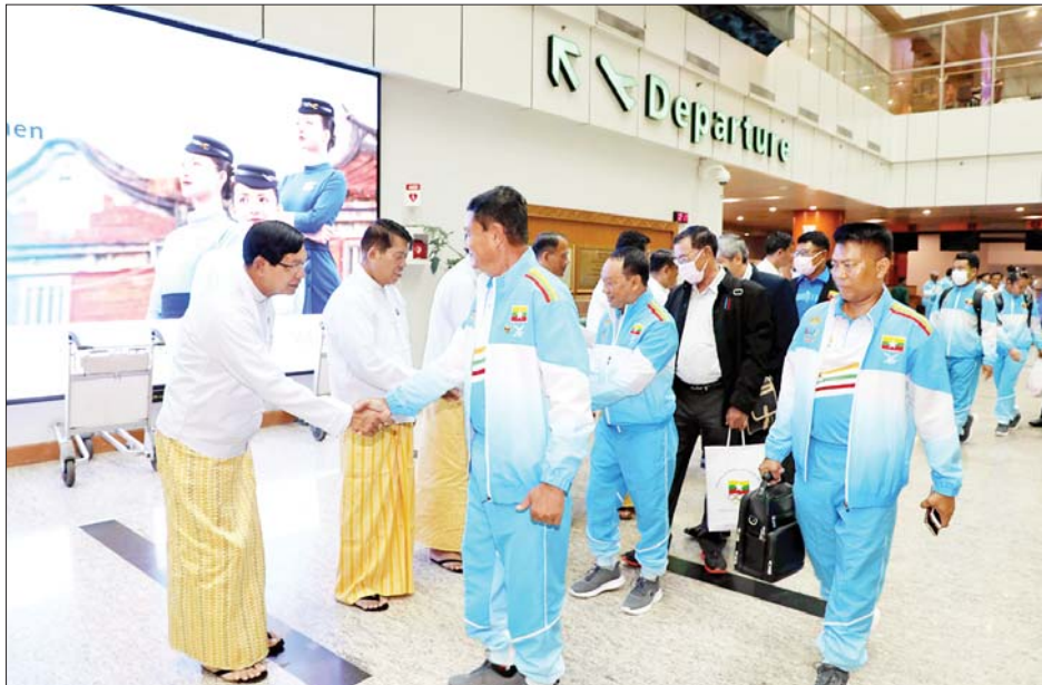
အားကစားအဖွဲ့အား ရင်းရင်းနှီးနှီးလိုက်လံနှုတ်ဆက်၍ ကျန်းမာရေးကို အထူးဂရုစိုက်ရန် အောင်မြင်မှုများ ရရှိပြီး နိုင်ငံ့ဂုဏ်ဆောင်နိုင်အောင် အစွမ်းကုန်ကြိုးစား ကြရန် အားပေးစကား ပြောကြားကြသည်။ အဆိုပါ အားကစားအဖွဲ့များတွင် ဖိတ်ကြားခံ ပုဂ္ဂိုလ် တစ်ဦး၊ အုပ်ချုပ်မှုအဖွဲ့ ၁၃ ဦး၊ ဗိုဗိနမ်

၂၀၂၃ ခုနှစ် မေ ၅ ရက်မှ ၁၇ ရက်အထိ ကမ္ဘောဒီးယားနိုင်ငံတွင် ကျင်းပမည့် (၃၂)ကြိမ်မြောက် အရှေ့တောင်အာရှ အားကစားပြိုင်ပွဲသို့ ဖိတ်ကြားခံ ပုဂ္ဂိုလ်အဖြစ် တက်ရောက်မည့် မြန်မာနိုင်ငံအိုလံပစ် ကော်မတီဥက္ကဋ္ဌ အားကစားနှင့် လူငယ်ရေးရာ ဝန်ကြီးဌာန ပြည်ထောင်စုဝန်ကြီး ဦးမင်းသိန်းဇံနှင့် အတူ မြန်မာအားကစားအဖွဲ့ခေါင်းဆောင် အားကစား နှင့် ကာယပညာဦးစီးဌာန ညွှန်ကြားရေးမှူးချုပ် ဦးထွန်းမြင့်ဦးနှင့် မြန်မာအားကစားအဖွဲ့သည် ယနေ့ မွန်းလွဲ ၃ နာရီတွင် မြန်မာအမျိုးသားလေကြောင်းလိုင်း (စင်းလုံးငှားလေယာဉ်) အမှတ် UB-7017 ဖြင့် ရန်ကုန် မြို့မှ ထွက်ခွာကြရာ ရန်ကုန်တိုင်းဒေသကြီးဝန်ကြီး ချုပ် ဦးစိုးသိန်းနှင့် တိုင်းဒေသကြီး ဝန်ကြီးများ၊ အားကစားနှင့် ကာယပညာဦးစီးဌာနမှ တာဝန်ရှိ ပုဂ္ဂိုလ်များ၊ မိဘပြည်သူများက ရန်ကုန်အပြည်ပြည် ဆိုင်ရာလေဆိပ်၌ လိုက်လံပို့ဆောင်နှုတ်ဆက် ကြသည်။