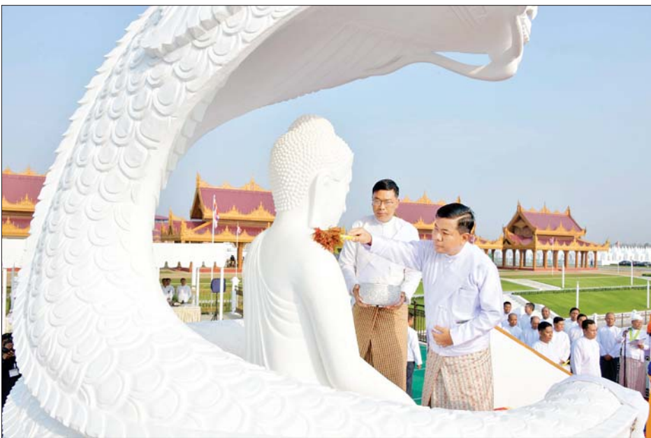
ညှိနှိုင်းကွပ်ကဲရေးမှူးကြီး(ကြည်း၊ ရေလေ) ဗိုလ်ချုပ်ကြီး မောင်မောင်အေး မုစလိန္န ဗုဒ္ဓရုပ်ပွားတော်မြတ်အား ပရိတ်နံ့သာရည်များဖြင့် ပက်ဖျန်းပူဇော်စဉ်။