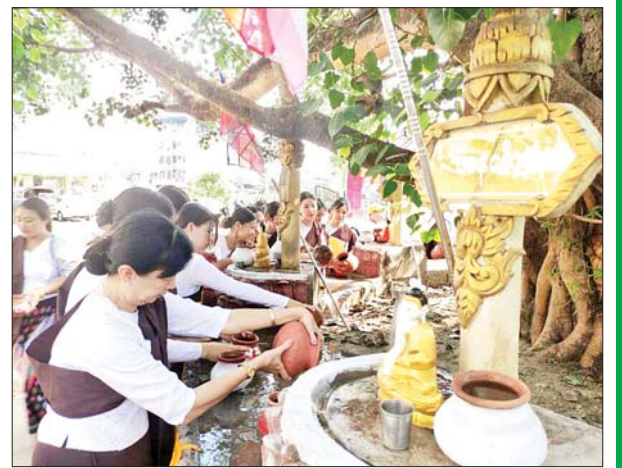
တိုက်ကြီးမြို့နယ်၌ ညောင်ရေသွန်းပွဲတော် ကျင်းပစဉ်။ မြင့်ဦး