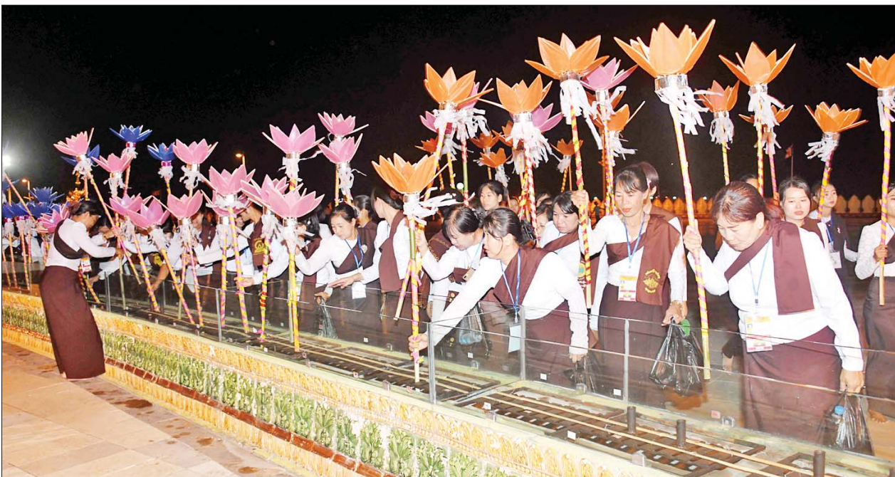
နေပြည်တော် ဥပ္ပါတသန္တီစေတီတော်မြတ်ကြီး ရင်ပြင်တော်၌ ဆီမီးတိုင်များကိုင်ဆောင်၍ လှည့်လည်ပူဇော်ပွဲ ကျင်းပစဉ်။

ယနေ့ကျရောက်သည့် ကဆုန်လပြည့်(ဗုဒ္ဓနေ့) နေ့ထူးနေ့မြတ်တွင် နေပြည်တော် ကောင်စီနယ်မြေအတွင်းရှိ ဘုရားစေတီပုထိုးများ၌ ကုသိုလ်ကောင်းမှုပြုခြင်း၊ ပရိဘောဂစေတီထိုက်သောဗောဓိညောင်ပင်တို့အား ညောင်ရေသွန်းလောင်းပူဇော်ခြင်း၊ စေတနာရှင်၊ ကုသိုလ်ရှင်များက သံဃာတော်များအား ဆွမ်းဆန်စိမ်းလောင်းလှူပွဲများ ကျင်းပခြင်းနှင့် စတုဒိသာကျေးမွေးလှူဒါန်းကြခြင်းစသည့် ကုသိုလ်ကောင်းမှုပြုလုပ်သူများဖြင့် စည်ကားလျက်ရှိသည်။