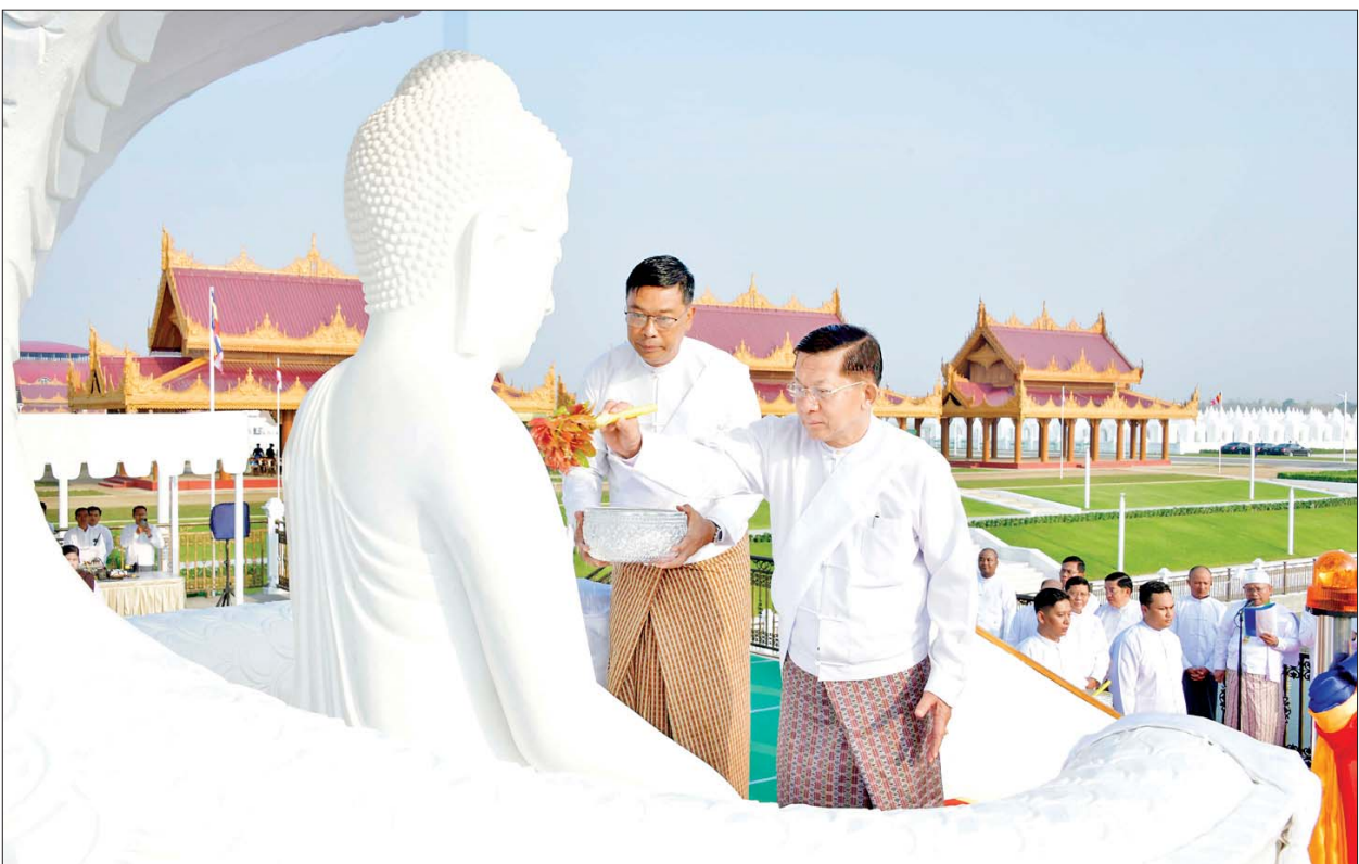
ဦးဆောင်ဘုရားဒါယကာ နိုင်ငံတော်စီမံအုပ်ချုပ်ရေးကောင်စီဥက္ကဋ္ဌ နိုင်ငံတော်ဝန်ကြီးချုပ် ဗိုလ်ချုပ်မှူးကြီးမင်းအောင်လှိုင် မုစလိန္န ဗုဒ္ဓရုပ်ပွားတော်မြတ်အား ပရိတ်နံ့သာရည်များဖြင့် ပက်ဖျန်းပူဇော်စဉ်။

အခမ်းအနားကို “နမောတဿ” သုံးကြိမ်ရွတ်ဆို ဘုရားရှိခိုး၍ ဖွင့်လှစ်သည်။ ရွတ်ဆိုပူဇော် ယင်းနောက် နိုင်ငံတော်စီမံအုပ်ချုပ်ရေးကောင်စီ ဥက္ကဋ္ဌ နိုင်ငံတော်ဝန်ကြီးချုပ် အမှူးပြုသည့် ဧည့်ပရိသတ်များက ရတနတ္ထယပူဇာ ဂါထာတော်နှင့် သဗ္ဗသင်္ဂါဟက မေတ္တာပို့လင်္ကာ နှစ်ပိုဒ်ကို သံပြိုင်ညီညာ သုံးကြိမ်ရွတ်ဆိုပူဇော်ကြသည်။ ထို့နောက် အခမ်းအနားမှူးက မင်္ဂလာအခါတော် စာတမ်းကို ဖတ်ကြားပြီး မင်္ဂလာအချိန်တွင် ဦးဆောင်ဘုရားဒါယကာ နိုင်ငံတော်စီမံအုပ်ချုပ်ရေး ကောင်စီဥက္ကဋ္ဌ နိုင်ငံတော်ဝန်ကြီးချုပ်က ဗုဒ္ဓရုပ်ပွားတော်မြတ်အား မုစလိန္န နဂါးရုံဘုရားကျောင်းဆောင်သို့ မင်္ဂလာစက်ခလုတ်နှိပ်၍ ပင့်ဆောင်သည်။ စာမျက်နှာ ၄ သို့ ❁