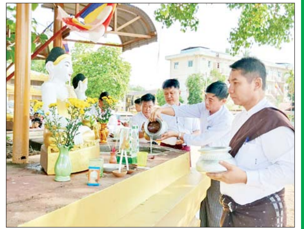
ကျိုက်ထိုမြို့၌ ညောင်ရေသွန်းပွဲတော် ကျင်းပစဉ်။ ခရိုင်(ပြန်/ဆက်)