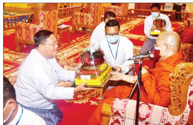
နိုင်ငံတော်စီမံအုပ်ချုပ်ရေးကောင်စီအဖွဲ့ဝင် ဒေါက်တာကျော်ထွန်း ဆရာတော်ထံ လှူဖွယ်ဝတ္ထုပစ္စည်းများ ဆက်ကပ်လှူဒါန်းစဉ်။