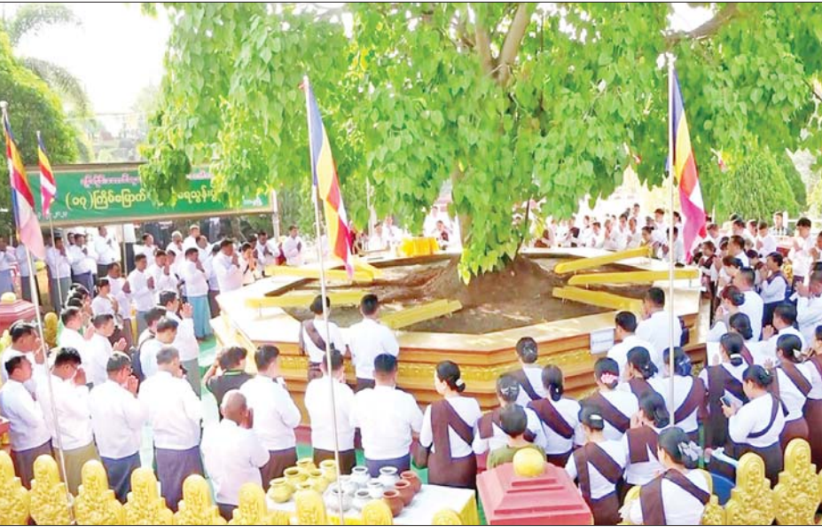
အရှေ့မြောက်တိုင်းစစ်ဌာနချုပ် တိုင်းမှူး ဗိုလ်ချုပ်နိုင်နိုင်ဦး ကဆုန်လပြည့် ဗုဒ္ဓနေ့၌ ရန်တိုင်းအောင်ဆုတောင်းပြည့် ဖြိုးဦးစေတီတော်မြတ်ကြီး ပရိပုဏ္ဏိအတွင်းရှိ မဟာဗောဓိညောင်ပင်အား အမွှေးနံ့သာရည်များဖြင့် သွန်းလောင်းပူဇော်စဉ်။

ထိုသို့ ကဆုန်ညောင်ရေသွန်းလောင်းပွဲများကို ရွှေတိဂုံစေတီတော်မြတ်ကြီး ရင်ပြင်တော်၌ ကျင်းပပြုလုပ်သည့် ညောင်ရေသွန်းပွဲအပါအဝင် တိုင်းဒေသကြီးနှင့် ပြည်နယ်များရှိ ဘုရားပုထိုးစေတီများ၌