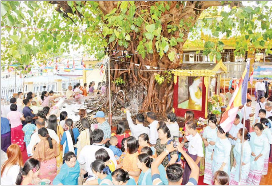
သထုံရွှေစာရုံစေတီတော် မြတ်ကြီး ဗောဓိညောင်ပင်၌ ညောင်ရေသွန်း ပွဲတော် ကျင်းပစဉ်။ ခရိုင်(ပြန်/ဆက်)