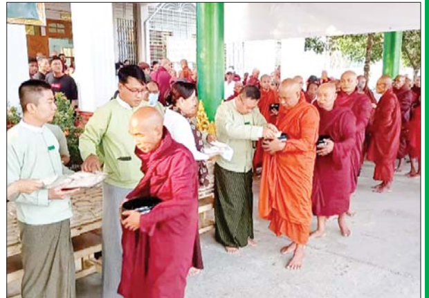
ဖျာပုံမြို့၌ မြို့လုံးကျွတ် ဆွမ်းဆန်စိမ်းလောင်းလှူပွဲ ကျင်းပစဉ်။ သပြေထွန်း