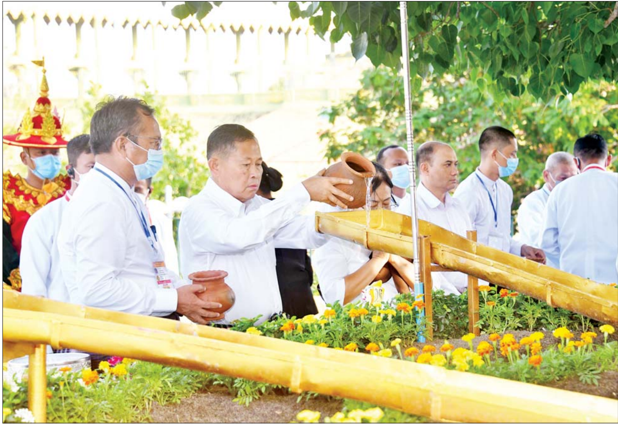
နိုင်ငံတော်စီမံအုပ်ချုပ်ရေးကောင်စီ ဒုတိယဥက္ကဋ္ဌ ဒုတိယဝန်ကြီးချုပ် ဒုတိယဗိုလ်ချုပ်မှူးကြီး စိုးဝင်းနှင့် ဇနီးဒေါ်သန်းသန်းနွယ်တို့ ဥပယုတသန္တိစေတီတော်မြတ်ကြီး ပရိဝုဏ်တော်အတွင်းရှိ မဟာဗောဓိညောင်ပင်အား ညောင်ရေသွန်းလောင်းပူဇော်စဉ်။

တက်ရောက် အခမ်းအနားသို့ နိုင်ငံတော်စီမံအုပ်ချုပ်ရေးကောင်စီ ဥက္ကဋ္ဌ နိုင်ငံတော်ဝန်ကြီးချုပ် ဗိုလ်ချုပ်