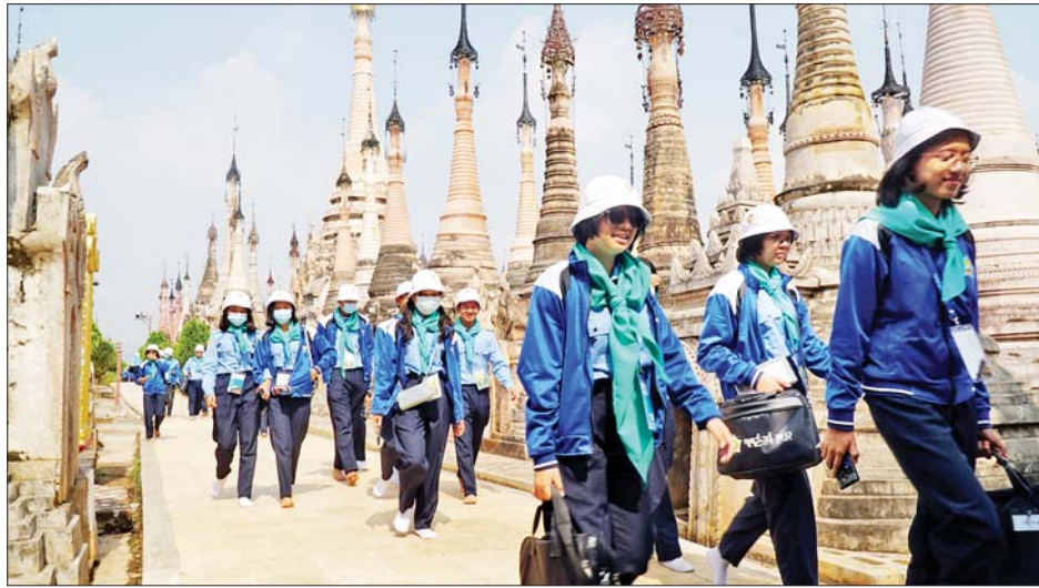
သမိုင်းဝင် မွေတော်ကတ္တူဘုရားသို့ ရောက်ရှိကြရာ လူရည်ချွန်မောင်မယ်များကို ဒေသခံပအိုဝ်းတိုင်းရင်း သားများက အိုးစည်ဗုံမောင်းများတီးခတ်၍ နွေးထွေး

ယင်းနောက် ကျောက်တလုံးကြီးမြို့ရှိ ရှေးဟောင်း