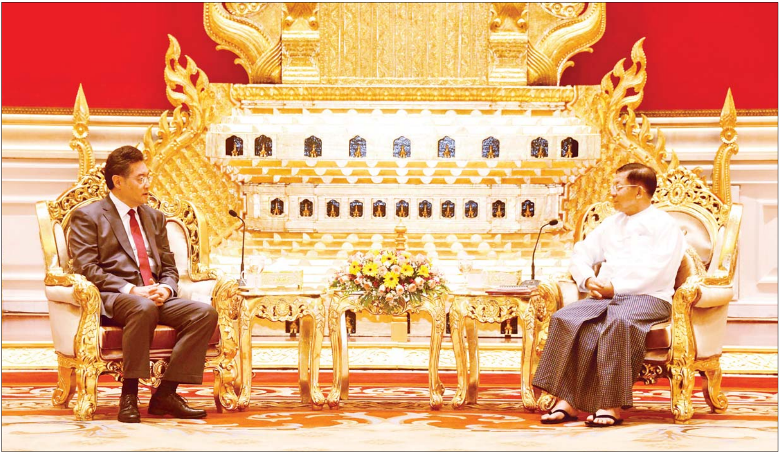
နိုင်ငံတော်စီမံအုပ်ချုပ်ရေးကောင်စီဥက္ကဋ္ဌ နိုင်ငံတော်ဝန်ကြီးချုပ် ဗိုလ်ချုပ်မှူးကြီး မင်းအောင်လှိုင် တရုတ်ပြည်သူ့သမ္မတနိုင်ငံ နိုင်ငံတော်ကောင်စီဝင်နှင့် နိုင်ငံခြားရေး ဝန်ကြီး H. E. Mr. Qin Gang အား လက်ခံတွေ့ဆုံစဉ်။

ပထမဆုံးအကြိမ် ထိုသို့တွေ့ဆုံရာတွင် ဦးစွာ နိုင်ငံတော် စီမံအုပ်ချုပ်ရေး ကောင်စီဥက္ကဋ္ဌ နိုင်ငံတော် ဝန်ကြီးချုပ်က ကြိုဆိုနှုတ်ခွန်း ဆက်စကားပြောကြားပြီး တရုတ် ပြည်သူ့သမ္မတနိုင်ငံ နိုင်ငံတော် ကောင်စီဝင်နှင့် နိုင်ငံခြားရေး ဝန်ကြီးက ယခုကဲ့သို့မိမိအနေဖြင့် မြန်မာနိုင်ငံသို့ ခရီးစဉ်လာရောက် ခြင်းမှာ နိုင်ငံတော်ကောင်စီဝင်နှင့် နိုင်ငံခြားရေးဝန်ကြီးအဖြစ် တာဝန် စာမျက်နှာ ၃ ကော်လံ ၁ သို့ *