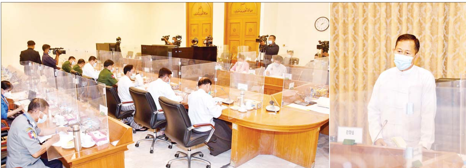
နိုင်ငံတော်စီမံအုပ်ချုပ်ရေးကောင်စီဒုတိယဥက္ကဋ္ဌ ဒုတိယဝန်ကြီးချုပ် ဒုတိယဗိုလ်ချုပ်မှူးကြီး စိုးဝင်း ကိုဗစ်-၁၉ ရောဂါထိန်းချုပ်ရေးနှင့် အရေးပေါ်တုံ့ပြန်ရေးကော်မတီ သတ္တမအကြိမ် လုပ်ငန်းညှိနှိုင်းအစည်းအဝေးတွင် အမှာစကား ပြောကြားစဉ်။

နေပြည်တော် မေ ၂ ကိုဗစ်-၁၉ ထိန်းချုပ်ရေးနှင့် အရေးပေါ် တုံ့ပြန်ရေးကော်မတီ သတ္တမအကြိမ် လုပ်ငန်းညှိနှိုင်း အစည်းအဝေးကို ယနေ့မွန်လွဲ ပိုင်းတွင် နေပြည်တော်ရှိ နိုင်ငံတော် စီမံအုပ်ချုပ်ရေးကောင်စီဥက္ကဋ္ဌရုံး အစည်းအဝေးခန်းမ၌ ကျင်းပရာ ကိုဗစ်-၁၉ ရောဂါ ထိန်းချုပ်ရေး နှင့် အရေးပေါ်တုံ့ပြန်ရေးကော်မတီ ဥက္ကဋ္ဌ နိုင်ငံတော်စီမံအုပ်ချုပ်ရေး ကောင်စီဒုတိယဥက္ကဋ္ဌ ဒုတိယ ဝန်ကြီးချုပ် ဒုတိယဗိုလ်ချုပ်မှူးကြီး စိုးဝင်း တက်ရောက် အမှာစကား ပြောကြားသည်။ စာမျက်နှာ ၄ ကော်လံ ၁ သို့ ၀