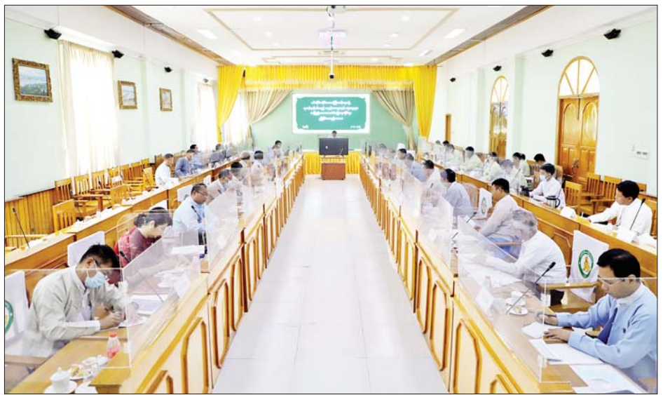
လိုအပ်သည်များကို တာဝန်ရှိသူများနှင့် ဖြည့်ဆည်း ပြောကြားပြီး အစည်းအဝေးကို ရုပ်သိမ်းခဲ့သည်။ ပေါင်းစပ်ဆောင်ရွက်ပေးကာ နိဂုံးချုပ်စကား တိုင်းဒေသကြီး(ပြန်/ဆက်)

ထို့နောက် တိုင်းဒေသကြီးဝန်ကြီးချုပ် ဦးမြတ်ကျော်က အစည်းအဝေးသို့ တက်ရောက်လာသူများ၏ အကြံပြုဆွေးနွေးတင်ပြချက်များအပေါ်