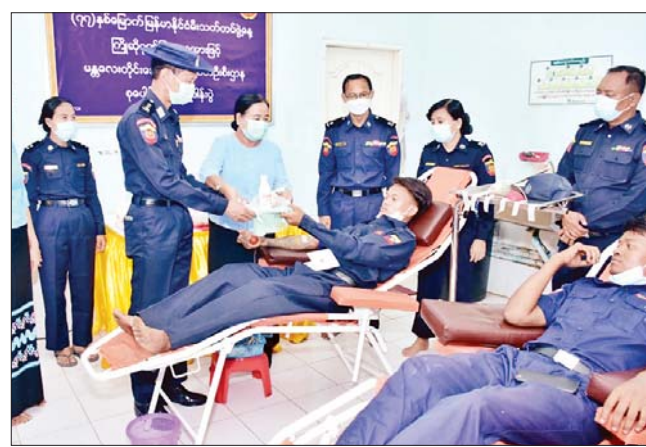
ဒေါက်တာစုလှိုင်ဦးတို့က လှည့်လည်ကြည့်ရှုအားပေးကြကြောင်း သိရသည်။ မန်းကိုယ်ပွား

မန္တလေး မေ ၂ (၇၇)နှစ်မြောက်မီးသတ်တပ်ဖွဲ့နေ့ကို ကြိုဆိုဂုဏ်ပြုသောအားဖြင့် တိုင်းဒေသ ကြီး မီးသတ်ဦးစီးဌာနက ကြီးမှူး၍ စုပေါင်းသန့်ရှင်းရေးဆောင်ရွက်ခြင်းနှင့် စုပေါင်း သွေးလှူဒါန်းပွဲကို ယနေ့နံနက်ပိုင်းက မန္တလေးမြို့၌ ပြုလုပ်သည်။ ဦးစွာ တိုင်းဒေသကြီး၊ ခရိုင်နှင့် မြို့နယ် မီးသတ်ဦးစီးမှူးများ ဦးဆောင်သော တပ်ဖွဲ့ဝင်များ၊ အရန်မီးသတ်တပ်ဖွဲ့ ဝင်များ အင်အား ၂၀၀ တို့သည် အောင်မြေ သာစံမြို့နယ် မန္တလေးတောင်ခြေရှိ မဟာသကျမာရဇိန် ကျောက်တော်ကြီး ဘုရားရှင်ပြင်တော် သန့်ရှင်းရေးဆောင်ရွက်ခြင်း၊ အာရုံခံတန်ဆောင်းအတွင်းရှိ ဗုဒ္ဓရုပ်ပွားတော်များအား ရေသပ္ပာယ်ခြင်း၊ ရောင်တော်ဖွင့်ခြင်းများကို ကုသိုလ်ပြု ဆောင်ရွက်ကြသည်။ ထို့နောက် မန္တလေးပြည်သူ့ဆေးရုံကြီး အမျိုးသား သွေးလှူဘဏ်တွင် တပ်ဖွဲ့ဝင် ၁၀၀ က သွေးလှူဒါန်းကြရာ တိုင်းဒေသကြီး မီးသတ်ဦးစီးမှူး ဦးဇော်ဝင်းထွန်းနှင့် တာဝန်ရှိသူများ၊ မိသားစုစည်းရုံးရေးကော်မတီ ဥက္ကဋ္ဌ သစ်သစ်လှိုင်နှင့် ကော်မတီဝင်များ၊ သွေးလှူဘဏ် တာဝန်ခံဆရာဝန်ကြီး