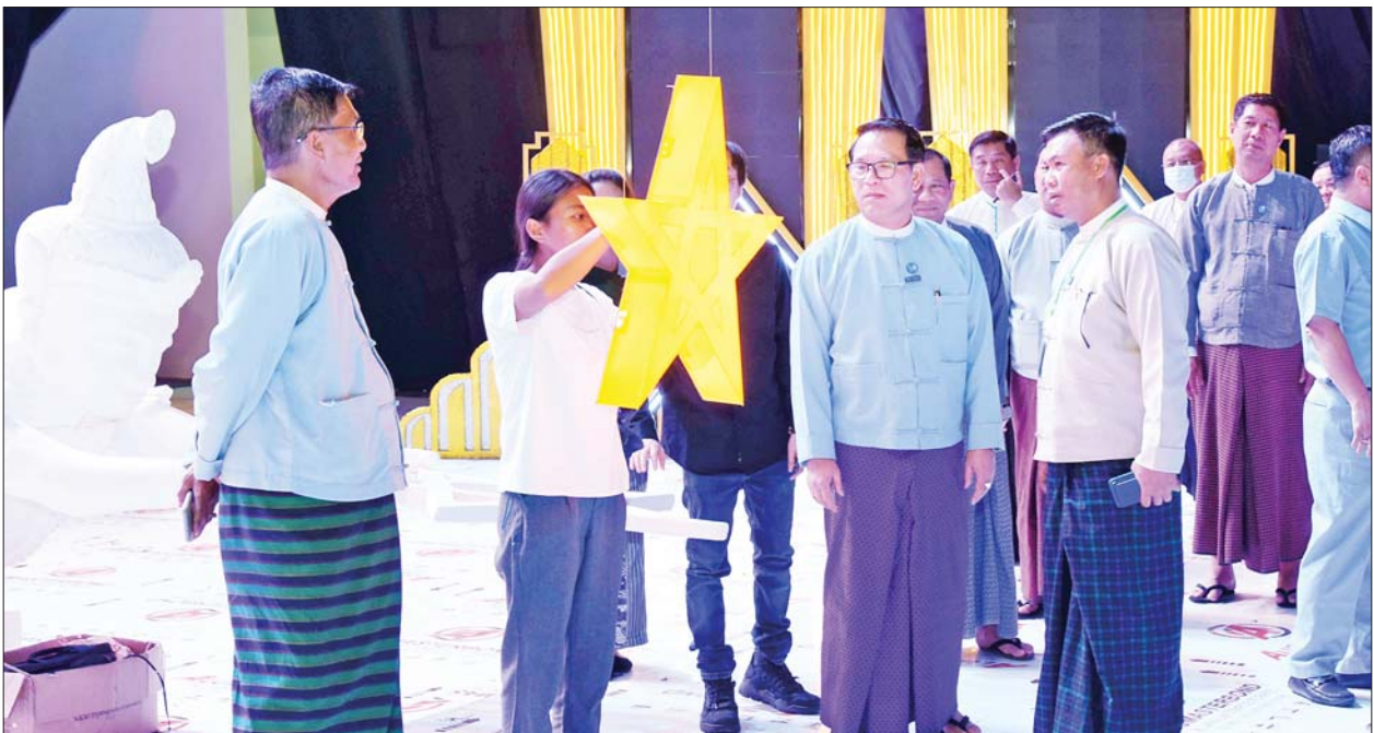
ပြည်ထောင်စုဝန်ကြီး ဦးမောင်မောင်အုန်းနှင့် တာဝန်ရှိသူများ မြန်မာ့ရုပ်ရှင်ထူးချွန်ဆုချီးမြှင့်ပွဲအခမ်းအနားကျင်းပမည့် လဟာပြင်ကဇာတ်ရုံ၌ ပြင်ဆင်ဆောင်ရွက်နေမှုများ ကြည့်ရှုစစ်ဆေးစဉ်။

နေပြည်တော် မေ ၂ မြန်မာ့ရုပ်ရှင်ထူးချွန်ဆုချီးမြှင့်ပွဲအခမ်းအနားကျင်းပရေး ဦးစီးကော်မတီဥက္ကဋ္ဌ ပြန်ကြားရေးဝန်ကြီးဌာန ပြည်ထောင်စုဝန်ကြီး ဦးမောင်မောင်အုန်းသည် လုပ်ငန်းကော်မတီဥက္ကဋ္ဌ ဒုတိယဝန်ကြီး ဦးရဲတင့်၊ နေပြည်တော်စည်ပင်သာယာရေးကော်မတီ ဒုတိယဥက္ကဋ္ဌ ဒုတိယမြို့တော်ဝန် ဦးမောင်မောင်၊ ဆပ်ကော်မတီအလိုက် တာဝန်ရှိသူများနှင့်အတူ ယနေ့ညနေပိုင်းတွင် နေပြည်တော် မြို့တော်ခန်းမအနီးရှိ လဟာပြင်ကဇာတ်ရုံ၌ ၂၀၁၉ ခုနှစ်၊ ၂၀၂၀ ပြည့်နှစ်နှင့် ၂၀၂၂ ခုနှစ်တို့အတွက် မြန်မာ့ရုပ်ရှင်ထူးချွန်ဆု ချီးမြှင့်ပွဲအခမ်းအနားကျင်းပရန် ပြင်ဆင်ဆောင်ရွက်နေမှု အခြေအနေများကို ကြည့်ရှုစစ်ဆေးသည်။