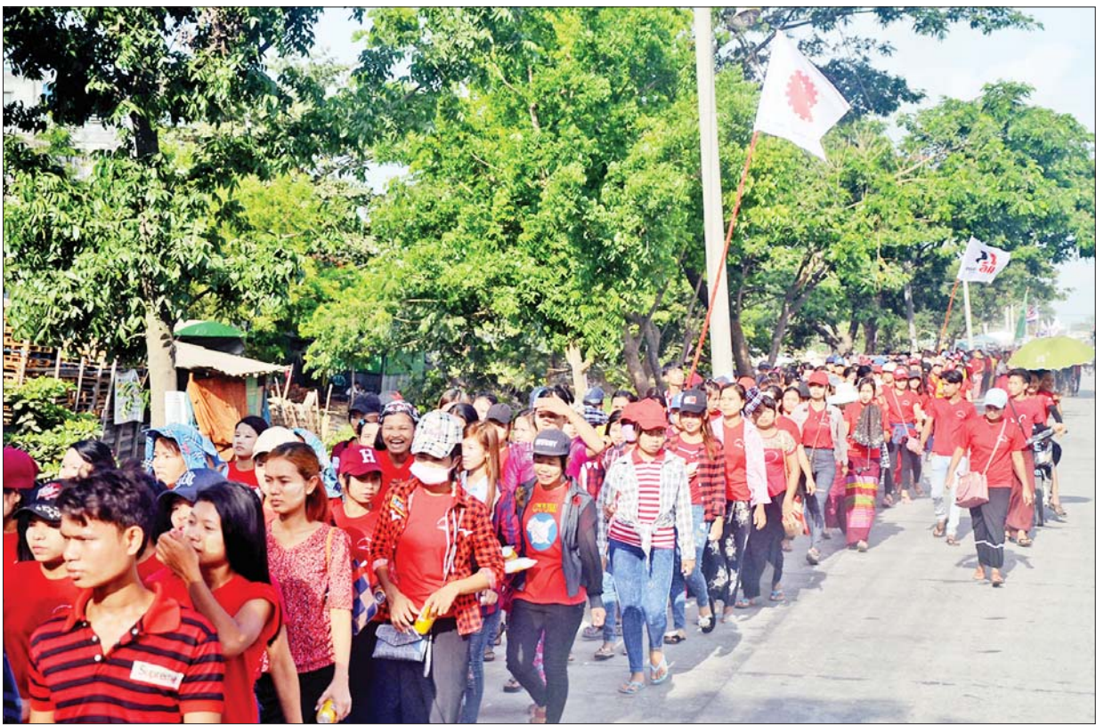
၂၀၁၉ ခုနှစ် အပြည်ပြည်ဆိုင်ရာအလုပ်သမားနေ့ကိုဂုဏ်ပြုသောအားဖြင့် အခမ်းအနားကျင်းပရာသို့ လှိုင်သာယာမြို့နယ်ရှိ စက်ရုံ၊ အလုပ်ရုံများမှ အလုပ်သမားများ ချီတက်ကြစဉ်။

ထိုအချိန်တွင် ထပ်မံအကြမ်းဖက်ပစ်ခတ်နှိမ်နင်းပြီး အလုပ် သမားခေါင်းဆောင် လေးဦးတို့ကို ဆူပူမှုဖန်တီးကြသည်ဟုသော အကြောင်းပြချက်ဖြင့် ကြီးပေးသတ်ဖြတ်လိုက်ကြသည်။ ကျန်အလုပ် သမားခေါင်းဆောင်များကိုလည်း ထောင်ဒဏ်၊ ငွေဒဏ်၊ စသည့်ပြစ်ဒဏ် များပေးလိုက်ကြသည်။ အလုပ်သမားထုကြီးက အလျှော့မပေးဘဲ