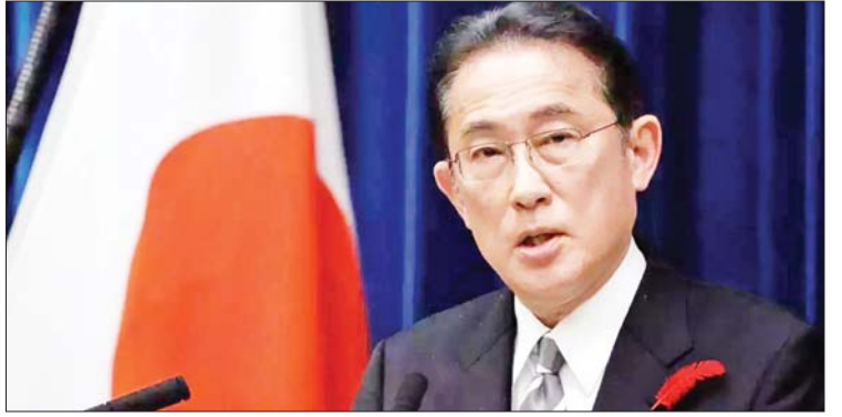
သွားမည်ဖြစ်ကြောင်း ကိရိုဒါက ဆိုသည်။ တွေ့ဆုံရန် စီစဉ်ထားကြောင်း သိရသည်။ ဝန်ကြီးချုပ်သည် ၎င်း၏ခရီးစဉ် ပထမ ကိုးကား - အင်န်အိတ်ချ်ကေ အကြိမ်တွင် အီဂျစ်သမ္မတအယ်စီစီနှင့် ဘာသာပြန် - အောင်ကျော်ကျော်

အာဖရိကခေါင်းဆောင်များနှင့် ပူးပေါင်း ဆောင်ရွက်ရေးကို မြှင့်တင်လိုကြောင်း ဝန်ကြီးချုပ် ကိရိုဒါက ခရီးစဉ်မစတင်မီ သတင်းထောက်များကို ပြောကြားသည်။ အစားအစာနှင့် စွမ်းအင်ကဲ့သို့သော နယ်ပယ်များတွင် Global South နှင့် ဂျပန်နိုင်ငံ၏ ဆက်ဆံရေးကို မြှင့်တင် စေလိုကြောင်း ကိရိုဒါက ဆိုသည်။ ထို့ပြင် ဆူဒန်နိုင်ငံ၏ လုံခြုံရေး အခြေအနေ တည်ငြိမ်စေရန် ပူးပေါင်း ဆောင်ရွက်မှုကိုလည်း ကြိုးပမ်းမြှင့်တင်