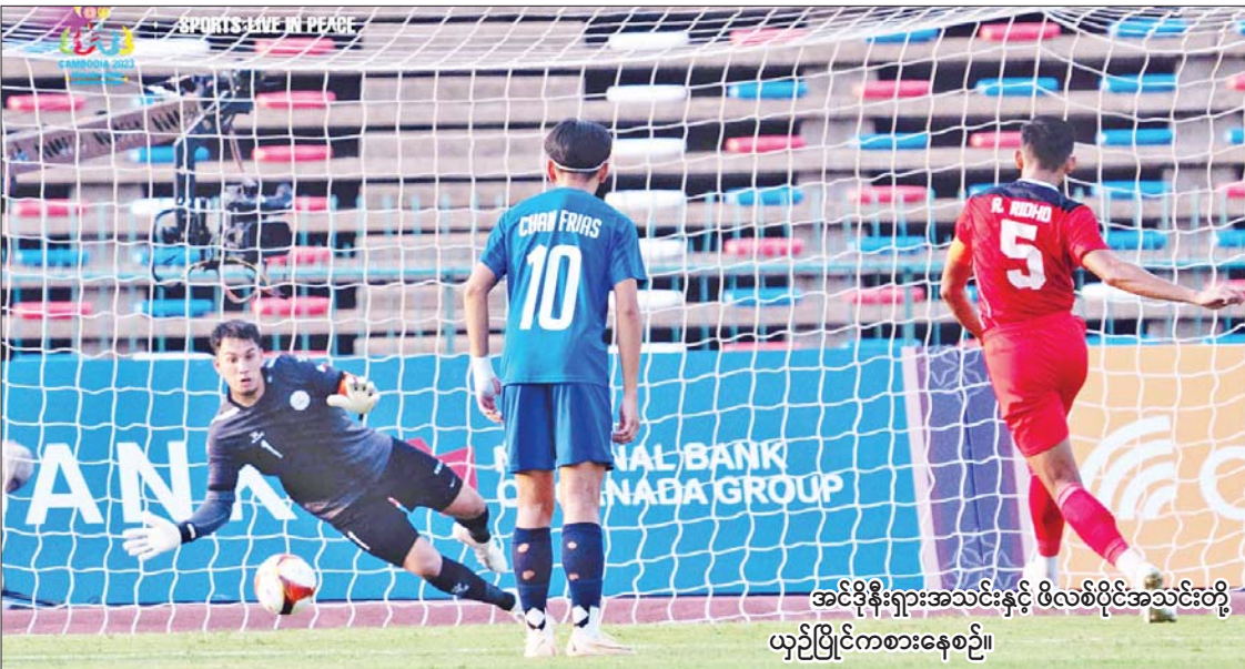
အင်ဒိုနီးရှားအသင်းနှင့် ဖိလစ်ပိုင်အသင်းတို့ ယှဉ်ပြိုင်ကစားနေစဉ်။

ကိုဗစ်-၁၉ ရောဂါပိုး ကူးစက်ပျံ့နှံ့မှုကို ဆက်လက်ထိန်းချုပ်ဆောင်ရွက်ရန် လိုအပ်ပါသဖြင့် ပြည်ထောင်စုအဆင့်အဖွဲ့အစည်းများ၊ ပြည်ထောင်စုဝန်ကြီးဌာနများမှ ကိုဗစ်-၁၉ ရောဂါ ကာကွယ်၊ ထိန်းချုပ်၊ တားဆီးရေးအတွက် ၂၀၂၃ ခုနှစ်၊ ဧပြီလ ၃၀ ရက်နေ့အထိ ထုတ်ပြန်ထားသော ပြည်သူ့သို့ ပန်ကြားချက်၊ အမိန့်၊ အမိန့်ကြော်ငြာစာ၊ ညွှန်ကြားချက်များ(ဖြေလျှော့ပေးမည့်ကိစ္စရပ်များမပါ)အား ၂၀၂၃ ခုနှစ်၊ မေလ ၃၀ ရက်နေ့အထိ ရက်တိုးမြှင့်သတ်မှတ်ဆောင်ရွက်ထားပါကြောင်း အသိပေးကြေညာအပ်ပါသည်။