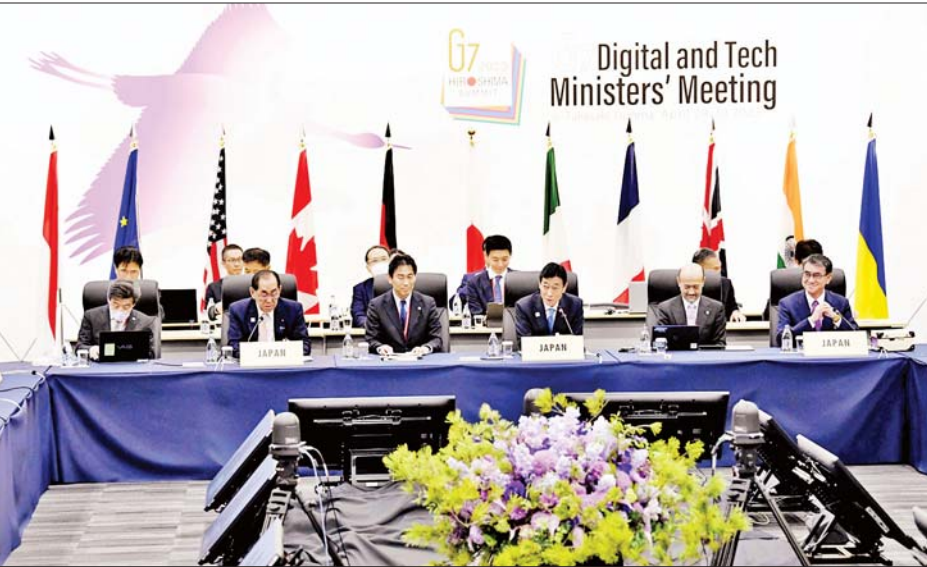
လိုအပ်ကြောင်း ဂျပန်စီးပွားရေး၊ ကုန်သွယ်ရေးနှင့် စက်မှုဝန်ကြီး နီရိုမူရာ ယာဆူတိုရီက ဆွေးနွေး ပြောကြားသည်။ ဖွံ့ဖြိုးတိုးတက်မှုနှင့် သင့်လျော်သော နည်းပညာ အသုံးပြုမှုကို ပိတ်ပင်ဟန့်တားခြင်းမရှိစေဘဲ ၎င်း၏ သက်ရောက်မှု ဆိုးကျိုးများကိုသာ တတ်နိုင်သမျှ ကိုင်တွယ်ဖြေရှင်းသင့်ကြောင်းလည်း ၎င်းက ဆိုသည်။ မကြာသေးမီရက် များအတွင်း နည်းပညာ ဆိုင်ရာ ဖွံ့ဖြိုးတိုးတက်မှုများကြောင့် ဒေတာအလွှဲ

တိုကျို ဧပြီ ၂၉ ကမ္ဘာ့စက်မှုထိပ်သီး ခုနစ်နိုင်ငံ(G7)၏ အင်ဂျင်နီယာနှင့်နည်းပညာဝန်ကြီးများက ဉာဏ်ရည်တု နည်းပညာ (AI)ကို လျင်မြန်စွာ ကျယ်ကျယ်ပြန့်ပြန့် အသုံးပြုမှုနှင့် ၎င်းအားထိန်းချုပ်ရန် နည်းလမ်း ကောင်းများကို အလေးပေးဆွေးနွေးခဲ့ကြောင်း သိရသည်။ အင်ဂျင်နီယာနှင့်နည်းပညာဆိုင်ရာ G7 ဝန်ကြီး များ၏ နှစ်ရက်ကြာအစည်းအဝေးကို ဂျပန်နိုင်ငံ တိုကျိုမြို့ မြောက်ဘက် တာကာဆာကီမြို့၌ ကျင်းပ လျက်ရှိပြီး ဂျပန်နိုင်ငံက သဘာပတိအဖြစ် ဆောင်ရွက်လျက်ရှိသည်။ အစည်းအဝေး၌ ဝန်ကြီးများက ဉာဏ်ရည်တု နည်းပညာ(AI)နှင့် နယ်စပ်ဖြတ်ကျော် ဒေတာစီးဆင်း မှုများကို အဓိကထား ဆွေးနွေးသွားမည်ဖြစ်သည်။ AI ကဲ့သို့သော နည်းပညာ၏ အပျက်သဘော ဆောင်သည့် အကျိုးသက်ရောက်မှုများသည် လူမှုရေးဆိုင်ရာ ပြောင်းလဲမှုများကို ဆောင်ကြဉ်းပေး နိုင်သည့် ဆိုးကျိုးများအပေါ် လျင်မြန်စွာ အကဲဖြတ် ရန်နှင့် ၎င်းတို့အား ကောင်းမွန်စွာ တုံ့ပြန်သွားရန်