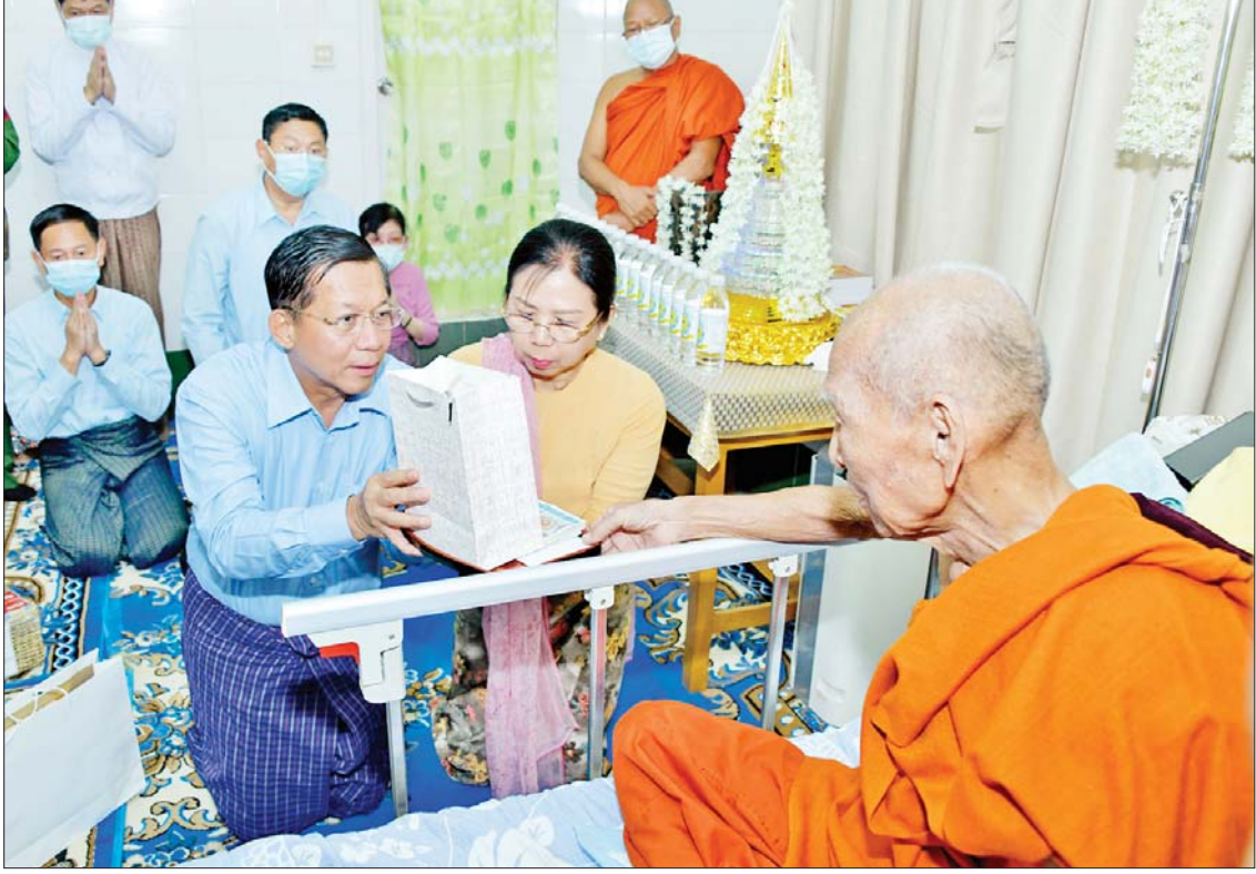
နိုင်ငံတော်စီမံအုပ်ချုပ်ရေးကောင်စီ ဥက္ကဋ္ဌ နိုင်ငံတော်ဝန်ကြီးချုပ် ဗိုလ်ချုပ်မှူးကြီးမင်းအောင်လှိုင်နှင့်ဇနီး ဒေါ်ကြူကြူလှတို့ ဗန်းမော်ဆရာတော်ကြီးအား ဆေးပစ္စည်းများ၊ အာဟာရဖြည့်စားသောက်ဖွယ်ရာများနှင့် နဝကမ္မအလှူငွေများကို ဆက်ကပ် လှူဒါန်းစဉ်။

မြန်မာသက္ကရာဇ် ၁၃၈၅ ခုနှစ် ကဆုန် လပြည့်နေ့တွင်လည်း “ကဆုန်လပြည့် ဗုဒ္ဓနေ့”ဆိုင်ရာ အခမ်းအနားများကို နိုင်ငံတော်အဆင့် ခမ်းနားသိုက်မြိုက်စွာ ကျင်းပပြုလုပ်သွားမည့် အခြေအနေများ၊ မြန်မာနိုင်ငံသည် ထေရဝါဒဗုဒ္ဓဘာသာ ကိုးကွယ်မှု၏ ဗဟိုချက်ဖြစ်စေရေး ကြိုးပမ်းဆောင်ရွက်သွားမည်ဖြစ်သည့် အခြေအနေများနှင့် ဆရာတော်ကြီးတို့၏ ဦးဆောင်မှုဖြင့် သံဃအဖွဲ့အစည်းသည် လည်း မှန်ကန်စွာရပ်တည်လျက်ရှိသည့် အခြေအနေများကို လျှောက်ထားတင်ပြ ပြီး ဆရာတော်ကြီးထံမှ ဩဝါဒကို ခံယူသည်။ ထို့နောက် နိုင်ငံတော်စီမံအုပ်ချုပ်ရေး ကောင်စီဥက္ကဋ္ဌ နိုင်ငံတော်ဝန်ကြီးချုပ် နှင့်ဇနီးတို့က ဆရာတော်ကြီးအား ဆေးပစ္စည်းများ၊ အာဟာရဖြည့်စားသောက်ဖွယ်ရာများနှင့် နဝကမ္မအလှူငွေများကို ဆက်ကပ်လှူဒါန်းပြီး ဆရာ တော်ကြီး ပောကြားချီးမြှင့် တော်မူသည့် တရားတော်များကို နာယူကြည့်ညှိ သည်။ ယင်းနောက် နိုင်ငံတော်စီမံအုပ်ချုပ် ရေးကောင်စီဥက္ကဋ္ဌ နိုင်ငံတော်ဝန်ကြီး