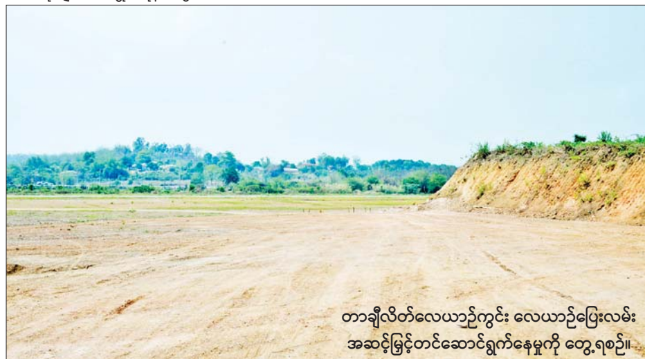
တာချီလိတ်လေယာဉ်ကွင်း လေယာဉ်ပြေးလမ်း အဆင့်မြှင့်တင်ဆောင်ရွက်နေမှုကို တွေ့ရစဉ်။