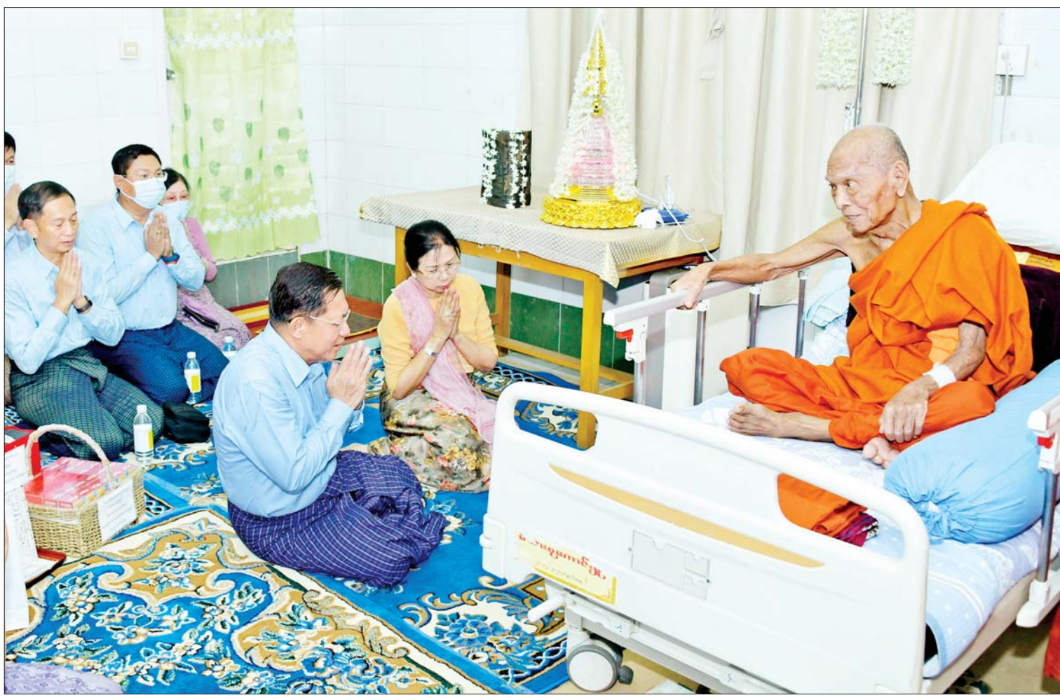
နိုင်ငံတော်စီမံအုပ်ချုပ်ရေးကောင်စီဥက္ကဋ္ဌ နိုင်ငံတော်ဝန်ကြီးချုပ် ဗိုလ်ချုပ်မှူးကြီးမင်းအောင်လှိုင်နှင့် ဇနီး ဒေါ်ကြူကြူလှတို့ ဗန်းမော်ဆရာတော်ကြီးအား ဖူးမြော်ကြည်ညို၍ ကျန်းမာရေးအခြေအနေများကို မေးမြန်းလျှောက်ထားစဉ်။

နေပြည်တော် ဧပြီ ၂၉ မန္တလေးမြို့ အထွေထွေရောဂါကုဆေးရုံကြီးတွင် တက်ရောက်ဆေးကုသမှုခံယူလျက်ရှိသည့် နိုင်ငံတော်သံဃမဟာနာယကအဖွဲ့ဥက္ကဋ္ဌ မန္တလေးမြို့ ဗန်းမော်ကျောင်းတိုက်ဆရာတော် အဂ္ဂမဟာပဏ္ဍိတ အဂ္ဂမဟာဂန္ထဝါစကပဏ္ဍိတ အဘိဓမ္မမဟာရဋ္ဌဂုရု အဘိဓမ္မအဂ္ဂမဟာသဒ္ဓမ္မဇောတိက ဘဒ္ဒန္တ ကုမာရာဘိဝံသအား နိုင်ငံတော်စီမံအုပ်ချုပ်ရေးကောင်စီဥက္ကဋ္ဌ နိုင်ငံတော်ဝန်ကြီးချုပ် ဗိုလ်ချုပ်မှူးကြီးမင်းအောင်လှိုင်သည် ဇနီး ဒေါ်ကြူကြူလှနှင့် တာဝန်ရှိသူများလိုက်ပါ၍ ယနေ့နံနက်ပိုင်းတွင် သွားရောက်ဖူးမြော်ကြည်ညိုသည်။