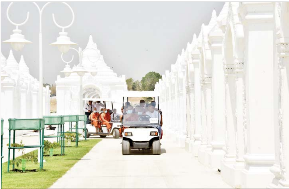
နိုင်ရန် သံဃာတော်စင်္ဂဟဓမ္မစင်္ဂဟတို့က တည်ဆောက်ခြင်း၊ ရုပ်ပွားတော်မြတ်ကြီးအား ပင့်ဆောင်ခြင်းနှင့် ပင့်ဆောင်နေရာချထားခြင်း လုပ်ငန်းအဆင့်ဆင့် ဆောင်ရွက်နေမှုအခြေအနေများ၊ မာရဝိဇယဗုဒ္ဓဥယျာဉ်တော်ကြီးနှင့် သာသနိကအဆောက်အအုံစိမ်းလန်းစိုပြည်သာယာလှပစေရေးအတွက် သစ်ပင်