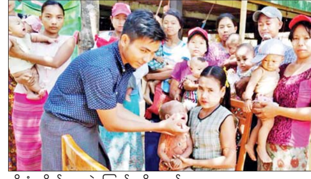
ထိုးနှံ၊ တိုက်ကျွေးခဲ့ကြောင်း သိရသည်။

အဆိုပါ ကာကွယ်ဆေးထိုးနှံခြင်းကို ဧပြီ ၂၈ ရက်မှ ၂၉ ရက် အထိ အသက် တစ်နှစ်အောက်ကလေးငယ်များ၊ အသက် တစ်နှစ်မှ နှစ်နှစ်အထိ ကလေးငယ်များ၊ နှစ်နှစ်မှ သုံးနှစ်အထိ ကလေးငယ်များအား မြို့နယ် ပြည်သူ့ကျန်းမာရေးဦးစီးဌာနမှ ကာကွယ်ဆေးငါးမျိုးကို