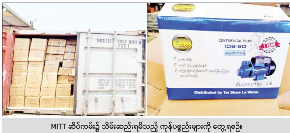
MITT ဆိပ်ကမ်း၌ သိမ်းဆည်းရမိသည့် ကုန်ပစ္စည်းများကို တွေ့ရစဉ်။

နေပြည်တော် ဧပြီ ၂၉ တရားမဝင်ကုန်သွယ်မှု တိုက်ဖျက်ရေး ဦးဆောင်ကော်မတီ၏ ကြီးကြပ်ကွပ်ကဲမှုဖြင့် တရားမဝင်ကုန်သွယ်မှုများကို ဥပဒေနှင့်အညီ ထိရောက်စွာ တားဆီးအရေးယူနိုင်ရေး ဆောင်ရွက်လျက်ရှိရာ ရန်ကုန်တိုင်းဒေသကြီး တရားမဝင်ကုန်သွယ်မှု တိုက်ဖျက်ရေးအထူးအဖွဲ့၏ စီမံခန့်ခွဲမှုဖြင့် ဧပြီ ၂၇ ရက်တွင် အမှတ်(၂)ယာဉ်ထိန်းရဲတပ်ဖွဲ့ခွဲ၊ လိုင်စင်မဲ့ယာဉ်ဖမ်းဆီးရမိရေးအဖွဲ့က စစ်ဆေးမှုများ ဆောင်ရွက်ခဲ့ရာ သောင်ရွက်ခဲ့ရာ လှိုင်သာယာ-အရှေ့ပိုင်းမြို့နယ် တွဲတေးလမ်း ပန်းလှိုင်တံတား အနီး၌ လိုင်စင်မဲ့ Toyota Mark II ယာဉ်တစ်စီး (ခန့်မှန်း တန်ဖိုးငွေကျပ် ၃၅၀၀၀၀၀)ကို သက်ဆိုင်ရာ လုပ်ထုံးလုပ်နည်းများအရ လည်းကောင်း၊ ဧပြီ ၂၈ ရက်တွင် ရွာသာကြီးတိုးဂိတ် အနီး၌ တာဝန်ကျ ပူးပေါင်းအဖွဲ့က မြဝတီမြို့မှ ရန်ကုန်မြို့သို့ သွားရောက်မည့် ယာဉ်တစ်စီးအား စစ်ဆေးရာ ရှေးနှင့် ပို့ဆောင်ရေးဌာနခွဲသို့ ခေါ်ယူစစ်ဆေးခဲ့ရာ သွင်းကုန်ကြေညာလွှာတွင် ကြေညာထားသည့်ထက် ပိုမိုပါရှိလာသည့် Wai Wai Instant Rice Vermicelli ၆၀၀ ကီလိုဂရမ် အပါအဝင် ကုန်ပစ္စည်းသုံးမျိုး (ခန့်မှန်း တန်ဖိုးငွေကျပ် ၉၁၉၄၅၅၁)ကို လည်းကောင်း၊ အဆိုပါပစ္စည်းများ တင်ဆောင်လာသည့် DONG FENG Tractor Head တစ်စီးနှင့်