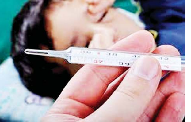
ကြိုတင်ကာကွယ်နိုင်ရန် ပုံမှန်တုတ်ကွေးရောဂါ ကာကွယ်ဆေးကို ထိုးနှံ ခြင်းပြုလုပ်ရေး အမေရိကန်နိုင်ငံ ရောဂါထိန်းချုပ်ရေးနှင့် ကာကွယ် ရေးစင်တာက အကြံပြုထားကြောင်း သိရသည်။ ကိုးကား - ဆင်ဟွာ၊ ဘာသာပြန် - အလင်းသစ်

လော့စ်အိန်ဂျလစ် ဧပြီ ၂၉ အမေရိကန်နိုင်ငံ၌ ယခုတုတ်ကွေးရာသီအတွင်း လက်ရှိအချိန်အထိ တုတ်ကွေးရောဂါကြောင့် ကလေးငယ် ၁၄၅ ဦး သေဆုံးခဲ့ကြောင်း အမေရိကန်နိုင်ငံ ရောဂါထိန်းချုပ်ရေးနှင့် ကာကွယ်ရေးစင်တာက ဧပြီ ၂၈ ရက်တွင် ထုတ်ပြန်သည့် နောက်ဆုံးအချက်အလက်များအရ သိရသည်။ လက်ရှိတွင် အမေရိကန်နိုင်ငံ၌ တုတ်ကွေးရောဂါဖြစ်ပွားသူ အနည်း ဆုံး ၂၆ သန်းရှိပြီး ၂၉၀၀၀၀ သည် ဆေးရုံတက်ရောက်ဆေးဝါးကုသမှု ခံယူခဲ့ရကာ လူဦးရေစုစုပေါင်း ၁၉၀၀၀ သေဆုံးခဲ့ကြောင်း သိရသည်။ ဧပြီ ၂၂ ရက်တွင် ကုန်ဆုံးခဲ့သည့် နောက်ဆုံးသီတင်းပတ်အတွင်း မှာပင် တုတ်ကွေးရောဂါကြောင့် လူပေါင်း ၁၀၀၀ နီးပါး ဆေးရုံတက်ရောက် ဆေးဝါးကုသမှုခံယူခဲ့ရကြောင်း အမေရိကန်နိုင်ငံ ရောဂါထိန်းချုပ်ရေး နှင့် ကာကွယ်ရေးစင်တာက ပြောကြားသည်။ ထို့ကြောင့် အမေရိကန်နိုင်ငံရှိ အသက်ခြောက်လနှင့်အထက် အသက်အရွယ်ရှိသူအားလုံးအနေဖြင့် တုတ်ကွေးရောဂါဖြစ်ပွားမှုကို