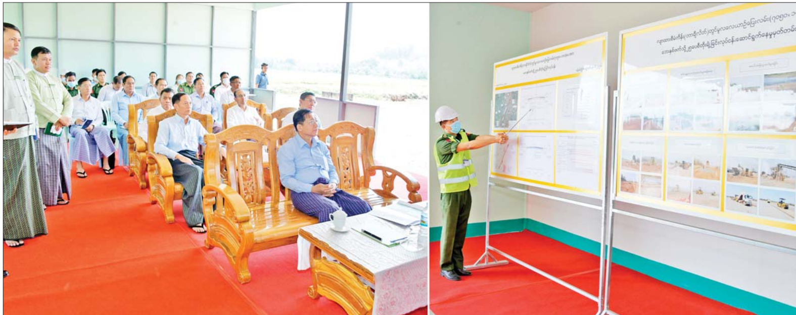
နိုင်ငံတော်စီမံအုပ်ချုပ်ရေးကောင်စီဥက္ကဋ္ဌ နိုင်ငံတော်ဝန်ကြီးချုပ် ဗိုလ်ချုပ်မှူးကြီးမင်းအောင်လှိုင်အား တာချီလိတ်လေယာဉ်ကွင်း လေယာဉ်ပြေးလမ်းအဆင့်မြှင့်တင်ဆောင်ရွက်နေမှုအခြေအနေများကို တာဝန်ရှိသူတစ်ဦးက ရှင်းလင်းတင်ပြစဉ်။

နေပြည်တော် ဧပြီ ၂၉ နိုင်ငံတော် စီမံအုပ်ချုပ်ရေးကောင်စီဥက္ကဋ္ဌ နိုင်ငံတော်ဝန်ကြီးချုပ် ဗိုလ်ချုပ်မှူးကြီးမင်းအောင်လှိုင်သည် ကောင်စီတွဲဖက်အတွင်းရေးမှူး ဒုတိယဗိုလ်ချုပ်ကြီး ရဲဝင်းဦး၊ ကာကွယ်ရေးဦးစီးချုပ် (ရေ) ဗိုလ်ချုပ်ကြီးမိုးအောင်၊ ကာကွယ်ရေးဦးစီးချုပ် (လေ) ဗိုလ်ချုပ်ကြီး ထွန်းအောင်နှင့် တာဝန်ရှိသူများလိုက်ပါ၍ ယနေ့ မွန်းလွဲပိုင်းတွင် တာချီလိတ်လေယာဉ်ကွင်း၊ လေယာဉ်ပြေးလမ်း အဆင့်မြှင့်တင် ဆောင်ရွက်နေမှုကို သွားရောက်ကြည့်ရှုစစ်ဆေးသည်။