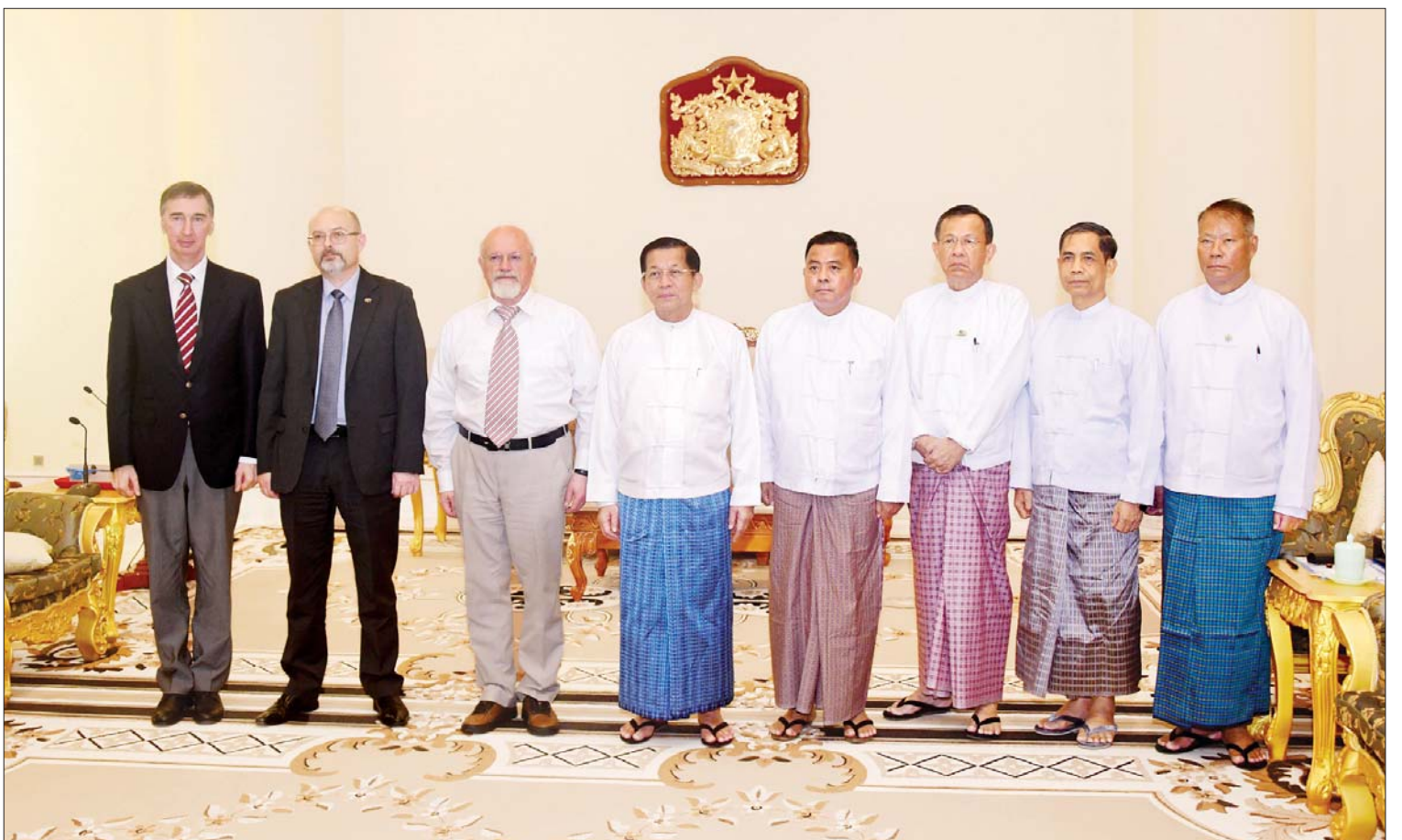
နိုင်ငံတော်စီမံအုပ်ချုပ်ရေးကောင်စီဥက္ကဋ္ဌ နိုင်ငံတော်ဝန်ကြီးချုပ် ဗိုလ်ချုပ်မှူးကြီး မင်းအောင်လှိုင်နှင့် ရုရှား-မြန်မာ ချစ်ကြည်ရေးနှင့် ပူးပေါင်းဆောင်ရွက်ရေးအသင်း ဒုတိယဥက္ကဋ္ဌ Mr. Anatoly Bulochnikov တို့ အဖွဲ့ဝင်များနှင့်အတူ စုပေါင်းမှတ်တမ်းတင်ဓာတ်ပုံရိုက်စဉ်။

အဆိုပါတွေ့ဆုံပွဲသို့ နိုင်ငံတော်စီမံအုပ်ချုပ်ရေးကောင်စီဥက္ကဋ္ဌ နိုင်ငံတော်ဝန်ကြီးချုပ်နှင့်အတူ ကောင်စီတွဲဖက်အတွင်းရေးမှူး ဒုတိယဗိုလ်ချုပ်ကြီး ရဲဝင်းဦး၊ ပြည်ထောင်စုဝန်ကြီးများ ဖြစ်ကြသည့် ဒေါက်တာကဇော်၊ ဦးကိုကိုလှိုင်၊ ဦးအောင်သော်နှင့် တာဝန်ရှိသူများ တက်ရောက်ကြပြီး ရုရှား-မြန်မာချစ်ကြည်ရေးနှင့် ပူးပေါင်းဆောင်ရွက်ရေးအသင်း ဒုတိယဥက္ကဋ္ဌနှင့်အတူ ကိုယ်စားလှယ်အဖွဲ့မှ တာဝန်ရှိသူများ တက်ရောက်ခဲ့ကြကြောင်း သိရသည်။ သတင်းစဉ်