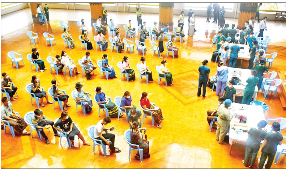
သော ကိုဗစ်-၁၉ ရောဂါ ကာကွယ်ဆေးကို အကြိမ်ပြည့်ထိုးနှံခြင်းနှင့် ကာကွယ်ဆေးထိုးနှံပြီး ခြောက်လပြည့်ပြီးပါက ထပ်ဆောင်းကာကွယ်ဆေးများ ထိုးနှံခြင်းတို့ကို နီးစပ်ရာ ကျန်းမာရေးဌာနများ၊ ကျေးရွာ/ရပ်ကွက်အုပ်ချုပ်ရေးမှူးရုံးများနှင့် ဆက်သွယ်၍ မပျက်မကွက် ဆေးထိုးနှံမှုခံယူကြရန် လိုအပ်ကြောင်း သိရသည်။ မြို့နယ်(ပြန်/ဆက်)

ကျန်းမာရေးဝန်ကြီးဌာနသည် ကိုဗစ်-၁၉ သံသယလူနာများ၊ ဓာတ်ခွဲအတည်ပြုလူနာနှင့် အနီးကပ်ထိတွေ့ခဲ့သူများနှင့် အသွားအလာကန့်သတ်ထားရှိသူများအား ကိုဗစ်-၁၉ ရောဂါ ရှိ မရှိ ဓာတ်ခွဲစစ်ဆေးခြင်း ပုံမှန်ဆောင်ရွက်လျက်ရှိပြီး ဓာတ်ခွဲအတည်ပြုလူနာများအား နေအိမ်တွင် သီးခြားထားရှိခြင်းနှင့် ဆေးရုံများတွင် သီးခြားထားရှိကုသမှုပေးခြင်းများ ဆောင်ရွက်ပေးလျက်ရှိသည်။ မပျက်မကွက်ထိုးနှံ ပြည်သူ့လူထုအနေဖြင့် ကိုဗစ်-၁၉ ရောဂါနှင့်အတူယှဉ်တွဲပြီး နေထိုင်ရာတွင် နေထိုင်မှုပုံစံသစ် နည်းလမ်းအား လိုက်နာ၍ နေထိုင်ရမည်ဖြစ်သဖြင့် အသက် (၅) နှစ်နှင့်အထက် ပြည်သူများအားလုံးသည် ကျန်းမာရေးဝန်ကြီးဌာနမှ အခမဲ့ထိုးနှံပေးလျက်ရှိ