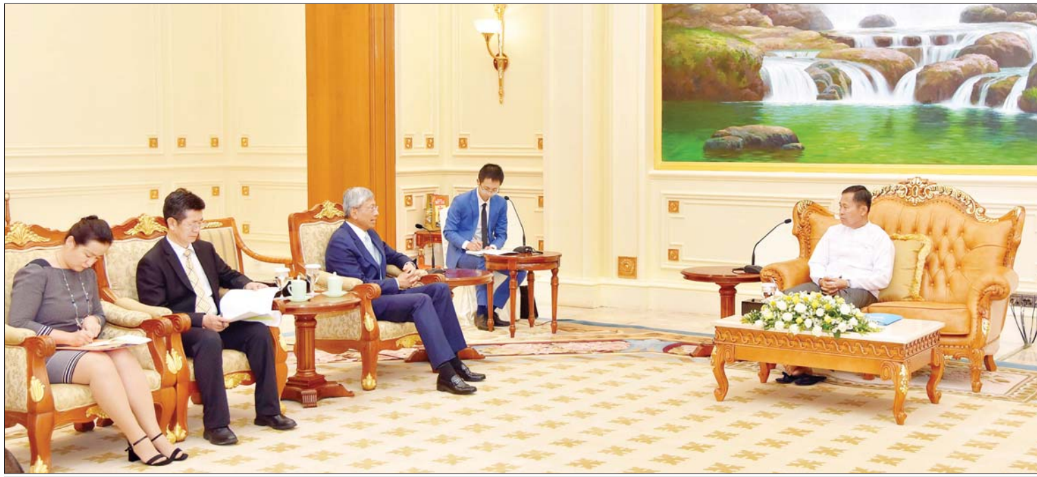
နိုင်ငံတော်စီမံအုပ်ချုပ်ရေးကောင်စီ ဒုတိယဥက္ကဋ္ဌ ဒုတိယဝန်ကြီးချုပ် ဒုတိယဗိုလ်ချုပ်မှူးကြီး စိုးဝင်း ပြည်ထောင်စုသမ္မတမြန်မာနိုင်ငံဆိုင်ရာ တရုတ်ပြည်သူ့သမ္မတနိုင်ငံ သံအမတ်ကြီး H.E. Mr. Chen Hai အား လက်ခံတွေ့ဆုံသည်။

ရင်းနှီးပွင့်လင်းစွာ ဆွေးနွေး ထိုသို့တွေ့ဆုံစဉ် ကျောက်ဖြူအထူး စီးပွားရေးဇုန်ဆိုင်ရာကိစ္စများ၊ နယ်စပ် ဒေသ သတင်းအချက်အလက်များ အပြန်အလှန်ဖလှယ်၍ နှစ်နိုင်ငံနယ်စပ် ဒေသများတွင် တည်ငြိမ်အေးချမ်းရေး၊ မူးယစ်ဆေးဝါး၊ တရားမဝင်လောင်းကစား မှု၊ အွန်လိုင်းဂိမ်းနှင့် လူကုန်ကူးမှုများ တိုက်ဖျက်ရေးတို့ကို တိုးမြှင့်ဆောင်ရွက် သွားမည့် စာမျက်နှာ ၃ ကော်လံ ၁ သို့ ❖