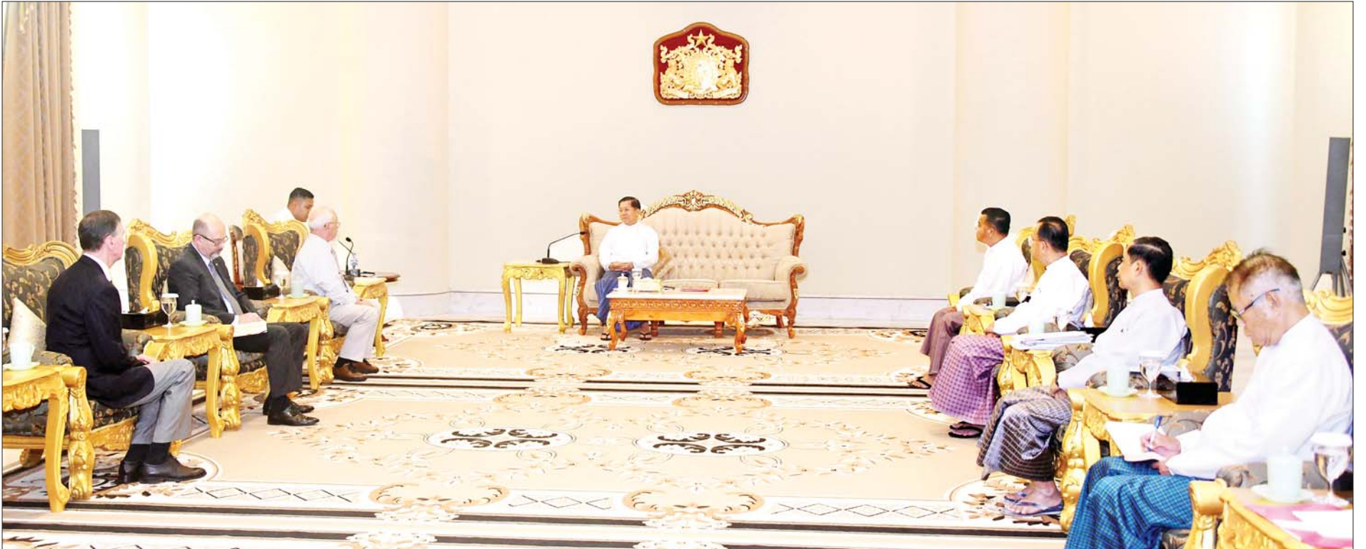
နိုင်ငံတော်စီမံအုပ်ချုပ်ရေးကောင်စီဥက္ကဋ္ဌ နိုင်ငံတော်ဝန်ကြီးချုပ် ဗိုလ်ချုပ်မှူးကြီး မင်းအောင်လှိုင် ရုရှား-မြန်မာ ချစ်ကြည်ရေးနှင့် ပူးပေါင်းဆောင်ရွက်ရေးအသင်း ဒုတိယဥက္ကဋ္ဌ Mr. Anatoly Bulochnikov ဦးဆောင်သောကိုယ်စားလှယ်အဖွဲ့အား လက်ခံတွေ့ဆုံစဉ်။