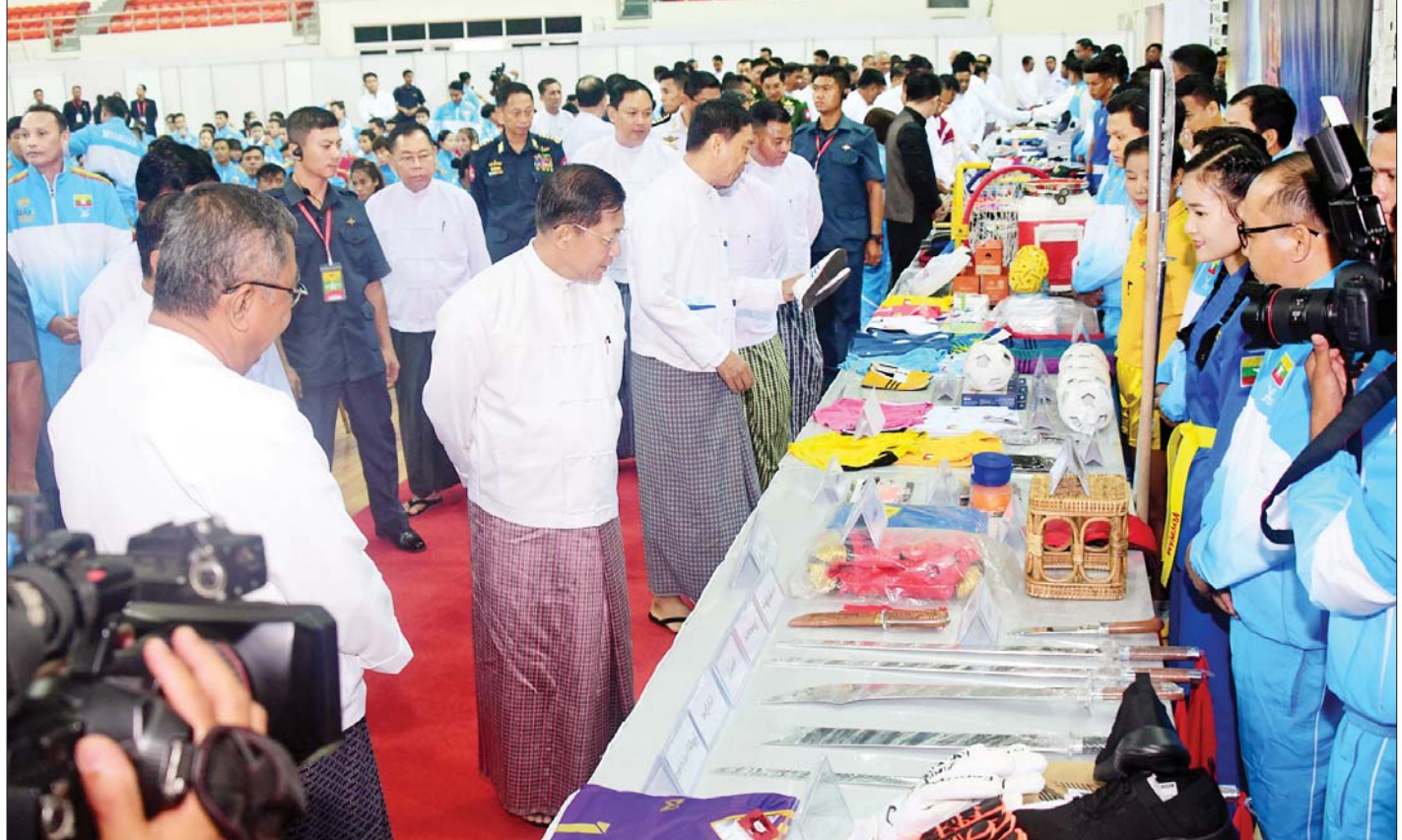
နိုင်ငံတော်စီမံအုပ်ချုပ်ရေးကောင်စီဥက္ကဋ္ဌ နိုင်ငံတော်ဝန်ကြီးချုပ် ဗိုလ်ချုပ်မှူးကြီးမင်းအောင်လှိုင် အားကစားနည်းများအလိုက် အားကစားပြိုင်ပွဲများတွင် အသုံးပြုမည့် ပြိုင်ပွဲဝင်ပစ္စည်းများ ခင်းကျင်းပြသထားရှိမှုကို ကြည့်ရှုစဉ်။

(၃၂)ကြိမ်မြောက် အရှေ့တောင်အာရှ အားကစား ပြိုင်ပွဲကြီးကို ယခုကဲ့သို့ သွားရောက်ယှဉ်ပြိုင်နိုင်ရေး အတွက် အဘက်ဘက်က ကူညီအားပေးခဲ့ကြသည့် မြန်မာနိုင်ငံအားကစားအဖွဲ့ချုပ်များ အပါအဝင် အားလုံးကို နိုင်ငံတော်ကိုယ်စား ကျေးဇူးတင်ရှိ ပါကြောင်း၊ စာမျက်နှာ ၇ သို့ ★