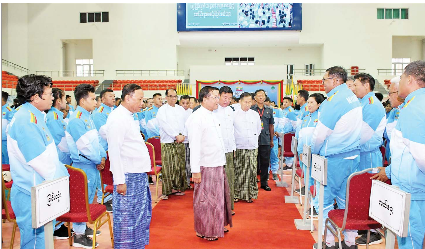
နိုင်ငံတော်စီမံအုပ်ချုပ်ရေးကောင်စီဥက္ကဋ္ဌ နိုင်ငံတော်ဝန်ကြီးချုပ် ဗိုလ်ချုပ်မှူးကြီးမင်းအောင်လှိုင် (၃၂)ကြိမ်မြောက် အရှေ့တောင်အာရှ အားကစားပြိုင်ပွဲသို့ ဝင်ရောက်ယှဉ်ပြိုင်ကြမည့် ပြိုင်ပွဲဝင် လက်ရွေးစင်အားကစားသမားများ၊ အုပ်ချုပ်သူများနှင့် နည်းပြများကို ရင်းရင်းနှီးနှီး နှုတ်ဆက်အားပေးစဉ်။

ထို့ပြင် နိုင်ငံတော်အနေဖြင့် ခေတ်အဆက်ဆက် အာရှအားကစားပြိုင်ပွဲနှင့် အရှေ့တောင်အာရှ အားကစားပြိုင်ပွဲများတွင် အောင်မြင်မှုနှင့် ဂုဏ်ပြုဆု တံဆိပ်များ ရယူပေးခဲ့ကြသည့် နိုင်ငံ့ဂုဏ်ဆောင် အားကစားသမားကြီးများကိုလည်း အသက်(၆၀) ပြည့်မြောက်သည့်အချိန်ကစပြီး သက်ရှိထင်ရှား ရှိနေသမျှ ကာလပတ်လုံး လစဉ်ထောက်ပံ့ငွေများ ချီးမြှင့်ပေးအပ်လျက်ရှိရာ ယနေ့အထိ အားကစား