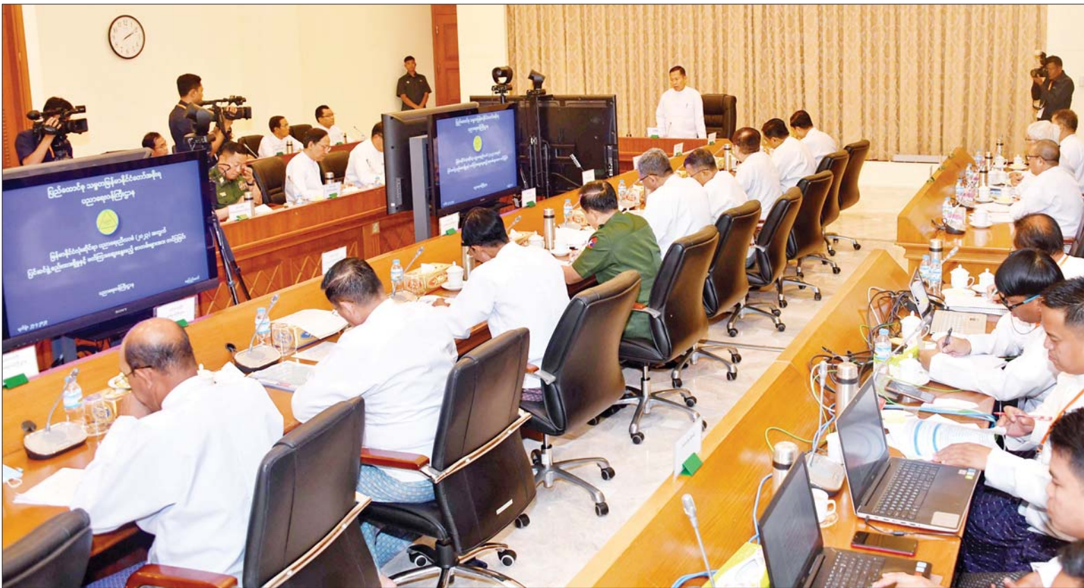
နိုင်ငံတော်စီမံအုပ်ချုပ်ရေးကောင်စီ ဒုတိယဥက္ကဋ္ဌ ဒုတိယဝန်ကြီးချုပ် ဒုတိယဗိုလ်ချုပ်မှူးကြီးစိုးဝင်း မြန်မာနိုင်ငံလုံးဆိုင်ရာပညာရေးညီလာခံ(၂၀၂၃) ကျင်းပရေး ဦးစီးကော်မတီနှင့် လုပ်ငန်းကော်မတီ ညှိနှိုင်းအစည်းအဝေးတွင် အမှာစကားပြောကြားစဉ်။

နေပြည်တော် ဧပြီ ၂၅ မြန်မာနိုင်ငံလုံးဆိုင်ရာ ပညာရေးညီလာခံ(၂၀၂၃) ကျင်းပရေး ဦးစီးကော်မတီနှင့် လုပ်ငန်းကော်မတီ ညှိနှိုင်းအစည်းအဝေးကို ယနေ့မနက် ၉ နာရီတွင် နေပြည်တော်ရှိ နိုင်ငံတော်စီမံအုပ်ချုပ်ရေးကောင်စီ ဥက္ကဋ္ဌရုံး အစည်းအဝေးခန်းမ၌ ကျင်းပရာ မြန်မာနိုင်ငံလုံးဆိုင်ရာ ပညာရေးညီလာခံ(၂၀၂၃) ကျင်းပရေး ဦးစီးကော်မတီဥက္ကဋ္ဌ နိုင်ငံတော်စီမံအုပ်ချုပ်ရေးကောင်စီ ဒုတိယဥက္ကဋ္ဌ ဒုတိယဝန်ကြီးချုပ် ဒုတိယဗိုလ်ချုပ်မှူးကြီးစိုးဝင်း တက်ရောက်အမှာစကား ပြောကြားသည်။