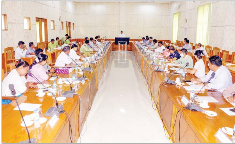
နေပြည်တော်ကောင်စီဥက္ကဋ္ဌ ဦးတင်ဦးလွင် သဘာဝဘေးအန္တရာယ်များနှင့်ပတ်သက်၍ ပြန်လည်ထူထောင် ရေးလုပ်ငန်းများ ထိရောက်စွာ ဆောင်ရွက်နိုင်ရေး လုပ်ငန်းညှိနှိုင်းအစည်းအဝေးတွင် အမှာစကားပြောကြားစဉ်။

သဘာဝဘေးအန္တရာယ်များနှင့်ပတ်သက်၍ ပြန်လည်ထူထောင်ရေးလုပ်ငန်းများ ထိရောက်စွာ ဆောင်ရွက်နိုင်ရေး လုပ်ငန်းညှိနှိုင်းအစည်းအဝေး တက်ရောက်