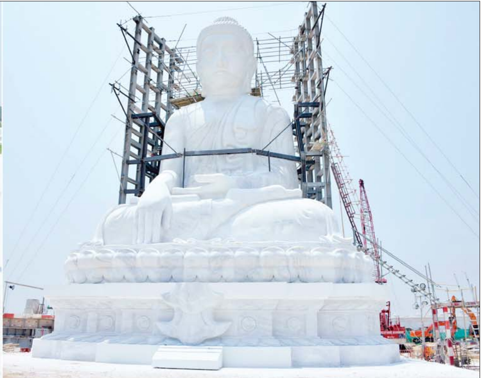
နိုင်ငံတော်စီမံအုပ်ချုပ်ရေးကောင်စီဥက္ကဋ္ဌ နိုင်ငံတော်ဝန်ကြီးချုပ် ဗိုလ်ချုပ်မှူးကြီးမင်းအောင်လှိုင် မာရဝိဇယ ဗုဒ္ဓရုပ်ပွားတော်မြတ်ကြီး တည်ဆောက်နေမှုအခြေအနေများကို ကြည့်ရှုစစ်ဆေးစဉ်။