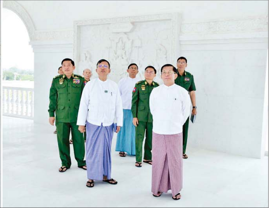
နိုင်ငံတော်စီမံအုပ်ချုပ်ရေးကောင်စီဥက္ကဋ္ဌ နိုင်ငံတော်ဝန်ကြီးချုပ် ဗိုလ်ချုပ်မှူးကြီး မင်းအောင်လှိုင် မာရဝိဇယ ဗုဒ္ဓရုပ်ပွားတော်မြတ်ကြီး တည်ဆောက်နေမှုကို ကြည့်ရှုစဉ်။

☆ စာမျက်နှာ ၃ မှ ပြည်ထောင်စု မြန်မာနိုင်ငံတော် တစ်ဝန်းလုံးမှ ခုနစ်ရက် သား သမီး၊ ဘုရားဒါယကာ ဒါယိကာမများ၊ စေတနာရှင်၊ အလှူရှင်များက ကုသိုလ်ပြု လှူဒါန်းထားသည့် အဖိုးတန် ကျောက်မျက်ရတနာ ဌာပနာတော် ကုသိုလ်ပစ္စည်းများ ဌာပနာသွင်းလှူပူဇော်ခြင်း မဟာ မင်္ဂလာ အခမ်းအနားများကို ဇန်နဝါရီ ၂၇ ရက်နှင့် ဖေဖော်ဝါရီ ၁၀ ရက်တို့တွင်အောင်မြင်စွာပြုလုပ် ပြီးစီးခဲ့ပြီး ပြည်ထောင်စုသမ္မတ မြန်မာနိုင်ငံတော် တစ်ဝန်းလုံးမှ ဌာပနာတော် ကုသိုလ်ရှင်များ၊ ပြည်သူပြည်သားများ အားလုံး ဝမ်းမြောက်နေမော် သာဓုခေါ်ဆိုခဲ့ ကြကြောင်း၊ ဖေဖော်ဝါရီ ၁၁ ရက် တွင် ဆင်းတုတော်အပိုင်း(၄)ကို ရတနာ ပလ္လင်တော်ထက်သို့ ပင့်ဆောင်ပူဇော်ခြင်း မဟာ မင်္ဂလာအခမ်းအနားကို ကျင်းပ ပြုလုပ်ခဲ့ခြင်းဖြစ်ကြောင်းနှင့် ယခု အခါ မာရဝိဇယဗုဒ္ဓရုပ်ပွားတော် မြတ်ကြီး ထုဆစ်မှုမှာ ၉၅ ရာခိုင်နှုန်း ပြီးစီးပြီဖြစ်ကြောင်း။