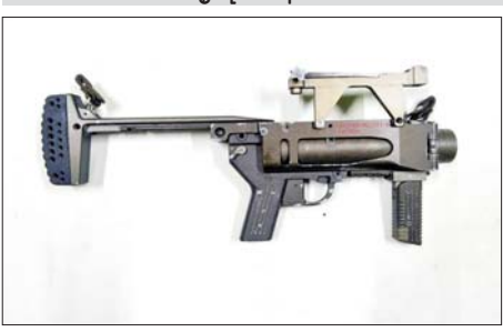
KIA ထုတ် KA-026 ၄၀ မမဗုံးပစ်လောင်ချာ