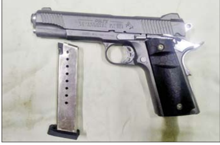
တူကီယိုနိုင်ငံထုတ် COLTS အမျိုးအစား ပွိုင် ၃၈၀ ပစ္စုတိုသေနတ်