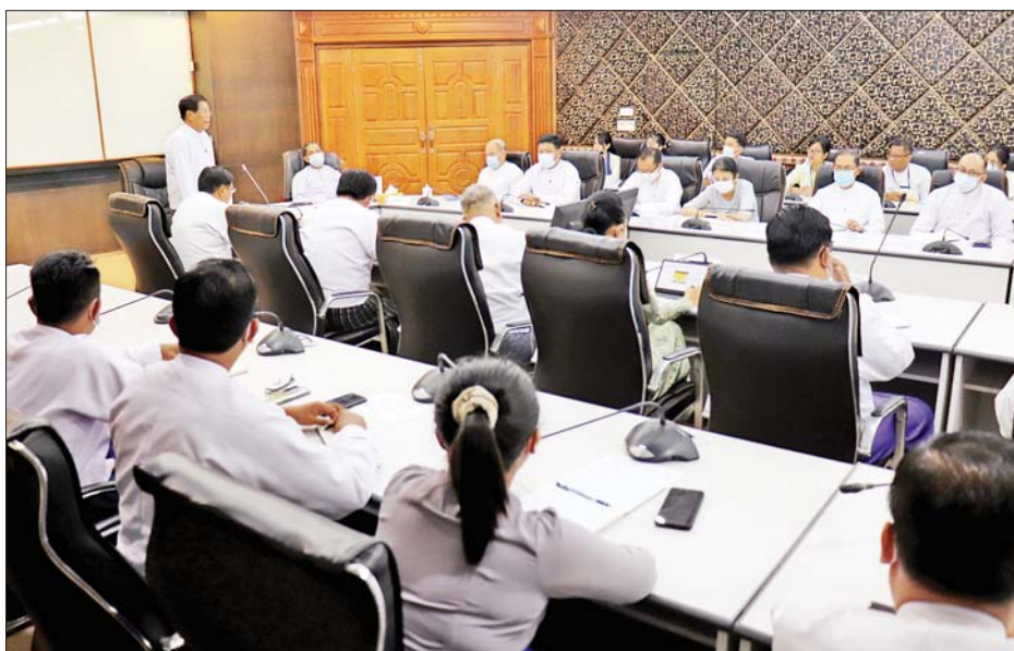
ပြည်ထောင်စုဝန်ကြီး ဦးသန်းဆွေ မြန်မာသံရုံး၊ မြန်မာအမြဲတမ်းကိုယ်စားလှယ်အဖွဲ့ရုံးနှင့် မြန်မာ ကောင်စစ်ဝန်ချုပ်ရုံးများသို့ သွားရောက်တာဝန်ထမ်းဆောင်ကြမည့် အရာထမ်း၊ အမှုထမ်းများကို တွေ့ဆုံ အမှာစကားပြောကြားစဉ်။

ထို့နောက် ပြည်ထောင်စုဝန်ကြီး ဦးသန်းဆွေက ပြည်ပတာဝန်ထမ်းဆောင်ရန် ဝန်ထမ်းများအား အလှည့်ကျစေလွှတ်တာဝန်ပေးအပ်ခြင်း မဟုတ်ဘဲ သင့်လျော်သူများကို ဝန်ကြီးဌာန၊ ဦးစီးဌာနအကြီး အကဲများက စိစစ်ရွေးချယ်စေလွှတ်၍ တာဝန်ပေး အပ်ခြင်းဖြစ်ကြောင်း၊ ပြည်ပတာဝန်ထမ်းဆောင်ရာ တွင် နိုင်ငံတော်၏ အမျိုးသားအကျိုးစီးပွား (National Interest) ကို ကာကွယ်စောင့်ရှောက်ရန်၊ Diplomacy is the First Line of Defence ဆိုသည့်