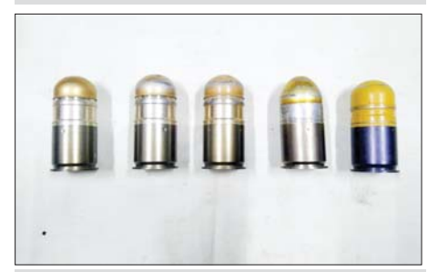
KIA ထုတ် ၄၀ မမဗုံးသီး