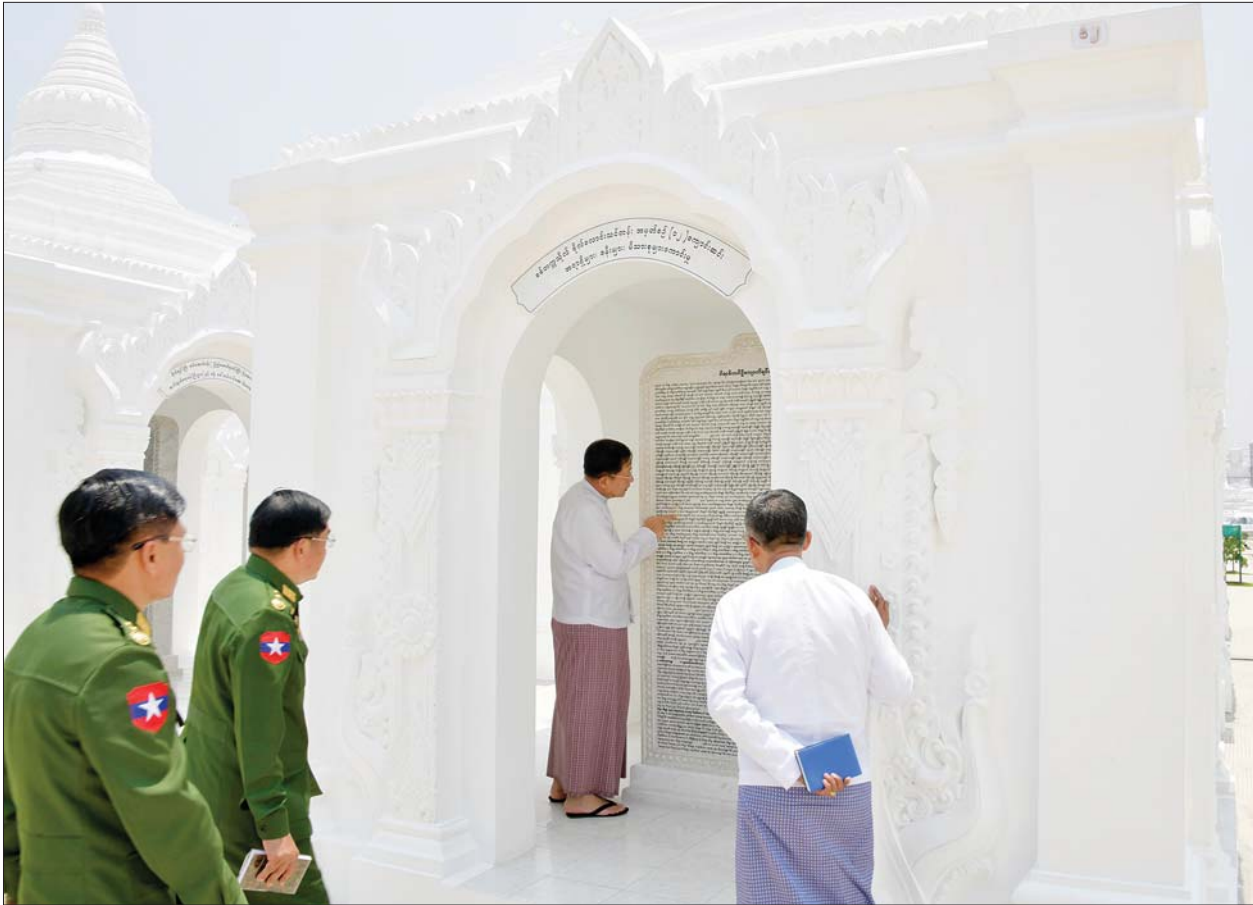
နိုင်ငံတော်စီမံအုပ်ချုပ်ရေးကောင်စီဥက္ကဋ္ဌ နိုင်ငံတော်ဝန်ကြီးချုပ် ဗိုလ်ချုပ်မှူးကြီး မင်းအောင်လှိုင် မာရဝိဇယဗုဒ္ဓရုပ်ပွားတော်အတွင်းရှိ ကျောက်စာရုံစေတီတော်များ တည်ထားဆောင်ရွက်မှုအား ကြည့်ရှုစဉ်။

☆ စာမျက်နှာ ၃ မှ ပြည်ထောင်စု မြန်မာနိုင်ငံတော် တစ်ဝန်းလုံးမှ ခုနစ်ရက် သား သမီး၊ ဘုရားဒါယကာ ဒါယိကာမများ၊ စေတနာရှင်၊ အလှူရှင်များက ကုသိုလ်ပြု လှူဒါန်းထားသည့် အဖိုးတန် ကျောက်မျက်ရတနာ ဌာပနာတော် ကုသိုလ်ပစ္စည်းများ ဌာပနာသွင်းလှူပူဇော်ခြင်း မဟာ မင်္ဂလာ အခမ်းအနားများကို ဇန်နဝါရီ ၂၇ ရက်နှင့် ဖေဖော်ဝါရီ ၁၀ ရက်တို့တွင်အောင်မြင်စွာပြုလုပ် ပြီးစီးခဲ့ပြီး ပြည်ထောင်စုသမ္မတ မြန်မာနိုင်ငံတော် တစ်ဝန်းလုံးမှ ဌာပနာတော် ကုသိုလ်ရှင်များ၊ ပြည်သူပြည်သားများ အားလုံး ဝမ်းမြောက်နေမော် သာဓုခေါ်ဆိုခဲ့ ကြကြောင်း၊ ဖေဖော်ဝါရီ ၁၁ ရက် တွင် ဆင်းတုတော်အပိုင်း(၄)ကို ရတနာ ပလ္လင်တော်ထက်သို့ ပင့်ဆောင်ပူဇော်ခြင်း မဟာ မင်္ဂလာအခမ်းအနားကို ကျင်းပ ပြုလုပ်ခဲ့ခြင်းဖြစ်ကြောင်းနှင့် ယခု အခါ မာရဝိဇယဗုဒ္ဓရုပ်ပွားတော် မြတ်ကြီး ထုဆစ်မှုမှာ ၉၅ ရာခိုင်နှုန်း ပြီးစီးပြီဖြစ်ကြောင်း။