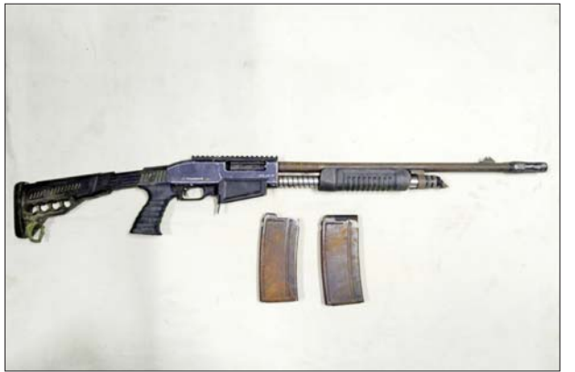
တူကီယိုနိုင်ငံထုတ် ၁၂ ဗို့သေနတ် တစ်လက်၊ ကျည်အိမ် နှစ်ခု

သည် ခရမ်းမြို့နယ် ပိန်းကန်ကျေးရွာရှိ ရဲကင်းစခန်း အား ၄၀ မမ လက်လုပ်ပုံးပစ်လောင်ချာဖြင့် ပစ်ခတ် ခဲ့ကြောင်း။