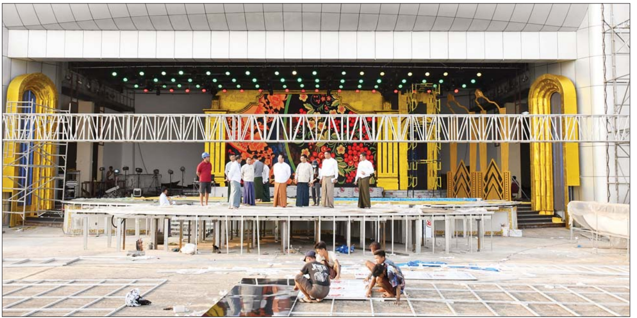
ပြည်ထောင်စုဝန်ကြီး ဦးမောင်မောင်အုန်းနှင့် တာဝန်ရှိသူများ မြန်မာ့ရုပ်ရှင်ထူးချွန်ဆုချီးမြှင့်ပွဲအခမ်းအနား ကျင်းပမည့်လဟာပြင်ကဇာတ်ရုံ၌ ပြင်ဆင်ဆောင်ရွက်ပြီးစီးမှုအခြေအနေများကို ကြည့်ရှုစစ်ဆေးစဉ်။

ထို့နောက် ပြည်ထောင်စုဝန်ကြီးနှင့်အဖွဲ့သည် မြန်မာ့ရုပ်ရှင်ထူးချွန်ဆုချီးမြှင့်ပွဲအခမ်းအနားကျင်းပမည့် အကယ်ဒမီဆုပေးပွဲစင်မြင့် တည်ဆောက်နေမှု၊ ဖွင့်ပွဲတွင် နည်းပညာမြင့် 3D Projection Mapping စနစ်ဖြင့် ဖွင့်လှစ်ရန် ဆောင်ရွက်ထားမှု၊ LED ဘုတ်များ တပ်ဆင်နေမှု၊ ဖျော်ဖြေရေးစင်မြင့်များ တည်ဆောက်နေမှု၊ မီးအလှဆင်ခြင်း၊ ဂုဏ်ပြုခံလျှောက်လမ်း (Red Carpet) နေရာ၊ အခမ်းအနားသို့ တက်ရောက်ကြမည့် သူများအတွက် နေရာထိုင်ခင်းနှင့် လေအေးပေးစက်များ စီစဉ်ဆောင်ရွက်မည့်အခြေအနေ၊ မီဒီယာဇန်သတ်မှတ်ထားမှု၊ မီးရှူးမီးပန်းများ ပစ်ဖောက်မည့်အခြေအနေနှင့် မုခ်ဦးများ တည်ဆောက်နေမှုတို့ကို