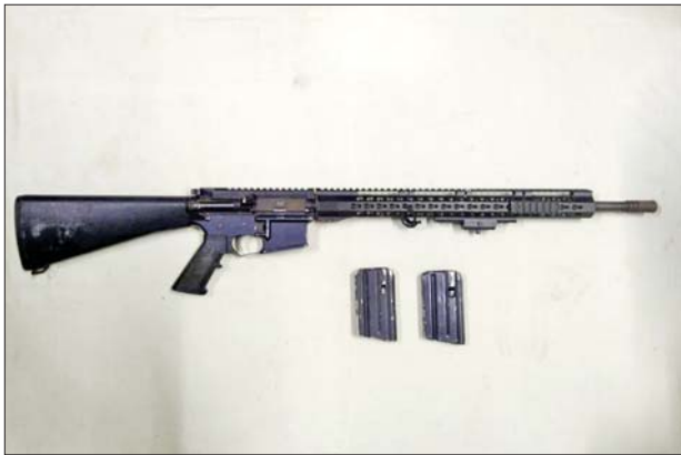
အမေရိကန်နိုင်ငံထုတ် M4A1 တစ်လက်၊ ကျည်အိမ် နှစ်ခု