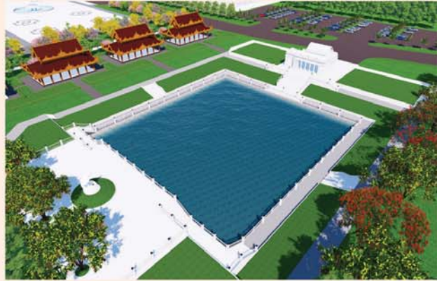
ကျောက်စာရုံစေတီ(၁၂ x ၁၂ x ၁၈)ပေ ၁ ဆူ တန်ဖိုး-၂၇၉ သိန်း