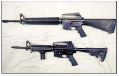
အမေရိကန်နိုင်ငံထုတ် အမ်-၄ ကာဘိုင်သေနတ်