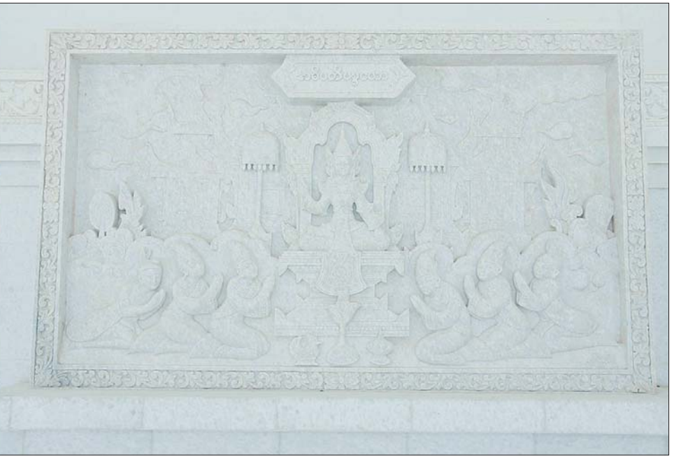
နိုင်ငံတော်စီမံအုပ်ချုပ်ရေးကောင်စီဥက္ကဋ္ဌ နိုင်ငံတော်ဝန်ကြီးချုပ် ဗိုလ်ချုပ်မှူးကြီးမင်းအောင်လှိုင် မာရဝိဇယ ဗုဒ္ဓဥယျာဉ်တော်အတွင်း စကျင်ကျောက်ပန်းပု ထုဆစ်ပုံဖော်ထား မှုကို ကြည့်ရှုစဉ်။

ရည်ရွယ်ချက် ၄ ရပ် အဆိုပါ “မာရဝိဇယ” ဗုဒ္ဓ ရုပ်ပွားတော်မြတ်ကြီးကို မြန်မာ နိုင်ငံတွင် ထေရဝါဒဗုဒ္ဓ သာသနာ တော်ကြီး ခိုင်မာစွာ ထွန်းလင်း တောက်ပလျက်ရှိမှုအား ကမ္ဘာကို ပြသရန်၊ မြန်မာနိုင်ငံသည်