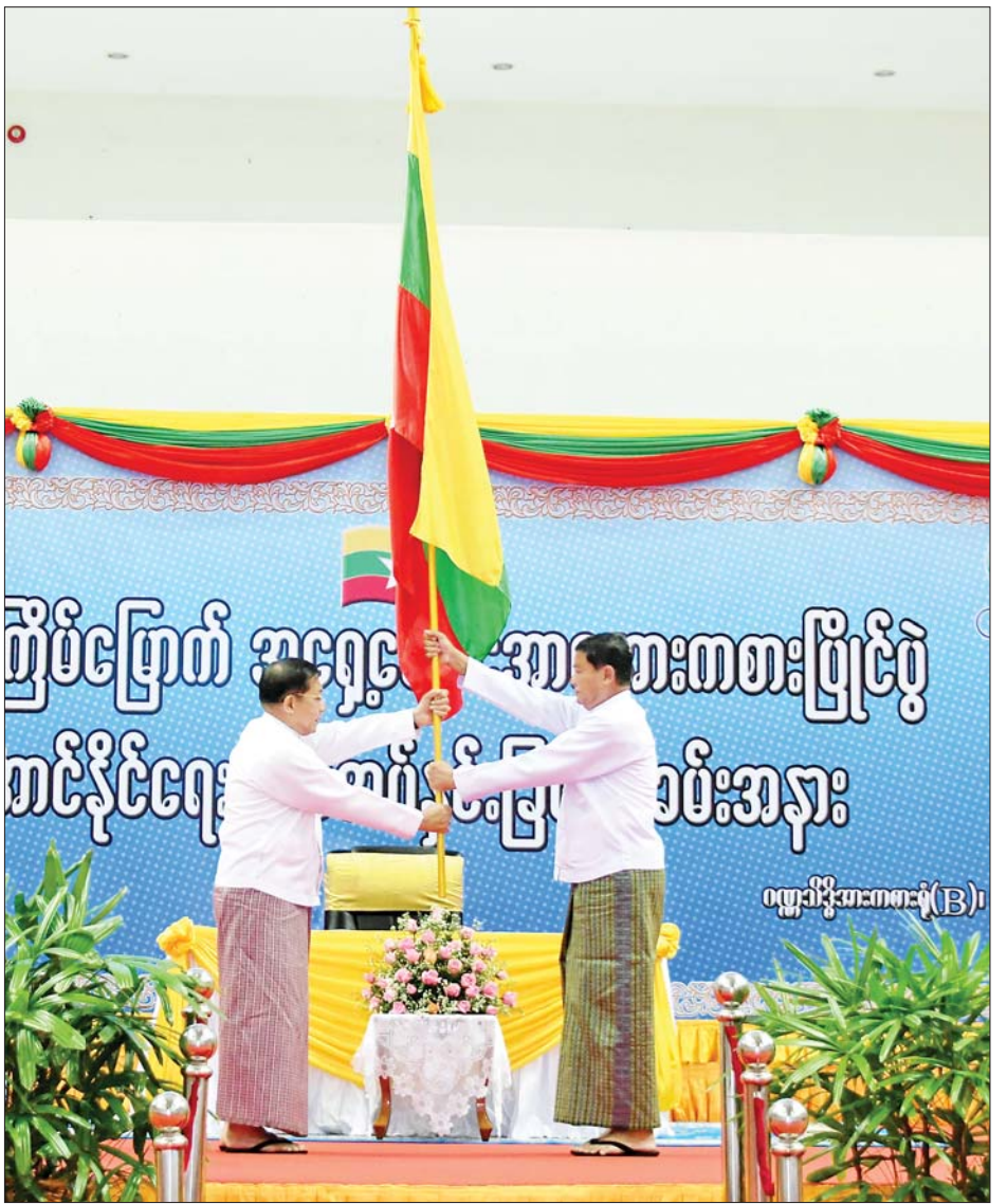
နိုင်ငံတော်စီမံအုပ်ချုပ်ရေးကောင်စီဥက္ကဋ္ဌ နိုင်ငံတော်ဝန်ကြီးချုပ် ဗိုလ်ချုပ်မှူးကြီးမင်းအောင်လှိုင် ပြည်ထောင်စုဝန်ကြီး ဦးမင်းသိန်းဇံထံ အောင်နိုင်ရေးအလံ အပ်နှင်းစဉ်။

အားကစားပြိုင်ပွဲများသည် တရားမျှတမှုရှိသည့် စွမ်းရည်ယှဉ်ပြိုင်မှုမျိုးဖြစ်ကြောင်း၊ အားကစားအောင်မြင်မှုဖြင့် နိုင်ငံတော်၏ဂုဏ်သိက္ခာကို မြှင့်တင်နိုင်ရေးအတွက် ယခုကဲ့သို့ နိုင်ငံတကာအားကစားပြိုင်ပွဲတစ်ရပ်ကို နိုင်ငံ့ကိုယ်စားပြု သွားရောက်ယှဉ်ပြိုင်ရခြင်းသည် ထူးခြားသည့်ဂုဏ်ဒြပ်နှင့် အခွင့်အလမ်းဖြစ်သည်ကို အုပ်ချုပ်သူ၊ နည်းပြနှင့် အားကစားသမားများအားလုံး သတိချပ်ကြစေလိုပါကြောင်း၊ ထို့ပြင် အမိမြန်မာနိုင်ငံတော်နှင့် မြန်မာလူမျိုး၏ ဂုဏ်သိက္ခာနှင့် ပတ်သက်ဆက်နွှယ်နေသည့်အတွက် ပြိုင်ပွဲတိုင်း အနိုင်ရရှိရေးသည် အမျိုးသားရေးတာဝန်