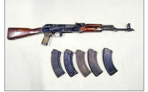
KIA ထုတ် အမ်-၂၂ သေနတ်