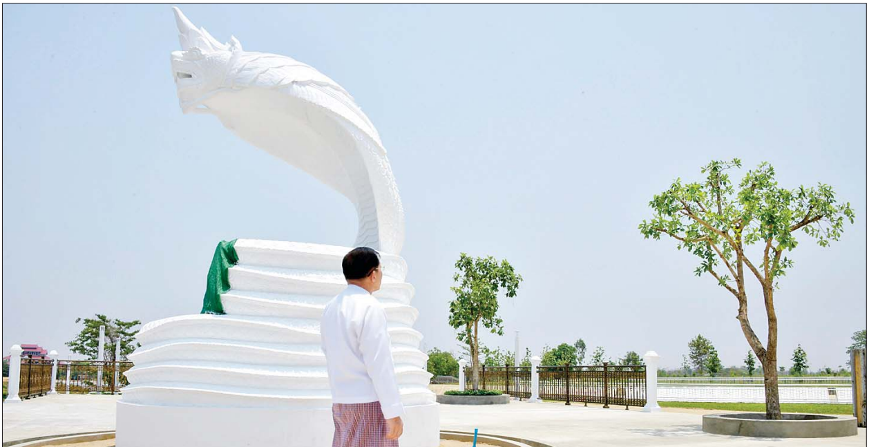
နိုင်ငံတော်စီမံအုပ်ချုပ်ရေးကောင်စီဥက္ကဋ္ဌ နိုင်ငံတော်ဝန်ကြီးချုပ် ဗိုလ်ချုပ်မှူးကြီးမင်းအောင်လှိုင် မာရဝိဇယ ဗုဒ္ဓဥယျာဉ်တော်အတွင်း တည်ဆောက်နေမှုလုပ်ငန်းများ ကြည့်ရှုစဉ်။

ပင့်ဆောင်ခဲ့ကာ ဇန်နဝါရီ ၃၁ ရက်တွင် ပလ္လင်တော်ထက်သို့ အောင်မြင်စွာ ပင့်ဆောင်ပူဇော် နိုင်ခဲ့ကြောင်း၊ ဗုဒ္ဓရုပ်ပွားတော် မြတ်ကြီး၏ ရတနာပလ္လင်တော် ထက် အလယ်ဗဟိုဌာနများတွင် လည်း ဦးဆောင်ဘုရားဒါယကာ နိုင်ငံတော် စီမံအုပ်ချုပ်ရေး ကောင်စီဥက္ကဋ္ဌ နိုင်ငံတော် ဝန်ကြီးချုပ် အမှူးပြုသည့် ပလ္လင်တော်ထက်သို့ စတင် စာမျက်နှာ ၄ သို့ ☆