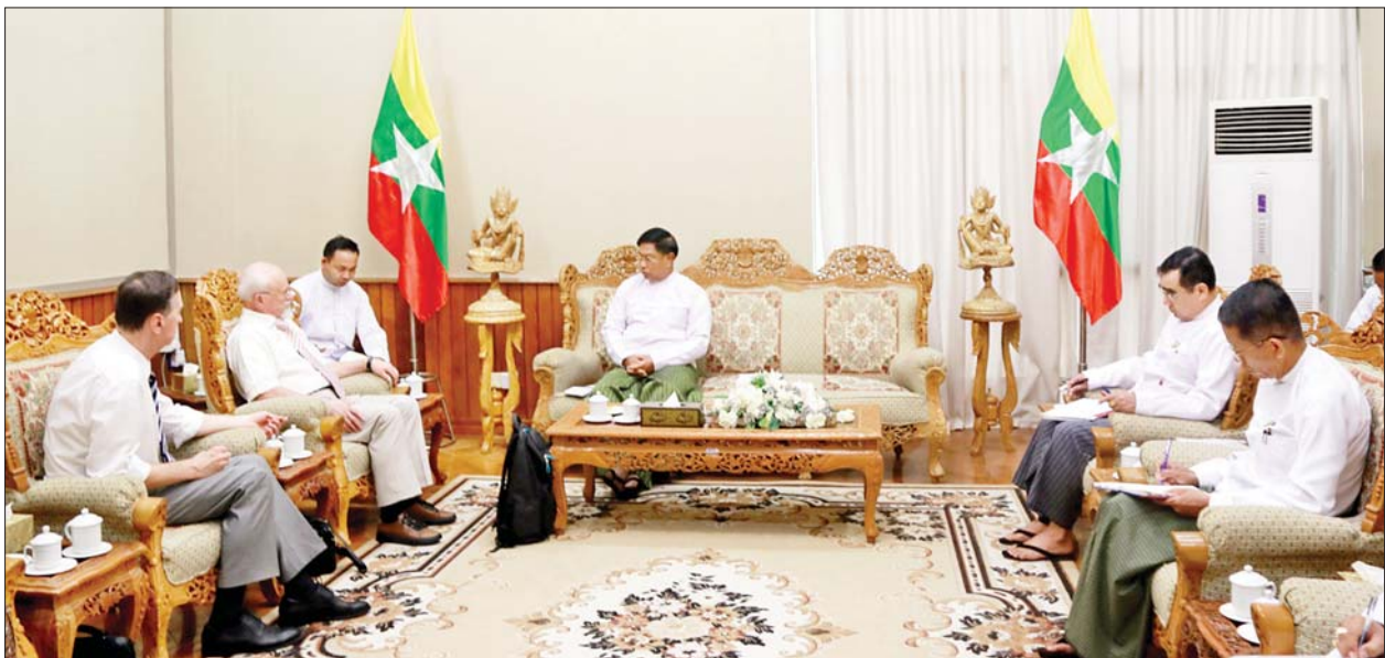
နိုင်ငံတော်စီမံအုပ်ချုပ်ရေးကောင်စီဝင် ဒုတိယဝန်ကြီးချုပ်နှင့် ပြည်ထောင်စုဝန်ကြီး ဗိုလ်ချုပ်ကြီးတင်အောင်စန်း ရုရှား-မြန်မာ ချစ်ကြည် ရေးနှင့် ပူးပေါင်းဆောင်ရွက်ရေးအသင်း ဒုတိယဥက္ကဋ္ဌ မစ္စတာအန်နာသိုလီ ဘူးလော့ချ်နီကော့ ဦးဆောင်သော ကိုယ်စားလှယ်အဖွဲ့အား လက်ခံတွေ့ဆုံသည်။