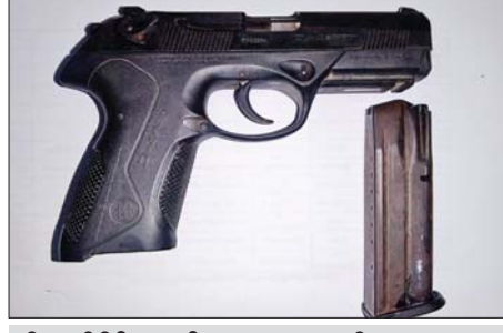
အီတလီနိုင်ငံထုတ် BERETTA အမျိုးအစား ၉ မမ ပစ္စုတိုသေနတ်