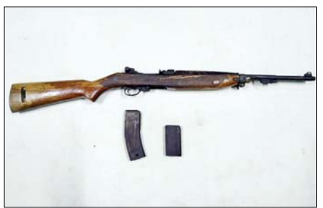
အမေရိကန်နိုင်ငံထုတ် ပွိုင် ၃၀ ကာဘိုင်သေနတ်