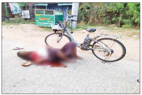
ဦးမြင့်စိုး (၅၇)နှစ် (သေဆုံး)

၂၀၂၂ ခုနှစ် မတ် ၁၀ ရက်တွင် ခရမ်းမြို့နယ် အမှတ်(၁၁)ရပ်ကွက် မြို့လှကုန်းလမ်းဆုံအနီး ရွာမလမ်း၌ ပစ်ခတ်မှုကြောင့် သေဆုံးခဲ့သည့် အပြစ်မဲ့ပြည်သူ၏ မှတ်တမ်းဓာတ်ပုံ။