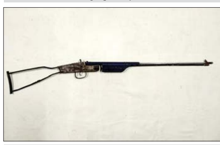
ပွိုင် ၂၂ ကျည်ထည့်ပစ်ရသော လက်လုပ်သေနတ်