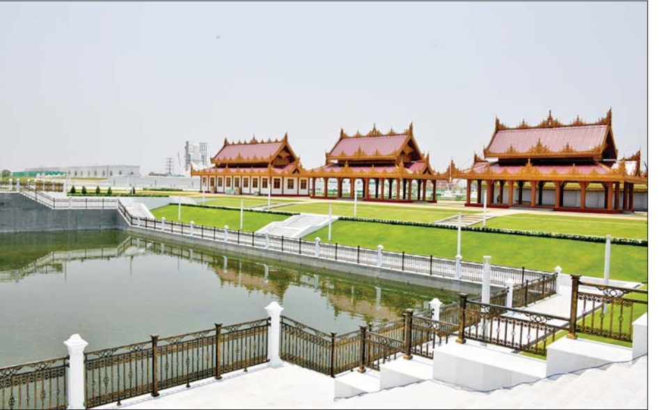
မာရဝိဇယ ဗုဒ္ဓဥယျာဉ်တော်အတွင်းရှိ ကျောက်စာရုံစေတီတော်များနှင့် သုဓမ္မာဇရပ်များကို တွေ့ရစဉ်။