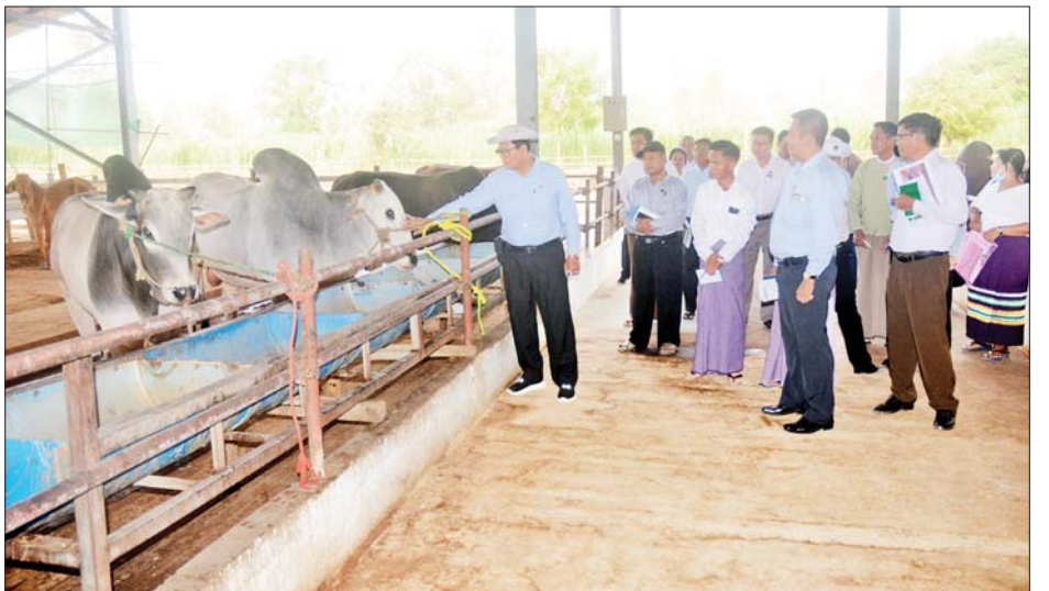
သီးနှံများ၏ အထွက်နှုန်း တိုးတက်ရန်၊ ဈေးနှုန်းနှင့် ဈေးကွက်သေချာစေရန် စနစ်တကျ ဆောင်ရွက်ပေးခြင်းဖြင့် တောင်သူများဝင်ငွေ ပိုမိုရရှိစေရေးနှင့် နိုင်ငံစီးပွား တိုးတက်မြှင့်တင်ရေးအတွက် ကြိုးပမ်းဆောင်ရွက်ရန် လိုအပ်ချက်များ၊ ကုန်ကြမ်းသီးနှံ ထုတ်လုပ်ခြင်းနှင့်အတူ တန်ဖိုးမြင့်စားသောက်ကုန် ချောများ တိုးတက်ထုတ်လုပ်နိုင်ရေးအတွက် လိုအပ်သော အသိပညာနှင့် နည်းပညာများ ပံ့ပိုးဆောင်ရွက်ပေးကြရန် လိုအပ်သည်များ ဆွေးနွေးမှာကြားခဲ့ကြောင်း သိရသည်။ သတင်းစဉ်

Brothers' Co.,Ltd. မျိုးကောင်းမျိုးသန့် ပြန်ပွားရေး နွားမွေးမြူရေးခြံ၏ နွားစာမြက် (နေဗီယာ) စိုက်ပျိုးရိတ်သိမ်းထုတ်လုပ်မှု အခြေအနေများ၊ အကျိုးတူ နွားမွေးဖက်နှင့် ခိုင်းနွား (အငှားချ) ပေးထားမှုများ၊ မွေးမြူရေးနှင့် ကုသရေးဦးစီးဌာနနှင့် ပူးပေါင်း၍ ကျေးရွာများသို့ ပညာပေးခြင်းနှင့် တိရစ္ဆာန် ကူးစက်ရောဂါကာကွယ်ရေးလုပ်ငန်းများ ဆောင်ရွက်နေမှု အခြေအနေများ၊ နို့စားနွား၊ နွားနောက်နှင့် ဒေသနွားများ မွေးမြူထားရှိမှုများကို ကြည့်ရှုစစ်ဆေးသည်။ ထို့နောက် ဒုတိယဝန်ကြီးသည် မကွေးမြို့ ဆည်မြောင်းနှင့် ရေအသုံးချမှုစီမံခန့်ခွဲရေးဦးစီးဌာန ညွှန်ကြားရေးမှူးရုံးဧည့်ခန်းမ၌ တိုင်းဒေသကြီးနှင့် ခရိုင်အဆင့် လယ်ယာကဏ္ဍဆိုင်ရာ တာဝန်ရှိသူများ အားတွေ့ဆုံ၍ နိုင်ငံတော်၏ အဓိကရိက္ခာသီးနှံ ဖြစ်သော ဆန်စပါးစိုက်ပျိုးထုတ်လုပ်မှုတိုးတက်ရန်