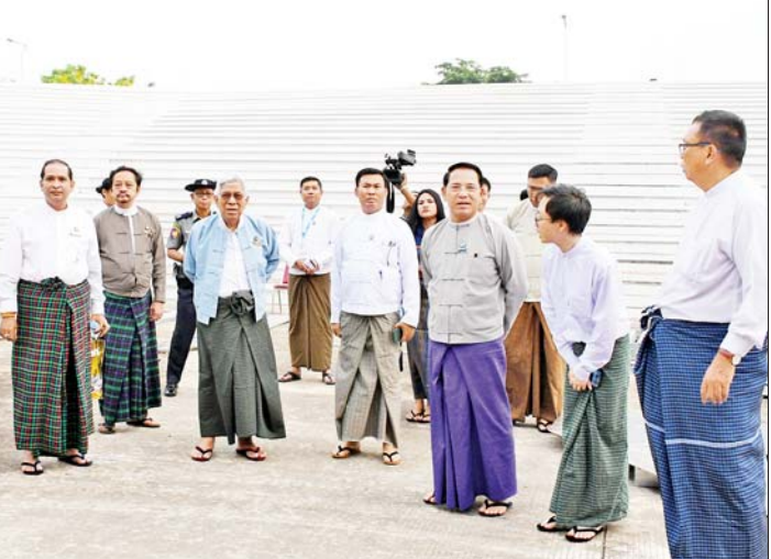
ပြည်ထောင်စုဝန်ကြီး ဦးမောင်မောင်အုန်းနှင့် တာဝန်ရှိသူများ မြန်မာ့ရုပ်ရှင်ထူးချွန်ဆု ချီးမြှင့်ပွဲအခမ်းအနား ကျင်းပမည့် နေပြည်တော် မြို့တော်ခန်းမအနီးရှိ လဟာပြင်ကဇာတိရုံတွင် ကြည့်ရှုစစ်ဆေးစဉ်။