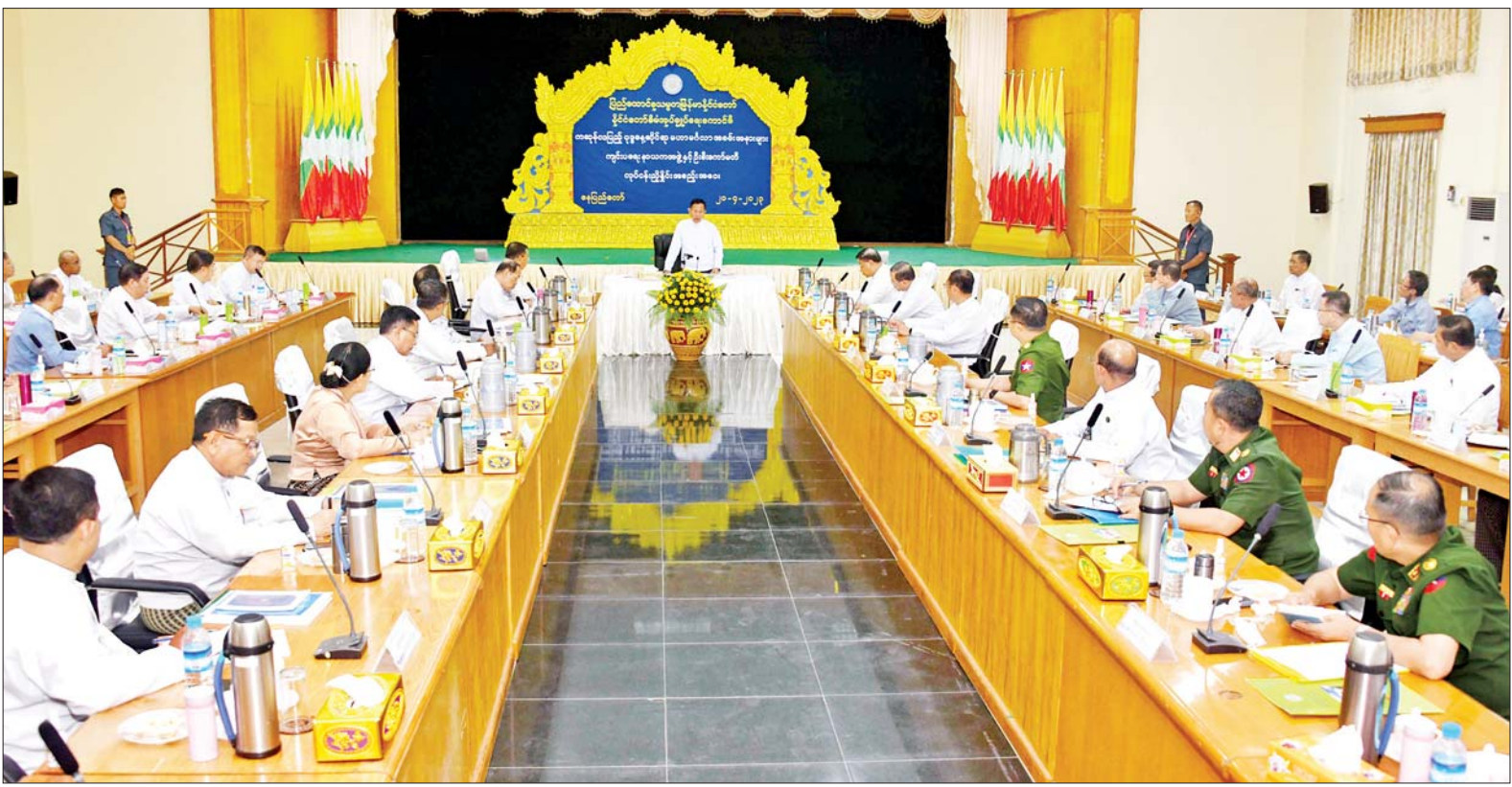
နိုင်ငံတော်စီမံအုပ်ချုပ်ရေးကောင်စီ ဒုတိယဥက္ကဋ္ဌ ဒုတိယဝန်ကြီးချုပ် ဒုတိယဗိုလ်ချုပ်မှူးကြီးစိုးဝင်း ကဆုန်လပြည့် ဗုဒ္ဓနေ့ဆိုင်ရာ မဟာမင်္ဂလာအခမ်းအနားများကျင်းပ ရေး နာယကအဖွဲ့နှင့် ဦးစီးကော်မတီ လုပ်ငန်းညှိနှိုင်းအစည်းအဝေးတွင် အမှာစကားပြောကြားစဉ်။

နေပြည်တော် ဧပြီ ၂၀ ကဆုန်လပြည့် ဗုဒ္ဓနေ့ဆိုင်ရာ မဟာမင်္ဂလာ အခမ်းအနားများ ကျင်းပရေး နာယကအဖွဲ့နှင့် ဦးစီးကော်မတီ လုပ်ငန်းညှိနှိုင်း အစည်းအဝေးကို ယနေ့မွန်းလွဲ ၂ နာရီတွင် နေပြည်တော်ရှိ သာသနာရေးနှင့် ယဉ်ကျေးမှု ဝန်ကြီးဌာန အစည်းအဝေးခန်းမ၌ ကျင်းပရာ ပြည်ထောင်စုသမ္မတ မြန်မာနိုင်ငံတော် နိုင်ငံတော် စီမံအုပ်ချုပ်ရေးကောင်စီ ကဆုန် လပြည့်ဗုဒ္ဓနေ့ဆိုင်ရာ မဟာမင်္ဂလာ အခမ်းအနားများ ကျင်းပရေး နာယကအဖွဲ့ဥက္ကဋ္ဌ နိုင်ငံတော် စီမံအုပ်ချုပ်ရေးကောင်စီ ဒုတိယ ဥက္ကဋ္ဌ ဒုတိယဝန်ကြီးချုပ် ဒုတိယ ဗိုလ်ချုပ်မှူးကြီးစိုးဝင်း တက်ရောက် အမှာစကား ပြောကြားသည်။ အစည်းအဝေးသို့ ပြည်ထောင်စု ဝန်ကြီးများ၊ နေပြည်တော် ကောင်စီဥက္ကဋ္ဌ၊ နေပြည်တော် တိုင်းစစ်ဌာနချုပ် တိုင်းမှူး၊ စာမျက်နှာ ၃ ကော်လံ ၁ သို့