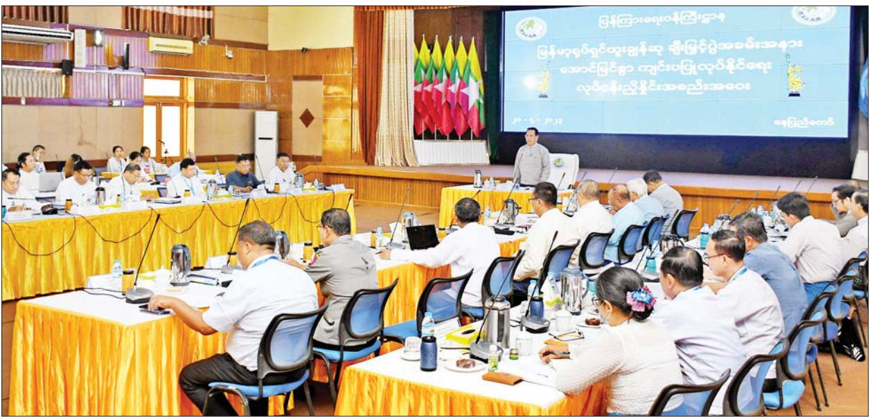
ပြည်ထောင်စုဝန်ကြီး ဦးမောင်မောင်အုန်း မြန်မာ့ရုပ်ရှင်ထူးချွန်ဆု ချီးမြှင့်ပွဲအခမ်းအနား အောင်မြင်စွာကျင်းပနိုင်ရေး လုပ်ငန်းညှိနှိုင်းအစည်းအဝေးတွင် အမှာစကား ပြောကြားစဉ်။

ထို့နောက် မြန်မာ့ရုပ်ရှင်ထူးချွန်ဆု ချီးမြှင့်ပွဲ အခမ်းအနားကျင်းပ