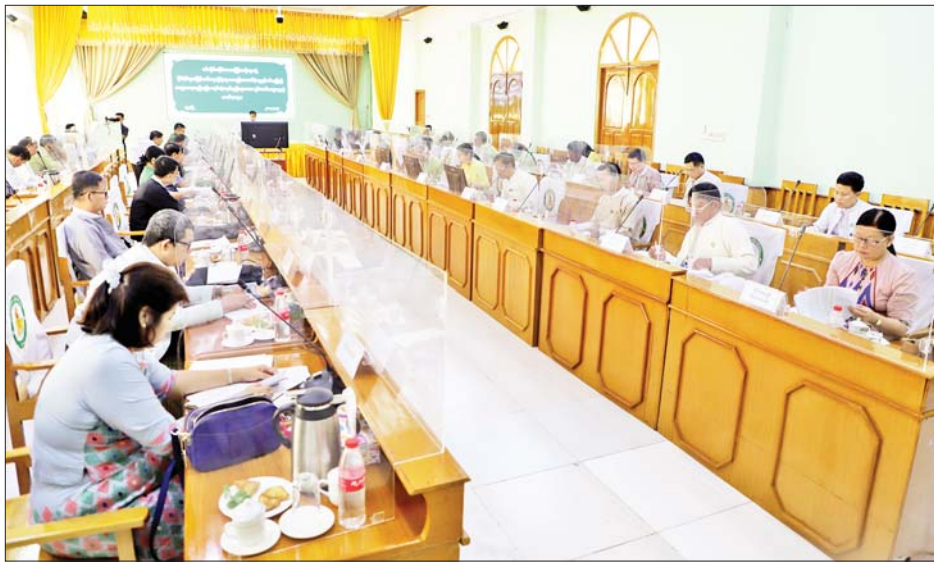
ကော်မတီများဖွဲ့စည်းပြီး သက်ဆိုင်ရာဌာနများ အနေဖြင့် ဘဏ္ဍာရေးစည်းမျဉ်း၊ ဘဏ္ဍာရေး လုပ်ထုံးလုပ်နည်းများကို သိရှိနားလည်စေရန် အထူးအလေးထား ဂရုပြုဆောင်ရွက်ရန်လိုအပ်ပါကြောင်းနှင့် နိုင်ငံစီးပွား မြှင့်တင်ရေးရန်ပုံငွေမှ မတည်ထောက်ပံ့မှုများကို ထုတ်ယူသုံးစွဲရာတွင် နိုင်ငံစီးပွားမြှင့်တင်ရေးရန်ပုံငွေမှ မတည်ထောက်ပံ့မှုဆိုင်ရာ ဘဏ္ဍာရေးလုပ်ထုံးလုပ်နည်းနှင့်အညီ ဆောင်ရွက်သွားကြ

မုံရွာ ဧပြီ ၂၀ နိုင်ငံစီးပွားမြှင့်တင်ရေးရန်ပုံငွေမှ မတည်ထောက်ပံ့မှုနှင့်စပ်လျဉ်း၍ ဘဏ္ဍာရေးစည်းမျဉ်း၊ ဘဏ္ဍာရေးလုပ်ထုံးလုပ်နည်းများ ရှင်းလင်းဆွေးနွေးပွဲအခမ်းအနားကို ဧပြီ ၂၀ ရက် နံနက်ပိုင်းတွင် စစ်ကိုင်းတိုင်းဒေသကြီး အစိုးရအဖွဲ့ရုံး အစည်းအဝေးခန်းမ၌ ကျင်းပသည်။