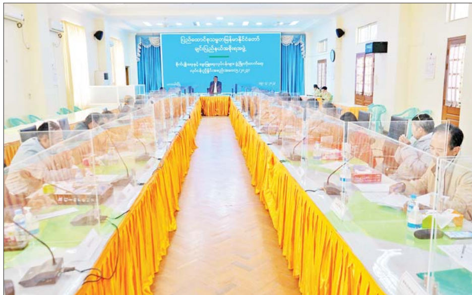
ပြောကြားသည်။ ထို့နောက် အနောက်မြောက်တိုင်းစစ်ဌာနချုပ် ဒုတိယတိုင်းမှူး ဗိုလ်မှူးချုပ် မျိုးထွဋ်လှိုင်က ချင်း

ချင်းပြည်နယ်အတွင်း စားရေရိက္ခာဖူလုံနိုင်ရေးနှင့် စိုက်ပျိုးရေးနှင့်မွေးမြူရေးလုပ်ငန်းများ ဖွံ့ဖြိုးတိုးတက်ရေးလုပ်ငန်း ညှိနှိုင်းအစည်းအဝေးကို ဧပြီ ၁၉ ရက် နံနက် ၁၀ နာရီက ဟားခါးမြို့ ချင်းပြည်နယ် အစိုးရအဖွဲ့ရုံး အစည်းအဝေးခန်းမ၌ကျင်းပရာ ချင်းပြည်နယ်ဝန်ကြီးချုပ် ဒေါက်တာ ဝန်ဆွန်းထန် တက်ရောက်အမှာစကားပြောကြားသည်။