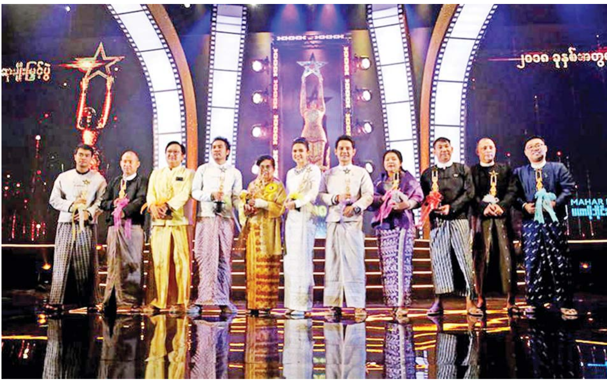
ရန်ကုန်မြို့ The One Entertainment Park ၌ ကျင်းပခဲ့သည့် ၂၀၁၈ ခုနှစ်အတွက် မြန်မာ့ရုပ်ရှင်ထူးချွန်ဆုပေးပွဲတွင် အကယ်ဒမီထူးချွန်ဆု ရရှိသူများကို တွေ့ရစဉ်။

ယောက်ျားလေးများထက် မိန်းကလေးများက အကယ်ဒမီကို ပိုမိုစိတ်ဝင်စားခဲ့ကြသည်။ ဘယ်သူရမည် ဘယ်ဝါရမည်ဟူသော ထင်ကြေးများဖြင့် ခန့်မှန်းလို့ မဆုံးနိုင်ခဲ့ကြ။ ငယ်စဉ်ကပင် အနုပညာ သွေးတို့ ကိန်းအောင်းခဲ့သော စာရေးသူအနေဖြင့် အကယ်ဒမီဆုပေးပွဲ လာသောနေ့များတွင် အဒေါ်၊ အစ်မများကြားရောက်ပြီး အဖြူအမည်း တီဗွီလေးမှတစ်ဆင့် သူတို့ကဲ့သို့ ရင်ခွန်ခဲ့ရသည်။ မီးဆလိုက်ကြီးများက မည်သူ့ဆီရောက်သွားမလဲ၊ ဆုကြေညာသူက မည်သူ့ကိုကြေညာ လိုက်မလဲ သို့လောသို့လော အတွေးခံစားချက်များက ပရိသတ်များကို ပင် ရင်သိမ့်တုန်စေခဲ့သည်။ အခြားသော အသံပိုင်း၊ ဓာတ်ပုံပိုင်း၊