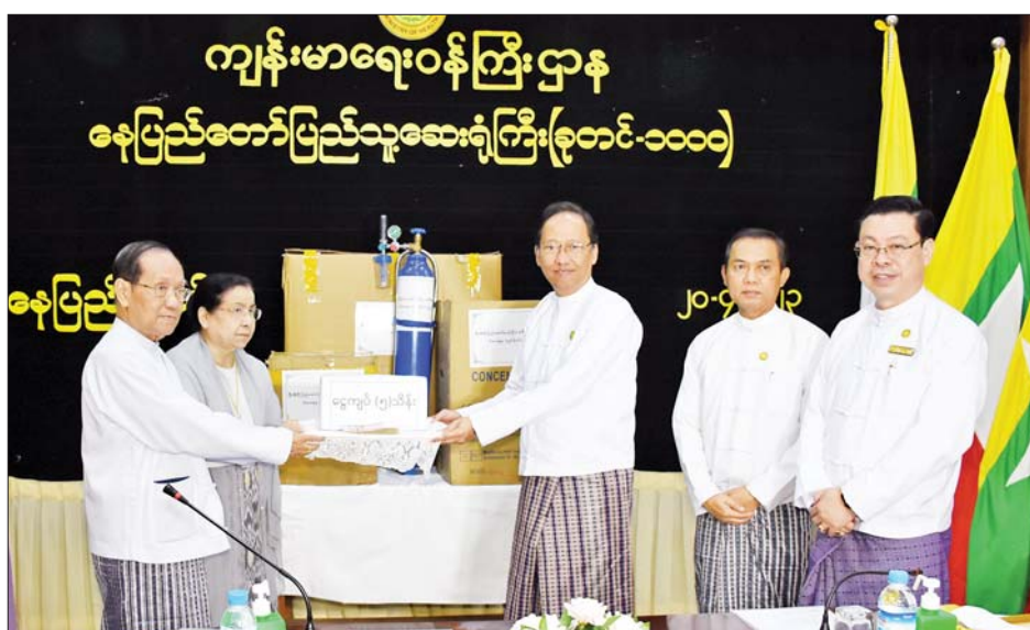
ဦးစုစက်နှင့် အောက်ဆီဂျင်စက်တို့ကို လှူဒါန်းရခြင်း ဖြစ်ကြောင်း ပြောကြားသည်။ ထို့နောက် အလှူရှင်မိသားစုက ဆေးရုံသုံး စက်ပစ္စည်းများဖြစ်သော ချွေစက်၊ အောက်ဆီဂျင် စက်၊ (Wheel Chair)နှင့် အလှူငွေကျပ် ငါးသိန်းတို့ကို ပေးအပ်လှူဒါန်းရာ ကျန်းမာရေးဝန်ကြီးဌာန

နေပြည်တော် ဧပြီ ၂၀ နေပြည်တော် ခုတင် (၁၀၀၀)ဆံ့ အထွေထွေ ရောဂါကုဆေးရုံကြီးသို့ ဆေးရုံသုံးစက်ပစ္စည်းများ နှင့် အလှူငွေများ လှူဒါန်းခြင်းအခမ်းအနားကို ယနေ့ နံနက် ၈ နာရီခွဲတွင် အဆိုပါဆေးရုံကြီးရှိ အုပ်ချုပ်မှု ဆောင် အစည်းအဝေးခန်းမ၌ ကျင်းပသည်။ အခမ်းအနားတွင် အလှူရှင် သာသနာရေးနှင့် ယဉ်ကျေးမှုဝန်ကြီးဌာန ပြည်ထောင်စုဝန်ကြီး ဦးကိုကိုက လှူဒါန်းရခြင်းအကြောင်း ရှင်းလင်း ပြောကြားရာတွင် ခုတင် (၁၀၀၀)ဆံ့ အထွေထွေ ရောဂါကုဆေးရုံကြီးတွင် မိသားစုသဖွယ် စောင့်ရှောက် ကုသပေးကြသည့် သမားတော်ကြီးများ၊ ဆရာဝန်ကြီး များ၊ ကျန်းမာရေးဆိုင်ရာဝန်ထမ်းများနှင့် ဆေးရုံကြီး ၏ ကျေးဇူးကို အထူးအလေးထား တုံ့ပြန်သော အားဖြင့် မိမိနှင့် မိသားစုများအနေဖြင့် ဤဆေးရုံကြီး အတွက် အသက်ရှူလမ်းကြောင်းဆိုင်ရာ အရေးပေါ် ဝေဒနာရှင်များ အထောက်အကူဖြစ်စေရန် ရည်ရွယ် ပြီး အလွယ်တကူ သယ်ဆောင်အသုံးပြုနိုင်သည့်