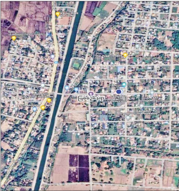
ပုသိမ်ကြီးမြို့နယ် မြကန်သာကျေးရွာတွင် PDF အမည်ခံ အကြမ်းဖက်သမားများက ရဟန်းသံဃာအယောင်ဆောင်ကာ လက်နက်ငယ်များဖြင့် ပစ်ခတ်တိုက်ခိုက် ထွက်ပြေးသွားသည့် နေရာပြပုံ။