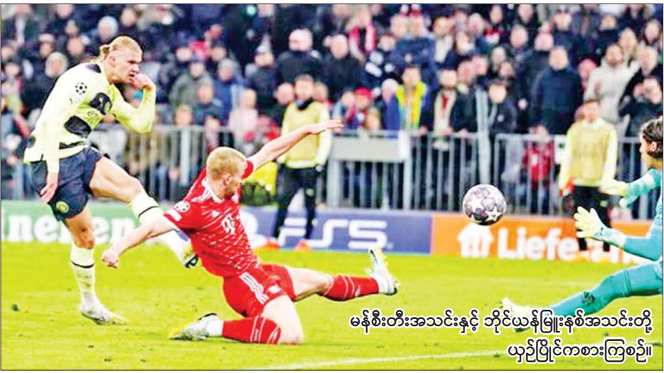
မန်စီးတီးအသင်းနှင့် ဘိုင်ယန်မြူးနစ်အသင်းတို့ ယှဉ်ပြိုင်ကစားကြစဉ်။

ဘိုင်ယန်မြူးနစ် အသင်းနဲ့ မန်စီးတီးအသင်းတို့ ဧပြီ ၂၀ ရက် နံနက်ပိုင်းက ယှဉ်ပြိုင်ကစားခဲ့တဲ့ ချန်ပီယံလိဂ် ကွာတားဖိုင်နယ် ဒုတိယအကျော့မှာ တစ်ဖက် တစ်ဂိုးစီ သရေရလဒ်ထွက်ပေါ် ခဲ့ပြီး ပထမအကျော့မှာ မန်စီးတီး အသင်းက သုံးဂိုးပြတ်အနိုင်ရရှိ ထားတာကြောင့် နှစ်ကျော့ပေါင်း လေးဂိုး-တစ်ဂိုးနဲ့ အနိုင်ရရှိကာ ဆီမီးဖိုင်နယ်အဆင့်ကို တက်လှမ်း ခွင့် ရရှိခဲ့ပါတယ်။ စာမျက်နှာ ၂၁ ကော်လံ ၁ သို့ ၀