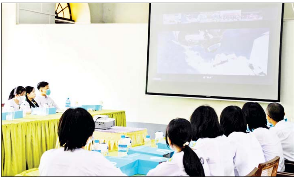
ကျောင်းသား ကျောင်းသူများ တက်ရောက်ခဲ့ကြပြီး မြန်မာနိုင်ငံမှ ကျောင်းသား ကျောင်းသူများအနေဖြင့် မြန်မာနိုင်ငံဆိုင်ရာ တရုတ်သံရုံးမှ ပညာရေးဝန်ကြီး ဌာနသို့ ဖိတ်ကြားမှုဖြင့် အွန်လိုင်းမှ စိတ်ပါဝင်စားစွာ တက်ရောက် လေ့လာခဲ့ခြင်းဖြစ်ကြောင်း သိရသည်။ သတင်းစဉ်

များနှင့် SCO အဖွဲ့ဝင်နိုင်ငံများမှ ကျောင်းသား ကျောင်းသူများ စကားပိုင်းဆွေးနွေးပွဲ ကျင်းပခြင်း ဖြစ်ပြီး မြန်မာနိုင်ငံမှ ကျောင်းသား ကျောင်းသူများ အနေဖြင့် အာကာသယာဉ်မှူးများ အာကာသယာဉ် အတွင်း နေထိုင်မှုနှင့် နည်းပညာပိုင်းဆိုင်ရာ တိုးတက်မှုအခြေအနေများကို လေ့လာနိုင်မည် ဖြစ်သည်။ တရုတ်ပြည်သူ့သမ္မတနိုင်ငံ ပေကျင်းတွင် ကျင်းပသည့် Shanghai Cooperation Organization အစီအစဉ်၌ Russia၊ China၊ India၊ Kazakhstan၊ Kyrgyzstan၊ Pakistan၊ Tajikistan၊ Uzbekistan၊ Iran၊ Belarus၊ Mongolia စသည့် နိုင်ငံများမှ