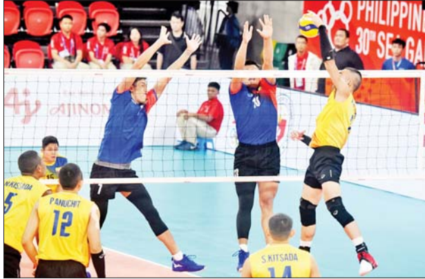
၂၀၁၉ ဆီးဂိမ်းပြိုင်ပွဲတွင် မြန်မာနှင့် ထိုင်းအသင်းတို့ တွေ့ဆုံခဲ့စဉ်။

ရန်ကုန် ဧပြီ ၂၀ မြန်မာ့လက်ရွေးစင် ဘော်လီဘောအသင်း ဝင်ရောက်ယှဉ်ပြိုင်မည့် (၃၂)ကြိမ်မြောက် ဆီးဂိမ်းအမျိုးသားဘော်လီဘောပြိုင်ပွဲ အုပ်စုပွဲစဉ်များ ထွက်ပေါ်လာပြီဖြစ်သည်။ ယခင်က ဆီးဂိမ်းအမျိုးသားဘော်လီဘောပြိုင်ပွဲတွင် ခုနစ်သင်းသာ ယှဉ်ပြိုင်မည်ဖြစ်သော်လည်း အုပ်စုပွဲစဉ်မှ ဖိလစ်ပိုင်အမျိုးသားအသင်း ထပ်တိုးလာသဖြင့် သုံးသင်းပါဝင်သည့် အုပ်စု(က)တွင် ထပ်တိုးခဲ့ခြင်း ဖြစ်သည်။ စာမျက်နှာ ၂၀ ကော်လံ ၁ သို့ ၀