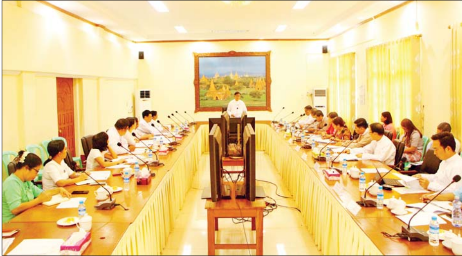
ဦးမောင်မောင်ဝင်း တက်ရောက်ဆွေးနွေးမှာကြားသည်။ ဦးစွာ ဒုတိယဝန်ကြီးက စီမံကိန်းအဆင့် - ၁ တွင် ဘဏ်ခြောက်ဘဏ်မှတစ်ဆင့် ၂၀၂၃ ခုနှစ် မတ်လကုန်အထိ SME လုပ်ငန်းရှင် ၁၅၉၅ ဦးသို့ ချေးငွေ ၂၇၅ ဒသမ ၀၁၁ ဘီလီယံ ထုတ်ချေးခဲ့ ပြီးဖြစ်ပါကြောင်း၊ စီမံကိန်းအဆင့် - ၂ တွင် ဘဏ် ၁၁ ဘဏ်မှတစ်ဆင့် ၂၀၂၃ ခုနှစ် မတ်လကုန်အထိ SME လုပ်ငန်းရှင် ၁၅၉၅ ဦးသို့ ချေးငွေ ၂၇၅ ဒသမ ၀၁၁ ဘီလီယံ ထုတ်ချေးခဲ့ပြီးဖြစ်ကြောင်း။ ဦးတည်ချက်နှင့်အညီ နိုင်ငံတော် စီမံအုပ်ချုပ်ရေးကောင်စီ၏ စီးပွားရေးဦးတည်ချက် (၄) ရပ်အနက် သွင်းကုန်အစားထိုးရန်နှင့် ပို့ကုန်မြှင့်တင်နိုင်ရေး ဒေသထွက်ကုန်ကြမ်းများ

နေပြည်တော် ဧပြီ ၂၀ မြန်မာနိုင်ငံရှိ အသေးစား၊ အလတ်စားနှင့်အလတ်စား စီးပွားရေးလုပ်ငန်းများ (MSMEs) ဖွံ့ဖြိုးတိုးတက်စေရန် နိုင်ငံတော်အနေဖြင့် လိုအပ်သောငွေကြေးထောက်ပံ့မှုများကိုစီမံဆောင်ရွက်ပေးလျက်ရှိရာ ၂၀၁၅-၂၀၁၆ ဘဏ္ဍာနှစ်နှင့် ၂၀၁၈-၂၀၁၉ ဘဏ္ဍာနှစ်တို့တွင် ဂျပန်နိုင်ငံမှ ရရှိခဲ့သော SME Two Step Loan များကို ဆက်လက်ဆောင်ရွက်ပေးလျက်ရှိသည်။