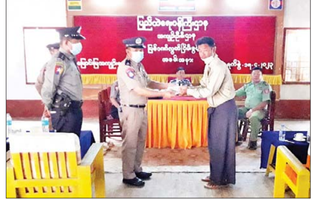
ယင်းတို့ကျခံရန်ကျန်ရှိသော ပြစ်ဒဏ်အပေါ် လျှော့ပေါ့၍ ပြစ်ဒဏ် လွတ်ငြိမ်းခွင့်ပြုခဲ့ကြောင်း သိရသည်။ ခရိုင်(ပြန်ဆက်)

အဆိုပါ ပြစ်ဒဏ်လွတ်ငြိမ်းခွင့်ပြုခြင်းကို နိုင်ငံတော်စီမံအုပ်ချုပ် ရေးကောင်စီ၏ ပြစ်ဒဏ်လွတ်ငြိမ်းခွင့်ပြုအမိန့်အမှတ် (၂၈/၂၀၂၃) ဖြင့် ပြစ်ဒဏ်ကျခံနေရသည့် အကျဉ်းသား အကျဉ်းသူတို့အား ရာဇဝတ် ကျင့်ထုံးဥပဒေပုဒ်မ ၄၀၁၊ ပုဒ်မခွဲ(၁) အရ “နောက်တစ်ကြိမ်ပြစ်မှုထပ်မံ ကျူးလွန်ပါက ၎င်းပြစ်ဒဏ်အပြင် ယခုကျခံရန်ကျန်ရှိသော ပြစ်ဒဏ် များကိုပါ ဆက်လက်ကျခံပါမည်” ဟူသော စည်းကမ်းသတ်မှတ်ချက်ဖြင့်