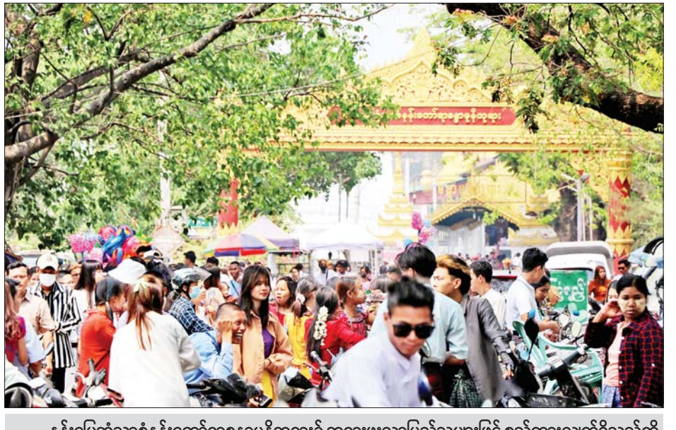
နန်းမြေဘုံသာစံနန်းတော်ရာစန္ဒာမုနိဘုရား၌ ဘုရားဖူးလာပြည်သူများဖြင့် စည်ကားလျက်ရှိသည်ကို တွေ့ရစဉ်။