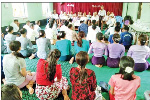
ဘီးလင်း ဧပြီ ၁၇

မွန်ပြည်နယ် ဘီးလင်းမြို့နယ်၌ နှစ်စဉ်ကျင်းပမြဲဖြစ်သော သက်ကြီး ဘိုးဘွားများအား ပူဇော်ကန်တော့ပွဲအခမ်းအနားကို ယနေ့ နံနက် ၉ နာရီက ဘီးလင်းမြို့နယ် အထွေထွေအုပ်ချုပ်ရေးဦးစီးဌာန အစည်း အဝေးခန်းမ၌ ကျင်းပသည်။