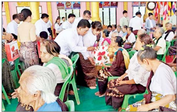
လေးမျက်နှာ ဧပြီ ၁၇

မြန်မာနှစ်ဆန်းတစ်ရက်နေ့တွင် ဟင်္သာတခရိုင် လေးမျက်နှာ မြို့နယ်၌ ဇီဝိတဒါနငါးလွတ်ပွဲအခမ်းအနားကို ငဝန်မြစ်ကူးတံတား အောက်တွင် ယနေ့ နံနက် ၈ နာရီက ကျင်းပသည်။