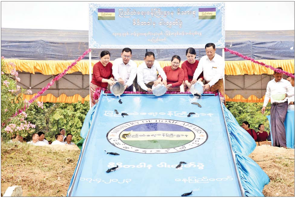
တက်ရောက်နိုင်သူ အဘိုး ရှစ်ဦး၊ အဘွား ၁၀ ဦး စုစုပေါင်းအဘိုးအဘွား ၁၈ ဦးတို့ကို ဒုတိယဝန်ကြီးချုပ်နှင့် ပြည်ထောင်စုဝန်ကြီးနှင့် ဇနီးတို့ ဦးဆောင်ကာ မြန်မာ့လေ့ထုံးတမ်းအစဉ်အလာနှင့်အညီ နှစ်သစ်ကူး ကန်တော့ပွဲများဖြင့် လှူဒါန်းပူဇော်ကန်တော့ကြရာ ကန်တော့ခံ အဘိုးအဘွားများကိုယ်စား အဘွားဒေါ်ခင်စန်းရီက ဆုတောင်းမေတ္တာ စကား ပြန်လည်ပြောကြားသည်။ ယနေ့အခမ်းအနားတွင် အသက် ၈၀ နှင့်အထက် အဘိုးအဘွား ၇၉ ဦးတို့ကို ငွေသားအပါအဝင် အသုံးအဆောင်ပစ္စည်းနှင့် ဆေးဝါး ပစ္စည်းများ ဂါရဝပြု လှူဒါန်းခဲ့ကြကြောင်း သိရသည်။ သတင်းစဉ်

ထို့နောက် ပြည်ထဲရေးဝန်ကြီးဌာန မိသားစု၏ သက်ကြီးဘိုးဘွား များ ကန်တော့ပွဲအခမ်းအနားကို နံနက် ၉ နာရီခွဲတွင် နေပြည်တော် ရုံးအမှတ်(၈) မြန်မာနိုင်ငံရဲတပ်ဖွဲ့ဌာနချုပ် အရိန္ဒမာခန်းမ၌ ဆက်လက် ကျင်းပရာ ဒုတိယဝန်ကြီးချုပ်နှင့် ပြည်ထောင်စုဝန်ကြီး ဒုတိယ ဗိုလ်ချုပ်ကြီးစိုးထွဋ်နှင့် ဇနီး၊ ဒုတိယဝန်ကြီး ဗိုလ်ချုပ်တိုးရီ နှင့် ဇနီး၊ ဒုတိယဝန်ကြီး မြန်မာနိုင်ငံရဲတပ်ဖွဲ့ရဲချုပ် ဗိုလ်ချုပ်ဇော်မင်းထက်နှင့် ဇနီး၊ အမြဲတမ်းအတွင်းဝန် ဦးခိုင်ထွန်းဦး နှင့် ဇနီး၊ တပ်ဖွဲ့/ဦးစီးဌာန များမှ ညွှန်ကြားရေးမှူးချုပ်များ၊ အရာရှိကြီးများနှင့် ဇနီးများ၊ တာဝန် ရှိသူများ၊ ဝန်ထမ်းများနှင့် မိသားစုဝင်များ တက်ရောက်ကြပြီး ပြည်ထဲရေးဝန်ကြီးဌာန ဝန်ထမ်းများ၏ အတူနေမိသားစုဝင် အသက် ၈၀ နှင့်အထက် အဘိုးအဘွား ၇၉ ဦးတို့အနက် အခမ်းအနားသို့