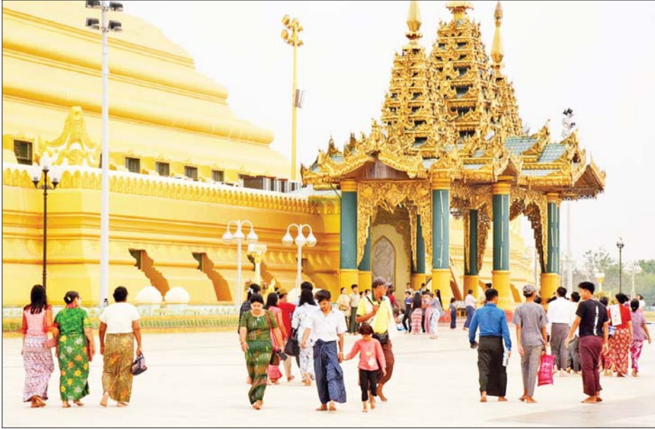
ဥပ္ပါတသန္တိစေတီတော်မြတ်ကြီး၌ ဘုရားဖူးလာပြည်သူများဖြင့် စည်ကားလျက်ရှိသည်ကို တွေ့ရစဉ်။