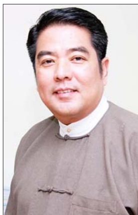
ဦးဆန်းလင်း

မြန်မာနိုင်ငံဟာ ဘာသာပေါင်းစုံ၊ လူမျိုးပေါင်းစုံ၊ တိုင်းရင်းသား ပေါင်းစုံ နေထိုင်ကြတဲ့ နိုင်ငံတော်ကြီးဖြစ်ပါတယ်။ တစ်ဦးနဲ့ တစ်ဦး မေတ္တာတရားရှေ့ထားပြီးတော့ သစ္စာတရားနဲ့ ချစ်ချစ်ခင်ခင်နေထိုင် ကြကာ တစ်ဘာသာနဲ့တစ်ဘာသာ၊ တစ်ဦးနဲ့တစ်ဦး အပြန်အလှန် လေးစားကြပြီး တိုင်းပြည်အေးချမ်းတည်ငြိမ်စေဖို့အတွက် တစ်ဖက် တစ်လမ်းကနေ ဝိုင်းဝန်းဆောင်ရွက်ကြပါစို့။ ပြည်တွင်းအေးသည် ပြည်တွင်းမှာသာ ရှိတယ်လို့ ကျွန်တော်တို့ အစ္စလာမ်ဘာသာလူထု ယုံကြည်ထားပါတယ်။ အခုနှစ်သစ်ကူးမှာ နိုင်ငံသူ နိုင်ငံသားအားလုံး ကမ္ဘာသူ ကမ္ဘာသားအားလုံး ပျော်ရွှင်ချမ်းမြေ့ပြီး နိုင်ငံအကျိုးကို သယ်ပိုးထမ်းဆောင်နိုင်ကြပါစေလို့ ဆုမွန်ကောင်းတောင်းအပ်ပါ တယ်။ အားလုံးနှစ်သစ်မှာ လိုအပ်ဆန္ဒပြည့်ဝကြပါစေလို့ ဆုတောင်း မေတ္တာတွေ ပို့သလိုက်ပါတယ်ခင်ဗျာ။ ။