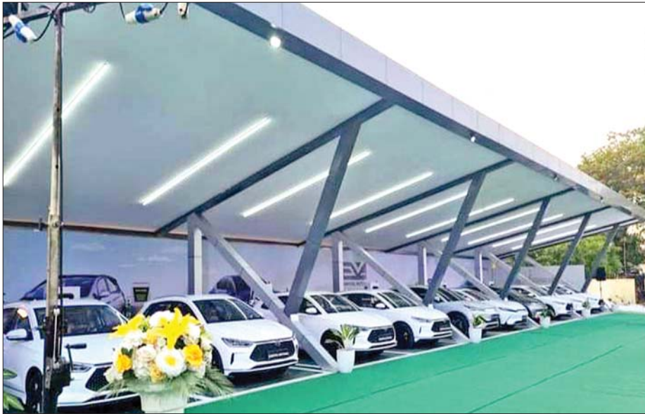
ရန်ကုန်ဘူတာကြီးရှေ့ရှိ Public Charging Station ကို တွေ့မြင်ရစဉ်။

စပေအိတ်နှင့် တက်စလာကုမ္ပဏီတည်ထောင်သူ အီလွန်မတ်နှင့် အလီဘာဘာကုမ္ပဏီတည်ထောင်သူ ဂျက်မားတို့နှစ်ဦး ၂၀၀၀ ပြည့်လွန်နှစ်များအတွင်း ထိုစဉ်က ခေတ်စားနေသည့် ဒီဘီတီတစ်ခုတွင် တွေ့ကြုံသည်။ အီလွန်မတ်က အနာဂတ်ဝါဒီတစ်ဦး (Futurist) ဖြစ်ပြီး အာကာသထဲတွင် လူများသွားရောက်နေထိုင်ရန် လုံ့လပြုနေသူဖြစ်သည်။ ဒီဘီတီတွင် အီလွန်မတ်က “ငါတို့စိတ်ကို အာကာသ Making Consciousness Multiplanetary အထိ တိုးချဲ့ဖို့ပါပဲ။ နိုင်ငံဂျီဒီပီရဲ့ တစ်ရာခိုင်နှုန်းလောက်ကို သုံးပြီး သုတေသနတွေ လုပ်ဖို့လိုတယ်။ ငါတို့ တက်စလာကနေ လျှပ်စစ်ကားတွေ ထုတ်ဖို့လုပ်နေတယ်။ ဆိုလာကို လိုအပ်လာတယ်။ ရေရှည်တည်တံ့မယ့် စွမ်းအင်တစ်မျိုးလိုမယ်။ တရုတ်က တက်စလာကုမ္ပဏီခွဲဟာ တော်တော်အလုပ်လုပ်နိုင်တယ်။ အဲဒါကို တကယ်ချီးကျူးတယ်။ တရုတ်ဟာ အနာဂတ်ပါပဲ”ဟု ပြောကြားခဲ့သည်။