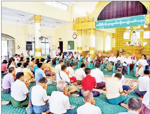
သထုံ ဧပြီ ၁၇

မွန်ပြည်နယ် သထုံမြို့၌ ဇီဝိတဒါန ငါးလွတ်ပွဲနှင့် သက်ကြီးဘိုးဘွား များ ပူဇော်ကန်တော့ခြင်းကို ဌာနဆိုင်ရာများ၊ မြို့မမြို့ဖများက မြန်မာ နှစ်ဆန်းတစ်ရက်နေ့ နံနက်ပိုင်းတွင် သတ်မှတ်နေရာ၌ ကျင်းပ သည်။