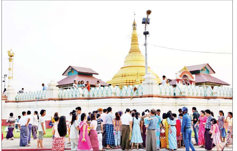
ဓာတုစယဓာတ်ပေါင်းစုစေတီတော်၌ ဘုရားဖူးလာပြည်သူများဖြင့် စည်ကားလျက်ရှိသည်ကို တွေ့ရစဉ်။