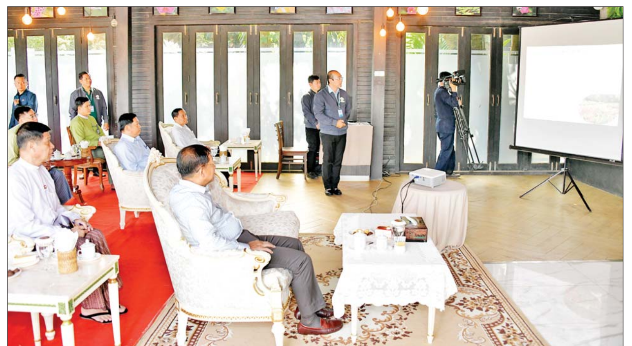
နိုင်ငံတော်စီမံအုပ်ချုပ်ရေးကောင်စီဥက္ကဋ္ဌ နိုင်ငံတော်ဝန်ကြီးချုပ် ဗိုလ်ချုပ်မှူးကြီး မင်းအောင်လှိုင်အား ပြင်ဦးလွင်မြို့ အမျိုးသား ကန်တော်ကြီးဥယျာဉ်မှ တာဝန်ရှိသူတစ်ဦးက ရှင်းလင်းတင်ပြစဉ်။

လာရောက်အပန်းဖြေမှုနှင့် နှစ်စဉ် ကျင်းပပြုလုပ်သည့် ပန်းပွဲတော် များသို့ ပြည်သူများ အပန်းဖြေ လာရောက်မှုအခြေအနေများကို ရှင်းလင်းတင်ပြသည်။ အကြံပြုပြောကြား ရှင်းလင်းတင်ပြမှုများအပေါ် နိုင်ငံတော် စီမံအုပ်ချုပ်ရေး ကောင်စီဥက္ကဋ္ဌ နိုင်ငံတော်ဝန်ကြီး ချုပ်က မေမြို့ပန်း၊ ဂန္ဓမာပန်း၊ သစ္စာပန်း၊ ဒေလီယာပန်း စသည့် ပန်းများသည် ပြင်ဦးလွင်၏ နာမည်ကျော်လူကြိုက်များသည့် ပန်းများဖြစ်ကြောင်း၊ သဘာဝ အလျောက်ပေါက်ရောက်နေသည့် ၁၂ ရာသီပန်းများကိုလည်း ဖွံ့ဖြိုး တိုးတက်ရေး သုတေသနပြု ဆောင်ရွက်ကြရန် လိုကြောင်း၊ ဓာတ်မြေဩဇာနှင့် သဘာဝ မြေဩဇာများကို စနစ်တကျ သုံးစွဲရန်လိုကြောင်း၊ ဒေသမျိုးရင်း များနှင့် ပြင်ဦးလွင်၏ရာသီဥတု နှင့်ကိုက်ညီသည့် နိုင်ငံအတွင်းရှိ ဒေသများမှ ပန်းမျိုးများစိုက်ပျိုးမှု တိုးတက်စေရေး ဆောင်ရွက် ကြရန် လိုကြောင်း၊ ချယ်ရီပင်များ ပွင့်လန်းမှု ပိုမိုကောင်းမွန်စေရေး စနစ်တကျ သုတေသနပြု ဆောင်ရွက်ရန် လိုကြောင်း၊ ပတ်ဝန်းကျင်စီမံခန့်ခွဲခြင်း ပန်းရန်များနှင့် သင်းပျံ့နေမည် ဆိုပါက ပြည်သူများစိတ်လက် ရွှင်လန်းစွာဖြင့် အပန်းဖြေနိုင် မည်ဖြစ်သဖြင့် စနစ်တကျ ဆောင်ရွက်ရန် လိုကြောင်း၊ မြက် စိုက်ပျိုးရာတွင်လည်း ဘဲစားမြက် များကို ကျွမ်းကျင်သူများနှင့် ဆွေးနွေးညှိနှိုင်းပြီး စနစ်တကျ စိုက်ပျိုးရန်လိုကြောင်း၊ ကန်တော် ကြီးအတွင်း ရေဝင်ရောက်မှုများ လျော့နည်းမှုမရှိစေရေး စနစ် တကျဖြင့် ထိန်းသိမ်းဆောင်ရွက် ကြရန်လိုကြောင်း အကြံပြုပြော