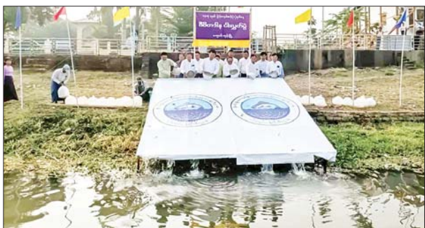
ကျောင်းကုန်း ဧပြီ ၁၇

ဧရာဝတီတိုင်းဒေသကြီး ကျောင်းကုန်းမြို့နယ် အထွေထွေအုပ်ချုပ် ရေးဦးစီးဌာနရုံးရှေ့ ဒါးကမြစ်အတွင်းသို့ ၁၃၈၅ ခုနှစ် မြန်မာနှစ်ဆန်း တစ်ရက်နေ့ နံနက်ပိုင်းက ဇီဝိတဒါန စုပေါင်းငါးလွတ်ပွဲ ကျင်းပသည်။