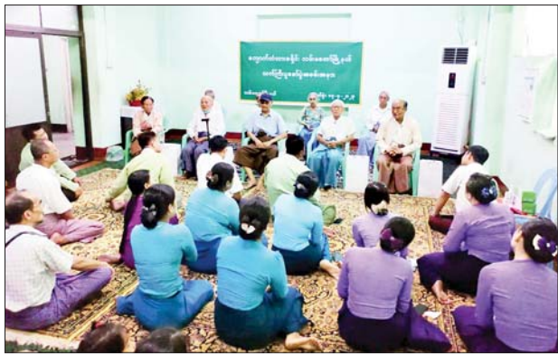
ရန်ကုန် ဧပြီ ၁၇

ရန်ကုန်တိုင်းဒေသကြီး လမ်းမတော်မြို့နယ်၌ အသက် ၈၀ နှင့် အထက် သက်ကြီးဘိုးဘွားများအား ပူဇော်ကန်တော့ခြင်းကို ယနေ့ မွန်းလွဲ ၃ နာရီက လမ်းမတော်မြို့နယ် အထွေထွေအုပ်ချုပ်ရေးဦးစီးဌာန အစည်းအဝေးခန်းမ၌ ကျင်းပသည်။