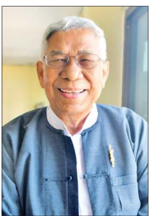
ဦးကြည်စိုးထွန်း

ဦးကြည်စိုးထွန်း ( မြန်မာနိုင်ငံရုပ်ရှင်အစည်းအရုံး ဥက္ကဋ္ဌ) မြန်မာနိုင်ငံရုပ်ရှင်အစည်းအရုံးရဲ့ဆောင်ပုဒ်က “ရုပ်ရှင်သည် ပြည်သူ့အတွက်ဖြစ်ပါတယ်” လို့ ဆိုထားပါတယ်။ ရုပ်ရှင်ဟာပြည်သူ့ အတွက်ဆိုတာကြောင့် ပြည်သူတွေပျော်ရွှင်မှု၊ အေးချမ်းသာယာမှု၊ ကြီးပွားတိုးတက်မှုနဲ့ ဘာသာသာသနာမှာကောင်းမွန်စွာ ရွက်ဆောင် နိုင်ကြဖို့ ဆုတောင်းမေတ္တာပို့သပါတယ်။ ရုပ်ရှင်ကိုချစ်မြတ်နိုးတဲ့ ပရိသတ်ကြီးဟာ ကျွန်တော်တို့အစည်းအရုံးအတွက် အဓိကမဏ္ဍိုင်ကြီးဖြစ်တာကြောင့် ချစ်ပရိသတ်ကြီး နှစ်သစ်မင်္ဂလာချိန်ခါမှာ ရွှင်လန်း ချမ်းမြေ့ကြပါစေကြောင်း ဆုမွန်ကောင်းပို့သပါတယ်။