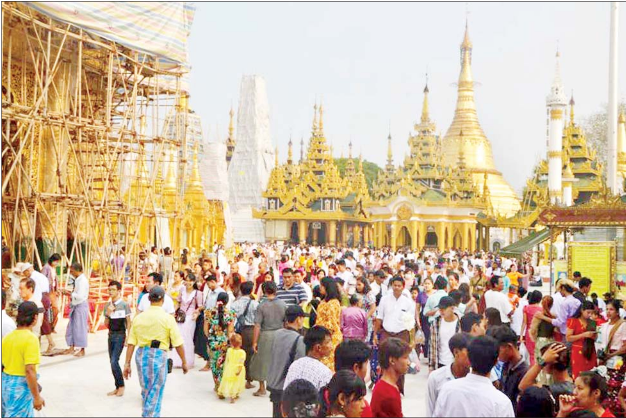
မြန်မာနှစ်ဆန်း တစ်ရက်နေ့တွင် ရွှေတိဂုံစေတီတော်မြတ်ကြီး၌ ဘုရားဖူးပြည်သူများဖြင့် စည်ကားလျက်ရှိသည်ကို တွေ့ရစဉ်။

ဦးစွာရွှေတိဂုံဘဏ္ဍာတော်ထိန်းဂေါပကအဖွဲ့ဝင်များနှင့် ဘာသာ