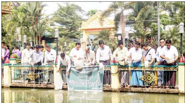
ထန်းတပင်(ရန်ကုန်) ဧပြီ ၁၇

ရန်ကုန်တိုင်းဒေသကြီး ထန်းတပင်မြို့နယ်၌ အသက် ၈၅ နှစ်နှင့် အထက် သက်ကြီးဘိုးဘွားများအား ပူဇော်ကန်တော့ပွဲနှင့် ဇီဝိတဒါန ငါးလွတ်ပွဲအခမ်းအနားကို ယနေ့နံနက်ပိုင်းက မြို့နယ်အထွေထွေ အုပ်ချုပ်ရေးဦးစီးဌာန အစည်းအဝေးခန်းမနှင့် တဝရွှေဂူကြီးဘုရား သီရိမင်္ဂလာကန်တော်တို့၌ ကျင်းပသည်။