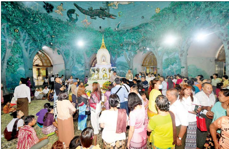
မြန်မာနှစ်ဆန်း တစ်ရက်နေ့တွင် မဟာဝိဇယစေတီတော်မြတ်ကြီး၏ ဂန္ဓကုဋ်တိုက်အတွင်း၌ ဘုရားဖူးပြည်သူများဖြင့် စည်ကားလျက်ရှိသည်ကို တွေ့ရစဉ်။

သတင်း - ဇော်မင်းလတ်