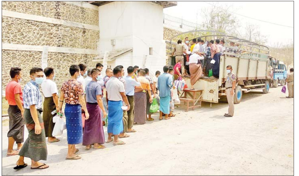
အကျဉ်းထောင် ငါးခုမှ အကျဉ်းသား အကျဉ်းသူ ၁၃၀ နှင့် ကုန်ထုတ်စခန်းများမှ အကျဉ်းသား အကျဉ်းသူ ၇၁ ဦး စုစုပေါင်း ၂၀၁ ဦး၊ တိုင်းဒေသကြီး အတွင်းရှိ လူငယ်သင်တန်းကျောင်း နှစ်ကျောင်းနှင့် အမျိုးသမီးသက်မွေး အတတ်ပညာသင်ကျောင်းတို့မှ ကျောင်းသား ကျောင်းသူစုစုပေါင်း ၉၇ ဦး လွတ်မြောက် ခွင့်ရရှိခဲ့ကြောင်း သိရသည်။ မောင်အေးချမ်း