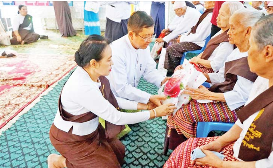
တာဝန်ရှိသူများ၊ အမျိုးသမီးရေးရာအဖွဲ့ဝင်များ၊ ကြသည်။ ဦးစွာ ရွှေတောင်ကျောင်းမှ သံဃာတော် ဝန်ထမ်းများ တက်ရောက် ခဲ့ကြောင်း သိရသည်။ ခရိုင်(ပြန်/ဆက်)

မော်လမြိုင် ဧပြီ ၁၇ သတ္တဝါများ ဘေးအန္တရာယ်ကင်းရှင်းပြီး အသက်ရှည်စွာနေနိုင်ကြစေရန်နှင့် ရှေးအစဉ်အဆက် ပြုလုပ်လာသည့် ကောင်းမြတ်သည့် မြန်မာ့ ယဉ်ကျေးမှုအစဉ်အလာကို ထိန်းသိမ်းစောင့်ရှောက် ရန်ရည်ရွယ်၍ ဇီဝိတဒါန ငါးလွှတ်ပွဲနှင့် သက်ကြီး ပူဇော်ကန်တော့ပွဲ အခမ်းအနားကို ၁၃၈၅ ခုနှစ် တန်ခူးလပြည့်ကျော် ၁၃ ရက် (မြန်မာနှစ်ဆန်း တစ်ရက်)နံနက်ပိုင်းတွင် မော်လမြိုင်မြို့ ဆိပ်ကမ်းသာ တံတား၌ ကျင်းပရာ မွန်ပြည်နယ်ဝန်ကြီးချုပ် ဦးအောင်ကြည်သိန်းနှင့် ဇနီး၊ အရှေ့တောင်တိုင်း စစ်ဌာနချုပ် တိုင်းမှူး ဗိုလ်မှူးချုပ် စိုးမင်းနှင့် ဇနီး၊ ပြည်နယ်တရားလွှတ်တော် တရားသူကြီးချုပ်၊ ပြည်နယ်အစိုးရအဖွဲ့ဝင် ဝန်ကြီးများ၊ ပြည်နယ်ဥပဒေ ချုပ်၊ ပြည်နယ်/ခရိုင်/မြို့နယ် ငါးမျိုးစိုက်ထည့်ခြင်း ကြီးကြပ်ကွပ်ကဲရေးကော်မတီဥက္ကဋ္ဌနှင့် အဖွဲ့ဝင်များ၊ ပြည်နယ်/ခရိုင်/မြို့နယ်အဆင့် ဌာနဆိုင်ရာများမှ