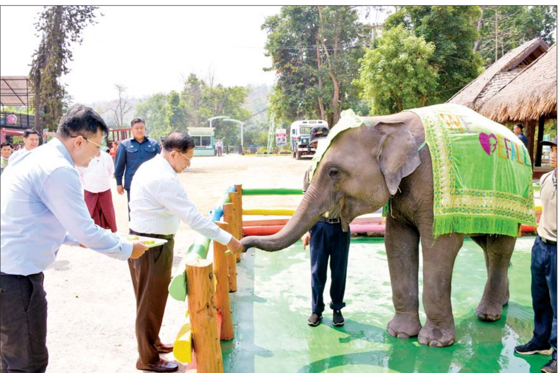
နိုင်ငံတော်စီမံအုပ်ချုပ်ရေးကောင်စီဥက္ကဋ္ဌ နိုင်ငံတော်ဝန်ကြီးချုပ် ဗိုလ်ချုပ်မှူးကြီးမင်းအောင်လှိုင် ပွဲကောက်ရေတံခွန် အပန်းဖြေစခန်း (B.E FALLS)အတွင်းရှိ ဆင်လေးအား အစာကျွေးစဉ်။

ဖြစ်သည်။ ပန်းမြို့တော်၊ ခရီးသွားမြို့တော် ဖြစ်သည့်နှင့်အညီ ပန်းမျိုးစုံကို စိုက်ပျိုး ထားရှိ၍ နှစ်စဉ် ပန်းပွဲတော်များကိုလည်း ကျင်းပသွားမည်ဖြစ်သည်။ လာရောက် လည်ပတ်သူများ စိတ်အပန်းဖြေစေရန် ရည်ရွယ်၍ အဆင့်မြှင့်တင် ဆောင်ရွက် ထားသည်။ မှန်တံတား၊ ကြိုးတံတားများ အပြင် log house၊ coffee shop၊ တောတွင်းလျှောက်လမ်းများ၊ အပန်းဖြေ နေရာများ၊ ကလေးကစားကွင်းများ စသည်တို့ကို ပြည့်စုံအောင် ထည့်သွင်း အဆင့်မြှင့်တင်ထားရှိသည့်အပြင် ယခု အခါတွင် အရှည် ၅၅၄ မီတာရှိ Sky Cable Way ကိုလည်း တည်ဆောက်ထားရှိကာ Sky Cable Car များကို စီးနင်း၍ သဘာဝ ပတ်ဝန်းကျင် အလှအပများကို ကြည့်ရှု ခံစားနိုင်ကြောင်းနှင့် မြန်မာနှစ်သစ်ကူး အတာသင်္ကြန်ကာလအတွင်း ပွဲကောက် ရေတံခွန်အပန်းဖြေစခန်း (B.E FALLS)သို့ ပြည်တွင်း၊ ပြည်ပ ခရီးသွား ပြည်သူများ စည်ကားသိုက်မြိုက်စွာဖြင့် လာရောက် လည်ပတ်ခဲ့ကြကြောင်း သိရသည်။ သတင်းစဉ်