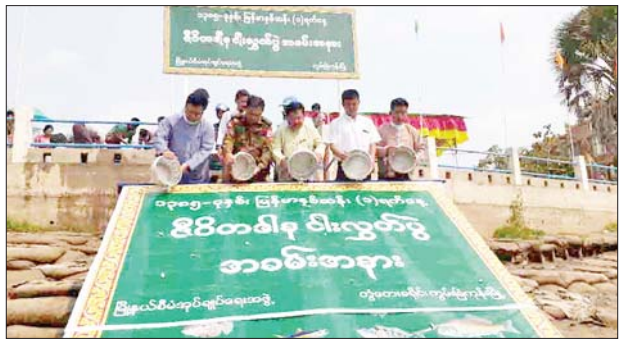
ကျော့သောင်း ဧပြီ ၁၇

တနင်္သာရီတိုင်းဒေသကြီး ကျော့သောင်းမြို့၌ မြန်မာနှစ်ဆန်း တစ်ရက်နေ့ ဇီဝိတဒါနငါးလွတ်ပွဲနှင့် သက်ကြီးပူဇော်ပွဲအခမ်းအနားကို ယနေ့တွင်ကျင်းပသည်။