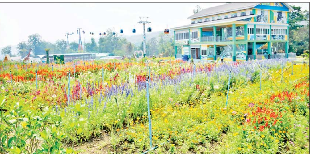
နိုင်ငံတော်စီမံအုပ်ချုပ်ရေးကောင်စီဥက္ကဋ္ဌ နိုင်ငံတော်ဝန်ကြီးချုပ် ဗိုလ်ချုပ်မှူးကြီးမင်းအောင်လှိုင် ပွဲကောက်ရေတံခွန်အပန်းဖြေစခန်း (B.E FALLS)အတွင်း ကြည့်ရှုစစ်ဆေးစဉ်။

★ စာမျက်နှာ ၃ မှ ပွဲကောက်ရေတံခွန်သည် ယခင်က စနစ်ကျသည့် အကွက်ချမှုမရှိခြင်း၊ ဈေးဆိုင်ခန်းများ များပြားလာခြင်း၊ စည်းကမ်းမဲ့ အမှိုက်စွန့်ပစ်ခြင်း၊ သစ်ပင် များ ခုတ်လှဲခြင်းများကြောင့် သဘာဝ ပတ်ဝန်းကျင်နှင့် ဂေဟစနစ် ပျက်စီး ယိုယွင်းမှုများ ဖြစ်ပေါ်လာခဲ့သည်။ ထို့ကြောင့် နိုင်ငံတော်စီမံအုပ်ချုပ် ရေးကောင်စီဥက္ကဋ္ဌ နိုင်ငံတော်ဝန်ကြီးချုပ် လာရောက်စစ်ဆေးစဉ်လမ်းညွှန်ချက်များ အရ အဆင့်မြှင့်တင် ပြုပြင်ထိန်းသိမ်း ဆောင်ရွက်ခဲ့ခြင်းဖြစ်ပြီး ရေတံခွန်အတွင်း ရေသန့်စင်စေရေး သဘာဝရေသန့်စင် စနစ်ကို အသုံးပြုထားသဖြင့် ရေကစား လိုသူများအနေဖြင့်လည်း သန့်ရှင်းပြီး ကျန်းမာရေးနှင့်ညီညွတ်စွာ ရေကစားမှု ပြုနိုင်မည်ဖြစ်သည်။ အပန်းဖြေစခန်းအတွင်း ရေတံခွန် သုံးခုရှိပြီး မြန်မာနိုင်ငံတွင် ပထမဆုံး LED မှန်တံတားကိုလည်း ကမ္ဘာ့ အဆင့်မီစွာဖြင့် ထည့်သွင်းဆောက်လုပ် ထားရှိ မှန်တံတားအောက်ခြေရှင်းများ ကို ရင်ခုန်စိတ်လှုပ်ရှားစွာ ခံစားနိုင်မည်