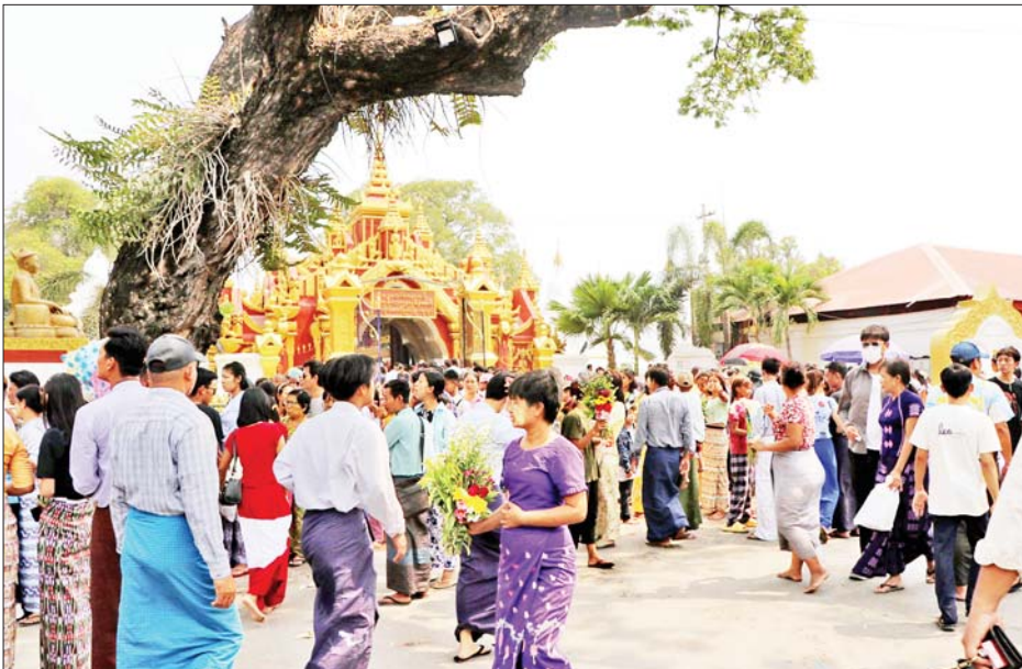
ကုသိုလ်တော်ဘုရား၌ ဘုရားဖူးလာပြည်သူများဖြင့် စည်ကားလျက်ရှိသည်ကို တွေ့ရစဉ်။