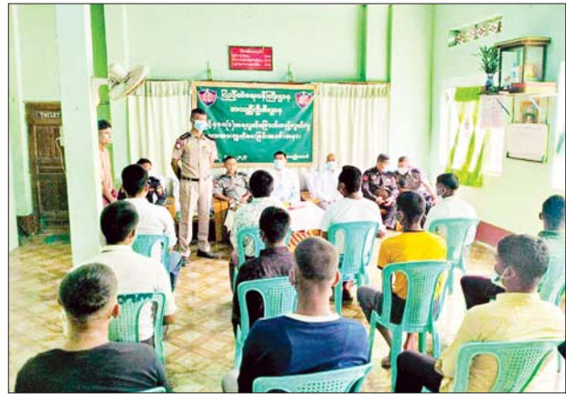
ဧရာဝတီတိုင်းဒေသကြီး ဖျာပုံမြို့နယ်အကျဉ်းထောင်မှ ပြစ်ဒဏ် လွတ်ငြိမ်းခွင့်ရရှိသည့် အကျဉ်းသား ၁၂ ဦးအား ပြစ်ဒဏ်မှလွတ်ငြိမ်း ခွင့်ပေးခြင်းအခမ်းအနားကို ယနေ့ နံနက် ၁၀ နာရီတွင် ဖျာပုံအကျဉ်း ထောင် တာဝန်ခံအရာရှိရုံးခန်း၌ ပြုလုပ်သည်။