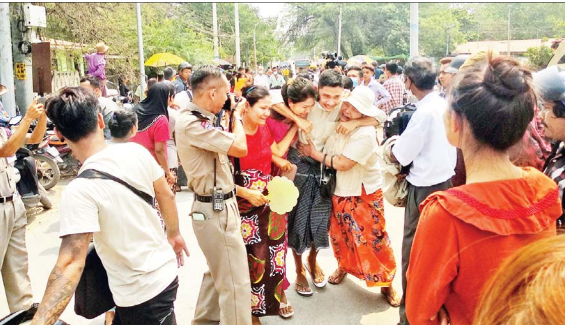
မန္တလေးဗဟိုအကျဉ်းထောင်မှ ပြစ်ဒဏ်လွတ်ငြိမ်းခွင့်ရသူများအား ၎င်းတို့၏မိသားစုဝင်များက ပျော်ရွှင်ကြည်နူး ဝမ်းမြောက်စွာ နှုတ်ဆက်ကြစဉ်။

နေပြည်တော် ဧပြီ ၁၇ အကျဉ်းထောင်၊ အချုပ်ထောင်၊ စခန်း အသီးသီးတို့တွင် အကျဉ်းကျခံနေကြ ရသည့် နိုင်ငံသား အကျဉ်းသား၊ အကျဉ်းသူ ၃၀၀၅ ဦးနှင့် နိုင်ငံခြားသား အကျဉ်းသား၊ အကျဉ်းသူ ၉၈ ဦး စုစုပေါင်း ၃၁၀၃ ဦး တို့ကို ယနေ့တွင် ပြစ်ဒဏ်လွတ်ငြိမ်းခွင့် ပြုခဲ့သည်။ ယနေ့တွင် တိုင်းဒေသကြီးနှင့် ပြည်နယ်အသီးသီးရှိ အကျဉ်းထောင်၊ အချုပ်ထောင်၊ စခန်းအသီးသီးမှ အကျဉ်း ကျခံနေကြသော အကျဉ်းသား၊ အကျဉ်းသူ ၃၀၀၅ ဦးနှင့် နိုင်ငံခြားသား အကျဉ်းသား၊ အကျဉ်းသူ ၉၈ ဦးတို့ကို ရာဇဝတ်ကျင့်ထုံး ဥပဒေပုဒ်မ ၄၀၁၊ ပုဒ်မ ၁) အရ “နောက် တစ်ကြိမ် ပြစ်မှုထပ်မံကျူးလွန်ပါက ၎င်း ပြစ်ဒဏ်အပြင် ယခုကျခံရန်ကျန်ရှိသော ပြစ်ဒဏ်များကိုပါ ဆက်လက်ကျခံပါမည်” ဟူသော စည်းကမ်းသတ်မှတ်ချက်ဖြင့် စာမျက်နှာ ၂၇ ကော်လံ ၁ သို့ *