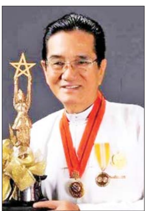
ပန်းချီစိုးမိုး