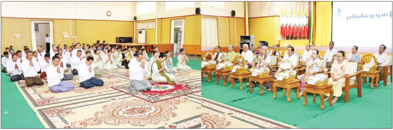
ညွှန်ကြားရေးမှူးချုပ်များနှင့် ဇနီး များ၊ ညွှန်ကြားရေးမှူးများနှင့် ဇနီးများ၊ ဝန်ထမ်းမိသားစုများ တက်ရောက်၍ ပြည်ထောင်စု ဝန်ကြီးနှင့် ဇနီးတို့ ဦးဆောင်ကာ ငါးကောင်ရေ ၁၅၀၀ ကို ဇီဝိတ ဒါနအဖြစ် မင်္ဂလာကန်တော် တွင်းသို့ ကုသိုလ်ပြုလွှတ်ပေးခဲ့ကြ သည်။ ထို့နောက် သက်ကြီးပူဇော်ပွဲ အခမ်းအနားကို နံနက် ၉ နာရီ တွင် နေပြည်တော် ရုံးအမှတ်(၄၂) နယ်စပ်ရေးရာဝန်ကြီးဌာန စုပေါင်း ခန်းမ၌ ဆက်လက်ကျင်းပရာ နယ်စပ်ရေးရာ ဝန်ကြီးဌာန ဝန်ထမ်းမိသားစုများရှိ အသက် ၇၅ နှစ်နှင့် အထက် အဘိုး ၁၁ ဦး၊ အဘွား ၂၂ ဦး စုစုပေါင်း ၃၃ ဦး အနက် တက်ရောက်နိုင်သူ အဘိုး အဘွား ၁၄ ဦးကို ပြည်ထောင်စု ဝန်ကြီးနှင့် ဇနီးတို့ ဦးဆောင်၍ မြန်မာ့လေ့ထုံးတမ်းအစဉ်အလာ နှင့်အညီ နှစ်သစ်ကူး ကန်တော့ ပစ္စည်းများဖြင့် လှူဒါန်းပူဇော် ကန်တော့ကြပြီး ကန်တော့ခံ ဘိုးဘွားများကိုယ်စား အဘွား တစ်ဦးက ဆုတောင်းမေတ္တာ စကား ပြန်လည်ပြောကြား သည်။ ထို့နောက် ပြည်ထောင်စု ဝန်ကြီးနှင့် အဖွဲ့သည် ဘိုးဘွားများ ကို ရင်းနှီးစွာဂါရဝပြု တွေ့ဆုံခဲ့ ကြောင်း သိရသည်။ သတင်းစဉ်

နေပြည်တော် ဧပြီ ၁၇ နယ်စပ်ရေးရာဝန်ကြီးဌာန၏ ဇီဝိတဒါန စုပေါင်းငါးလွှတ်ပွဲ အခမ်းအနားကို ယနေ့(မြန်မာ နှစ်ဆန်းတစ်ရက်)နံနက် ၇ နာရီ တွင် နေပြည်တော်ရှိ မင်္ဂလာ ကန်တော်၌ ကျင်းပသည်။ ကုသိုလ်ပြုလွှတ်ပေး အခမ်းအနားသို့ ပြည်ထောင်စု ဝန်ကြီး ဒုတိယဗိုလ်ချုပ်ကြီး ထွန်းထွန်းနောင်နှင့် ဇနီး၊ ဒုတိယ ဝန်ကြီး ဗိုလ်ချုပ်ခွန်သန်းဇော်ထူး နှင့် ဇနီး၊ ဒုတိယဝန်ကြီး ဗိုလ်ချုပ် ဖြိုးသန့်နှင့် ဇနီး၊ အမြဲတမ်း အတွင်းဝန်၏ ဇနီး၊ ဒုတိယ