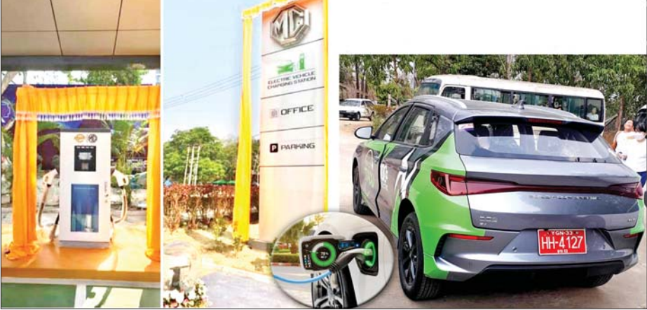
နေပြည်တော် သပြေကုန်းဈေးရှေ့ရှိ Public Charging Station ၌ လျှပ်စစ်သုံးမော်တော်ယာဉ် တစ်စီးကို တွေ့မြင်ရစဉ်။

က လည်းကောင်း၊ လျှပ်စစ်သုံးယာဉ်များနှင့် ဆက်စပ်လုပ်ငန်းများ ရင်းနှီးမြှုပ်နှံမှုနှင့် တင်သွင်း၊ တင်ပို့၊ တပ်ဆင်ထုတ်လုပ်မှုမြှင့်တင်ရေး လုပ်ငန်းကော်မတီကို စီးပွားရေးနှင့် ကူးသန်းရောင်းဝယ်ရေး ဝန်ကြီးဌာနကလည်းကောင်း၊ လျှပ်စစ်သုံးယာဉ်များနှင့် ဆက်စပ်လုပ်ငန်းများဆိုင်ရာ အထူးသက်သာခွင့်များ ညှိနှိုင်းကြိုကြပ်ရေးလုပ်ငန်းကော်မတီကို စီမံကိန်းနှင့် ဘဏ္ဍာရေးဝန်ကြီးဌာနက လည်းကောင်း၊ လျှပ်စစ်သုံးယာဉ်များပြေးဆွဲ/ အသုံးပြုရေးနှင့် အခြေခံအဆောက်အအုံများ အကောင်အထည်ဖော်ရေးလုပ်ငန်းကော်မတီကို ဆောက်လုပ်ရေးဝန်ကြီးဌာနကလည်းကောင်း၊ လျှပ်စစ်သုံးယာဉ်နှင့် ဆက်စပ်ပစ္စည်းများ သုတေသနနှင့်ဖွံ့ဖြိုးရေးလုပ်ငန်းကော်မတီကို သိပ္ပံနှင့်နည်းပညာဝန်ကြီးဌာနကလည်းကောင်း၊ Focal အဖြစ်ဆောင်ရွက်လျက် ရှိသည်။