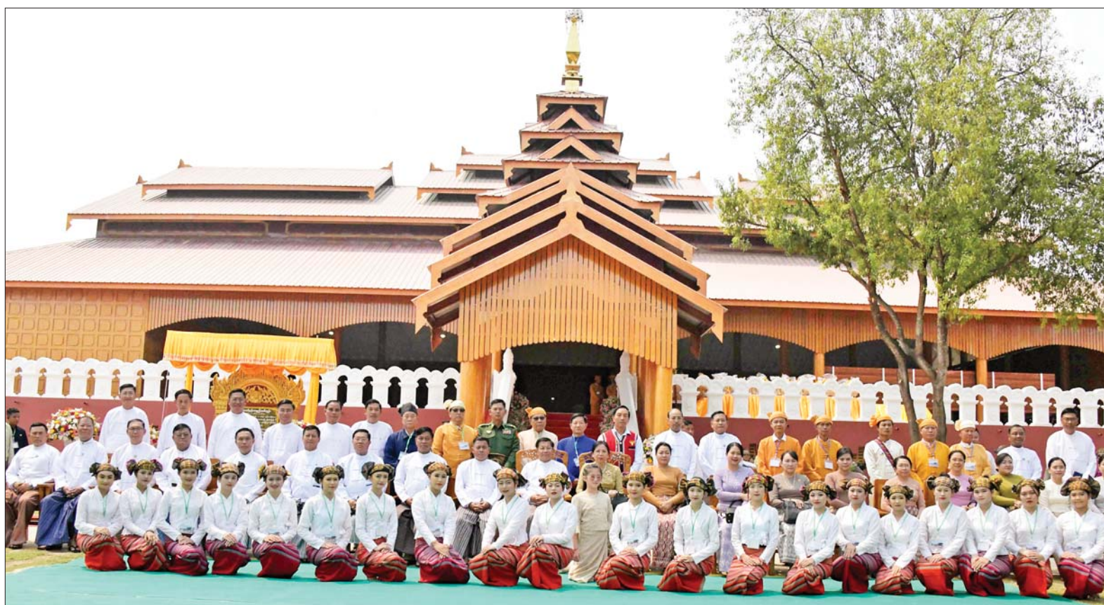
နိုင်ငံတော်စီမံအုပ်ချုပ်ရေးကောင်စီဥက္ကဋ္ဌ နိုင်ငံတော်ဝန်ကြီးချုပ် ဗိုလ်ချုပ်မှူးကြီး မင်းအောင်လှိုင် သိန္နီဟော်နန်းယဉ်ကျေးမှုပြတိုက် ဖွင့်ပွဲအခမ်းအနားသို့ တက်ရောက်လာကြသူများနှင့်အတူ စုပေါင်းမှတ်တမ်းတင် ဓာတ်ပုံရိုက်ကြစဉ်။

မိမိတို့ဒေသအတွင်း မှီတင်းနေထိုင်ကြသည့် ရှမ်း၊ ကချင်၊ ကိုးကန့်၊ 'ဝ'၊ ပလောင်၊ လားဟူ၊ လီဆူ အစရှိသည့် ဒေသခံတိုင်းရင်းသားလူမျိုးများသည် ရှေးပဝေသဏီကပင် သိန္နီမြို့အပါအဝင် ရှမ်းပြည်နယ်မြောက်ပိုင်းတစ်ခွင်တွင် ချစ်ကြည်စည်းလုံးစွာဖြင့် အေးအတူ ပူအမျှ အတူယှဉ်တွဲ နေထိုင်ခဲ့ကြသည့် သမိုင်းအစဉ်အလာကောင်းများ ခိုင်မာစွာ တည်ရှိခဲ့ပါကြောင်း၊ ရှမ်းပြည်နယ် မြောက်ပိုင်း သိန္နီမြို့နယ်၏ သမိုင်းဝင်ယဉ်ကျေးမှု အမွေအနှစ်တစ်ခု ဖြစ်သော ယခု ဟော်နန်းကြီးအား မူလပုံစံအတိုင်း ပြန်လည် တည်ဆောက်ပေးခြင်းဖြင့် သိန္နီမြို့နယ်၏ ဂုဏ်ယူဖွယ်ရာ အထင်ကရ ကျက်သရေဆောင် အဆောက်အအုံကြီး တစ်ခု ပြန်လည်ပေါ်ထွန်းခဲ့ပြီး ဒေသဖွံ့ဖြိုးရေး၊ ဒေသတွင်း တိုင်းရင်းသား စည်းလုံးညီညွတ်စေရေးကို များစွာ အထောက်အကူဖြစ်စေ၍ ပြည်ထောင်စုကြီး၏ ဂုဏ်ဒြပ်ကို ထင်ဟပ်ပေါ်လွင်စေသည့် သမိုင်းမှတ်တိုင်ကြီးတစ်ခုဖြစ်သည်ကို အလေးအနက် တင်ပြအပ်ပါကြောင်း၊ ယခုဟော်နန်းကြီးအား ရှေးမူမပျက် မူလပုံစံအတိုင်း ပြန်လည် တည်ဆောက်ပေးပါသော နိုင်ငံတော်နှင့် တပ်မတော်၏ စေတနာ၊ အဘက်ဘက်မှ ဝိုင်းဝန်းကူညီပံ့ပိုးပေးကြပါသော အုပ်ချုပ်ရေးဌာန အဆင့်ဆင့်နှင့် ဌာနဆိုင်ရာများ လူပုဂ္ဂိုလ်အဖွဲ့အစည်းများ၊ အလှူရှင်များနှင့် ကျေးဇူးတင်ထိုက်သူများအားလုံးကို ကျေးဇူးတင်ရှိပါကြောင်း ပြောကြားသည်။