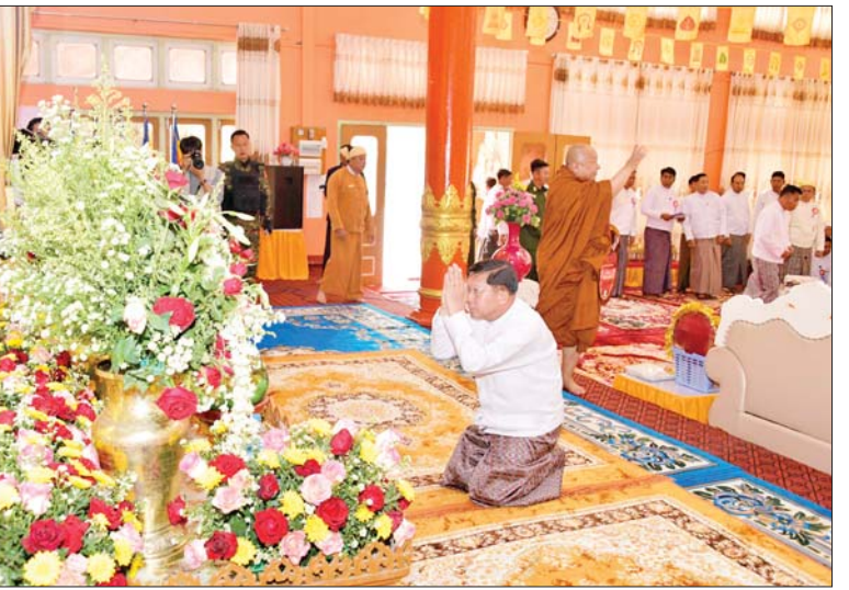
နိုင်ငံတော်စီမံအုပ်ချုပ်ရေးကောင်စီဥက္ကဋ္ဌ နိုင်ငံတော်ဝန်ကြီးချုပ် ဗိုလ်ချုပ်မှူးကြီး မင်းအောင်လှိုင် သီရိမင်္ဂလာမန်ဆူရှမ်းကျောင်းတိုက် မဇ္ဈရုံအတွင်းရှိ နှီးဘုရား ဗုဒ္ဓရုပ်ပွားတော်မြတ်အား ဖူးမြော်ကြည့်ညိကာ ပန်း၊ ရေချမ်း၊ ဆီမီး ကပ်လှူပူဇော်စဉ်။

အုပ်ချုပ်ရေးကောင်စီဥက္ကဋ္ဌ နိုင်ငံတော်ဝန်ကြီးချုပ် ဗိုလ်ချုပ်မှူးကြီး မင်းအောင်လှိုင်နှင့် ဇနီးဒေါ်ကြူကြူလှ၊ မိသားစုဝင်များ၊ ခရီးစဉ်တွင် လိုက်ပါလာသည့် အဖွဲ့ဝင်များ၊ ဒေသခံပြည်သူများ တက်ရောက်ကြသည်။