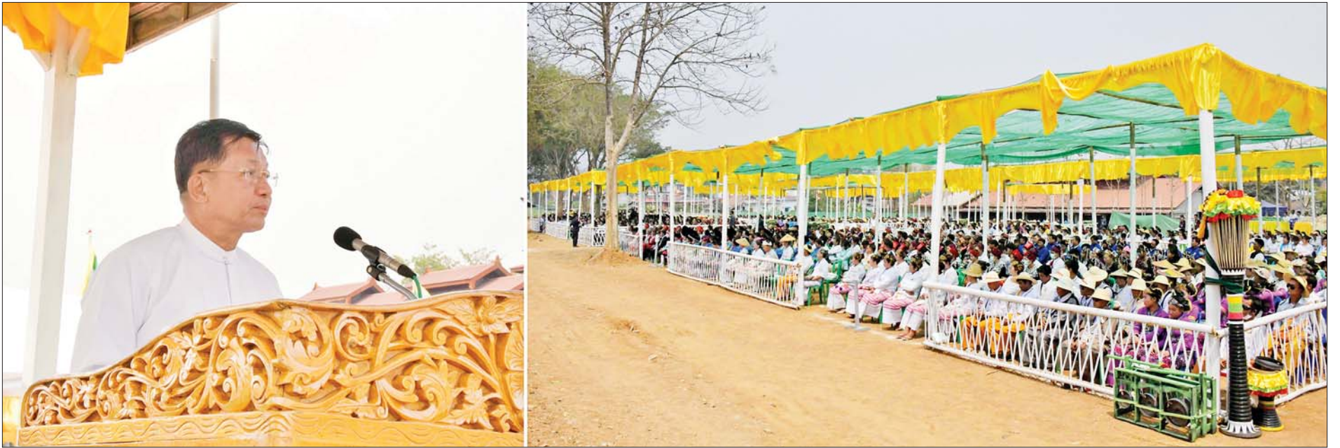
နိုင်ငံတော်စီမံအုပ်ချုပ်ရေးကောင်စီဥက္ကဋ္ဌ နိုင်ငံတော်ဝန်ကြီးချုပ် ဗိုလ်ချုပ်မှူးကြီး မင်းအောင်လှိုင် သိန္နီဟော်နန်းယဉ်ကျေးမှုပြတိုက် ဖွင့်ပွဲအခမ်းအနားတွင် အဖွင့်အမှာစကား ပြောကြားစဉ်။

★ ရှေးဦးစွာ အခမ်းအနားသို့ နိုင်ငံတော် စီမံအုပ်ချုပ်ရေးကောင်စီ ဥက္ကဋ္ဌ နိုင်ငံတော်ဝန်ကြီးချုပ်၏ ဇနီး ဒေါ်ကြူကြူလှ၊ တွဲဖက်အတွင်းရေးမှူး ဒုတိယဗိုလ်ချုပ်ကြီး ရဲဝင်းဦးနှင့် ဇနီး၊ ကောင်စီဝင် ဗိုလ်ချုပ်ကြီး တင်အောင်စန်း၊ ဒေါက်တာကျော်ထွန်း၊ ခွန်စုံလွင်၊ ဦးရွှေကြိမ်းနှင့် ဦးရန်ကျော်၊ ပြည်ထောင်စုဝန်ကြီး ဦးခင်မောင်ရီ၊ ဦးအောင်သော်၊ ရှမ်းပြည်နယ် ဝန်ကြီးချုပ် ဦးအောင်ဇော်အေး၊ ကာကွယ်ရေးဦးစီးချုပ် (ရေ) ဗိုလ်ချုပ်ကြီး မိုးအောင်နှင့် ဇနီး၊ ကာကွယ်ရေးဦးစီးချုပ် (လေ) ဗိုလ်ချုပ်ကြီး ထွန်းအောင်နှင့် ဇနီး၊ ကာကွယ်ရေး ဦးစီးချုပ်ရုံးမှ တပ်မတော် အရာရှိကြီးများနှင့် ဇနီးများ၊ အရှေ့မြောက်တိုင်း စစ်ဌာနချုပ် တိုင်းမှူး ဗိုလ်ချုပ် နိုင်နိုင်ဦး၊ စေတနာရှင် အလှူရှင် များ၊ ဒေသခံပြည်သူများ တက်ရောက်ကြသည်။