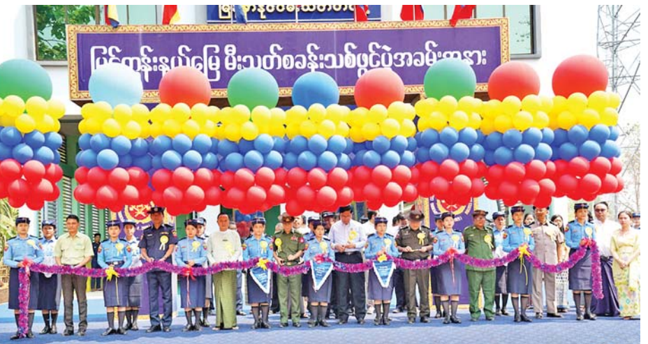
ခင်းခြင်းလုပ်ငန်းအတွက် ငွေကျပ်သန်း ၁၀ ဒသမ ၁၀၀ ကို ရန်ပုံငွေခွဲဝေချထားပေးကာ (အလျား ၄၅ ပေ X အနံ ၅၀ ပေ X အမြင့် ၂၆ ပေ) အရွယ်အစားရှိ RC နှစ်ထပ် အဆောက်အအုံ အမျိုးအစား ဆောက်လုပ်ပေးခဲ့ခြင်းဖြစ်ကြောင်း သိရသည်။ တိုင်းဒေသကြီး (ပြန်/ဆက်)

ကျေးဇူးတင်စကား ပြန်လည်ပြောကြားသည်။ အဆိုပါ မြင်ကွန်းနယ်မြေမီးသတ်စခန်းသစ်ကို မကွေးတိုင်းဒေသကြီးအစိုးရအဖွဲ့က ၂၀၂၂-၂၀၂၃ ဘဏ္ဍာနှစ် ငွေလုံးငွေရင်းရန်ပုံငွေမှ ခွင့်ပြုငွေကျပ်သန်း ၁၈၂ ဒသမ ၈၂၀ နှင့် မကွေးတိုင်းဒေသကြီး၏ အထွေထွေပုံလျှံရန်ပုံငွေ (GRF)မှ စခန်းရှေ့ကွန်ကရစ်