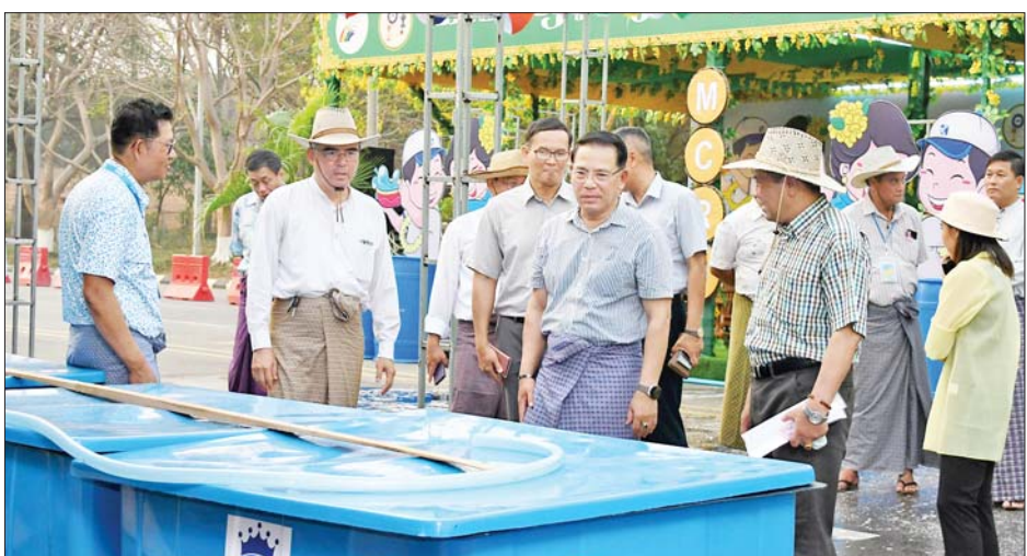
ပြည်ထောင်စုဝန်ကြီး ဦးမောင်မောင်အုန်းနှင့် တာဝန်ရှိသူများ နေပြည်တော်လမ်းလျှောက်သင်္ကြန် ဖွင့်ပွဲအခမ်းအနားအတွက် ပြင်ဆင်ဆောင်ရွက်နေမှုများကို ကြည့်ရှုစစ်ဆေးစဉ်။

လုံခြုံရေးကျိုးပေါက်မှု မရှိစေရေး ဆောင်ရွက်ထားရှိမှု အခြေအနေ များကို ကြည့်ရှုစစ်ဆေးသည်။ ကြည့်ရှုစစ်ဆေး ယင်းနောက် ဗဟိုမဏ္ဍပ်၌ ဖျော်ဖြေကြမည့် ဝန်ကြီးဌာန ယိမ်းအဖွဲ့များ၏ အစမ်းလေ့ကျင့် ကပြဖျော်ဖြေမှုများ၊ တေးသီချင်း သီဆိုဖျော်ဖြေနေမှုများ၊ အစမ်း လေ့ကျင့် ရေပက်ကစားနေမှုများ ကို ကြည့်ရှုစစ်ဆေးပြီး မီးဘေး အန္တရာယ် မဖြစ်ပေါ်စေရေးနှင့် ရေပြတ်တောက်မှု မရှိစေရေး စနစ်တကျ ဆောင်ရွက်ထားရှိရန် မှာကြားခဲ့သည်။ သတင်းစဉ်