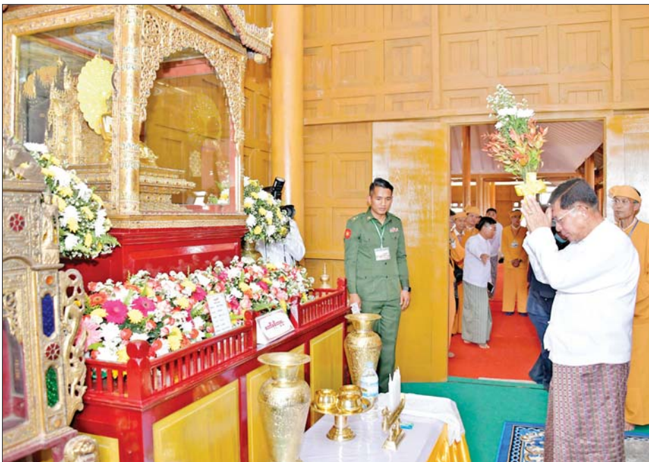
နိုင်ငံတော်စီမံအုပ်ချုပ်ရေးကောင်စီဥက္ကဋ္ဌ နိုင်ငံတော်ဝန်ကြီးချုပ် ဗိုလ်ချုပ်မှူးကြီး မင်းအောင်လှိုင် သိန္နီဟော်နန်းယဉ်ကျေးမှုပြတိုက်အတွင်းရှိ ဘုရားခန်းအတွင်း သိန္နီစော်ဘွားကြီး ခွန်ဆန်တုန်ဟုန်းအပါအဝင် စော်ဘွားအစဉ်အဆက် ကိုးကွယ်ခဲ့သည့် ရှေးဟောင်းဘုရားများအား ပန်း၊ ရေချမ်း၊ ဆီမီးများ ကပ်လှူပူဇော်စဉ်။

စော်ဘွားကြီး ခွန်ဆန်တုန်ဟုန်း၏ အရိုက်အရာကို ဆက်ခံသည့် သားတော် စပ်ဟုံဖသည် မြောက်သိန္နီနယ်၏ နောက်ဆုံး ဆက်ခံသည့် စော်ဘွားကြီးဖြစ်ပြီး စစ်ဘက်နယ်ဘက် တာဝန်များကို ထမ်းဆောင်လျက် ပြည်ထောင်စုကြီးကိုများစွာ အလုပ်အကျွေးပြုခဲ့သည့် ပုဂ္ဂိုလ်တစ်ဦး ဖြစ်ပါကြောင်း၊ ၁၉၄၄-၁၉၄၅ ခုနှစ်တွင် နယ်သူနယ်သားများကို စုစည်းပြီး တပ်ဖွဲ့ကို ဦးဆောင်လျက် ဂျပန်များကို တော်လှန်တိုက်ခိုက်ခဲ့ပါကြောင်း၊ ၁၉၄၇ ခုနှစ် ဖေဖော်ဝါရီ ၁၂ ရက်တွင် မော်ကွန်းဝင် ပင်လုံစာချုပ်ကြီးကို ရှမ်းစော်ဘွားများ ခေါင်းဆောင်တစ်ဦးအနေဖြင့် လက်မှတ်ရေးထိုးခဲ့သည့် ပုဂ္ဂိုလ်တစ်ဦးလည်းဖြစ်ပါကြောင်း၊ ၁၉၄၈ ခုနှစ် မတ် ၂၈ ရက်တွင် လားရှိုးမြို့ကို ရဲဘော်ဖြူနှင့် ကွန်မြူနစ်တပ်နီများ ဝင်ရောက်သိမ်းပိုက်ရာ မိမိနယ်က ရဲအမှုထမ်းနှင့် နယ်တွင်းမှ လူသူစုဆောင်းပြီး လားရှိုးမြို့ကို ၁၉၄၈ ခုနှစ် မတ်လအတွင်း ပြန်လည်တိုက်ခိုက်သိမ်းယူပြီး အစိုးရကို ပြန်လည်အပ်နှင်းနိုင်ခဲ့ပါကြောင်း၊ စော်ဘွားကြီး စပ်ဟုံဖသည်