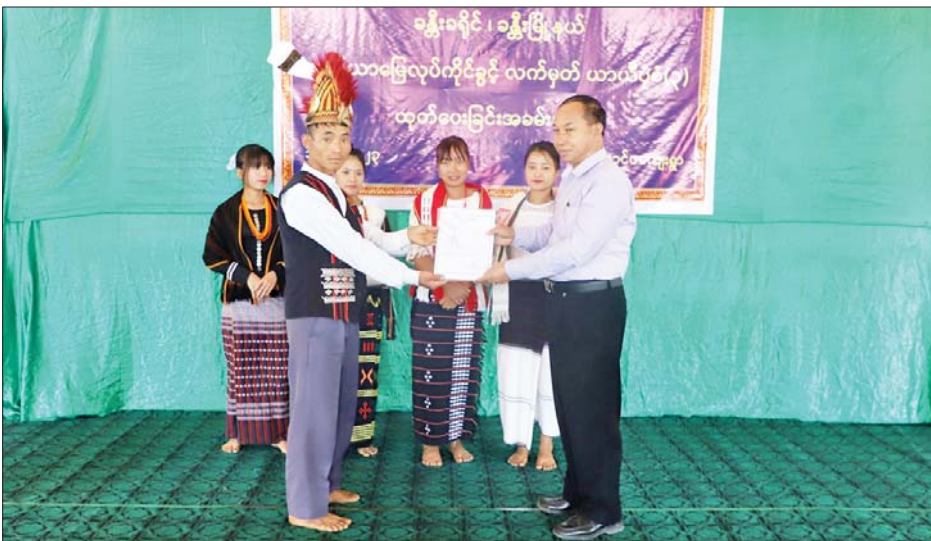
ကြောင်း၊ ဒေသခံတောင်သူများအနေဖြင့် ယနေ့ခွဲဝေပေးမည့် လယ်ယာမြေများပေါ်တွင် အထွက်ကောင်းမျိုးများအသုံးပြု၍ သွင်းအားစုများ ထည့်သွင်းကာ ခေတ်မီသိပ္ပံနည်းကျစိုက်ပျိုးနည်းစနစ်များ ဆောင်ရွက်

မုံရွာ ဧပြီ ၁၁ စစ်ကိုင်းတိုင်းဒေသကြီး ဝန်ကြီးချုပ်ဦးမြတ်ကျော် သည် တိုင်းဒေသကြီးအဆင့် ဌာနဆိုင်ရာများ၊ ခန္တီးခရိုင် စီမံအုပ်ချုပ်ရေးအဖွဲ့ဥက္ကဋ္ဌနှင့်အဖွဲ့ဝင်များ လိုက်ပါလျက် ယနေ့ နံနက်ပိုင်းတွင် ခန္တီးမြို့နယ် ဆင်သေကျေးရွာအုပ်စု လောင်ပကျေးရွာ၌ ကုန်းမြင့် လယ်ယာဖော်ထုတ်ပြီးစီး၍ ဒေသခံတိုင်းရင်းသား တောင်သူများထံ လယ်ယာမြေ ယာယီလုပ်ပိုင်ခွင့် လက်မှတ် ပုံစံ (၃) များ ပေးအပ်ပွဲအခမ်းအနားသို့ တက်ရောက်ကြသည်။