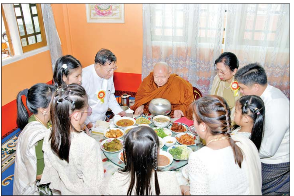
နိုင်ငံတော်စီမံအုပ်ချုပ်ရေးကောင်စီဥက္ကဋ္ဌ နိုင်ငံတော်ဝန်ကြီးချုပ် ဗိုလ်ချုပ်မှူးကြီး မင်းအောင်လှိုင်နှင့် ဇနီး ဒေါ်ကြူကြူလှတို့က ဆရာတော်၊ သံဃာတော်များအား နေ့ဆွမ်းဆက်ကပ်လှူဒါန်းကြစဉ်။

များသည် အရှေ့မြောက်တိုင်း စစ်ဌာနချုပ်သို့ ရောက်ရှိကြပြီး တိုင်းစစ်ဌာနချုပ်မှ အရာရှိ၊ စစ်သည်၊ မိသားစုများကို မြန်မာ့ ရိုးရာ အတာသင်္ကြန်ရေများ ပက်ဖျန်း၍ နှစ်သစ်ကို အတူတကွ ရင်းနှီးနှေးထွေးစွာ ကြိုဆိုခဲ့ကြပြီး ရင်းရင်းနှီးနှီး နှုတ်ဆက်ခဲ့ကြ ကြောင်း သိရသည်။ သတင်းစဉ်