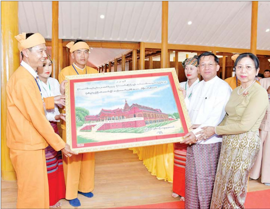
နိုင်ငံတော်စီမံအုပ်ချုပ်ရေးကောင်စီဥက္ကဋ္ဌ နိုင်ငံတော်ဝန်ကြီးချုပ် ဗိုလ်ချုပ်မှူးကြီးမင်းအောင်လှိုင် နှင့် ဇနီးဒေါ်ကြူကြူလှတို့အား သိန္နီဟော်နန်းယဉ်ကျေးမှုပြတိုက်ဖွင့်ပွဲအထိမ်းအမှတ် ပန်းချီကားကို ရှမ်းစာပေနှင့် ယဉ်ကျေးမှုအသင်းမှ တာဝန်ရှိသူတစ်ဦးက အမှတ်တရလက်ဆောင်ပေးအပ်စဉ်။