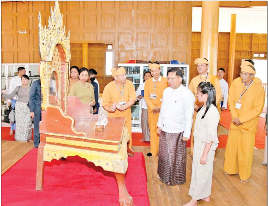
နိုင်ငံတော်စီမံအုပ်ချုပ်ရေးကောင်စီဥက္ကဋ္ဌ နိုင်ငံတော်ဝန်ကြီးချုပ် ဗိုလ်ချုပ်မှူးကြီးမင်းအောင်လှိုင်၊ ဇနီးဒေါ်ကြူကြူလှနှင့် အဖွဲ့ဝင်များ သိန္နီဟော်နန်းယဉ်ကျေးမှုပြတိုက်အတွင်းရှိ ရှေးဟောင်းယဉ်ကျေးမှု လက်ရာပစ္စည်းများကို လှည့်လည်ကြည့်ရှုစဉ်။