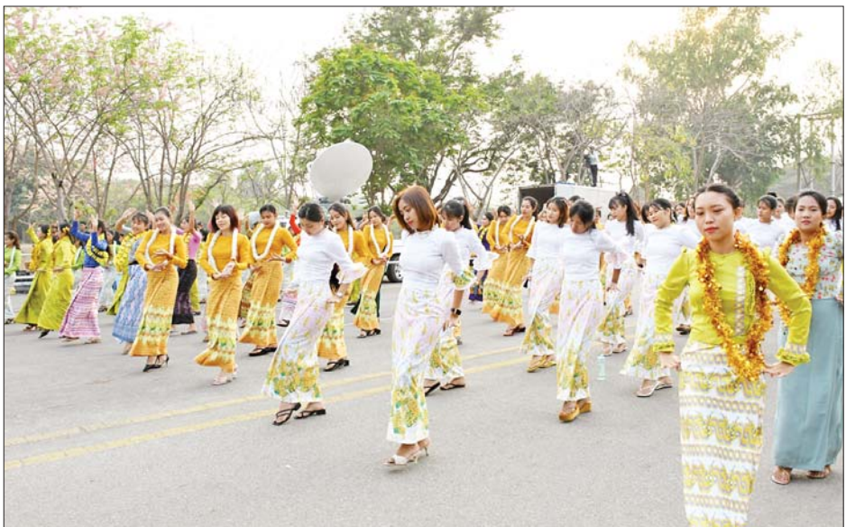
နေပြည်တော်လမ်းလျှောက်သင်္ကြန်အတွက် ဝန်ကြီးဌာနကိုယ်စားပြု ယိမ်းအကအဖွဲ့များ အစမ်းလေ့ကျင့်ကပြဖျော်ဖြေနေစဉ်။