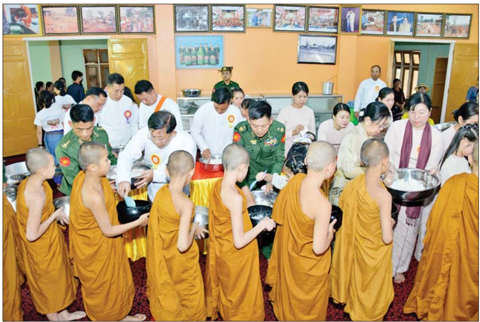
နိုင်ငံတော်စီမံအုပ်ချုပ်ရေးကောင်စီဥက္ကဋ္ဌ နိုင်ငံတော်ဝန်ကြီးချုပ် ဗိုလ်ချုပ်မှူးကြီး မင်းအောင်လှိုင်နှင့် ဇနီးဒေါ်ကြူကြူလှ၊ တာဝန်ရှိသူများ ဆရာတော်၊ သံဃာတော်များအား နေ့ဆွမ်းလောင်းလှူကြစဉ်။

ပြေးဆွဲမှုကိုလည်း အထောက်အကူဖြစ်စေမည်ဖြစ်ကြောင်းနှင့် အခြားလိုအပ်သည်များကို လမ်းညွှန်မှာကြားသည်။ စာမျက်နှာ ၈ သို့ ❖