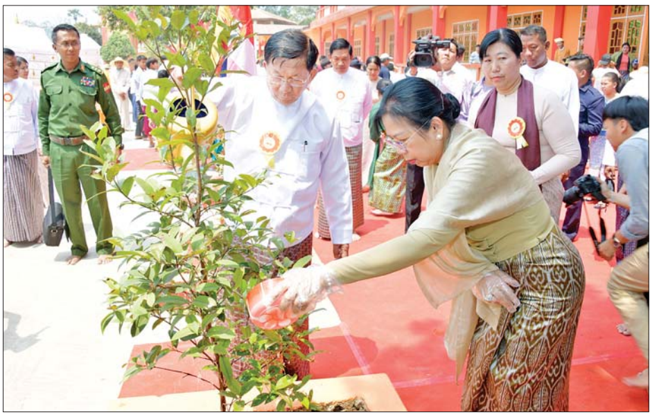
နိုင်ငံတော်စီမံအုပ်ချုပ်ရေးကောင်စီဥက္ကဋ္ဌ နိုင်ငံတော်ဝန်ကြီးချုပ် ဗိုလ်ချုပ်မှူးကြီး မင်းအောင်လှိုင်နှင့် ဇနီးဒေါ်ကြူကြူလှတို့ သီရိမင်္ဂလာဓမ္မရတနာ သုံးထပ်ကျောင်းဆောင်သစ်ဖွင့်ပွဲနှင့် စူဠာမုနိစေတီတော်မြတ်အား ရွှေထီးတော်၊ ငှက်မြတ်နားတော်၊ ရတနာစိန်ဖူးတော် တင်လှူပူဇော်ပွဲ မဟာမင်္ဂလာအခမ်းအနား အောင်မြင်ခြင်းအထိမ်းအမှတ်အဖြစ် သပြေပင်ကို အမှတ်တရစိုက်ပျိုးပေးစဉ်။