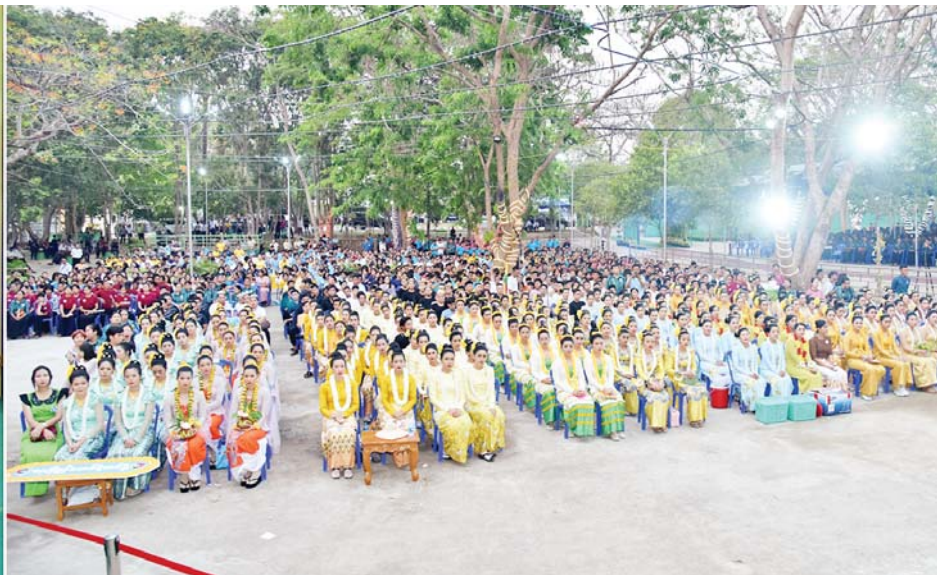
နိုင်ငံတော်စီမံအုပ်ချုပ်ရေးကောင်စီအဖွဲ့ဝင် ဒုတိယဝန်ကြီးချုပ်နှင့် ပြည်ထောင်စုဝန်ကြီး ဒုတိယဗိုလ်ချုပ်ကြီး စိုးထွဋ် ပြည်ထဲရေးဝန်ကြီးဌာနမှ သွားစု မြန်မာ့ရိုးရာသင်္ကြန်ပွဲတော် ယိမ်းအကအဖွဲ့၊ Dancer အကအဖွဲ့ ပြိုင်ပွဲနှင့် ဆုချီးမြှင့်ခြင်းအခမ်းအနားတွင် အမှာစကားပြောကြားစဉ်။

အကအဖွဲ့များ စုံညီစွာ တက်ရောက်ကြပြီး ပျော်ရွှင်စွာ ပါဝင်ဆင်နွှဲကြသည်။ အခမ်းအနားတွင် ဒုတိယဝန်ကြီးချုပ်နှင့် ပြည်ထောင်စုဝန်ကြီးက ရှေးဦးစွာ ဖွင့်လှစ်အမှာစကားပြောကြားပြီး ဒုတိယဝန်ကြီးချုပ်နှင့် ပြည်ထောင်စု