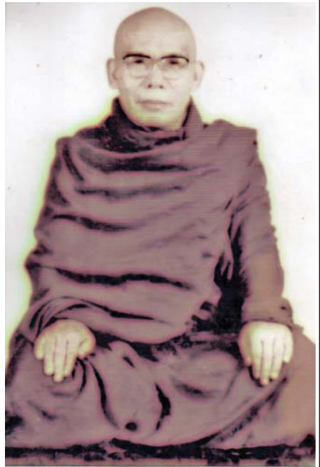
ဘဝနတ်ထံပျံလွန်တော်မူခြင်း ဆရာတော်ကြီးသည်သာသနာတော်အကျိုးကို သယ်ပိုးဆောင်ရွက်တော်မူရင်း သက်တော် ၉၃ နှစ်၊ သိက္ခာတော် ၇၃ ဝါအရ ၁၃၈၄ ခုနှစ် နှောင်းတန်ခူးလပြည့်ကျော် ၄ ရက် (၈-၄-၂၀၂၃) စနေနေ့ နံနက် (၅:၂၅)နာရီအချိန်တွင် ဘဝနတ်ထံ ပျံလွန်တော်မူကြောင်း သာသနာရေးဦးစီးဌာနမှ သိရသည်။ သတင်းစဉ်

ဖွားမြင်တော်မူခြင်း ဆရာတော်လောင်းလျာသည် မကွေးတိုင်း ဒေသကြီး မကွေးမြို့နယ် ထန်းပင်စမ်းရွာတွင် ခမည်းတော်ဦးချစ်ဖျော်+ မယ်တော်ဒေါ်ငွေရှင်တို့မှ ၁၂၉၂ ခုနှစ်ကဆုန်လဆန်း ၅ ရက်ကြာသပတေးနေ့ တွင် ဖွားမြင်တော်မူသော သားရတနာဖြစ်ပါသည်။ ရှင်ရဟန်းပြုတော်မူခြင်း ဆရာတော်လောင်းလျာသည် ၁၃၀၆ ခုနှစ် ပြာသိုလဆန်း ၁၁ ရက် တနင်္လာနေ့တွင် မကွေး မြို့နယ် ထန်းပင်စမ်းကျေးရွာ ထန်းပင်စမ်းကျောင်း ဆရာတော် ဘဒ္ဒန္တပဏ္ဍိတကို ဥပဇ္ဈာယ်ပြု၍ မိဘ နှစ်ပါးတို့၏ ပစ္စယာနုဂ္ဂဟကိုခံယူကာ ရှင်သာမဏေ အဖြစ်သို့ ရောက်ရှိခဲ့ပြီး ၁၃၁၁ ခုနှစ် နတ်တော် လပြည့်ကျော် ၂ ရက် အင်္ဂါနေ့တွင် မကွေးမြို့နယ် ထန်းပင်စမ်းကျေးရွာ ထန်းပင်စမ်းကျောင်း ဆရာတော်ဘဒ္ဒန္တပဏ္ဍိတကို ဥပဇ္ဈာယ်ပြု၍ မိဘနှစ်ပါး တို့၏ ပစ္စယာနုဂ္ဂဟကိုခံယူကာ မြင့်မြတ်သော ရဟန်းအဖြစ်သို့ ရောက်ရှိတော်မူခဲ့ပါသည်။ ပရိယတ္တိစာပေ သင်ယူဆည်းပူးတော်မူခြင်း ဆရာတော်လောင်းလျာသည် မကွေးမြို့နယ်