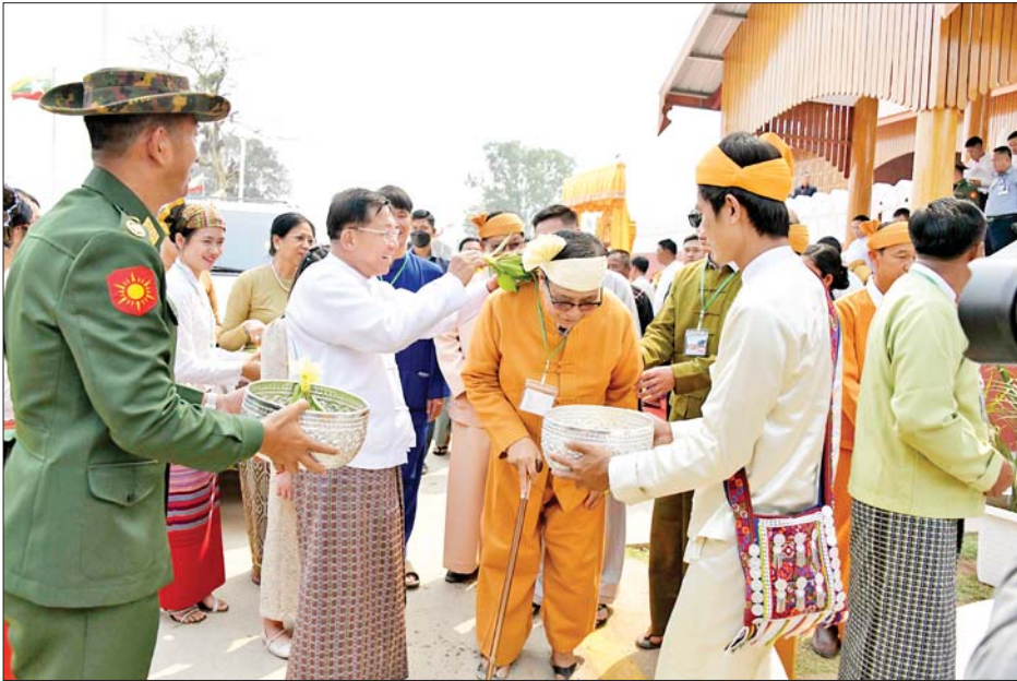
နိုင်ငံတော်စီမံအုပ်ချုပ်ရေးကောင်စီဥက္ကဋ္ဌ နိုင်ငံတော်ဝန်ကြီးချုပ် ဗိုလ်ချုပ်မှူးကြီးမင်းအောင်လှိုင်၊ ဇနီးဒေါ်ကြူကြူလှနှင့် အဖွဲ့ဝင်များ ဒေသခံတိုင်းရင်းသားပြည်သူများကို မြန်မာ့ရိုးရာအတာသင်္ကြန်ရေများ ပက်ဖျန်း၍ နှစ်သစ်ကိုအတူတကွ ရင်းနှီးနှေးထွေးစွာကြိုဆိုကြစဉ်။