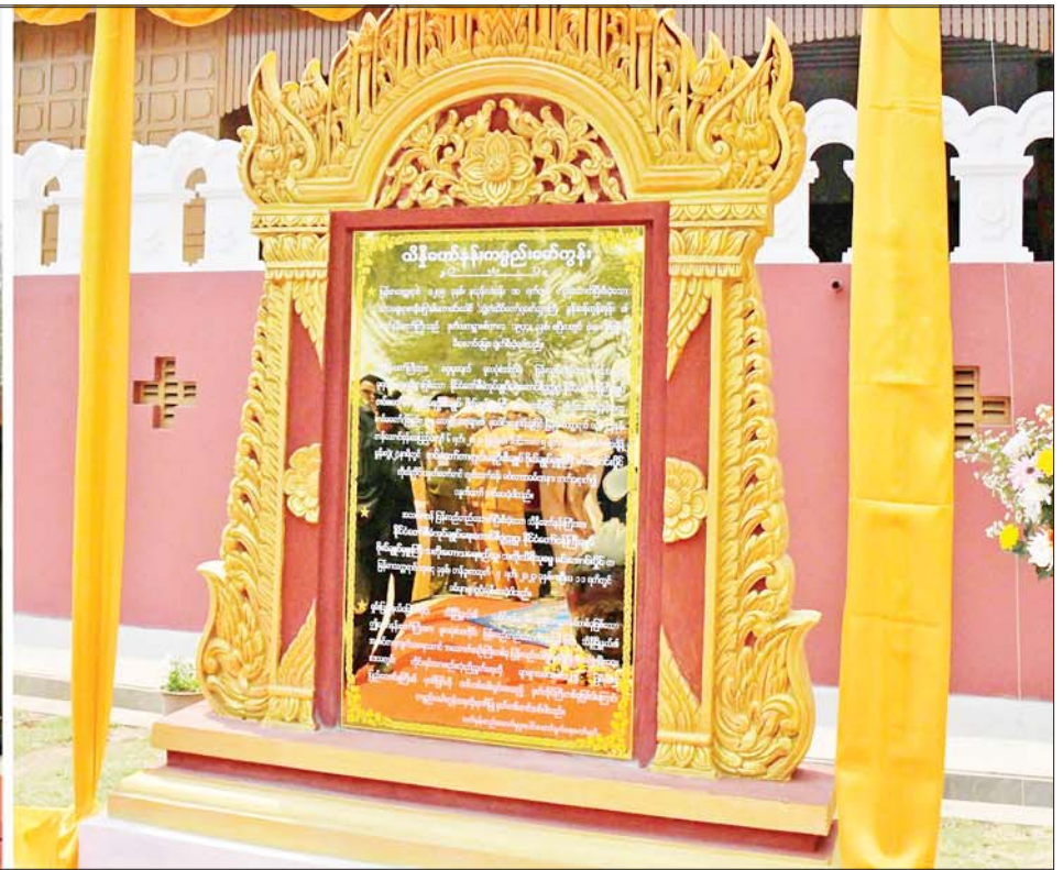
နိုင်ငံတော်စီမံအုပ်ချုပ်ရေးကောင်စီဥက္ကဋ္ဌ နိုင်ငံတော်ဝန်ကြီးချုပ် ဗိုလ်ချုပ်မှူးကြီး မင်းအောင်လှိုင် သိန္နီဟော်နန်းယဉ်ကျေးမှုပြတိုက် ကမ္ဘာ့မော်ကွန်းကို စက်ခလုတ်နှိပ် ဖွင့်လှစ်ပေးစဉ်။