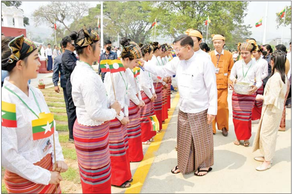
နိုင်ငံတော်စီမံအုပ်ချုပ်ရေးကောင်စီဥက္ကဋ္ဌ နိုင်ငံတော်ဝန်ကြီးချုပ် ဗိုလ်ချုပ်မှူးကြီးမင်းအောင်လှိုင်၊ ဇနီးဒေါ်ကြူကြူလှနှင့် အဖွဲ့ဝင်များ ဒေသခံတိုင်းရင်းသားပြည်သူများကို မြန်မာ့ရိုးရာအတာသင်္ကြန်ရေများ ပက်ဖျန်း၍ နှစ်သစ်ကိုအတူတကွ ရင်းနှီးနှေးထွေးစွာကြိုဆိုကြစဉ်။

☆ စာမျက်နှာ ၄ မှ ယင်းနောက် နိုင်ငံတော်စီမံအုပ်ချုပ်ရေးကောင်စီ အဖွဲ့ဝင်ဒေါက်တာကျော်ထွန်း၊ ရှမ်းပြည်နယ်ဝန်ကြီးချုပ်ဦးအောင်ဇော်အေး၊ စစ်တော်ချုပ် ဒုတိယဗိုလ်ချုပ်ကြီးကျော်စွာလင်း၊ အရှေ့မြောက်တိုင်းစစ်ဌာနချုပ် တိုင်းမှူးဗိုလ်ချုပ်နိုင်နိုင်ဦး၊ သိန္နီမြို့နယ်ရှမ်းစာပေနှင့် ယဉ်ကျေးမှုအဖွဲ့ဥက္ကဋ္ဌ ဦးစိုင်းမြင့်ထွန်း၊ မြို့မိမြို့မများဖြစ်ကြသည့် ဦးစိုင်းစံညွန့်နှင့် ဦးစိုင်းခိုင်ဝင်းတို့က သိန္နီဟော်နန်းယဉ်ကျေးမှုပြတိုက်ကို ဖဲကြိုးဖြတ်ဖွင့်လှစ်ပေးကြသည်။ ထို့နောက် နိုင်ငံတော်စီမံအုပ်ချုပ်ရေးကောင်စီ ဥက္ကဋ္ဌ နိုင်ငံတော်ဝန်ကြီးချုပ် ဗိုလ်ချုပ်မှူးကြီး မင်းအောင်လှိုင်က သိန္နီဟော်နန်းယဉ်ကျေးမှုပြတိုက်ကမ္ဘာ့အမွေအနှစ်အဖြစ် နှစ်သစ်လှည့်ပေးပြီး အမွေအနှစ်အဖြစ် ရည်ရွယ်ချက် ပက်ဖျန်းပေးသည်။ ၎င်းနောက် နိုင်ငံတော်စီမံအုပ်ချုပ်ရေးကောင်စီ ဥက္ကဋ္ဌ နိုင်ငံတော်ဝန်ကြီးချုပ်သည် အခမ်းအနား တက်ရောက်လာကြ