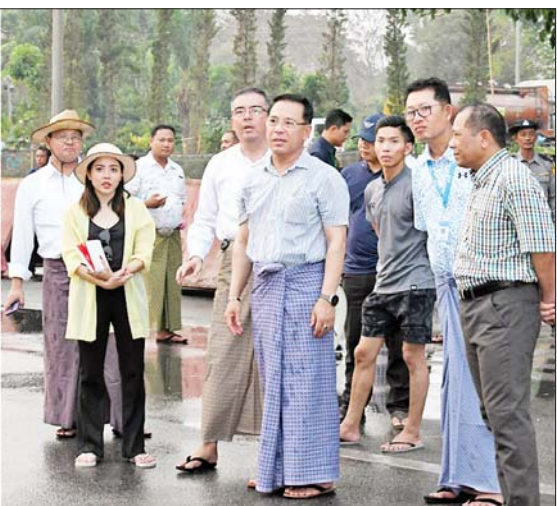
ပြည်ထောင်စုဝန်ကြီး ဦးမောင်မောင်အုန်းနှင့် တာဝန်ရှိသူများ နေပြည်တော်လမ်းလျှောက်သင်္ကြန်တွင် ဝန်ကြီးဌာနကိုယ်စားပြု ယိမ်းအကအဖွဲ့များ အစမ်းလေ့ကျင့်ကပြဖျော်ဖြေမှုများကို ကြည့်ရှုစစ်ဆေးစဉ်။

လုံခြုံရေးကျိုးပေါက်မှု မရှိစေရေး ဆောင်ရွက်ထားရှိမှု အခြေအနေ များကို ကြည့်ရှုစစ်ဆေးသည်။ ကြည့်ရှုစစ်ဆေး ယင်းနောက် ဗဟိုမဏ္ဍပ်၌ ဖျော်ဖြေကြမည့် ဝန်ကြီးဌာန ယိမ်းအဖွဲ့များ၏ အစမ်းလေ့ကျင့် ကပြဖျော်ဖြေမှုများ၊ တေးသီချင်း သီဆိုဖျော်ဖြေနေမှုများ၊ အစမ်း လေ့ကျင့် ရေပက်ကစားနေမှုများ ကို ကြည့်ရှုစစ်ဆေးပြီး မီးဘေး အန္တရာယ် မဖြစ်ပေါ်စေရေးနှင့် ရေပြတ်တောက်မှု မရှိစေရေး စနစ်တကျ ဆောင်ရွက်ထားရှိရန် မှာကြားခဲ့သည်။ သတင်းစဉ်