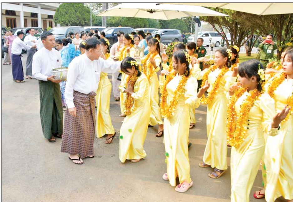
နိုင်ငံတော်စီမံအုပ်ချုပ်ရေးကောင်စီဥက္ကဋ္ဌ နိုင်ငံတော်ဝန်ကြီးချုပ် ဗိုလ်ချုပ်မှူးကြီး မင်းအောင်လှိုင် အရှေ့မြောက်တိုင်းစစ်ဌာနချုပ်မှ အရာရှိ၊ စစ်သည်၊ မိသားစုများကို မြန်မာ့ရိုးရာ အတာသင်္ကြန်ရေများ ပက်ဖျန်းစဉ်။