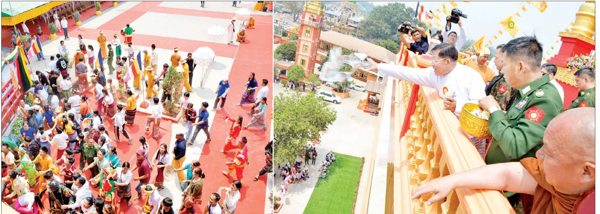
နိုင်ငံတော်စီမံအုပ်ချုပ်ရေးကောင်စီဥက္ကဋ္ဌ နိုင်ငံတော်ဝန်ကြီးချုပ် ဗိုလ်ချုပ်မှူးကြီး မင်းအောင်လှိုင် ရတနာစိန်ဖူးတော်၊ ငှက်မြတ်နားတော် တင်လှူပူဇော်အောင်မြင်ခြင်းအထိမ်းအမှတ်အဖြစ် ရတနာ ရွှေမိုး၊ ငွေမိုးများ ရွာသွန်းဖြိုးကြစဉ်။

❖ စာမျက်နှာ ၇ မှ ယင်းနောက် နိုင်ငံတော်စီမံ အုပ်ချုပ်ရေးကောင်စီဥက္ကဋ္ဌ နိုင်ငံ တော် ဝန်ကြီးချုပ်နှင့် အဖွဲ့ဝင်များ သည် လားရှိုးလေယာဉ်ကွင်း အဆင့်မြှင့်တင် ဆောင်ရွက်နေမှု ကို သွားရောက်ကြည့်ရှုစစ်ဆေး ခဲ့ပြီး တာဝန်ရှိသူများ၏ တင်ပြ ချက်များအပေါ် စီမံကိန်းလုပ်ငန်း