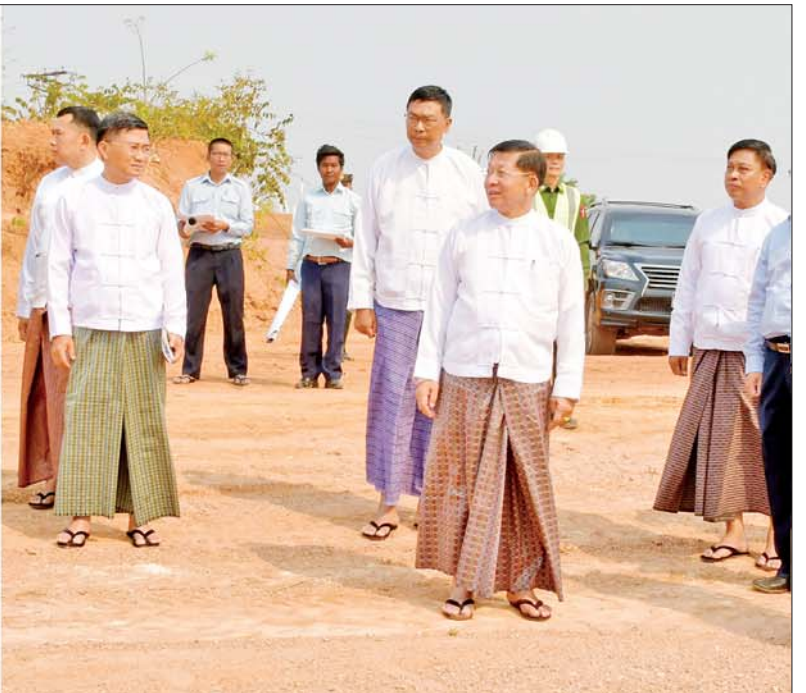
နိုင်ငံတော်စီမံအုပ်ချုပ်ရေးကောင်စီဥက္ကဋ္ဌ နိုင်ငံတော်ဝန်ကြီးချုပ် ဗိုလ်ချုပ်မှူးကြီး မင်းအောင်လှိုင် လားရှိုးလေဆိပ် လေယာဉ်ပြေးလမ်း အဆင့်မြှင့်တင် တိုးချဲ့ဆောင်ရွက်နေမှုကို ကြည့်ရှုစစ်ဆေးစဉ်။