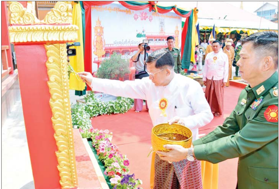
နိုင်ငံတော်စီမံအုပ်ချုပ်ရေးကောင်စီဥက္ကဋ္ဌ နိုင်ငံတော်ဝန်ကြီးချုပ် ဗိုလ်ချုပ်မှူးကြီး မင်းအောင်လှိုင် သီရိမင်္ဂလာဓမ္မရတနာ သုံးထပ်ကျောင်းဆောင်သစ် ကမ္မည်းမော်ကွန်းကို အမွှေးနံ့သာရည်များဖြင့် ပက်ဖျန်းပေးစဉ်။

နိုင်ငံတော် စီမံအုပ်ချုပ်ရေးကောင်စီဥက္ကဋ္ဌ နိုင်ငံတော်ဝန်ကြီးချုပ် ဗိုလ်ချုပ်မှူးကြီး မင်းအောင်လှိုင်နှင့် ဇနီးဒေါ်ကြူကြူလှ၊ မိသားစုဝင်များ၊ အခမ်းအနား တက်ရောက်လာကြသူများ သီရိမင်္ဂလာဓမ္မရတနာ သုံးထပ် ကျောင်းဆောင်သစ် အထွတ်၌ တည်ထားပူဇော်အပ်သည့် စူဠာမုနိစေတီတော်မြတ်၏အထွတ်၌ တင်လှူပူဇော်မည့် ရွှေထီးတော်၊ ငှက်မြတ်နားတော်၊ ရတနာစိန်ဖူးတော်နှင့် ဌာပနာသွင်းလှူ ပူဇော်မည့် ဓာတ်တော်၊ မွေတော်များကို ဓမ္မာရုံတော်အတွင်းမှ မင်္ဂလာဝေါယာဉ်တော်ဖြင့် ပင့်ဆောင်ကြပြီး မင်္ဂလာရထားပျံတော်ထက်သို့ ပင့်ဆောင်ပူဇော်စဉ်။