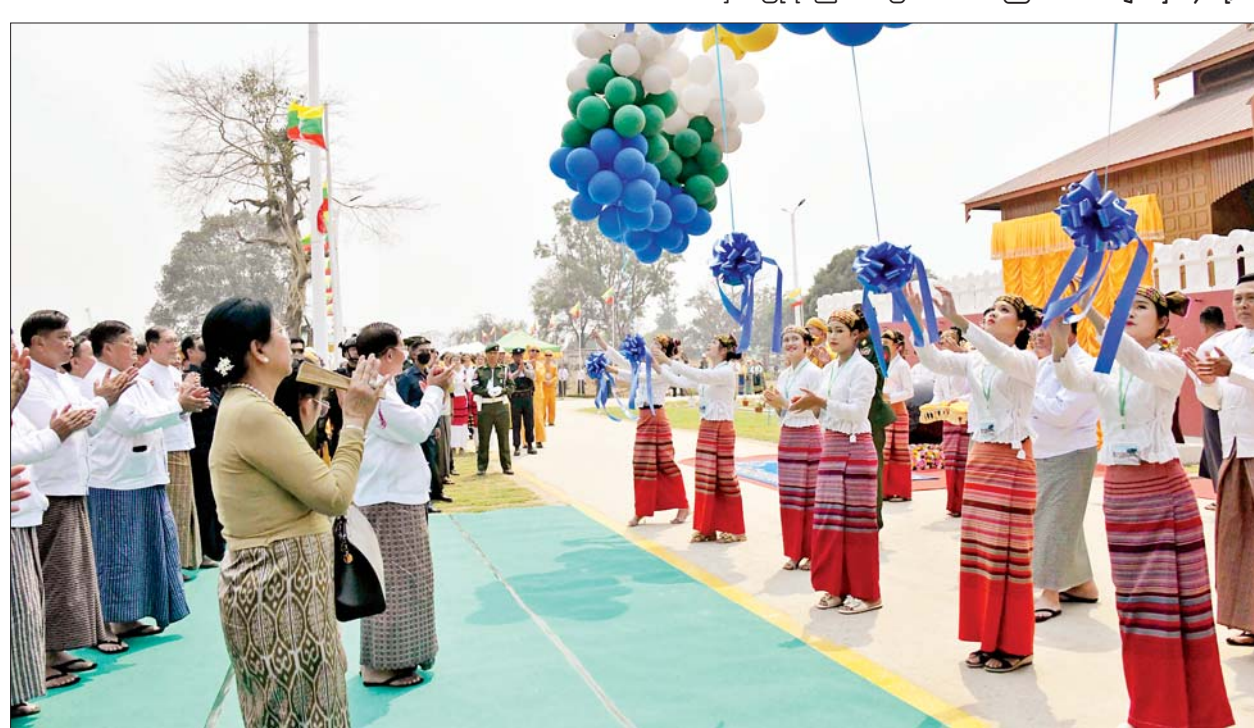
နိုင်ငံတော်စီမံအုပ်ချုပ်ရေးကောင်စီအဖွဲ့ဝင် ဒေါက်တာကျော်ထွန်း၊ ရှမ်းပြည်နယ်ဝန်ကြီးချုပ် ဦးအောင်ဇော်အေး၊ စစ်ထောက်ချုပ် ဒုတိယဗိုလ်ချုပ်ကြီး ကျော်စွာလင်း၊ အရှေ့မြောက်တိုင်းစစ်ဌာနချုပ် တိုင်းမှူး ဗိုလ်ချုပ် နိုင်နိုင်ဦး၊ သိန္နီမြို့နယ် ရှမ်းစာပေနှင့် ယဉ်ကျေးမှုအဖွဲ့ဥက္ကဋ္ဌ ဦးစိုင်းမြင့်ထွန်း၊ မြို့မိမြို့ဖများဖြစ်ကြသည့် ဦးစိုင်းစံညွန့်နှင့် ဦးစိုင်းခိုင်ဝင်းတို့ သိန္နီဟော်နန်းယဉ်ကျေးမှုပြတိုက်ကို ဖဲကြိုးဖြတ်ဖွင့်လှစ်ပေးကြစဉ်။

၁၄ ခုအနက် အကြီးမားအကျယ် ပြန်ဆုံးသော ပြည်နယ်ကြီးတစ်ခု ဖြစ်ပါကြောင်း၊ တိုင်းရင်းသား လူမျိုးပေါင်းစုံလင်စွာ မှီတင်းနေထိုင်ကြသည့် ထူးခြားသော ဝိသေသများရှိသည့် ပြည်နယ်ကြီး တစ်ခုလည်း ဖြစ်ပါကြောင်း၊ ရှမ်းပြည်နယ်၏ ဖြစ်စဉ်သမိုင်းကြောင်းကို အနည်းငယ် ပြန်ပြောင်း ပြောရမည်ဆိုပါက ရှေးမြန်မာမင်းများ အဆက်ဆက်ကတည်းက ရှမ်းတောင်တန်းဒေသရှိ ပဒေသရာဇ်စော်ဘွားများသည် မြန်မာမင်းများ၏ သစ္စာတော်ကို စောင့်သိနာခံ၍ နိုင်ငံတော်၏ အကျိုးနှင့် နိုင်ငံတော်ကာကွယ်ရေး ကိစ္စရပ်များတွင် တက်ကြွစွာ ပူးပေါင်း ပါဝင်ဆောင်ရွက်ခဲ့ကြသည့် သာဓကများရှိခဲ့ပါကြောင်း။