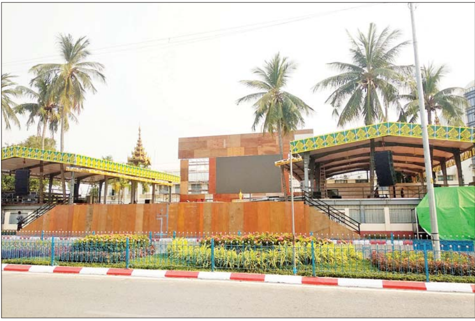
မန္တလေးမြို့တော်ဝန် မဟာသင်္ကြန်ဗဟိုမဏ္ဍပ်ပြင်ဆင်ဆောင်ရွက်ထားမှုကို တွေ့ရစဉ်။