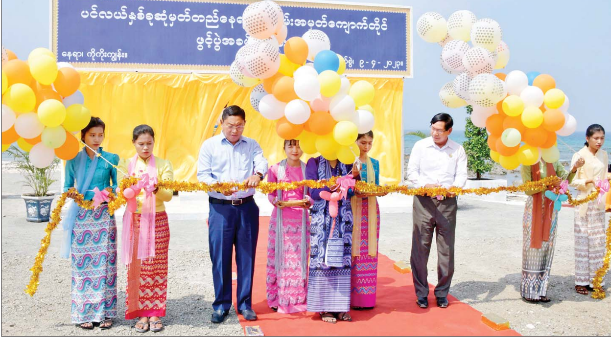
ရန်ကုန်တိုင်းဒေသကြီးဝန်ကြီးချုပ် ဦးစိုးသိန်းနှင့် ကာကွယ်ရေးဦးစီးချုပ်(ရေ) ဗိုလ်ချုပ်ကြီး မိုးအောင် တို့က ကပ္ပလီပင်လယ်ပြင်နှင့် ဘင်္ဂလားပင်လယ်အော် ပင်လယ်နှစ်ခုဆုံမှတ်တည်နေရာ အောင်မြေအထိမ်းအမှတ်ကျောက်တိုင်ဖွင့်ပွဲအခမ်းအနားကို ဖဲကြိုးဖြတ်ဖွင့်လှစ်ပေးကြစဉ်။

ခရီးစဉ်တွင် ကပ္ပလီပင်လယ်ပြင် (Andaman Sea) နှင့် ဘင်္ဂလားပင်လယ်အော် (Bay of Bengal) ဆုံမှတ်နေရာ (Victorious Point) တွင် အထိမ်းအမှတ်ကျောက်တိုင်တစ်ခုကို စိုက်ထူရန် လမ်းညွှန်ချက်အရ ယခုကဲ့သို့ အောင်မြေအထိမ်းအမှတ် ကျောက်တိုင်ကို စိုက်ထူခဲ့ခြင်း ဖြစ်ကြောင်း၊ ဘင်္ဂလား ပင်လယ်အော်သည် အိန္ဒိယသမုဒ္ဒရာ၏ အစိတ်အပိုင်းတစ်ခုဖြစ်သော အရှေ့မြောက်ဘက်ပိုင်း ရေပြင်ဖြစ်ကာ အနောက်နှင့် အနောက်မြောက်ဘက်တွင် အိန္ဒိယနိုင်ငံ၊ အရှေ့ဘက်တွင် မြန်မာနိုင်ငံ၊ တောင်ဘက်တွင် အင်ဒိုနီးရှားနှင့် နီကိုဘားကျွန်းတို့ တည်ရှိကြောင်း၊ ဘင်္ဂလားပင်လယ်အော်သည် ကမ္ဘာပေါ်ရှိ ပင်လယ်အော်များအနက် ရေပြင်အကျယ်ဆုံး ပင်လယ်အော်ဖြစ်ကြောင်း၊ ကပ္ပလီပင်လယ်ပြင် (Andaman Sea) သည် အိန္ဒိယသမုဒ္ဒရာ၏ အရှေ့မြောက်အစွန်အဖျားအကျဆုံး ရေပြင်ဖြစ်ကာ အရှေ့ဘက်တွင် မုတ္တမပင်လယ်ကွေ့တစ်လျှောက်ရှိ မြန်မာနိုင်ငံကမ်းရိုးတန်း၊ ထိုင်းနိုင်ငံ ကမ်းရိုးတန်းနှင့် မလေးကျွန်းဆွယ်၊ အနောက်ဘက်တွင် အင်ဒိုနီးရှားနှင့် စာမျက်နှာ ၄ သို့ >>>