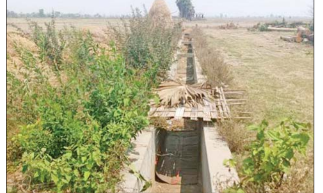
စီမူလေးကျေးရွာ ဘုန်းကြီးကျောင်းအတွင်း သဲအိတ်များကာရံ၍ KIA/PDF အကြမ်းဖက်သမားများက စစ်စခန်းပြုလုပ်ထားသည်ကို တွေ့ရစဉ်။