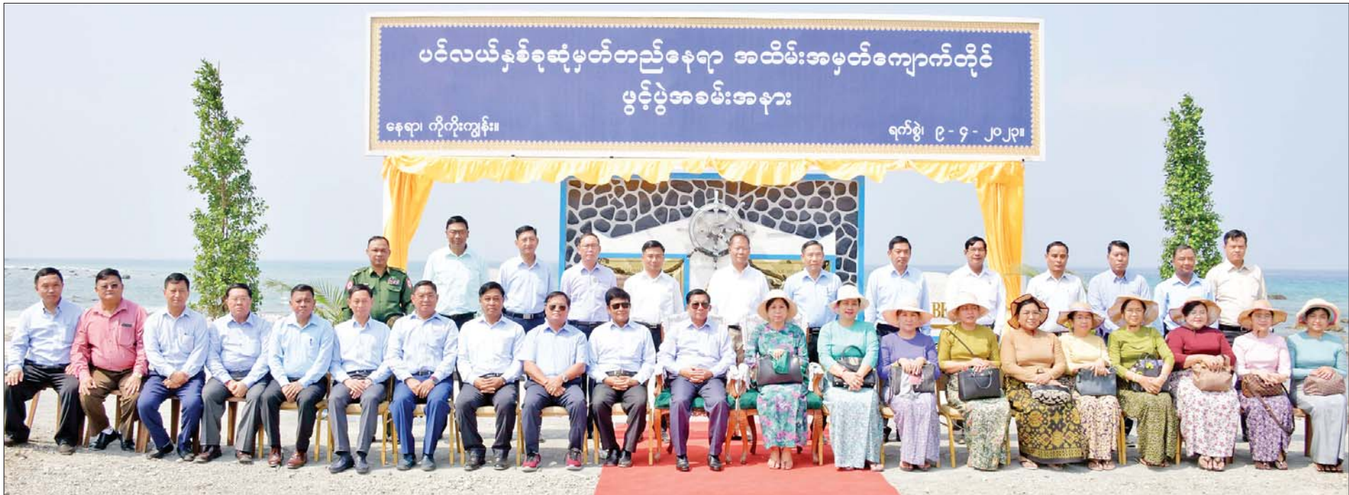
နိုင်ငံတော်စီမံအုပ်ချုပ်ရေးကောင်စီဥက္ကဋ္ဌ နိုင်ငံတော်ဝန်ကြီးချုပ် ဗိုလ်ချုပ်မှူးကြီးမင်းအောင်လှိုင်နှင့်ဇနီး ဒေါ်ကြူကြူလှ၊ အဖွဲ့ဝင်များ ကပ္ပလီပင်လယ်ပြင်နှင့် ဘင်္ဂလားပင်လယ်အော်ပင်လယ်နှစ်ခုဆုံမှတ် တည်နေရာ အောင်မြင်အထိမ်းအမှတ်ကျောက်တိုင်ပွင့်ပွဲအခမ်းအနားတွင် စုပေါင်းမှတ်တမ်းတင်ဓာတ်ပုံရိုက်စဉ်။