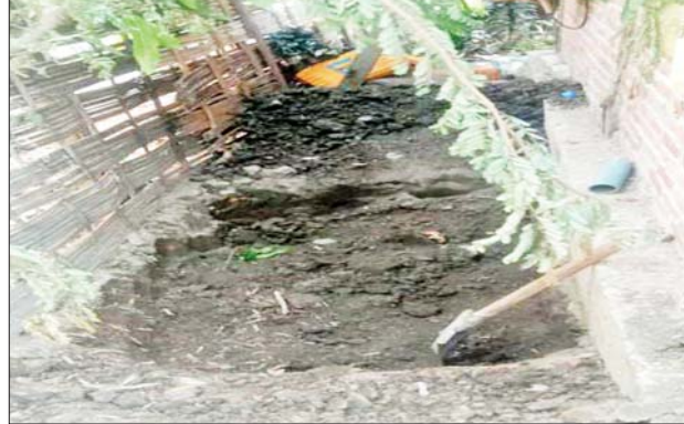
KIA/PDF အကြမ်းဖက်သမားများက ကွန်ကရစ်ရေသွယ်မြောင်းများအား ဆက်သွယ်ရေးမြောင်းများပြုလုပ်၍ ပစ်ကျင်းများပြုလုပ်ထားမှုကို တွေ့ရစဉ်။