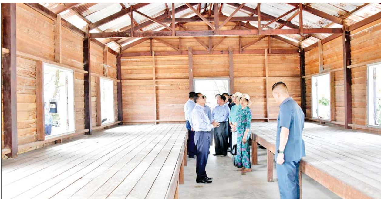
နိုင်ငံတော်စီမံအုပ်ချုပ်ရေးကောင်စီဥက္ကဋ္ဌ နိုင်ငံတော်ဝန်ကြီးချုပ် ဗိုလ်ချုပ်မှူးကြီးမင်းအောင်လှိုင်နှင့်ဇနီး ဒေါ်ကြူကြူလှ၊ အဖွဲ့ဝင်များ ကိုကိုးကျွန်းမြို့ရှိ အကျဉ်းစခန်းဟောင်းနေရာနှင့် အဆောက်အအုံများအား မူလပုံစံအတိုင်း ပြန်လည်ပြုပြင်ဆောင်ရွက်ထားရှိမှုများကို ကြည့်ရှုစစ်ဆေးစဉ်။

ဖောက်လုပ်နေမှုအား ကြည့်ရှု စစ်ဆေးပြီး တာဝန်ရှိသူများ၏ တင်ပြချက်များအပေါ် လိုအပ် သည်များ လမ်းညွှန်မှာကြား သည်။ ယင်းနောက် နိုင်ငံတော် စီမံအုပ်ချုပ်ရေးကောင်စီဥက္ကဋ္ဌ နိုင်ငံတော်ဝန်ကြီးချုပ်နှင့် ဇနီး၊ အဖွဲ့ဝင်များသည် ကိုကိုးကျွန်းမြို့ ရှိ အကျဉ်းစခန်းဟောင်းနေရာနှင့် အဆောက်အအုံများအား မူလပုံစံ အတိုင်း ပြန်လည်ပြုပြင်ဆောင်ရွက် ထားရှိမှုများကို ကြည့်ရှုစစ်ဆေး သည်။ ဗီဒီယိုဖိုင်ကို ကြည့်ရှု ထို့နောက် နိုင်ငံတော် စီမံအုပ်ချုပ်ရေးကောင်စီ ဥက္ကဋ္ဌ နိုင်ငံတော်ဝန်ကြီးချုပ်နှင့် အဖွဲ့ဝင် များသည် နယ်မြေခံရေတပ်စခန်း ဌာနချုပ် အစည်းအဝေးခန်းမတွင် မြန်မာနိုင်ငံ ပင်လယ်ပြင်အတွင်း ရိုက်ကူးထားသည့် ရေအောက် သဘာဝရှုခင်းများနှင့် ရေနေ သတ္တဝါများကို မှတ်တမ်းတင် သုတေသနပြု ရိုက်ကူးထားသည့် Documentary ဗီဒီယိုဖိုင်ကို ကြည့်ရှုကြရာ တာဝန်ရှိသူတစ်ဦး က ရှင်းလင်း တင်ပြမှုများအပေါ် နိုင်ငံတော်စီမံအုပ်ချုပ်ရေးကောင်စီ