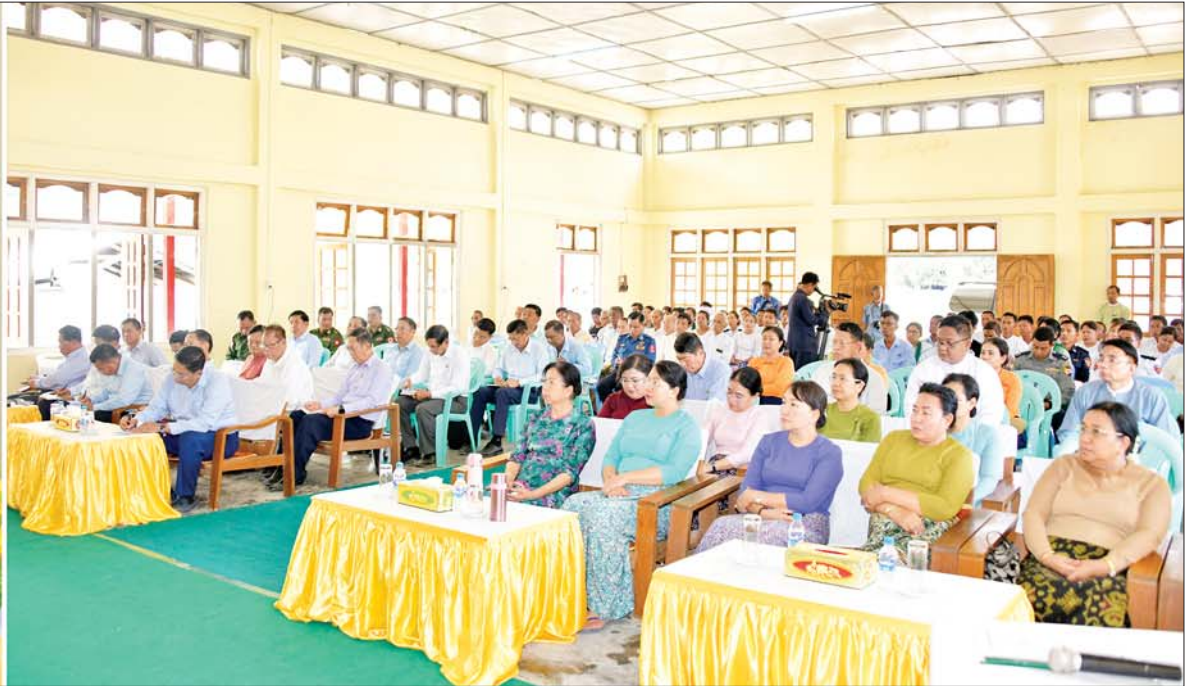
နိုင်ငံတော်စီမံအုပ်ချုပ်ရေးကောင်စီဥက္ကဋ္ဌ နိုင်ငံတော်ဝန်ကြီးချုပ် ဗိုလ်ချုပ်မှူးကြီးမင်းအောင်လှိုင် ကိုကိုးကျွန်းမြို့နယ်ရှိ ဌာနဆိုင်ရာဝန်ထမ်းများနှင့် ရပ်မိရပ်ဖများအား ရင်းရင်းနှီးနှီး တွေ့ဆုံအမှာစကား ပြောကြားစဉ်။

နေပြည်တော် ဧပြီ ၉ နိုင်ငံတော် စီမံအုပ်ချုပ်ရေး ကောင်စီဥက္ကဋ္ဌ နိုင်ငံတော်ဝန်ကြီး ချုပ်ဗိုလ်ချုပ်မှူးကြီးမင်းအောင်လှိုင် သည် ဇနီး ဒေါ်ကြူကြူလှ၊ ကောင်စီ တွဲဖက်အတွင်းရေးမှူး ဒုတိယ ဗိုလ်ချုပ်ကြီးရဲဝင်းဦးနှင့် ဇနီး၊ ကောင်စီဝင်များ၊ ပြည်ထောင်စု ဝန်ကြီးများ၊ ရန်ကုန်တိုင်း ဒေသကြီးဝန်ကြီးချုပ် ဦးစိုးသိန်း၊ ကာကွယ်ရေး ဦးစီးချုပ်ရုံးမှ တပ်မတော် အရာရှိကြီးများ၊ ရန်ကုန်တိုင်းစစ်ဌာနချုပ်တိုင်းမှူး ဗိုလ်ချုပ်ဇော်ဟိန်းနှင့် တာဝန်ရှိသူ များလိုက်ပါ၍ ယနေ့နံနက်ပိုင်း တွင် ရန်ကုန်တိုင်းဒေသကြီး ကိုကိုးကျွန်းမြို့နယ်ရှိ ဌာနဆိုင်ရာ ဝန်ထမ်းများ၊ ဒေသခံပြည်သူများ နှင့် ရပ်မိရပ်ဖများအား မြို့တော် ခန်းမ၌ တွေ့ဆုံသည်။ ဦးစွာ ကိုကိုးကျွန်းမြို့နယ်ရှိ ဌာနဆိုင်ရာများနှင့် ရပ်မိရပ်ဖများ