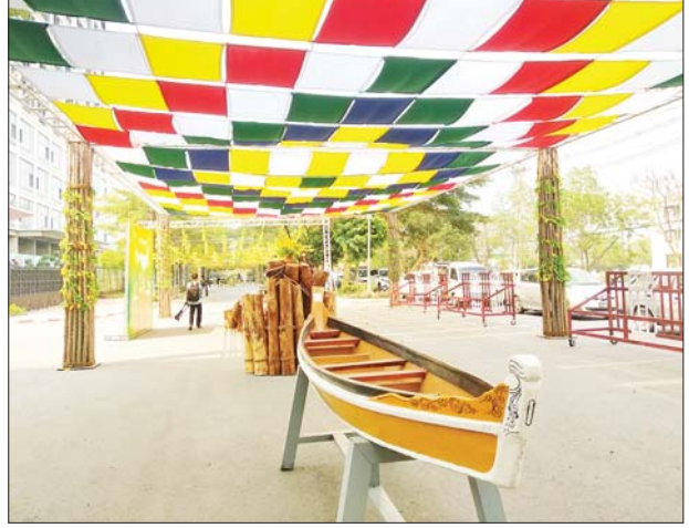
မင်္ဂလာမန္တလေး မြန်မာ့ရိုးရာလမ်းလျှောက် အတာသင်္ကြန်ကျင်းပရန် ပြင်ဆင်ဆောင်ရွက်နေမှုကို တွေ့ရစဉ်။

ရမည့် မုန့်များ၊ အအေးများ ကျွေးမွေးသွားမည်ဖြစ်ကြောင်း၊ ဖျော်ဖြေရေးများအနေဖြင့် နေ့စဉ်နံနက် ၉ နာရီမှ မွန်းတည့် ၁၂ နာရီတစ်ကြိမ်နှင့် မွန်းလွဲ ၃ နာရီမှ ၆ နာရီအထိ တစ်ကြိမ်စီစဉ်ထားပြီး နိုင်ငံကျော်အဆိုတော်များနှင့် အနုပညာရှင်များစွာကိုလည်း ဖိတ်ကြားထားကြောင်း New Starlight Group of Companies မှ Business Development