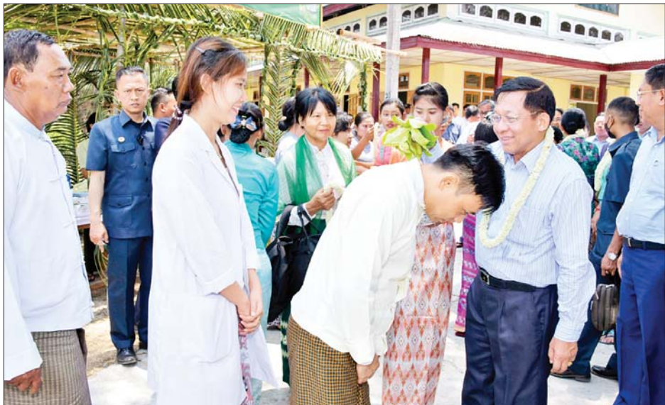
နိုင်ငံတော်စီမံအုပ်ချုပ်ရေးကောင်စီဥက္ကဋ္ဌ နိုင်ငံတော်ဝန်ကြီးချုပ် ဗိုလ်ချုပ်မှူးကြီးမင်းအောင်လှိုင် ကိုကိုးကျွန်းမြို့နယ်ရှိ ဌာနဆိုင်ရာဝန်ထမ်းများနှင့် ရပ်မိရပ်ဖများ၊ ဒေသခံပြည်သူများအား မြန်မာ့ရိုးရာ အတာသင်္ကြန်နေရာများဖြင့် ပတ်ဖျန်း၍ နှစ်သစ်ကို အတူတကွရင်းနှီးနှေးထွေးစွာ ပျော်ပျော်ရွှင်ရွှင်ကြိုဆိုစဉ်။

မိမိအနေဖြင့် ကိုကိုးကျွန်းသို့ ပထမဆုံးအကြိမ် ရောက်ရှိသည့် အချိန်ကတည်းကပင် ကိုကိုးကျွန်း ဖွံ့ဖြိုး တိုးတက်ရေးအတွက် တတ်စွမ်းသရွေ့ကူညီဆောင်ရွက် ပေးမည်ဟု ပြောကြားခဲ့ပြီး ဒေသ ဖွံ့ဖြိုး တိုးတက်ရေးအတွက် များစွာ ကူညီဆောင်ရွက်ပေးခဲ့ ကြောင်း၊ ယနေ့တွင်လည်း ကပ္ပလီ ပင်လယ်ပြင် (Andaman Sea) နှင့် ဘင်္ဂလားပင်လယ်အော် (Bay of Bengal) ပင်လယ်နှစ်ခု ဆုံမှတ် တည်နေရာတွင် အောင်မြေအထိမ်း အမှတ်ကျောက်တိုင်ကို စိုက်ထူ ခဲ့ကြောင်း၊ ယခုကဲ့သို့ ပင်လယ် နှစ်ခုဆုံမှတ်တည်နေရာအပါအဝင် ကိုကိုးကျွန်းဒေသသည် သဘာဝ အလှအပများ များစွာတည်ရှိနေ သည့်အတွက် ခရီးသွားလုပ်ငန်း ဖွံ့ဖြိုးတိုးတက်ရေးအတွက်လည်း ကြိုးပမ်း ဆောင်ရွက်နေမှုများရှိ ကြောင်း၊ ဒေသဖွံ့ဖြိုးတိုးတက်ရေး