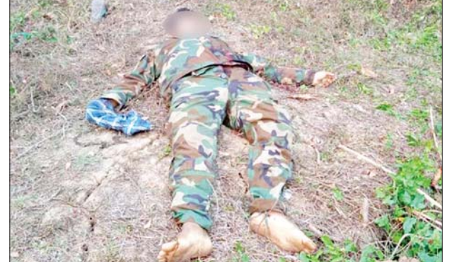
KIA/PDF အကြမ်းဖက်သမားများအား ပစ်ခတ်ဖမ်းဆီးရမိမှု မှတ်တမ်းဓာတ်ပုံ။