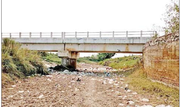
KIA/PDF အကြမ်းဖက်သမားများက မန်ခါးကျေးရွာတံတား အောက်၌ သဲအိတ်များကာရံ၍ ဘန်ကာပြုလုပ်ထားမှုကို တွေ့ရစဉ်။