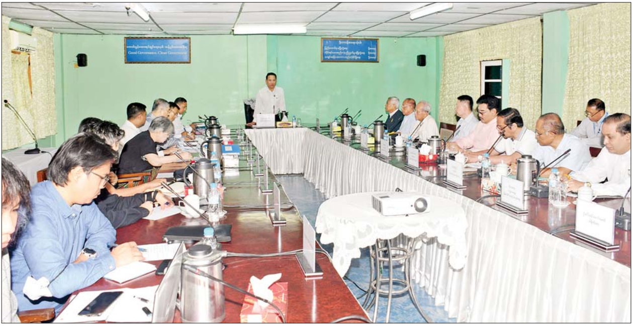
ပြည်ထောင်စုဝန်ကြီး ဦးမောင်မောင်အုန်း မြန်မာ့ရုပ်ရှင်ထူးချွန်ဆုချီးမြှင့်ပွဲကျင်းပရေး လုပ်ငန်းညှိနှိုင်းအစည်းအဝေးတွင် အမှာစကား ပြောကြားစဉ်။

၂၀၁၉ ခုနှစ်၊ ၂၀၂၀ ပြည့်နှစ်နှင့် ၂၀၂၂ ခုနှစ်တို့အတွက် မြန်မာ့ရုပ်ရှင် ထူးချွန်ဆုချီးမြှင့်ပွဲကျင်းပရေး လုပ်ငန်းညှိနှိုင်းအစည်းအဝေးကို ယနေ့နံနက်ပိုင်းတွင် ရန်ကုန်မြို့၊ ဗဟန်းမြို့နယ် ကုက္ကိုင်းရိပ်သာ လမ်းရှိ ပြန်ကြားရေးနှင့် ပြည်သူ့ ဆက်ဆံရေးဦးစီးဌာန ရုပ်ရှင် မြှင့်တင်ရေးဌာနခွဲ အစည်းအဝေး ခန်းမ၌ ကျင်းပသည်။