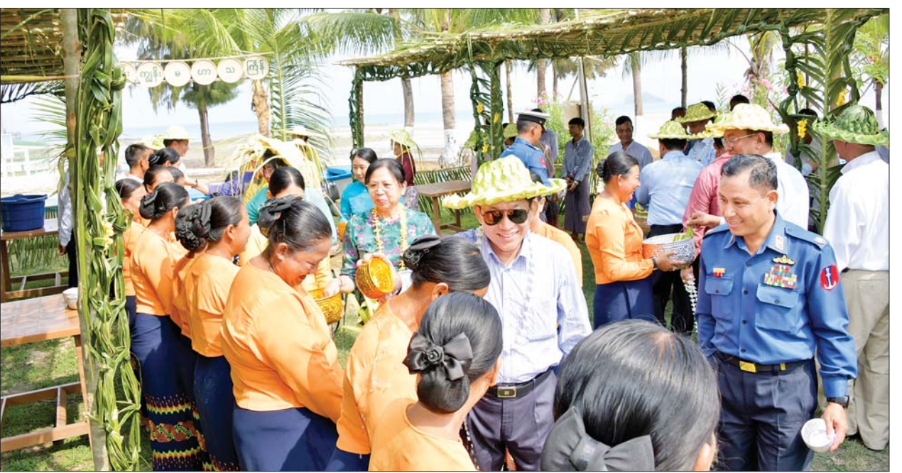
နိုင်ငံတော်စီမံအုပ်ချုပ်ရေးကောင်စီဥက္ကဋ္ဌ တပ်မတော်ကာကွယ်ရေးဦးစီးချုပ် ဗိုလ်ချုပ်မှူးကြီး မင်းအောင်လှိုင်နှင့်ဇနီး ဒေါ်ကြူကြူလှတို့ ကိုကိုးကျွန်းတပ်နယ်မှ အရာရှိ၊ စစ်သည်၊ မိသားစုများကို မြန်မာ့ရိုးရာအတာသကြိန်ရေများ ပက်ဖျန်း၍ နှစ်သစ်ကို အတူတကွ ရင်းနှီး နွေးထွေးစွာ ကြိုဆိုကြစဉ်။

ဆုမွန်ကောင်းတောင်း မြန်မာ့ရိုးရာ အတာသကြိန် ကာလကို ပျော်ပျော်ရွှင်ရွှင်ဖြင့် ဖြတ်သန်းကြစေလိုပြီး စည်းကမ်း စနစ်တကျဖြင့် ရိုးရာယဉ်ကျေးမှု ကို ထိန်းသိမ်းရန်လိုကြောင်း၊ မိမိတို့၏ လုပ်ငန်းတာဝန်များကို ကျေပွန်အောင် ထမ်းဆောင် သကဲ့သို့ မိမိတို့အပန်းဖြေ နေထိုင် ရမည့် အားလပ်ရက်များကိုလည်း ပျော်ရွှင်စွာဖြင့် ဖြတ်သန်းကြရန်