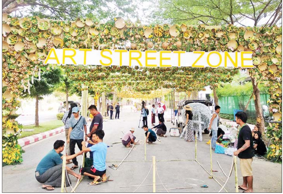
မင်္ဂလာမန္တလေး မြန်မာ့ရိုးရာလမ်းလျှောက် အတာသင်္ကြန်ကျင်းပရန် ပြင်ဆင်ဆောင်ရွက်နေမှုကို တွေ့ရစဉ်။

Street Zone၊ အမြဲတမ်းစိမ်းလန်းစိုပြည်ပြီး ရေလိုအေးချမ်းစေချင်တဲ့ ရည်ရွယ်ချက်တွေပါဝင်တဲ့ Water Street Zone၊ လာရောက်လည်ပတ်သူတွေသွားလာလိုရတဲ့ Floating Street Zone နဲ့ Flower Street Zone စသဖြင့် ဇုန်လေးတွေခွဲပြီး ဖော်ဆောင်ထားပါတယ်။ ဒီဇုန်လေးတွေမှာလည်း မြန်မာ့ရိုးရာကို ထိန်းသိမ်းတဲ့အနေနဲ့ အလှဆင်ဖန်တီးမှုလေးတွေလည်း