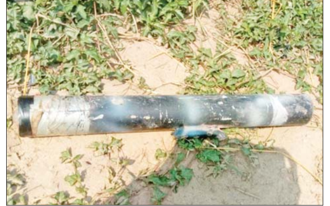
KIA/PDF အကြမ်းဖက်သမားများထံမှ လက်နက်၊ ခဲယမ်းများနှင့် ဆက်စပ်ပစ္စည်းများ သိမ်းဆည်းရမိမှု မှတ်တမ်းဓာတ်ပုံ။