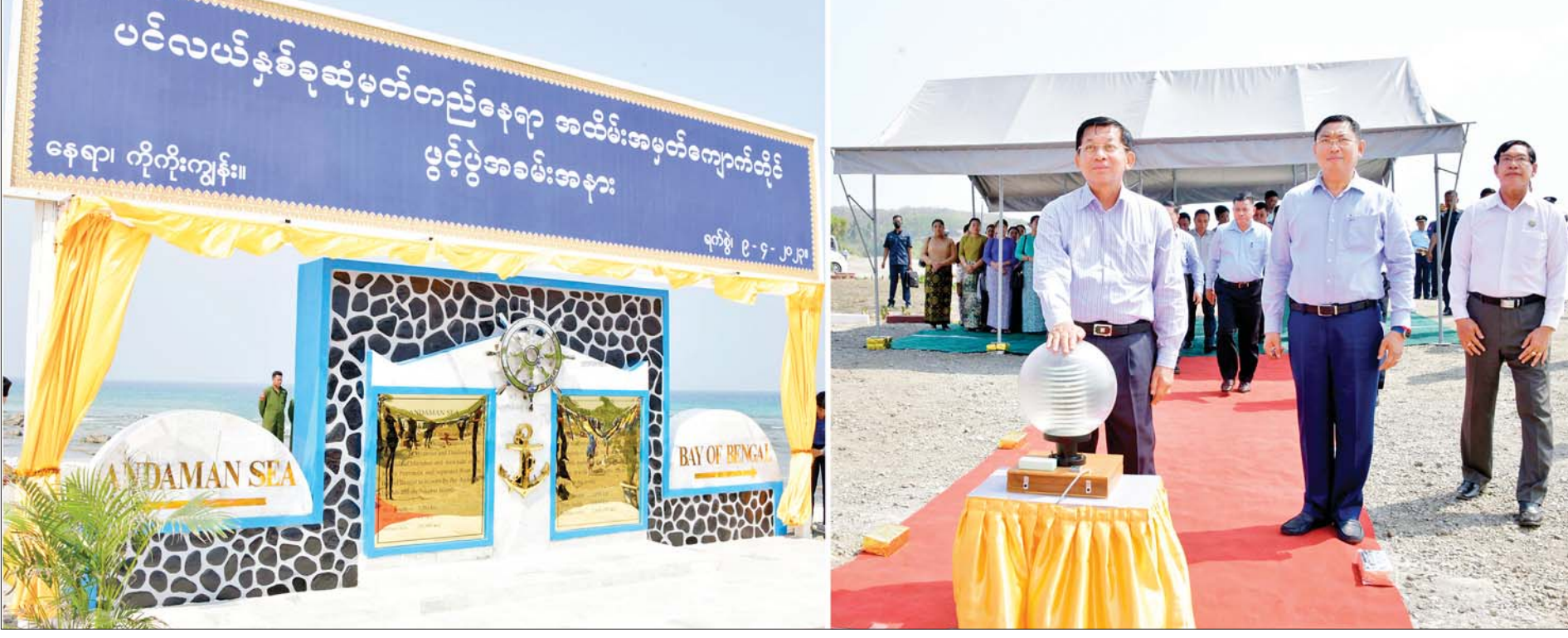
နိုင်ငံတော်စီမံအုပ်ချုပ်ရေးကောင်စီဥက္ကဋ္ဌ နိုင်ငံတော်ဝန်ကြီးချုပ် ဗိုလ်ချုပ်မှူးကြီးမင်းအောင်လှိုင် ကိုကိုးကျွန်းမြို့နယ်ရှိ ကပ္ပလီပင်လယ်ပြင်နှင့် ဘင်္ဂလားပင်လယ်အော် ပင်လယ်နှစ်ခုဆုံမှတ်တည်နေရာ အောင်မြေအထိမ်းအမှတ်ကျောက်တိုင်ကို စက်ခလုတ်နှိပ်ဖွင့်လှစ်ပေးစဉ်။

နေပြည်တော် ဧပြီ ၉ နိုင်ငံတော်စီမံအုပ်ချုပ်ရေးကောင်စီဥက္ကဋ္ဌ နိုင်ငံတော်ဝန်ကြီးချုပ် ဗိုလ်ချုပ်မှူးကြီးမင်းအောင်လှိုင်သည် ဇနီး ဒေါ်ကြူကြူလှ၊ ကောင်စီတွဲဖက်အတွင်းရေးမှူး ဒုတိယဗိုလ်ချုပ်ကြီး ရဲဝင်းဦးနှင့် ဇနီး၊ ကောင်စီဝင်များ၊ ပြည်ထောင်စုဝန်ကြီးများလိုက်ပါ၍ ကိုကိုးကျွန်းမြို့နယ်ရှိ ကပ္ပလီပင်လယ်ပြင် (Andaman Sea)နှင့် ဘင်္ဂလားပင်လယ်အော်(Bay of Bengal) ပင်လယ်နှစ်ခုဆုံမှတ်တည်နေရာတွင် အောင်မြေအထိမ်းအမှတ် ကျောက်တိုင်စိုက်ထူခြင်းအခမ်းအနားသို့ ယနေ့နံနက်ပိုင်းတွင် တက်ရောက်ချီးမြှင့်သည်။ စာမျက်နှာ ၃ ကော်လံ ၁ သို့