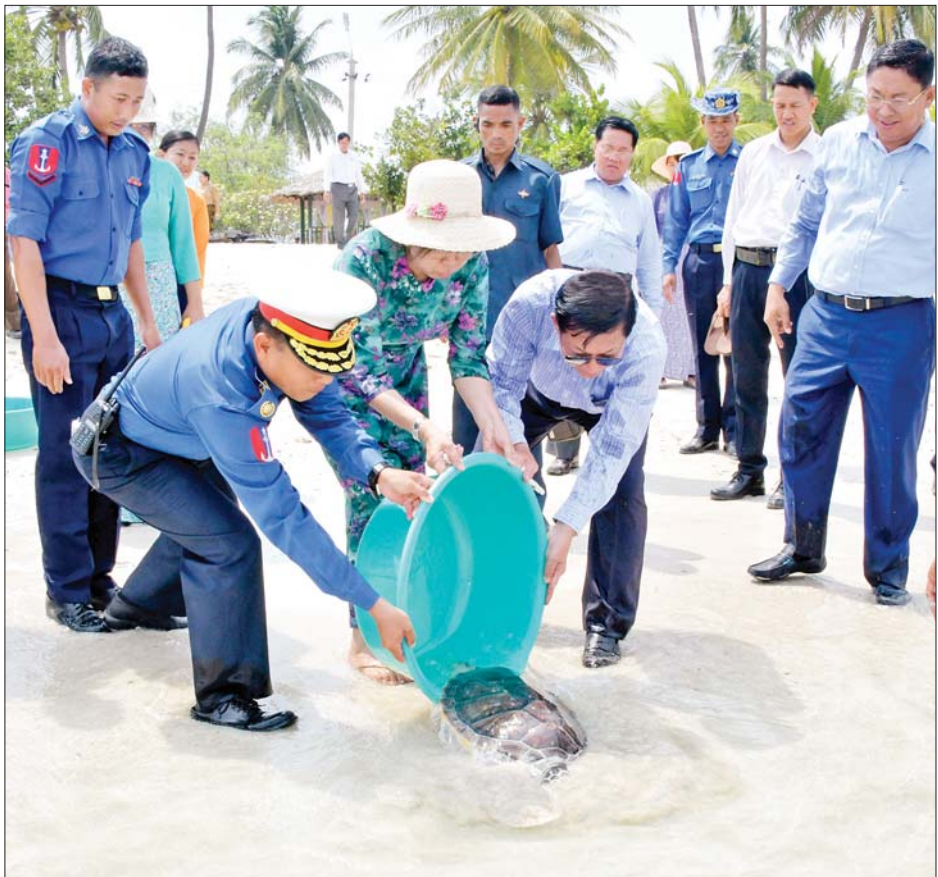
နိုင်ငံတော်စီမံအုပ်ချုပ်ရေးကောင်စီဥက္ကဋ္ဌ တပ်မတော်ကာကွယ်ရေးဦးစီးချုပ် ဗိုလ်ချုပ်မှူးကြီး မင်းအောင်လှိုင်နှင့် ဇနီး ဒေါ်ကြူကြူလှတို့ သုံးနှစ်သားအရွယ် ပင်လယ်လိပ်ကြီးအား မြန်မာ့ရိုးရာ နှစ်သစ်ကူးအတာသင်္ကြန်အကြိုကာလ ဇီဝိတဒါနအဖြစ် ကုသိုလ်ပြုလွှတ်ပေးစဉ်။