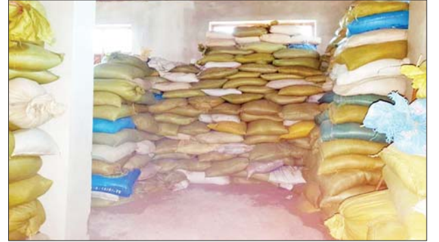
စီမူလေးကျေးရွာ ဘုန်းကြီးကျောင်းအတွင်း သဲအိတ်များကာရံ၍ KIA/PDF အကြမ်းဖက်သမားများက စစ်စခန်းပြုလုပ်ထားသည်ကို တွေ့ရစဉ်။

အကြမ်းဖက်သမားများအနေဖြင့် ကျေးရွာအချို့အတွင်းဝင်ရောက် ၍ အကြမ်းဖက်လုပ်ရပ်များ လုပ်ဆောင်လျက်ရှိခြင်းကြောင့် ဒေသခံ ပြည်သူများ အေးချမ်းတည်ငြိမ်စွာ နေထိုင်နိုင်ရေးအတွက် လုံခြုံရေး တပ်ဖွဲ့များက နယ်မြေလုံခြုံရေးလုပ်ငန်းများ တိုးမြှင့် ဆောင်ရွက်လျက် ရှိကြောင်းနှင့် အကြမ်းဖက်အဖွဲ့များ၏ ဝင်ထွက်သွားလာမှု သတင်းများ ရရှိပါက သက်ဆိုင်ရာသို့ လျှို့ဝှက်စွာသတင်းပေး၍ နယ်မြေတည်ငြိမ် အေးချမ်းရေးအတွက် ပူးပေါင်းပါဝင်ကြရန် သတင်းထုတ်ပြန်အပ်ပါ သည်။