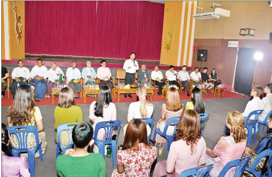
ပြည်ထောင်စုဝန်ကြီး ဦးမောင်မောင်အုန်း မြန်မာ့ရုပ်ရှင်ထူးချွန်ဆုချီးမြှင့်ပွဲအခမ်းအနားတွင် ပါဝင် ကူညီဆောင်ရွက်ကြမည့် ရွှေကြိုမောင်မယ်များအား တွေ့ဆုံအားပေးစကားပြောကြားစဉ်။