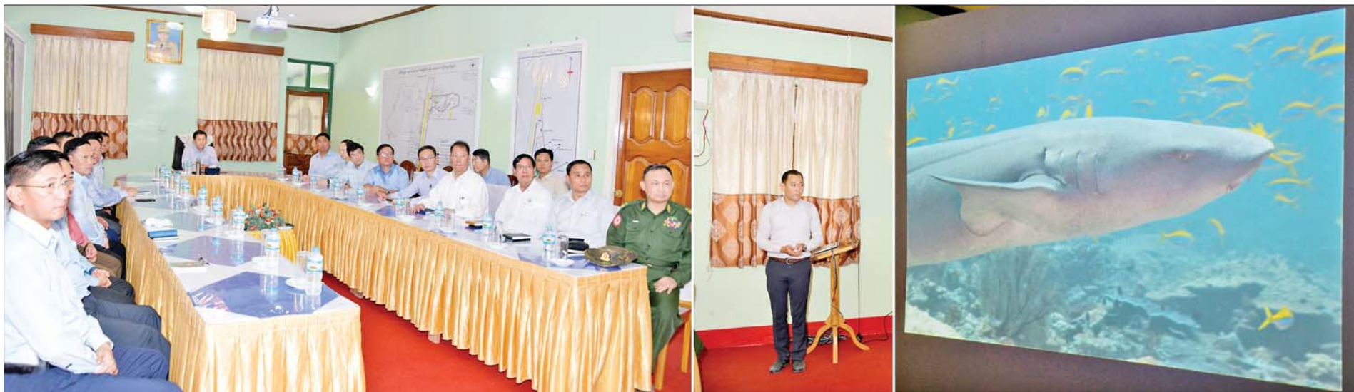
နိုင်ငံတော်စီမံအုပ်ချုပ်ရေးကောင်စီဥက္ကဋ္ဌ နိုင်ငံတော်ဝန်ကြီးချုပ် ဗိုလ်ချုပ်မှူးကြီးမင်းအောင်လှိုင်နှင့်အဖွဲ့ဝင်များ မြန်မာနိုင်ငံပင်လယ်ပြင်အတွင်းရိုက်ကူးထားသည့် ရေအောက်သဘာဝရှုခင်းများနှင့် ရေနေသတ္တဝါများကို မှတ်တမ်းတင်သုတေသနပြုရိုက်ကူးထားသည့် Documentary ဗီဒီယိုဖိုင်ကို ကြည့်ရှုကြရာ တာဝန်ရှိသူတစ်ဦးက ရှင်းလင်းတင်ပြစဉ်။

»» စာမျက်နှာ ၃ မှ နီကိုဘားကျွန်းတို့ တည်ရှိကြောင်း၊ ကပ္ပလီ ပင်လယ်ပြင်၏ တောင်ဘက်အကျဆုံးနေရာတွင် နိုင်ငံတကာကုန်သွယ်ရေးကြောင်း ၏ အဓိကအရေးပါသည့် ရေလက် ကြားတစ်ခုဖြစ်သော မလ္လာ ကာ ရေလက်ကြားနှင့်လည်း ဆက်စပ် တည်ရှိနေကြောင်း၊ ကပ္ပလီ ပင်လယ်ပြင်နှင့် ဘင်္ဂလားပင်လယ် အော် ဆက်စပ်နေရာဖြစ်သည့် ကိုကိုးကျွန်း၏ မြောက်ဘက်၌ ပါလီပါလဲ ရေလမ်းကြောင်း၊ တောင်ဘက်၌ ကိုကိုးရေလမ်း ကြောင်းများ တည်ရှိပြီး ၎င်းရေလက်ကြားများမှ နှစ်စဉ် နိုင်ငံခြား ကုန်သွယ်ရေးယာဉ် အစင်းရေ ၈၀၀၀ ခန့် ဖြတ်သန်း သွားလာလျက်ရှိသဖြင့် နိုင်ငံတကာ ရေကြောင်းကုန်သွယ်မှုအတွက် သာမက မြန်မာနိုင်ငံ၏ ရေကြောင်း အကျိုးစီးပွား အတွက်လည်း အဓိကအခန်းကဏ္ဍမှ ပါဝင်လျက် ရှိကြောင်း သိရှိရသည်။ ကြည့်ရှုစစ်ဆေး ထို့နောက် နိုင်ငံတော်စီမံအုပ်ချုပ် ရေးကောင်စီဥက္ကဋ္ဌ နိုင်ငံတော် ဝန်ကြီးချုပ်နှင့် ဇနီး၊ အဖွဲ့ဝင်များ သည် ဗျိုင်းကျွန်းနှင့် ဂျယ်ရီကျွန်း ကြား ဆက်စပ်မြေသားလမ်း