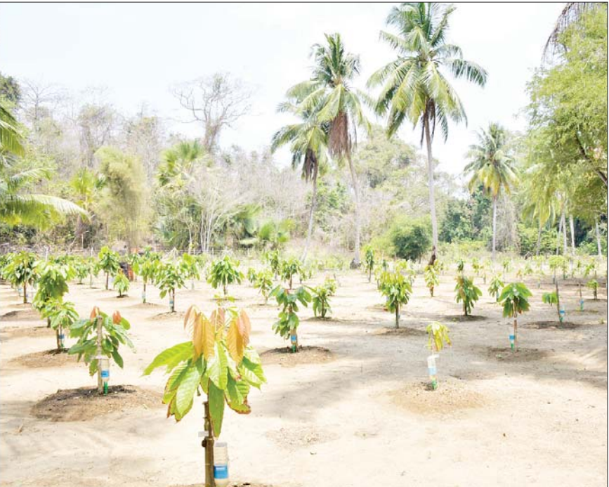
နိုင်ငံတော်စီမံအုပ်ချုပ်ရေးကောင်စီဥက္ကဋ္ဌ တပ်မတော်ကာကွယ်ရေးဦးစီးချုပ် ဗိုလ်ချုပ်မှူးကြီး မင်းအောင်လှိုင် ကိုကိုးကျွန်းတပ်နယ်မှ စမ်းသပ်စိုက်ပျိုးထားသည့် ကိုကိုးစိုက်ခြံကို ကြည့်ရှုစစ်ဆေးစဉ်။

နှင့်အဖွဲ့ဝင်များသည် ၇ မိုင် လိပ်သားဖောက်စခန်းနှင့် နယ်မြေခံရေတပ်စခန်းဌာနချုပ် လိပ်မွေးမြူရေးစခန်းတို့သို့ ရောက်ရှိကြပြီး လိပ်များ မွေးမြူထားရှိမှုကို ကြည့်ရှုစစ်ဆေးရာ တာဝန်ရှိသူများ၏ တင်ပြချက်များအပေါ် နိုင်ငံတော်စီမံအုပ်ချုပ်ရေးကောင်စီဥက္ကဋ္ဌ နိုင်ငံတော်ဝန်ကြီးချုပ်က ကိုကိုးကျွန်းဒေသအတွင်း ပင်လယ်လိပ်များ စနစ်တကျထိန်းသိမ်းစောင့်ရှောက်ရေးနှင့် ပတ်သက်၍ လိုအပ်သည်များ လမ်းညွှန်မှာကြားသည်။ ထို့နောက်နိုင်ငံတော်စီမံအုပ်ချုပ်