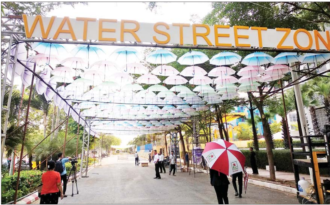
မင်္ဂလာမန္တလေး မြန်မာ့ရိုးရာလမ်းလျှောက် အတာသင်္ကြန်ကျင်းပရန် ပြင်ဆင်ဆောင်ရွက်နေမှုကို တွေ့ရစဉ်။

မန္တလေး ဧပြီ ၉ ၂၀၂၃ ခုနှစ် မြန်မာ့ရိုးရာ အတာသင်္ကြန် ပွဲတော်ကာလအတွင်း မန္တလေးမြို့ရှိ ပြည်သူများ ပိုမိုပျော်ရွှင်စွာ ဆင်နွှဲနိုင်ရေးအတွက် လမ်းလျှောက်သင်္ကြန်ထည့်သွင်း၍ စည်ကားသိုက်မြိုက်စွာ ကျင်းပသွားမည်ဖြစ်ကြောင်း သိရသည်။ အစီအစဉ်ကောင်းများ ပါဝင်မည် သင်္ကြန်အကြံပြုရေးဖြစ်သည့် ဧပြီ ၁၃ ရက်မှစတင်၍ မန္တလေးမြို့ ချမ်းမြသာစည်မြို့နယ်ရှိ မင်္ဂလာမန္တလေးမြန်မာ့ရိုးရာ လမ်းလျှောက်အတာသင်္ကြန်နှင့် ကျူးတောင်ဘက်ခြမ်းရှိ (၂၆ လမ်း၊ ၆၆ လမ်းမှ ၇၈ လမ်းအထိ) လမ်းလျှောက်သင်္ကြန် တို့၌ ဖျော်ဖြေရေးအစီအစဉ်များ၊ စတုဒိသာမဏ္ဍပ်များ၊ ရေကစားမဏ္ဍပ်များနှင့် အခြားအပန်းဖြေ အနားယူနိုင်မည့် အစီအစဉ်ကောင်းများလည်း ပါဝင်မည်ဖြစ်သည်။ စာမျက်နှာ ၁၂ ကော်လံ ၁ သို့ *