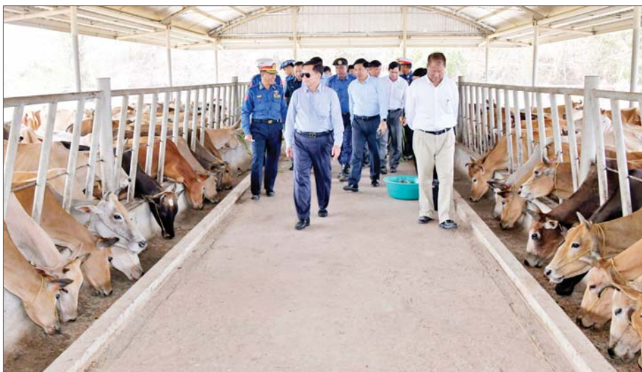
နိုင်ငံတော်စီမံအုပ်ချုပ်ရေးကောင်စီဥက္ကဋ္ဌ တပ်မတော်ကာကွယ်ရေးဦးစီးချုပ် ဗိုလ်ချုပ်မှူးကြီး မင်းအောင်လှိုင်နှင့် တာဝန်ရှိသူများ ကိုကိုးကျွန်းတပ်နယ် နယ်မြေခံ ရေတပ်စခန်းဌာနချုပ် ဒေသန္တာမွေးမြူရေးခြံတွင် ကြည့်ရှုစစ်ဆေးစဉ်။

စာမျက်နှာ ၅ မှ ထို့ကြောင့်ကျောင်းသားကျောင်းသူများ အတွေးအခေါ် ကောင်းမွန်စေရေးနှင့် ပညာရပ်များကို မှန်ကန်စွာ တတ်မြောက်စေရေး စနစ်တကျ သင်ကြားပေးကြစေလိုကြောင်း၊ ကျောင်းသား ကျောင်းသူများ၏ အတွေးအခေါ်များ ကောင်းမွန်လာမည်ဆိုပါက ၎င်းတို့၏ဘဝ ကောင်းမွန်ရေးအတွက်ဆောင်ရွက်နိုင်မည်ဖြစ်ကြောင်း၊ စာဖတ်မှသာလျှင်ပညာတတ်မည်ဖြစ်သဖြင့် စာပေလေ့လာဖတ်ရှုခြင်း နှင့် စာဖတ်အား မြှင့်တင်ခြင်းများကို