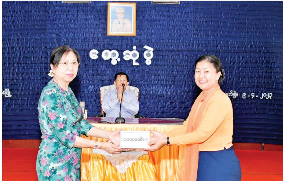
နိုင်ငံတော်စီမံအုပ်ချုပ်ရေးကောင်စီဥက္ကဋ္ဌ တပ်မတော်ကာကွယ်ရေးဦးစီးချုပ် ဗိုလ်ချုပ်မှူးကြီး မင်းအောင်လှိုင်၏ဇနီး ဒေါ်ကြူကြူလှ ကိုကိုးကျွန်းတပ်နယ်မှ မိခင်နှင့် ကလေးစောင့်ရှောက်ရေးအသင်း အတွက် ချီးမြှင့်ငွေများ ပေးအပ်စဉ်။

လိုကြောင်း၊ ကိုကိုးကျွန်းဒေသ သည် ယခင်ကထက်များစွာ တိုးတက် ပြောင်းလဲလာသည်ကို တွေ့ရှိရပြီး မိမိတို့အကြီးအကဲများ က လိုအပ်သည်များ ဖြည့်ဆည်း ပေးခြင်းထက် ဒေသခံများနှင့် အတူ နယ်မြေခံတပ်များ၏ဝိုင်းဝန်း ပူးပေါင်းပါဝင် ဆောင်ရွက်ခြင်း ကြောင့်ပင်ဖြစ်ကြောင်း၊ ထို့ကြောင့် ကိုကိုးကျွန်းဒေသ ယခုထက် ဖွံ့ဖြိုးတိုးတက်စေရေး ဒေသခံ ပြည်သူများနှင့် စုစည်းညီညွတ်စွာ ဖြင့် ဒေသအကျိုး၊ ဒေသခံများ၏ အကျိုးစီးပွားကို ယခုထက် ပိုမို ဖော်ဆောင်နိုင်ရေး ဆက်လက် ကြိုးပမ်းသွားကြရန် လိုကြောင်း၊ နှစ်သစ်အခါသမယတွင် အရာရှိ၊ စစ်သည်၊ မိသားစုများအားလုံး ကိုယ်စိတ်နှစ်ဖြာ ကျန်းမာချမ်းသာ