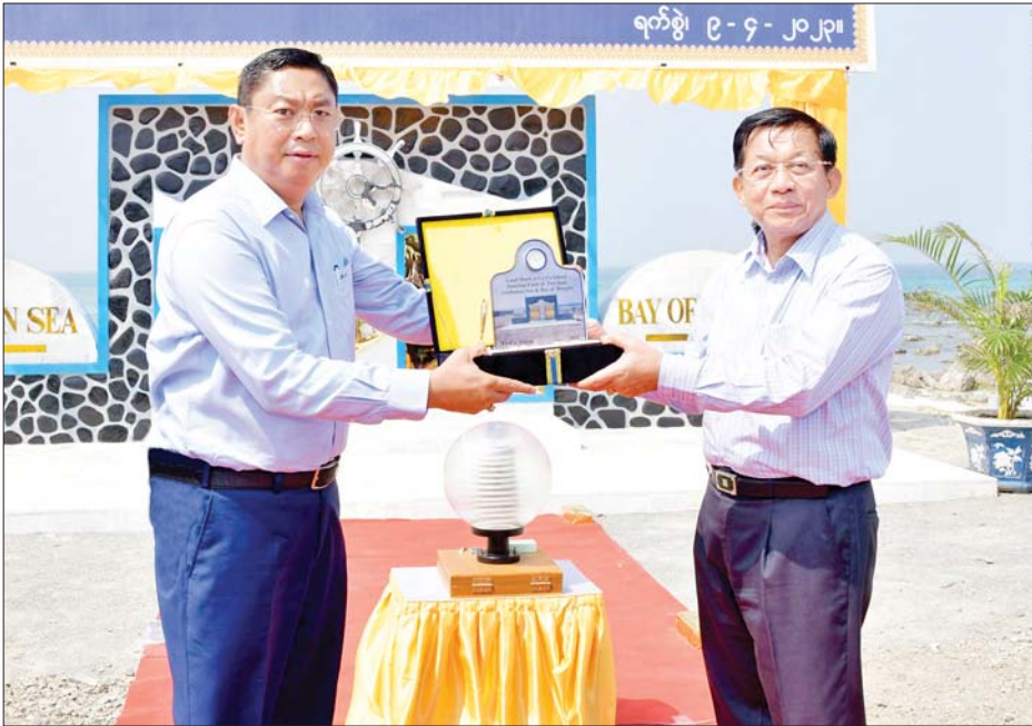
နိုင်ငံတော်စီမံအုပ်ချုပ်ရေးကောင်စီဥက္ကဋ္ဌ နိုင်ငံတော်ဝန်ကြီးချုပ် ဗိုလ်ချုပ်မှူးကြီးမင်းအောင်လှိုင်ထံ ကာကွယ်ရေးဦးစီးချုပ်(ရေ) ဗိုလ်ချုပ်ကြီး မိုးအောင် က ကပ္ပလီပင်လယ်ပြင်နှင့် ဘင်္ဂလားပင်လယ်အော် ပင်လယ်နှစ်ခုဆုံမှတ်တည်နေရာ အောင်မြေအထိမ်းအမှတ်ကျောက်တိုင်ဖွင့်ပွဲအထိမ်းအမှတ် အမှတ်တရလက်ဆောင်ကို ဂါရဝပြုပေးအပ်စဉ်။

ရှေ့ဖုံးမှ ဦးစွာ နိုင်ငံတော်စီမံအုပ်ချုပ်ရေးကောင်စီဥက္ကဋ္ဌ နိုင်ငံတော်ဝန်ကြီးချုပ်နှင့် ဇနီး၊ အဖွဲ့ဝင်များသည် ကိုကိုးကျွန်းမြို့နယ်သို့ ရောက်ရှိကြရာ ရန်ကုန်တိုင်းဒေသကြီးဝန်ကြီးချုပ် ဦးစိုးသိန်း၊ ရန်ကုန်တိုင်းစစ်ဌာနချုပ်တိုင်းမှူး ဗိုလ်ချုပ်ဇော်ဟိန်းနှင့် တာဝန်ရှိသူများ၊ ကိုကိုးကျွန်းမြို့နယ်ရှိ ဌာနဆိုင်ရာဝန်ထမ်းများ၊ ဒေသခံပြည်သူများနှင့် ရပ်မိရပ်ဖများက လှိုက်လှဲနှေးထွေးစွာ ကြိုဆိုနှုတ်ဆက်ကြသည်။