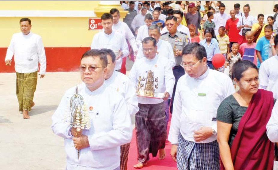
သော မေတ္တာသုတ်အစရှိသည့် ပရိတ်တရားတော်များ နာယူကြည်ညိုခဲ့ကြပြီး ပြည်နယ်ဝန်ကြီးချုပ်နှင့် တာဝန်ရှိသူများက စုဠာမုန့်စေတီတော်မြတ်တွင်

သထုံ ဧပြီ ၉ မွန်ပြည်နယ် သထုံမြို့၏ကျက်သရေဆောင်လေးဆူဓာတ်စံရွှေစာရံစေတီတော်မြတ်ကြီး ရင်ပြင်တော်ပေါ်ရှိ စုဠာမုန့်စေတီတော်၏ ထီးတော်၊ ငှက်မြတ်နားတော်၊ စိန်ဖူးတော်တင်လှူခြင်း၊ “ဒက္ခိဏဒီပံ” သာသနာငါးထောင်အလင်းဆောင် သာသနာ့ဗိမာန်တော်မြတ်ကြီးနှင့် သာသနိကအဆောက်အအုံများ ဖွင့်လှစ်ရေစက်ချခြင်း မင်္ဂလာအခမ်းအနားကို ယနေ့ နံနက်က သာသနာ့ဗိမာန်တော်သစ်၌ ကျင်းပသည်။