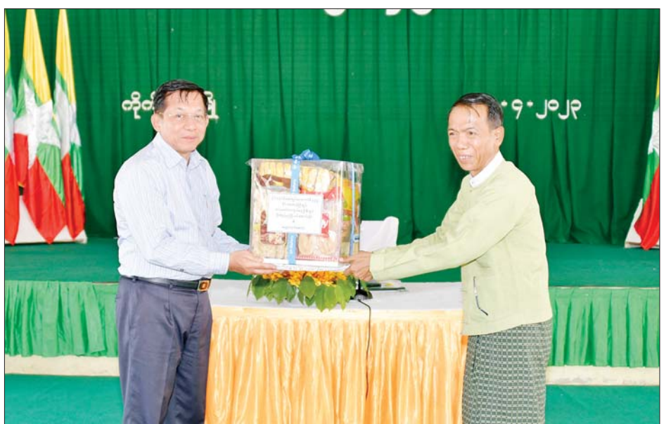
နိုင်ငံတော်စီမံအုပ်ချုပ်ရေးကောင်စီဥက္ကဋ္ဌ နိုင်ငံတော်ဝန်ကြီးချုပ် ဗိုလ်ချုပ်မှူးကြီးမင်းအောင်လှိုင် ကိုကိုးကျွန်းမြို့နယ်ရှိ ဌာနဆိုင်ရာဝန်ထမ်းများအတွက် စားသောက်ဖွယ်ရာများ ပေးအပ်စဉ်။

နှစ်တာကာလထက် အဆပေါင်း များစွာ ဖွံ့ဖြိုးတိုးတက်လာခဲ့သည် ကို တွေ့ရှိရသည့်အတွက်လည်း ဝမ်းမြောက်မိပါကြောင်း။ ပူးပေါင်းကြိုးပမ်းဆောင်ရွက် ဒေသ ဖွံ့ဖြိုးတိုးတက်ရေး အတွက် တပ်မတော်နှင့် အစိုးရမှ တတ်စွမ်းသရွေ့ ဖြည့်ဆည်းဆောင် ရွက်ပေးလျက်ရှိပြီး ဒေသခံများ အနေဖြင့်လည်း ပူးပေါင်းကြိုးပမ်း ဆောင်ရွက်သွားရန် လိုကြောင်း၊ ကိုကိုးကျွန်းဒေသသည် လမ်းပန်း ဆက်သွယ်မှုခက်ခဲသည့် ဒေသ တစ်ခုဖြစ်ပြီး ဒေသဖွံ့ဖြိုးတိုးတက် ရေးသည် ထိုက်သင့်သလောက် မဖြစ်ပေါ်ခဲ့သည်ကို တွေ့ရှိရ ကြောင်း၊ နိုင်ငံရေးအစိုးရလက်ထက် တွင် ကိုကိုးကျွန်းဒေသ၌ အချင်း ချင်း စည်းလုံးညီညွတ်မှု အားနည်း ချက်များရှိကာ ဒေသဖွံ့ဖြိုးတိုးတက် ရေးသည်လည်း နှောင့်နှေးခဲ့ ရကြောင်း။