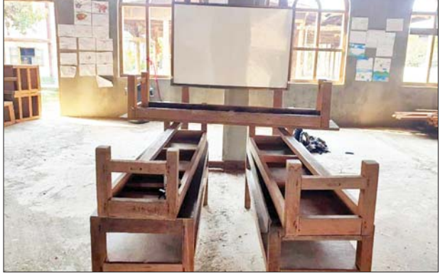
စီမူလေးကျေးရွာ ဘုန်းကြီးကျောင်းအတွင်း၌ KIA/PDF အကြမ်း ဖက်သမားများက တရားမဝင်စာသင်ကျောင်း ဖွင့်လှစ်သင်ကြားမှု မှတ်တမ်းဓာတ်ပုံ။