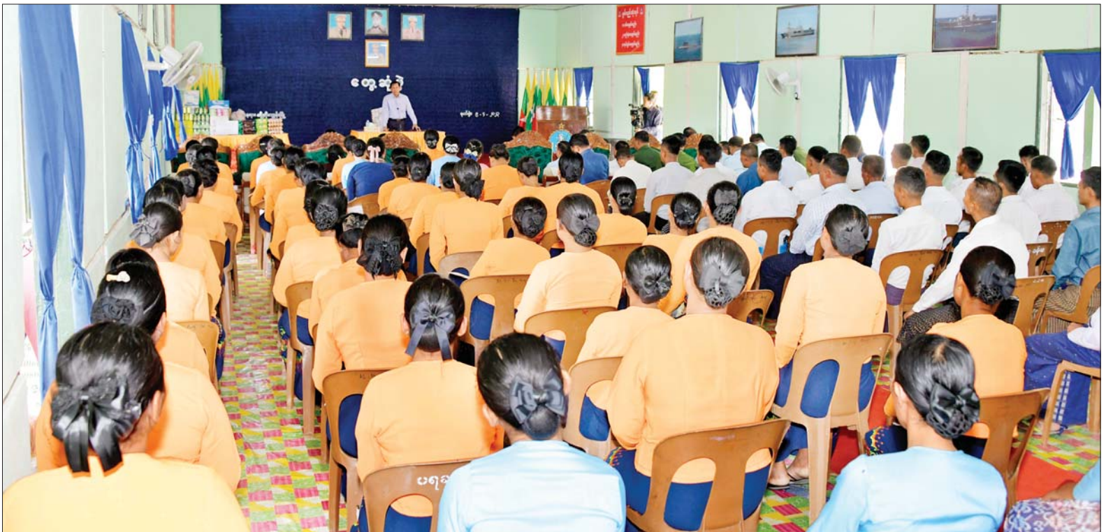
နိုင်ငံတော်စီမံအုပ်ချုပ်ရေးကောင်စီဥက္ကဋ္ဌ တပ်မတော်ကာကွယ်ရေးဦးစီးချုပ် ဗိုလ်ချုပ်မှူးကြီး မင်းအောင်လှိုင် ကိုကိုးကျွန်းတပ်နယ်မှ အရာရှိ၊ စစ်သည်၊ မိသားစုများအား တွေ့ဆုံ အမှာစကားပြောကြားစဉ်။

နေပြည်တော် ဧပြီ ၉ နိုင်ငံတော် စီမံအုပ်ချုပ်ရေး ကောင်စီဥက္ကဋ္ဌ တပ်မတော် ကာကွယ်ရေးဦးစီးချုပ် ဗိုလ်ချုပ် မှူးကြီး မင်းအောင်လှိုင်သည် ဇနီး ဒေါ်ကြူကြူလှ၊ ကာကွယ်ရေးဦးစီး ချုပ် (ရေ) ဗိုလ်ချုပ်ကြီး မိုးအောင် နှင့်ဇနီး၊ ကာကွယ်ရေးဦးစီးချုပ် (လေ) ဗိုလ်ချုပ်ကြီး ထွန်းအောင် နှင့်ဇနီး၊ ကာကွယ်ရေးဦးစီးချုပ် ရုံးမှ တပ်မတော်အရာရှိကြီးများ၊ ရန်ကုန်တိုင်းစစ်ဌာနချုပ်တိုင်းမှူး ဗိုလ်ချုပ်ဇော်ဟိန်းနှင့် တာဝန်ရှိသူ များလိုက်ပါ၍ ယနေ့ မွန်းလွဲပိုင်း တွင် ကိုကိုးကျွန်းတပ်နယ်မှ အရာရှိ စစ်သည်၊ မိသားစုများအား တပ်နယ်ခန်းမ၌ တွေ့ဆုံအမှာ စကား ပြောကြားသည်။