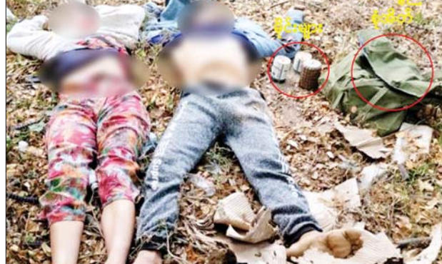
KIA/PDF အကြမ်းဖက်သမားများအား မိုင်းများ၊ ဆေးပစ္စည်းစုံအိတ် နှင့်အတူ ပစ်ခတ်ဖမ်းဆီးရမိမှု မှတ်တမ်းဓာတ်ပုံ။