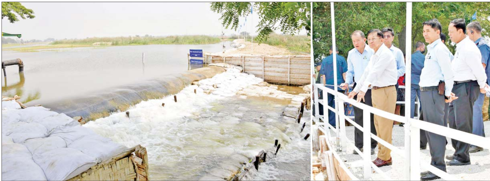
နိုင်ငံတော်စီမံအုပ်ချုပ်ရေးကောင်စီဥက္ကဋ္ဌ နိုင်ငံတော်ဝန်ကြီးချုပ် ဗိုလ်ချုပ်မှူးကြီး မင်းအောင်လှိုင် တပ်ကုန်းမြို့နယ် ရှားတောကျေးရွာ ဆင်သေချောင်း ယာယီရေထိန်းဆည် လုပ်ငန်း ဆောင်ရွက်နေမှုကို ကြည့်ရှုစစ်ဆေးစဉ်။

၁၂ စာမျက်နှာ ၃ မှ ဆောင်ရွက်ရန်လိုကြောင်း၊ မိမိတို့ အနေဖြင့် ပတ်ဝန်းကျင်ကို ဖန်တီး ရန်လိုကြောင်း၊ သစ်ပင်သစ်တော များဖြင့် စိမ်းလန်းစေရေး ထိန်းသိမ်း ခြင်းနှင့် စိုက်ပျိုးခြင်းလုပ်ငန်း များကို ဆောင်ရွက်ရန်လိုကြောင်း၊ လျှပ်စစ်မီးရရှိမှုမရှိသည့် ဒေသ များတွင် ထင်းမီးများဖြင့် ချက်ပြုတ်ခြင်းကို ဆောင်ရွက်ကြ ကြောင်း၊ မိမိတို့နိုင်ငံ၏ သစ်တော ပြုန်းတီးမှုမှာ တစ်နိုင်လုံးအတိုင်း အတာအနေဖြင့် ရှစ်ရာခိုင်နှုန်းခန့် ကျဆင်းသွားကြောင်း၊ ထို့ကြောင့် ရေခန်းခြောက်မှု မရှိစေရန် အတွက် သစ်ပင်သစ်တောများကို ထိန်းသိမ်းထားရန်လိုကြောင်း။