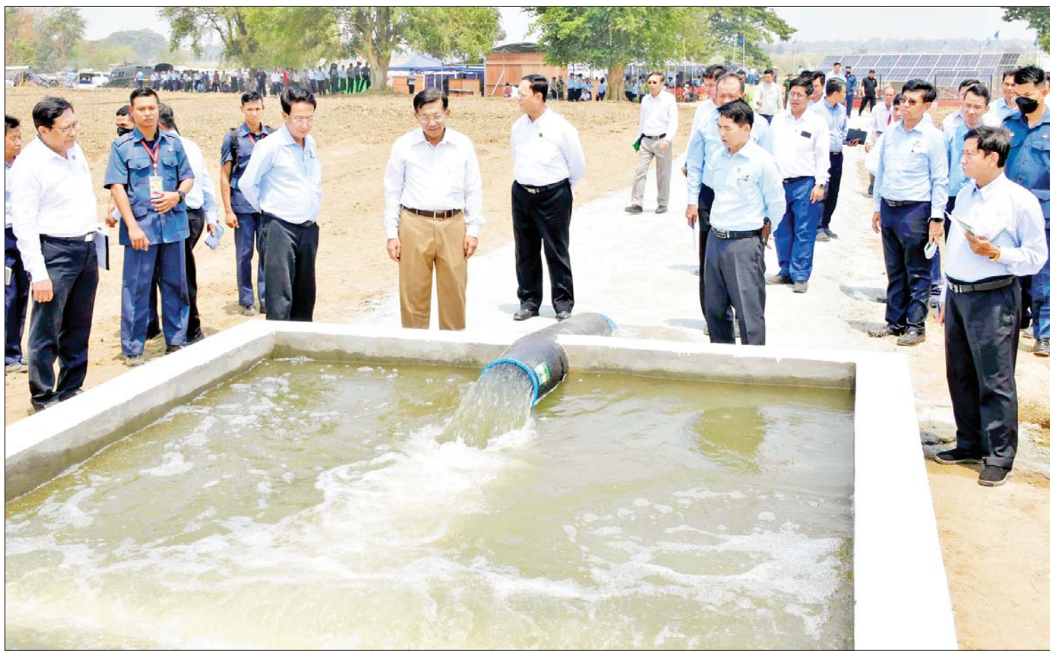
နိုင်ငံတော်စီမံအုပ်ချုပ်ရေးကောင်စီဥက္ကဋ္ဌ နိုင်ငံတော်ဝန်ကြီးချုပ် ဗိုလ်ချုပ်မှူးကြီး မင်းအောင်လှိုင် ရှားတောကျေးရွာ ဆိုလာစနစ်သုံး ရေတင်စနစ်ဆောင်ရွက်ထား ရှိမှုနှင့် စိုက်ပျိုးရေးများ ဖြန့်ဝေပေးနေမှုကို ကြည့်ရှုစစ်ဆေးစဉ်။

နေပြည်တော် ဧပြီ ၈ နိုင်ငံတော်စီမံအုပ်ချုပ်ရေးကောင်စီ ဥက္ကဋ္ဌ နိုင်ငံတော်ဝန်ကြီးချုပ် ဗိုလ်ချုပ်မှူးကြီး မင်းအောင်လှိုင်သည် စိုက်ပျိုးရေး၊ မွေးမြူရေးနှင့် ဆည်မြောင်း ဝန်ကြီးဌာန ပြည်ထောင်စုဝန်ကြီး ဦးမင်းနောင်၊ သမဝါယမနှင့်ကျေးလက် ဖွံ့ဖြိုးရေးဝန်ကြီးဌာန ပြည်ထောင်စု ဝန်ကြီး ဦးလှမိုး၊ နေပြည်တော်ကောင်စီ ဥက္ကဋ္ဌ ဦးတင်ဦးလွင်၊ နေပြည်တော် တိုင်းစစ်ဌာနချုပ်တိုင်းမှူးနှင့် တာဝန်ရှိသူ များလိုက်ပါ၍ ယနေ့နံနက်ပိုင်းတွင် နေပြည်တော်ကောင်စီနယ်မြေ တပ်ကုန်း မြို့နယ်ရှားတောကျေးရွာဆင်သေချောင်း ယာယီရေထိန်းဆည် လုပ်ငန်းဆောင်ရွက် နေမှုနှင့် ဆိုလာစနစ်သုံးရေတင်စနစ် ဆောင်ရွက်နေမှုများကို သွားရောက် ကြည့်ရှုစစ်ဆေးပြီး ဒေသခံစိုက်ပျိုးရေး တောင်သူများနှင့် တွေ့ဆုံသည်။ ဦးစွာ စိုက်ပျိုးရေး၊ မွေးမြူရေးနှင့် ဆည်မြောင်းဝန်ကြီးဌာန ဆည်မြောင်းနှင့် ရေအသုံးချမှု စီမံခန့်ခွဲရေးဦးစီးဌာန ညွှန်ကြားရေးမှူးချုပ် ဦးဗိုလ်ဗိုလ်ကျော်က ဆင်သေချောင်း ယာယီရေထိန်းဆည် တည်ဆောက်ထားမှုနှင့် ဆိုလာရေတင် လုပ်ငန်းဆောင်ရွက်ပြီး ရေပေးဝေနေမှု၊ စာမျက်နှာ ၃ ကော်လံ ၁ သို့ ။