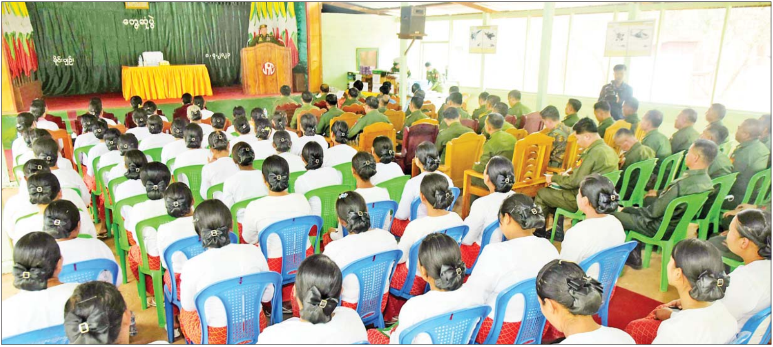
နိုင်ငံတော်စီမံအုပ်ချုပ်ရေးကောင်စီဒုတိယဥက္ကဋ္ဌ ဒုတိယတပ်မတော်ကာကွယ်ရေးဦးစီးချုပ် ကာကွယ်ရေးဦးစီးချုပ်(ကြည်း) ဒုတိယဗိုလ်ချုပ်မှူးကြီးစိုးဝင်း မိုင်းပျဉ်းတပ်နယ်မှ အရာရှိ၊ စစ်သည်၊ မိသားစုများအား တွေ့ဆုံအမှာစကားပြောကြားစဉ်။

နေပြည်တော် ဧပြီ ၈ နိုင်ငံတော် စီမံအုပ်ချုပ်ရေး ကောင်စီဒုတိယဥက္ကဋ္ဌ ဒုတိယ တပ်မတော်ကာကွယ်ရေးဦးစီးချုပ် ကာကွယ်ရေးဦးစီးချုပ်(ကြည်း) ဒုတိယဗိုလ်ချုပ်မှူးကြီး စိုးဝင်း သည် ယနေ့မွန်လွှဲပိုင်းတွင် မိုင်းပျဉ်းတပ်နယ်မှ အရာရှိ၊ စစ်သည်၊ မိသားစုများကို သွားရောက်တွေ့ဆုံ အမှာစကား ပြောကြားသည်။