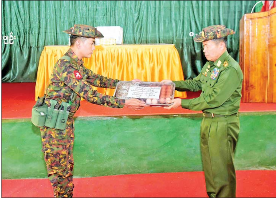
နိုင်ငံတော်စီမံအုပ်ချုပ်ရေးကောင်စီဒုတိယဥက္ကဋ္ဌ ဒုတိယတပ်မတော်ကာကွယ်ရေးဦးစီးချုပ် ကာကွယ်ရေးဦးစီးချုပ်(ကြည်း) ဒုတိယဗိုလ်ချုပ်မှူးကြီးစိုးဝင်း မိုင်းပျဉ်းတပ်နယ်မှ အရာရှိ၊ စစ်သည်၊ မိသားစုများအတွက် စားသောက်ကုန်ပစ္စည်းများကို ပေးအပ်စဉ်။

အဆိုပါ တွေ့ဆုံပွဲသို့ နိုင်ငံတော် စီမံအုပ်ချုပ်ရေးကောင်စီ ဒုတိယ ဥက္ကဋ္ဌ ဒုတိယတပ်မတော်ကာကွယ် ရေးဦးစီးချုပ် ကာကွယ်ရေးဦးစီး ချုပ်(ကြည်း)နှင့်အတူ ဇနီး ဒေါ်သန်းသန်းနွယ်၊ ညှိနှိုင်းကွပ်ကဲ ရေးမှူးကြီး(ကြည်း) ရှေ့ လေ) ဗိုလ်ချုပ်ကြီး မောင်မောင်အေးနှင့် ဇနီး၊ ကာကွယ်ရေးဦးစီးချုပ်ရုံးမှ တပ်မတော် အရာရှိကြီးများ၊ အရှေ့ပိုင်းတိုင်း စစ်ဌာနချုပ်