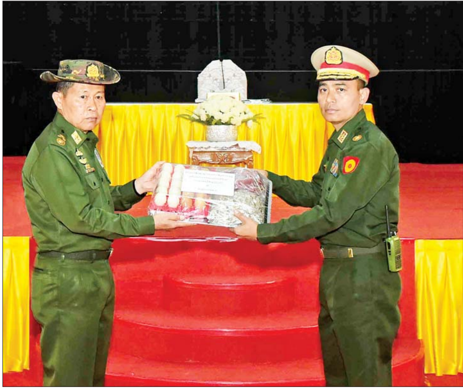
နိုင်ငံတော်စီမံအုပ်ချုပ်ရေးကောင်စီ ဒုတိယဥက္ကဋ္ဌ ဒုတိယတပ်မတော်ကာကွယ်ရေးဦးစီးချုပ် ကာကွယ်ရေးဦးစီးချုပ်(ကြည်း) ဒုတိယဗိုလ်ချုပ်မှူးကြီး စိုးဝင်း သင်တန်းသားများအတွက် တပ်မတော် စက်ရုံများမှ ထုတ်လုပ်သည့် စားသောက်ကုန်ပစ္စည်းများကို ပေးအပ်စဉ်။

အပြည့်အဝ ကူညီပေးနိုင်ရန် ဆိုင်ရာများ သင်ကြားပေးခြင်း လိုကြောင်း၊ သင်ကြားပေးသည့် ဖြစ်သော်လည်း သစ္စာမိဋ္ဌာန် ဘာသာရပ်များအရ ပညာရပ် လေးချက် ရွတ်ဆို၍ တပ်မတော်