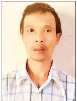
လေးလွင်မျိုး(ခ) ကိုမျိုး(ခ) ပူတူး