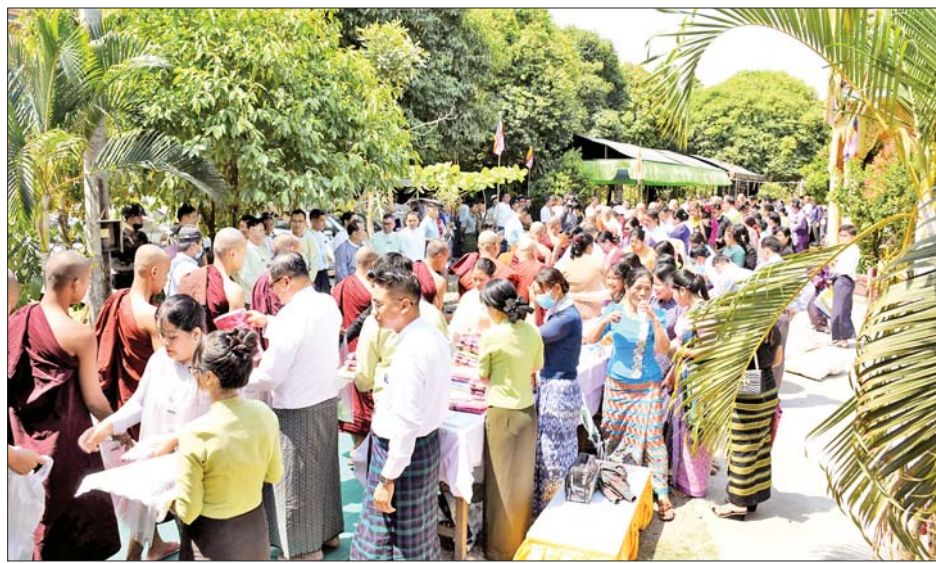
သူကြီးချုပ်၊ ပြည်နယ်ဝန်ကြီးများနှင့် ၎င်းတို့၏ဇနီးမိသားစုဝင်များက လှူဖွယ်ပစ္စည်းများ လောင်းလှူပူဇော်ကြပြီး ပြည်နယ်ဝန်ကြီးချုပ်နှင့် ဇနီး၊ တာဝန်ရှိသူများက ဆရာတော်၊ သံဃာတော်များနှင့် ဒုလ္လာဘရဟန်းခံပုဂ္ဂိုလ်များ၏ ခုလှူဒါန်းမှုအစုအဝေးကို ရေစက်သွန်းချ အမျှပေးဝေခဲ့ကြပြီး ရွတ်ဆို ရုပ်သိမ်းလိုက်ကြောင်း သိရသည်။

မြစ်ကြီးနား ဧပြီ ၈ ကချင်ပြည်နယ်အစိုးရအဖွဲ့မှကြီးမှူး၍ ပြည်နယ်အတွင်း တာဝန်ထမ်းဆောင်လျက်ရှိသော ဌာနဆိုင်ရာ အရာထမ်း၊ အမှုထမ်းများအား မဟာသင်္ကြန်ပွဲတော်ကာလနှင့် မြန်မာနှစ်သစ်ကူးအခါသမယ၌ ရိုးရာယဉ်ကျေးမှုဓလေ့ထုံးစံနှင့်အညီ စုပေါင်းဒုလ္လာဘရဟန်းခံနှင့် သီလရှင်ဝတ်ပွဲ မင်္ဂလာအခမ်းအနားကို ယနေ့နံနက် ၁၀ နာရီတွင် မြစ်ကြီးနားမြို့ ကျောင်းတိုင်ဘုန်းတော်ကြီးကျောင်း၌ ကျင်းပသည်။