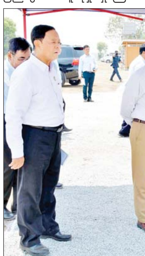
နိုင်ငံတော်စီမံအုပ်ချုပ်ရေးကောင်စီဥက္ကဋ္ဌ နိုင်ငံတော်ဝန်ကြီးချုပ် ဗိုလ်ချုပ်မှူးကြီး မင်းအောင်လှိုင် တပ်ကုန်းမြို့နယ် ရှားတောကျေးရွာ စနစ်တကျ လယ်ယာမြေ ၇၉ ဒသမ ၈၈ ဧက ဖော်ထုတ်ဆောင်ရွက်နေမှုကို ကြည့်ရှုစစ်ဆေးစဉ်။

ဖြစ်ပြီး ပြည်ပနိုင်ငံများသို့ တင်ပို့ ရောင်းချနိုင်သဖြင့် နိုင်ငံဝင်ငွေ တိုးတက်လာမည် ဖြစ်ကြောင်း၊ ထို့ကြောင့် သီးထပ်စွမ်းအားများ ကောင်းမွန်လာအောင် ဆောင်ရွက် ကြရန်လိုကြောင်း။ နေကြာစိုက်ပျိုးမှု တိုးတက်ရေး မိမိတို့နိုင်ငံတွင် စားသုံးဆီဖုလုံ မှုမရှိခြင်းကြောင့် ပြည်ပမှ နှစ်စဉ် တင်သွင်းနေရကြောင်း၊ နိုင်ငံ အတွင်း၌ ဆီထွက်သီးနှံများ စိုက်ပျိုးလျက် ရှိသော်လည်း ပြည်တွင်း ဆီဖုလုံမှုမရှိကြောင်း၊