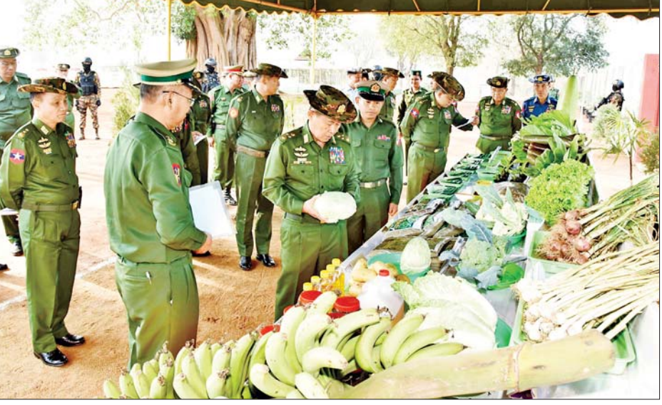
နိုင်ငံတော်စီမံအုပ်ချုပ်ရေးကောင်စီ ဒုတိယဥက္ကဋ္ဌ ဒုတိယတပ်မတော်ကာကွယ်ရေးဦးစီးချုပ် ကာကွယ်ရေးဦးစီးချုပ်(ကြည်း) ဒုတိယဗိုလ်ချုပ်မှူးကြီး စိုးဝင်း တိရစ္ဆာန်မွေးမြူရေးနှင့် လေ့ကျင့်ရေးတပ်ရင်းမှ စိုက်ပျိုးထွက်ရှိသည့် အသီးအရွက်များအား ကြည့်ရှုစစ်ဆေးစဉ်။

ဦးစီးချုပ် ကာကွယ်ရေးဦးစီးချုပ်(ကြည်း)နှင့် အဖွဲ့ဝင်များသည် တိရစ္ဆာန်မွေးမြူရေးနှင့် လေ့ကျင့်ရေးတပ်ရင်းသို့ သွားရောက်၍ တိရစ္ဆာန် မွေးမြူရေးနှင့် လေ့ကျင့်ရေးတပ်ရင်းရှိ စံပြစိုက်ပျိုးမွေးမြူရေးဇုန် စုစုပေါင်း ၅၅ ဧက တည်ဆောက်ထားရှိမှု အခြေအနေ၊ ရာသီသီးနှံနှင့် မြေအစားထိုးသီးနှံ စိုက်ပျိုးထားရှိမှုများ၊ Green House အတွင်း စိုက်ပျိုးထားရှိမှုများနှင့် ကျောက်စိမ်းတစ်သျှူးငှက်ပျော (သီးမွေး) စိုက်ပျိုးထားရှိမှုများ၊ DYL မျိုးမြင့်သားပေါက်ဝက်များနှင့် မြေစိုက်ရေခံ အဆောက်အအုံနှင့် လေလုံအအေးပေး အဆောက်အအုံအတွင်း ဥစားကြက်များ မွေးမြူထားရှိမှု၊ နို့စားနွားနှင့် အသားတီးနွားများ မွေးမြူထားရှိမှုတို့ကို လှည့်လည်ကြည့်ရှုစစ်ဆေးပြီး တာဝန်ရှိသူများအား စိုက်ပျိုးမွေးမြူရေးလုပ်ငန်းများကို ဆောင်ရွက်ရာတွင် အမှန်တကယ်အောင်မြင် ဖြစ်ထွန်းအောင် လုပ်ဆောင်ကြရန်၊ နိုင်ငံတော်စီမံအုပ်ချုပ်ရေးကောင်စီဥက္ကဋ္ဌ နိုင်ငံတော်ဝန်ကြီးချုပ် လမ်းညွှန်ချက်အတိုင်း စိုက်ပျိုးမွေးမြူရေးလုပ်ငန်းများမှ ထွက်ရှိသည့် စာမျက်နှာ ၇ သို့