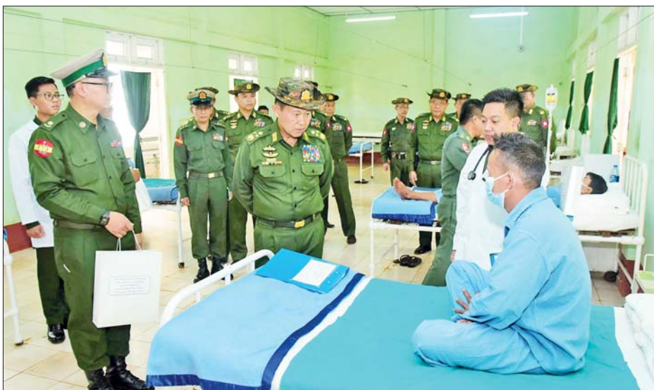
နိုင်ငံတော်စီမံအုပ်ချုပ်ရေးကောင်စီ ဒုတိယဥက္ကဋ္ဌ ဒုတိယတပ်မတော်ကာကွယ်ရေးဦးစီးချုပ် ကာကွယ်ရေးဦးစီးချုပ်(ကြည်း) ဒုတိယဗိုလ်ချုပ်မှူးကြီး စိုးဝင်း ဗထူးမြို့ရှိ တပ်မတော်ဆေးရုံတွင် ဆေးကုသမှုခံယူလျက်ရှိသူတစ်ဦးအား ကြည့်ရှုအားပေးစဉ်။

နေပြည်တော် ဧပြီ ၈ နိုင်ငံတော် စီမံအုပ်ချုပ်ရေးကောင်စီ ဒုတိယဥက္ကဋ္ဌ ဒုတိယတပ်မတော် ကာကွယ်ရေးဦးစီးချုပ် ကာကွယ်ရေးဦးစီးချုပ်(ကြည်း) ဒုတိယဗိုလ်ချုပ်မှူးကြီး စိုးဝင်းသည် ဇနီး ဒေါ်သန်းသန်းနွယ်၊ ညှိနှိုင်းကွပ်ကဲရေးမှူး(ကြည်း၊ ရေလေ) ဗိုလ်ချုပ်ကြီး မောင်မောင်အေးနှင့်ဇနီး ကာကွယ်ရေးဦးစီးချုပ်မှူး တပ်မတော်အရာရှိကြီးများ၊ အရှေ့ပိုင်းတိုင်းစစ်ဌာနချုပ် တိုင်းမှူးတို့လိုက်ပါ၍ ယနေ့နံနက်ပိုင်းတွင် ရှမ်းပြည်နယ် (တောင်ပိုင်း) ဗထူးတပ်နယ်ရှိ တပ်မတော်ဆေးရုံ၊ တိရစ္ဆာန်မွေးမြူရေးနှင့် လေ့ကျင့်ရေးတပ်ရင်းနှင့် တပ်နယ်အတွင်း စိုက်ပျိုး/မွေးမြူရေးလုပ်ငန်းများ ဆောင်ရွက်ထားရှိမှုတို့ကို သွားရောက်ကြည့်ရှုစစ်ဆေးသည်။ လိုက်လံကြည့်ရှု ဦးစွာ နိုင်ငံတော်စီမံအုပ်ချုပ်ရေးကောင်စီဒုတိယဥက္ကဋ္ဌ ဒုတိယတပ်မတော် ကာကွယ်ရေးဦးစီးချုပ် ကာကွယ်ရေးဦးစီးချုပ်(ကြည်း) ဒုတိယဗိုလ်ချုပ်မှူးကြီး စိုးဝင်းသည် အဖွဲ့ဝင်များလိုက်ပါ၍ ဗထူးမြို့ရှိ တပ်မတော်ဆေးရုံသို့ ရောက်ရှိရာ ဆေးရုံတပ်မှူးနှင့် တာဝန်ရှိသူများက ကြိုဆိုနှုတ်