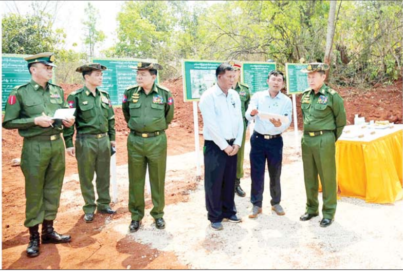
နိုင်ငံတော်စီမံအုပ်ချုပ်ရေးကောင်စီ ဒုတိယဥက္ကဋ္ဌ ဒုတိယတပ်မတော်ကာကွယ်ရေးဦးစီးချုပ် ကာကွယ်ရေးဦးစီးချုပ် (ကြည်း) ဒုတိယဗိုလ်ချုပ်မှူးကြီး စိုးဝင်း တပ်မတော်(ကြည်း) တိုက်ခိုက်ရေးကျောင်း(ဗထူး)ပေါင်းစည်းလယ်ယာ(ဗထူးစမ်း)၌ နွေစပါး ရှစ်ဧက စိုက်ပျိုးထားရှိမှုကို ကြည့်ရှုစစ်ဆေးစဉ်။

ပေးခြင်း၊ ရောင်းချသည့်မျိုးစေ့မှ မိသားစုများ အကျိုးအမြတ်များစွာ ရရှိစေခြင်း၊ တပ်မတော်တပ်ရင်း၊ တပ်ဖွဲ့အားလုံးသို့ မျိုးကောင်း မျိုးသန့် မျိုးစေ့များဖြန့်ဝေနိုင်ရေး ကာကွယ်ရေးဦးစီးချုပ်ရုံး (ကြည်း) မှ တာဝန်ပေးထားသည့် မျိုးသန့် မျိုးစေ့ ထုတ်လုပ်ရေးတပ်နှင့် ညှိနှိုင်း၍ အမြန်ဆုံးဆောင်ရွက် သွားရန် ညွှန်ကြားခဲ့ကြောင်း၊ အဆိုပါဇုန်အတွင်း စိုက်ပျိုးထားရှိ သည့် ခရမ်းမျိုးစိတ်မှာ ဒေသမျိုး ရင်းဖြစ်ပြီး ပျိုးသက်အနေဖြင့် ရက်ပေါင်း ၃၀ မှ ၄၀ ခန့် ကြာမြင့် ကာ စိုက်ပျိုးပြီး သုံးလအတွင်း စတင်အသီးသီးကြောင်း၊ ခရမ်း ပင်သီးနှုန်းမှာ တစ်ပင်လျှင် ပျမ်းမျှ ၁၅ လုံးမှ အလုံး ၂၀ (ငါးပိဿာခန့်) ရှိပြီး ခရမ်းသီး တစ်ပိဿာလျှင် ပြင်ပပေါက်ဈေး ငွေကျပ် ၁၀၀၀