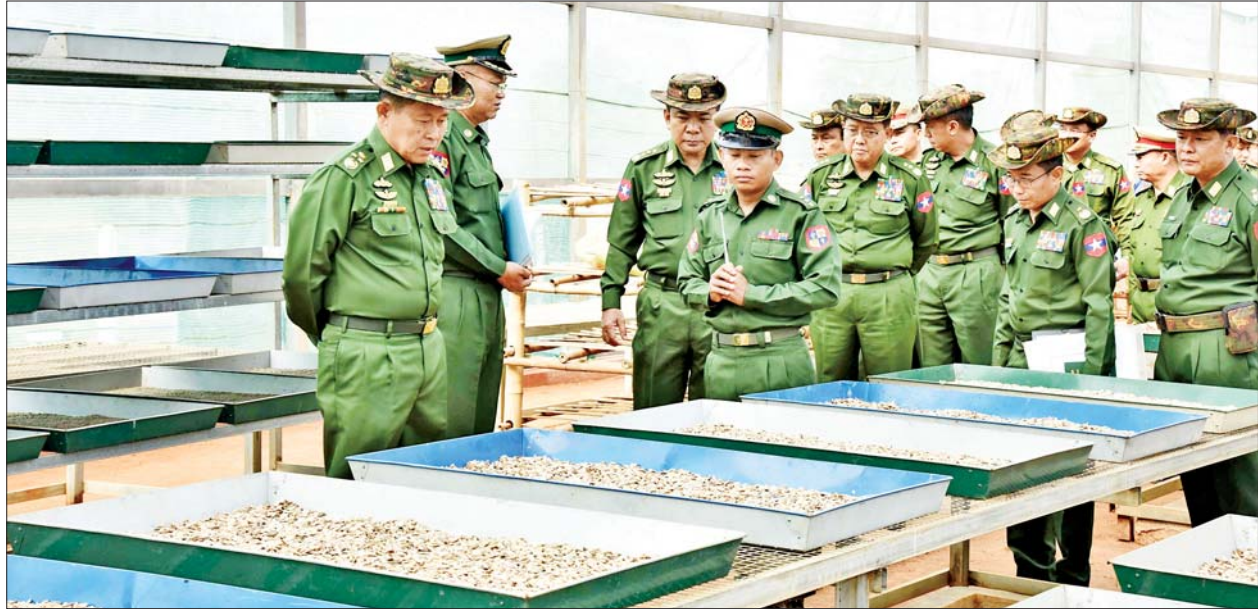
နိုင်ငံတော်စီမံအုပ်ချုပ်ရေးကောင်စီ ဒုတိယဥက္ကဋ္ဌ ဒုတိယတပ်မတော်ကာကွယ်ရေးဦးစီးချုပ် ကာကွယ်ရေးဦးစီးချုပ် (ကြည်း) ဒုတိယ ဗိုလ်ချုပ်မှူးကြီး စိုးဝင်း တိရစ္ဆာန်မွေးမြူရေးနှင့် လေ့ကျင့်ရေးတပ်ရင်း၌ သုတေသနပြုလုပ်ထားသည့် မျိုးစေ့များ ကြည့်ရှုစစ်ဆေးစဉ်။

ရှင်းလင်းတင်ပြ ဆက်လက်၍ နိုင်ငံတော်စီမံ အုပ်ချုပ်ရေးကောင်စီ ဒုတိယ ဥက္ကဋ္ဌ ဒုတိယတပ်မတော်ကာကွယ် ရေးဦးစီးချုပ် ကာကွယ်ရေးဦးစီး ချုပ် (ကြည်း) နှင့် အဖွဲ့ဝင်များသည် တပ်မတော် (ကြည်း) တိုက်ခိုက် ရေးကျောင်း(ဗထူး) ပေါင်းစည်း လယ်ယာ(ဗထူးစမ်း)သို့ သွားရောက် ၍ ဆည်မြောင်းနှင့် ရေအသုံးချမှု ရှိ ဆည်မြောင်းနှင့် ရေအသုံးချမှု အညီဖြင့် ရေကျော်တစ်အသေး တည်ဆောက်လျက် လယ်မြေသစ် များဖော်ထုတ်၍ ၎င်းလယ်မြေ များတွင် အာလူး တစ်ဧကနှင့်