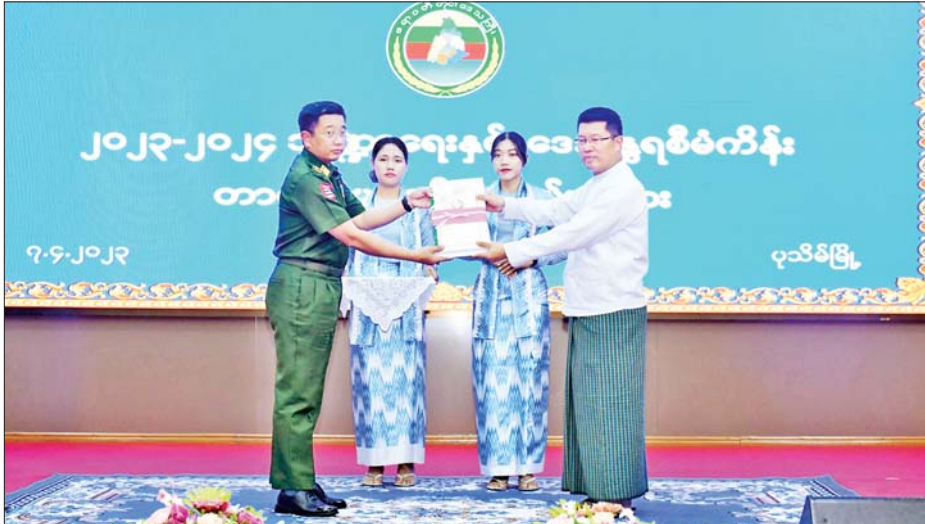
ဆိုင်ရာများအား တိုင်းဒေသကြီး၏ ဒေသန္တရစီမံကိန်း ဒေသန္တရစီမံကိန်းတာဝန်များကို လည်းကောင်း တာဝန်များကိုလည်းကောင်း၊ ခရိုင်စီမံအုပ်ချုပ်ပေးအပ်ခဲ့ကြောင်း သိရသည်။ ဧရာရွှေဝါခန်းမအား သက်ဆိုင်ရာခရိုင်များ၏ တိုင်းဒေသကြီး(ပြန်/ဆက်)

လိုအပ်ချက်များကိုလည်း ဒေသံပြည်သူများ၏ တင်ပြချက်များအား အလေးထား၍ သက်ဆိုင်ရာ ကဏ္ဍအလိုက် ဖြည့်ဆည်းဆောင်ရွက်ပေးနိုင်ရေး ဘဏ္ဍာနှစ်အလိုက် လျာထားဆောင်ရွက်ရန်လိုကြောင်း၊ စိုက်ပျိုး၊ မွေးမြူရေးကို အခြေခံ၍ ကုန်ထုတ်လုပ်ငန်းများ တိုးတက်လာရန် ကြိုးပမ်းရမည် ဖြစ်ကြောင်း၊ စိုက်ပျိုးသီးနှံများ ပန်းတိုင်အထွက်နှုန်းရောက်စေရေးနှင့် စံနမူနာပြုတိုင်းဒေသကြီး ဖြစ်စေရေးဆောင်ရွက်ရမည်ဖြစ်ကြောင်း၊ စီမံကိန်းလုပ်ငန်းများ ပိုမိုအောင်မြင်ရန် တာဝန်ရှိသူများ အနေဖြင့် ကဏ္ဍများအလိုက် ကြပ်မတ်ဆောင်ရွက်ရန်လိုကြောင်း ပြောကြားသည်။ ဆက်လက်၍ တိုင်းဒေသကြီးဝန်ကြီးချုပ်က အစိုးရအဖွဲ့ဝန်ကြီးများနှင့် တိုင်းအဆင့်ဌာန