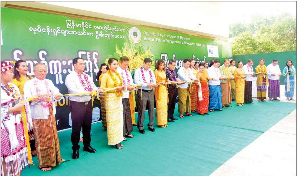
ပြည်ထောင်စုဝန်ကြီး ဦးမောင်မောင်အုန်း၊ ရန်ကုန်တိုင်းဒေသကြီးဝန်ကြီးချုပ် ဦးစိုးသိန်း၊ ဒုတိယဝန်ကြီး ဦးဇော်အေးမောင်၊ ရန်ကုန်တိုင်းဒေသကြီး တိုင်းရင်းသားရေးရာဝန်ကြီး ဦးစောကျက်ကျော့တူးနှင့် တာဝန်ရှိသူများက မြန်မာ့ရိုးရာနှစ်သစ်ကူးသင်္ကြန်အကြိုနှင့် ဈေးရောင်းပွဲတော် ၂၀၂၃ ကို ဖဲကြိုးဖြတ်ဖွင့်လှစ်ပေးစဉ်။

အခမ်းအနားသို့ ပြန်ကြားရေး ဝန်ကြီးဌာန ပြည်ထောင်စုဝန်ကြီး ဦးမောင်မောင်အုန်း၊ ရန်ကုန်တိုင်းဒေသကြီးဝန်ကြီးချုပ် ဦးစိုးသိန်း၊ တိုင်းရင်းသား လူမျိုးရေးရာ ဝန်ကြီးဌာန ဒုတိယဝန်ကြီး ဦးဇော်အေးမောင်၊ ရန်ကုန်တိုင်းဒေသကြီး တိုင်းရင်းသားရေးရာ ဝန်ကြီး ဦးစောကျက်ကျော့တူး၊ သမဝါယမနှင့်ကျေးလက်ဖွံ့ဖြိုးရေးဝန်ကြီးဌာန အသေးစားစက်မှုလက်မှု လုပ်ငန်းဦးစီးဌာန ညွှန်ကြားရေးမှူးချုပ် ဦးသိန်းတိုးနှင့် ဌာနဆိုင်ရာအကြီးအကဲများ၊ မြန်မာနိုင်ငံဆိုင်ရာ အိန္ဒိယသံရုံးမှ Counsellor ဖြစ်သူ Mr. R.C.Yadavi Centre for Investment and Trade မှ CEO ဖြစ်သူ Dr.Sital Kumar၊ ပြည်ထောင်စုသမ္မတ