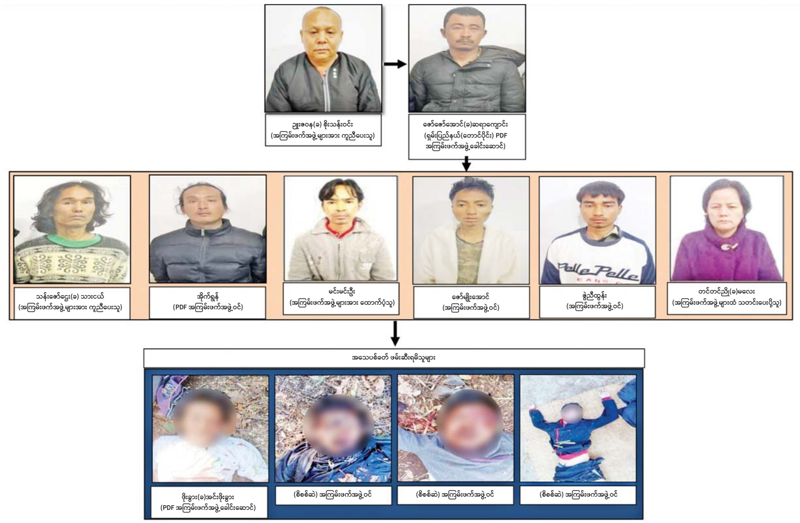
၂၀၂၂-၂၀၂၂ ရက်တွင် အင်းလေးဒေသအတွင်း၌ အကြမ်းဖက်လုပ်ငန်းများ လုပ်ဆောင်မည့် PDF အကြမ်းဖက်အဖွဲ့ဝင်များအား လက်နက်/ခဲယမ်းများနှင့်အတူ ဖော်ထုတ်ဖမ်းဆီးရမိမှု

နှင့် အကြမ်းဖက်သမားများအား ကြိုတင်သတင်းလက်ဦးမှုရယူ၍ ဖော်ထုတ် ဖမ်းဆီးခြင်းများကို အရှိန်အဟုန်ဖြင့် ဆောင်ရွက် လျက်ရှိသည်။ ထိုသို့ လုံခြုံရေးတပ်ဖွဲ့ဝင်များ ၏ နေ/ညမပြတ် သတင်းစုံစမ်း စစ်ဆေး ဖော်ထုတ်မှုများကြောင့် ၂၀၂၃ ခုနှစ် ဧပြီ ၅ ရက် နံနက် ၂၀၂၃ ခုနှစ် ဧပြီ ၅ ရက် နံနက် မှုကိုမလိုလားသည့် ပြည်သူများ မှ လျှို့ဝှက်စွာ သတင်းပေးပို့ခဲ့ပြီး လုံခြုံရေး တပ်ဖွဲ့ဝင်များအနေဖြင့် လည်း အင်းလေးဒေသအတွင်း နယ်မြေတည်ငြိမ်အေးချမ်းရေး၊ အကြမ်းဖက်သမားများ၏ အန္တရာယ် မှ တားဆီးကာကွယ် နှိမ်နင်းရေး