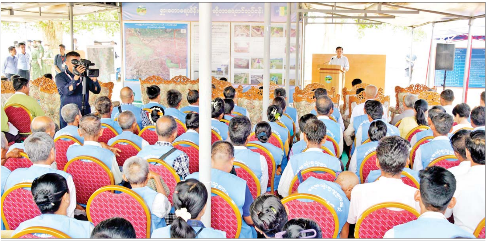
နိုင်ငံတော်စီမံအုပ်ချုပ်ရေးကောင်စီဥက္ကဋ္ဌ နိုင်ငံတော်ဝန်ကြီးချုပ် ဗိုလ်ချုပ်မှူးကြီး မင်းအောင်လှိုင် တပ်ကုန်းမြို့နယ် ရှားတောကျေးရွာ ဆင်သေချောင်း ယာယီရေထိန်း ဆည်လုပ်ငန်းဆောင်ရွက်နေမှုနှင့် ဆိုလာစနစ်သုံးရေတင်စနစ်ဆောင်ရွက်နေမှုများ ကြည့်ရှုစစ်ဆေးပြီး ဒေသခံစိုက်ပျိုးရေးတောင်သူများအား တွေ့ဆုံအမှာစကားပြောကြားစဉ်။

ထို့နောက် နိုင်ငံတော်စီမံအုပ်ချုပ် ရေးကောင်စီဥက္ကဋ္ဌ နိုင်ငံတော် ဝန်ကြီးချုပ်သည် စိုက်ပျိုးရေး တောင်သူများနှင့် တွေ့ဆုံအမှာ စကားပြောကြားရာတွင် မိမိတို့ အနေဖြင့် နိုင်ငံတော်တာဝန်ယူချိန် နောက်ပိုင်းတွင် အဓိကအားဖြင့် တိုင်းပြည်သာယာပြောရေးနှင့် စားရေရိက္ခာ ဖူလုံရေးအတွက် ဦးတည် ဆောင်ရွက်လျက်ရှိ ကြောင်း၊ သာယာပြောရေး၌ စားရေရိက္ခာ ဖူလုံခြင်းအပြင် တရားဥပဒေစိုးမိုးခြင်း၊ အသိ ပညာ အတတ်ပညာ ပေါ်ကြွယ်ဝ ခြင်းတို့လည်း ပါဝင်ကြောင်း။