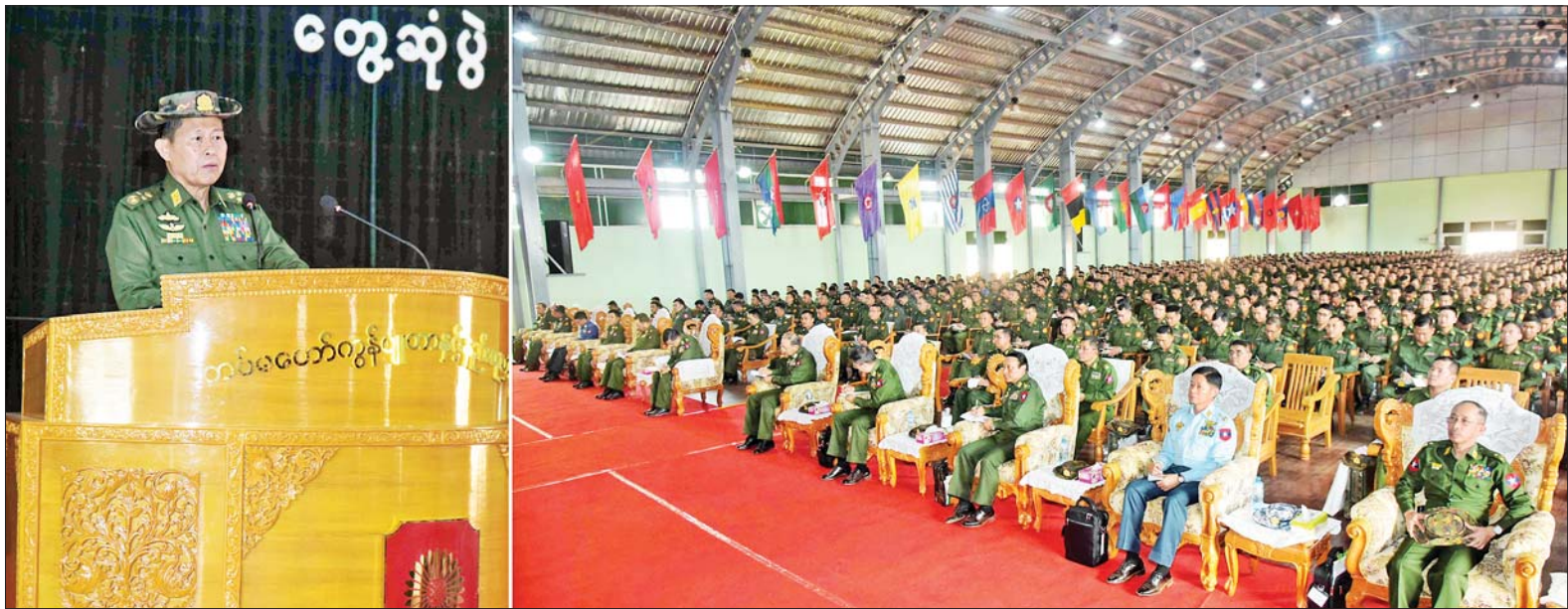
နိုင်ငံတော်စီမံအုပ်ချုပ်ရေးကောင်စီ ဒုတိယဥက္ကဋ္ဌ ဒုတိယတပ်မတော်ကာကွယ်ရေးဦးစီးချုပ် ကာကွယ်ရေးဦးစီးချုပ်(ကြည်း) ဒုတိယဗိုလ်ချုပ်မှူးကြီး စိုးဝင်း ဟိုပုံးတပ်နယ် တပ်မတော်ကွန်ပျူတာနှင့် နည်းပညာသိပ္ပံကျောင်းမှ နည်းပြများနှင့် သင်တန်းသားများအား တွေ့ဆုံအမှာစကားပြောကြားစဉ်။

မိမိ တာဝန်ထမ်းဆောင်ရာ နယ်မြေဒေသဆိုင်ရာ ဖွံ့ဖြိုးရေး လုပ်ငန်းများတွင် အင်ဂျင်နီယာ ဆိုင်ရာကိစ္စရပ်များ၊ အင်ဂျင်နီယာနှင့်ပတ်သက်သည့် လူ့စွမ်းအား အရင်းအမြစ်ဆိုင်ရာ ကိစ္စရပ်များ တွင်လည်း လိုအပ်လာပါက