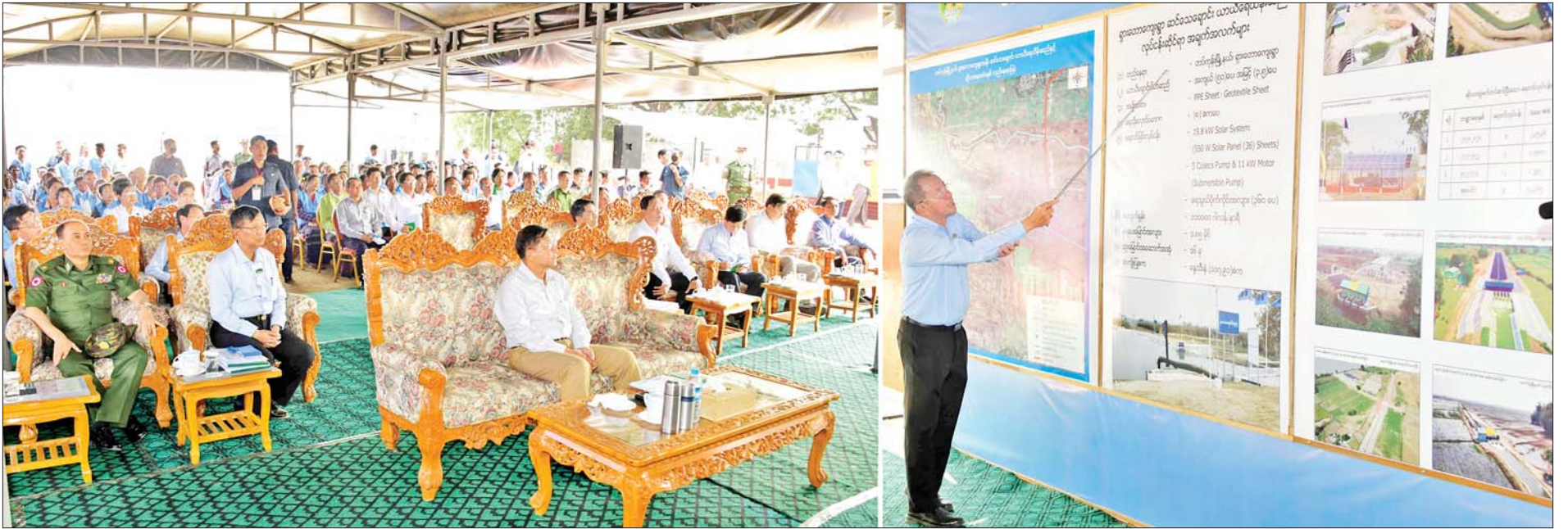
နိုင်ငံတော်စီမံအုပ်ချုပ်ရေးကောင်စီဥက္ကဋ္ဌ နိုင်ငံတော်ဝန်ကြီးချုပ် ဗိုလ်ချုပ်မှူးကြီး မင်းအောင်လှိုင်အား တာဝန်ရှိသူတစ်ဦးက ရှင်းလင်းတင်ပြစဉ်။

★ ရှေးဖွဲ့မှ နိုင်ငံတော်စီမံအုပ်ချုပ်ရေးကောင်စီဝန်ကြီးချုပ် ဗိုလ်ချုပ်မှူးကြီး မင်းအောင်လှိုင်အား တာဝန်ရှိသူတစ်ဦးက ရှင်းလင်းတင်ပြစဉ်။