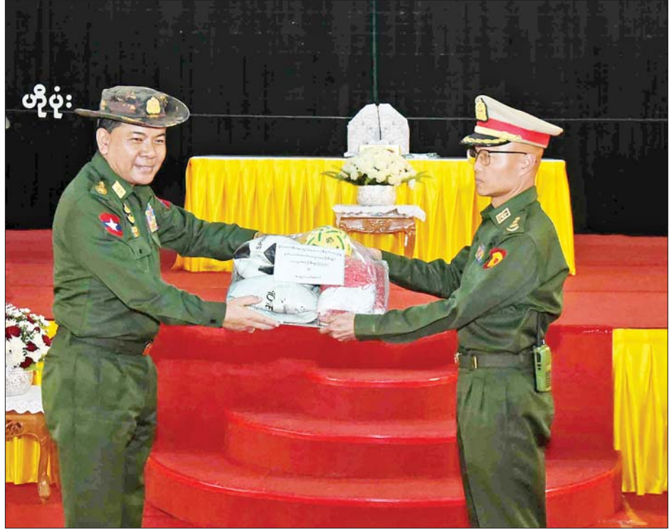
ညှိနှိုင်းကွပ်ကဲရေးမှူး(ကြည်း)၊ ရေ၊ လေ) ဗိုလ်ချုပ်ကြီး မောင်မောင်အေးက သင်တန်းသားများအတွက် အားကစားပစ္စည်းများကို ပေးအပ်စဉ်။