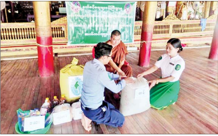
အပါအဝင် တိုင်းဒေသကြီး/ပြည်နယ်များ အခဲမရှိစေရေး ဆန်၊ ဆီ၊ ဆား၊ ကုလားပဲ ရှိ ဘုန်းတော်ကြီးကျောင်း၊ သီလရှင် အမယ်လေးမျိုးတို့ကို ဆက်ကပ်လှူဒါန်း ကျောင်းများသို့ ဆွမ်းဆန်တော် အခက် လျက်ရှိကြောင်း သိရသည်။ သတင်းစဉ်

နေပြည်တော် ဧပြီ ၈ နယ်စပ်ရေးရာဝန်ကြီးဌာန နယ်စပ် ဒေသနှင့် တိုင်းရင်းသားလူမျိုးများ ဖွံ့ဖြိုး တိုးတက်ရေးဦးစီးဌာန မောက်မယ်မြို့နယ် ဖွံ့ဖြိုးမှုကြီးကြပ်ရေးရုံးမှ လက်ထောက် ညွှန်ကြားရေးမှူးနှင့် တာဝန်ရှိသူများသည် ယမန်နေ့နံနက်ပိုင်းတွင် ရှမ်းပြည်နယ် (တောင်ပိုင်း) လင်းခေးခရိုင် မောက်မယ်မြို့ ဆီဆုံရပ်ကွက် မောက်စံ ဘုန်းတော်ကြီးကျောင်းရှိ သံဃာတော် များအတွက် ဆွမ်းဆန်တော်၊ ဆီ၊ ဆား၊ ကုလားပဲနှင့် ဆေးများ ဆက်ကပ်လှူဒါန်း ကြသည်။ နယ်စပ်ရေးရာ ဝန်ကြီးဌာန အနေဖြင့် နေပြည်တော်ကောင်စီနယ်မြေ