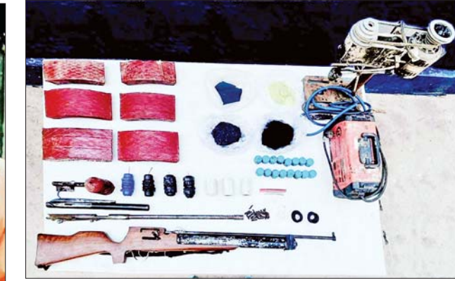
၂၀၂၃ ခုနှစ် ဧပြီ ၅ ရက်တွင် ညောင်ရွှေမြို့ မိုင်းလီ (၅)ရပ်ကွက်၌ တရားခံများနှင့်အတူ ဖမ်းဆီးရမိခဲ့သည့် လက်နက်/ခဲယမ်းနှင့် မိုင်းများ၏ မှတ်တမ်းဓာတ်ပုံ