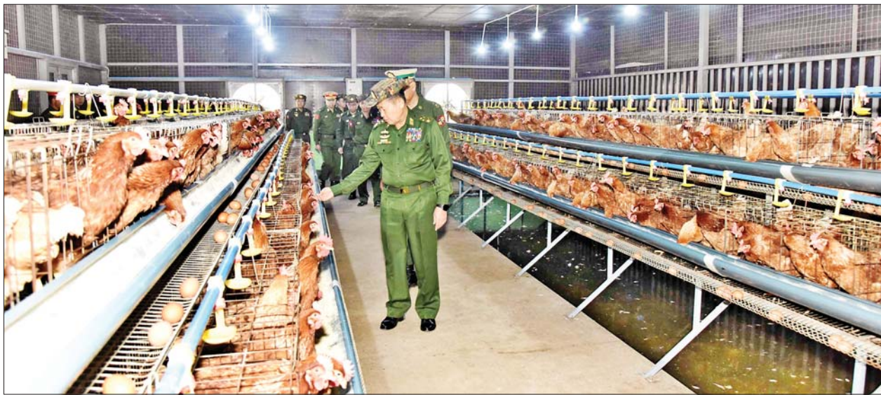
နိုင်ငံတော်စီမံအုပ်ချုပ်ရေးကောင်စီ ဒုတိယဥက္ကဋ္ဌ ဒုတိယတပ်မတော်ကာကွယ်ရေးဦးစီးချုပ် ကာကွယ်ရေးဦးစီးချုပ် (ကြည်း) ဒုတိယ ဗိုလ်ချုပ်မှူးကြီး စိုးဝင်း တိရစ္ဆာန်မွေးမြူရေးနှင့် လေ့ကျင့်ရေးတပ်ရင်း၌ ဥစားကြက်များ မွေးမြူထားရှိမှုကို ကြည့်ရှုစစ်ဆေးစဉ်။

ပေးခြင်း၊ ရောင်းချသည့်မျိုးစေ့မှ မိသားစုများ အကျိုးအမြတ်များစွာ ရရှိစေခြင်း၊ တပ်မတော်တပ်ရင်း၊ တပ်ဖွဲ့အားလုံးသို့ မျိုးကောင်း မျိုးသန့် မျိုးစေ့များဖြန့်ဝေနိုင်ရေး ကာကွယ်ရေးဦးစီးချုပ်ရုံး (ကြည်း) မှ တာဝန်ပေးထားသည့် မျိုးသန့် မျိုးစေ့ ထုတ်လုပ်ရေးတပ်နှင့် ညှိနှိုင်း၍ အမြန်ဆုံးဆောင်ရွက် သွားရန် ညွှန်ကြားခဲ့ကြောင်း၊ အဆိုပါဇုန်အတွင်း စိုက်ပျိုးထားရှိ သည့် ခရမ်းမျိုးစိတ်မှာ ဒေသမျိုး ရင်းဖြစ်ပြီး ပျိုးသက်အနေဖြင့် ရက်ပေါင်း ၃၀ မှ ၄၀ ခန့် ကြာမြင့် ကာ စိုက်ပျိုးပြီး သုံးလအတွင်း စတင်အသီးသီးကြောင်း၊ ခရမ်း ပင်သီးနှုန်းမှာ တစ်ပင်လျှင် ပျမ်းမျှ ၁၅ လုံးမှ အလုံး ၂၀ (ငါးပိဿာခန့်) ရှိပြီး ခရမ်းသီး တစ်ပိဿာလျှင် ပြင်ပပေါက်ဈေး ငွေကျပ် ၁၀၀၀