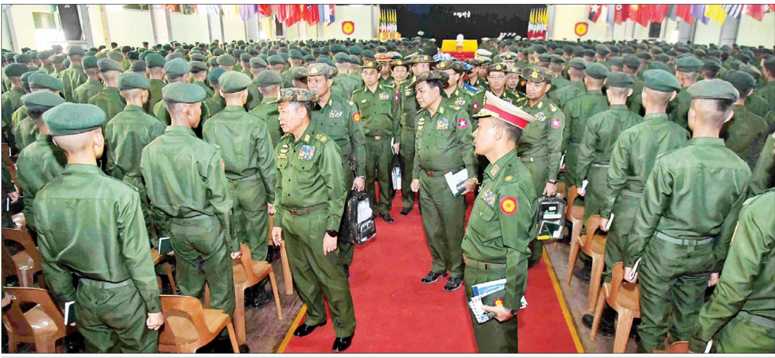
နိုင်ငံတော်စီမံအုပ်ချုပ်ရေးကောင်စီ ဒုတိယဥက္ကဋ္ဌ ဒုတိယတပ်မတော်ကာကွယ်ရေးဦးစီးချုပ် ကာကွယ်ရေးဦးစီးချုပ်(ကြည်း) ဒုတိယဗိုလ်ချုပ်မှူးကြီး စိုးဝင်း ဟိုပုံးတပ်နယ် တပ်မတော်ကွန်ပျူတာနှင့် နည်းပညာသိပ္ပံကျောင်းမှ နည်းပြများနှင့် သင်တန်းသားများကို ရင်းရင်းနှီးနှီး နှုတ်ဆက်စဉ်။

နေပြည်တော် ဧပြီ ၈ နိုင်ငံတော်စီမံအုပ်ချုပ်ရေးကောင်စီ ဒုတိယဥက္ကဋ္ဌ ဒုတိယတပ်မတော်ကာကွယ်ရေးဦးစီးချုပ် ကာကွယ်ရေး ဦးစီးချုပ်(ကြည်း) ဒုတိယဗိုလ်ချုပ်မှူးကြီး စိုးဝင်းသည် ညှိနှိုင်းကွပ်ကဲရေးမှူး(ကြည်း၊ ရေ၊ လေ) ဗိုလ်ချုပ်ကြီး မောင်မောင်အေး၊ ကာကွယ်ရေးဦးစီးချုပ်ရုံးမှ တပ်မတော် အရာရှိကြီးများ၊ အရှေ့ပိုင်းတိုင်းစစ်ဌာနချုပ် တိုင်းမှူးတို့ လိုက်ပါ၍ ယနေ့မွန်းလွဲပိုင်းတွင် ဟိုပုံးတပ်နယ် တပ်မတော် ကွန်ပျူတာနှင့် နည်းပညာသိပ္ပံကျောင်းရှိ အရာရှိ စစ်သည် များ၊ နည်းပြများနှင့် သင်တန်းသားများကို အဆိုပါကျောင်း သင်တန်းခန်းမ၌ သွားရောက်တွေ့ဆုံအမှာစကား ပြောကြား သည်။ စာမျက်နှာ ၈ ကော်လံ ၁ သို့ ✕