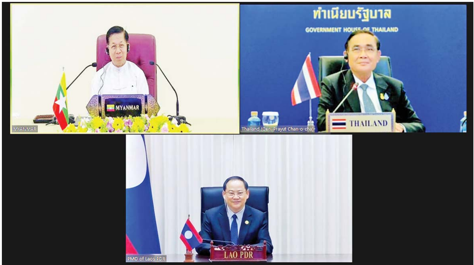
နိုင်ငံတော်စီမံအုပ်ချုပ်ရေးကောင်စီဥက္ကဋ္ဌ နိုင်ငံတော်ဝန်ကြီးချုပ် ဗိုလ်ချုပ်မှူးကြီး မင်းအောင်လှိုင်၊ ထိုင်းနိုင်ငံဝန်ကြီးချုပ် ပရာယုဒ်ချန်အိုချာနှင့် လာအိုနိုင်ငံဝန်ကြီးချုပ် ဆိုဆိုင်ဆီဖန်ဒို တို့ မြန်မာနိုင်ငံ၊ ထိုင်းနိုင်ငံနှင့် လာအိုနိုင်ငံတို့အကြား နယ်စပ်ဖြတ်ကျော် မီးခိုးမြူငွေ့ညစ်ညမ်းမှုဆိုင်ရာ သုံးဦးသုံးဖလှယ် အစည်းအဝေးကို ဗီဒီယိုကွန်ဖရင့်ဖြင့် တွေ့ဆုံဆွေးနွေးစဉ်။

ထိုသို့ တွေ့ဆုံဆွေးနွေးရာတွင် ဦးစွာ ထိုင်းနိုင်ငံဝန်ကြီးချုပ်က ယခုကဲ့သို့ တွေ့ဆုံဆွေးနွေးခြင်းဖြင့် မိမိတို့ အချင်းချင်း ယုံကြည်မှု နားလည်မှုများဖြင့် ဖြေရှင်းဆောင်ရွက်ရမည့် ကိစ္စရပ်များကို ဆောင်ရွက်သွားနိုင်မည်ဟု ယုံကြည်ပါကြောင်း၊ ယခုကိစ္စသည် သုံးနိုင်ငံရှိ ပြည်သူများ၏ လူမှုရေးနှင့် စီးပွားရေးကဏ္ဍများကို ထိခိုက်စေလျက်ရှိကြောင်း၊ ထို့ကြောင့် မိမိတို့ အနေဖြင့် လက်တွဲဖြေရှင်းရမည်ဖြစ်ပြီး အကောင်းဆုံး ဖြေရှင်းနိုင်ရန်အတွက် ဆောင်ရွက်ရမည်ဖြစ်ကြောင်း၊ ထို့ကြောင့် သတင်းအချက်အလက်များကို မျှဝေဆောင်ရွက်ရမည်ဖြစ်ကြောင်း၊ ယခုကဲ့သို့ ဖြေရှင်းဆောင်ရွက်ခြင်းသည် မိမိတို့ ပြည်သူများအတွက် ဆောင်ရွက်သည့် အစည်းအဝေးတစ်ခုပင်ဖြစ်ကြောင်း ပြောကြားသည်။ စာမျက်နှာ ၃ ကော်လံ ၁ သို့ ၀