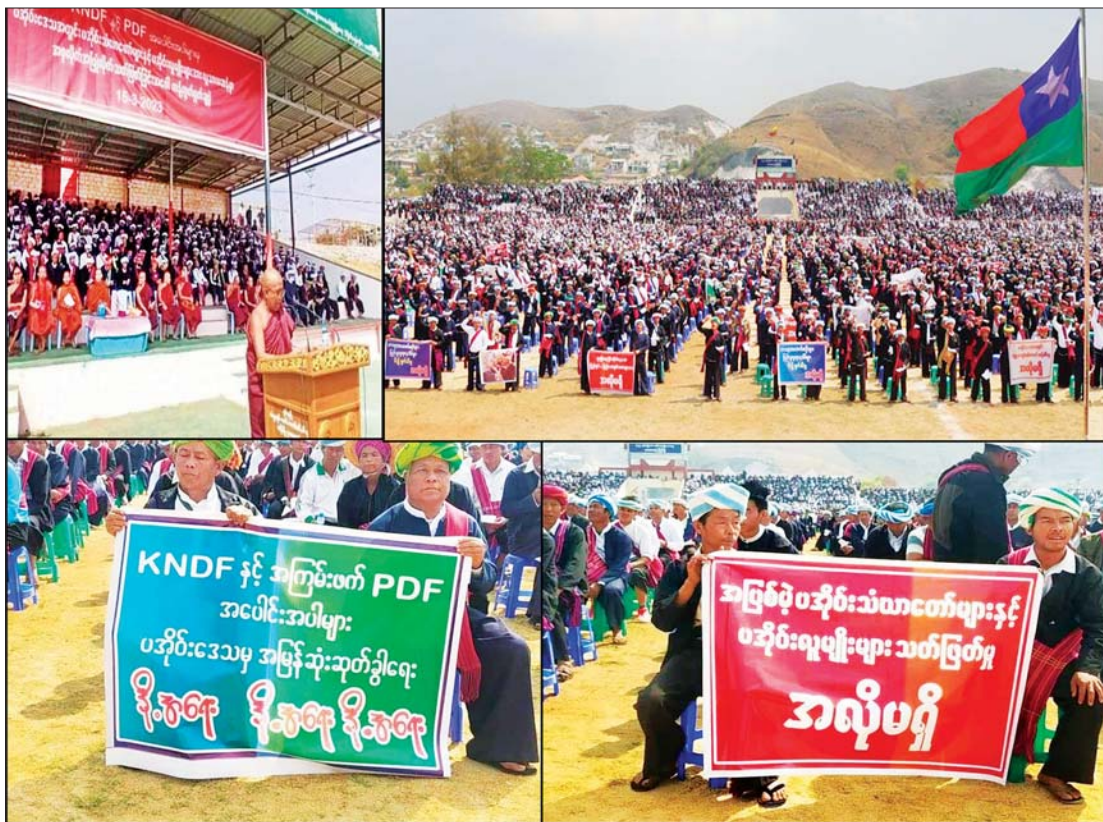
ပအိုဝ်းကိုယ်ပိုင်အုပ်ချုပ်ခွင့်ရဒေသအတွင်း KNDF/KNPP အဖွဲ့တို့နှင့် PDF အမည်ခံ အကြမ်းဖက်အဖွဲ့များက ပအိုဝ်းသံဃာ တော်များနှင့် လူမျိုးများအား လူမဆန်စွာ သတ်ဖြတ်မှုအပေါ် ပြင်းထန်စွာ ဆန့်ကျင်ရှုတ်ချကြောင်း ဆန္ဒထုတ်ဖော်မှုများ။

တပ်မတော်က အာဏာရယူလိုက်ခြင်း ကြောင့် အကြီးအကျယ် ပျက်စီးနေပြီလို့ ဆိုပါတယ်။ နိုလင်းဟောဇာ သိသင့်တာက မြန်မာနိုင်ငံမှာဖြစ်နေတဲ့ အကြမ်းဖက် လုပ်ရပ်တွေဟာ တပ်မတော်က အာဏာ ထိန်းလိုက်လို့ ဖြစ်ပေါ်လာတာမဟုတ်ဘဲ NLD ပါတီမှ အကြမ်းဖက်မှုကို လိုလား သော အစွန်းရောက်ပါတီဝင်အချို့နဲ့ ဖွဲ့စည်းထားတဲ့ NUG အမည်ခံ အကြမ်း ဖက်အဖွဲ့ရဲ့ အလုံးစုံပျက်သုဉ်းရေး လမ်းစဉ်အရ သူတို့လက်အောက်ခံ PDF အမည်ခံ အကြမ်းဖက်အဖွဲ့တွေရဲ့ အကြမ်း ဖက်တိုက်ခိုက်မှုတွေကြောင့်သာ ဖြစ် တယ်ဆိုတာကို အသိပေးလိုပါတယ်။