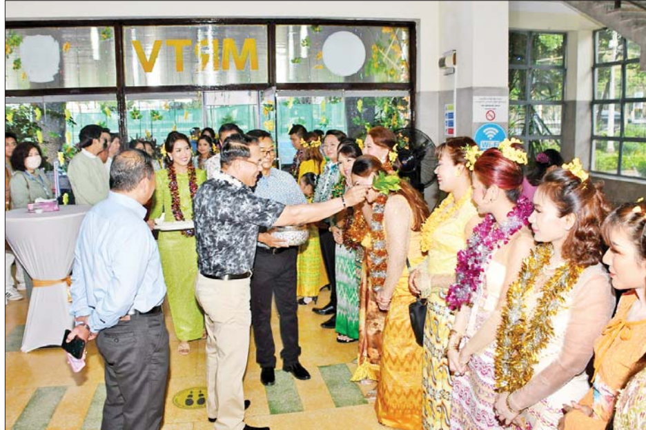
ပြည်ထောင်စုဝန်ကြီး ဦးမောင်မောင်အုန်း “ပိတောက်နှင့်အတူ” တေးဂီတဖျော်ဖြေပွဲသို့ တက်ရောက်လာကြသူများအား မြန်မာ့ရိုးရာယဉ်ကျေးမှုနှင့်အညီ သပြေခက်ဖြင့် ရေပက်ဖျန်းစဉ်။