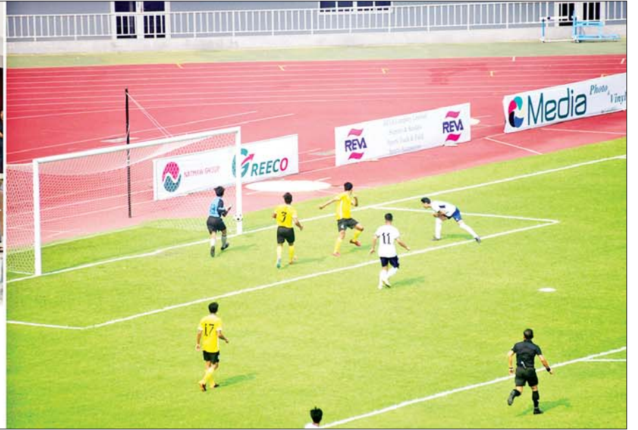
နိုင်ငံတော်စီမံအုပ်ချုပ်ရေးကောင်စီဥက္ကဋ္ဌ နိုင်ငံတော်ဝန်ကြီးချုပ် ဗိုလ်ချုပ်မှူးကြီးမင်းအောင်လှိုင်နှင့် တာဝန်ရှိသူများ သိပ္ပံနှင့် နည်းပညာဝန်ကြီးဌာန တက္ကသိုလ်ပေါင်းစုံ ဘောလုံးပြိုင်ပွဲ ဗိုလ်လုပွဲစဉ်အား ကြည့်ရှုအားပေးစဉ်။