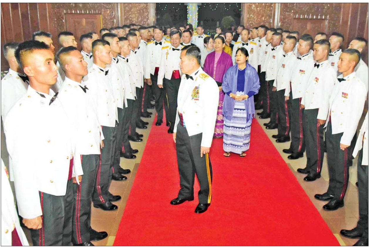
နိုင်ငံတော်စီမံအုပ်ချုပ်ရေးကောင်စီဒုတိယဥက္ကဋ္ဌ ဒုတိယတပ်မတော်ကာကွယ်ရေးဦးစီးချုပ် ကာကွယ်ရေးဦးစီးချုပ်(ကြည်း) ဒုတိယ ဗိုလ်ချုပ်မှူးကြီးစိုးဝင်းနှင့် အဖွဲ့ဝင်များ တပ်မတော်(ကြည်း)ဗိုလ်သင်တန်းကျောင်း(ဗထူး) ဗိုလ်လောင်းသင်တန်း အမှတ်စဉ်(၁၂၆) သူရတပ်ခွဲ သင်တန်းဆင်းဂုဏ်ပြုညစာစားပွဲအခမ်းအနားတွင် ကျောင်းဆင်းအရာရှိများအား ရင်းရင်းနှီးနှီးလိုက်လံနှုတ်ဆက်စဉ်။

နေပြည်တော် ဧပြီ ၇ တပ်မတော်(ကြည်း) ဗိုလ် သင်တန်းကျောင်း (ဗထူး) ဗိုလ်လောင်းသင်တန်းအမှတ်စဉ် (၁၂၆) သူရတပ်ခွဲသင်တန်းဆင်း ဂုဏ်ပြုညစာစားပွဲအခမ်းအနား ကို ယနေ့ညပိုင်းတွင် ဗထူးမြို့ တပ်မတော်(ကြည်း)ဗိုလ်သင်တန်း ကျောင်း(ဗထူး) စစ်ရာထူး ခန့်ထားရေး ခန့်မဆောင်၌ ကျင်းပရာ နိုင်ငံတော်စီမံအုပ်ချုပ် ရေးကောင်စီဥက္ကဋ္ဌ တပ်မတော် ကာကွယ်ရေးဦးစီးချုပ်ကိုယ်စား နိုင်ငံတော် စီမံအုပ်ချုပ်ရေး ကောင်စီ ဒုတိယဥက္ကဋ္ဌ ဒုတိယ တပ်မတော်ကာကွယ်ရေးဦးစီးချုပ် ကာကွယ်ရေးဦးစီးချုပ်(ကြည်း) ဒုတိယဗိုလ်ချုပ်မှူးကြီး စိုးဝင်း တက်ရောက်ချီးမြှင့်သည်။