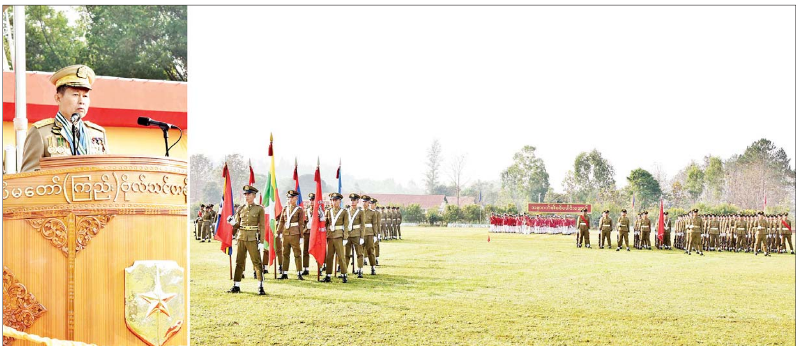
နိုင်ငံတော်စီမံအုပ်ချုပ်ရေးကောင်စီဒုတိယဥက္ကဋ္ဌ ဒုတိယတပ်မတော်ကာကွယ်ရေးဦးစီးချုပ် ကာကွယ်ရေးဦးစီးချုပ်(ကြည်း) ဒုတိယဗိုလ်ချုပ်မှူးကြီး သီရိပျံချီ မဟာသရေစည်သူ စိုးဝင်း တပ်မတော်(ကြည်း) ဗိုလ်သင်တန်းကျောင်း(ဗထူး) ဗိုလ်လောင်းသင်တန်း အမှတ်စဉ်(၁၂၆) သူရတပ်ခွဲသင်တန်းဆင်း ဂုဏ်ပြုစစ်ရေးပြအခမ်းအနားတွင် အမှာစကား ပြောကြားစဉ်။

နေပြည်တော် ဧပြီ ၇ တပ်မတော် (ကြည်း) ဗိုလ်သင်တန်းကျောင်း (ဗထူး) ဗိုလ်လောင်းသင်တန်း အမှတ်စဉ် (၁၂၆) သူရတပ်ခွဲသင်တန်းဆင်း ဂုဏ်ပြုစစ်ရေးပြ အခမ်းအနားကို ယနေ့နံနက်ပိုင်းတွင် ဗထူးမြို့ တပ်မတော်(ကြည်း)ဗိုလ်သင်တန်း ကျောင်း(ဗထူး) စစ်ရေးပြကွင်း၌ ကျင်းပရာ နိုင်ငံတော်စီမံအုပ်ချုပ် ရေးကောင်စီဥက္ကဋ္ဌ တပ်မတော် ကာကွယ်ရေးဦးစီးချုပ် ဗိုလ်ချုပ် မှူးကြီး သတိုးမဟာသရေစည်သူ သတိုးသီရိသုဓမ္မ မင်းအောင်လှိုင် ကိုယ်စား နိုင်ငံတော်စီမံအုပ်ချုပ် ရေးကောင်စီဒုတိယဥက္ကဋ္ဌ ဒုတိယ တပ်မတော်ကာကွယ်ရေးဦးစီးချုပ် ကာကွယ်ရေးဦးစီးချုပ် (ကြည်း) ဒုတိယဗိုလ်ချုပ်မှူးကြီး သီရိပျံချီ မဟာသရေစည်သူ စိုးဝင်း တက်ရောက်မိန့်ခွန်း ပြောကြား သည်။ စာမျက်နှာ ၈ ကော်လံ ၁ သို့ ❖