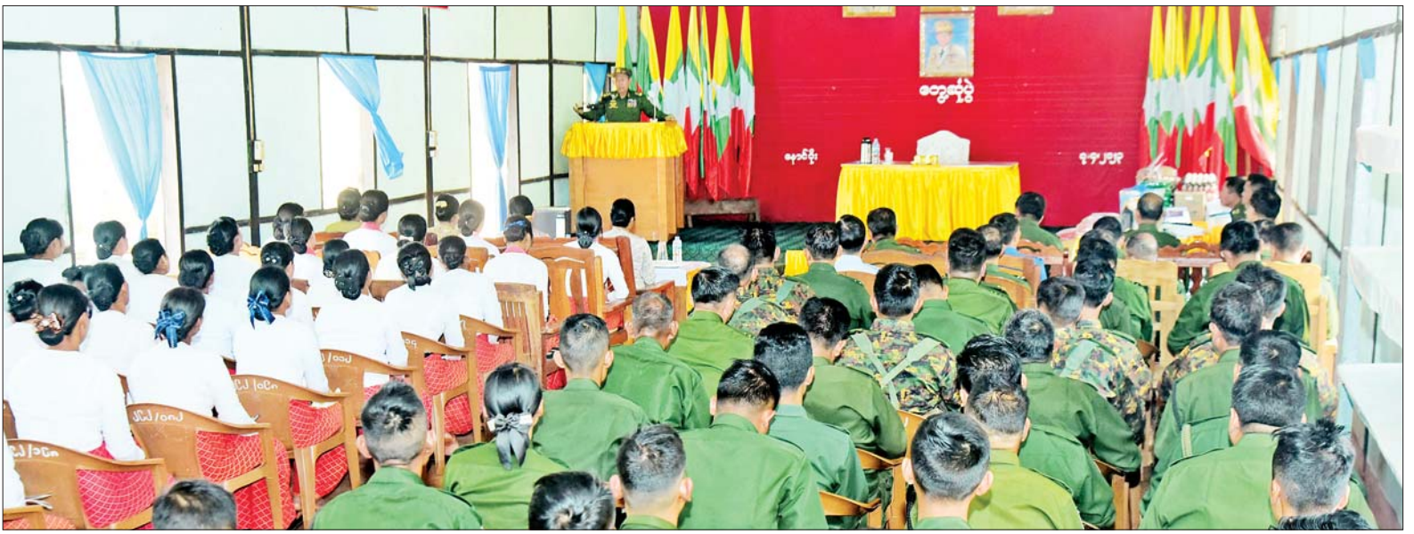
နိုင်ငံတော်စီမံအုပ်ချုပ်ရေးကောင်စီ ဒုတိယဥက္ကဋ္ဌ ဒုတိယတပ်မတော်ကာကွယ်ရေးဦးစီးချုပ် ကာကွယ်ရေးဦးစီးချုပ်(ကြည်း) ဒုတိယဗိုလ်ချုပ်မှူးကြီး စိုးဝင်း နောင်ပိုး တပ်နယ်မှ အရာရှိ၊ စစ်သည်၊ မိသားစုများအား တွေ့ဆုံအမှာစကားပြောကြားစဉ်။

နေပြည်တော် ဧပြီ ၇ နိုင်ငံတော် စီမံအုပ်ချုပ်ရေးကောင်စီ ဒုတိယဥက္ကဋ္ဌ ဒုတိယတပ်မတော် ကာကွယ်ရေးဦးစီးချုပ် ကာကွယ်ရေးဦးစီးချုပ်(ကြည်း) ဒုတိယဗိုလ်ချုပ်မှူးကြီး စိုးဝင်းသည် ဇနီးဒေါ်သန်းသန်းနွယ်၊ ညွှန်ကြားကွပ်ကဲရေးမှူး (ကြည်း၊ ရေလေ) ဗိုလ်ချုပ်ကြီး မောင်မောင်အေးနှင့်ဇနီး၊ ကာကွယ်ရေးဦးစီးချုပ်ရုံးမှ တပ်မတော် အရာရှိကြီးများ၊ အရှေ့ပိုင်းတိုင်း စစ်ဌာနချုပ် တိုင်းမှူးတို့လိုက်ပါ၍ ယနေ့နံနက်ပိုင်းတွင် နောင်ပိုးနှင့် ကျိုင်းခမ်းတပ်နယ်တို့ရှိ နယ်မြေခံတပ်များသို့ သွားရောက်၍ အရာရှိ၊ စစ်သည်၊ မိသားစုများအား သီးခြားစီ တွေ့ဆုံအမှာစကားပြောကြားသည်။