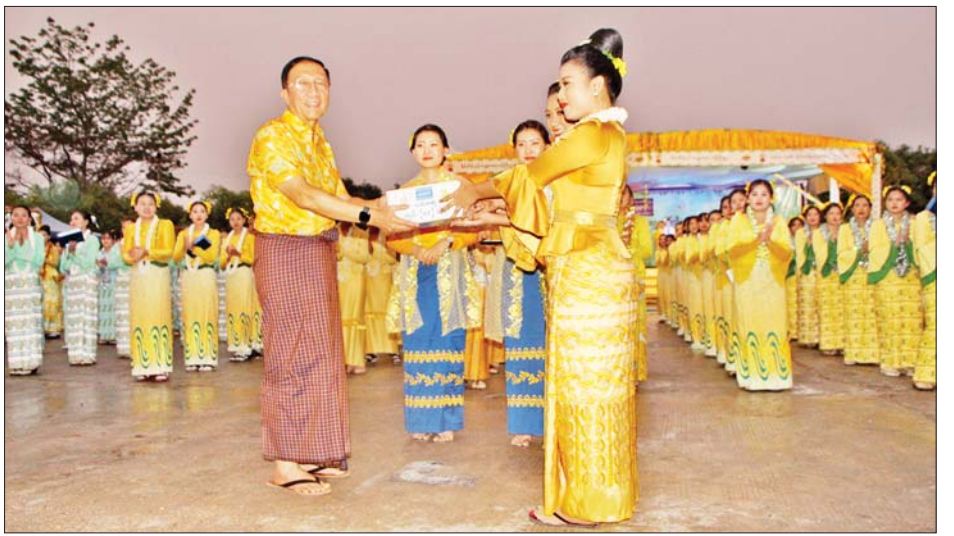
အထိမ်းအမှတ် ဝန်ထမ်းများ သင်္ကြန်ယိမ်းအကပြိုင်ပွဲကို စီမံကိန်းနှင့်ဘဏ္ဍာရေးဝန်ကြီးဌာန ဝန်ထမ်းမိသားစုများ အနေဖြင့် မြန်မာ့ယဉ်ကျေးမှုလေ့ထုံးစံများကို ချစ်ခင်မြတ်နိုးထိန်းသိမ်းနိုင် ကြစေရန်၊ ရာသီပွဲတော်အဖြစ် ပျော်ရွှင်စွာ ပါဝင်ဆင်နွှဲနိုင်ကြစေ ရန်နှင့် မြန်မာ့နှစ်သစ်ကိုကြိုဆိုပြီး အားမာန်အပြည့်၊ စည်းလုံးညီညွတ်စွာဖြင့် နိုင်ငံ့တာဝန်များကို ကြိုးပမ်းထမ်းဆောင်ကြစေရန် ရည်ရွယ် ကျင်းပခြင်းဖြစ်ကြောင်း သိရသည်။

နေပြည်တော် ဧပြီ ၇ - ဒုတိယဝန်ကြီးချုပ်နှင့် စီမံကိန်းနှင့် ဘဏ္ဍာရေးဝန်ကြီးဌာန ပြည်ထောင်စုဝန်ကြီး ဦးဝင်းရှိန်သည် ဒုတိယဝန်ကြီး ဦးမောင်မောင်ဝင်း၊ ဒေါ်သန်းသန်းလင်းတို့နှင့်အတူ ယမန်နေ့ မွန်းလွဲပိုင်းတွင် နေပြည်တော်ရှိ စီမံကိန်းနှင့် ဘဏ္ဍာရေးဝန်ကြီးဌာန၌ ကျင်းပသော ၁၃၈၄ ခုနှစ် မြန်မာ့ရိုးရာမဟာသင်္ကြန်ပွဲအထိမ်းအမှတ် ဝန်ထမ်းများ သင်္ကြန်ယိမ်းအကပြိုင်ပွဲကို ကြည့်ရှုအားပေးပြီး မြန်မာ့ရိုးရာ မဟာသင်္ကြန်ပွဲကို သင်္ကြန်ရေစင်များ ပက်ဖျန်း၍ ပျော်ရွှင်စွာဆင်နွှဲကြသည်။ ဆက်လက်၍ ဝန်ထမ်းများ သင်္ကြန်ယိမ်းအက ပြိုင်ပွဲကို ပြည်ထောင်စုဝန်ကြီးရုံးနှင့် ဝန်ကြီးဌာနအောက်ရှိ ဌာနများမှ ဌာနကိုင်စားပြု စုစုပေါင်း ယိမ်းအဖွဲ့ ၂၀ တို့က ပါဝင်ယှဉ်ပြိုင်ကြသည်။ ထို့ပြင်ပြည်ထောင်စုဝန်ကြီးရုံးနှင့် ဝန်ကြီးဌာနအောက်ရှိ ဌာနများမှ မိမိတို့မဏ္ဍပ်များအလိုက် သင်္ကြန် စတုဒိသာကျွေးမွေးဧည့်ခံကြရာ ဒုတိယဝန်ကြီးချုပ်နှင့် ပြည်ထောင်စုဝန်ကြီး၊ ဖိတ်ကြားထားသော ဧည့်သည်တော်များ၊ ဒုတိယဝန်ကြီးများနှင့် ဌာနဆိုင်ရာ တာဝန်ရှိသူများက ဝန်ထမ်းများနှင့်အတူ ကြည့်ရှုအားပေးခဲ့ကြပြီး ပြိုင်ပွဲတွင် ပထမဆုရရှိသော အကောက်ခွန်ဦးစီးဌာန၊ ဒုတိယဆုရရှိသော ပြည်တွင်းအခွန်များဦးစီးဌာန၊ တတိယဆုရရှိသော ပြည်ထောင်စုဝန်ကြီးရုံး (ရုံးအမှတ်-၂၆)၊ စတုတ္ထဆုရရှိသော ရသုံးမှန်းခြေငွေစာရင်းဦးစီးဌာန၊ ပဉ္စမဆုရရှိသော စီမံကိန်းစိစစ်ရေးနှင့် တိုးတက်မှုအစီရင်ခံရေးဦးစီးဌာနနှင့် နှစ်သိမ့်ဆုရရှိသော ကျန်ဌာနများကို ဆုများချီးမြှင့်ကြသည်။ မြန်မာ့ရိုးရာ မဟာသင်္ကြန်ပွဲ