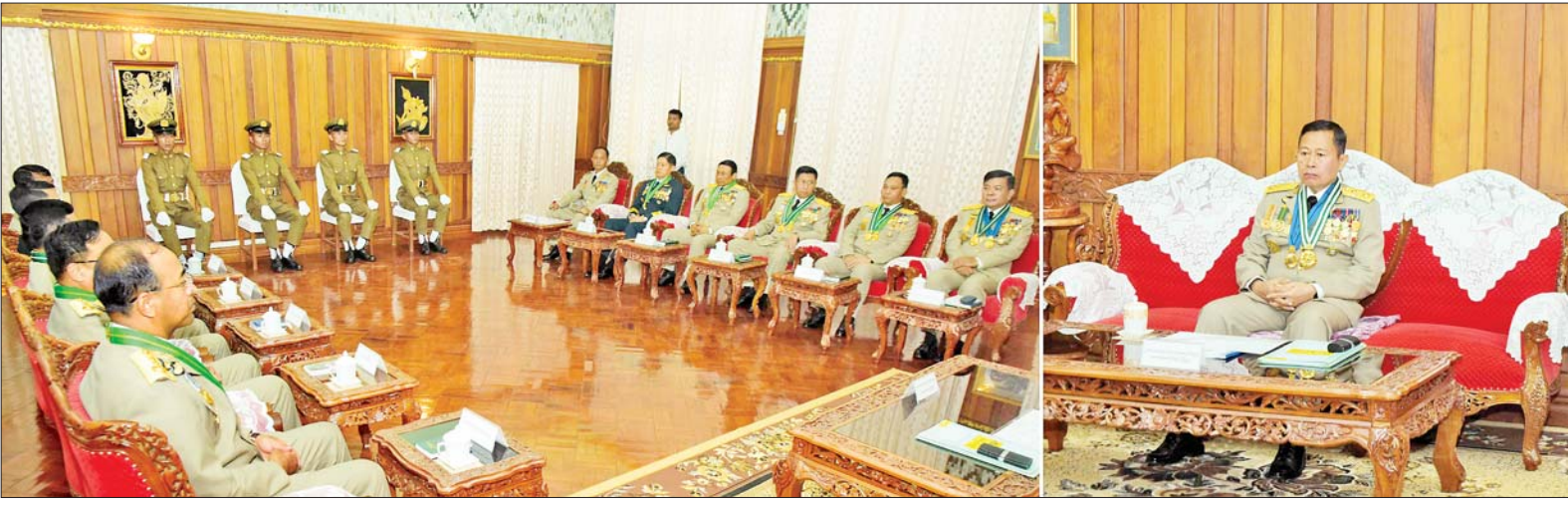
နိုင်ငံတော်စီမံအုပ်ချုပ်ရေးကောင်စီဒုတိယဥက္ကဋ္ဌ ဒုတိယတပ်မတော်ကာကွယ်ရေးဦးစီးချုပ် ကာကွယ်ရေးဦးစီးချုပ်(ကြည်း) ဒုတိယဗိုလ်ချုပ်မှူးကြီး သီရိပျံချိ မဟာသရေစည်သူ စိုးဝင်း ထူးချွန်ဆုရဗိုလ်လောင်းများအား တွေ့ဆုံအမှာစကားပြောကြားစဉ်။

ညီညွတ်မှုတည်ဆောက်မှုအုပ်ချုပ်မှုစနစ် ထို့ကြောင့် တပ်တွင်းစည်းရုံး ရေးကို ရေပက်မဝင်သည့် စည်းရုံး ရေးမျိုးဖြစ်အောင် ညီညွတ်မှုတ သည့် အုပ်ချုပ်မှုစနစ်များနှင့် တည်ဆောက်သွားကြရန်နှင့် မိမိတို့ကိုယ်တိုင် အမိန့်နှင့်ညွှန်ကြား ချက်များအတိုင်း စနစ်တကျ နေထိုင်ရန်လိုအပ်ပြီး တပ်ပြင် စည်းရုံးရေး ရရှိအောင်လည်း မိမိ ကွပ်ကဲရသည့် တပ်ဖွဲ့ဝင်များကို ပြည်သူလူထုအပေါ် ပြုကျင့်ရမည့် ကျင့်ဝတ်များနှင့်အညီ နေထိုင် နိုင်ရေး သင်ကြားကြပ်မတ်သွား ကြရန် လိုအပ်ကြောင်း။ နိုင်ငံ၏ သမိုင်းကြောင်းကို လေ့လာကြည့်မည်ဆိုပါက လွတ် လပ်ရေးရပြီးကာလတွင် ပါလီမန် ဒီမိုကရေစီစနစ်၊ တစ်ပါတီစနစ် ဦးစီးစနစ်နှင့် တိုင်းရင်းသား ပြည်သူလူထု တစ်ရပ်လုံး၏ တောင်းဆိုမှုအရ ယနေ့ ပါတီစုံ ဒီမိုကရေစီစနစ် စသဖြင့် နိုင်ငံရေး စနစ်များ ပြောင်းလဲကျင့်သုံး ခဲ့ကြောင်း၊ ပါတီစုံဒီမိုကရေစီစနစ် ကို တပ်မတော်သားများအားလုံး ကလည်း တစ်ခဲနက်ထောက်ခံ ခဲ့ပြီး စတင်ကျင့်သုံးရာ နောက်ပိုင်း အချို့နိုင်ငံရေး ကိစ္စများတွင် တက်ရောက်လာသည့် အစိုးရနှင့် တပ်မတော်အကြား သဘောထား မတိုက်ဆိုင်မှုများ ရှိခဲ့သော်လည်း တိုင်းပြည်ဖွံ့ဖြိုးတိုးတက်ရေးနှင့် ပါတီစုံဒီမိုကရေစီစနစ် ရှင်သန် ခိုင်မာစေရေးရှေ့၍ တပ်မတော်