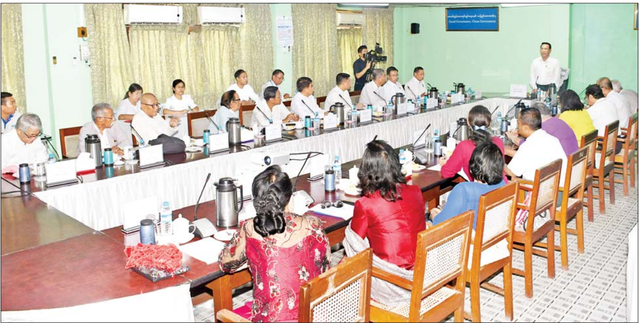
ပြည်ထောင်စုဝန်ကြီး ဦးမောင်မောင်အုန်း ရုပ်ရှင်နှင့် ဗီဒီယိုဆင်ဆာအဖွဲ့ဝင်များနှင့် တွေ့ဆုံဆွေးနွေးပွဲတွင် အမှာစကားပြောကြားစဉ်။

ယဉ်ကျေးမှုထိန်းသိမ်းရေး၊ ရက်စက်ကြမ်းကြုတ်မှုများ ပါဝင်မှုမရှိစေရေးနှင့် ကာမရာဂလှုံ့ဆော်မှုများ ပါဝင်မှုမရှိရေးဆိုသည့် စည်းကမ်းချက် ခြောက်ချက်နှင့်အညီ စစ်ဆေးဆောင်ရွက်နေရပါကြောင်း။ ဆင်ဆာအဖွဲ့ဝင်များအနေဖြင့် တင်ပြလာသော ဇာတ်ကားများအား ပြည်သူများအတွက် အဆိပ်