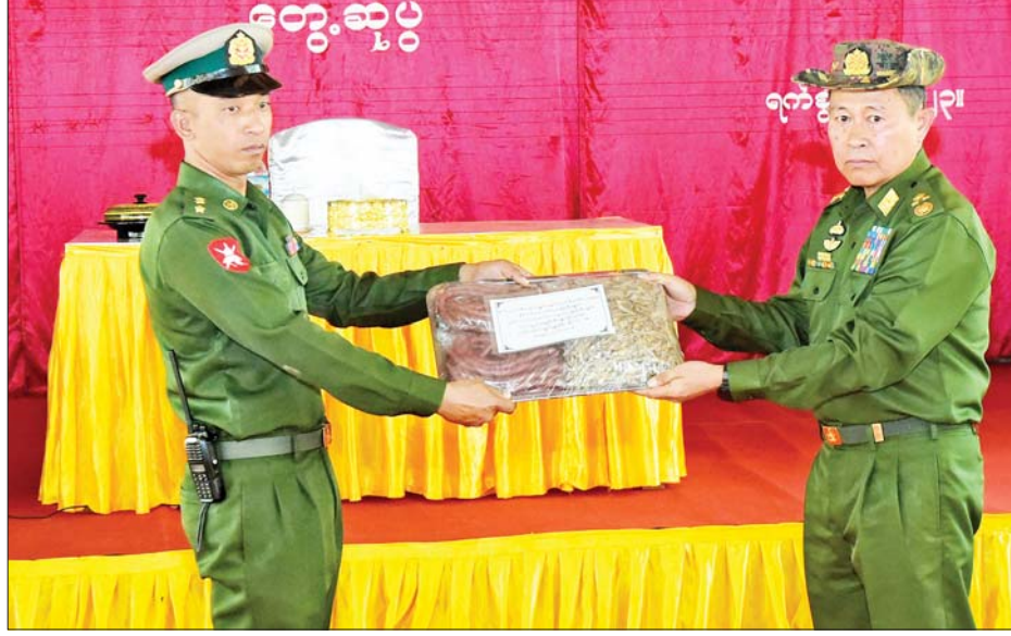
နိုင်ငံတော်စီမံအုပ်ချုပ်ရေးကောင်စီ ဒုတိယဥက္ကဋ္ဌ ဒုတိယတပ်မတော်ကာကွယ်ရေးဦးစီးချုပ် ကာကွယ်ရေးဦးစီးချုပ်(ကြည်း) ဒုတိယဗိုလ်ချုပ်မှူးကြီး စိုးဝင်း ကျိုင်းခမ်းတပ်နယ်မှ အရာရှိ၊ စစ်သည်၊ မိသားစုများအတွက် တပ်မတော်စက်ရုံများမှ ထုတ်လုပ်သည့် စားသောက်ကုန်ပစ္စည်းများ ပေးအပ်စဉ်။

ကာကွယ်ရေးတာဝန်ကို ကျေပွန်စွာ ထမ်းဆောင်နိုင်ရေးအတွက် စွမ်းရည်ရှိသောတပ်ကို တည်ဆောက်နိုင်ရန် တပ်တည်ဆောက်ရေးလုပ်ငန်းကြီး (၄)ရပ်ကို အပြည့်အဝ အကောင်အထည်ဖော်နိုင်ရန် လိုအပ်ကြောင်း။