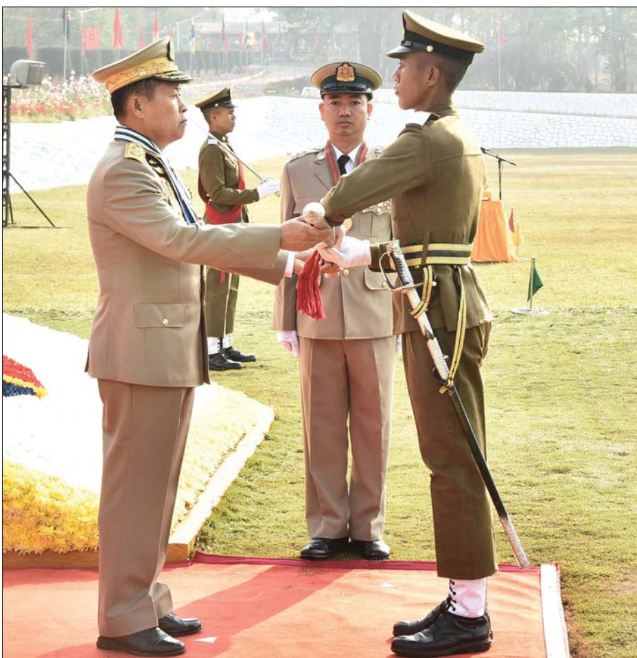
နိုင်ငံတော်စီမံအုပ်ချုပ်ရေးကောင်စီဒုတိယဥက္ကဋ္ဌ ဒုတိယတပ်မတော်ကာကွယ်ရေးဦးစီးချုပ် ကာကွယ်ရေးဦးစီးချုပ်(ကြည်း) ဒုတိယဗိုလ်ချုပ်မှူးကြီး သီရိပျံချီ မဟာသရေစည်သူ စိုးဝင်း အကောင်းဆုံး ဗိုလ်လောင်းဆုရရှိသူ ဗိုလ်လောင်းအမှတ် ၂ ဗိုလ်လောင်း မောင်မောင်မြင့်မြတ်အား ငွေစားဆုချီးမြှင့်ပေးအပ်စဉ်။

❖ ကျောပိုးမှ အဆိုပါ အခမ်းအနားသို့ နိုင်ငံတော်စီမံအုပ်ချုပ်ရေးကောင်စီ ဒုတိယဥက္ကဋ္ဌ ဒုတိယတပ်မတော် ကာကွယ်ရေးဦးစီးချုပ်၏ ဇနီး ဒေါ်သန်းသန်းနွယ်၊ ညှိနှိုင်းကွပ်ကဲရေးမှူး (ကြည်း၊ ရေ၊ လေ) ဗိုလ်ချုပ်ကြီး သီရိပျံချီ စည်သူ မောင်မောင်အေးနှင့်ဇနီး၊ ရှမ်းပြည်နယ်ဝန်ကြီးချုပ် ဇေယျကျော်ထင် စည်သူ ဦးအောင်ဇော်အေးနှင့် ဇနီး၊ ကာကွယ်ရေးဦးစီးချုပ်ရုံးမှ တပ်မတော် အရာရှိကြီးများ၊ အရှေ့ပိုင်းတိုင်း စစ်ဌာနချုပ် တိုင်းမှူးနှင့်ဇနီး၊ ဗဟူးတပ်နယ်မှ တပ်မတော် အရာရှိကြီးများနှင့် ဇနီးများ၊ ကျောင်းဆင်း ဗိုလ်လောင်းများ၏ မိဘအုပ်ထိန်း သူများဖြစ်သည့် တပ်မတော် (ကြည်း) ဗိုလ်သင်တန်းကျောင်း (ဗဟူး)မှ နည်းပြအရာရှိများနှင့် ဆရာ ဆရာမများ၊ ဖိတ်ကြားထား သည့် ဧည့်သည်တော်များ တက်ရောက်ကြသည်။