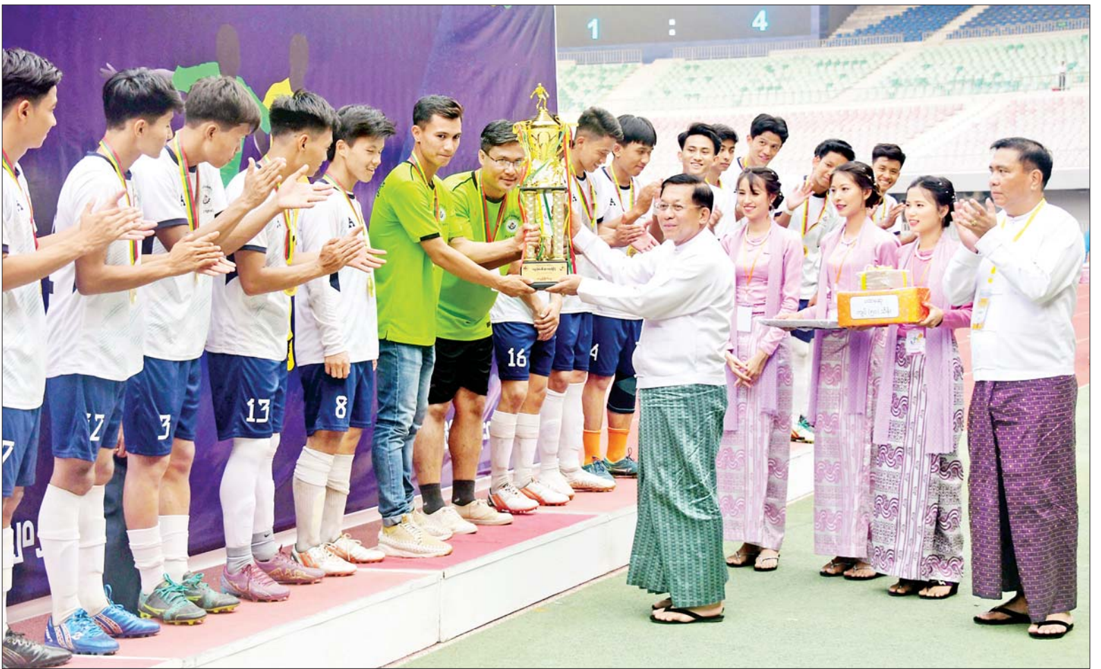
နိုင်ငံတော်စီမံအုပ်ချုပ်ရေးကောင်စီဥက္ကဋ္ဌ နိုင်ငံတော်ဝန်ကြီးချုပ် ဗိုလ်ချုပ်မှူးကြီးမင်းအောင်လှိုင် ပထမဆုရရှိသည့် နည်းပညာတက္ကသိုလ်(အထက်မြန်မာပြည်)(က) အသင်းအား ဂုဏ်ပြုချီးမြှင့်ငွေနှင့် တံခွန်စိုက်ဖလား ပေးအပ်ချီးမြှင့်စဉ်။

နေပြည်တော် ဧပြီ ၇ သိပ္ပံနှင့် နည်းပညာဝန်ကြီးဌာန တက္ကသိုလ်ပေါင်းစုံ ဘောလုံး ပြိုင်ပွဲ ဗိုလ်လုပွဲနှင့် ဆုချီးမြှင့်ခြင်း အခမ်းအနားကို ယနေ့ညနေပိုင်း တွင် နေပြည်တော်ရှိ ဝဏ္ဏသိဒ္ဓိ ဘောလုံးကွင်း၌ ကျင်းပရာ နိုင်ငံတော်စီမံအုပ်ချုပ်ရေးကောင်စီ ဥက္ကဋ္ဌ နိုင်ငံတော်ဝန်ကြီးချုပ် ဗိုလ်ချုပ်မှူးကြီး မင်းအောင်လှိုင် တက်ရောက်ကြည့်ရှုအားပေးပြီး ဆုများပေးအပ်ချီးမြှင့်သည်။