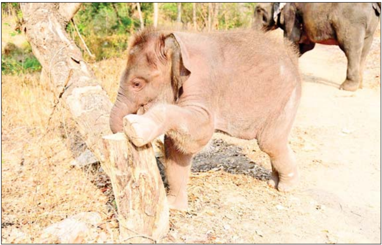
ကတည်းကပင် လူနှင့်ယဉ်ပါးသည့် ဆင်ဖြူတော်လေးဖြစ်ပြီး ပိုမိုယဉ်ပါးလာစေရန် ဆင်နှင့်လူသားတို့အကြား ကောင်းမွန်စွာ ဆက်ဆံတတ်စေရန် လေ့ကျင့်သင်ကြားခြင်းစနစ် “Peace Human and Elephant Interaction Training” ဖြင့် လေ့ကျင့်သင်ကြားပေးလျက်ရှိကြောင်း သိရသည်။

ခြင်းစနစ် “Peace Human and Elephant Interaction Training” ဖြင့် လေ့ကျင့်သင်ကြားပေးလျက်ရှိကြောင်း သိရသည်။ သတင်းစဉ်