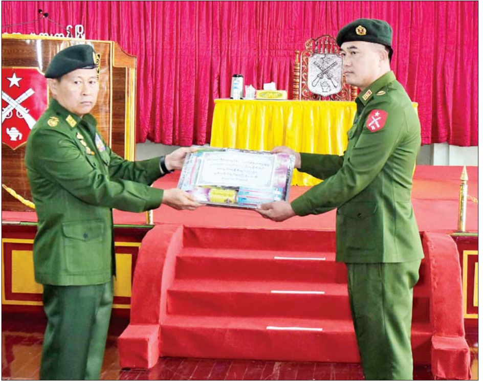
နိုင်ငံတော်စီမံအုပ်ချုပ်ရေးကောင်စီဒုတိယဥက္ကဋ္ဌ ဒုတိယတပ်မတော်ကာကွယ်ရေးဦးစီးချုပ် ကာကွယ်ရေးဦးစီးချုပ်(ကြည်း) ဒုတိယဗိုလ်ချုပ်မှူးကြီးစိုးဝင်း ဗထူးတပ်နယ်မှ သင်တန်းသားများ၊ ဗိုလ်လောင်းများနှင့် အရာရှိ၊ စစ်သည်၊ မိသားစုများအတွက် တပ်မတော်စက်ရုံများမှ ထုတ်လုပ်သည့် စားသောက်ဖွယ်ရာများကို ပေးအပ်စဉ်။

ခေါင်းဆောင်မှုနှင့်ပတ်သက်၍ လုပ်ငန်းတာဝန်အောင်မြင်ရန်မှာ ခေါင်းဆောင်မှုသည် အရေးကြီး ကြောင်း၊ နိုင်ငံတော်ပြန်တမ်း အဖြစ် ခေါင်းဆောင်ခန့်အပ်မှုနှင့် လက်အောက်အရာရှိ စစ်သည် များက ခန့်အပ်သည့် ခေါင်းဆောင် မှုသည် မတူညီကြောင်း၊ မိမိ၏ စည်းကမ်းလိုက်နာမှု၊ ကျွမ်းကျင် မှု၊ နေထိုင်ပြောဆိုမှုကို လိုက်၍ လက်အောက်၏ ယုံကြည်ကိုးစား မှု၊ လေးစားမှုကို ရရှိ၍ ခေါင်းဆောင် မှုကို ရရှိနိုင်မည်ဖြစ်ကြောင်း၊ ထို့ကြောင့် တပ်မတော်က ပြဋ္ဌာန်း ထားသည့် ခေါင်းဆောင်မှု အင်္ဂါရပ် (၁၆)ချက်ကို သိရှိလိုက်နာနေရန် လိုကြောင်း၊ ထို့အပြင် လုပ်ငန်း တာဝန်အရ တပ်မှူးကောင်း စိတ်ဓာတ်ထားရှိရန် လိုအပ်သကဲ့ သို့ တစ်ဖက်တွင်လည်း မိသားစုကဲ့သို့ စိတ်ဓာတ်ဖြင့် မိသားစုကဲ့သို့ နွေးထွေးစွာ ဆက်ဆံကြရန်လို ကြောင်း၊ မိမိကွပ်ကဲနေသော တပ်အရွယ်အစားအလိုက် လက် အောက် ငယ်သားများနှင့် ပတ်သက်၍ ကောင်းမွန်သော အုပ်ချုပ်သူ၊ ကောင်းမွန်သော ဘဏ္ဍာရေးဆိုင်ရာ စီမံခန့်ခွဲသူ၊ ကောင်းမွန်သော တရားစီရင် နိုင်သူနှင့် ကောင်းမွန်သော လေ့ကျင့်ရေးမှူးကောင်းများနှင့် တပ်မှူးကောင်းများအဖြစ် တည် ဆောက်နေထိုင်ရန် လိုကြောင်း၊ သို့မှသာ လက်အောက်က ယုံကြည် အားထားရသည့် အောင်မြင်သော စစ်ဘက်ခေါင်းဆောင်များ ဖြစ်လာ မည်ဖြစ်ကြောင်း။