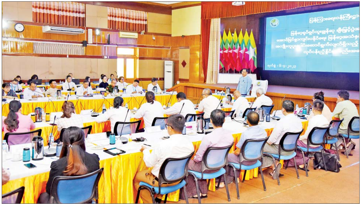
ပြည်ထောင်စုဝန်ကြီး ဦးမောင်မောင်အုန်း မြန်မာ့ရုပ်ရှင်ထူးချွန်ဆုချီးမြှင့်ပွဲအခမ်းအနား အောင်မြင်စွာကျင်းပနိုင်ရေး မြန်မာ့အသံနှင့် ရုပ်မြင်သံကြားနှင့် အကျိုးတူပူးပေါင်းဆောင်ရွက်လျက်ရှိသည့် Broadcaster များနှင့် လုပ်ငန်းညှိနှိုင်းအစည်းအဝေးတွင် အမှာစကားပြောကြားစဉ်။

ဆက်လက်၍ ပြည်သူ့ဆက်ဆံရေးနှင့် စိတ်ဓာတ်စစ်ဆင်ရေး