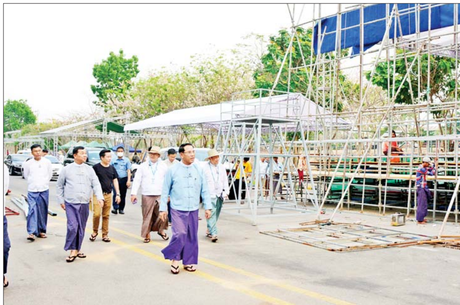
ပြည်ထောင်စုဝန်ကြီး ဦးမောင်မောင်အုန်း၊ ဒုတိယဝန်ကြီး ဦးရဲတင့်၊ ဒုတိယမြို့တော်ဝန်ကြီးဦးမောင်မောင်၊ အမြဲတမ်းအတွင်းဝန် ဦးမျိုးမြင့်မောင်နှင့် တာဝန်ရှိသူများ နေပြည်တော်လမ်းလျှောက်သင်္ကြန် ပြင်ဆင်နေမှုတို့ကို ကြည့်ရှုစစ်ဆေးစဉ်။