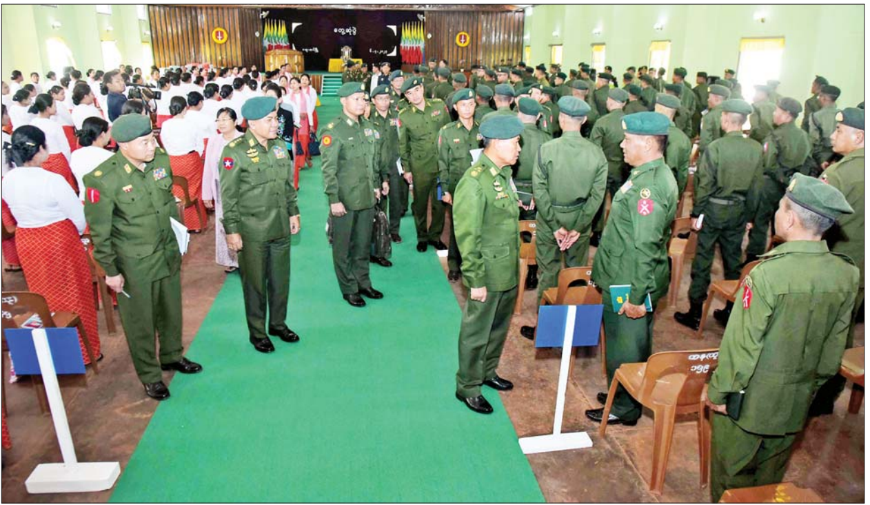
နိုင်ငံတော်စီမံအုပ်ချုပ်ရေးကောင်စီဒုတိယဥက္ကဋ္ဌ ဒုတိယတပ်မတော်ကာကွယ်ရေးဦးစီးချုပ် ကာကွယ်ရေးဦးစီးချုပ်(ကြည်း) ဒုတိယ ဗိုလ်ချုပ်မှူးကြီးစိုးဝင်း ဗထူးတပ်နယ်မှ အရာရှိစစ်သည်မိသားစုများအား ရင်းရင်းနှီးနှီးနှုတ်ဆက်စဉ်။

အမျိုးသားရေးစိတ်ဓာတ်ဖြင့်ပင် ဦးဆောင်မှုဖြင့် ကာကွယ်ခဲ့ ကြောင်း၊ အလားတူ ၂၀၂၀ ပြည့်နှစ် ရွေးကောက်ပွဲတွင် ဒီမိုကရေစီ ပျက်ပြားစေရန် အဓမ္မ နိုင်ငံတော် အာဏာရယူရန် ကြိုးပမ်းလာမှု ကိုလည်း တပ်မတော်က ၂၀၀၈ ခုနှစ် ဖွဲ့စည်းပုံအခြေခံဥပဒေနှင့် အညီ ကာကွယ်ထိန်းသိမ်းပေးခဲ့ရ ကြောင်း၊ ထိုသို့ နိုင်ငံတော် ကာကွယ်ရေး တာဝန်များကို ကျေပွန်စွာ ထမ်းဆောင်နိုင်ရေးမှာ သိသင့်သိထိုက်၊ တတ်သိတတ်အပ် သော စစ်မှုအတတ်ပညာများ၊ စစ်လက်နက် ပစ္စည်းများကို ကျွမ်းကျင် စွာ ကိုင်တွယ် ဆောင်ရွက်တတ်ရန်လိုကြောင်း၊ ထိုသို့ ဆောင်ရွက်နိုင်ရန်အတွက် လည်း တပ်မတော်သားများအနေ ဖြင့် အမြဲတမ်းလေ့ကျင့်နေကြရ မည်ဖြစ်ကြောင်း ပြောကြားသည်။ ထိုသို့ စစ်ဘက်ဆိုင်ရာ အသိ ပညာနှင့် အတတ်ပညာများ သင်ကြားလေ့ကျင့်ပေးရာတွင် နည်းပြများအနေဖြင့် စေတနာ ထား၍ တတ်မြောက်သည်အထိ လေ့ကျင့်ပေးသွားရန် လိုကြောင်း၊ မိမိသိသကဲ့သို့၊ မိမိတတ်သကဲ့သို့၊ မိမိကျွမ်းကျင်သကဲ့သို့ သင်တန်း သားများအား တတ်သိကျွမ်းကျင်