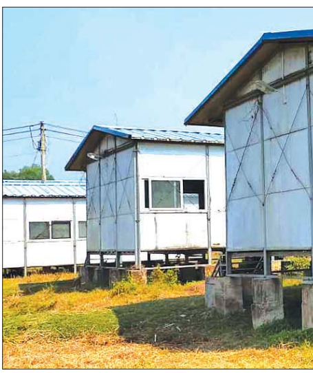
ရခိုင်ပြည်နယ်မှ နေရပ်စွန့်ခွာသူများအတွက် ပြန်လည်လက်ခံရေးစခန်းများ၌ ဆောက်လုပ်ထားသော အဆောက်အအုံများ။

နေခြင်းကြောင့် တစ်ဖက်နိုင်ငံသို့ အမှန်တကယ် ထွက်ခွာသွားသူစာရင်းမှာ အိမ်ထောင်စု ၅၆၀၀၀ ခန့်၊ လူဦးရေ ငါးသိန်းလေးသောင်းခန့်သာဖြစ် ကြောင်း စိစစ်တွေ့ရှိရသည်။ ဘင်္ဂလားဒေ့ရှ်နိုင်ငံ ဘက်မှပေးပို့လာသည့်စာရင်းမှာ မြန်မာနိုင်ငံဘက် က စိစစ်ထားသည်ထက် လူဦးရေ သုံးသိန်းခန့် ပိုမို နေသည်။ ၎င်းတို့က အိမ်ထောင်စု နှစ်သိန်းနီးပါး၊ လူဦးရေ ရှစ်သိန်းကျော် စာရင်းပေးပို့လာသည်။ မည်သည့်စာရင်းများ၊ မည်သည့်ကာလက ရှိနေသူ များကို ထည့်သွင်းဖော်ပြထားသည်မသိ။ မိမိတို့ ကတော့ စံသတ်မှတ်ချက်(၅)ချက်နှင့်အညီ စိစစ် လက်ခံမည်။ ဘင်္ဂလားဒေ့ရှ်နိုင်ငံမှ သံတမန်နည်းလမ်း အရ အသီးသီးပေးပို့လာသည့်စာရင်းများကို မိမိတို့၌ ရှိနှင့်ပြီးဖြစ်သည့် ဆွဲ၊ တင်၊ စစ် စာရင်းအချက်အလက် များအား နည်းပညာအသုံးပြု စိစစ်လျက်ရှိသည်။ ယင်းသို့စိစစ်ရာတွင် အိမ်ထောင်စု ၂၄၀၀၀ ကျော်၊ လူဦးရေ တစ်သိန်းကျော်ကို စိစစ်ပြီးဖြစ်ရာ လက်ရှိ