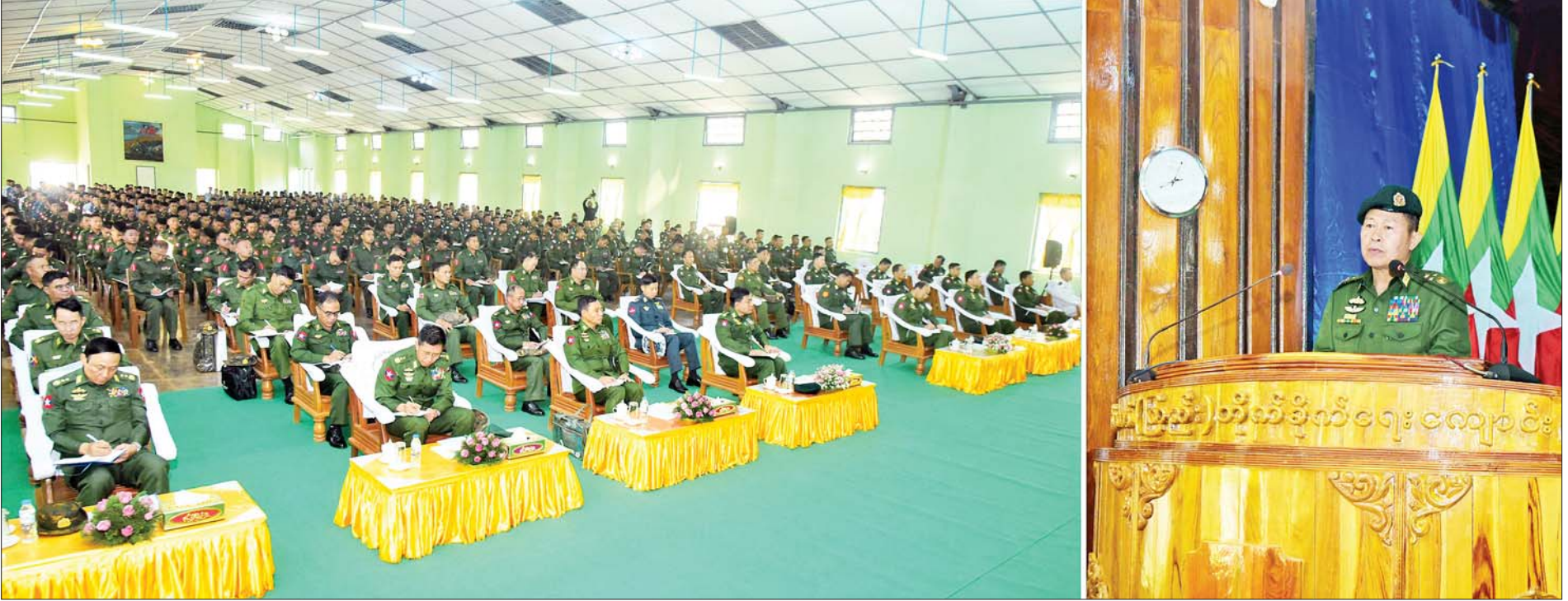
နိုင်ငံတော်စီမံအုပ်ချုပ်ရေးကောင်စီဒုတိယဥက္ကဋ္ဌ ဒုတိယတပ်မတော်ကာကွယ်ရေးဦးစီးချုပ် ကာကွယ်ရေးဦးစီးချုပ်(ကြည်း) ဒုတိယဗိုလ်ချုပ်မှူးကြီးစိုးဝင်း ဗထူးတပ်နယ်မှ ခြေလျင်တပ်စုမှူးသင်တန်းသားများ၊ ဗိုလ်လောင်းများအား တွေ့ဆုံအမှာစကားပြောကြားစဉ်။