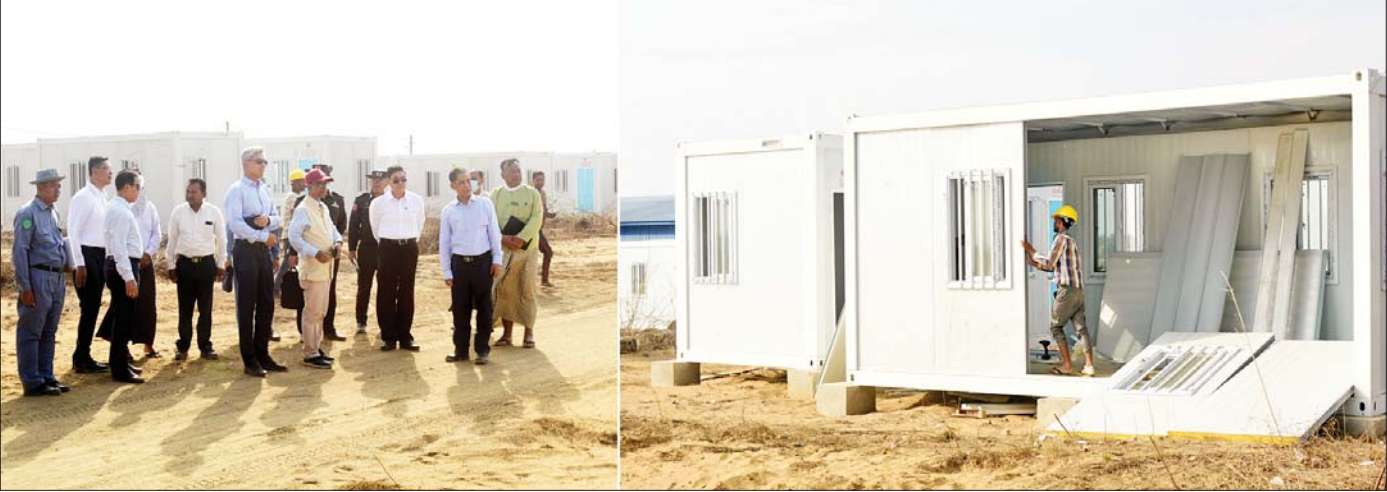
အာဆီယံနိုင်ငံများနှင့် အိမ်နီးချင်းနိုင်ငံ သံရုံးများမှ သံရုံးအကြီးအကဲများ၊ AHA Center တို့မှ ကိုယ်စားလှယ်များပါဝင်သည့်အဖွဲ့ ရခိုင်ပြည်နယ်မှ နေရပ်စွန့်ခွာသူများ ပြန်လည်လက်ခံရေးအတွက် လှိုင်ခေါင်ယာယီလက်ခံရေးစခန်း ပြင်ဆင်ဆောင်ရွက်မှုများကို လိုက်လံကြည့်ရှုစစ်ဆေးစဉ်။

ဦးဆောင်သူက ရခိုင်ပြည်နယ်တည်ငြိမ်အေးချမ်းရေးနှင့် ဖွံ့ဖြိုးတိုးတက်ရေးဆိုင်ရာလုပ်ငန်းများ ညှိနှိုင်းပေါင်းစပ်ရေးကော်မတီ ဒုတိယဥက္ကဋ္ဌ(၁) အပြည်ပြည်ဆိုင်ရာပူးပေါင်းဆောင်ရွက်ရေးဝန်ကြီးဌာန ပြည်ထောင်စုဝန်ကြီး ဦးကိုကိုလှိုင်ဖြစ်သည်။ မြန်မာနိုင်ငံအခြေစိုက် အာဆီယံနိုင်ငံများနှင့် အိမ်နီးချင်းနိုင်ငံများဖြစ်သည့် တရုတ်၊ အိန္ဒိယနှင့် ဘင်္ဂလားဒေ့ရှ်နိုင်ငံသံရုံးများမှ သံရုံးအကြီးအကဲများ၊ သံတမန်များ၊ အာဆီယံလူသားချင်းစာနာထောက်ထားမှုအကူအညီပေးအပ်ရေး ညှိနှိုင်းမှုဗဟိုဌာန (AHA Center) မှ ကိုယ်စားလှယ်အဖွဲ့ဝင်များကို ဦးဆောင်ကာ နေပြည်တော်မှ စစ်တွေသို့လေကြောင်းခရီး၊ ထိုမှတစ်ဆင့် ရခိုင်ပြည်နယ်မှ ဘင်္ဂလားဒေ့ရှ်နိုင်ငံသို့ နေရပ်စွန့်ခွာသူများ ပြန်လည်ဝင်ရောက်လာပါက အဆင်သင့်ဖြစ်စေရေးအတွက် စီစဉ်ထားသည့် မောင်တောမြို့နယ် ငါးခူးပြန်လည်လက်ခံရေးစခန်းနှင့် လှိုင်ခေါင်ယာယီနေရာချထားရေးစခန်းတို့ကို ရဟတ်ယာဉ်များဖြင့် လှည့်လည်ကြည့်ရှုလေ့လာကာ ပြန်လည်လက်ခံရေးလုပ်ငန်းစဉ်အဆင့်ဆင့်နှင့် ပြန်လည်နေရာချထားမည့်လုပ်ငန်းစဉ်များကို လက်တွေ့ကျကျ၊ မျက်ဝါးထင်ထင် လိုက်လံရှင်းလင်းပြသခြင်းဖြစ်သည်။ လိုက်ပါလာသူများ၏ သိရှိလိုသည့်များကိုလည်း စခန်းအသီးသီး၌ လက်ရှိလုပ်ငန်းဆောင်ရွက်နေသည့် ဌာနအလိုက် တာဝန်ခံများက ဂုဏ်သိက္ခာရှိစွာ ပြန်လည်မည့်သူများအတွက် လက်ခံဆောင်ရွက်မည့် လုပ်ငန်းစဉ်အဆင့်ဆင့်ကို အသေးစိတ်ရှင်းလင်းချပြ ဆွေးနွေးခဲ့ကြသည်ကိုလည်း တွေ့ရသည်။