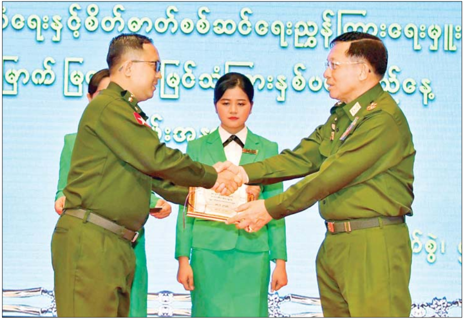
နိုင်ငံတော်စီမံအုပ်ချုပ်ရေးကောင်စီဥက္ကဋ္ဌ တပ်မတော်ကာကွယ်ရေးဦးစီးချုပ် ဗိုလ်ချုပ်မှူးကြီး မင်းအောင်လှိုင် ၂၀၂၂ ခုနှစ် စာပေဗိမာန်စာမူဆု ကလေးစာပေ ပထမဆုရရှိသည့် ဗိုလ်ကြီး သက်နောင်အား ဆုပေးအပ်ချီးမြှင့်စဉ်။

★ ရှေးဦးမှ လှိုက်လှဲနွေးထွေးစွာ ကြိုဆို ဦးစွာနိုင်ငံတော်စီမံအုပ်ချုပ်ရေး ကောင်စီဥက္ကဋ္ဌ တပ်မတော် ကာကွယ်ရေးဦးစီးချုပ်နှင့် အဖွဲ့ဝင်များသည် အခမ်းအနားကျင်းပ ပြုလုပ်မည့် အမှတ်(၂)တပ်မတော် ရုပ်မြင်သံကြားထုတ်လွှင့်ရေးတပ် သို့ရောက်ရှိကြရာပြည်သူ့ဆက်ဆံ ရေးနှင့် စိတ်ဓာတ်စစ်ဆင်ရေး ညွှန်ကြားရေးမှူးရုံး ညွှန်ကြား ရေးမှူး ဗိုလ်ချုပ်ဇော်မင်းထွန်းနှင့် အဖွဲ့ဝင်များ၊ မြဝတီရုပ်မြင်သံ ကြားမှ ဝန်ထမ်းများ၊ တာဝန်ရှိသူ များက လှိုက်လှဲနွေးထွေးစွာ ကြိုဆိုနှုတ်ဆက်ကြသည်။