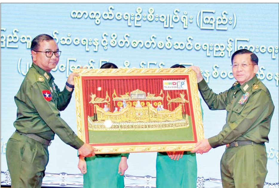
နိုင်ငံတော်စီမံအုပ်ချုပ်ရေးကောင်စီဥက္ကဋ္ဌ တပ်မတော်ကာကွယ်ရေးဦးစီးချုပ် ဗိုလ်ချုပ်မှူးကြီးမင်းအောင်လှိုင်အား ပြည်သူ့ဆက်ဆံရေးနှင့် စိတ်ဓာတ်စစ်ဆင်ရေးညွှန်ကြားရေးမှူးချုပ် ညွှန်ကြားရေးမှူးဗိုလ်ချုပ်ဇော်မင်းထွန်းက မြဝတီရုပ်မြင်သံကြား၏ (၂၈)နှစ်မြောက် နှစ်ပတ်လည်နေ့ အထိမ်းအမှတ်လက်ဆောင်ကို ဂါရဝပြုပေးအပ်စဉ်။

မြဝတီရုပ်မြင်သံကြားအနေဖြင့် တစ်ခေတ်ပြီးတစ်ခေတ် တစ်ဆင့်ပြီးတစ်ဆင့် ပိုမိုစွမ်းရည်ပြည့်ဝသည့် မီဒီယာကြီးတစ်ခုဖြစ်လာခဲ့ခြင်းသည် ဝန်ထမ်းအားလုံးနှင့် တာဝန်ရှိသူအဆင့်ဆင့်၏ စုပေါင်း ကြိုးစားမှုများကြောင့်သာ ဖြစ်ပါကြောင်း၊ ရုပ်မြင်သံကြားဟူသည်မှာ သုတ၊ ရသဖြစ်ဖွယ် သတင်းအချက်အလက်များ၊ အကြောင်းအရာများကို အရုပ်၊ အသံနှင့် ထုတ်လွှင့်ပြသနေခြင်း ဖြစ်ပြီး ကြည့်ရှုသူ ပရိသတ်များ၏ စိတ်ကို ဖမ်းစားနိုင်စွမ်းရှိသည့် မီဒီယာပလက်ဖောင်းတစ်ခုဖြစ်ပါကြောင်း၊ ရေဒီယိုအသံလွှင့်ခြင်းသည် အသံကိုအဓိကထားခြင်းဖြစ်