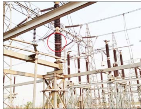
၂၃၀ ကေဗီ သာယာကုန်းပင်မဓာတ်အားခွဲရုံ၏ ၂၃၀ ကေဗီ ဓာတ်အားခွဲရုံသုံး ပစ္စည်းများ ပျက်စီးမှုအခြေအနေမှတ်တမ်းဓာတ်ပုံ။