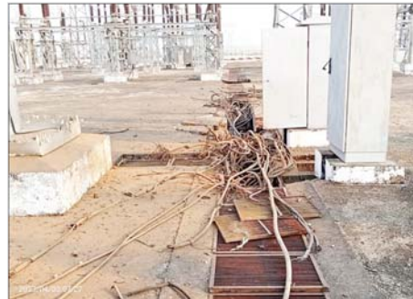
၂၃၀ ကေဗီ သာယာကုန်းပင်မဓာတ်အားခွဲရုံ၏ ၃၃/၀.၄ ကေဗီ ၅၀၀ ကေဗီအေ ဓာတ်အားခွဲရုံသုံး ထရန်စဖော်မာနှင့် ဓာတ်အားထိန်းချုပ်ကြိုးများ ပျက်စီးမှုအခြေအနေမှတ်တမ်းဓာတ်ပုံ။