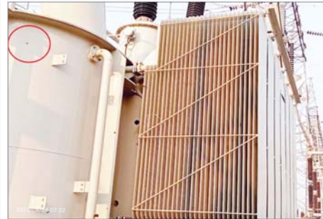
၂၃၀ ကေဗီ သာယာကုန်းပင်မဓာတ်အားခွဲရုံ၏ ၂၃၀/၃၃/၁၁ ကေဗီ ၁၀၀ အမ်ပီအေ ထရန်စဖော်မာ ပျက်စီးမှုအခြေအနေမှတ်တမ်းဓာတ်ပုံ။