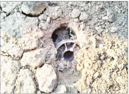
၂၃၀ ကေဗီ သာယာကုန်းပင်မဓာတ်အားခွဲရုံတွင် ကျရောက်ပေါက်ကွဲသော ဗုံးများ မှတ်တမ်းဓာတ်ပုံ။