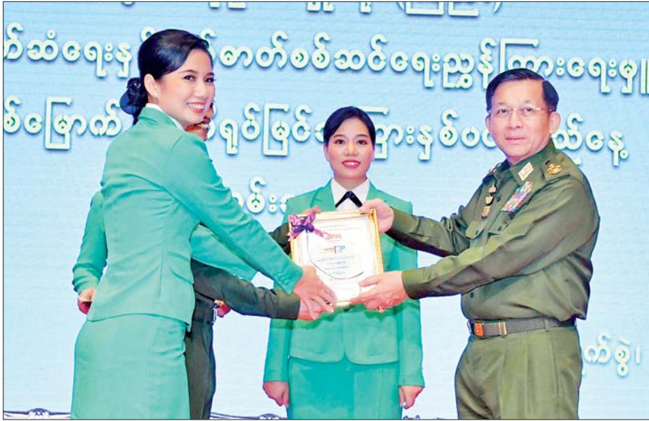
နိုင်ငံတော်စီမံအုပ်ချုပ်ရေးကောင်စီဥက္ကဋ္ဌ တပ်မတော်ကာကွယ်ရေးဦးစီးချုပ် ဗိုလ်ချုပ်မှူးကြီးမင်းအောင်လှိုင် ရှုရှားနိုင်ငံတွင် ကျင်းပသည့် နိုင်ငံတကာတပ်မတော်အားကစားပြိုင်ပွဲ ရိုးရာယဉ်ကျေးမှုပြိုင်ပွဲတွင် အဆို၊ အက၊ အတီးပြိုင်ပွဲ၌ ဆုရရှိခဲ့သည့် မြဝတီတေးဂီတနှင့် အငြိမ်းအဖွဲ့ကိုယ်စား တပ်ကြပ်အောင်အောင်ထက်နှင့် ဒုတိယအရာခံဗိုလ်(အစားခန့်) ဒေါ်သန္တာလင်းတို့အား ဆုပေးအပ်ချီးမြှင့်စဉ်။

ပြီး ရုပ်မြင်သံကြားသည် အရပ်ရောအသံပါ အားပြုလုပ်ဆောင်ရသည်ဖြစ်ပါကြောင်း၊ ထို့ကြောင့် ပိုမို၍ ကရုဏာကြရန်လိုပါကြောင်း၊ အသံအနေအထား၊ အမူအရာ၊ ဝတ်စားဆင်ယင်မှု၊ ရုပ်သွင်ပြင်လက္ခဏာကအစ အသေးစိတ်ဂရုပြု၍ ဆောင်ရွက်ကြရမည်ဖြစ်ပါကြောင်း၊ လူများ၏စိတ်ကို ဆွဲဆောင်နိုင်စွမ်း၊ တက်ကြွလာအောင် Motivation လုပ်နိုင်စွမ်းသည်လည်း မြင့်မားကြောင်း၊ ပြည်သူ့အပေါ် အသိပညာဗဟုသုတပေးနိုင်ရေး၊ နောင်တစ်ချိန်တွင် နိုင်ငံတာဝန်ထမ်းဆောင်ကြမည့်၊ နိုင်ငံတော်ကို ထုဆစ်ပုံဖော်ကြမည့်၊ လက်ဆင့်ကမ်းတာဝန်ယူကြမည့် လူငယ်လူရွယ်များလမ်းမှားမရောက်စေရေး၊ ပညာ