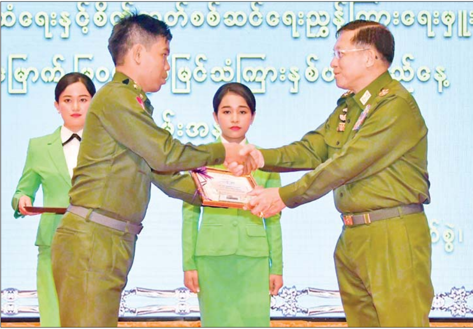
နိုင်ငံတော်စီမံအုပ်ချုပ်ရေးကောင်စီဥက္ကဋ္ဌ တပ်မတော်ကာကွယ်ရေးဦးစီးချုပ် ဗိုလ်ချုပ်မှူးကြီး မင်းအောင်လှိုင် ၂၀၂၂ ခုနှစ် စာပေဗိမာန်စာမူဆု လူငယ်စာပေ ပထမဆုရရှိသည့် ဗိုလ်ကြီး စိုးမိုးကျော်အား ဆုပေးအပ်ချီးမြှင့်စဉ်။