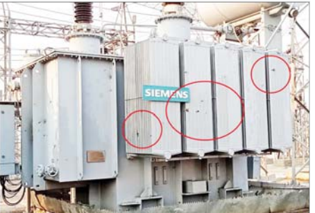
၂၃၀ ကေဗီ သာယာကုန်းပင်မဓာတ်အားခွဲရုံ၏ ၂၃၀/၃၃/၁၁ ကေဗီ ၆၀ အမ်ပီအေ ထရန်စဖော်မာ ပျက်စီးမှုအခြေအနေမှတ်တမ်းဓာတ်ပုံ။