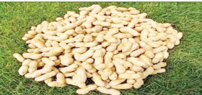
တည်ငြိမ်နေသော်လည်း ဝင်ရောက်သည့် မြေပဲလုံးဆန်များအားလုံး အရောင်းအဝယ်ဖြစ်လျက်ရှိကြောင်း သိရသည်။

ယခင်နှစ်ကာလကဲ့သို့ မြေပဲလုံးဆန်တစ်တင်းလျှင် ငွေကျပ် ၆၈၀၀၀ ပေါက်ဈေးရှိခဲ့ပြီး ယခုနှစ်မတ်လ(စတုတ္ထပတ်)၌ မြေပဲလုံးဆန် တစ်တင်းလျှင် ငွေကျပ် ၉၉၂၀၀ ပေါက်ဈေးရှိခဲ့သဖြင့် ယခင်နှစ်ကာလကဲ့သို့ ဈေးနှုန်းနှိုင်းယှဉ်ပါက ယခုနှစ်တွင်ယခင်နှစ်ထက် တစ်တင်းလျှင် ငွေကျပ် ၃၈၄၀၀ ဈေးနှုန်း ပိုမိုခဲ့ကြောင်း၊ ယခင်အပတ်နှင့် ယခုအပတ်ဈေးနှုန်းများတူညီနေပြီး ဈေးနှုန်း