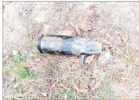
၂၃၀ ကေဗီ သာယာကုန်းပင်မဓာတ်အားခွဲရုံတွင် ကျရောက်ပေါက်ကွဲသော ဗုံးများ မှတ်တမ်းဓာတ်ပုံ။