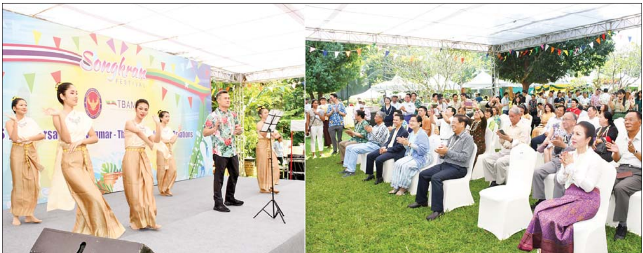
ပြည်ထောင်စုဝန်ကြီး ဦးသန်းဆွေနှင့် အခမ်းအနား တက်ရောက်လာကြသူများ မြန်မာနိုင်ငံဆိုင်ရာ ထိုင်းနိုင်ငံသံအမတ်ကြီး H.E.Mr. Mongkol Visitstump က “မြန်မာ” သီချင်းဖြင့် သီဆိုပြီး ထိုင်းရိုးရာယဉ်ကျေးမှုအဖွဲ့က တွဲဖက်ကပြဖျော်ဖြေတင်ဆက်မှုကို ကြည့်ရှုအားပေးစဉ်။

အသင်းချုပ်ဥက္ကဋ္ဌနှင့် တာဝန်ရှိသူ များ၊ ရန်ကုန်မြို့ရှိ စီးပွားရေးနှင့် ကူးသန်းရောင်းဝယ်ရေး အဖွဲ့ အစည်းများမှ တာဝန်ရှိသူများ၊ မြန်မာနိုင်ငံတွင် ရောက်ရှိနေသည့် ထိုင်းနိုင်ငံသားများနှင့် ဖိတ်ကြား ထားသူများ တက်ရောက်ကြ သည်။ ဦးစွာ ခေမာရာမဘုန်းတော်ကြီး ကျောင်းပဓာနနာယက ဆရာတော် ထံမှ ပြည်ထောင်စုဝန်ကြီး ဦးသန်းဆွေ၊ ထိုင်းနိုင်ငံ သံအမတ် ကြီးနှင့် ဧည့်ပရိသတ်များက ငါးပါးသီလ ခံယူဆောက်တည်ကြ ပြီး ဆရာတော်သံဃာတော်များ ချီးမြှင့်သည့် ပရိတ်တရားတော် များကို နာယူကြသည်။ ယင်းနောက် ပြည်ထောင်စု ဝန်ကြီး ဦးသန်းဆွေ၊ ဒုတိယ ဝန်ကြီး ဒေါ်နန္ဒာ၊ မြန်မာနိုင်ငံ ဆိုင်ရာ ထိုင်းနိုင်ငံသံအမတ်ကြီး နှင့် တာဝန်ရှိသူများက ဆရာတော် ကြီးနှင့် သံဃာတော်များအား လှူဖွယ်ဝတ္ထုပစ္စည်းများ ဆက်ကပ် လှူဒါန်းကြသည်။ ထို့နောက် ခေမာရာမဘုန်းတော် ကြီးကျောင်း ပဓာနနာယက ဆရာတော်ထံမှ လှူဒါန်းမှုအစုစု တို့အတွက် ရေစက်သွန်းချ အမျှ ပေးဝေကြပြီး ပြည်ထောင်စု ဝန်ကြီး၊ ဒုတိယဝန်ကြီး၊ ထိုင်းသံအမတ်ကြီးနှင့် တာဝန် ရှိသူများက သံဃာတော်များအား