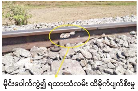
မိုင်းပေါက်ကွဲ၍ ရထားသံလမ်း ထိခိုက်ပျက်စီးမှု

၄-၄-၂၀၂၃ ရက်နေ့က အကြမ်းဖက်သောင်းကျန်းသူများ၏ ရက်စက်ကြမ်းကြုတ်စွာ မိုင်းခွဲတိုက်ခိုက် မှုကြောင့် ရထားလမ်းထိခိုက်ပျက်စီးမှု အခြေအနေ မှတ်တမ်းဓာတ်ပုံများ။