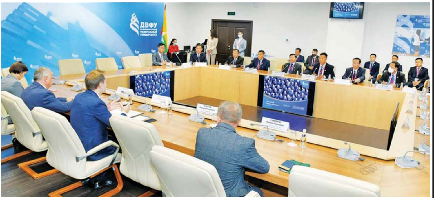
နိုင်ငံတော်စီမံအုပ်ချုပ်ရေးကောင်စီဥက္ကဋ္ဌ နိုင်ငံတော်ဝန်ကြီးချုပ် ဗိုလ်ချုပ်မှူးကြီး မင်းအောင်လှိုင်နှင့် ရုရှားနိုင်ငံ ဗလာဒီဗော့စတော့ဗ်မြို့၊ Far Eastern Federal University (FEFU) တက္ကသိုလ်ပါမောက္ခချုပ် Mr. Boris Nikolaevich Korobets တို့ ၂၀၂၂ ခုနှစ် စက်တင်ဘာ ၈ ရက်က တွေ့ဆုံဆွေးနွေးစဉ်။

နိုင်ငံအကြီးအကဲများ၏ နိုင်ငံအပေါ် ထားရှိသည့် စိတ်ထားနှင့် ဦးဆောင်မှု နိုင်ငံတစ်နိုင်ငံ၏ အကြောင်းအရာ များကို သုတေသနပြုလေ့လာရာတွင် နိုင်ငံအကြီးအကဲများ၏ နိုင်ငံအပေါ် ထားရှိသည့် စိတ်ထားနှင့် ဦးဆောင်မှု အပေါ်လည်း လေ့လာကြသည်မှာ ပကတိအမှန်တရားပင်ဖြစ်၏။ နိုင်ငံတော် စီမံအုပ်ချုပ်ရေးကောင်စီသည် ယခင် NLD အစိုးရ၏ ၂၀၂၀ ပြည့်နှစ် အထွေထွေရွေးကောက်ပွဲတွင် နိုင်ငံတော် အာဏာအား မဲမသမာမှုနည်းလမ်းဖြင့် အတင်းအဓမ္မရယူရန် ကြိုးပမ်းခဲ့သည်ကို