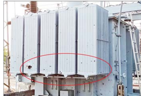
၂၃၀ ကေဗီ သာယာကုန်းပင်မဓာတ်အားခွဲရုံ၏ ၂၃၀/၃၃/၁၁ ကေဗီ ၆၀ အမ်ပီအေ ထရန်စဖော်မာ ပျက်စီးမှုအခြေအနေမှတ်တမ်းဓာတ်ပုံ။