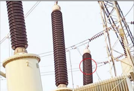
၂၃၀ ကေဗီ သာယာကုန်းပင်မဓာတ်အားခွဲရုံ၏ ၂၃၀/၃၃/၁၁ ကေဗီ ၆၀ အမ်ပီအေ ထရန်စဖော်မာ ပျက်စီးမှုအခြေအနေမှတ်တမ်းဓာတ်ပုံ။