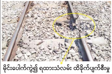
မိုင်းပေါက်ကွဲ၍ ရထားသံလမ်း ထိခိုက်ပျက်စီးမှု

ပို့ဆောင်ရေးနှင့် ဆက်သွယ်ရေးဝန်ကြီးဌာန မြန်မာ့မီးရထားအနေဖြင့် နိုင်ငံအနှံ့ရှိ ပြည်သူအများ နှစ်သက်သော လာမူ၊ ကုန်စည်ပို့ဆောင်မှုများ အဆင်ပြေ စေရေး၊ ပြည်တွင်းထုတ်ကုန်များနှင့် နယ်စပ်ဒေသ မှ တင်သွင်းလာသည့် ကုန်ပစ္စည်းများ အဆင်ပြေ ချောမွေ့စွာ စီးဆင်းနိုင်ရေး စသည့်ရည်မှန်းချက် တာဝန်များချမှတ်၍ ရထားကွန်ရက်ကြီးတစ်ခုလုံး တွင် အမြန်လူစီးရထားခရီးစဉ် ၁၈ စင်း၊ စာပို့ရထား ခရီးစဉ် ၁၂ စင်း၊ လူစီးကုန်တင်ရထားခရီးစဉ် ၅၈ စင်း တို့နှင့် ရန်ကုန်မြို့ပတ်နှင့် ဆင်ခြေပုံးရထားခရီးစဉ် အစင်း ၃၀ စုစုပေါင်း ရထားခရီးစဉ် ၆၈ စင်းတို့နှင့် ကုန်ရထားခရီးစဉ်များကို နေ့စဉ်စီစဉ်ပြေးဆွဲလျက် ရှိသကဲ့သို့ ရထားလမ်းပိုင်းများ ကြံ့ခိုင်ရေးနှင့် အဆင့် မြှင့်တင်နိုင်ရေးတို့အတွက် ကျောက်ရထားများ၊ အင်ဂျင်နီယာရထားခရီးစဉ်များဖြင့်လည်း သယ်ယူ ပို့ဆောင်ပေးလျက်ရှိသည်။