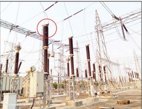
၂၃၀ ကေဗီ သာယာကုန်းပင်မဓာတ်အားခွဲရုံ၏ ၂၃၀ ကေဗီ ဓာတ်အားခွဲရုံသုံး ပစ္စည်းများ ပျက်စီးမှုအခြေအနေမှတ်တမ်းဓာတ်ပုံ။