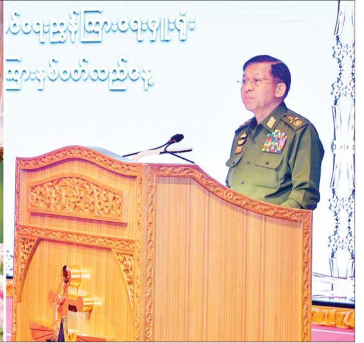
နိုင်ငံတော်စီမံအုပ်ချုပ်ရေးကောင်စီဥက္ကဋ္ဌ တပ်မတော်ကာကွယ်ရေးဦးစီးချုပ် ဗိုလ်ချုပ်မှူးကြီး မင်းအောင်လှိုင် ကာကွယ်ရေးဦးစီးချုပ်ရုံး(ကြည်း) ပြည်သူ့ဆက်ဆံရေးနှင့် စိတ်ဓာတ်စစ်ဆင်ရေးညွှန်ကြားရေးမှူးရုံး မြဝတီရုပ်မြင်သံကြား၏ (၂၈)နှစ်မြောက် နှစ်ပတ်လည်နေ့အခမ်းအနားတွင် အမှာစကားပြောကြားစဉ်။