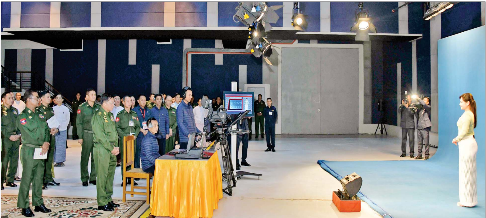
နိုင်ငံတော်စီမံအုပ်ချုပ်ရေးကောင်စီဥက္ကဋ္ဌ တပ်မတော်ကာကွယ်ရေးဦးစီးချုပ် ဗိုလ်ချုပ်မှူးကြီး မင်းအောင်လှိုင် အမှတ်(၂) တပ်မတော်ရုပ်မြင်သံကြားထုတ်လွှင့်ရေးတပ် မြဝတီရုပ်မြင်သံကြားစက်ရုံအတွင်း ကြည့်ရှုစစ်ဆေးစဉ်။

ယနေ့ ၂၁ ရာစုတွင် သတင်းစီးဆင်းမှုနှုန်းသည် မြန်ဆန်သောကြောင့် အချိန်နှင့်အမျှ ပြောင်းလဲ ဖြစ်ထွန်းမှုနောက်ကို မီဒီယာ အားကောင်းကောင်းနှင့် လိုက်ပါနိုင်စွမ်းရှိရန် လိုအပ်ကြောင်း၊ အချို့ သတင်းမီဒီယာများသည် တိကျမှု၊ ဘက်မလိုက်မှု၊ မျှတမှု စသည့် မီဒီယာကျင့်ဝတ်များကို လိုက်နာမှုမရှိ၊ ကျင့်ဝတ်နှင့် မညီညွတ်စွာ သတင်းများ ဖော်ပြနေသည်ကို တွေ့ရပါကြောင်း၊ တပ်မတော်၏ပုံရိပ်နှင့် ပြည်သူ့ဆက်ဆံရေးကို ထိခိုက်ကျဆင်းအောင် ပုံဖော်ဆောင်ရွက်နေကြသည်ကိုလည်း တွေ့ရပါကြောင်း၊ မဟုတ်မမှန် စွပ်စွဲပြောဆိုမှုများ အပေါ် နိုင်ငံပိုင်မီဒီယာများ၊ တပ်မတော် မီဒီယာများက သတင်းမှန်များနှင့် တုံ့ပြန်လုပ်ဆောင်ရမည် ဖြစ်သကဲ့သို့ သမာသမတ်ကျသည့် ပြည်တွင်း၊ ပြည်ပ မီဒီယာများ၏ “အား” ကိုလည်း ရယူနိုင်ရန် ကြိုးစားဆောင်ရွက်ရမည် ဖြစ်ပါကြောင်း။