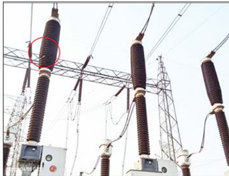
၂၃၀ ကေဗီ သာယာကုန်းပင်မဓာတ်အားခွဲရုံ၏ ၂၃၀ ကေဗီ ဓာတ်အားခွဲရုံသုံး ပစ္စည်းများ ပျက်စီးမှုအခြေအနေမှတ်တမ်းဓာတ်ပုံ။