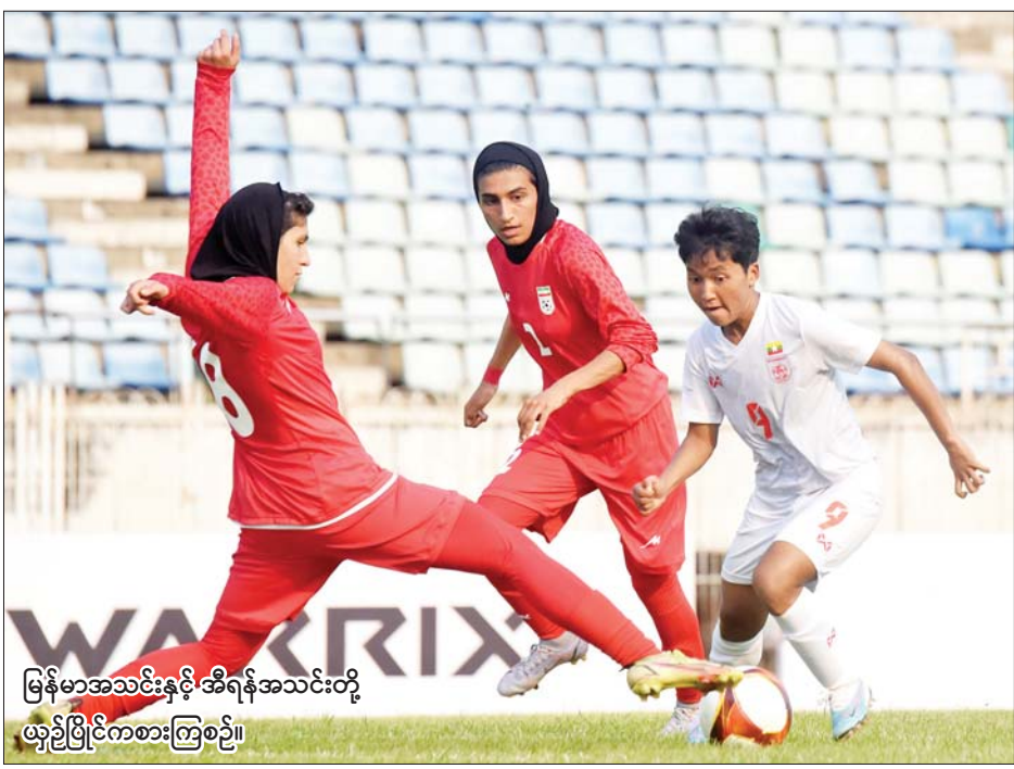
မြန်မာအသင်းနှင့် အီရန်အသင်းတို့ ယှဉ်ပြိုင်ကစားကြစဉ်။

ရန်ကုန် ဧပြီ ၅ ၂၀၂၄ ပါရီအိုလံပစ် အမျိုးသမီး ဘောလုံး ပထမအဆင့်ခြေစစ်ပွဲ အုပ်စု (ခ) ပထမအကျော့အဖြစ် အီရန်အသင်းနှင့် မြန်မာအသင်းတို့ ဧပြီ ၅ ရက်က ရန်ကုန်မြို့ရှိ သုဝဏ္ဏကွင်း၌ ယှဉ်ပြိုင်ကစားရာ အီရန်အသင်းက တစ်ဂိုး - ဂိုးမရှိ ဖြင့် အနိုင်ရခဲ့သည်။ မြန်မာအသင်းသည် အီရန်ကို မထင်မှတ်ဘဲ အရေးနိမ့်ခဲ့သဖြင့် ဒုတိယအဆင့် ခြေစစ်ပွဲ တက်ရောက်ရန် ရုန်းကန်ရတော့ မည်ဖြစ်သည်။ မြန်မာအသင်း သည် ဒုတိယအကျော့တွင် နှစ်ဂိုး နှင့်အထက် အနိုင်ရမှသာ နောက် တစ်ဆင့် တက်ရောက်နိုင်မည် ဖြစ်သည်။ စာမျက်နှာ ၁၁ ကော်လံ ၁ သို့ ❖