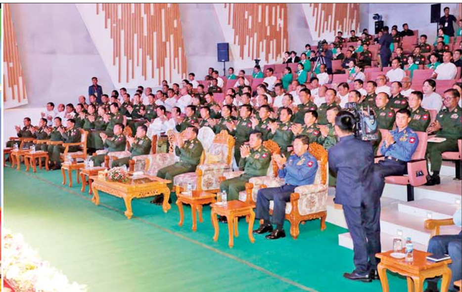
နိုင်ငံတော်စီမံအုပ်ချုပ်ရေးကောင်စီဥက္ကဋ္ဌ တပ်မတော်ကာကွယ်ရေးဦးစီးချုပ် ဗိုလ်ချုပ်မှူးကြီးမင်းအောင်လှိုင်နှင့်အဖွဲ့ဝင်များ မြဝတီရုပ်မြင်သံကြားမှ ဝန်ထမ်းများ၏ နှစ်ပတ်လည်နေ့ ဂုဏ်ပြုတေးသီချင်းများဖြင့် ဖျော်ဖြေတင်ဆက်မှုကို ကြည့်ရှုအားပေးစဉ်။

✦ စာမျက်နှာ ၃ မှ ထုတ်လွှင့်ပေးလျက် ရှိကြောင်း၊ ပညာပေးရေး တာဝန်အနေဖြင့် ပြည်သူ့လူထုကို တိုက်ရိုက်ထိတွေ့ ဆက်ဆံရသည့် တာဝန်ဖြစ်ပြီး အသိပညာပေးရေး တာဝန်၊ ဉာဏ်ပညာ ဗဟုသုတပေးရေး တာဝန် စသည်များကို တာဝန်ကျေပွန်စွာ ထမ်းဆောင်ခဲ့ကြောင်း၊ ဖျော်ဖြေရေးတာဝန် ထမ်းဆောင်ပေးမှုအနေဖြင့် ပြည်သူများ အပန်းပြေစေရန် အနုပညာအရပ်ရပ်၊ တေးဂီတအဖွဲ့ဖွဲ့၊ အကအခုန်အဆိုအတီး ကဏ္ဍအစုံအလင်ဖြင့် ဖျော်ဖြေမှုများ ဆောင်ရွက်လျက်ရှိပါကြောင်း။