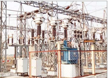
၂၃၀ ကေဗီ သာယာကုန်းပင်မဓာတ်အားခွဲရုံ၏ ၃၃/၀.၄ ကေဗီ ၅၀၀ ကေဗီအေ ဓာတ်အားခွဲရုံသုံး ထရန်စဖော်မာနှင့် ဓာတ်အားထိန်းချုပ်ကြိုးများ ပျက်စီးမှုအခြေအနေမှတ်တမ်းဓာတ်ပုံ။

ဆီးဂိမ်း အမျိုးသားမှ အုပ်စုခွဲဝေထားမှုအရ အုပ်စု (က) တွင် အိမ်ရှင်ကမ္ဘောဒီးယား၊ အင်ဒိုနီးရှား၊ မြန်မာ၊ ဖိလစ်ပိုင်၊ တီမော၊ အုပ်စု (ခ) တွင် ဗီယက်နမ်၊ ထိုင်း၊ မလေးရှား၊ စင်ကာပူနှင့် လာအိုအသင်းတို့ ပါဝင်နေသည်။ မြန်မာအသင်းသည် အုပ်စုအနေအထားအရ ဆီးမီးဖိုင်နယ် တက်ရောက်ရန် အခွင့်အရေးရှိနေပြီး ကမ္ဘောဒီးယား၊ အင်ဒိုနီးရှားအသင်းတို့နှင့် အဓိကယှဉ်ပြိုင်ရဖွယ်