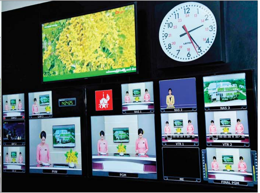
နိုင်ငံတော်စီမံအုပ်ချုပ်ရေးကောင်စီဥက္ကဋ္ဌ တပ်မတော်ကာကွယ်ရေးဦးစီးချုပ် ဗိုလ်ချုပ်မှူးကြီး မင်းအောင်လှိုင်နှင့် အဖွဲ့ဝင်များ အမှတ်(၂)တပ်မတော်ရုပ်မြင်သံကြားထုတ်လွှင့်ရေးတပ် မြဝတီရုပ်မြင်သံကြားစက်ရုံအတွင်း ကြည့်ရှုစစ်ဆေးစဉ်။