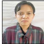
ခိုင်မာဖြိုး