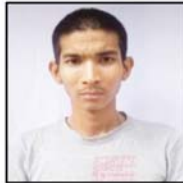
ကျော်စန်းထွေး