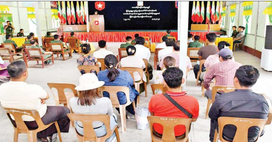
များကို ရှင်းလင်းဆွေးနွေး ပြောကြားသည်။ ထို့နောက် ဥပဒေဘောင်အတွင်း ပြန်လည်ဝင်ရောက်ခဲ့သည့် ပြစ်မှုကျူးလွန်ခြင်းမရှိခဲ့သော မန္တလေးတိုင်းဒေသ ကြီး အောင်မြေသာစံမြို့နယ်၊ ချမ်းမြသာစည်မြို့နယ်၊

နေပြည်တော် ဧပြီ ၄ တိုင်းရင်းသား လက်နက်ကိုင်အဖွဲ့နယ်မြေ အတွင်း သင်တန်းများတက်ရောက်ခဲ့ပြီး ပြစ်မှု ကျူးလွန်ခြင်းမရှိခဲ့သည့် ဥပဒေဘောင်အတွင်း ဝင်ရောက်လာသော PDF အဖွဲ့ဝင်များကို ပြန်လည် ကြိုဆိုလက်ခံ၍ ၎င်း၏ မိဘအုပ်ထိန်းသူများထံသို့ လွှဲပြောင်းပေးအပ်လျက်ရှိပါသည်။ ယနေ့မွန်လွှဲပိုင်းတွင်လည်း မန္တလေးတိုင်း ဒေသကြီး အောင်မြေသာစံမြို့နယ် နယ်မြေခံ သင်တန်းကျောင်းခန်းမ၌ ပြန်လည်ကြိုဆိုလက်ခံခြင်း အခမ်းအနားကို ပြုလုပ်ရာ အလယ်ပိုင်းတိုင်းစစ်ဌာန ချုပ်မှ တာဝန်ရှိသူများ၊ ခရိုင်/မြို့နယ်စီမံအုပ်ချုပ်ရေး အဖွဲ့ဝင်များ၊ ဌာနဆိုင်ရာတာဝန်ရှိသူများ၊ ဥပဒေ ဘောင်အတွင်းဝင်ရောက်လာသူများနှင့် ၎င်းတို့၏ မိဘအုပ်ထိန်းသူများ တက်ရောက်ကြသည်။ ဦးစွာ တာဝန်ရှိသူတစ်ဦးက နယ်မြေဒေသ တည်ငြိမ်အေးချမ်းရေးနှင့် တရားဥပဒေဆိုင်ရာပုဒ်မ