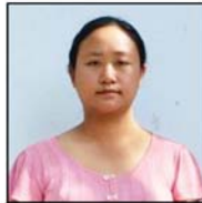
အေးမြတ်မွန်