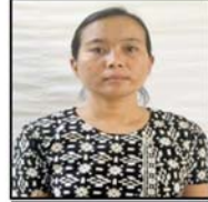
ခိုင်မာသန်း