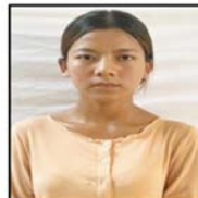
ယဉ်ယဉ်မင်း