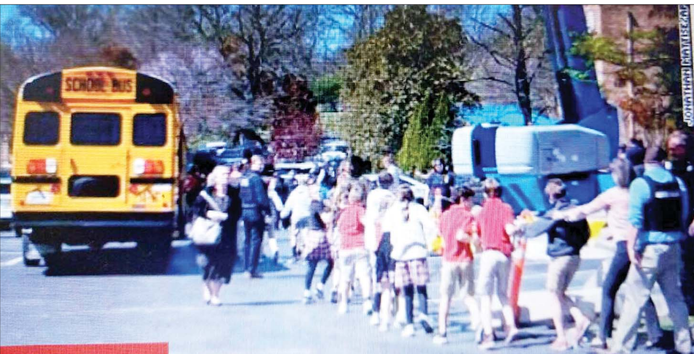
အမေရိကန်နိုင်ငံ တင်နက်ဆီပြည်နယ် နက်ရီဗီလီမြို့ ပုဂ္ဂလိကပိုင် ခရစ်ယာန်ကျောင်း၌ မတ် ၂၇ ရက်က ပစ်ခတ်မှုဖြစ်ပွားမှုကြောင့် ကျောင်းအတွင်းမှ ကလေးများအား ကယ်ထုတ်လာစဉ်။

တစ်ကမ္ဘာလုံးမှာ ငွေဖောင်းပွမှု ပြင်းပြင်း ထန်ထန်ကြုံနေရပေမယ့် အမေရိကန်ရဲ့ ငွေဖောင်းပွမှု က ဘဏ်တွေပြုလဲ၊ စတော့ဈေးကွက်တွေ ပျက်တဲ့ အထိ သက်ရောက်သွားတယ်။ ဦးဆုံးဘဏ်ပြိုမှုမှာ တာဝန်ယူမှုမရှိတဲ့ ကမ္ဘာ့ကြေးအထူးဆုံး အမေရိကန် စူပါပါဝါကြီးဟာ သူနဲ့တစ်ပါတည်း သေဖော်သေဖက် ဥရောပဘဏ်တွေကိုပါ အပါခေါ်တဲ့အခါ စီးပွားပျက် ကပ်ဆီးဦးတည်နေတဲ့ စိုးရိမ်ဖွယ်ရေမှတ်ကို ရောက်ခါ နီးပြီလို့ယူဆရင်တွေကသတိပေးထောက်ပြနေကြပါပြီ။ OPEC၊ တရုတ်၊ ရုရှားတို့ ဦးဆောင်ပြီး ဒေါ်လာကို ဖယ်ကြည့်လာတဲ့အနေအထားနဲ့အတူ ဒေါ်လာကြီးစိုးမှု အပေါ် ကမ္ဘာ့ရဲ့ယုံကြည်မှု ပျောက်ဆုံးခြင်းလမ်းစ ပေါ်လာနေပြီလို့ ယူဆရပါတယ်။ တရုတ်နဲ့ ရုရှား ဦးဆောင်တဲ့ SCO နဲ့ BRICS အဖွဲ့တွေ၊ အထူးသဖြင့် BRICS အဖွဲ့ကြီး ပါဝါအားကောင်းလာတာနဲ့အတူ မနေးအမြန် De dollarization ဘက် ရွေ့လျော လာတဲ့အခြေအနေ၊ ကမ္ဘာ့စူပါပါဝါကြီးရဲ့ ကမ္ဘာအပေါ် လွှမ်းမိုးနိုင်စွမ်းအား အားနည်းယုတ်လျော့လာတဲ့ အနေအထားတွေဟာ သင်္ခါရသဘောအရ မမြဲ၊ ဖြစ်ပြီး ပျက်တဲ့သဘောပါပဲ။ အသေးအဖွဲ့ဟူသည့်မရှိ၊ တစ်နေရာက အသေးအဖွဲ့လေးမို့ လျစ်လျူရှုမိရင် အခြားတစ်နေရာမှာ ကြီးစွာသော အကျိုးသက်ရောက်မှု