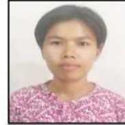
ခင်နွယ်ဦး