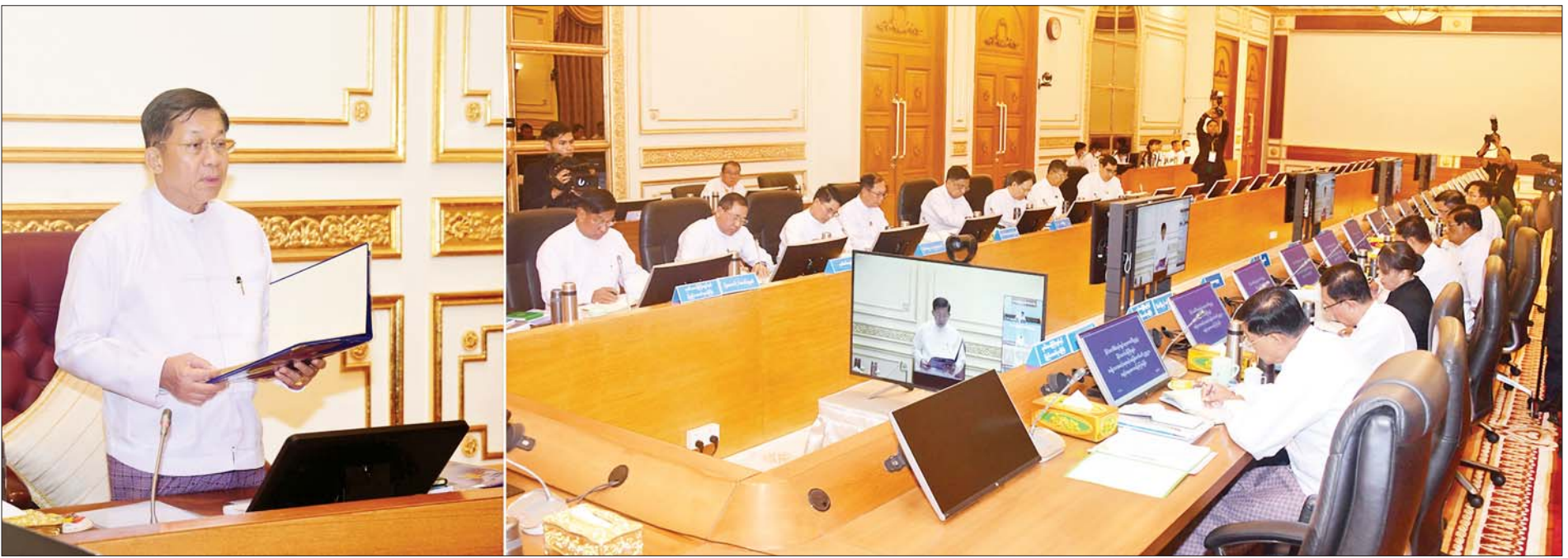
အမျိုးသားအဆင့်ရေအရင်းအမြစ်ကော်မတီဥက္ကဋ္ဌ နိုင်ငံတော်စီမံအုပ်ချုပ်ရေးကောင်စီဥက္ကဋ္ဌ နိုင်ငံတော်ဝန်ကြီးချုပ် ဗိုလ်ချုပ်မှူးကြီး မင်းအောင်လှိုင် အမျိုးသားအဆင့်ရေအရင်းအမြစ်ကော်မတီ (၁/၂၀၂၃) အစည်းအဝေးတွင် အမှာစကားပြောကြားစဉ်။

လူသားများအပါအဝင် သက်ရှိသတ္တဝါများ ရှိနေသမျှ ကာလပတ်လုံး ရေရှည်သုံးစွဲသွားကြရမည်ဖြစ်သည့်အတွက် ရေအရင်းအမြစ်များကို စနစ်တကျ ထိန်းသိမ်းအသုံးပြုသွားကြရန် လိုအပ်ပြီး လူတိုင်းရေရရှိရေးအတွက် ဝိုင်းဝန်းဆောင်ရွက်ကြရမည်