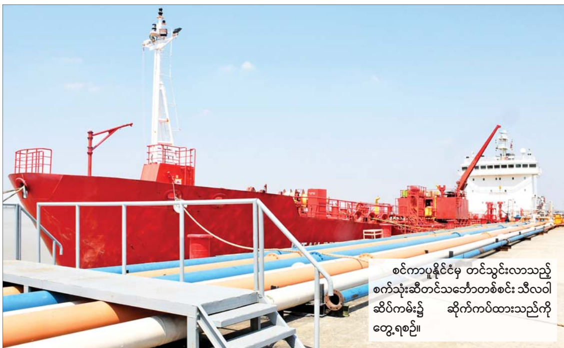
စင်ကာပူနိုင်ငံမှ တင်သွင်းလာသည့် စက်သုံးဆီတင်သင်္ဘောတစ်စင်း သီလဝါ ဆိပ်ကမ်း၌ ဆိုက်ကပ်ထားသည်ကို တွေ့ရစဉ်။

(နိုင်ငံတော်စီမံအုပ်ချုပ်ရေးကောင်စီ ဥက္ကဋ္ဌ နိုင်ငံတော်ဝန်ကြီးချုပ် ဗိုလ်ချုပ် မျိုးကြီး သတိုးမဟာသရေစည်သူ သတိုးသီရိသုဓမ္မ မင်းအောင်လှိုင်၏ ၂၀၂၃ ခုနှစ် ဇန်နဝါရီလ ၄ ရက်နေ့ (၇၅)နှစ်မြောက် စိန်ရတု လွတ်လပ်ရေးနေ့ ဂုဏ်ပြုအခမ်းအနား တွင်ပြောကြားခဲ့သည့် မိန့်ခွန်းမှ ကောက်နုတ်ချက်) ၄-၁-၂၀၂၃