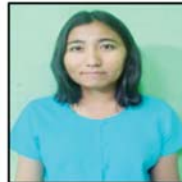
အိအိအောင်