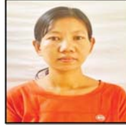
ခင်ကြည်မာဝေ