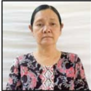
တင်တင်လတ်