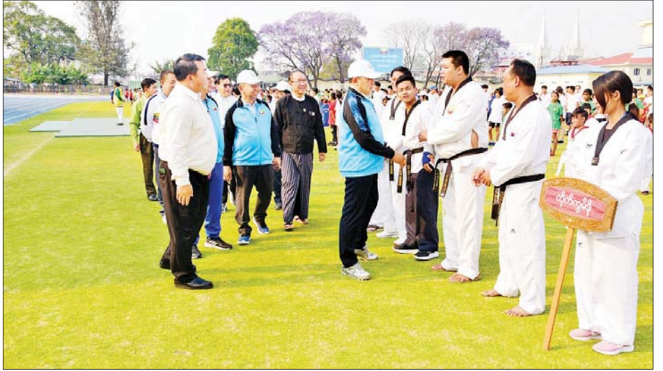
တောင်ကြီးမြို့ နွေရာသီ အခြေခံအားကစားသင်တန်းဆင်းပွဲ ကျင်းပ

နှင့်တာဝန်ရှိသူတို့က နောင်ယားကန်သာနှင့် မင်းကျောင်းကန်သာသို့သွားရောက်ပြီး ပြည်သူများ စိတ်အေးချမ်းသာစွာ အပန်းဖြေအနားယူနိုင်ရေးအတွက် ကန်ပတ်ဝန်းကျင်သန့်ရှင်းရေးဆောင်ရွက်ခြင်း၊ နားနေဆောင်ပြုပြင်ဆောင်ရွက်ခြင်း၊ ပန်းအလှပင်များ ပုံဖော်စိုက်ပျိုးခြင်း၊ အမှိုက်များရှင်းလင်းခြင်းဖြင့် စုပေါင်းသန့်ရှင်းရေးဆောင်ရွက်နေမှုများကို ကြည့်ရှုအားပေးခဲ့ပြီး လိုအပ်သည်များကိုမှာကြားခဲ့ကြောင်း သိရသည်။ ပြည်နယ်(ပြန်/ဆက်)