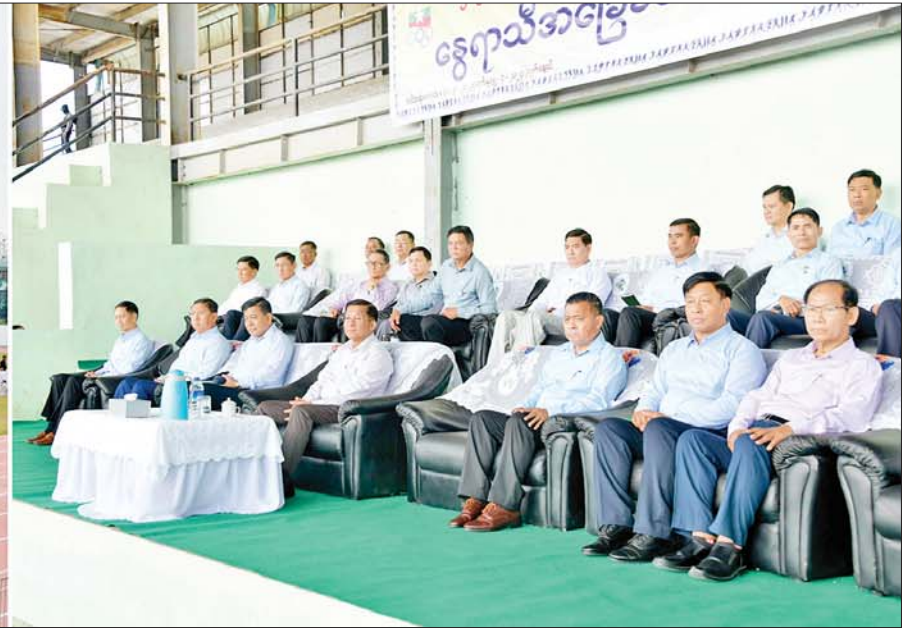
နိုင်ငံတော်စီမံအုပ်ချုပ်ရေးကောင်စီဥက္ကဋ္ဌ နိုင်ငံတော်ဝန်ကြီးချုပ် ဗိုလ်ချုပ်မှူးကြီး မင်းအောင်လှိုင် ရခိုင်ပြည်နယ် အားကစားနှင့် ကာယပညာကော်မတီမှ ဖွင့်လှစ်သည့် နွေရာသီအခြေခံအားကစားသင်တန်း သရုပ်ပြလေ့ကျင့်မှုများကို ကြည့်ရှုအားပေးစဉ်။