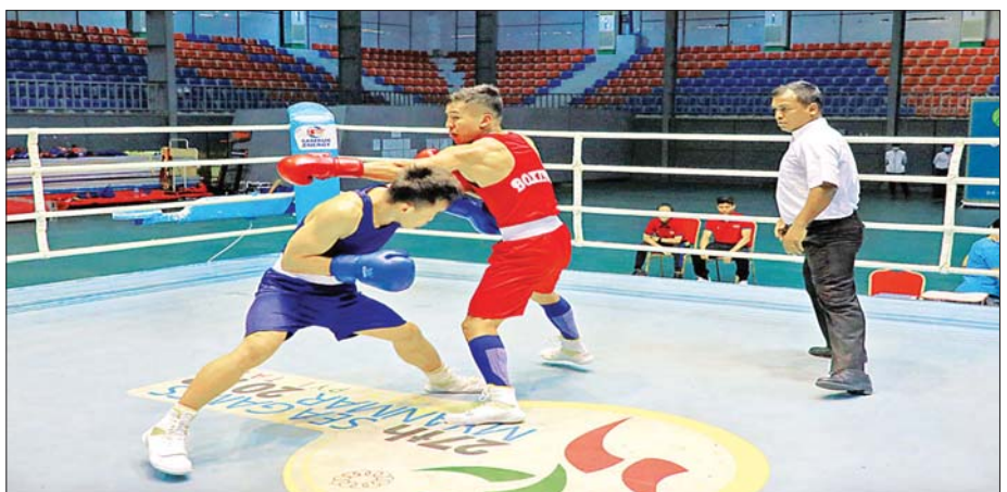
(၃၂) ကြိမ်မြောက် အရှေ့တောင်အာရှအားကစားပြိုင်ပွဲအကြို(လက်ရည်စမ်း)လက်ဝှေ့ပြိုင်ပွဲကျင်းပစဉ်။

ကျင်းပပြီးစီးခဲ့သည့် (၃၁) ကြိမ်မြောက် အရှေ့တောင်အာရှ အားကစားပြိုင်ပွဲကြီးကို ဗီယက်နမ်နိုင်ငံ၌ ၂၀၂၁ ခုနှစ်တွင် ကျင်းပရန် ဖြစ်သော်လည်း ဗီယက်နမ်နိုင်ငံအတွင်း ဖြစ်ပေါ်နေသည့် ကိုဗစ်-၁၉ ရောဂါအခြေအနေကြောင့် ပြိုင်ပွဲရက်ကို ၂၀၂၂ ခုနှစ် မေလသို့ ပြောင်းရွှေ့ကျင်းပခဲ့ရသည်။ ထိုကဲ့သို့သော အခြေအနေအရ (၃၁)ကြိမ်မြောက် အရှေ့တောင်အာရှအားကစားပြိုင်ပွဲနှင့် (၃၂)ကြိမ်မြောက် အရှေ့တောင်အာရှ အားကစားပြိုင်ပွဲမှာ တစ်နှစ်ခန့်သာခြား၍ ကျင်းပခဲ့ခြင်းဖြစ်သည်။