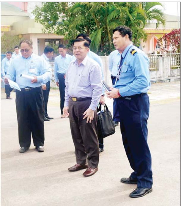
နိုင်ငံတော်စီမံအုပ်ချုပ်ရေးကောင်စီဥက္ကဋ္ဌ နိုင်ငံတော်ဝန်ကြီးချုပ် ဗိုလ်ချုပ်မှူးကြီး မင်းအောင်လှိုင် စစ်တွေလေယာဉ်ကွင်း အဆင့်မြှင့်တင်ဆောင်ရွက်နိုင်မည့်အခြေအနေများကို ကြည့်ရှုစဉ်။