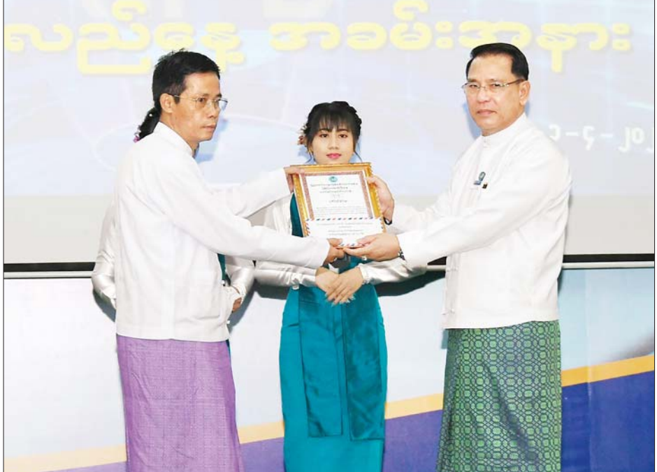
ပြည်ထောင်စုဝန်ကြီး ဦးမောင်မောင်အုန်း ကဏ္ဍသစ်များ စဉ်ဆက်မပြတ်ထည့်သွင်းခြင်းနှင့် ကြော်ငြာဝင်ငွေ အများဆုံးရှာဖွေပေးနိုင်ခဲ့သည့် ကြေးမုံသတင်းစာတိုက် ဝန်ထမ်းများအတွက် ဂုဏ်ပြုဆု ပေးအပ်ချီးမြှင့်စဉ်။

ယင်းနောက် ပြည်ထောင်စုဝန်ကြီး ဒုတိယဝန်ကြီးနှင့် အခမ်းအနားသို့ တက်ရောက်လာကြသူများက စုပေါင်းမှတ်တမ်းတင်ဓာတ်ပုံရိုက်ကြပြီး နှစ်ပတ်လည်နေ့အခမ်းအနားကို ရုပ်သိမ်းလိုက်သည်။ သတင်းစဉ်