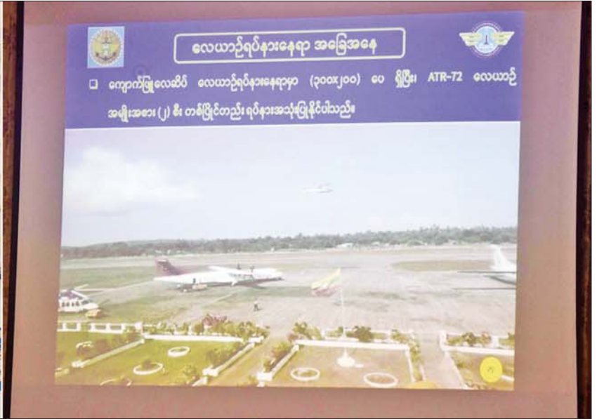
နိုင်ငံတော်စီမံအုပ်ချုပ်ရေးကောင်စီဥက္ကဋ္ဌ နိုင်ငံတော်ဝန်ကြီးချုပ် ဗိုလ်ချုပ်မှူးကြီး မင်းအောင်လှိုင်အား ရခိုင်ပြည်နယ်အတွင်းရှိ လေယာဉ်ကွင်းများအဆင့်မြှင့်တင်ရန် ဆောင်ရွက်နေမှုအခြေအနေများကို တာဝန်ရှိသူတစ်ဦးက ရှင်းလင်းတင်ပြစဉ်။

နေပြည်တော် ဧပြီ ၁ နိုင်ငံတော်စီမံအုပ်ချုပ်ရေးကောင်စီ ဥက္ကဋ္ဌ နိုင်ငံတော်ဝန်ကြီးချုပ် ဗိုလ်ချုပ်မှူးကြီး မင်းအောင်လှိုင်သည် ယနေ့ နံနက်ပိုင်းတွင် ခရီးစဉ်တွင် လိုက်ပါလာသည့် အဖွဲ့ဝင်များ၊ ရခိုင်ပြည်နယ်ဝန်ကြီးချုပ် ဦးထိန်လင်း၊ အနောက်ပိုင်းတိုင်းစစ်ဌာနချုပ် တိုင်းမှူးနှင့် တာဝန်ရှိသူများ လိုက်ပါ၍ ရခိုင်ပြည်နယ်အတွင်းရှိ လေယာဉ်ကွင်းများ အဆင့်မြှင့်တင်ရန် ဆောင်ရွက်နေမှု အခြေအနေများကို ကြည့်ရှုစစ်ဆေးသည်။