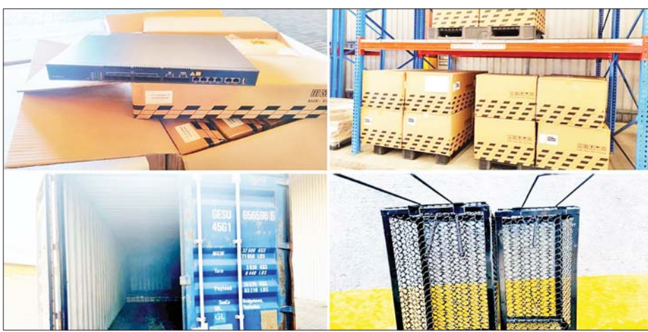
မြန်မာအပြည်ပြည်ဆိုင်ရာဆိပ်ကမ်း(သီလဝါ)၌ သိမ်းဆည်းရမိမှု။

နေပြည်တော် ဧပြီ ၁ တရားမဝင် ကုန်သွယ်မှုတိုက် ဖျက်ရေး ဦးဆောင်ကော်မတီ၏ ကြီးကြပ်ကွပ်ကဲမှုဖြင့် တရားမဝင် ကုန်သွယ်မှုများကို ဥပဒေနှင့်အညီ ထိရောက်စွာ တားဆီးအရေးယူ နိုင်ရေး ဆောင်ရွက်လျက်ရှိရာတွင် မတ် ၂၃ ရက်နှင့် ၃၁ ရက်တို့တွင် အကောက်ခွန်ဦးစီးဌာန၏ စီမံ ခန့်ခွဲမှုဖြင့် မြန်မာအပြည်ပြည် ဆိုင်ရာဆိပ်ကမ်း (သီလဝါ)၌ တာဝန်ကျ အကောက်ခွန်အဖွဲ့က စစ်ဆေးမှုများ ဆောင်ရွက်ခဲ့ရာ ကုန်သေတ္တာ နှစ်လုံးအတွင်းမှ သွင်းကုန် ကြေညာလွှာတွင် ကြေညာထားသည်နှင့် ကိုက်ညီမှု မရှိသော Gpon Olt 8 Pon Ports အလုံး ၈၀ (ခန့်မှန်းတန်ဖိုးငွေကျပ် ၁၄၁၁၂၀၀၀)နှင့် Metal Mouse Trap ၈၄၀ ကီလိုဂရမ် (ခန့်မှန်း တန်ဖိုးငွေကျပ် ၁၇၆၄၀၀၀) စုစု ပေါင်း (ခန့်မှန်းတန်ဖိုးငွေကျပ် ၁၄၂၈၈၄၀၀)ကို သိမ်းဆည်းရမိ ခဲ့ပြီး အကောက်ခွန်လုပ်ထုံး လုပ်နည်းနှင့်အညီ အရေးယူ ဆောင်ရွက်လျက်ရှိသည်။ အလားတူ မတ် ၂၅ ရက်တွင် ရှမ်းပြည်နယ်တရားမဝင်ကုန်သွယ် မှု တိုက်ဖျက်ရေးအဖွဲ့၏ စီမံခန့်ခွဲမှုဖြင့် လားရှိုးမြို့နယ် အကောက်ခွန် ဦးစီးဌာနမှူးရုံးမှ