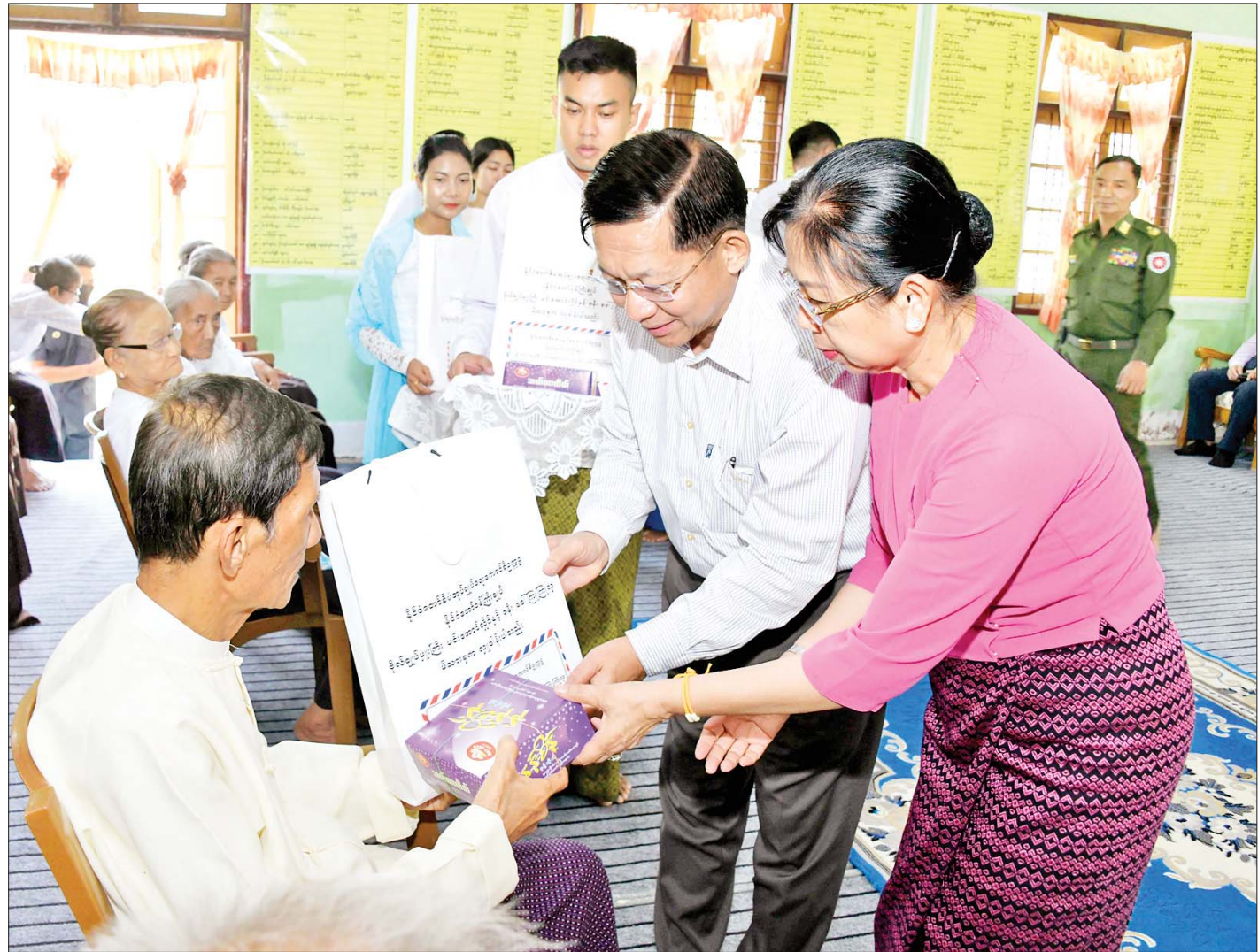
နိုင်ငံတော်စီမံအုပ်ချုပ်ရေးကောင်စီ ဥက္ကဋ္ဌ နိုင်ငံတော်ဝန်ကြီးချုပ် ဗိုလ်ချုပ်မှူးကြီး မင်းအောင်လှိုင်နှင့်ဇနီး ဒေါ်ကြူကြူလှ စစ်တွေမြို့ရှိ ဘိုးဘွားရိပ်သာမှ သက်ကြီးအဘိုးတစ်ဦးအား အာဟာရဖြည့်စားသောက်ဖွယ်ရာများနှင့် အသုံးအဆောင်ပစ္စည်းများ ပေးအပ်လှူဒါန်းစဉ်။

နေပြည်တော် ဧပြီ ၁ နိုင်ငံတော်စီမံအုပ်ချုပ်ရေးကောင်စီ ဥက္ကဋ္ဌ နိုင်ငံတော်ဝန်ကြီးချုပ် ဗိုလ်ချုပ်မှူးကြီး မင်းအောင်လှိုင်သည် ယနေ့နံနက်ပိုင်းတွင် ဇနီး ဒေါ်ကြူကြူလှ၊ ခရီးစဉ်တွင် လိုက်ပါလာသည့် အဖွဲ့ဝင်များနှင့် ဇနီးများ၊ ရခိုင်ပြည်နယ်ဝန်ကြီးချုပ် ဦးထိန်လင်း၊ အနောက်ပိုင်းတိုင်းစစ်ဌာနချုပ် တိုင်းမှူးနှင့် တာဝန်ရှိသူများလိုက်ပါ၍ ရခိုင်ပြည်နယ် စစ်တွေမြို့ရှိ ဘိုးဘွားရိပ်သာမှ သက်ကြီးဘိုးဘွားများအတွက် အာဟာရဖြည့်စားသောက်ဖွယ်ရာများနှင့် အသုံးအဆောင်ပစ္စည်းများ ပေးအပ်လှူဒါန်းသည်။ ရှင်းလင်းတင်ပြ ဦးစွာ နိုင်ငံတော်စီမံအုပ်ချုပ်ရေးကောင်စီဥက္ကဋ္ဌ နိုင်ငံတော်ဝန်ကြီးချုပ်နှင့်ဇနီး၊ အဖွဲ့ဝင်များအား ဘိုးဘွားရိပ်သာဓမ္မာရုံ၌ ဘိုးဘွားရိပ်သာကော်မတီ ဥက္ကဋ္ဌ ဦးရွှေထွန်းအောင်က ရခိုင်ပြည်နယ် ဘိုးဘွားရိပ်သာ၏ အချက်အလက်များနှင့် သမိုင်းအကျဉ်း၊ ဘိုးဘွားများ၏ စားသောက်နေထိုင်ရေးနှင့် ကျန်းမာရေးဆိုင်ရာများကို စောင့်ရှောက်ဆောင်ရွက်ပေးလျက်ရှိမှု၊ စာမျက်နှာ ၃ ကော်လံ ၁ သို့ ။