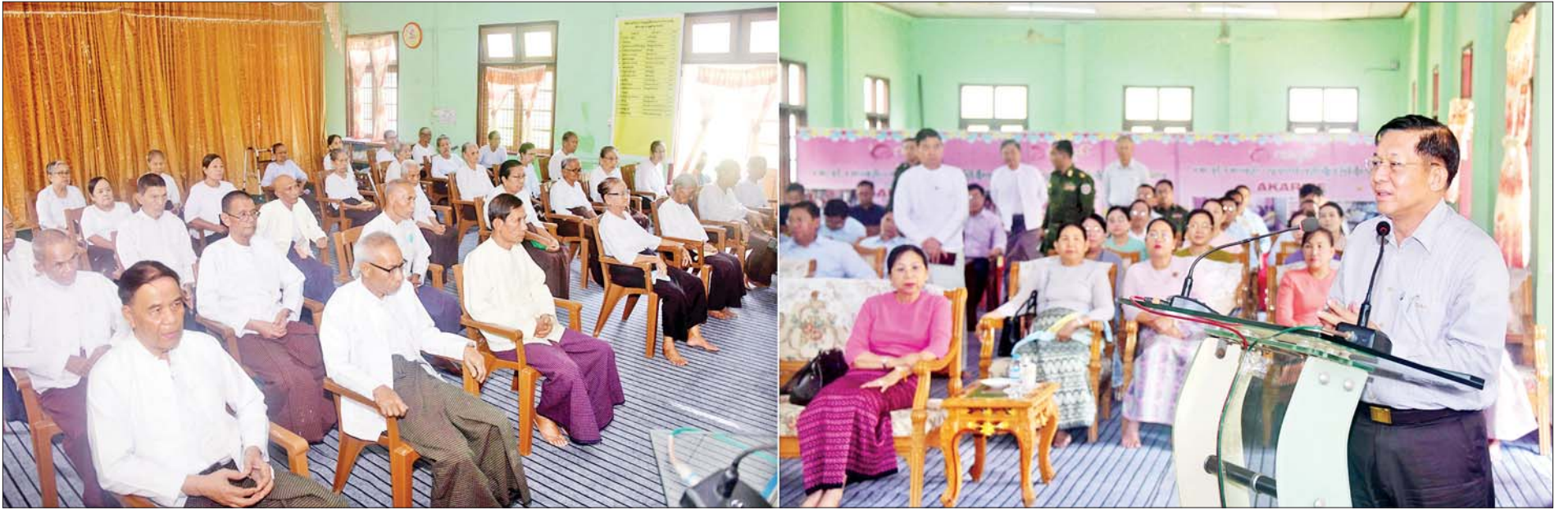
နိုင်ငံတော်စီမံအုပ်ချုပ်ရေးကောင်စီဥက္ကဋ္ဌ နိုင်ငံတော်ဝန်ကြီးချုပ် ဗိုလ်ချုပ်မှူးကြီးမင်းအောင်လှိုင် စစ်တွေမြို့ရှိ ဘိုးဘွားရိပ်သာမှ သက်ကြီးဘိုးဘွားများအား နှုတ်ခွန်းဆက်စကားပြောကြားစဉ်။

☆ ရှေ့ဖုံးမှ ဘိုးဘွားရိပ်သာအတွက် အလှူရှင်များက လှူဒါန်းလျက်ရှိသကဲ့သို့ နိုင်ငံတော်မှလည်း နှစ်စဉ်ထောက်ပံ့လှူဒါန်းပေးလျက်ရှိပြီး ဘိုးဘွားရိပ်သာတွင် ဂိလာနအဆောင်တစ်ဆောင် ဆောက်လုပ်ပေးရန် လိုအပ်လျက်ရှိသည့် အခြေအနေများကို ရှင်းလင်းတင်ပြသည်။