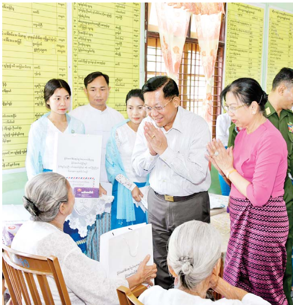
နိုင်ငံတော်စီမံအုပ်ချုပ်ရေးကောင်စီဥက္ကဋ္ဌ နိုင်ငံတော်ဝန်ကြီးချုပ် ဗိုလ်ချုပ်မှူးကြီးမင်းအောင်လှိုင်နှင့်ဇနီး ဒေါ်ကြူကြူလှ စစ်တွေမြို့ရှိ ဘိုးဘွားရိပ်သာမှ သက်ကြီးဘိုးဘွားများအား အာဟာရဖြည့်စားသောက်ဖွယ်ရာများနှင့် အသုံးအဆောင်ပစ္စည်းများ ပေးအပ်လှူဒါန်းစဉ်။

ယင်းနောက် နိုင်ငံတော်စီမံအုပ်ချုပ်ရေးကောင်စီဥက္ကဋ္ဌ နိုင်ငံတော်ဝန်ကြီးချုပ်က နှုတ်ခွန်းဆက်စကား ပြောကြားရာတွင် ဗုဒ္ဓဘာသာတွင် သာမက အခြားဘာသာများတွင်လည်း မိမိတို့ထက် အသက်အရွယ်ကြီးရင့်သူများကို ပြုစုစောင့်ရှောက်ခြင်းသည် ကောင်းမွန်သည့် ဆောင်ရွက်ချက်ဖြစ်ကြောင်း၊ ဘိုးဘွားများကို စောင့်ရှောက်လျက်ရှိသူများအနေဖြင့် ဘိုးဘွားများ ကိုယ်စိတ်နှလုံးရွှင်လန်းစွာဖြင့် နေထိုင်စေရေး ဆောင်ရွက်ပေးရန်လိုကြောင်း၊ ဘိုးဘွားများအနေဖြင့်လည်း မိမိတို့ဘဝအတွက် အကောင်းဆုံးအခြေအနေကို ရောက်ရှိနေပြီဟု နှလုံးသွင်းပြီး ကုသိုလ်ဘာဝနာများ ပွားများ၍ စိတ်နှလုံးရွှင်လန်းစွာဖြင့် နေထိုင်နိုင်ရန်လိုကြောင်း၊ လူသားတိုင်းသည် အသက်အရွယ်မရွေး နွေးထွေးကြင်နာမှုကို လိုလားကြကြောင်း၊ အထူးသဖြင့် ဘိုးဘွားများကဲ့သို့ အသက်အရွယ်ကြီးရင့်သူများကို နွေးထွေးစွာဖြင့် နေထိုင်နိုင်အောင် ဆောင်ရွက်ပေးရမည်ဖြစ်ကြောင်း၊ စိတ်ကျန်းမာမှုသာ ကိုယ်ကျန်းမာမှုကို အထောက်အကူပြုမည်ဖြစ်ပြီး ယခုကဲ့သို့ ဘိုးဘွားများကို ကျန်းမာစွာဖြင့် တွေ့ဆုံခွင့်ရသည့်အတွက် ဝမ်းမြောက်ပါကြောင်း၊ ယခုထက်အသက်ရှည်ကျန်းမာစွာဖြင့် နေထိုင်နိုင်ကြစေရန် ဂါရဝပြုဆုမွန်ကောင်း တောင်းပါကြောင်း ပြောကြားသည်။