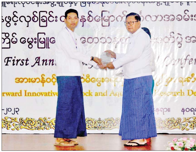
အခမ်းအနားတွင် ဒုတိယဝန်ကြီး ဦးဖွဲ့ဖြိုးစွာ ဆောင်ရွက်နိုင်မည်ဖြစ်ကြောင်း၊ ဒေါက်တာအောင်ကြီးက မွေးမြူရေး သုတေသနဦးစီးဌာန အသစ်ဖွင့်လှစ် ဆောင်ရွက်ခြင်းဖြင့် နိုင်ငံတကာအဆင့်မီ အမျိုးသားအဆင့် သုတေသနလုပ်ငန်းများ ထို့အတူ မွေးမြူရေးနှင့် ရေလုပ်ငန်း ထွက်ကုန်ပစ္စည်းများမှ ပြည်တွင်း စားသုံးမှု ဖူလုံစေပြီး ပိုလျှံသည်များကို ပြည်ပသို့ တင်ပို့နိုင်မည်ဖြစ်ကြောင်း။

နေပြည်တော် ဧပြီ ၁ မွေးမြူရေး သုတေသနဦးစီးဌာန တည်ထောင်ဖွင့်လှစ်ခြင်း တစ်နှစ်ပြည့် အခမ်းအနားနှင့် ပထမအကြိမ် မွေးမြူရေး သုတေသန စာတမ်းဖတ်ပွဲ အခမ်းအနားကို ယနေ့တွင် နေပြည်တော်ကောင်စီ နယ်မြေ ရေဆင်းရှိ နဝရတ်ခန်းမ၌ ကျင်းပ သည်။ အခမ်းအနားသို့ စိုက်ပျိုးရေး၊ မွေးမြူ ရေးနှင့် ဆည်မြောင်းဝန်ကြီးဌာန ဒုတိယ ဝန်ကြီး ဒေါက်တာအောင်ကြီးနှင့် ဒေါက်တာတင်ထွဋ်၊ အမြဲတမ်းအတွင်းဝန်၊ ညွှန်ကြားရေးမှူးချုပ်များ၊ ပါမောက္ခချုပ် များ၊ မြန်မာနိုင်ငံ တိရစ္ဆာန်ဆေးပညာ ကောင်စီ၊ မြန်မာနိုင်ငံ တိရစ္ဆာန်ဆေးကု ဆရာဝန်များအသင်း၊ မြန်မာနိုင်ငံ မွေးမြူရေးလုပ်ငန်းအဖွဲ့ချုပ်နှင့် မြန်မာ နိုင်ငံ ငါးလုပ်ငန်းအဖွဲ့ချုပ်တို့မှ တာဝန် ရှိသူများ၊ ဖိတ်ကြားထားသော ဧည့်သည် တော်များ တက်ရောက်ကြသည်။