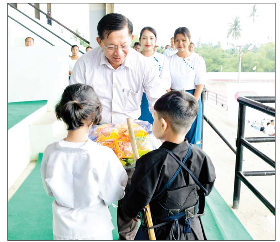
နိုင်ငံတော်စီမံအုပ်ချုပ်ရေးကောင်စီဥက္ကဋ္ဌ နိုင်ငံတော်ဝန်ကြီးချုပ် ဗိုလ်ချုပ်မှူးကြီး မင်းအောင်လှိုင် ရခိုင်ပြည်နယ် အားကစားနှင့် ကာယပညာကော်မတီမှ ဖွင့်လှစ်သည့် နွေရာသီအခြေခံအားကစားသင်တန်းမှ သင်တန်းသား သင်တန်းသူများအတွက် စားသောက်ဖွယ်ရာများကို ပေးအပ်စဉ်။

အားကစားသင်တန်းကို လူငယ်မောင်မယ်များ ဗလင်းတန်ဖွံ့ဖြိုးတိုးတက်ပြီး အားကစားအသိစိတ်ဓာတ် ပိုမိုတိုးပွားလာခြင်းမှ တစ်မျိုးသားလုံး ကာယ၊ ဉာဏ၊ စာရိတ္တ ဖွံ့ဖြိုးတိုးတက်လာစေရန်၊ မိမိဝါသနာပါသည့် အားကစားနည်းကို လေ့ကျင့်လိုက်စားခြင်းမှ အမျိုးသား အားကစားအဆင့်အတန်း တိုးတက်မြှင့်မားလာစေရန်နှင့် ကျောင်းသား လူငယ်မောင်မယ်များအတွက် နွေရာသီကျောင်းပိတ်ရက်ကာလကို အကျိုးရှိရှိအသုံးပြုနိုင်စေရန် စသည့် ရည်ရွယ်ချက်များဖြင့် မတ် ၁ ရက်မှ စတင်ဖွင့်လှစ်သင်ကြားခဲ့ခြင်းဖြစ်ပြီး ဧပြီ ၅ ရက်အထိ ဖွင့်လှစ်သင်ကြားသွားမည်ဖြစ်ကြောင်း၊ ယခုသင်တန်းတွင် အားကစားနည်း ၁၆ မျိုးကို လေ့ကျင့်သင်ကြားပေးလျက်ရှိကြောင်းနှင့် သင်တန်းသား သင်တန်းသူ ၁၈၂၀ တက်ရောက်သင်ကြားလျက်ရှိကြောင်း သိရသည်။