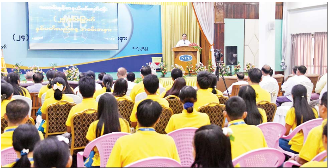
ပြည်ထောင်စုဝန်ကြီး ဦးမောင်မောင်အုန်း ပြန်ကြားရေးဝန်ကြီးဌာန သတင်းနှင့်စာနယ်ဇင်းလုပ်ငန်း၏ (၂၅)နှစ်မြောက် နှစ်ပတ်လည်နေ့ အခမ်းအနားတွင် အမှာစကားပြောကြားစဉ်။

မျက်မှောက် ကာလတွင် ပြန်ကြားရေးကဏ္ဍ၏ အဓိက လိုအပ်ချက်မှာ မြန်မာတစ်နိုင်ငံလုံး သာမက တစ်ကမ္ဘာလုံးကိုပါ သတင်းမှန်များ အချိန်နှင့်တစ်ပြေးညီ ပျံ့နှံ့စေရန်ဖြစ်ပါကြောင်း၊ သို့သော် လိုအပ်ချက်များ ရှိနေသည်ကိုလည်း တွေ့ရပါကြောင်း၊ ထို့ကြောင့် အနာဂတ်ကာလတွင် Myanmar Digital News ကို ယခုထက်မက တိုးတက်လာအောင် ဆောင်ရွက်ရမည်