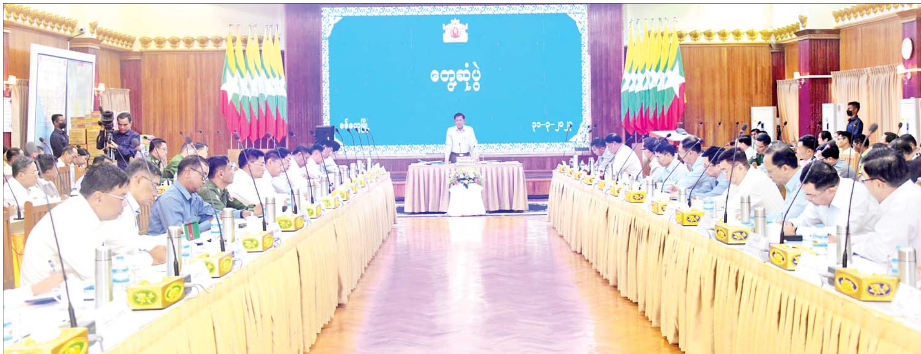
နိုင်ငံတော်စီမံအုပ်ချုပ်ရေးကောင်စီဥက္ကဋ္ဌ နိုင်ငံတော်ဝန်ကြီးချုပ် ဗိုလ်ချုပ်မှူးကြီး မင်းအောင်လှိုင် ရခိုင်ပြည်နယ်အစိုးရအဖွဲ့နှင့် ပြည်နယ်အဆင့် ဌာနဆိုင်ရာတာဝန်ရှိသူများအား တွေ့ဆုံအမှာစကားပြောကြားစဉ်။