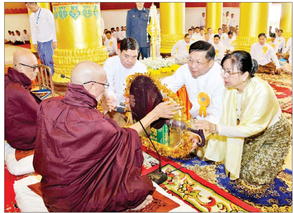
နိုင်ငံတော် စီမံအုပ်ချုပ်ရေး ကောင်စီဥက္ကဋ္ဌ နိုင်ငံတော် ဝန်ကြီးချုပ် ဗိုလ်ချုပ်မှူးကြီး မင်းအောင်လှိုင်၏ ဇနီး ဒေါ်ကြူကြူလှနှင့် အဖွဲ့ဝင်များ၊ အခမ်းအနား တက်ရောက် လာကြသူများနှင့် ဒေသခံ တိုင်းရင်းသား ပြည်သူလူထု တို့က မင်္ဂလာကြီးဆွဲ၍ ရတနာ စိန်ဖူးတော်၊ ငှက်မြတ်နားတော် တို့အား မင်္ဂလာရထားပျံဖြင့် လောကာနန္ဒာ စေတီတော် မြတ်ကြီး အထွတ်သို့ ပင့်ဆောင် ကြစဉ်။