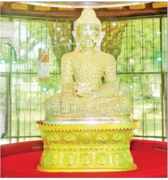
နိုင်ငံတော်စီမံအုပ်ချုပ်ရေးကောင်စီဥက္ကဋ္ဌ နိုင်ငံတော်ဝန်ကြီးချုပ် ဗိုလ်ချုပ်မှူးကြီးမင်းအောင်လှိုင်နှင့်ဇနီး ဒေါ်ကြူကြူလှ စကြာမုနိသိမ်တော်မြတ်ကြီးအတွင်းရှိ စကြာမုနိ ဗုဒ္ဓရုပ်ပွားတော်မြတ်အား ဖူးမြော်ကြည့်ညိုစဉ်။

ရွာသွန်းဖြိုးကြသည်။ ပေးအပ်လှူဒါန်း ထို့နောက် လောကာနန္ဒာ စေတီတော်မြတ်ကြီး အတွက် အလှူငွေပေးအပ်ပွဲနှင့် ဗုဒ္ဓါဘိသေ က အနေကဇာတင် အခမ်းအနား ကိုဆက်လက်ကျင်းပရာ နိုင်ငံတော် စီမံအုပ်ချုပ်ရေးကောင်စီ ဥက္ကဋ္ဌ နိုင်ငံတော်ဝန်ကြီးချုပ်နှင့် ဇနီး တို့က စေတီတော်မြတ်ကြီး