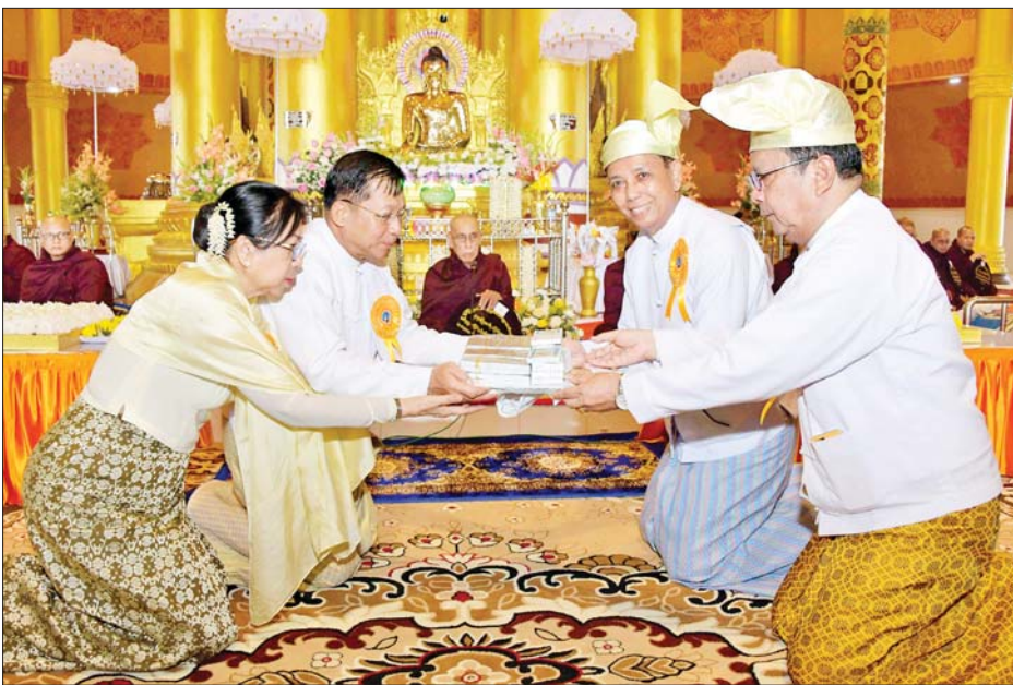
နိုင်ငံတော်စီမံအုပ်ချုပ်ရေးကောင်စီဥက္ကဋ္ဌ နိုင်ငံတော်ဝန်ကြီးချုပ် ဗိုလ်ချုပ်မှူးကြီးမင်းအောင်လှိုင် နှင့်ဇနီး ဒေါ်ကြူကြူလှတို့ လောကနန္ဒာစေတီတော်မြတ်ကြီး လုံးတော်ပြည့် ရွှေသင်္ကန်းကပ်လှူပူဇော်ရန် အတွက် အလှူငွေများ ပေးအပ်လှူဒါန်းစဉ်။

ဤစာအုပ်စီမံအုပ်ချုပ်ရေး ကောင်စီဥက္ကဋ္ဌ နိုင်ငံတော်ဝန်ကြီး ချုပ်နှင့် အဖွဲ့ဝင်များက စေတီတော် လိုဏ်အတွင်းရှိ ဗုဒ္ဓရုပ်ပွားတော် မြတ်အား ဖူးမြော်ကြည်ညို၍ မြသပိတ်ဆွမ်းတော်နှင့် ပန်း၊ ရေချမ်း၊ ဆီမီးတို့ကို ဆက်ကပ် လှူဒါန်းသည်။