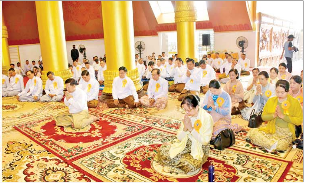
နိုင်ငံတော်စီမံအုပ်ချုပ်ရေးကောင်စီဥက္ကဋ္ဌ နိုင်ငံတော်ဝန်ကြီးချုပ် ဗိုလ်ချုပ်မှူးကြီးမင်းအောင်လှိုင်နှင့်ဇနီး ဒေါ်ကြူကြူလှ၊ အခမ်းအနား တက်ရောက်လာကြသူများ မင်းပြားဆရာတော်ကြီးထံမှ ကိုးပါးသီလ ခံယူဆောက်တည်ကြစဉ်။