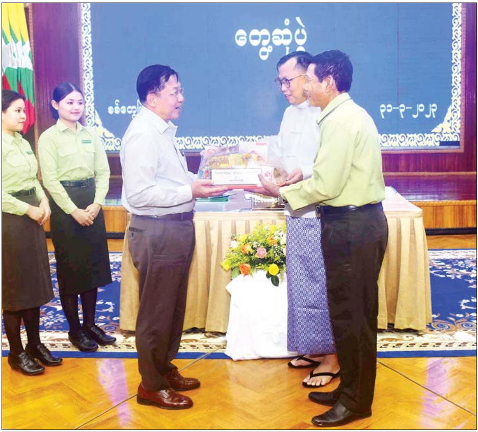
နိုင်ငံတော်စီမံအုပ်ချုပ်ရေးကောင်စီဥက္ကဋ္ဌ နိုင်ငံတော်ဝန်ကြီးချုပ် ဗိုလ်ချုပ်မှူးကြီး မင်းအောင်လှိုင် ရခိုင်ပြည်နယ်အစိုးရအဖွဲ့နှင့် ပြည်နယ်အဆင့် ဌာနဆိုင်ရာဝန်ထမ်းများအတွက် စားသောက်ဖွယ်ရာများ ထောက်ပံ့ပေးအပ်စဉ်။

ငြိမ်းချမ်းရေးနှင့်ပတ်သက်၍လည်း ဖွဲ့စည်းပုံအခြေခံဥပဒေ(၂၀၀၈ ခုနှစ်)နှင့် တစ်နိုင်ငံလုံးပစ်ခတ်တိုက်ခိုက်မှုရပ်စဲရေးသဘောတူစာချုပ် NCA ကို အခြေခံ၍ ငြိမ်းချမ်းရေးကို အကောင်အထည်ဖော်ဆောင်ရွက်လျက်ရှိကြောင်း၊ တိုင်းရင်းသားလက်နက်ကိုင်အဖွဲ့များနှင့် ငြိမ်းချမ်းရေးဆွေးနွေးမှုများကို အရှိန်အဟုန်ဖြင့် ဆောင်ရွက်လျက်ရှိပြီး နိုင်ငံတော်အတွက် အပြုသဘောဆောင်သည့် ဆွေးနွေးမှုလမ်းစဉ်များကို ဖော်ဆောင်နိုင်ခဲ့ကြောင်း၊ ဖွဲ့စည်းပုံအခြေခံဥပဒေ(၂၀၀၈ ခုနှစ်) သည်ပြည်လုံးကျွတ် ဆန္ဒခံယူပွဲဖြင့် အတည်ပြုထားသည့်ဥပဒေဖြစ်ပြီး ပြည်သူတို့အပေါ်ထားရှိသည့် ကတိကဝတ်ပင်ဖြစ်ကြောင်း၊ တစ်နိုင်ငံလုံးပစ်ခတ်တိုက်ခိုက်မှုရပ်စဲရေးသဘောတူစာချုပ်(NCA)သည်လည်း အစိုးရနှင့် EAO များအကြား၊ နိုင်ငံတကာအဖွဲ့အစည်းများအကြားထားရှိခဲ့သည့် ကတိကဝတ်ဖြစ်ကြောင်း။