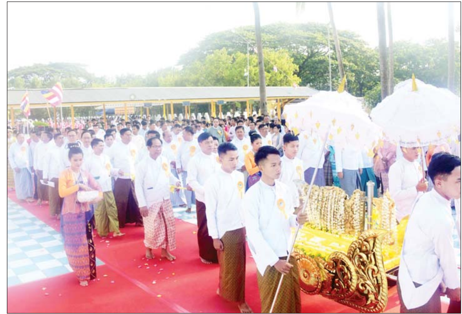
ကောင်စီတွဲဖက်အတွင်းရေးမှူး၊ ကောင်စီဝင်များ၊ ပြည်ထောင်စုဝန်ကြီးများနှင့် အခမ်းအနား တက်ရောက်လာကြသူများက ငှက်မြတ်နားတော်ကို မင်္ဂလာဝေါဟာရဖြင့် ပင့်ဆောင်၍ လောကာနန္ဒာ စေတီတော်မြတ်ကြီးအား လက်ယာရစ် လှည့်လည်ပူဇော်ကြစဉ်။