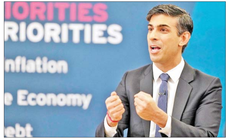
ချီလီ၊ ဂျပန်၊ မလေးရှား၊ မက္ကဆီကို၊ နယူးဇီလန်၊ ပီရူး၊ စင်ကာပူနှင့် ဗီယက်နမ်တို့ပါဝင်သည်။ ဗြိတိန်နိုင်ငံသည် ၁၂ နိုင်ငံမြောက် အဖွဲ့ဝင်နိုင်ငံဖြစ်ကြောင်း သိရသည်။ ကိုးကား- ဆင်ဟွာဘာသာပြန်- အောင်ကျော်ကျော်

တန်ဖိုးမှာ ပေါင် ၁၁ ထရီလီယံ (အမေရိကန် ဒေါ်လာ ၁၃ ဒသမ ၆၅ ထရီလီယံ) ရှိပြီး ဗြိတိန်နိုင်ငံ အဖွဲ့ဝင်ဖြစ်လာသည့်အတွက် ကမ္ဘာလုံးဆိုင်ရာ အသားတင်ကုန်ထုတ်လုပ်မှုတန်ဖိုး၏ ၁၅ ရာခိုင်နှုန်းအထိ မြင့်တက်လာမည်ဖြစ်သည်။ အဆိုပါ သဘောတူညီချက်သည် ဗြိတိန်နိုင်ငံအနေဖြင့် အင်ဒို-ပစ်ဖိတ်ဒေသ နှင့် စီးပွားရေးလုပ်ငန်းများ ကျယ်ကျယ်ပြန့်ပြန့် ဆောင်ရွက်နိုင်ပြီဖြစ်သည့် အတွက် ဗြိတိန်နိုင်ငံ၏ စီးပွားရေးလုပ်ငန်းများကို ပိုမိုတိုးတက်ကောင်းမွန်လာစေမည်ဖြစ်ကြောင်း သိရသည်။ ပစ်ဖိတ်ဖြတ်ကျော်မိတ်ဖက်ဆက်ဆံရေးဆိုင်ရာ ကုန်သွယ်ရေးအဖွဲ့ဝင်နိုင်ငံများတွင် ဩစတြေးလျ၊ ဘရူနိုင်း၊ ကနေဒါ