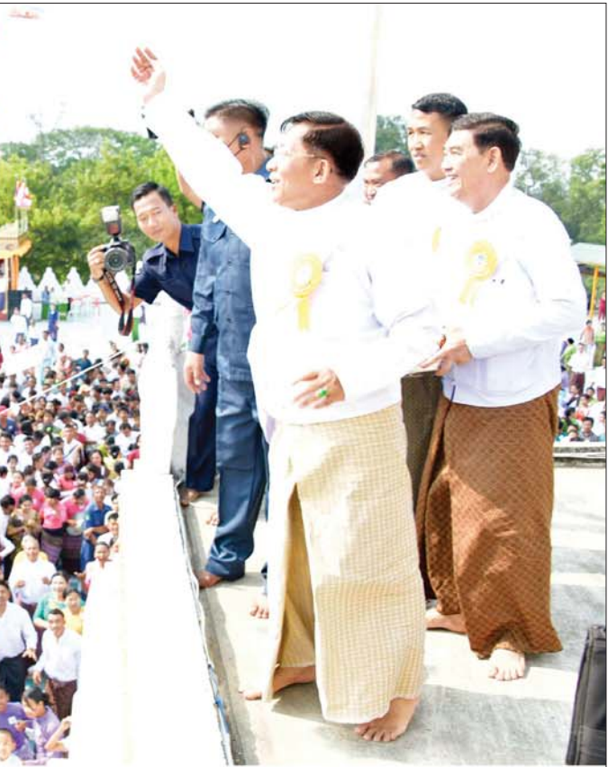
နိုင်ငံတော်စီမံအုပ်ချုပ်ရေးကောင်စီဥက္ကဋ္ဌ နိုင်ငံတော်ဝန်ကြီးချုပ် ဗိုလ်ချုပ်မှူးကြီးမင်းအောင်လှိုင် လောကာနန္ဒာစေတီတော်မြတ်ကြီး ရတနာစိန်ဖူးတော်၊ ငှက်မြတ်နားတော်တင်လှူပူဇော်ပွဲနှင့် ဗုဒ္ဓါဘိသေက အနေကဇာတင် မဟာမင်္ဂလာအခမ်းအနားများ အောင်မြင်ခြင်းအထိမ်းအမှတ်အဖြစ် ရတနာ ရွှေမိုး၊ ငွေမိုး ရွာသွန်းပြီးစဉ်။