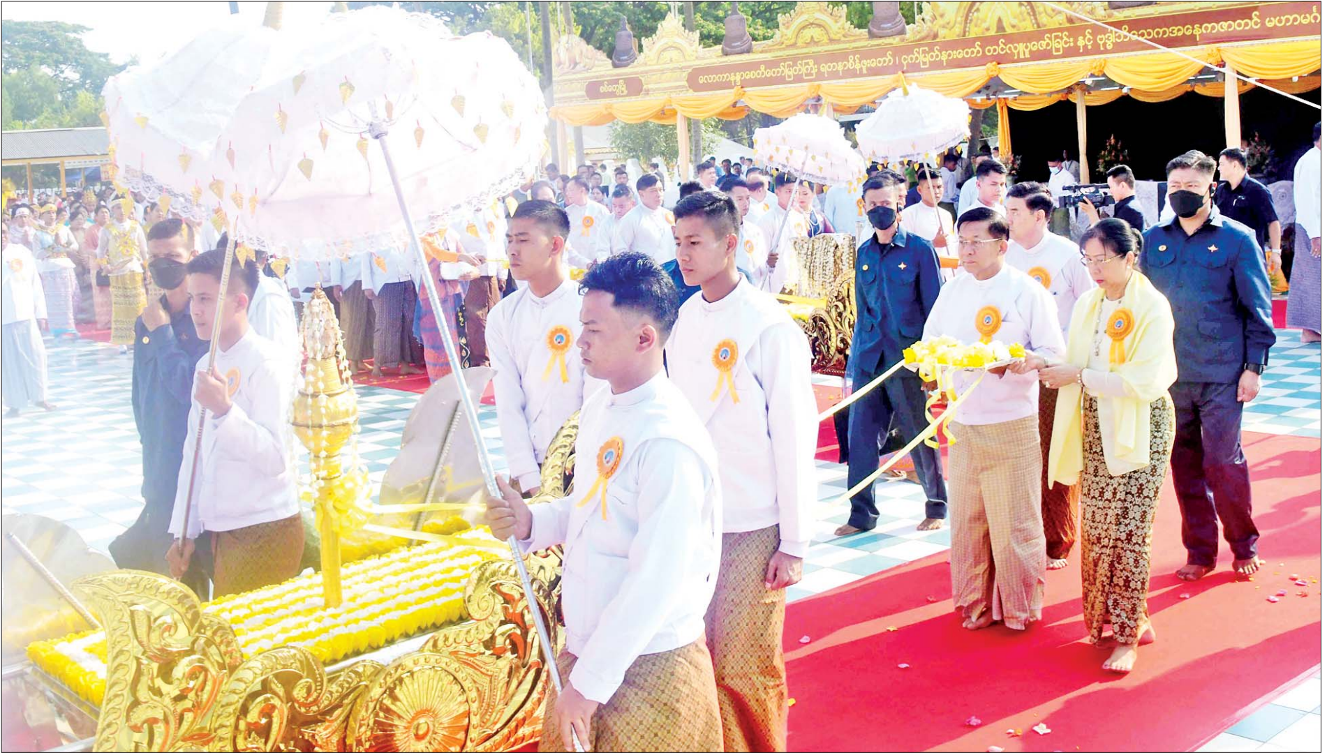
နိုင်ငံတော်စီမံအုပ်ချုပ်ရေးကောင်စီဥက္ကဋ္ဌ နိုင်ငံတော်ဝန်ကြီးချုပ် ဗိုလ်ချုပ်မှူးကြီးမင်းအောင်လှိုင်နှင့်ဇနီး ဒေါ်ကြူကြူလှတို့ ရတနာစိန်ဖူးတော်ကို မင်္ဂလာဝေါယာဉ်တော်ဖြင့် ပင့်ဆောင်၍ လောကာနန္ဒာစေတီတော်မြတ်ကြီးအား လက်ယာရစ် လှည့်လည်ပူဇော်စဉ်။