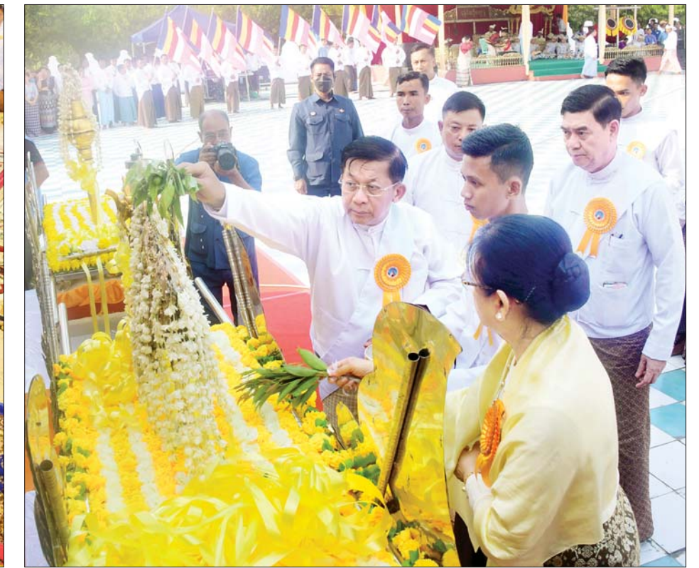
နိုင်ငံတော်စီမံအုပ်ချုပ်ရေးကောင်စီဥက္ကဋ္ဌ နိုင်ငံတော်ဝန်ကြီးချုပ် ဗိုလ်ချုပ်မှူးကြီးမင်းအောင်လှိုင် နှင့်ဇနီး ဒေါ်ကြူကြူလှတို့ သဗ္ဗညုဘုရားရှင်အား ရည်မှန်း၍ ရတနာစိန်ဖူးတော်ကို ဆရာတော်ထံ သာဟတ္ထိကဒါနမြောက် ဆက်ကပ်ပူဇော်စဉ်။