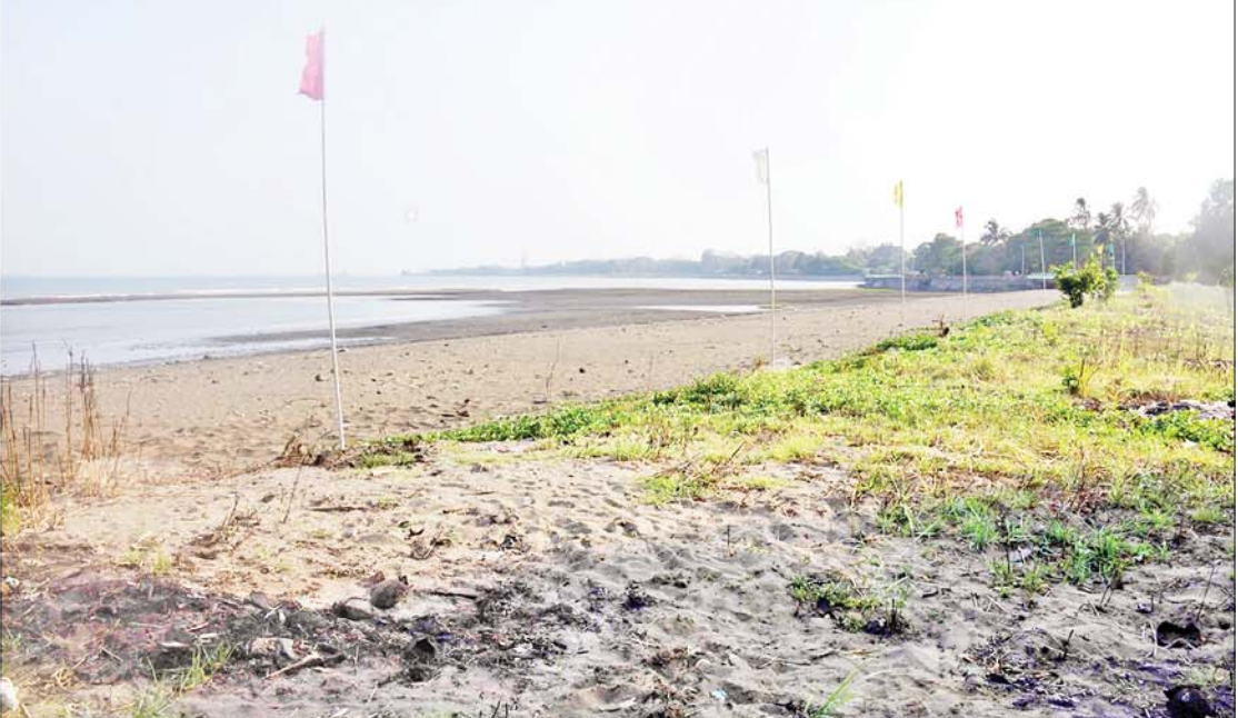
နိုင်ငံတော်စီမံအုပ်ချုပ်ရေးကောင်စီဥက္ကဋ္ဌ နိုင်ငံတော်ဝန်ကြီးချုပ် ဗိုလ်ချုပ်မှူးကြီး မင်းအောင်လှိုင် စစ်တွေမြို့ ကမ်းခြေတစ်လျှောက် သဲဖို့ခြင်းလုပ်ငန်းများဆောင်ရွက်ရန် စီမံဆောင်ရွက်မည့်အခြေအနေများကို ကြည့်ရှုစစ်ဆေးစဉ်။

လည်း ဥပဒေနှင့် အညီသာဆောင်ရွက်ရမည်ဖြစ်ပြီး “လူညီရင် ဤကို ကျွဲဖတ်သည်” ဟူသည့် ပုံစံမျိုး သွား၍မရကြောင်း၊ ဖက်ဒရယ်စနစ်ဟူသည်မှာ အဆင့်ဆင့်လုပ်ပိုင်ခွင့်များကို ခွဲဝေကျင့်သုံးခြင်းပင်ဖြစ်ကြောင်း၊ ပြည်နယ်နှင့် တိုင်းဒေသကြီးအားလုံးတွင် လျော်ကန်သင့်မြတ်သည့် အုပ်ချုပ်မှုအာဏာကို ခွဲဝေပေးရမည်ဖြစ်ကြောင်း၊ ထိုသို့ဆောင်ရွက်ပေးသည့်အချိန်တွင် လိုအပ်ချက်များကို ပြန်လည်ဆွေးနွေးပြီး ပြည်ထောင်စုနှင့် တိုင်းဒေသကြီးနှင့် ပြည်နယ်များမှ ဆောင်ရွက်ရမည့်များကို ဆွေးနွေးဆုံးဖြတ်ဆောင်ရွက်ရမည်ဖြစ်ကြောင်း၊ ဖက်ဒရယ်ဆိုင်ရာ လုပ်ပိုင်ခွင့်နှင့် ပတ်သက်၍ ဖွဲ့စည်းပုံအခြေခံ