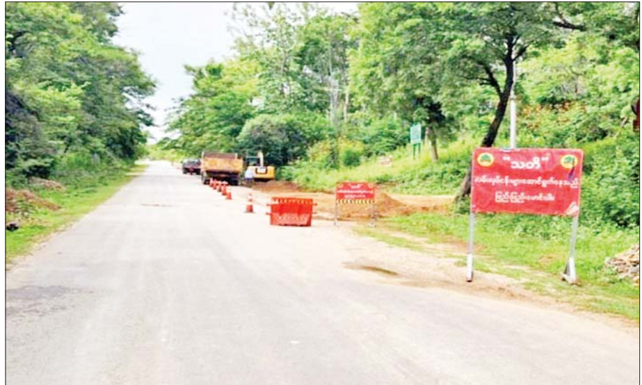
ပုသိမ်-မုံရွာလမ်း မကွေးတိုင်းဒေသကြီးအပိုင်း၌ ကတ္တရာခင်းနေစဉ်။

သို့ဖြစ်၍ ပုသိမ် - မုံရွာကားလမ်းတွင် ၃၁-၃-၂၀၂၃ ရက်နေ့၌ ၂၄ ပေအကျယ် ကတ္တရာလမ်း ၁၂ မိုင် သုညဖာလုံ + ပေ ၅၅၀၊ ၁၈ ပေအကျယ် ကတ္တရာလမ်း ၁၂ မိုင် ၅ ဖာလုံ + ၆၄ ပေ၊ ၁၆ ပေအကျယ် ကတ္တရာလမ်း ၃၃ မိုင် ၇ ဖာလုံ + ၃၁၆ ပေ၊ ၁၂ ပေအကျယ် ကတ္တရာလမ်း ၆၆ မိုင် ၂ ဖာလုံ + ၃၀ ပေအဆင့်သို့ရောက်ရှိမည်ဖြစ်ပြီး လမ်းပိုင်းများအားလုံးကို ၂၄ ပေအကျယ် ကတ္တရာလမ်းအဆင့်သို့ရောက်ရှိရန် နှစ်စဉ် စီမံချက်များရေးဆွဲ၍ ဆက်လက်ဆောင်ရွက်သွားမည်ဖြစ်ကြောင်း သိရသည်။ ။