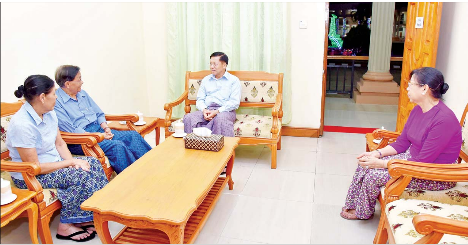
နိုင်ငံတော်စီမံအုပ်ချုပ်ရေးကောင်စီဥက္ကဋ္ဌ တပ်မတော်ကာကွယ်ရေးဦးစီးချုပ် ဗိုလ်ချုပ်မှူးကြီးမင်းအောင်လှိုင်နှင့် ဇနီးဒေါ်ကြူကြူလှ (၇၈)နှစ်မြောက် တပ်မတော်နေ့အခမ်းအနားသို့ တက်ရောက်ကြမည့် အငြိမ်းစားတပ်မတော်အရာရှိကြီးနှင့် ဇနီးအား တွေ့ဆုံဂါရဝပြုနှုတ်ဆက်စဉ်။

ဂါရဝပြုနှုတ်ဆက် နိုင်ငံတော် စီမံအုပ်ချုပ်ရေးကောင်စီဥက္ကဋ္ဌ တပ်မတော်ကာကွယ်ရေးဦးစီးချုပ်နှင့် ဇနီးတို့သည် အငြိမ်းစားတပ်မတော်အရာရှိကြီးများနှင့် ဇနီးများအား တစ်ဦးချင်း လိုက်လံဂါရဝပြုနှုတ်ဆက်ခဲ့ပြီး ကျန်းမာရေး၊ လူမှုရေးဆိုင်ရာ လိုအပ်ချက်များကို မေးမြန်း၍ လိုအပ်သည်များ ညှိနှိုင်းဖြည့်ဆည်းဆောင်ရွက်ပေးသည်။ စာမျက်နှာ ၃ ကော်လံ ၁ သို့ ၃