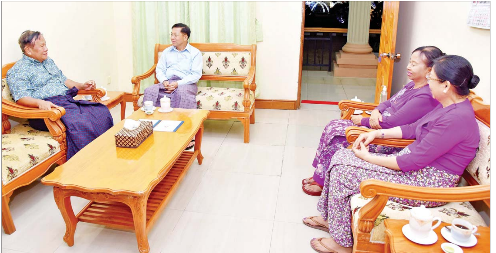
နိုင်ငံတော်စီမံအုပ်ချုပ်ရေးကောင်စီဥက္ကဋ္ဌ တပ်မတော်ကာကွယ်ရေးဦးစီးချုပ် ဗိုလ်ချုပ်မှူးကြီး မင်းအောင်လှိုင်နှင့် ဇနီးဒေါ်ကြူကြူလှ (၇၈)နှစ် မြောက် တပ်မတော်နေ့ အခမ်းအနားသို့ တက်ရောက်ကြမည့် အငြိမ်းစား တပ်မတော်အရာရှိကြီးနှင့် ဇနီးအား တွေ့ဆုံဂါရဝပြုနှုတ်ဆက်စဉ်။