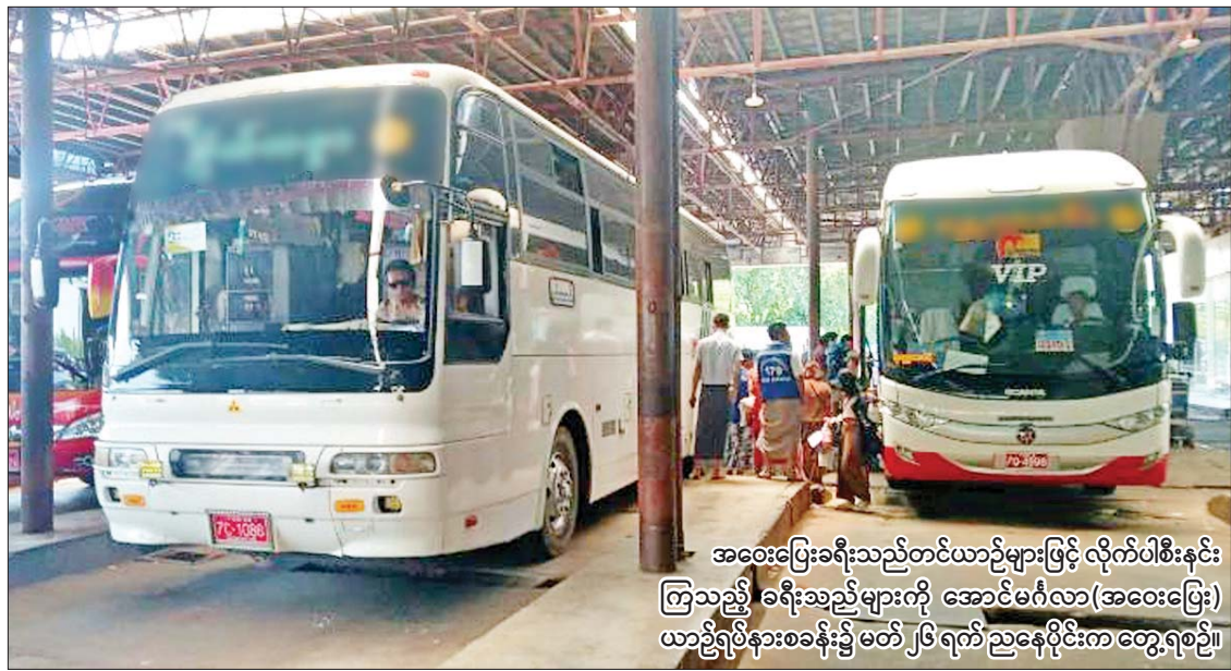
အဝေးပြေးခရီးသည်တင်ယာဉ်များဖြင့် လိုက်ပါစီးနင်းကြသည့် ခရီးသည်များကို အောင်မင်္ဂလာ(အဝေးပြေး) ယာဉ်ရပ်နားစခန်း၌ မတ် ၂၆ ရက် ညနေပိုင်းက တွေ့ရစဉ်။

(နိုင်ငံတော်စီမံအုပ်ချုပ်ရေးကောင်စီ ဥက္ကဋ္ဌ တပ်မတော်ကာကွယ်ရေးဦးစီးချုပ် ဗိုလ်ချုပ်မှူးကြီး မဟာသရေစည်သူ မင်းအောင်လှိုင်၏ စစ်တက္ကသိုလ် ဗိုလ်လောင်းသင်တန်း အမှတ်စဉ်(၆၄) သင်တန်းဆင်းဂုဏ်ပြုစစ်ရေးပြ အခမ်းအနားသို့ တက်ရောက်ပြောကြားသည့် မိန့်ခွန်းမှ ကောက်နုတ်ချက်) ၂-၁၂-၂၀၂၂