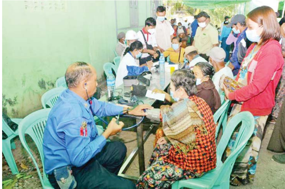
တပ်မတော်မြစ်တွင်းသွား ဆေးရုံရေယာဉ်(ရွှေပုဇွန်)နှင့် မြစ်ရေယာဉ်(စကု)တို့ဖြင့် တပ်မတော် နယ်လှည့်အထူးကုဆေးအဖွဲ့က ဖေဖော်ဝါရီ ၉ ရက်တွင် ဧရာဝတီတိုင်းဒေသကြီး မြစ်ကျွန်းပေါ်ကျေးရွာများမှ ဒေသခံပြည်သူများကို ကျန်းမာရေးစောင့်ရှောက်မှုလုပ်ငန်းများ ဆောင်ရွက်ပေးစဉ်။

လက်တွေ့ ပကတိဖြစ်စဉ်များနဲ့ ချိန်ထိုးပြီး တပ်မတော်ရဲ့ ဆောင်ရွက် ချက်တွေကိုကြည့်ရင် နိုင်ငံတည်ငြိမ် အေးချမ်းရေး၊ တိုင်းရင်းသားအားလုံး စည်းလုံးညီညွတ်ရေးနဲ့ လူမှုစီးပွား ဘဝဖွံ့ဖြိုးရေး ဒီသုံးချက်ကို သဟ ဇာတဖြစ်အောင် ချိန်ညှိဆောင်ရွက် နေတာ တွေ့ရပါတယ်။ ပြည်သူ့ အားကို အရယူပြီး စစ်ဘက်-အရပ် ဘက် ဆက်ဆံရေး ကောင်းသထက် ကောင်းအောင် ဆောင်ရွက်နေတယ် လို့ပဲ ယူဆမိပါတယ်။