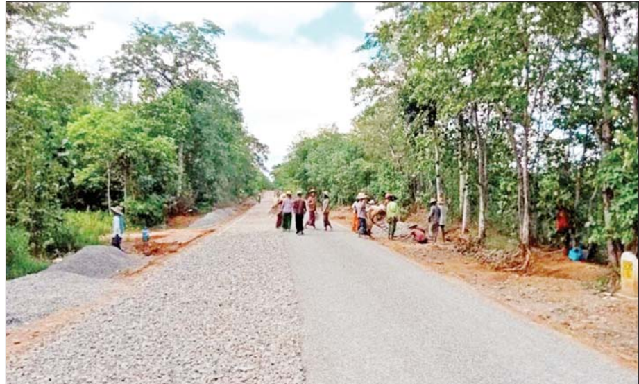
ပုသိမ်-မုံရွာလမ်း မကွေးတိုင်းဒေသကြီးအပိုင်း၌ ကျောက်ခင်းနေစဉ်။