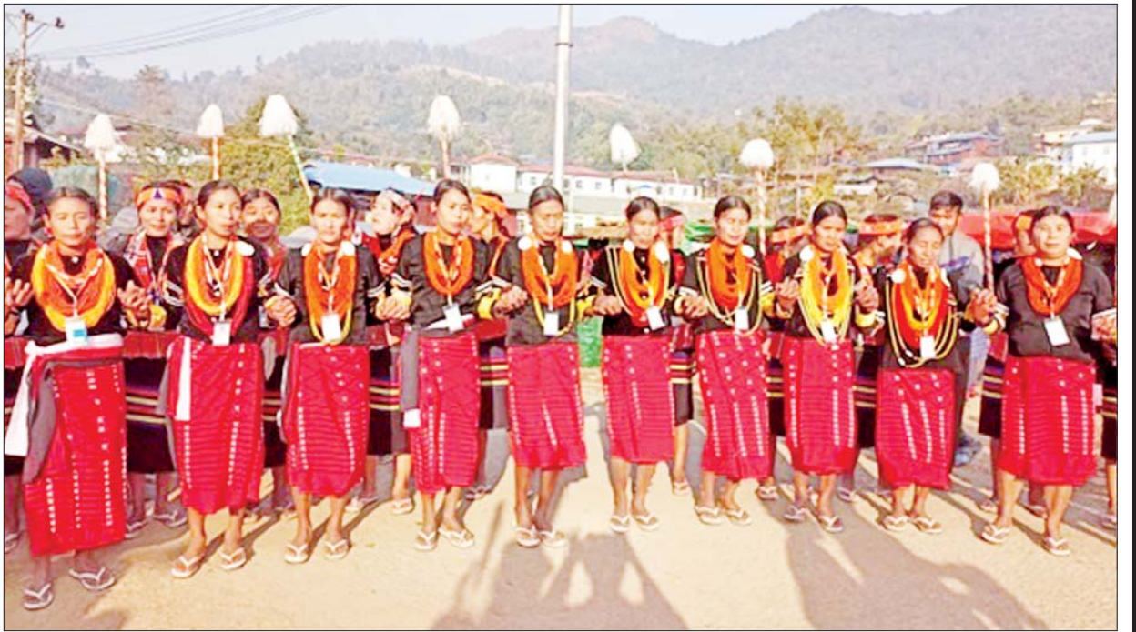
၂၀၂၃ ခုနှစ် နာဂရိုးရာ နှစ်သစ်ကူးပွဲတော်သို့ တက်ရောက်သည့် ဒေသခံတိုင်းရင်းသားများကို တွေ့ရစဉ်။

နိုင်ငံစီးပွားမြှင့်တင်ရေးရန်ပုံငွေမှ မတည်ထောက်ပံ့ငွေကျပ် ငါးဘီလီယံကို စိုက်ပျိုးရေးထွက်ကုန်များနှင့် မွေးမြူရေးထွက်ကုန်များ အပေါ် အခြေခံ၍ အသေးစား၊ အငယ်စားနှင့် အလတ်စားစီးပွားရေး လုပ်ငန်းများကို တစ်ပိုင်တစ်နိုင်မှ စီးပွားဖြစ်လုပ်ငန်းများသို့ အချိန်တို အတွင်းရောက်ရှိလာစေရန်နှင့် ဒေသထွက်ကုန်ကြမ်းပစ္စည်းများကို အသုံးပြုပြီး တန်ဖိုးမြှင့်ထုတ်ကုန်များအဖြစ် ထုတ်လုပ်နိုင်ရေး၊