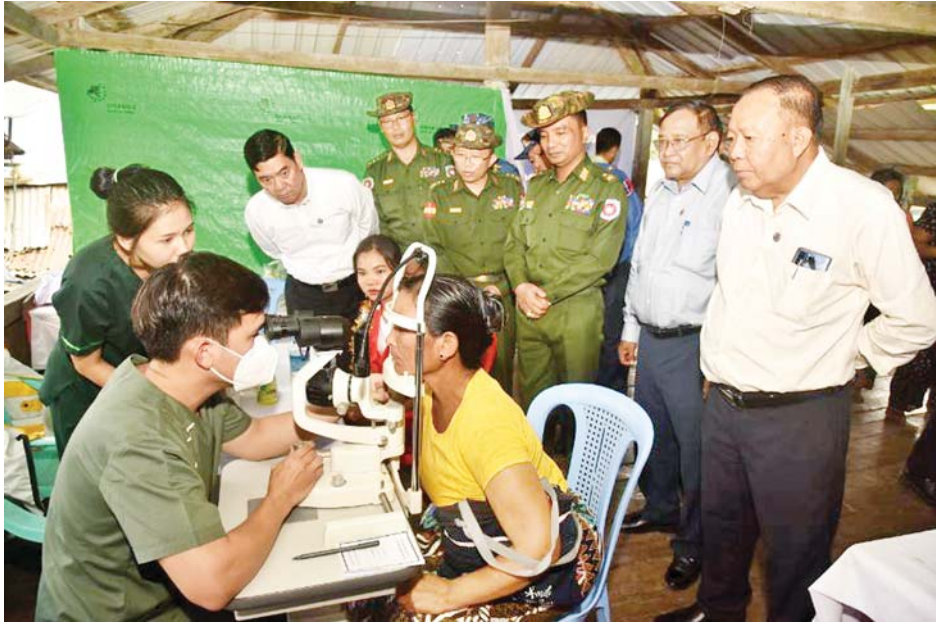
တပ်မတော်ပင်လယ်သွားဆေးရုံရေယာဉ်(သံလွင်)ဖြင့် လိုက်ပါလာသော တပ်မတော်နှင့် ကျန်းမာရေး ဝန်ကြီးဌာနတို့မှ နယ်လှည့်အထူးကုဆေးအဖွဲ့များက မတ် ၁၈ ရက်တွင် ရခိုင်ပြည်နယ် ပေါက်တောမြို့နယ် အတွင်းရှိ ဒေသခံပြည်သူများကို ကျန်းမာရေးစောင့်ရှောက်မှုလုပ်ငန်းများ ဆောင်ရွက်ပေးစဉ်။