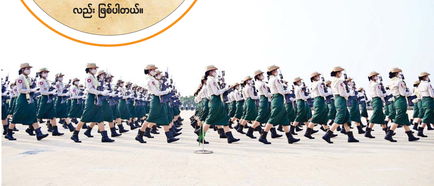
(၇၇)နှစ်မြောက် တပ်မတော်နေ့ စစ်ရေးပြအခမ်းအနားတွင် အမျိုးသမီးတပ်ခွဲ ချီတက်လာစဉ်။

စစ်ရေးစည်းရုံးရေး တည်ဆောက်ရေးနည်းလမ်းများဖြင့် စစ်မှန်စည်းကမ်းပြည့်ဝသည့် စနစ်တစ်ရပ်ဆီသို့ ယခုလက်ရှိ အနေအထားတစ်ရပ်မှာ တော့ နိုင်ငံဟာ စစ်မှန်ပြီးစည်းကမ်းပြည့်ဝ တဲ့ စနစ်တစ်ခုဆီကို အတတ်နိုင်ဆုံး အထူးထုတ် [ ၈ ] သို့ >>>