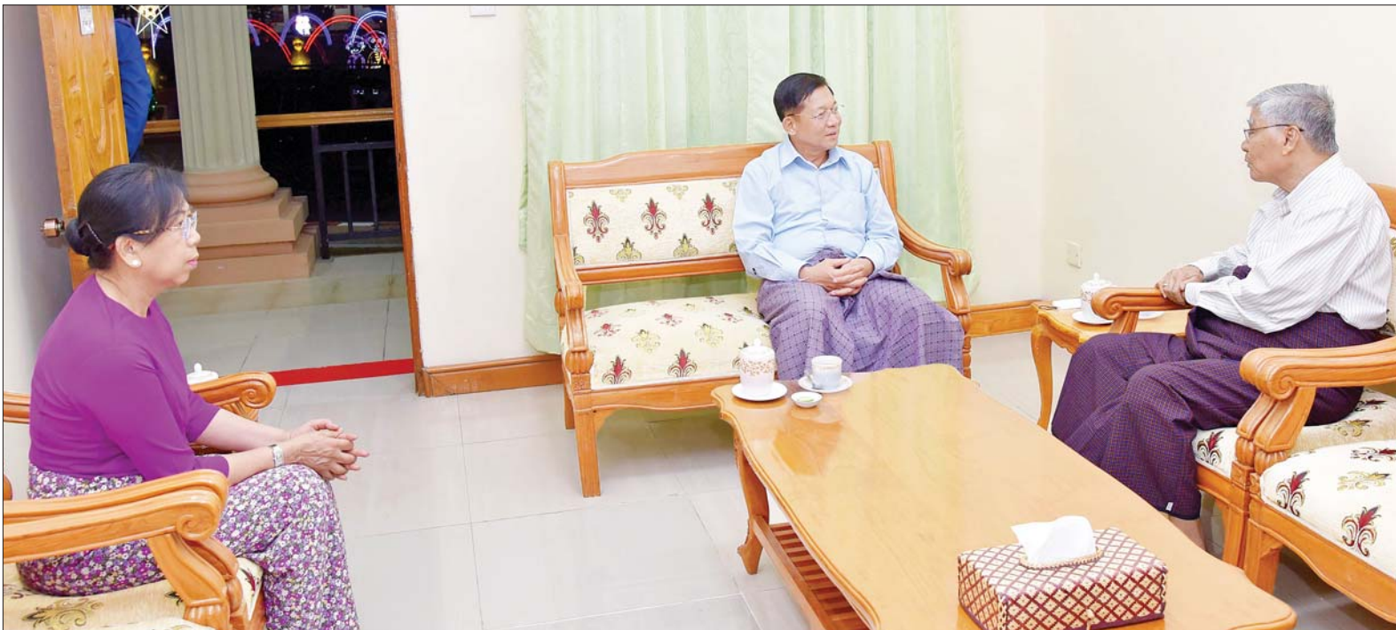
နိုင်ငံတော်စီမံအုပ်ချုပ်ရေးကောင်စီဥက္ကဋ္ဌ တပ်မတော်ကာကွယ်ရေးဦးစီးချုပ် ဗိုလ်ချုပ်မှူးကြီး မင်းအောင်လှိုင်နှင့် ဇနီးဒေါ်ကြူကြူလှ (၇၈)နှစ် မြောက် တပ်မတော်နေ့ အခမ်းအနားသို့ တက်ရောက်ကြမည့် အငြိမ်းစား တပ်မတော်အရာရှိကြီးတစ်ဦးအား တွေ့ဆုံဂါရဝပြုနှုတ်ဆက်စဉ်။