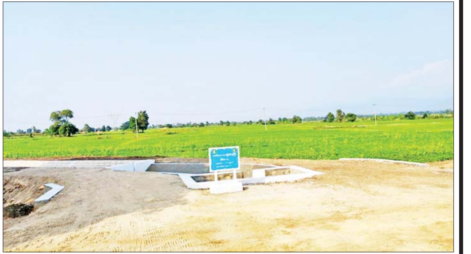
ရေဆင်းဆည် လက်ယာ(၁)မြောင်းမကြီး မိုင်နာ(၇)မြောင်းအဆုံးရှိ Tail Structure အား ပြန်လည်ပြုပြင်ပြီးစီးမှုကို တွေ့ရစဉ်။