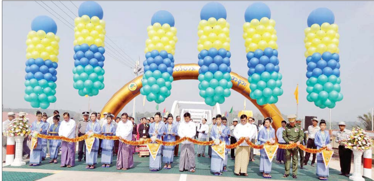
နိုင်ငံတော်စီမံအုပ်ချုပ်ရေးကောင်စီအဖွဲ့ဝင် ခွန်စုံလွင်နှင့် ဦးရန်ကျော်၊ တိုင်းဒေသကြီးဝန်ကြီးချုပ် ဦးမြတ်ကို၊ တိုင်းမှူး ဗိုလ်ချုပ်စောသန်းလှိုင်နှင့် ဒုတိယဝန်ကြီး ဦးဝင်းဖေတို့ ကမြောက်-တံတားကို ဖဲကြိုးဖြတ်ဖွင့်လှစ်ပေးကြစဉ်။

ကြောင်း၊ ထို့အပြင် တိုင်းပြည်၏ အဓိက ဝင်ငွေရရှိသော ဓာတ်ငွေများထွက်ရှိရာ တိုင်းဒေသကြီး တစ်ခုဖြစ်သည့်အတွက် ဖွံ့ဖြိုးရေးတွင် အရေးကြီးသည့် ဦးစားပေးကဏ္ဍ၌ ပါဝင်နေကြောင်း။ မိမိတို့နိုင်ငံ၏ အနာဂတ်