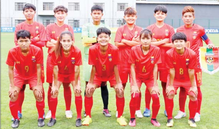
မြန်မာ့လက်ရွေးစင် အမျိုးသမီးအသင်း ကစားသမားများကို တွေ့ရစဉ်။

အာရှဇုန် ပထမအဆင့်ခြေစစ်ပွဲကို အုပ်စု ခုနစ်ခုခွဲ၍ ကျင်းပမည်ဖြစ်ပြီး အုပ်စုတစ်ခုကို အိမ်ရှင်တစ်နိုင်ငံရွေးချယ်၍ ကျင်းပမည်ဖြစ်သည်။ မြန်မာ့လက်ရွေးစင်အမျိုးသမီးအသင်းသည် အုပ်စု(ခ)တွင် အီရန်၊ ဘင်္ဂလားဒေ့ရှ်၊ မော်လဒိုက်တို့နှင့် ကျရောက်နေပြီး ဧပြီ ၅ ရက်မှ ၁၁ ရက်အထိ လက်ခံကျင်းပမည်ဖြစ်သည်။ ပွဲစဉ်ရေးဆွဲထားမှုအရ ဧပြီ ၅ ရက်တွင် အီရန်နှင့် ဘင်္ဂလားဒေ့ရှ်၊ မြန်မာနှင့် မော်လဒိုက်၊ ဧပြီ ၈ ရက်တွင် မော်လဒိုက်နှင့် အီရန်၊ စာမျက်နှာ ၁၇ ကော်လံ ၄ သို့ ○