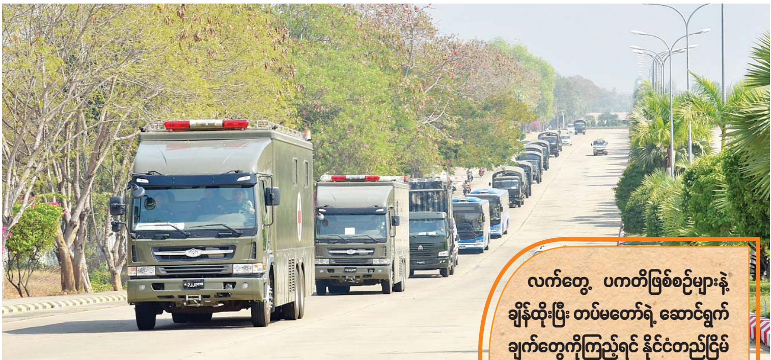
မန္တလေးတိုင်းဒေသကြီးနှင့် မကွေးတိုင်းဒေသကြီးအတွင်းရှိ ကျေးရွာများမှ ဒေသခံပြည်သူများကို ကျန်းမာရေးစောင့်ရှောက်မှုလုပ်ငန်းများ ဆောင်ရွက်ပေးရန် ပါရဂူများ၊ ဆေးမှူးများနှင့် သူနာပြုများ ပါဝင်သော တပ်မတော်နယ်လှည့်အထူးဆေးကုသရေးအဖွဲ့ ဖေဖော်ဝါရီ ၉ ရက်က နေပြည်တော်မှ စတင်ထွက်ခွာစဉ်။

ပါတီစုံဒီမိုကရေစီစနစ်ကို အခြေခံတဲ့ ဒီမိုကရေစီနဲ့ ဖက်ဒရယ်စနစ်ကို အခြေခံ တဲ့ ပြည်ထောင်စုတည်ဆောက်ရေးဟာ ပြည်သူ့အားလုံးရဲ့ လိုလားချက်ဖြစ်တဲ့ အတွက် NCA ကို အလေးထားလုပ်ဆောင်