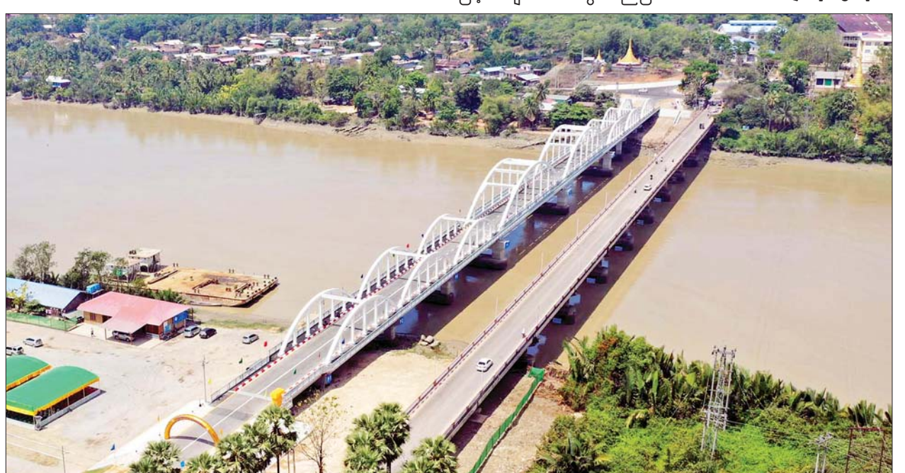
ထားဝယ်မြို့ ထားဝယ်-ကမြောက်-လောင်းလုံးလမ်းပေါ်ရှိ ကမြောက်-တံတားကို တွေ့ရစဉ်။

စေရန် ပြည်ထောင်စုအစိုးရအဖွဲ့နှင့် တိုင်းဒေသကြီး၊ ပြည်နယ် အစိုးရအဖွဲ့တို့ ပူးပေါင်းပါဝင် ဆောင်ရွက်ကြရမည် ဖြစ်ကြောင်း၊ ဒေသတစ်ခု ဖွံ့ဖြိုးတိုးတက်ရန် အဓိကကျသော လိုအပ်ချက်များထဲမှ လမ်းပန်းဆက်သွယ်ရေး လွယ်ကူလျင်မြန်ခြင်းသည် အလွန်အရေးကြီးသော အခန်းကဏ္ဍတွင် ပါဝင်လျက်ရှိကြောင်း၊ တနင်္သာရီတိုင်းဒေသကြီးအတွင်း ဒေသ၏ ကုန်စည်စီးဆင်းမှု လွယ်ကူချောမွေ့စေရန်၊ လူမှုစီးပွားဘဝ ဖွံ့ဖြိုးတိုးတက်လာစေရန်၊ ခရီးသွားလုပ်ငန်းများဖွံ့ဖြိုးတိုးတက်လာစေရန် ရည်ရွယ်၍ ရန်ကုန်တိုင်းဒေသကြီး၊ ပဲခူးတိုင်းဒေသကြီး၊ မွန်ပြည်နယ်တို့နှင့် ဆက်သွယ်ပေးလျက်ရှိသော ဘုရား