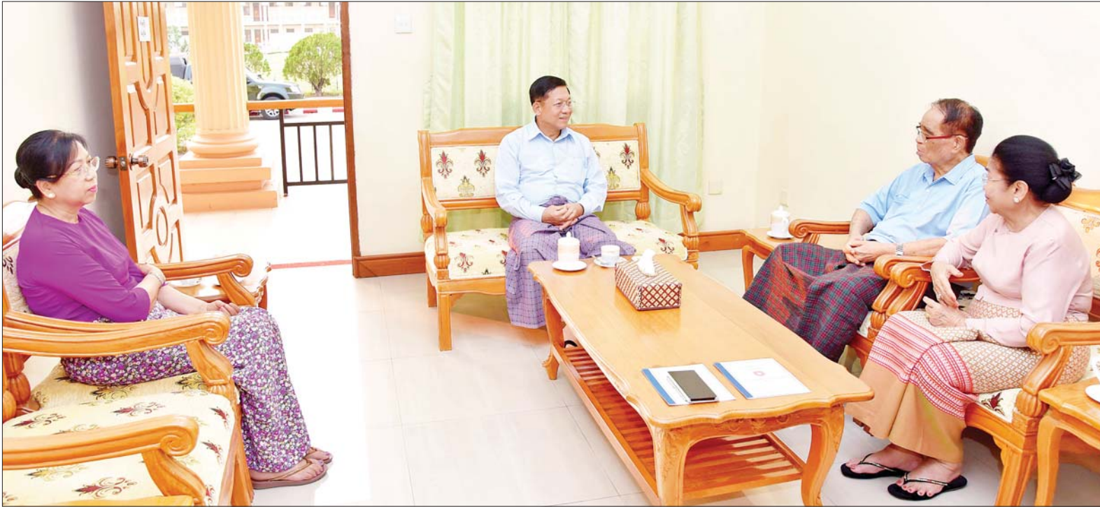
နိုင်ငံတော်စီမံအုပ်ချုပ်ရေးကောင်စီဥက္ကဋ္ဌ တပ်မတော်ကာကွယ်ရေးဦးစီးချုပ် ဗိုလ်ချုပ်မှူးကြီး မင်းအောင်လှိုင်နှင့် ဇနီးဒေါ်ကြူကြူလှ (၇၈)နှစ် မြောက် တပ်မတော်နေ့ အခမ်းအနားသို့ တက်ရောက်ကြမည့် အငြိမ်းစား တပ်မတော်အရာရှိကြီးနှင့် ဇနီးအား တွေ့ဆုံဂါရဝပြုနှုတ်ဆက်စဉ်။