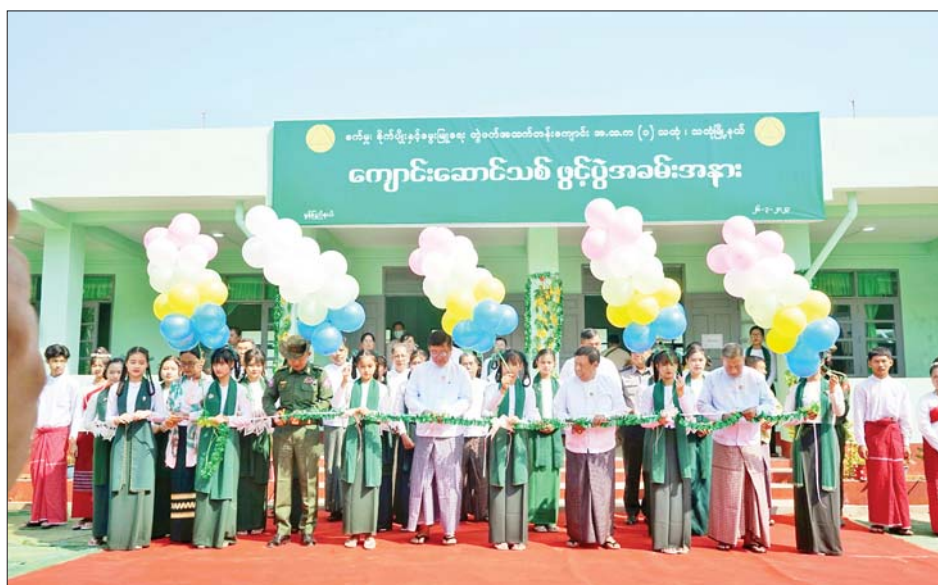
မွန်ပြည်နယ်ဝန်ကြီးချုပ် ဦးအောင်ကြည်သိန်းနှင့် တာဝန်ရှိသူများ အထက(၁)သထုံ ကျောင်းဝင်းအတွင်းရှိ စက်မှု စိုက်ပျိုးနှင့် မွေးမြူရေး တွဲဖက်အထက်တန်းကျောင်းဆောင်သစ်အား ဖဲကြိုးဖြတ်ဖွင့်လှစ်ပေးစဉ်။

မွန်ပြည်နယ် သထုံမြို့နယ်၌ (၇၈)နှစ်မြောက် တပ်မတော်နေ့ကို ကြိုဆိုဂုဏ်ပြုသောအားဖြင့် ခရိုင်ပြည်သူ့ဆေးရုံ၏ နှစ်ထပ် အထူးကြပ်မတ်ကုသဆောင်သစ်နှင့် အထက(၁)သထုံ ကျောင်းဝင်းအတွင်း ရှိ စက်မှု စိုက်ပျိုးနှင့် မွေးမြူရေး တွဲဖက်အထက်တန်းကျောင်းဆောင်သစ် ဖွင့်ပွဲကို ယနေ့ နံနက်ပိုင်းက ကျင်းပသည်။