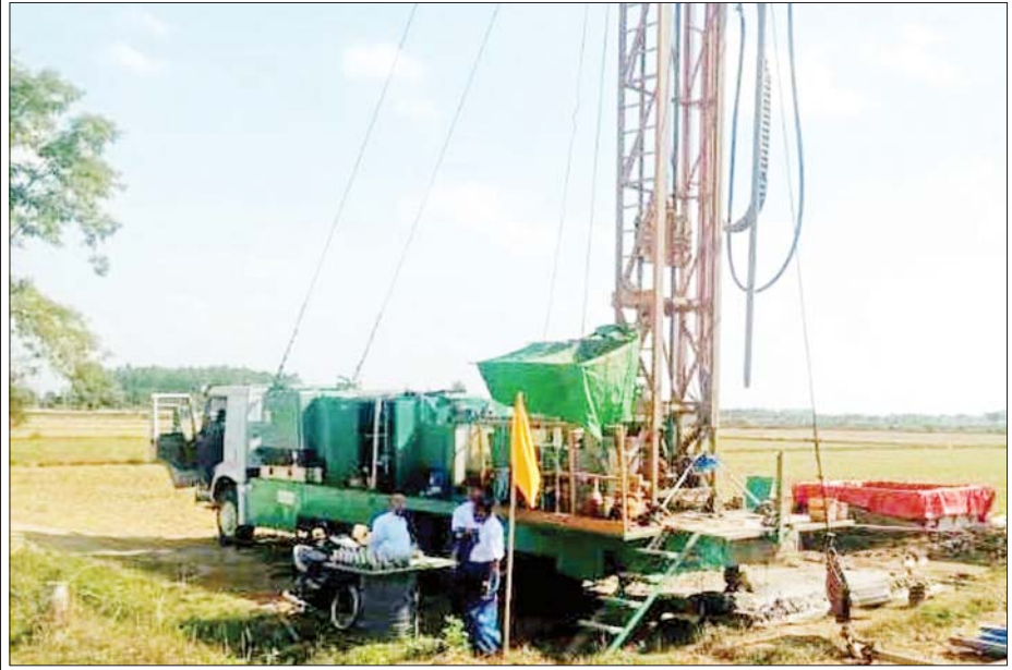
ရာဇဌာနီလမ်းဘေး ဝဲ/ ယာတွင် စိုက်ပျိုးရေးဖြည့်စွက်ပေးဝေနိုင်ရေး စက်ရေတွင်းများ တူးဖော်စဉ်။