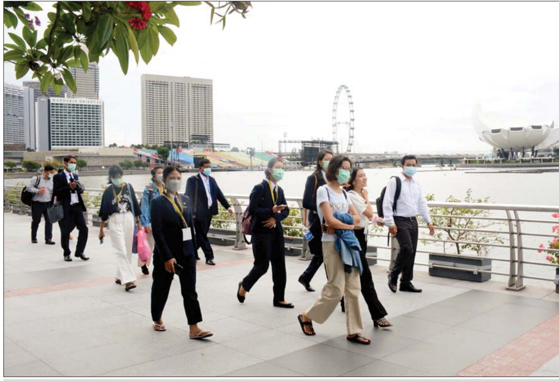
၂၀၂၂ ခုနှစ် တက္ကသိုလ်ဝင်စာမေးပွဲတွင် ဘာသာတွဲများအလိုက် မြန်မာတစ်နိုင်ငံလုံး အမှတ်အများဆုံး အဆင့် ၁ မှ အဆင့် ၁၀ အတွင်း ထူးချွန်စွာအောင်မြင်ခဲ့ကြသည့် ကျောင်းသား ကျောင်းသူများကို ချီးမြှင့်ဂုဏ်ပြုသည့်အနေဖြင့် နိုင်ငံတော်က ၂၀၂၂ ခုနှစ် ဇူလိုင် ၄ ရက်မှ ၈ ရက်အထိ ထိုင်းနိုင်ငံနှင့် စင်ကာပူနိုင်ငံတို့သို့ လေ့လာရေးခရီး ပို့ဆောင်ပေးခဲ့သည်။

မိမိမှာ ရှိသမျှအရင်းအမြစ်ကို စနစ် တကျ ကျွမ်းကျွမ်းကျင်ကျင်နဲ့ စုစည်း ပေါင်းစပ်နိုင်စွမ်းသော အားသာချက်ကို အသုံးချပြီး ပြည်တွင်း၊ ပြည်ပ အန္တရာယ် များကနေ နိုင်ငံနဲ့ ပြည်သူ့အကျိုးစီးပွားကို အစဉ်ထာဝရ ကာကွယ်စောင့်ရှောက် သွားမယ့် တစ်ခုတည်းသော မျိုးချစ် တပ်မတော်အဖြစ် ဆက်လက်ရပ်တည် နေမည်ဖြစ်ကြောင်း ရေးသားတင်ပြ လိုက်ရပါသည်။ ။