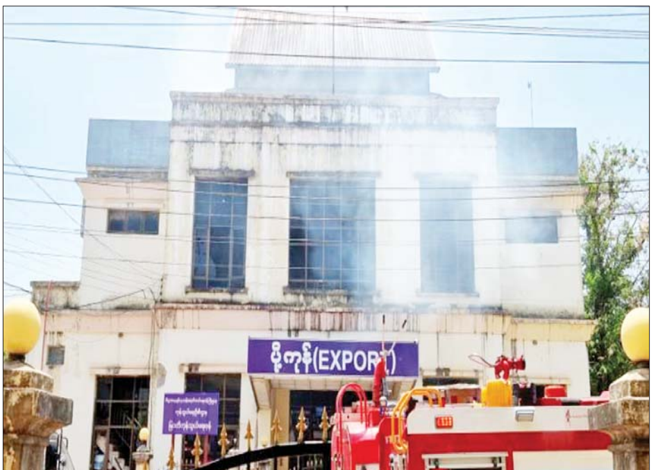
မြဝတီကုန်သွယ်ရေးဇုန် တိုက်ခိုက်ခံရမှု မှတ်တမ်းဓာတ်ပုံများ။

ထိခိုက်ကျဆုံး ဖြစ်စဉ်မှာ မြဝတီကုန်သွယ်ရေး ဇုန်အား မတ် ၂၅ ရက် နံနက် ၆ နာရီခွဲခန့်တွင် KKO(ခွဲထွက်) အဖွဲ့နှင့် PDF အမည်ခံအကြမ်းဖက် သမားများသည် ကုန်သွယ်ရေးဇုန် ၏ အနောက်ဘက် မီတာ ၂၀၀ ခန့် အကွာမှနေ၍ လက်နက်ကြီး၊