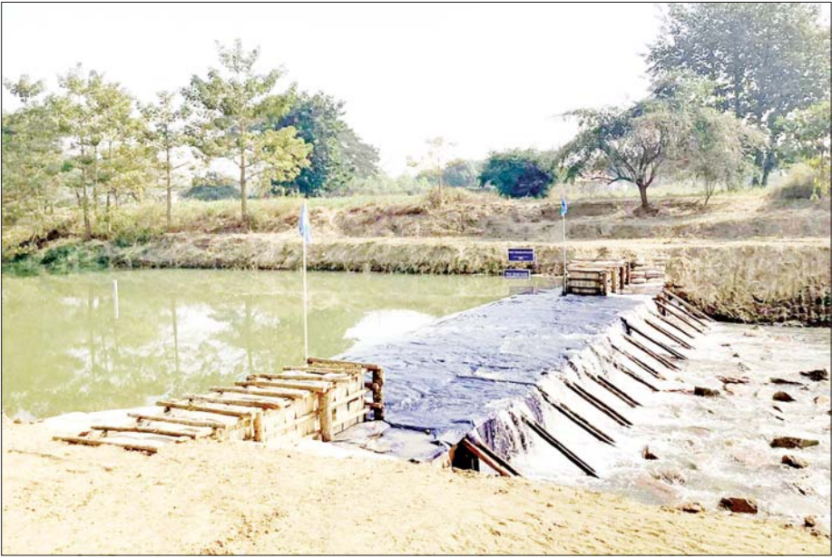
ပုဗ္ဗသီရိမြို့နယ် အေးမြင့်သာယာကျေးရွာအနီး ဆင်သေချောင်း ယာယီချောင်းပိတ်ဆည်ကိုတွေ့ရစဉ်။