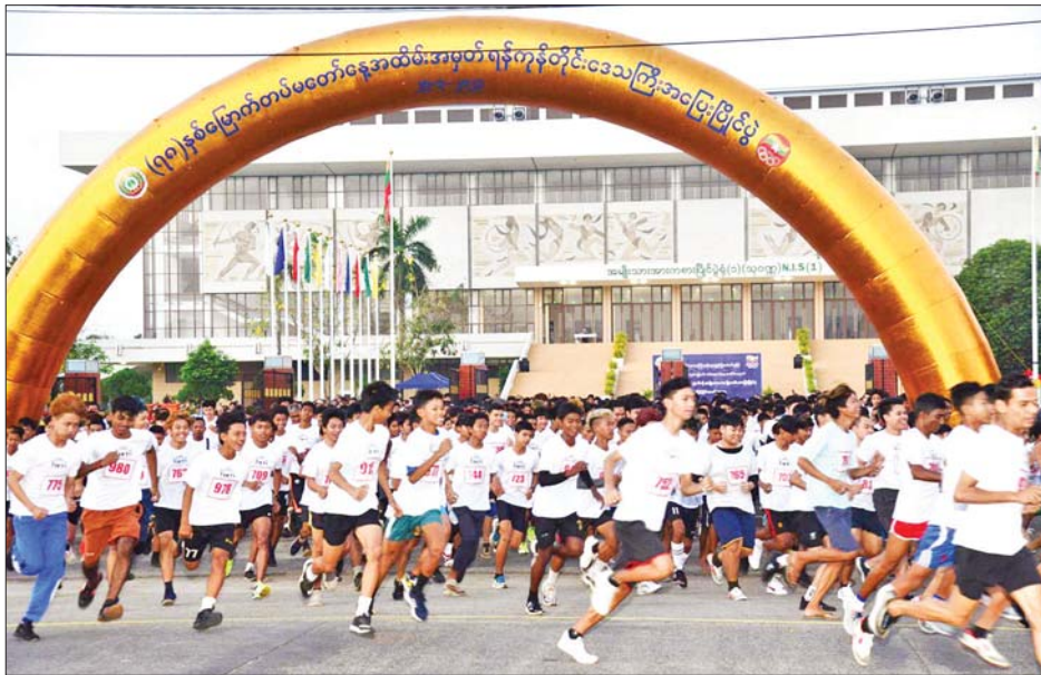
တာထွက်ကြပြီး ဝေယန္တရလမ်းအတိုင်း သစ္စာလမ်း၊ ပါရမီလမ်းတို့ကိုဖြတ်၍ မြောက်ဥက္ကလာပ ခုံးကျော် တံတားဘေးမှ သုဓမ္မာလမ်းအတိုင်း မြောက်ဥက္ကလာပ

မိုက်ခရိုမာရသွန်ပြိုင်ပွဲဝင် အပြေးသမားများသည် အမျိုးသားအားကစားပြိုင်ပွဲရုံ(၁)ရှေ့မှ