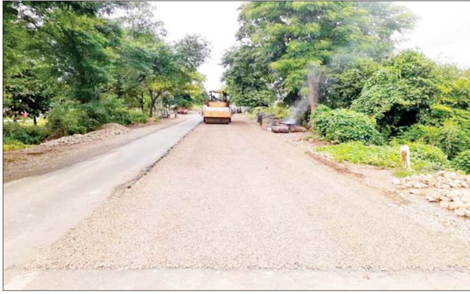
ပုသိမ်-မုံရွာလမ်း မကွေးတိုင်းဒေသကြီးအပိုင်း၌ လမ်းချဲ့နေစဉ်။

၂၀၁၀ ပြည့်နှစ် ဇွန်လမှစတင်၍ ပုသိမ်-မုံရွာလမ်းမကြီး အဆင့်မြှင့်တင်တည်ဆောက်ခြင်းနှင့် တိုးတက်ပြုပြင်ခြင်းလုပ်ငန်းများကို အပိုင်း (၁) မိုင်တိုင် ၀/၀ မှ ၁၇၉/၆ အထိ၊ အပိုင်း (၂) မိုင်တိုင် ၁၇၉/၆ မှ ၃၆၃/၀ အထိနှင့် အပိုင်း (၃) မိုင်တိုင်