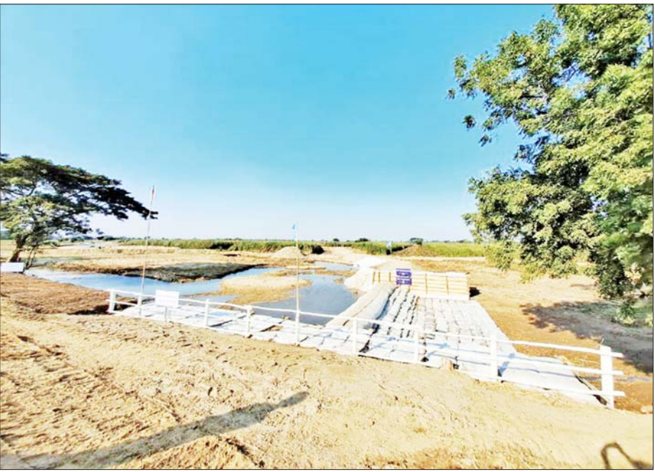
တပ်ကုန်းမြို့နယ် ရှားတောကျေးရွာအနီး ဆင်သေချောင်း ယာယီချောင်းပိတ်ဆည်ကိုတွေ့ရစဉ်။

သို့မို့ကြောင့် မိုးအကုန်တွင် အလဟဿ စီးဆင်းသွားသည့် ဆင်သေချောင်းမှ မိုးရေများကို သဲအိတ်ပေါင်း ၇၀၀၀၊ မျော၊ ဝါးကပ်၊ မိုးကာစသည်တို့ဖြင့် အလျား ၁၀၅ ပေ၊ အကျယ် ပေ ၂၀၊ အနက် ငါးပေရှိသည့် ယာယီချောင်းပိတ်ဆည်များကို အေးမြင့်သာယာကျေးရွာအနီး၌လည်းကောင်း၊ ပုံစံတူဆည်တစ်ခုကို အေးမြင့်သာယာကျေးရွာ၏ အထက်ပေ ၁၉၀၀ ခန့်အကွာ ဇေယျာသီရိမြို့နယ် သာယာ