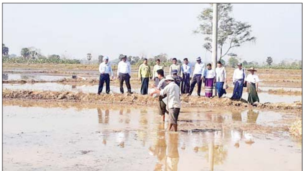
(နှွေစပါး)စုပေါင်းကြိုပက်စိုက်ပျိုးပွဲကို မြန်မာအောင်ခရိုင် စီမံအုပ်ချုပ်ရေးအဖွဲ့၊ ဥက္ကဋ္ဌ ဦးမျိုးလှိုင်၊ မြို့နယ် စီမံအုပ်ချုပ်ရေးအဖွဲ့

ဧရာဝတီ တိုင်းဒေသကြီး မြန်မာအောင်မြို့နယ် ကွင်းကြီးဒေသ ကျေးရွာအုပ်စု ပန်းညိုကွင်း ကျေးရွာ ကွင်းမှတ် (၂၀၉)၊ တောင်သူ ဦးသန်းထွန်းပါ ၁၆ ဦး တို့၏ လယ်မြေဧက ၃၀ တွင် ယနေ့ နံနက်ပိုင်းက တစ်နှစ် သုံးသီး တတိယ သီးနှံနှွေစပါး ရက် ၉၀ စပါးမျိုး စုပေါင်းကြိုပက် စိုက်ပျိုးပွဲ အခမ်းအနားကို ကျင်းပ သည်။ တစ်နှစ်သုံးသီး တတိယသီးနှံ