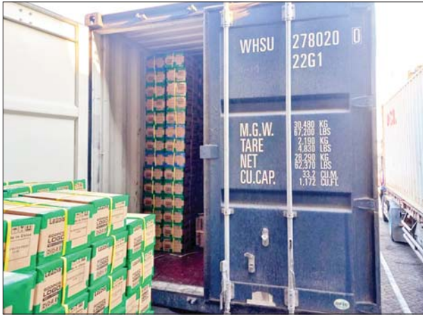
အေးရှားဝေါလ်ကုန်သွယ်မှု စစ်ဆေးရေးစခန်း၌ သိမ်းဆည်းရမိမှု။

မျိုး(ခန့်မှန်းတန်ဖိုးငွေ ၇၉၄၅၈၂၅ ကျပ်)နှင့် သွင်းကုန်ကြေညာလွှာတွင် ကြေညာထားခြင်းမရှိသော Solar Air-Conditioner တစ်လုံး၊ Computer Compact Disc CD ချပ် ၁၈၀၀၀၀ အပါအဝင် ကုန်ပစ္စည်းငါးမျိုး (ခန့်မှန်းတန်ဖိုးငွေကျပ် ၁၃၅၄၀၀၀) ကိုလည်းကောင်း၊ မြန်မာ စက်မှုဆိပ်ကမ်းကုန်သွယ်မှုစစ်ဆေးရေးစခန်း၌ ကုန်သွယ်မှုတစ်လုံးအတွင်းမှ သွင်းကုန်ကြေညာလွှာတွင် ကြေညာထားသည့်နှင့် ကိုက်ညီမှုမရှိသော EP664 INKJET -Ink ၂၅၀၀ ဘူး၊ Air Filter ၇၈၃ ခု အပါအဝင် ကုန်ပစ္စည်း ၁၁ မျိုး(ခန့်မှန်းတန်ဖိုးငွေ ၁၇၄၀၄၉၆၀၈ ကျပ်)ကိုလည်းကောင်း စုစုပေါင်း ခန့်မှန်းတန်ဖိုးငွေ ၂၇၂၄၇၈၃၃ ကျပ်ကို သိမ်းဆည်းရမိခဲ့ပြီး အကောက်ခွန်လုပ်ထုံးလုပ်နည်းနှင့်အညီ အရေးယူ ဆောင်ရွက်လျက်ရှိသည်။ သို့ဖြစ်၍ မတ် ၂၁ ရက်၊ ၂၂ ရက်၊ ၂၃ ရက်နှင့် ၂၄ ရက်တို့တွင် ဖမ်းဆီးရမိမှု စုစုပေါင်းမှာ အမှုတွဲ ၁၁ မှု (ခန့်မှန်းတန်ဖိုးငွေ ၂၉၈၁၉၁၈၄၈ ကျပ်) ဖြစ်ကြောင်း တရားမဝင်ကုန်သွယ်မှုတိုက်ဖျက်ရေး ဦးဆောင်ကော်မတီက သိရသည်။ သတင်းစဉ်