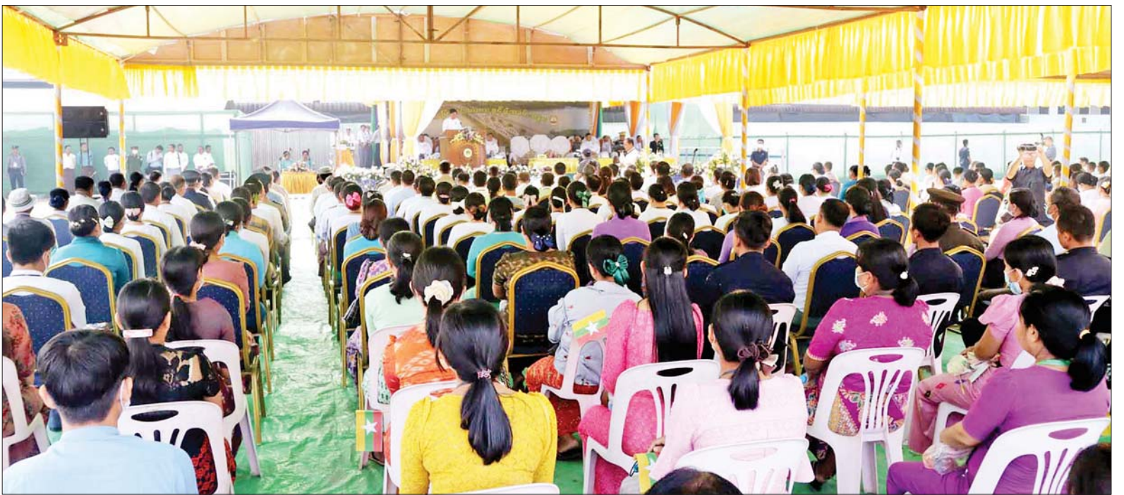
ထားဝယ်မြို့ ထားဝယ်-ကမြောက်-လောင်းလုံးလမ်းပေါ်ရှိ ကမြောက်-တံတားသစ်ဖွင့်ပွဲအခမ်းအနား ကျင်းပစဉ်။

နေပြည်တော် မတ် ၂၆ ပြည်သူများ သွားလာရေး လွယ်ကူ အဆင်ပြေစေရန်နှင့် လမ်းပန်းဆက်သွယ်ရေးကဏ္ဍ ဖွံ့ဖြိုး တိုးတက်စေရန်အတွက် ထားဝယ်မြို့ ထားဝယ်-ကမြောက်-လောင်းလုံး လမ်းပေါ်ရှိ ကမြောက်-တံတားသစ် တည်ဆောက်ရေး စီမံကိန်းကို ဆောက်လုပ်ရေး ဝန်ကြီးဌာန တံတားဦးစီးဌာန တည်ဆောက်ရေးအဖွဲ့(၄)က ၂၀၂၁ ခုနှစ် ဖေဖော်ဝါရီ ၁၆ ရက်မှ စတင်၍ တာဝန်ယူ တည်ဆောက်လျက် ရှိရာ ၂၀၂၃ ခုနှစ် မတ် ၁၅ ရက် တွင် တည်ဆောက်ပြီးစီးခဲ့သဖြင့် ယနေ့ နံနက်ပိုင်းတွင် ကမြောက်-တံတားသစ်ဖွင့်ပွဲ အခမ်းအနား ကျင်းပသည်။