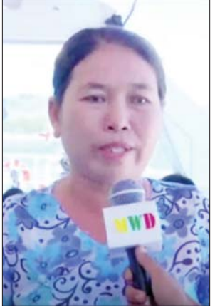
ဒေသခံပြည်သူများ