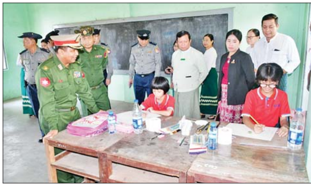
အားပေးကြသည်။ ပြိုင်ပွဲများတွင် အခြေခံပညာအထက်တန်းအဆင့် ကွန်ပျူတာပန်းချီရစ်ဦးအပါအဝင် ပန်းချီနှင့် ပိုစတာပြိုင်ပွဲတွင် အခြေခံပညာအလယ်တန်းအဆင့် ၁၆ ဦးနှင့် မူလတန်းအဆင့် ၂၇ ဦး စုစုပေါင်း ၅၁ ဦး ပါဝင်ယှဉ်ပြိုင်ကြကြောင်း သိရသည်။

ပြည် မတ် ၂၃ ပဲခူးတိုင်းဒေသကြီး ပြည်မြို့ အမှတ်(၄)အခြေခံပညာအထက်တန်းကျောင်း၌ ယမန်နေ့နံနက် ၉ နာရီက (၂၆)ကြိမ်မြောက် အပြည်ပြည်ဆိုင်ရာ မူးယစ်ဆေးဝါးအလွဲသုံးမှုနှင့် တရားမဝင်ရောင်းဝယ်မှုတိုက်ဖျက်ရေးနေ့အထိမ်းအမှတ် ခရိုင်အဆင့် (ပန်းချီ၊ ကာတွန်း၊ ပိုစတာနှင့် ကွန်ပျူတာပန်းချီပြိုင်ပွဲ)ကျင်းပရာ ပြည်ခရိုင်အတွင်း မြို့နယ်များရှိ အခြေခံပညာကျောင်းများနှင့် ပုဂ္ဂလိကကိုယ်ပိုင်ကျောင်းများမှ ကျောင်းသား ကျောင်းသူ ၅၁ ဦး ဝင်ရောက်ယှဉ်ပြိုင်ကြသည်။ ပြိုင်ပွဲဝင် ကျောင်းသား ကျောင်းသူများ၏ ယှဉ်ပြိုင်မှုအား ဒေသကွပ်ကဲမှုစစ်ဌာနချုပ်(ပြည်)မှ ဒေသကွပ်ကဲရေးမှူး ဗိုလ်မှူးချုပ် အောင်နိုင်ဦး၊ ပြည်ခရိုင်စီမံအုပ်ချုပ်ရေးအဖွဲ့ဥက္ကဋ္ဌ ဦးသိန်းအောင်နှင့် အဖွဲ့ဝင်များ၊ ခရိုင်ရဲတပ်ဖွဲ့မှူး၊ ဒုတိယရဲမှူးကြီး ဇော်နိုင်ထွန်းဦးဆောင်သော မြန်မာနိုင်ငံရဲတပ်ဖွဲ့တာဝန်ရှိသူများ၊ ခရိုင်ပညာရေးမှူး၊ ခရိုင်ဥပဒေအရာရှိ၊ ခရိုင်ပြန်/ဆက်ဦးစီးမှူး၊ မြို့နယ်စီမံအုပ်ချုပ်ရေးအဖွဲ့ဥက္ကဋ္ဌနှင့် မြို့နယ်ဌာနဆိုင်ရာ တာဝန်ရှိသူများ လာရောက်ကြည့်ရှု