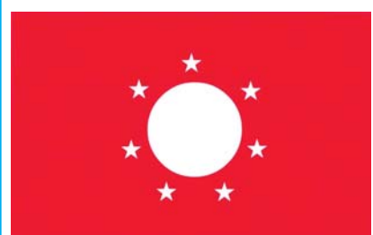
ကိုးကန့်ဒီမိုကရေစီနှင့် ညီညွတ်ရေးပါတီ (KKDUP)၏ တံဆိပ်ပုံစံ

ကိုးကန့်ဒီမိုကရေစီနှင့် ညီညွတ်ရေးပါတီ (KKDUP)၏ အလံပုံစံ