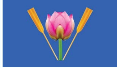
အင်းအမျိုးသားအဖွဲ့ချုပ်ပါတီ (Inn National League Party)၏ တံဆိပ်ပုံစံ

အင်းအမျိုးသားအဖွဲ့ချုပ်ပါတီ (Inn National League Party)၏ အလံပုံစံ