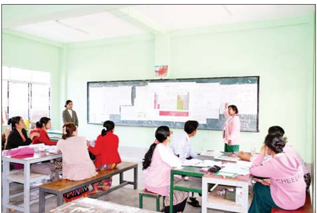
အဆိုပါ ဘာသာရပ်စွမ်းရည်မြှင့် ဆွေးနွေးပွဲကို မူဆယ်မြို့တွင် အလယ်တန်းဆင့် ဆရာ ဆရာမ ၁၆၀ နှင့် အထက်တန်းဆင့်

နေရာသီ အစိုးရကျောင်းပိတ် ရက်တွင် သင်ကြားမှုစနစ်များနှင့် ဘာသာရပ်အလိုက် သင်ကြားမှု စွမ်းရည်များ တိုးတက်မြှင့်တင်ရေး အတွက် ရှမ်းပြည်နယ် (မြောက်ပိုင်း) မူဆယ်ခရိုင် မူဆယ်မြို့ရှိ အမှတ်(၂) အခြေခံ ပညာ အထက်တန်းကျောင်း၌ ခရိုင်အဆင့် အထက်တန်းနှင့် အလယ်တန်းဆင့် ဆရာ ဆရာမ များကို ဘာသာရပ်စွမ်းရည်မြှင့် ဆွေးနွေးပွဲ ပြုလုပ်သည်။