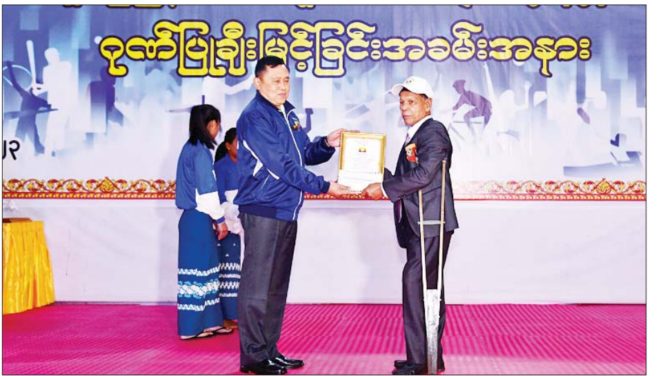
ပြည်နယ်ဥပဒေချုပ်၊ ပြည်နယ်အစိုးရအဖွဲ့၊ ပြည်နယ်ဝန်ကြီးချုပ်က အားကစားသမား အတွင်းရေးမှူးတို့က ချီးမြှင့်ပေးခဲ့ကြသည်။ ထို့နောက် ရှမ်းပြည်နယ်ကိုယ်စားပြု အားကစား သမားများကိုယ်စား အားကစားသမားဟောင်းတစ်ဦးက ဝမ်းသာပီတိစကား ပြန်လည်ပြောကြား၍

အကြံများကို နောင်လာနောက်သား အားကစားသမား လူတော်လူကောင်းများသို့ လက်ဆင့်ကမ်းအမွေပေး ဝေငှသော်လည်းကောင်း၊ မိမိတို့နီးစပ်ရာ မိသားစု၊ အသိုင်းအဝိုင်းနှင့် ပတ်ဝန်းကျင်ရှိ လူငယ်လူရွယ်များကို ကိုယ်တိုင်တွေ့ကြုံခံစားလာရသည့် အားကစားကို လေ့လာလိုက်စားခြင်း၏ အကျိုးကျေးဇူးများကို မျှဝေပေး၍ အားကစားကို ပါဝင်ဆောင်ရွက်နိုင်ကြစေရန် ဝိုင်းဝန်းတိုက်တွန်း အားပေးစေလိုကြောင်း ပြောကြား သည်။ ဆက်လက်၍ ရှမ်းပြည်နယ်အစိုးရအဖွဲ့မှ အားကစားသမားဟောင်း ၁၉၅ ဦးအတွက် တစ်ဦးလျှင်ငွေကျပ် ၁၀၀၀၀၀ နှုန်းနှင့် ဂုဏ်ပြု မှတ်တမ်းလွှာများကို အားကစားနည်းအလိုက် အသက်(၆၀)နှစ်နှင့်အထက် ရှမ်းပြည်နယ် ကိုယ်စားပြု အားကစားသမားဟောင်းများဖြစ်သည့် ဘောလုံး၊ လက်ဝှေ့ ပြေးခုန်ပစ်၊ မြန်မာ့သိုင်း၊ ဘတ်စကက်ဘော၊ သေနတ်ပစ်၊ အလေးမ၊ တင်းနစ်၊ စားပွဲတင်တင်းနစ်၊ စက်ဘီး၊ ရိုးရာခြင်း၊ စစ်တုရင်၊ ဘော်လီဘော၊ ကြက်တောင်အားကစားသမားများအား ပြည်နယ် ဝန်ကြီးချုပ် ဦးအောင်ဇော်အေး၊ ပြည်နယ်ဝန်ကြီးများ၊