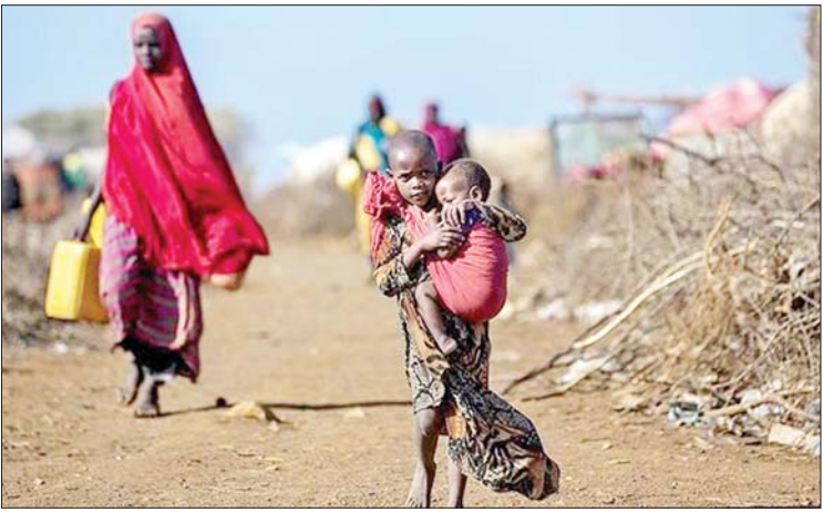
ဒဏ်ကို ရင်ဆိုင်ကြုံတွေ့ခဲ့ရကြောင်း ၎င်းက မှတ်ချက်ပြုပြောကြားသည်။ လက်ရှိတွင် ပြည်သူ ၅၄၆ သန်းခန့်သည် ဆင်းရဲမွဲတေစွာ နေထိုင်နေရဆဲဖြစ်ပြီး ယင်းပမာဏသည် ၁၉၉၀ ပြည့်နှစ်မှစပြီး ၇၄ ရာခိုင်နှုန်း မြင့်တက်လာခြင်းဖြစ်ကြောင်း ၎င်းက ဆိုသည်။ ကိုးကား - ဆင်ဟွာ ဘာသာပြန် - အောင်ကျော်ကျော်

စစ်တမ်းတစ်ရပ်ကို ကိုးကားပြီး စီးပွားရေး ပညာရှင် ဟာနန်မော်ဆေးက ဆိုသည်။ အာဖရိကရှိ အိမ်ထောင်စုများသည် ၎င်းတို့ ဝင်ငွေ၏ ၄၀ ရာခိုင်နှုန်းကို စားရေရိက္ခာအတွက် သုံးစွဲရပြီး ကမ္ဘာ့အကျပ်အတည်းများ၏ သက်ရောက်မှုသည် အာဖရိကရှိ အဆင်းရဲဆုံး အိမ်ထောင်စုများအပေါ် ရိုက်ခတ်လျက်ရှိကြောင်း ၎င်းက ပြောကြားသည်။ ထို့ပြင် ၂၀၂၂ ခုနှစ်တွင် အာဖရိက နိုင်ငံသား သန်း ၃၀၀ သည် စားရေရိက္ခာ မလုံလောက်မှုကို ခံစားရပြီး အာဖရိက နိုင်ငံသား ခြောက်သန်းသည် ငတ်မွတ်မှု