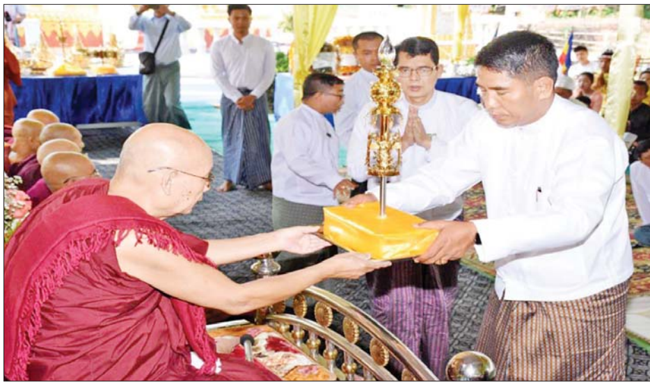
ငါးပါးသီလံယူဆောက်တည်ကြပြီး သံဃာတော်များ တက်ရောက်လာကြသူများက စိန်ဖူးတော်၊ ငှက်မြတ်နားတော်၊ ရွှေထီးတော်နှင့် လှူဖွယ်ဝတ္ထုများကို သံဃာတော်များထံ ဆက်ကပ်လှူဒါန်းကြပြီး နာယူကြည့်ညှိကြသည်။ ထို့နောက် တိုင်းမှူးနှင့် ကို သံဃာတော်များထံ ဆက်ကပ်လှူဒါန်းကြပြီး