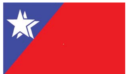
အမျိုးသားဒီမိုကရေစီအင်အားစုပါတီ [National Democratic Force Party (NDF)]၏ တံဆိပ်ပုံစံ

အမျိုးသားဒီမိုကရေစီအင်အားစုပါတီ [National Democratic Force Party (NDF)]၏ အလံပုံစံ