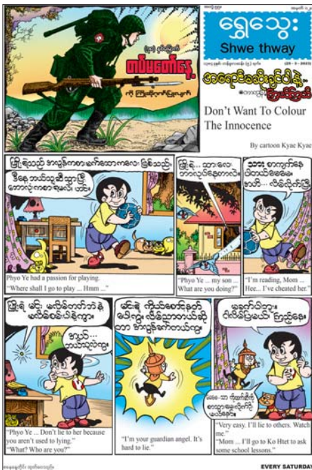
မပျောက်စေရန်ထားတတ်သော ဖြတ်တိုးဉာဏ် ကောင်းသည့် ကိုလာအကြောင်းကို ရေးဖွဲ့ထားသည့်

မတ် ၂၅ ရက် (စနေနေ့) တွင် ထွက်ရှိမည့် ရွှေသွေးဂျာနယ်အတွဲ (၅၅)၊ အမှတ် (၁၂) တွင် မိမိတို့၏ ပင်ကိုရိုးသားမှုကို မကောင်းမွန်သော အရောင်များဖြင့် မဆိုးသင့်ကြောင်း ပညာပေးတင်ဆက်ထားသည့် “အရောင်မဆိုးချင်ပါနဲ့” မျက်နှာဖုံးဇာတ်လမ်း၊ မြန်မာ လူမျိုးတို့၏ ရိုးရာဓလေ့သောက်စေ့အိုးစင်တင်ကြပုံ အကြောင်းကို ဗဟုသုတရဖွယ် တင်ဆက်ထားသည့် “မြန်မာ့ဓလေ့သောက်စေ့အိုးစင်” သုတဆောင်းပါး၊ ကလေးတို့ပေးပို့သော ကာတွန်းလက်ရာများကို ထည့်သွင်းဖော်ပြထားသည့် “ရွှေသွေးတို့လက်ရာ” ကဏ္ဍ၊ ကလေးများအား မိမိတို့၏ နေရပ်ဒေသကို တန်ဖိုးထားချစ်မြတ်နိုးတတ်စေရန် တင်ဆက်ထား သည့် “ဒေသ” နှစ်မျက်နှာကာတွန်း၊ တောရွာဓလေ့ ကလေးများ၏ လွတ်လပ်စွာ စည်းစည်းလုံးလုံးညီညီ ညွတ်ညွတ် ဆော့ကစားကြပုံကို တင်ဆက်ထားသည့် “ပုန်းစလတ်” ဝတ္ထု၊ အလှူအိမ်သို့ သွားရာ၌ မိမိဖိနပ်