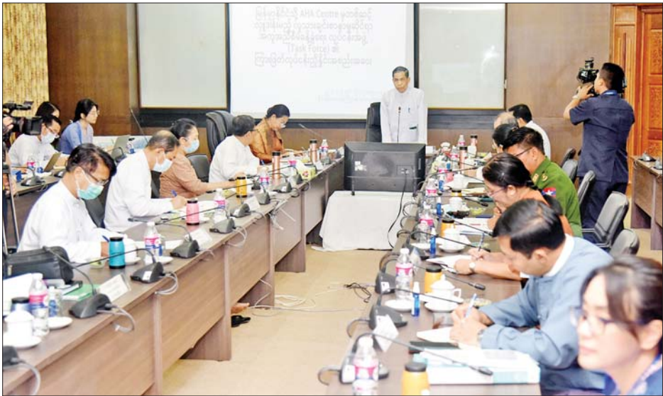
ထို့နောက် အစည်းအဝေး၌ အာဆီယံတူညီဆန္ဒအကူအညီလိုအပ်သူများ၏ လိုအပ်ချက်များကို စတုတ္ထအချက်ဖြစ်သည့် လူသားချင်းစာနာမှုအကူအညီပေးအပ်ရေးနှင့် စပ်လျဉ်း၍ မြန်မာနိုင်ငံ၏ ကတိကဝတ်အပေါ် ထပ်လောင်းအတည်ပြုခဲ့ကြပြီး အကူအညီပေးနိုင်ရေး ရှိရင်းစွဲ ယန္တရားများအကြား ပေါင်းစပ်ညှိနှိုင်းအားကိုးလည်း တိုးမြှင့်သွားရန် ဆွေးနွေးခဲ့ကြကြောင်း သိရသည်။ သတင်းစဉ်

ဝန်ကြီးဌာနများမှ လုပ်ငန်းအဖွဲ့ အဖွဲ့ဝင်များ တက်ရောက်ကြသည်။ အစည်းအဝေး၌ မြန်မာနိုင်ငံတွင် အမှန်တကယ် အကူအညီလိုအပ်နေသည့် ပြည်သူများအတွက် ပိုမိုကျယ်ပြန့်သော လူသားချင်းစာနာမှုအကူအညီများ ပေးအပ်နိုင်ရန် လိုအပ်ချက်ဆန်းစစ်မှုလုပ်ငန်းများ အပြီးသတ်ဆောင်ရွက်နိုင်ရေး ကူညီဆောင်ရွက်ပေးနိုင်မည့် နည်းလမ်းများနှင့်ပတ်သက်၍ ဆွေးနွေးခဲ့ကြပြီး ကြားကာလအကူအညီပေးအပ်ရေးလုပ်ငန်းများ အကောင်အထည်ဖော်နိုင်ရေး ထိရောက်၍ လုံခြုံမှုရှိသော မြေပြင်လုပ်ငန်းများအတွက် ညှိနှိုင်းဆောင်ရွက်ပေးရန် ပေါင်းစပ်ညှိနှိုင်းဆွေးနွေးကြသည်။