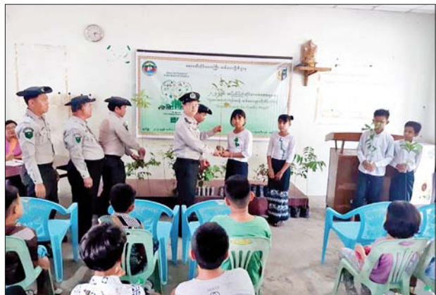
ရေကြည်မြို့နယ်၌ အပြည်ပြည်ဆိုင်ရာသစ်တောများနေ့ အထိမ်းအမှတ်ဟောပြောပွဲ ကျင်းပ

ဖမ်းဆီးထိန်းသိမ်း အမှုဖွင့်လှစ်အရေးယူခြင်းများ ဆောင်ရွက်ခဲ့ရသည်။ ထိုကဲ့သို့ CRPH၊ NUG နှင့် ယင်းတို့၏ လက်အောက်ခံအဖွဲ့အစည်းများ၊ ယင်းတို့နှင့် ဆက်သွယ်နေသောအဖွဲ့အစည်းများ၊ လူပုဂ္ဂိုလ်များသည် နိုင်ငံတော်တည်ငြိမ်အေးချမ်းရေးကို ပျက်ပြားစေရန်နှင့် အစိုးရယန္တရားများ ပျက်ပြားစေရန် ရည်ရွယ်လျက် လှုံ့ဆော်ခြင်း၊ ဝါဒဖြန့်ခြင်းများ ပြုလုပ်ခဲ့မှုအပေါ် အားပေးကူညီခြင်းပြုလုပ်ခဲ့သူများအား ဥပဒေနှင့်အညီ ထိရောက်စွာ အရေးယူသွားမည် ဖြစ်ကြောင်းနှင့် ထိုသို့လှုံ့ဆော်သူ၊ ဝါဒဖြန့်သူများအား ဆက်လက်ဖော်ထုတ် အရေးယူသွားမည်ဖြစ်ကြောင်း သိရသည်။ သတင်းစဉ်