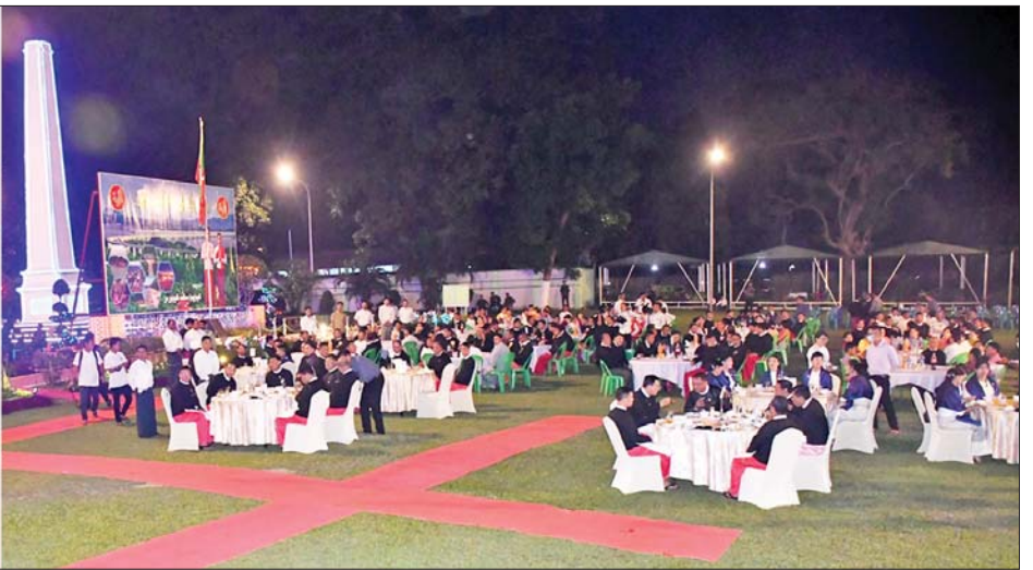
နိုင်ငံတော်စီမံအုပ်ချုပ်ရေးကောင်စီဝင် ဒုတိယဝန်ကြီးချုပ်နှင့် ပြည်ထောင်စုဝန်ကြီး ဗိုလ်ချုပ်ကြီးမြထွန်းဦး၊ နိုင်ငံတော်စီမံအုပ်ချုပ်ရေးကောင်စီဝင် ဦးရန်ကျော်၊ ပြည်ထောင်စုဝန်ကြီး ဒုတိယဗိုလ်ချုပ်ကြီး ထွန်းထွန်းနောင်၊ Jeng Phang နော်တောင်နှင့် တာဝန်ရှိသူများ မွန်တိုင်းရင်းသားရိုးရာ ယဉ်ကျေးမှုအဖွဲ့များ၏ သီဆိုကပြဖျော်ဖြေမှုများကို ကြည့်ရှုအားပေးစဉ်။

ပြည်နယ်ဝန်ကြီးချုပ်တို့က (၄၉)နှစ်မြောက် မွန်ပြည်နယ်နေ့ အထိမ်းအမှတ်ပြခန်း ပထမဆုရ ပြည်နယ် လျှပ်စစ်ဓာတ်အား ဖြန့်ဖြူးရေးဦးစီးဌာန၊ ဒုတိယဆုရ