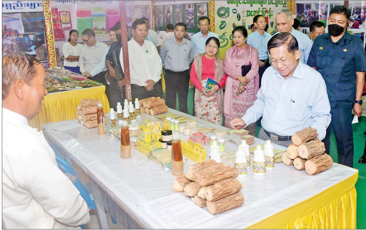
နိုင်ငံတော်စီမံအုပ်ချုပ်ရေးကောင်စီဥက္ကဋ္ဌ နိုင်ငံတော်ဝန်ကြီးချုပ် ဗိုလ်ချုပ်မှူးကြီး မင်းအောင်လှိုင် ခင်းကျင်းပြသထားသည့် ထုတ်ကုန်ပစ္စည်းများကို ကြည့်ရှုလေ့လာစဉ်။

အောင်မြင်စွာ ဆောင်ရွက်လျက်ရှိသည့်အတွက် ဂုဏ်ယူဖွယ်ရာဖြစ်ကြောင်း၊ အခြားဒေသများမှ ထွက်ရှိသည့် ကုန်ကြမ်းများကို မှီခိုရန်မလိုဘဲ မိမိဒေသအတွင်း ထွက်ကုန်များဖြင့် အောင်မြင်စွာ ထုတ်လုပ်နိုင်သည့် ဒေသတစ်ခု ဖြစ်သည့်အတွက်လည်း ဂုဏ်ယူပါကြောင်း၊ မွေးမြူရေးလုပ်ငန်းများကိုလည်း အောင်မြင်စွာ ဆောင်ရွက်နိုင်မည့်ဒေသဖြစ်ပြီး ဧရာဝတီမြစ်နှင့် ချင်းတွင်းမြစ်နစ်နစ်အကြားတွင် တည်ရှိနေသည့် ရေခဲမြေခံကောင်းများကို ပိုင်ဆိုင်ထားသည့် ဒေသတစ်ခုလည်းဖြစ်ကြောင်း။