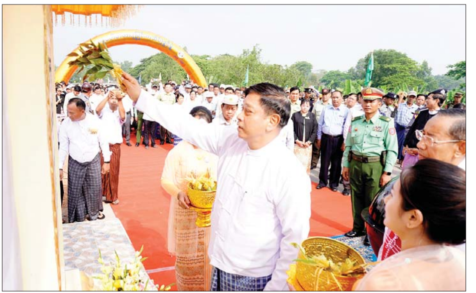
နိုင်ငံတော်စီမံအုပ်ချုပ်ရေးကောင်စီဝင် ဒုတိယဝန်ကြီးချုပ်နှင့် ပြည်ထောင်စုဝန်ကြီး ဗိုလ်ချုပ်ကြီး တင်အောင်စန်း ပမ္မဝတီတံတား(မြင်းကဆိပ်) ကမ္ဘည်းမော်ကွန်းကျောက်စာကို အမွှေးနံ့သာရည် ပက်ဖျန်းပေးစဉ်။

မြောင်းမြမြို့နယ် ပုသိမ်-ကံကုန်း-မြင်းကဆိပ်-မြောင်းမြလမ်းပေါ်တွင် ယခင်က တည်ဆောက်ခဲ့သည့် ပမ္မဝတီတံတား(မြင်းကဆိပ်) ကြီးတံတား