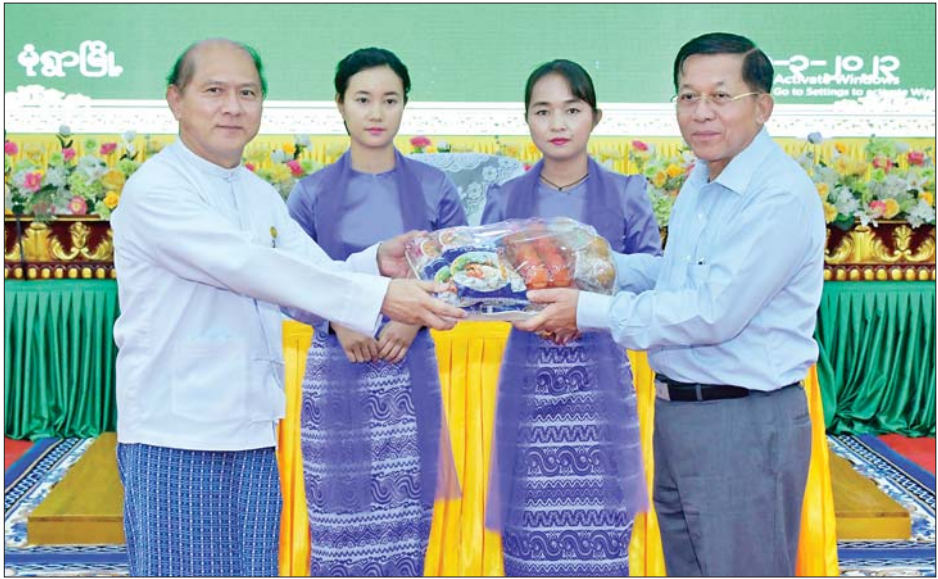
နိုင်ငံတော်စီမံအုပ်ချုပ်ရေးကောင်စီဥက္ကဋ္ဌ နိုင်ငံတော်ဝန်ကြီးချုပ် ဗိုလ်ချုပ်မှူးကြီး မင်းအောင်လှိုင် တိုင်းဒေသကြီး၊ ခရိုင်၊ မြို့နယ်အဆင့် ဌာနဆိုင်ရာ ဝန်ထမ်းများအတွက် စားသောက်ဖွယ်ရာပစ္စည်းများ ပေးအပ်စဉ်။

မိမိတို့၏ ကိုယ်ပိုင်ဆိုင်ခြင်းတို့ တရားဖြင့် စဉ်းစားဆုံးဖြတ်ကြစေ လိုကြောင်း။ လူသားအရင်းအမြစ်များ ပေါ်ထွက်လာရေး ပညာရေးကို အားပေးဆောင်ရွက် မိမိ၏မူဝါဒမှာ ပြည်တွင်းစီးပွား ရေးနှင့် ပြည်တွင်းကုန်ထုတ်လုပ် မှုကို အားပေးခြင်းပင်ဖြစ်ပြီး နိုင်ငံစီးပွားရေး မြှင့်တင်ရေး ရန်ပုံ ငွေမှ ရင်းနှီးမတည်ငွေများ လွှဲအပ် ပေးထားပြီးဖြစ်သဖြင့် စနစ်တကျ အကျိုးရှိစွာ အသုံးချရန်လိုကြောင်း၊ ကုန်ထုတ်လုပ်မှုအတွက် လိုအပ် သည့် ကုန်ကြမ်းများ၊ အရင်းအနှီး၊ စက်သုံးဆီ၊ လျှပ်စစ်ဓာတ်အားနှင့် လူသားအရင်းအမြစ်များ လိုအပ် ကြောင်း၊ စိုက်ပျိုးမွေးမြူရေး လုပ်ငန်းများအတွက် လိုအပ်သည့် လူသားအရင်းအမြစ်များ ရရှိစေ ရေး ခရိုင် ၅၀ တွင် စိုက်ပျိုးမွေးမြူ ရေးနှင့် စက်မှုအခြေခံသင်တန်း ကျောင်းများ ဖွင့်လှစ်လျက်ရှိ ကြောင်း၊ အလားတူ သိပ္ပံကျောင်း များကိုလည်း ဖွင့်လှစ်သင်ကြား လျက်ရှိကြောင်း၊ ၎င်းမှတစ်ဆင့် ကောလိပ်နှင့် တက္ကသိုလ်များကို တက်ရောက်နိုင်ကြောင်း၊ ယခင် ပညာသင်နှစ်တွင် စစ်ကိုင်းတိုင်း ဒေသကြီးသည် ကျောင်းဖွင့်လှစ်မှု နှင့် ကျောင်းတက်ရောက်မှု ရာခိုင် နှုန်း အနည်းဆုံးဖြစ်ကြောင်း၊ မိမိ တို့သားသမီးများ၏ ပညာရည် မြှင့်တင်ရေးအတွက် ပိုင်းဝန်း အားပေး ဆောင်ရွက်ကြရန် တိုက်တွန်းလိုကြောင်း။ စစ်ကိုင်းတိုင်းဒေသကြီးသည်