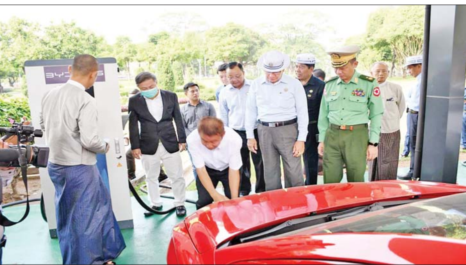
တိုင်းမှူးနှင့် တာဝန်ရှိသူများသည် 60 KW DC Fast Charging Station နှင့် EV Charging Station တို့မှ ကားများအား လှည့်လည်ကြည့်ရှုကြပြီး (လှုပ်စစ်ကား)များကို စမ်းသပ်မောင်းနှင်ခဲ့ကြကြောင်း သိရသည်။