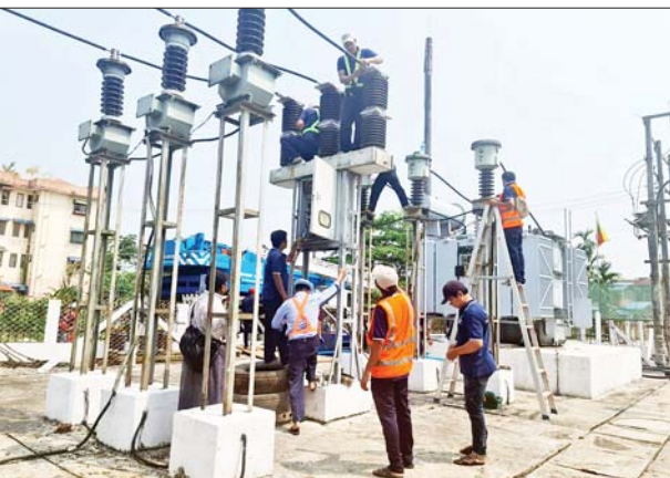
ခရိုင် လျှပ်စစ်အင်ဂျင်နီယာ၊ ရွှေပေါက်ကံမြို့ လျှပ်စစ်အင်ဂျင်နီယာ တို့က အနီးကပ်ကြီးကြပ်ဆောင်ရွက်ပေးခဲ့ကြောင်း သိရသည်။

ရန်ကုန် မတ် ၂၀ ဓာတ်အားပျောက်ဆုံးမှုလျော့နည်းရေး၊ ဓာတ်အားသုံးစွဲသူ ပြည်သူများ ဗို့အားပြည့်ဝစွာရရှိရေး ဓာတ်အားပြတ်တောက်မှု လျော့နည်းရေး၊ စဉ်ဆက်မပြတ် ဓာတ်အားဖြန့်ဖြူးပေးနိုင်ရေးတို့ အတွက် ရန်ကုန်လျှပ်စစ်ဓာတ်အားပေးရေး ကော်ပိုရေးရှင်း၊ အရှေ့ပိုင်း ခရိုင် ရွှေပေါက်ကံရှိ 33/11 kV ကုန်းဘောင်ဓာတ်အားခွဲရုံမှ ဓာတ်အား ဖြန့်ဖြူးပေးထားသော 10MVA ထရန်စဖော်မာသည် မီးသုံးစွဲသူများပြား ကာ ဝန်အားနိုင်နင်းမှု နည်းပါးလာသောကြောင့် 33/11kV 10 MVA ထရန်စဖော်မာအား ဝန်အားပိုမိုနိုင်နင်းမှုရှိသည့် 33/11kV15MVA ထရန်စဖော်မာဖြင့် အစားထိုးလဲလှယ်တပ်ဆင်ခြင်းလုပ်ငန်းကို မတ် ၁၉ ရက် နံနက် ၁၀ နာရီမှ မွန်းလွဲ ၂ နာရီအထိ ဆောင်ရွက်ခဲ့ပြီး အများပြည်သူတို့အား ဓာတ်အားဖြန့်ဖြူးပေးနိုင်ခဲ့သည်။ ထိုသို့လုပ်ငန်းများဆောင်ရွက်ရာတွင် YESC ရုံးချုပ်မှ ဒုတိယ အထွေထွေမန်နေဂျာ(အင်ဂျင်နီယာ)နှင့် တာဝန်ရှိသူများ၊ အရှေ့ပိုင်း