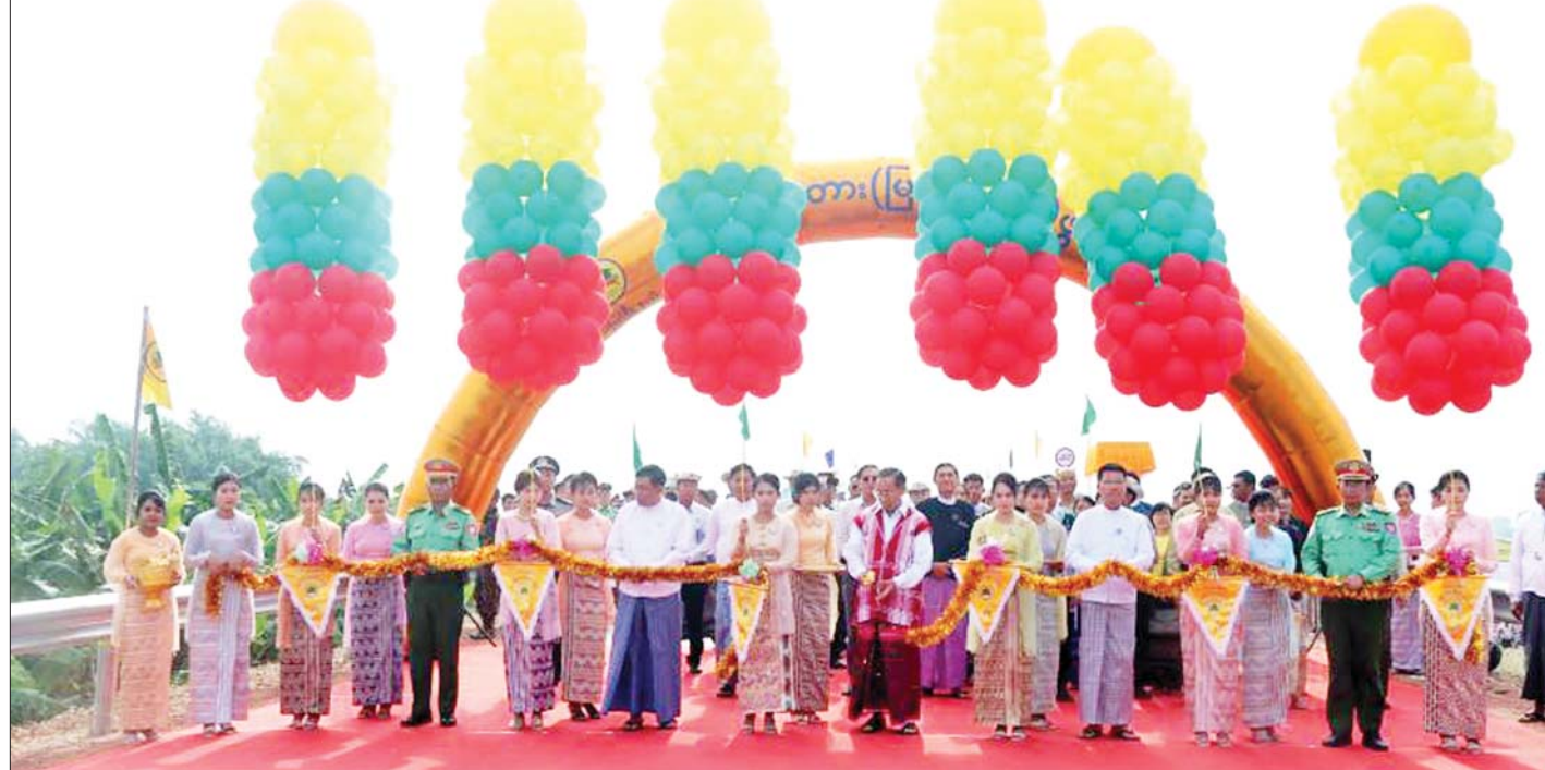
နိုင်ငံတော်စီမံအုပ်ချုပ်ရေးကောင်စီဝင် မန်းငြိမ်းမောင်၊ ဆောက်လုပ်ရေးဝန်ကြီးဌာန ပြည်ထောင်စုဝန်ကြီး ဦးမျိုးသန့်၊ ဧရာဝတီတိုင်းဒေသကြီး ဝန်ကြီးချုပ် ဦးတင်မောင်ဝင်း၊ အနောက်တောင်တိုင်းစစ်ဌာနချုပ် တိုင်းမှူး၊ ဗိုလ်မှူးချုပ် ကြည်ခိုင်နှင့် တိုင်းဒေသကြီးအစိုးရအဖွဲ့ လုံခြုံရေးနှင့်နယ်စပ်ရေးရာဝန်ကြီးတို့က ပမ္မဝတီတံတား(မြင်းကဆိပ်)ကို ဖဲကြိုးဖြတ် ဖွင့်လှစ်ပေးကြစဉ်။

ဝန်ကြီး ဗိုလ်ချုပ်ကြီးတင်အောင်စန်းက လမ်းပန်းဆက်သွယ်ရေး လွယ်ကူချောမွေ့ရေးသည် ဒေသတစ်ခု ဖွံ့ဖြိုး တိုးတက်ရေးအတွက် အဓိကလိုအပ်ချက်ဖြစ်ပြီး အလွန်အရေးကြီးသည့် အခန်းကဏ္ဍတွင် ပါဝင်ပါကြောင်း၊ ဧရာဝတီတိုင်းဒေသကြီးသည် မြစ်ဝကျွန်းပေါ်ဒေသဖြစ်သည်နှင့်အညီ မြန်မာနိုင်ငံ၏ ဆန်စပါး အဓိကထွက်ရှိရာ တိုင်းဒေသကြီးဖြစ်ကြောင်း၊ မြစ်ချောင်းများပေါများပြီး မြေဆီဩဇာကြွယ်ဝသော မြေနုကျွန်းများရှိသည့်အတွက်