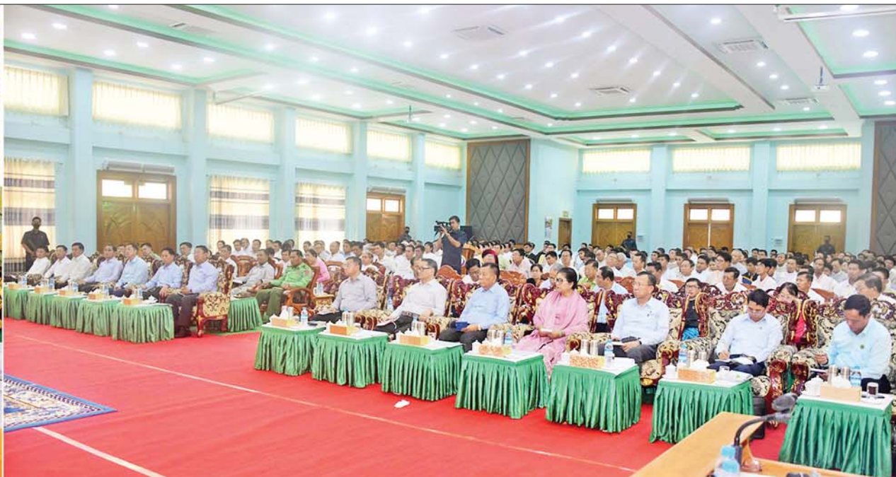
နိုင်ငံတော်စီမံအုပ်ချုပ်ရေးကောင်စီဥက္ကဋ္ဌ နိုင်ငံတော်ဝန်ကြီးချုပ် ဗိုလ်ချုပ်မှူးကြီး မင်းအောင်လှိုင် စစ်ကိုင်းတိုင်းဒေသကြီးအတွင်းရှိ တိုင်းဒေသကြီး၊ ခရိုင်၊ မြို့နယ်အဆင့်ဌာနဆိုင်ရာတာဝန်ရှိသူများ၊ မြို့၊ မြို့ဖများ၊ အသေးစား၊ အငယ်စားနှင့် အလတ်စား စီးပွားရေး (MSME) လုပ်ငန်းရှင်များအားတွေ့ဆုံ၍ ဒေသဖွံ့ဖြိုးတိုးတက်ရေးဆိုင်ရာများကို ဆွေးနွေးပြောကြားစဉ်။