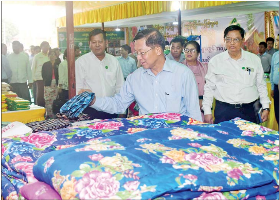
နိုင်ငံတော်စီမံအုပ်ချုပ်ရေးကောင်စီဥက္ကဋ္ဌ နိုင်ငံတော်ဝန်ကြီးချုပ် ဗိုလ်ချုပ်မှူးကြီး မင်းအောင်လှိုင် ခင်းကျင်းပြသထားသည့် ထုတ်ကုန် ပစ္စည်းများကို ကြည့်ရှုလေ့လာစဉ်။

ဒေသတွင်း ကုန်ထုတ်လုပ်မှုလုပ်ငန်းများရှိမှသာလျှင် ရောင်းကုန်ပစ္စည်းများ ရရှိမည်ဖြစ်ကြောင်း၊ ကုန်ထုတ်လုပ်မှုလုပ်ငန်းများ ဆောင်ရွက်နိုင်ရန်အတွက် ကုန်ကြမ်းပစ္စည်းများ လိုအပ်မည်ဖြစ်ကြောင်း၊ ဒေသတွင်း၌ထွက်ရှိသည့် ကုန်ကြမ်းများကို ကုန်ကြမ်းအတိုင်းသာ ရောင်းချမည်ဆိုပါက အကျိုးအမြတ်ရရှိမှုနည်းပါးမည်ဖြစ်ပြီး ကုန်ချောအဖြစ်ထုတ်လုပ်၍ တန်ဖိုးမြှင့်ထုတ်ကုန်များအဖြစ် ရောင်းချနိုင်မည်ဆိုပါက အကျိုးအမြတ်ပိုမိုရရှိနိုင်မည်ဖြစ်ကြောင်း။ ဒေသတွင်း အောင်မြင်စွာ ဆောင်ရွက်နိုင်မည့် စိုက်ပျိုးမွေးမြူရေးလုပ်ငန်းများကို အောင်မြင်အောင် ကြိုးပမ်းဆောင်ရွက်ရန်လို စစ်ကိုင်းတိုင်းဒေသကြီးအတွင်း စိုက်ပျိုးရေး လုပ်ငန်းများနှင့် ပတ်သက်၍ပန်းတိုင် ရည်မှန်းချက်များ ပြည့်မီမှုမရှိသည်ကိုတွေ့ရကြောင်း၊ စပါးစိုက်ပျိုးမှုများကို စနစ်တကျဆောင်ရွက်ပြီး တစ်ကေချင်းအထွက်နှုန်းများ တိုးတက်အောင် ဆောင်ရွက်နိုင်မည်ဆိုပါက ဒေသတွင်းဝမ်းစာဖူလုံမှုကို အထောက်အကူပြုနိုင်သည့်အပြင်