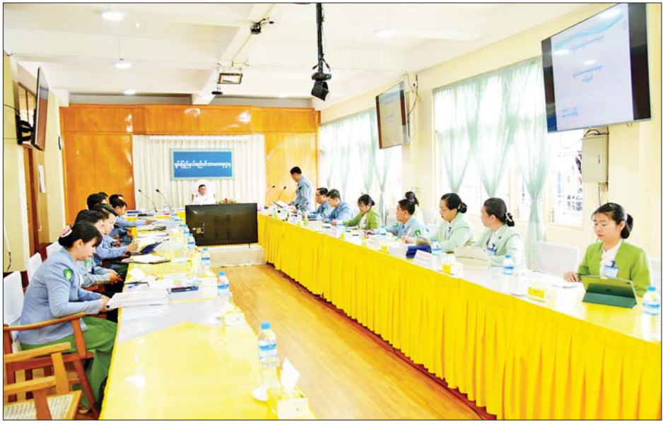
တောင်ကြီးမြို့နယ် စည်ပင်သာယာရေးဌာန အမှုဆောင်အရာရှိ၊ ကလေးမြို့နယ်စည်ပင်သာယာရေးဌာန အင်ဂျင်နီယာမှူးများ တက်ရောက်ကြကြောင်း ပြည်နယ်(ပြန်/ဆက်)

တွေ့ဆုံပွဲတွင် ရှမ်းပြည်နယ်စည်ပင်သာယာရေးညွှန်ကြားရေးမှူး၊ ဒုတိယညွှန်ကြားရေးမှူး၊ လက်ထောက်ညွှန်ကြားရေးမှူး (စီမံ၊ အခွန်၊ ငွေစာရင်း) နှင့် ရှမ်းပြည်နယ်အင်ဂျင်နီယာမှူးများ၊