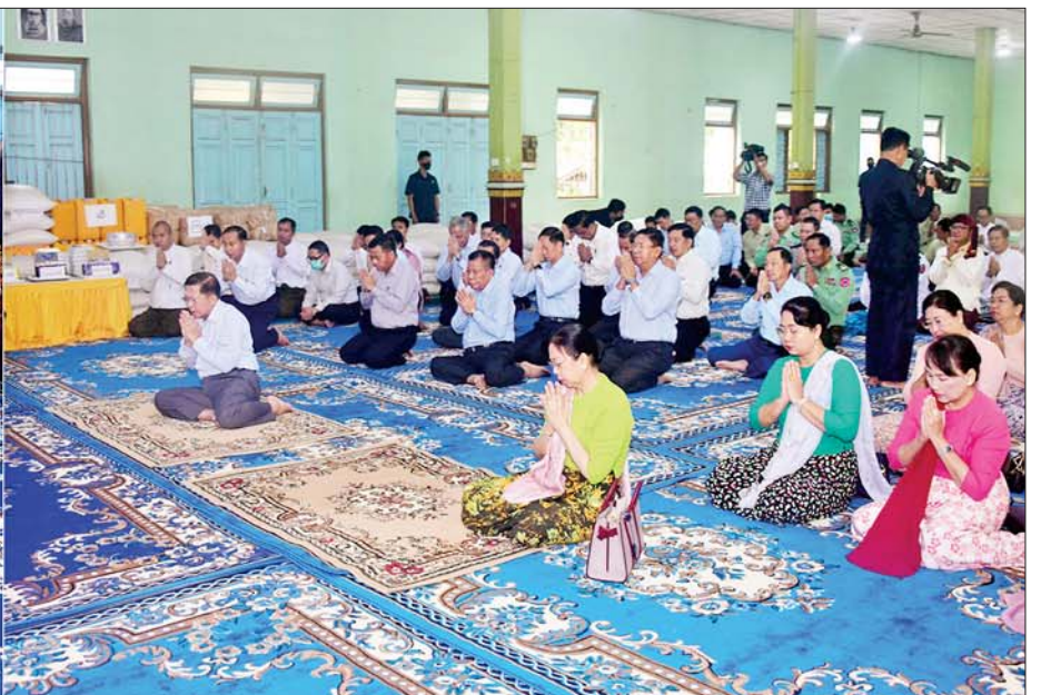
နိုင်ငံတော်စီမံအုပ်ချုပ်ရေးကောင်စီဥက္ကဋ္ဌ နိုင်ငံတော်ဝန်ကြီးချုပ် ဗိုလ်ချုပ်မှူးကြီးမင်းအောင်လှိုင်နှင့် ဇနီး ဒေါ်ကြူကြူလှ၊ အဖွဲ့ဝင်များ ရန်ကင်းကျောင်းတိုက်ဆရာတော်ထံမှ ငါးပါးသီလခံယူဆောက်တည်ကြပြီး ဆရာတော်၊ သံဃာတော်များ ရွတ်ပွားချီးမြှင့်တော်မူကြသည့် မေတ္တသုတ်ပရိတ်တရားတော်များကို နာယူကြစဉ်။