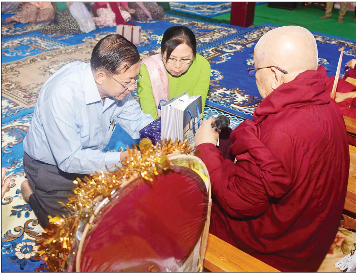
နိုင်ငံတော်စီမံအုပ်ချုပ်ရေးကောင်စီဥက္ကဋ္ဌ နိုင်ငံတော်ဝန်ကြီးချုပ် ဗိုလ်ချုပ်မှူးကြီး မင်းအောင်လှိုင်နှင့် ဇနီး ဒေါ်ကြူကြူလှ ရန်ကင်း ကျောင်းတိုက် ဆရာတော်ထံ လှူဖွယ်ဝတ္ထုပစ္စည်း များ ဆက်ကပ်စဉ်။

ကြွရောက်ချီးမြှင့်တော်မူ အခမ်းအနားသို့ နိုင်ငံတော်ဩဝါဒါစရိယ၊ မဟာ ဝိဇ္ဇာသိပ္ပံ ကျောင်းတိုက် ဆရာတော် အဘိဓမ္မမဟာ ရဋ္ဌဂုရု ဘဒ္ဒန္တသူရိယနှင့် ရန်ကင်းကျောင်းတိုက် ဆရာတော် ဒွိပိဋကဓရဒွိပိဋကကောဝိဒ အဂ္ဂမဟာ ပဏ္ဍိတ ဘဒ္ဒန္တပညာဝံသတို့ အမှူးပြုသည့် မုံရွာ မြို့ပေါ်ရှိ စာသင်တိုက် ခုနစ်တိုက်တို့မှ ဆရာတော်၊ သံဃာတော်များ ကြွရောက်ချီးမြှင့်တော်မူကြပြီး နိုင်ငံတော်စီမံအုပ်ချုပ်ရေးကောင်စီဥက္ကဋ္ဌ နိုင်ငံတော် ဝန်ကြီးချုပ် ဗိုလ်ချုပ်မှူးကြီးမင်းအောင်လှိုင်နှင့် ဇနီး ဒေါ်ကြူကြူလှ၊ ကောင်စီတွဲဖက်အတွင်းရေးမှူး ဒုတိယဗိုလ်ချုပ်ကြီး ရဲဝင်းဦးနှင့် ဇနီး၊ ကောင်စီဝင် များ၊ စာမျက်နှာ ၃ ကော်လံ ၁ သို့ ။