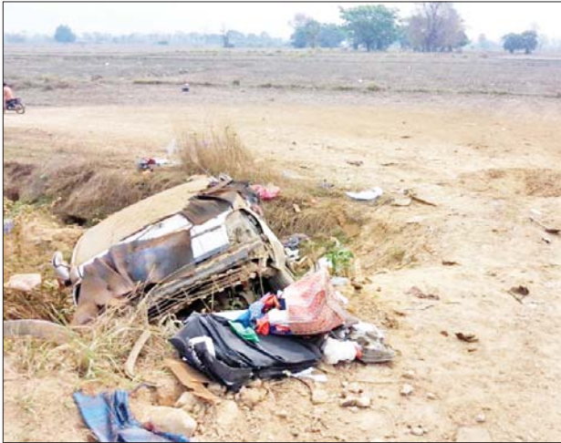
သည့် နယ်မြေလုံခြုံရေးလုပ်ငန်းများ ဆောင်ရွက်လျက်ရှိကြောင်းနှင့် ဒဏ်ရာရရှိသူများကို ကျောက်ကြီးမြို့နယ် ပြည်သူ့ဆေးရုံသို့ ပို့ဆောင် ဆေးကုသမှုခံယူစေလျက်ရှိကြောင်း သိရသည်။