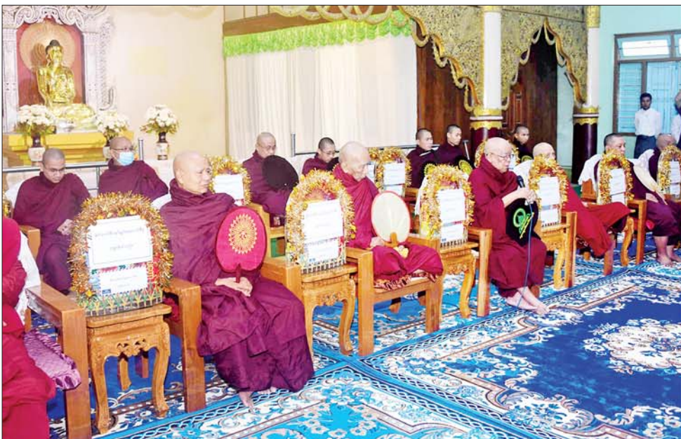
နိုင်ငံတော်စီမံအုပ်ချုပ်ရေးကောင်စီဥက္ကဋ္ဌ နိုင်ငံတော်ဝန်ကြီးချုပ် ဗိုလ်ချုပ်မှူးကြီးမင်းအောင်လှိုင်နှင့် ဇနီး ဒေါ်ကြူကြူလှ ဓမ္မပါရဂူကျောင်းတိုက်ဆရာတော်ထံ လှူဖွယ်ဝတ္ထုပစ္စည်းများ ဆက်ကပ်စဉ်။