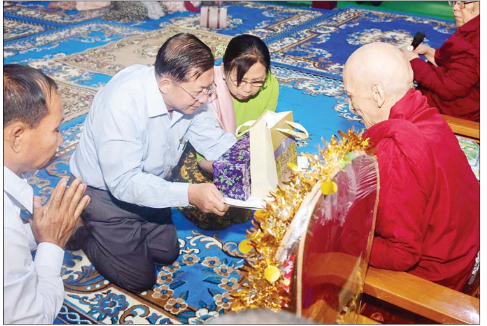
နိုင်ငံတော်စီမံအုပ်ချုပ်ရေးကောင်စီဥက္ကဋ္ဌ နိုင်ငံတော်ဝန်ကြီးချုပ် ဗိုလ်ချုပ်မှူးကြီးမင်းအောင်လှိုင်နှင့် ဇနီး ဒေါ်ကြူကြူလှ မဟာဝိဇ္ဇာသိပ္ပံကျောင်းတိုက်ဆရာတော်ထံ လှူဖွယ်ဝတ္ထုပစ္စည်းများ ဆက်ကပ်စဉ်။