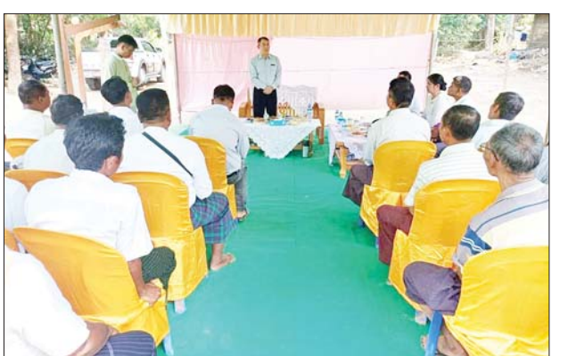
ကျေးရွာတွင်း ကွန်ကရစ်လမ်း ရာနှုန်းပြည့်ပြီးစီးမှု အခြေအနေများကို ကြည့်ရှုစစ်ဆေးခဲ့ပြီး ကျေးရွာဖွံ့ဖြိုးရေးကော်မတီဝင်များ၊ ကျေးရွာသူ ကျေးရွာသားများနှင့် တွေ့ဆုံသည်။

အဆိုပါ ကွန်ကရစ်လမ်းသည် အရှည် ပေ ၇၈၀၊ အကျယ် ၁၀ ပေ၊ ဒု ခြောက်လက်မရှိပြီး ကျေးရွာဖွံ့ဖြိုးတိုးတက်ရေးလုပ်ငန်းစီမံကိန်း ပံ့ပိုးရန်ပုံငွေကျပ်သိန်း ၁၀၀၊ ကျေးရွာပြည်သူထည့်ဝင်ငွေ ကျပ်သိန်း ၂၀ ကို အသုံးပြုကာ ၂၀၂၂ ခုနှစ် စက်တင်ဘာလ ဒုတိယပတ်မှ စတင် အကောင်အထည်ဖော်ဆောင်ရွက်ခဲ့ရာ ယခုအခါ လုပ်ငန်းများရာနှုန်းပြည့် ဆောင်ရွက်ပြီးစီးပြီဖြစ်ကြောင်း သိရသည်။