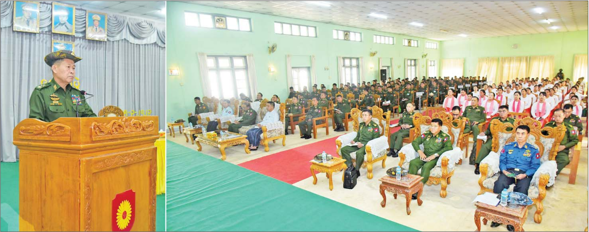
နိုင်ငံတော်စီမံအုပ်ချုပ်ရေးကောင်စီ ဒုတိယဥက္ကဋ္ဌ ဒုတိယတပ်မတော်ကာကွယ်ရေးဦးစီးချုပ် ကာကွယ်ရေးဦးစီးချုပ်(ကြည်း) ဒုတိယဗိုလ်ချုပ်မှူးကြီး စိုးဝင်း လှိုင်ကော်တပ်နယ်မှ အရာရှိ၊ စစ်သည်၊ မိသားစုများအား တွေ့ဆုံအမှာစကားပြောကြားစဉ်။