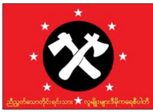
ပြည်ထောင်စုရွေးကောက်ပွဲကော်မရှင်

ညီညွတ်သောတိုင်းရင်းသားလူမျိုးများဒီမိုကရေစီပါတီ (United Nationalities Democracy Party)၏ တံဆိပ်ပုံစံ