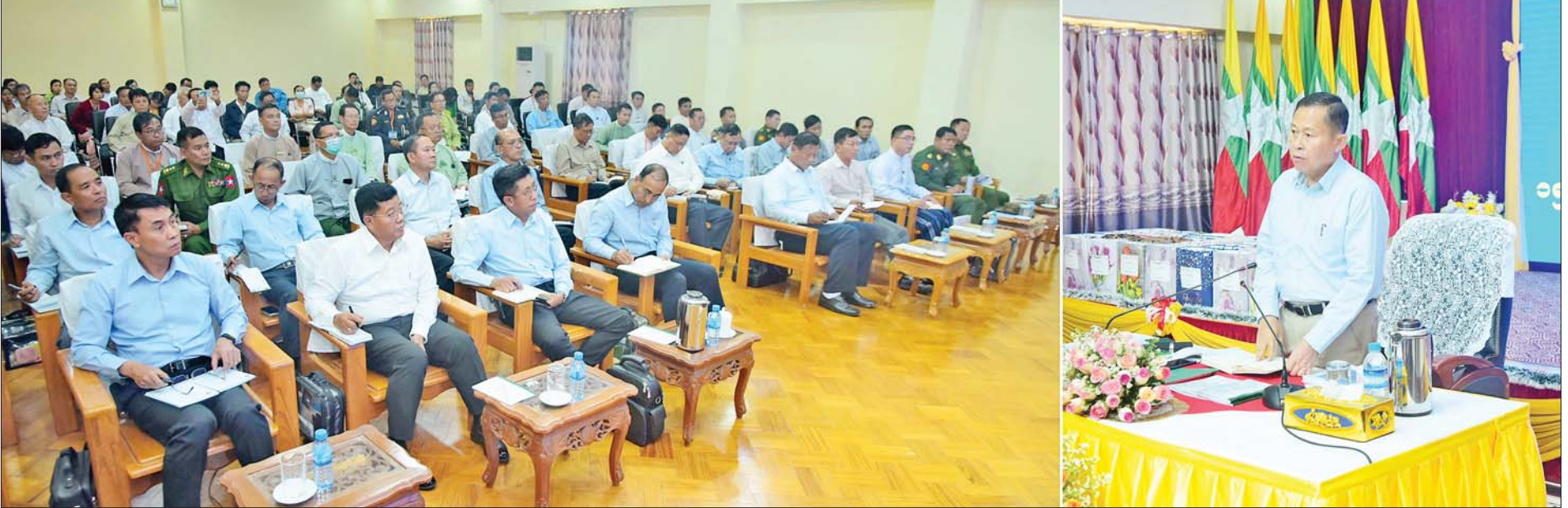
နိုင်ငံတော်စီမံအုပ်ချုပ်ရေးကောင်စီဒုတိယဥက္ကဋ္ဌ ဒုတိယတပ်မတော်ကာကွယ်ရေးဦးစီးချုပ် ကာကွယ်ရေးဦးစီးချုပ်(ကြည်း) ဒုတိယဗိုလ်ချုပ်မှူးကြီး စိုးဝင်း ကယားပြည်နယ်အတွင်းရှိ အသေးစား၊ အငယ်စားနှင့် အလတ်စား စီးပွားရေးလုပ်ငန်းရှင်များနှင့် ဌာနဆိုင်ရာ တာဝန်ရှိသူများအား တွေ့ဆုံအမှာစကား ပြောကြားစဉ်။

နေပြည်တော် မတ် ၁၅ ကယားပြည်နယ်အတွင်းရှိ အသေးစား၊ အငယ်စားနှင့် အလတ်စား (MSME) စီးပွားရေးလုပ်ငန်းရှင်များနှင့် ဌာနဆိုင်ရာ တာဝန်ရှိသူများအား ယနေ့နံနက်ပိုင်းတွင် နိုင်ငံတော်စီမံအုပ်ချုပ်ရေးကောင်စီ ဒုတိယဥက္ကဋ္ဌ ဒုတိယတပ်မတော်ကာကွယ်ရေးဦးစီးချုပ် ကာကွယ်ရေးဦးစီးချုပ်(ကြည်း) ဒုတိယဗိုလ်ချုပ်မှူးကြီးစိုးဝင်းက ကယားပြည်နယ်အစိုးရအဖွဲ့ရုံးအစည်းအဝေးခန်းမ၌ တွေ့ဆုံအမှာစကား ပြောကြားသည်။