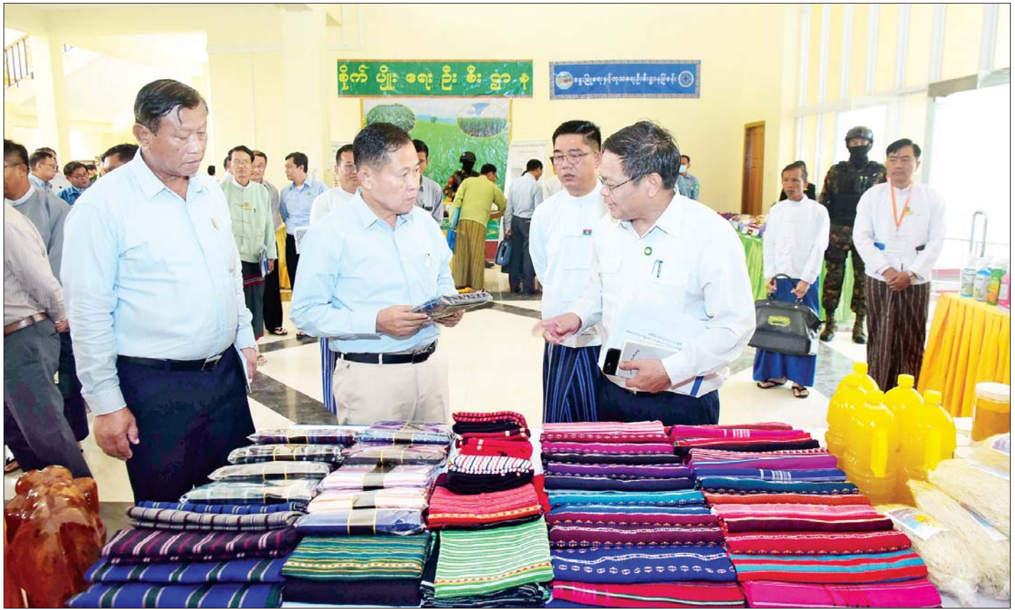
နိုင်ငံတော်စီမံအုပ်ချုပ်ရေးကောင်စီဒုတိယဥက္ကဋ္ဌ ဒုတိယတပ်မတော်ကာကွယ်ရေးဦးစီးချုပ် ကာကွယ်ရေးဦးစီးချုပ်(ကြည်း) ဒုတိယဗိုလ်ချုပ်မှူးကြီး စိုးဝင်းနှင့် အဖွဲ့ဝင်များ ခင်းကျင်းပြသထားသည့် ဒေသထုတ်ကုန်ပစ္စည်းများအား ကြည့်ရှုစဉ်။