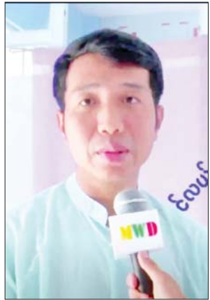
ဒေသခံပြည်သူ