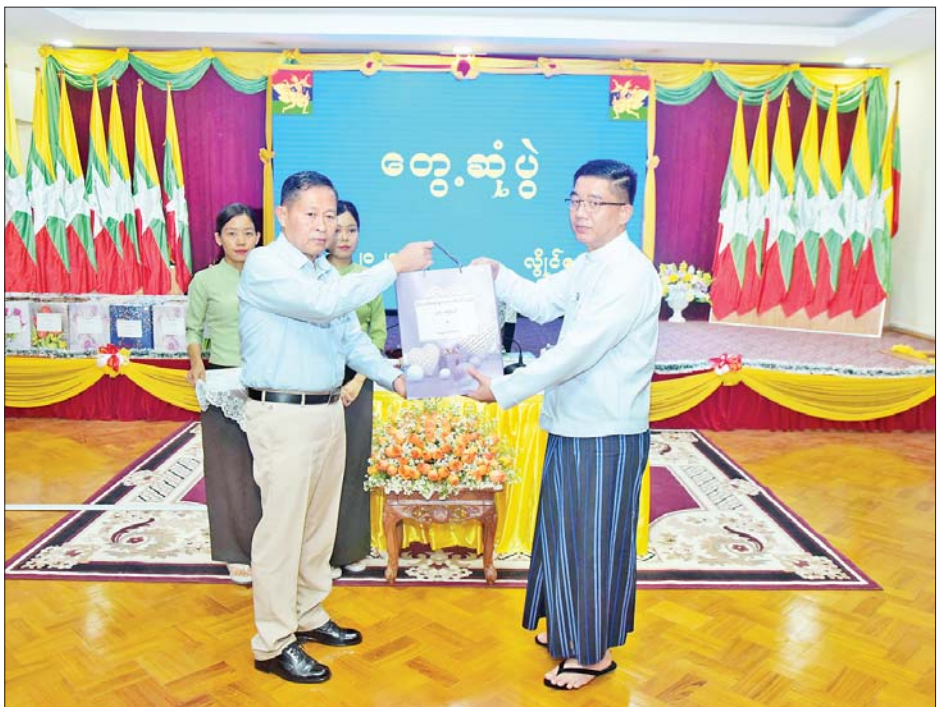
နိုင်ငံတော်စီမံအုပ်ချုပ်ရေးကောင်စီဒုတိယဥက္ကဋ္ဌ ဒုတိယတပ်မတော်ကာကွယ်ရေးဦးစီးချုပ် ကာကွယ်ရေးဦးစီးချုပ်(ကြည်း) ဒုတိယဗိုလ်ချုပ်မှူးကြီး စိုးဝင်း ဌာနဆိုင်ရာ ဝန်ထမ်းများအတွက် လက်ဆောင်ပစ္စည်းများ ပေးအပ်ရာ ပြည်နယ်ဝန်ကြီးချုပ် ဦးဇော်မျိုးတင်က လက်ခံရယူစဉ်။

အမှာစကား ပြောကြား ဆွေးနွေးတင်ပြမှုများနှင့်ပတ်သက်၍ နိုင်ငံတော်စီမံအုပ်ချုပ်ရေးကောင်စီဒုတိယဥက္ကဋ္ဌ ဒုတိယတပ်မတော်ကာကွယ်ရေးဦးစီးချုပ် ကာကွယ်ရေးဦးစီးချုပ်(ကြည်း) ဒုတိယဗိုလ်ချုပ်မှူးကြီး စိုးဝင်းက