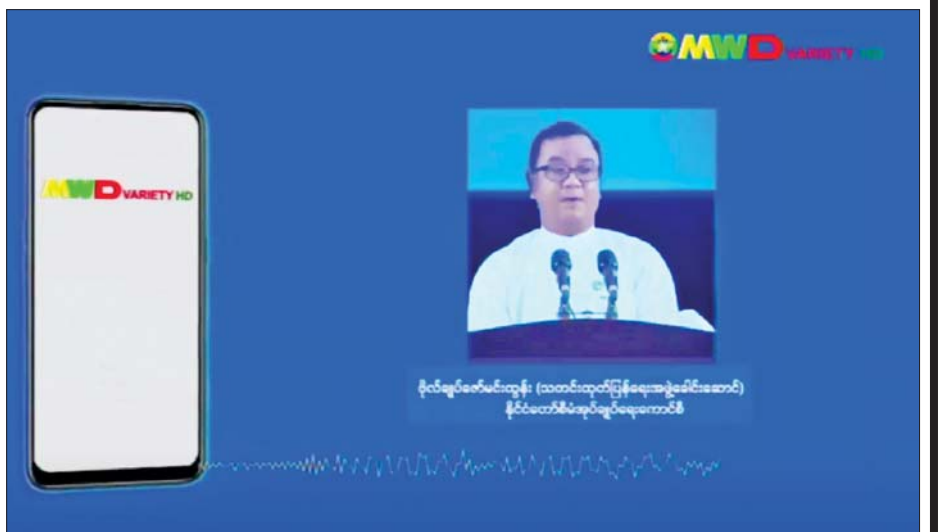
ဆိုရင် ၂၈ ရက်နေ့ နောက်ဆုံးဖြစ်ပါမယ်။ ဒါက ဆောင်ရွက်သွားရမှာဖြစ်ပါတယ်။ ရွေးကောက်ပွဲဥပဒေအရ ပြဋ္ဌာန်းခြင်းဖြစ်ပါတယ်။ ပါတီကြီးငယ်ကော်မရှင်ကလည်း ပြဋ္ဌာန်းချက်အတိုင်း ဆက်လက်မဟုတ်မည့်ပါတီမဆို ပြဋ္ဌာန်းချက်အတိုင်း ဆောင်ရွက်သွားမှာ ဖြစ်ပါတယ်။

နည်းဥပဒေအပိုဒ် ၈ မှာလည်း ပါရှိပြီးဖြစ်ပါတယ်။ ရက်ပေါင်း ၆၀ အတွင်းမှာပဲ မှတ်ပုံတင်ကြေး ထပ်မံပေးသွင်းခြင်းမှအပ ဥပဒေပုဒ်မ ၅ ပါ ပြဋ္ဌာန်းချက်များအတိုင်း ကော်မရှင်သို့ ဥပဒေ၊ နည်းဥပဒေများနှင့်အညီ လျှောက်ထားခွင့်ရှိပြီး လျှောက်ထားခြင်းမရှိတဲ့ နိုင်ငံရေးပါတီတွေက အလိုအလျောက် ပျက်ပြယ်ပြီးဖြစ်သည်ဟု မှတ်ယူရမည်လို့ပါပြီးဖြစ်ပါတယ်။ ဒါနဲ့ပတ်သက်ပြီး မတ်လ ၂၆ ရက်နေ့မှာ ရက်ပေါင်း ၆၀ ပြည့်မှာ ဖြစ်ပါတယ်။ သို့သော် ၂၅၊ ၂၆၊ ၂၇ ရက်နေ့တွေက ရုံးပိတ်ရက်တွေဖြစ်ပါတယ်။ နည်းဥပဒေပုဒ်မ ၂၉ မှာက နောက်ဆုံးနေ့ရက်အဖြစ် သတ်မှတ်ထားသောနေ့ရက်သည် အများပြည်သူရုံးပိတ်ရက်ဖြစ်ရင် ရုံးပြန်ဖွင့်သည့်နေ့တွင် အဲဒီကိစ္စကို နောက်ဆုံးနေ့ရက်အဖြစ် ဆောင်ရွက်ခွင့်ရှိပါတယ်။ ဆက်လက်တည်ထောင်လိုတဲ့ နိုင်ငံရေးပါတီတွေက ရက်ပေါင်း ၆၀ အတွင်း ကော်မရှင်ကို ပါတီမှတ်ပုံတင်ခွင့် ပြန်လည်လျှောက်ထားမယ်