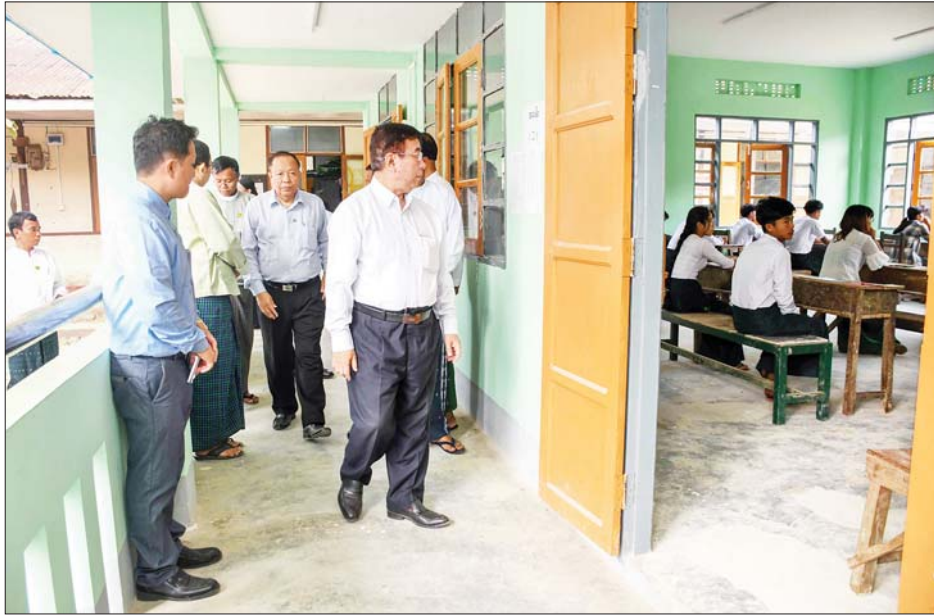
ကြည့်ရှုအားပေးသည်။ ထိုသို့အားပေးကြည့်ရှုစဉ် ပြည်ထောင်စုဝန်ကြီး က စာမေးပွဲကြိုပေးရေးမှူးများနှင့် တာဝန်ကျဆရာ ဆရာမများအနေဖြင့် မိမိတို့ကျရာ တာဝန်အခန်း ကဏ္ဍအလိုက် ဝိုင်းဝန်းလက်တွဲ ကြိုးပမ်းဆောင်ရွက် ကြရန်နှင့် ကျောင်းသား ကျောင်းသူများ စာမေးပွဲ

ဦးစွာ ပြည်ထောင်စုဝန်ကြီးနှင့် ရခိုင်ပြည်နယ် ဝန်ကြီးချုပ်တို့သည် စာမေးပွဲဖြေဆိုကြမည့် ကျောင်းသား ကျောင်းသူများနှင့် လိုက်ပါပို့ဆောင် ပေးကြသည့် ကျောင်းသားမိဘများ၊ ရပ်မိရပ်ဖ များကို ရင်းရင်းနှီးနှီး နှုတ်ဆက်အားပေးပြီး ကျောင်းသား ကျောင်းသူများ၏ သိပ္ပံဘာသာတွဲ ဇီဝဗေဒဘာသာရပ်နှင့် ဝိဇ္ဇာဘာသာတွဲ ဘောဂဗေဒ ဘာသာရပ် အေးချမ်းစွာဖြေဆိုနေမှုများကို လှည့်လည်