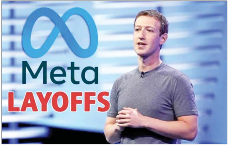
ယင်းကုမ္ပဏီများတွင် အမေဇန် (Goldman Sachs) တို့ ပါဝင်သည်။ (Amazon)၊ ဂူဂဲလ် (Google)၊ ဝေါ့လ်ဒစ္စနေး (Walt Disney)နှင့် ကိုးမန်းဆက်ချိ ကိုးကား - အင်န်အိတ်ချီကော ဘာသာပြန် - အောင်ကျော်ကျော်

အားလုံး၏ ၁၃ ရာခိုင်နှုန်းဖြစ်သည်။ နည်းပညာကုမ္ပဏီကြီး ဖြစ်သည့် မီတာကုမ္ပဏီက ယင်းသို့ ပထမအကြိမ် ဝန်ထမ်းအင်အား လျှော့ချပြီးနောက် မကြာမီအချိန်အတွင်းမှာပင် ဒုတိယအကြိမ် ဝန်ထမ်းအင်အားလျှော့ချရန် စီစဉ်ခြင်းမှာ ပုံမှန်လုပ်ရိုးလုပ်စဉ်တစ်ခု မဟုတ်ပေ။ အလားတူ အခြားသော အမေရိကန် ကုမ္ပဏီများသည်လည်း စီးပွားရေး ပျက်ကပ်ဆိုင်ကာမည်ကို စိုးရိမ်သည့် အတွက် လုပ်သားစရိတ်ကို လျှော့ချရန် ကြိုးပမ်းလျက်ရှိသည်။