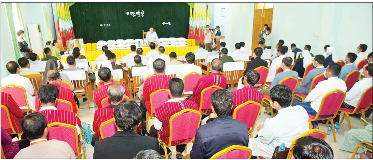
နိုင်ငံတော်စီမံအုပ်ချုပ်ရေးကောင်စီ ဒုတိယဥက္ကဋ္ဌ ဒုတိယတပ်မတော်ကာကွယ်ရေးဦးစီးချုပ် ကာကွယ်ရေးဦးစီးချုပ်(ကြည်း) ဒုတိယဗိုလ်ချုပ်မှူးကြီး စိုးဝင်း လွိုင်ကော်မြို့ရှိ ဘာသာရေးအသင်းအဖွဲ့ခေါင်းဆောင်များအား တွေ့ဆုံအမှာစကားပြောကြားစဉ်။

နေပြည်တော် မတ် ၁၅ နိုင်ငံတော် စီမံအုပ်ချုပ်ရေး ကောင်စီ ဒုတိယဥက္ကဋ္ဌ ဒုတိယ တပ်မတော်ကာကွယ်ရေး ဦးစီး ချုပ် ကာကွယ်ရေးဦးစီးချုပ် (ကြည်း) ဒုတိယဗိုလ်ချုပ်မှူးကြီး စိုးဝင်းသည် ယနေ့နံနက်ပိုင်းတွင် လွိုင်ကော်မြို့ရှိ ကက်သလစ် သာသနာ့အသင်းတော်၊ နှစ်ခြင်း ခရစ်ယာန်အသင်းတော်၊ ကယား ဖူးနှစ်ခြင်း ခရစ်ယာန်အသင်းတော်၊ အင်္ဂလိကန်အသင်းတော်၊ ယေ ဟောဝါအသင်းတော်၊ သတ္တမနေ့ ဥပုသ်အသင်းတော်နှင့် ကေ့ထိုးဘိုး ရိုးရာအဖွဲ့များမှ ဘာသာရေး ခေါင်းဆောင်များအား ပြည်နယ် အစိုးရအဖွဲ့ရုံးခန်းမ၌ တွေ့ဆုံ သည်။