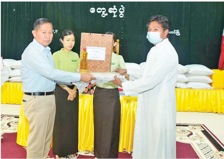
နိုင်ငံတော်စီမံအုပ်ချုပ်ရေးကောင်စီ ဒုတိယဥက္ကဋ္ဌ ဒုတိယတပ်မတော်ကာကွယ်ရေး ဦးစီးချုပ် ကာကွယ်ရေးဦးစီးချုပ်(ကြည်း) ဒုတိယဗိုလ်ချုပ်မှူးကြီး စိုးဝင်း ဘာသာရေးအသင်းအဖွဲ့ခေါင်းဆောင် တစ်ဦးအား ဆန်း၊ ဆီနှင့် စားသောက်ဖွယ်ရာများ ပေးအပ်စဉ်။

ဆွေးနွေးတင်ပြချက်များအပေါ် နိုင်ငံတော် စီမံအုပ်ချုပ်ရေး ကောင်စီ ဒုတိယဥက္ကဋ္ဌ ဒုတိယ တပ်မတော်ကာကွယ်ရေးဦးစီးချုပ် ကာကွယ်ရေးဦးစီးချုပ် (ကြည်း) ဒုတိယဗိုလ်ချုပ်မှူးကြီး စိုးဝင်း က ပြန်လည်ဆွေးနွေး ပြောကြား ရာတွင် ယာယီနေရပ်စွန့်ခွာသူများ နှင့်ပတ်သက်၍ ဒေသတည်ငြိမ် အေးချမ်းမှု မဖြစ်မနေ လိုအပ်ပြီး လက်နက်ကိုင်အဖွဲ့များ၏ အကြမ်း ဖက်မှုတွင် ဒေသခံပြည်သူများ သည် ဆင်းရဲဒုက္ခများစွာ ကျရောက် ခဲ့ကြောင်း၊ တည်ငြိမ်အေးချမ်းရန် ဒေသခံပြည်သူများ အနေဖြင့် ပူးပေါင်းပါဝင်ပေးရန် လိုကြောင်း၊ အလားတူ ဘာသာရေးအဖွဲ့ အစည်းများသည် အရေးကြီးသော အခန်းကဏ္ဍမှ ပါဝင်ကြောင်း၊ တည်ငြိမ်အေးချမ်းသော ဒေသ များတွင် ပဋိပက္ခမရှိလျှင် နေရပ် စွန့်ခွာသူများမရှိကြောင်း၊ သို့ဖြစ် ၍ ဒေသခံပြည်သူများအနေဖြင့် တည်ငြိမ် အေးချမ်းရေးအတွက် သက်ဆိုင်ရာ တာဝန်ရှိသူများနှင့် ပူးပေါင်းပေးရန် ပြောကြားလို