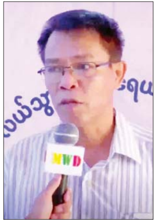
ဒေသခံပြည်သူ