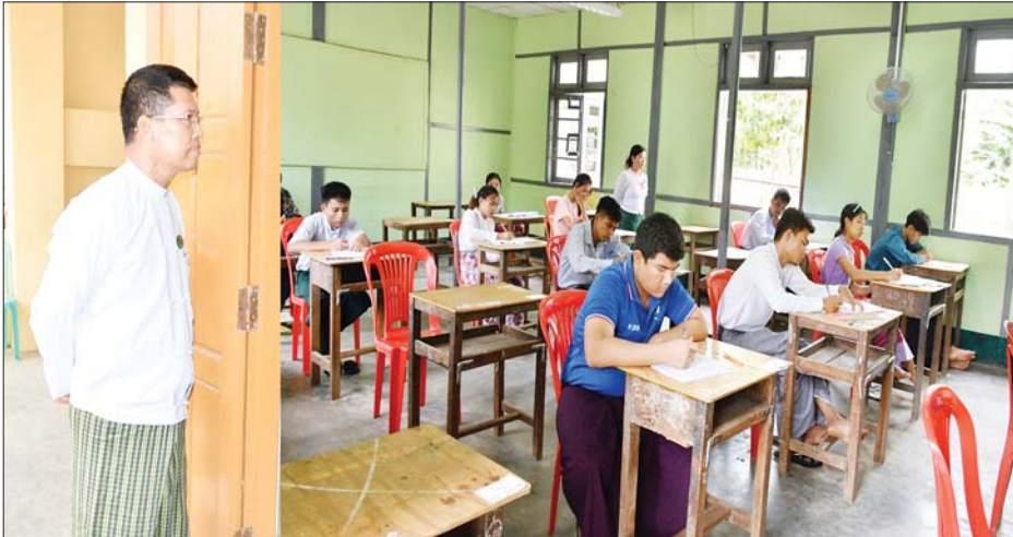
အင်ကြင်းဆောင်ရွက်အထိ အလျား ပေ ၁၇၀၀၊ အကျယ် ရှစ်ပေ ကွန်ကရစ် လူသွားလမ်းအား ရေရှည်ခိုင်ခံ့စေရေးနှင့် ပန်းအလှ ပင်များနှင့် မြက်ပင်များ စိုက်ပျိုး နေမှုများ သန့်ရှင်းသပ်ရပ်စွာ စနစ်တကျစိုက်ပျိုးထားရှိရေးနှင့် စိမ်းလန်းသာယာမှု ရှိစေရေးတို့ အား မှာကြားသည်။ ဆက်လက်၍ တိုင်းဒေသကြီး ဝန်ကြီးချုပ်သည် အမှတ်(၁) အခြေခံပညာ အထက်တန်း ကျောင်း၌ တက္ကသိုလ်ဝင်စာမေးပွဲ ဆဋ္ဌမနေ့ ဇီဝဗေဒဘာသာရပ်နှင့် ဘောဂဗေဒဘာသာရပ်ဖြေဆိုနေ ကြသည့် ကျောင်းသား ကျောင်းသူ များနှင့် ပုသိမ်ပြည်သူ့ဆေးရုံကြီး၌ ဆေးရုံတက်ရောက်၍ တက္ကသိုလ် ဝင်စာမေးပွဲ ဖြေဆိုနေသည့် ကျောင်း သားတစ်ဦးနှင့် အမှတ်(၇) အခြေခံပညာ အထက်တန်း ကျောင်း၊ အမှတ်(၈) အခြေခံ ပညာ အထက်တန်းကျောင်းများ ၌ တက္ကသိုလ်ဝင်စာမေးပွဲ ဆဋ္ဌမ နေ့ ဇီဝဗေဒဘာသာရပ်နှင့်ဘောဂ ဗေဒဘာသာရပ်အား ကျောင်းသား ကျောင်းသူများ အေးချမ်းစွာဖြေဆို နေမှုများကို လှည့်လည်ကြည့်ရှု အားပေးခဲ့ကြောင်း သိရသည်။ တိုင်းဒေသကြီး(ပြန်/ဆက်)

ပုသိမ်မြို့နယ် စည်ပင်သာယာ ရေးကော်မတီမှ ဆောင်ရွက်လျက် ရှိသည့် ပုသိမ်တက္ကသိုလ် အဝင် မှန်ဦးမှ ငါးအောက်ချောင်းအထိ အလျားပေ ၆၁၀၊ အကျယ် ရှစ်ပေ အား ကွန်ကရစ်ခင်းခြင်း၊ ရောင်စုံ အုတ်များခင်းခြင်းလုပ်ငန်း ဆောင် ရွက်နေမှုများနှင့် တက္ကသိုလ်ဝင် စာမေးပွဲ ဆဋ္ဌမနေ့ ဇီဝဗေဒ ဘာသာရပ်နှင့် ဘောဂဗေဒ ဘာသာရပ်အား ကျောင်းသား ကျောင်းသူများ အေးချမ်းစွာဖြေဆို နေမှုကို ဧရာဝတီတိုင်းဒေသကြီး ဝန်ကြီးချုပ် ဦးတင်မောင်ဝင်းသည် ယနေ့ နံနက်ပိုင်းက တာဝန်ရှိသူ များနှင့်အတူ သွားရောက်ကြည့်ရှု စစ်ဆေးသည်။