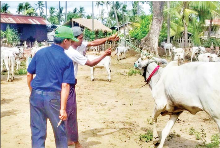
နေပြည်တော် ဥတ္တရသီရိမြို့နယ်တွင် နွားများကို ခွာနာလျာနာရောဂါကာကွယ်ဆေး အခမဲ့ ကွင်းဆင်းထိုးနှံပေးစဉ်။

၂၀၂၁ ခုနှစ် ဇွန်လမှစတင်ပြီး နေပြည်တော် ကောင်စီနယ်မြေ ခွာနာလျာနာရောဂါ ထိန်းချုပ်ရေး