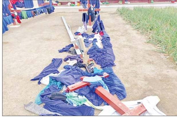
အဝတ်လှန်းတန်းနှင့် ဓာတ်တိုင်အား ဖျက်ဆီးထားသည့် မှတ်တမ်းဓာတ်ပုံများ။

ဖြစ်စဉ်တွင် အကျဉ်းသား ၁၅ ဦးခန့်သည် ၎င်းတို့၏ အိပ်ဆောင်များရှိ လှေကား သစ်သားလက်ရန်းတန်းများကို ချိုးဖျက်၍ လက်နက်အဖြစ်အသုံးပြုခြင်း၊ ဝန်ထမ်းများကို အကြမ်းဖက်တိုက်ခိုက် ရန်မူခြင်းတို့ကို ပြုလုပ်ခဲ့ကြပြီး အိပ်ဆောင်ဝင်းအနောက်ဘက်မှတစ်ဆင့် အုတ်ရိုးကျော်တက် ထွက်ပြေးရန် ကြိုးစားခဲ့ကြရာ တာဝန်ကျဝန်ထမ်းများက အကြမ်းဖက်မှုများမပြုလုပ်ရန် ဖျောင်းဖျေပြောဆိုခြင်း၊ မျှော်စင်တာဝန်ကျဝန်ထမ်းမှ သေနတ်ဖြင့် ခြောက်လှန့်ပစ်ခတ်ခြင်းများ ဆောင်ရွက်ခဲ့သော်လည်း အကျဉ်းသားများသည် နာခံမှုမရှိဘဲ အော်ဟစ်ပြီး CCTV ကြိုးများ ဖျက်ဆီးခြင်း၊ ဆိုလာဓာတ်မီးတိုင်အား ဖျက်ဆီးခြင်း၊ အနီးပတ်ဝန်းကျင်ရှိ ခဲများဖြင့် အစောင့်ဝန်ထမ်းများကို ပစ်ခတ်တိုက်ခိုက်ခြင်းများထပ်မံပြုလုပ်ခဲ့ကြသည်။