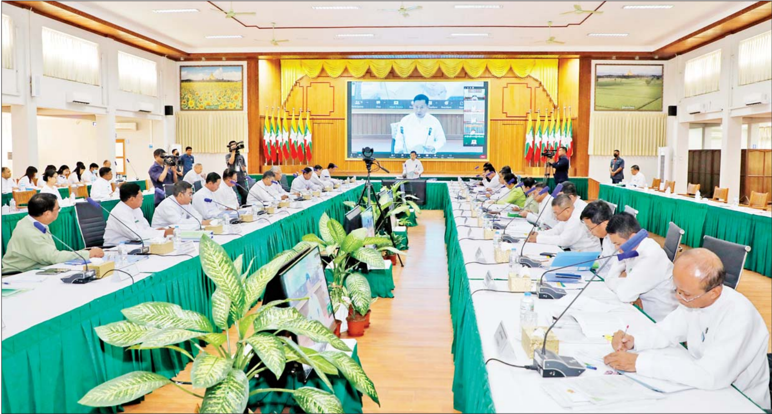
နိုင်ငံတော်စီမံအုပ်ချုပ်ရေးကောင်စီ ဒုတိယဥက္ကဋ္ဌ ဒုတိယဝန်ကြီးချုပ် ဒုတိယဗိုလ်ချုပ်မှူးကြီးစိုးဝင်း တောင်သူလယ်သမားအခွင့်အရေးကာကွယ်ရေးနှင့် အကျိုးစီးပွားမြှင့်တင်ရေး ဦးဆောင်အဖွဲ့ စုံညီအစည်းအဝေး (၁/၂၀၂၃) တွင် အမှာစကားပြောကြားစဉ်။

နေပြည်တော် မတ် ၁၄ တောင်သူလယ်သမား အခွင့်အရေး ကာကွယ်ရေးနှင့် အကျိုးစီးပွားမြှင့်တင်ရေး ဦးဆောင်အဖွဲ့ စုံညီအစည်းအဝေး (၁/၂၀၂၃) ကို ယနေ့မွန်းလွဲ ၁ နာရီခွဲတွင် နေပြည်တော်ရှိ စိုက်ပျိုးရေး၊ မွေးမြူရေးနှင့် ဆည်မြောင်းဝန်ကြီးဌာန အစည်းအဝေးခန်းမ၌ ကျင်းပရာ တောင်သူလယ်သမား အခွင့်အရေး ကာကွယ်ရေးနှင့် အကျိုးစီးပွားမြှင့်တင်ရေးဦးဆောင်အဖွဲ့ ခေါင်းဆောင် နိုင်ငံတော်စီမံအုပ်ချုပ်ရေးကောင်စီ ဒုတိယဥက္ကဋ္ဌ ဒုတိယဝန်ကြီးချုပ် ဒုတိယဗိုလ်ချုပ်မှူးကြီးစိုးဝင်း တက်ရောက် အမှာစကား ပြောကြားသည်။ တက်ရောက် အစည်းအဝေးသို့ တောင်သူလယ်သမား အခွင့်အရေးကာကွယ်ရေးနှင့် အကျိုးစီးပွားမြှင့်တင်ရေး ဦးဆောင်အဖွဲ့ အဖွဲ့ဝင်များဖြစ်ကြသည့် ပြည်ထောင်စုဝန်ကြီးများ၊ စာမျက်နှာ ၄ ကော်လံ ၁ သို့ ၀