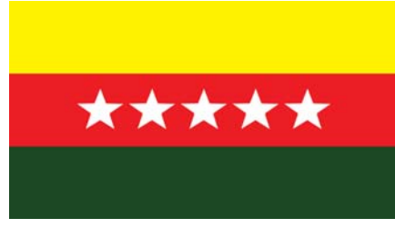
ရှမ်းနီ(တိုင်းလျှန်)သွေးစည်းညီညွတ်ရေးပါတီ [Shan-Ni Solidarity Party (S.S.P)] ၏ တံဆိပ်ပုံစံ