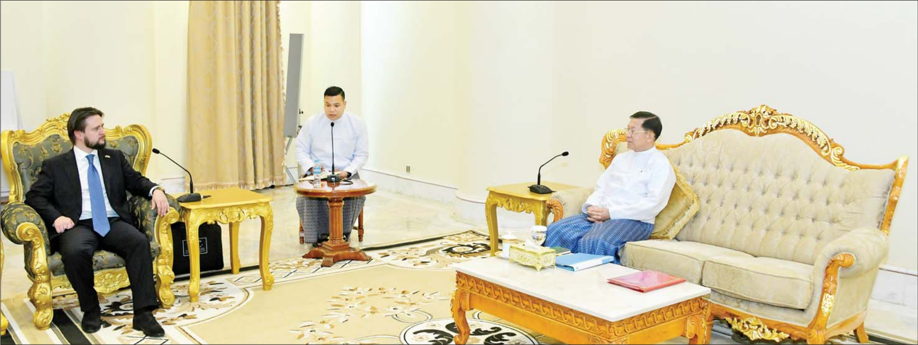
နိုင်ငံတော်စီမံအုပ်ချုပ်ရေးကောင်စီဥက္ကဋ္ဌ နိုင်ငံတော်ဝန်ကြီးချုပ် ဗိုလ်ချုပ်မှူးကြီး မင်းအောင်လှိုင်ထံ ရုရှားဖက်ဒရေးရှင်းနိုင်ငံ ရှေ့ကွန်ဂရက်ရင်းနှီးမြှုပ်နှံမှုရန်ပုံငွေအဖွဲ့မှ ညွှန်ကြားရေးမှူး Mr. SHATIROV Alexander Sergeevich က ဂါရဝပြုတွေ့ဆုံစဉ်။

မြန်မာနိုင်ငံမှထွက်ရှိသည့် စိုက်ပျိုးမွေးမြူရေးထုတ်ကုန်များ၊ ရေထွက်ပစ္စည်းများကို ရုရှားနိုင်ငံသို့ တင်ပို့နိုင်ရေးကိစ္စရပ်များနှင့် နှစ်နိုင်ငံအပြန်အလှန်ကုန်သွယ်မှု မြှင့်တင်ရေးဆိုင်ရာကိစ္စရပ်များဆွေးနွေး