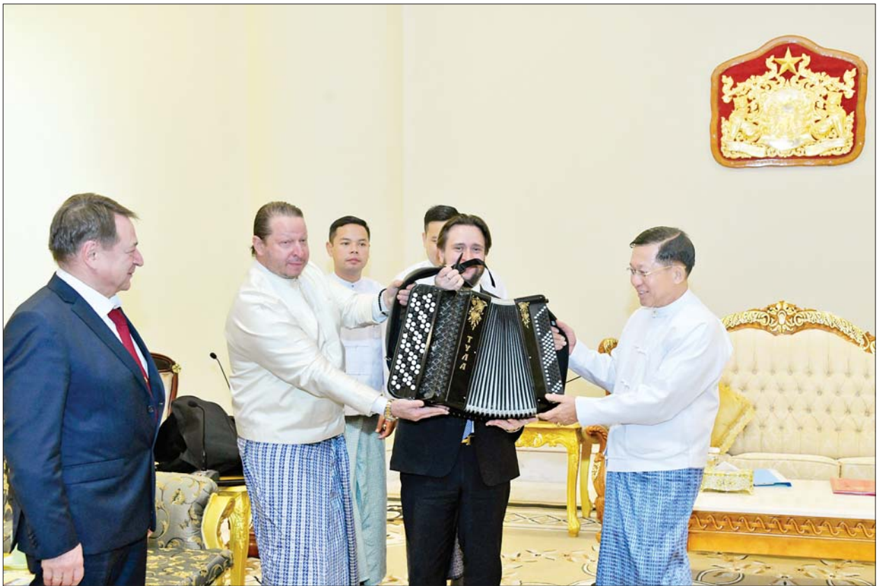
နိုင်ငံတော်စီမံအုပ်ချုပ်ရေးကောင်စီဥက္ကဋ္ဌ နိုင်ငံတော်ဝန်ကြီးချုပ် ဗိုလ်ချုပ်မှူးကြီးမင်းအောင်လှိုင်နှင့် ရှုရှားဖက်ဒရေးရှင်းနိုင်ငံ ရှေ့စွဲကွန်ဂရက် ရင်းနှီးမြှုပ်နှံမှုရန်ပုံငွေအဖွဲ့မှ ညွှန်ကြားရေးမှူး Mr. SHATIROV Alexander Sergeevich တို့ အမှတ်တရ လက်ဆောင်ပစ္စည်းများ အပြန်အလှန်ပေးအပ်ကြစဉ်။

တွေ့ဆုံပွဲသို့ နိုင်ငံတော်စီမံအုပ်ချုပ်ရေးကောင်စီဥက္ကဋ္ဌ နိုင်ငံတော် ဝန်ကြီးချုပ် ဗိုလ်ချုပ်မှူးကြီးမင်းအောင်လှိုင်နှင့်အတူ ကောင်စီတွဲဖက် အတွင်းရေးမှူး ဒုတိယဗိုလ်ချုပ်ကြီး ရဲဝင်းဦး၊ ရင်းနှီးမြှုပ်နှံမှုနှင့် နိုင်ငံခြားစီးပွားဆက်သွယ်ရေးဝန်ကြီးဌာန ပြည်ထောင်စုဝန်ကြီး ဒေါက်တာကော်တို့ တက်ရောက်ကြပြီး ရှုရှားဖက်ဒရေးရှင်းနိုင်ငံ ရှေ့စွဲကွန်ဂရက်ရင်းနှီးမြှုပ်နှံမှုရန်ပုံငွေအဖွဲ့မှ ညွှန်ကြားရေးမှူး Mr. SHATIROV Alexander Sergeevich နှင့်အတူ ကိုယ်စားလှယ်အဖွဲ့ဝင် များ၊ မြန်မာနိုင်ငံဆိုင်ရာ ရှုရှားဖက်ဒရေးရှင်းနိုင်ငံသံရုံးမှ တာဝန်ရှိသူများ တက်ရောက်ကြကြောင်း သိရသည်။