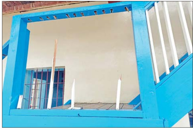
လှေကားလက်ရန်းတန်းမှ သစ်သားချောင်းများ ဖြုတ်ယူထားသည့် မှတ်တမ်းဓာတ်ပုံများ။