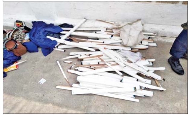
လှေကားလက်ရန်းတန်းမှ ဖြုတ်ယူထားသည့် သစ်သားချောင်းများ၏ မှတ်တမ်းဓာတ်ပုံ။