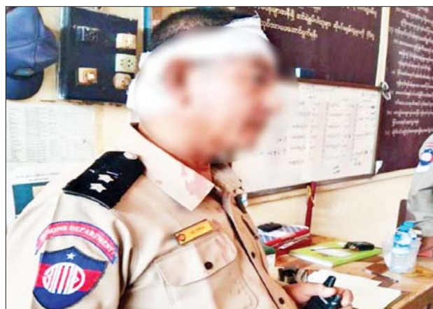
လည်ကုပ်ယာဘက်ပေါက်ပြဒဏ်ရာတစ်ချက်၊ ယာလက်သန်းပြတ်ရှဒဏ်ရာတစ်ချက်ထိခိုက်ဒဏ်ရာရရှိခဲ့သည့် ဒုတိယကြီးကြပ်ရေးမှူး၏ မှတ်တမ်းဓာတ်ပုံ။

ဖြစ်စဉ်နှင့်ပတ်သက်၍ ပဏာမစစ်စစ်မှုအရ သိရှိရသည်မှာ အကြမ်းဖက်ပြစ်မှုများ ကျူးလွန်ခဲ့ကြပြီး ပြစ်ဒဏ်ကျခံနေရသော အကျဉ်းသားအချို့ကဦးဆောင်၍ ထွက်ပြေးရန် ကြံစည်ကြိုးပမ်းခဲ့ခြင်းကြောင့်