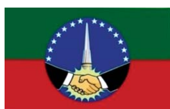
လူထုပါတီ (The Party for People) ၏ တံဆိပ်ပုံစံ