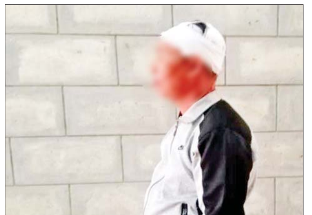
ဦးခေါင်းထိပ် ပေါက်ပြဒဏ်ရာတစ်ချက်(ရစ်ချက်ချုပ်)၊ ဝဲလက်ဖျံပြတ်ရှဒဏ်ရာတစ်ချက်၊ ဝဲလက်ညှိုးပြတ်ရှဒဏ်ရာတစ်ချက် ရရှိသည့် အကျဉ်းထောင်တပ်ကြပ်၏ မှတ်တမ်းဓာတ်ပုံ။

အခြားအကျဉ်းသားများကလည်း ပါဝင်ခဲ့ကြခြင်းဖြစ်ပြီး ဖြစ်စဉ်မှန်ပေါ်ပေါက်စေရေးအတွက် လုပ်ထုံးလုပ်နည်းနှင့်အညီ ဆက်လက် စစ်စစ်