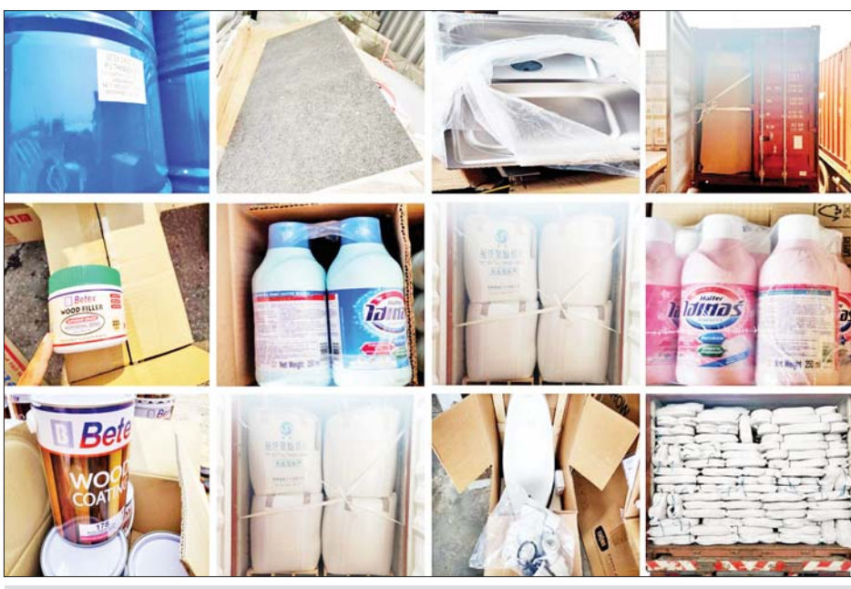
အေးရှားဝေါလ်ကုန်သေတ္တာစစ်ဆေးရေးစခန်း၌ သိမ်းဆည်းရမိမှု။

တန်ဖိုးငွေကျပ် ၈၄၈၅၅၆၁၇)ကို သိမ်းဆည်းရမိခဲ့ပြီး အကောက်ခွန် လုပ်ထုံးလုပ်နည်းနှင့်အညီ အရေးယူဆောင်ရွက်လျက်ရှိသည်။ အလားတူ မတ် ၇ ရက်တွင် မန္တလေးတိုင်းဒေသကြီး တရားမဝင်ကုန်သွယ်မှုတိုက်ဖျက်ရေးအထူးအဖွဲ့၏ စီမံခန့်ခွဲမှုဖြင့် ၁၆ မိုင်ကျောက်ချောစစ်ဆေးရေးစခန်း၌ တာဝန်ကျပူးပေါင်းအဖွဲ့က စစ်ဆေးမှုများဆောင်ရွက်ခဲ့ရာ မူဆယ်မှ မန္တလေးမြို့သို့ ထွက်ခွာလာသော မော်တော်ယာဉ် သုံးစီးပေါ်မှ သွင်းကုန်ကြေညာလွှာတွင် ကြေညာထားသည်ထက် ပိုမိုပါရှိသော စက်မှုကုန်ကြမ်းအထည်အလိပ်များ ကီလိုဂရမ် ၅၀၀၀ (ခန့်မှန်းတန်ဖိုးငွေကျပ် ၅၃၅၇၀၉၀)နှင့် အဆိုပါပစ္စည်းများ တင်ဆောင်သော Chenglong Tractor Head တစ်စီး၊ Beiben Tractor Head တစ်စီး၊ Mitsubishi Fuso Tractor Head တစ်စီးနှင့်နောက်တွဲ ယာဉ်သုံးတွဲ(ခန့်မှန်းတန်ဖိုးငွေကျပ် ၂၀၀၀၀၀၀) စုစုပေါင်း(ခန့်မှန်းတန်ဖိုးငွေကျပ် ၂၁၅၃၅၇၀၉၀)ကို သိမ်းဆည်းရမိခဲ့ပြီး အကောက်ခွန်လုပ်ထုံး လုပ်နည်းနှင့်အညီ အရေးယူဆောင်ရွက်လျက်ရှိသည်။ ထို့အတူ စစ်ကိုင်းတိုင်းဒေသကြီး တရားမဝင်ကုန်သွယ်မှုတိုက်ဖျက်ရေးအထူးအဖွဲ့၏ စီမံခန့်ခွဲမှုဖြင့် စစ်ဆေးမှုများဆောင်ရွက်ခဲ့ရာ မတ် ၉ ရက်တွင် ကလေးဝမြို့နယ်အတွင်း၌ မြန်မာနိုင်ငံရဲတပ်ဖွဲ့ဦးဆောင်သော စစ်ဆေးရေးအဖွဲ့က လိုင်စင်မဲ့ မော်တော်ဆိုင်ကယ်များဖြစ်သည့် Canda 125 တစ်စီး၊ New Anbo တစ်စီး (ခန့်မှန်းတန်ဖိုးငွေကျပ် ၂၀၀၀၀၀)ကို ပို့ကုန်သွင်းကုန်ဥပဒေအရ လည်းကောင်း၊ မတ် ၁၀ ရက်တွင် စစ်ကိုင်းမြို့အဝင်ပူးပေါင်းစစ်ဆေးရေးဂိတ်၌ တာဝန်ကျပူးပေါင်း