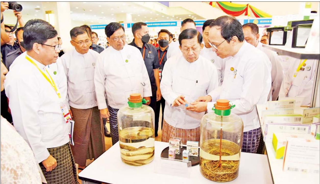
နိုင်ငံတော်စီမံအုပ်ချုပ်ရေးကောင်စီဥက္ကဋ္ဌ နိုင်ငံတော်ဝန်ကြီးချုပ် ဗိုလ်ချုပ်မှူးကြီး မင်းအောင်လှိုင် မြန်မာနိုင်ငံ ကျန်းမာရေးပညာရပ်ဆိုင်ရာ နှီးနှောဖလှယ်ပွဲ ၂၀၂၃ တွင် ခင်းကျင်းပြသထားသည့် ပြခန်းများအတွင်း လှည့်လည်ကြည့်ရှုစဉ်။

အရည်အချင်းပြည့်ဝသည့် ကျန်းမာရေးလူ့စွမ်းအားအရင်းအမြစ် များ မွေးထုတ်ပေးနိုင်ရေးအတွက် ဆေးနှင့် ဆေးပညာနီးနွယ်တက္ကသိုလ် ၁၆ ခု၊ သူနာပြုနှင့် သားဖွားသင်တန်းကျောင်း ၅၃ ကျောင်းတို့ကို ဖွင့်လှစ်ပြီး သင်ရိုးညွှန်းတမ်းများကို လိုအပ်ချက်နှင့်အညီ ပြုပြင် ပြောင်းလဲပြီး သင်ကြားပေးလျက်ရှိပါကြောင်း၊ ယခုဆေးပညာသင်ရိုး ညွှန်းတမ်းကို နိုင်ငံတကာအဆင့်မီဖြစ်စေရန် မျှော်မှန်းရလဒ် အခြေခံ သည့် စုစည်းချိတ်ဆက် သင်ကြားခြင်းစနစ်ကို ပြောင်းလဲသင်ကြား လျက်ရှိပြီး ကျန်းမာရေးပညာရှင်များအကြား ယှဉ်တွဲလေ့လာ သင်ယူမှု (Inter-Professional Education)နှင့် လက်တွေ့ပူးပေါင်း ဆောင်ရွက်တတ်စေရေးတို့ကိုပါ ထည့်သွင်းသင်ကြားပေးလျက်