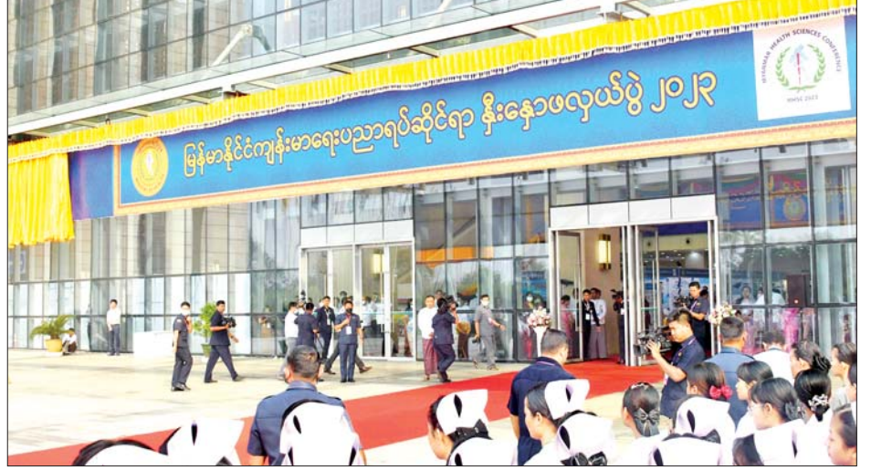
နိုင်ငံတော်စီမံအုပ်ချုပ်ရေးကောင်စီဥက္ကဋ္ဌ နိုင်ငံတော်ဝန်ကြီးချုပ် ဗိုလ်ချုပ်မှူးကြီး မင်းအောင်လှိုင် မြန်မာနိုင်ငံ ကျန်းမာရေးပညာရပ်ဆိုင်ရာနှီးနှောဖလှယ်ပွဲ ၂၀၂၃ ဖွင့်ပွဲအထိမ်းအမှတ် မုခ်ဦးကို စက်ခလုတ်နှိပ် ဖွင့်လှစ်ပေးစဉ်။