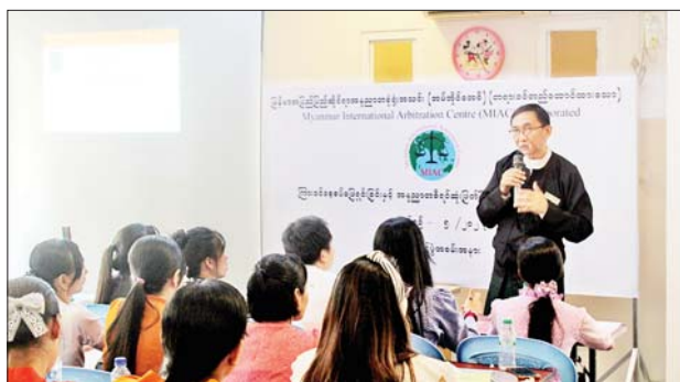
အပတ်စဉ်စနေနေ့တိုင်း နံနက် ၉ နာရီမှ ညနေ ၄ နာရီအထိ ဆရာကြီး ဆရာမကြီး ၁၀ ဦးက အလှည့်ကျသင်ကြားပို့ချမည်ဖြစ်ကြောင်း သိရသည်။ မောင်မောင်(လျှပ်စစ်)

ရှင်းလင်းဆွေးနွေးသည်။ ယင်းနောက် အခမ်းအနားသို့ တက်ရောက်လာကြသော သင်တန်းနည်းပြဆရာကြီး ဆရာမကြီးများ၊ သင်တန်းသား သင်တန်းသူများက တစ်ဦးချင်းမိတ်ဆက်စကားပြောကြားကြပြီး သင်တန်းတာဝန်ခံဆရာကြီးဦးကျွန်းခေါင်က သင်တန်းဖွင့်လှစ်ခြင်း၏ရည်ရွယ်ချက်များ၊ နောင်ဆက်လက်ဖွင့်လှစ်သွားမည့်သင်တန်းများနှင့် အခြေခံသင်ကြားရမည့်ဘာသာရပ်များအကြောင်း ရှင်းလင်းဆွေးနွေးသည်။ ထို့နောက် သင်တန်းသား သင်တန်းသူများက သိလိုသည်များ မေးမြန်းရာ သင်တန်းနည်းပြဆရာကြီး ဆရာမကြီးများက ဖြေကြားပေးကြသည်။ သင်တန်းကာလမှာ မတ် ၁၁ ရက်မှ ဧပြီ ၁ ရက်အထိ