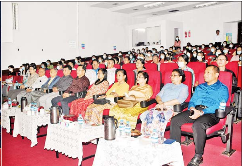
ပြည်ထောင်စုဝန်ကြီး ဦးမောင်မောင်အုန်း (၇၈)နှစ်မြောက် တပ်မတော်နေ့ကို ကြိုဆိုဂုဏ်ပြုသောအားဖြင့် ရိုက်ကူးထုတ်လွှင့်နေသည့် “ပြည်ချစ်သားမွန် တေးသံဝဏ်” တေးဂီတဖျော်ဖြေပွဲ ပွဲစဉ်(၃) တိုက်ရိုက် Live ရိုက်ကူးထုတ်လွှင့်နေမှုကို ကြည့်ရှုအားပေးစဉ်။

သိမ်မွေ့ပြီး အသိအမြင်၊ ဗဟုသုတပြည့်စုံသည့် လူပတ်ဝန်းကျင်နှင့် ယဉ်ကျေးသိမ်မွေ့ပြီး အသိအမြင်၊ ဗဟုသုတပြည့်စုံသည့် နိုင်ငံ၏ လူ့စွမ်းအားအရင်းအမြစ်များ ဖြစ်သည့် ပညာရှင်များ ပေါ်ထွက်လာမည် ဖြစ်ကြောင်း၊ ထို့ကြောင့် ဖွံ့ဖြိုးတိုးတက်သည့် လူမျိုး၊ ဖွံ့ဖြိုးတိုးတက်သည့် လူပတ်ဝန်းကျင်နှင့် ဖွံ့ဖြိုးတိုးတက်သည့် နိုင်ငံဖြစ်လာစေရေးနှင့် ပြည်သူများ၏ လူမှုစီးပွားဘဝများ တိုးတက်လာစေရေးအတွက် ပြည်သူတိုင်းစာဖတ်ကြပြီး စာဖတ်ခြင်းဖြင့် မိမိဘဝ၊ မိသားစုဘဝ၊ မိမိပတ်ဝန်းကျင်နှင့် နိုင်ငံဖွံ့ဖြိုးတိုးတက်ရေးလုပ်ငန်းများတွင် တစ်ဖက်တစ်လမ်းမှ ပါဝင်ဆောင်ရွက်နိုင်ကြပါစေကြောင်း ပြောကြားသည်။