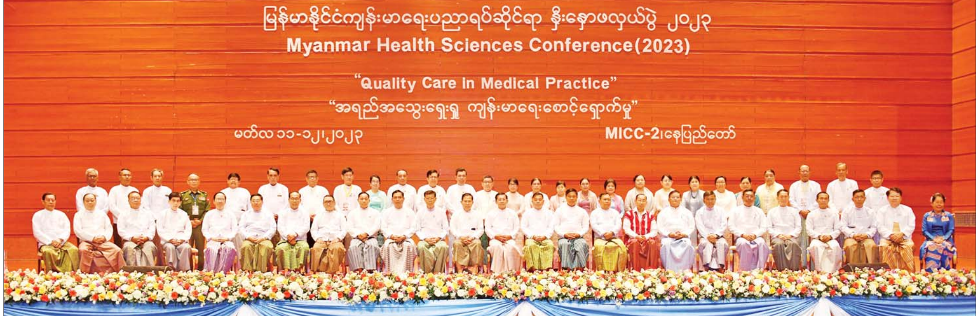
မြန်မာနိုင်ငံကျန်းမာရေးပညာရပ်ဆိုင်ရာ နှီးနှောဖလှယ်ပွဲ ၂၀၂၃ Myanmar Health Sciences Conference(2023)

“Quality Care In Medical Practlce” “အရည်အသွေးရေးရှု ကျန်းမာရေးစောင့်ရှောက်မှု”