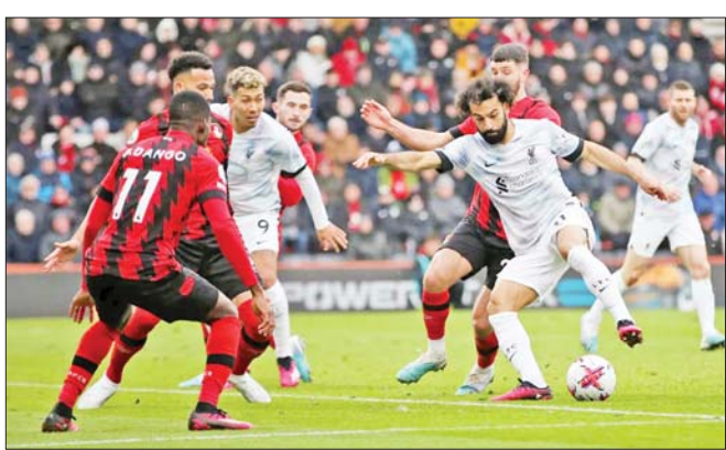
ခဲ့တဲ့ လီဗာပူးအသင်းဟာ အခုပွဲစဉ်မှာ အနိုင်သုံးမှတ်ဆုံးရှုံးခဲ့ရလို့ အမှတ်ပေးဇယားအဆင့် ၅ နေရာမှာ ဆက်လက်ရပ်တည်ခဲ့ရတာဖြစ်ပါတယ်။ ငွေကြယ်

ပရီမီယာလိဂ်ပွဲစဉ် ၂၇ ရဲ့ မတ် ၁၁ ရက်ညပိုင်း အစောဆုံးပွဲစဉ်အဖြစ် ယှဉ်ပြိုင်ကစားခဲ့တဲ့ ဘုန်းမောက်အသင်းနဲ့ လီဗာပူးအသင်းတို့ပွဲစဉ်မှာ ဘုန်းမောက်အသင်းက လီဗာပူးအသင်းကို တစ်ဂိုး-ဂိုးမရှိဖြင့် အနိုင်ရရှိခဲ့ပါတယ်။ အဲဒီပွဲစဉ်မှာ ဘုန်းမောက်အသင်းက ပွဲကစားချိန် ၂၈ မိနစ်မှာ သွင်းယူခဲ့တဲ့ ဘီလင်းရဲ့ တစ်လုံးတည်းသောသွင်းဂိုးနဲ့ အနိုင်ရရှိခဲ့တာဖြစ်ပြီး လီဗာပူးအသင်းကတော့ ပွဲကစားချိန် မိနစ် ၇၀ မှာ ပင်နယ်တီ ပြစ်ဒဏ်ဘောကန်ခွင့်ရရှိခဲ့ပေမယ့် တိုက်စစ်မှူး ဆာလာက ဂိုးအဖြစ် မပြောင်းလဲနိုင်ခဲ့တာကြောင့် အဝေးကွင်းမှာ အရေးနိမ့်ခဲ့ရတာဖြစ်ပါတယ်။ ဘုန်းမောက်အသင်းဟာ လီဗာပူးအသင်းကို အနိုင်ရရှိခဲ့တာကြောင့် ပရီမီယာလိဂ်ပွဲစဉ် ၂၆ ပွဲကစားပြီးချိန်မှာ ရမှတ် ၂၄ မှတ်ရရှိခဲ့ကာ တန်းဆင်းဇုန်အတွင်းမှ ရုန်းထွက်နိုင်ခဲ့ပြီး အမှတ်ပေးဇယားအဆင့် ၁၆ နေရာကို ယာယီတက်လှမ်းခွင့်ရရှိခဲ့ပြီ ဖြစ်ပါတယ်။ ပြီးခဲ့တဲ့ ပရီမီယာလိဂ်ပွဲစဉ်မှာ မန်ယူအသင်းကို ခုနစ်ဂိုးပြတ်နဲ့ အနိုင်ရရှိ