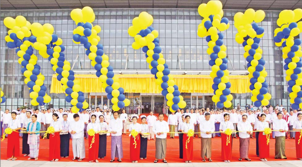
နိုင်ငံတော်စီမံအုပ်ချုပ်ရေးကောင်စီဒုတိယဥက္ကဋ္ဌ ဒုတိယဝန်ကြီးချုပ် ဒုတိယဗိုလ်ချုပ်မှူးကြီးစိုးဝင်း၊ ကျန်းမာရေးဝန်ကြီးဌာန ပြည်ထောင်စုဝန်ကြီး၊ ဆေးဝန်ထမ်းညွှန်ကြားရေးမှူး၊ မြန်မာနိုင်ငံဆေးကောင်စီဥက္ကဋ္ဌ၊ မြန်မာနိုင်ငံ သွားနှင့်ခံတွင်းဆိုင်ရာဆေးကောင်စီဥက္ကဋ္ဌ၊ မြန်မာနိုင်ငံ သူနာပြုနှင့် သားဖွားကောင်စီဥက္ကဋ္ဌနှင့် မြန်မာနိုင်ငံဆေးပညာရှင်အဖွဲ့ ဒုတိယဥက္ကဋ္ဌတို့က မြန်မာနိုင်ငံ ကျန်းမာရေးပညာရပ်ဆိုင်ရာ နှီးနှောဖလှယ်ပွဲ ၂၀၂၃ ဖွင့်ပွဲအထိမ်းအမှတ် မုခ်ဦးကို ဖြတ်ဖြင့်လှစ်ပေးကြစဉ်။

ပြုလုပ်မည်ဖြစ်ပြီး နှီးနှောဖလှယ်ပွဲ၏ ရည်ရွယ်ချက်များမှာ နေပြည်တော်၊ တိုင်းဒေသကြီး/ ပြည်နယ်များရှိ ကျန်းမာရေးနယ်ပယ်အသီးသီးမှ ပညာရှင်များ ချစ်ကြည်ရင်းနှီးမှုရရှိစေရန်နှင့် အပြန်အလှန် ပေါင်းစပ်ညှိနှိုင်းသင်ကြားရေးနှင့် ကုသရေးကိစ္စရပ်များ ဖွံ့ဖြိုးတိုးတက်လာစေရန် ကျန်းမာရေးကဏ္ဍနယ်ပယ်စုံမှ ပညာရှင်များပါဝင်ဆင်နွှဲစေခြင်းဖြင့် ခေတ်မီဆေးပညာရပ်များ ဖွံ့ဖြိုးတိုးတက်မှုများနှင့် ပတ်သက်၍ သိရှိနားလည်နိုင်စေရန်၊ ဆေးနှင့် ဆေးနီးနှယ်ပညာရှင်များအနေဖြင့် တိုးတက်ပြောင်းလဲနေသော ဆေးပညာရပ်များအား စဉ်ဆက်မပြတ် လေ့လာဆည်းပူးလိုစိတ်များ ဖြစ်ထွန်းစေရန် ပြည်သူလူထုအား အရည်အသွေးပြည့်ဝသော ကျန်းမာရေးစောင့်ရှောက်မှုများ ပေးရာတွင် အထောက်အကူပြုနိုင်စေရန် စသည့် ရည်ရွယ်ချက်များဖြင့် ကျင်းပပြုလုပ်ခြင်းဖြစ်သည်ဟု သိရှိကြောင်း။ နိုင်ငံတော်စီမံအုပ်ချုပ်ရေးကောင်စီအနေဖြင့် တိုင်းရင်းသားပြည်သူများ၏ ကျန်းမာရေးအဆင့်အတန်း တိုးတက်မြှင့်တင်ရေးအတွက် စဉ်ဆက်မပြတ် အားပေးဆောင်ရွက်လျက်ရှိသည်ကို အားလုံးသိရှိပြီး ဖြစ်ကြောင်း၊ ကမ္ဘာပေါ်တွင်ရှိသည့် နိုင်ငံအသီးသီးမှ ပြည်သူ့အပေါင်း၏