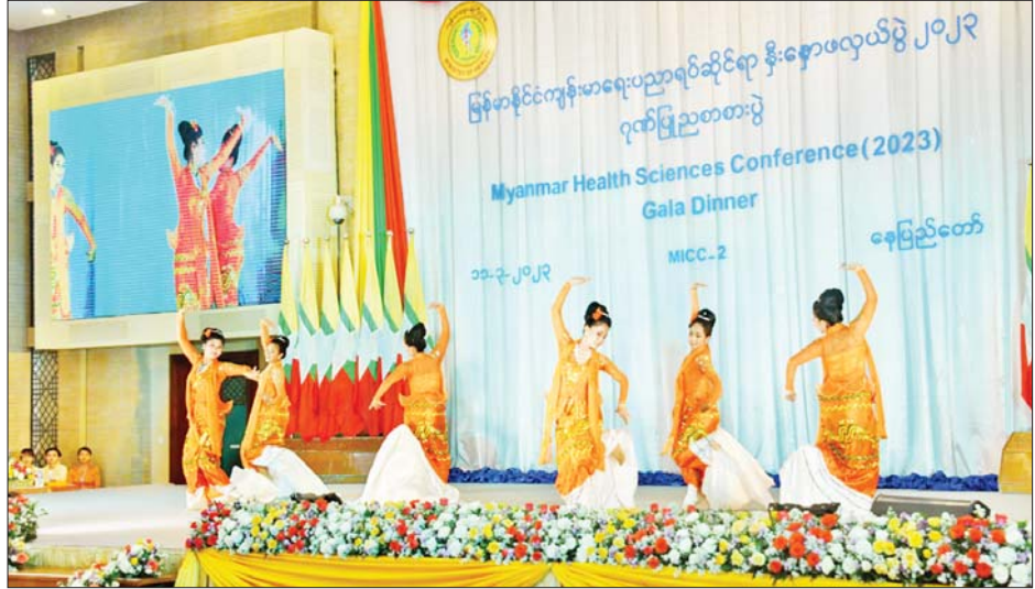
မြန်မာနိုင်ငံကျန်းမာရေးပညာရပ်ဆိုင်ရာ နီးနှောဖလှယ်ပွဲ ၂၀၂၃ အထိမ်းအမှတ် ဂုဏ်ပြုညစာစားပွဲတွင် အနုပညာဦးစီးဌာနမှ အနုပညာရှင်များက ကပြဖျော်ဖြေကြစဉ်။