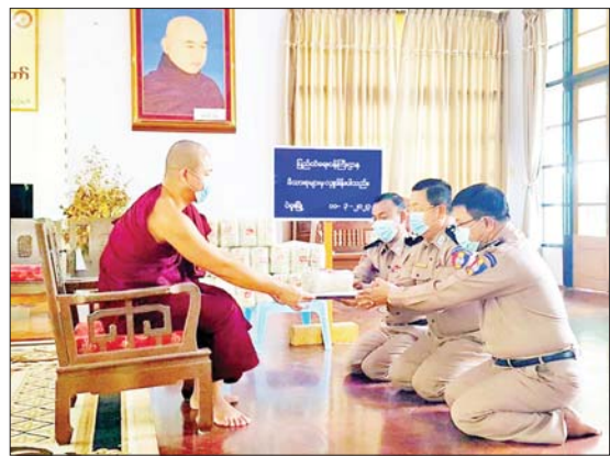
မန္တလေးတိုင်းဒေသကြီး အမရပူရမြို့နယ်ရှိ ပိဋကတ်ကျောင်းတိုက်နှင့် အောင်မြေသာစံမြို့နယ်ရှိ ဥဿာကျောင်းတိုက်၊ ရန်ကုန်တိုင်းဒေသကြီး လှိုင်သာယာ (အနောက်ပိုင်း)မြို့နယ်ရှိ ပဒံပရိယတ္တိစာသင်တိုက်၊ ရှမ်းပြည်နယ် လားရှိုးမြို့နယ်ရှိ ရွှေလရောင်ကျောင်းတိုက်တို့သို့ ဆန်ကြာဆံများကိုလည်းကောင်း ဆရာတော်၊ သံဃာတော်များအတွက်တာဝန်ရှိသူများက သွားရောက်ဆက်ကပ်လှူဒါန်းခဲ့ကြောင်း သိရသည်။

နေပြည်တော် မတ် ၁၁ ပြည်ထဲရေးဝန်ကြီးဌာန တပ်ဖွဲ့ဝင်/ဝန်ထမ်း အရာထမ်း၊ အမှုထမ်းမိသားစုများက မြို့နယ်အသီးသီးရှိ ဘုန်းတော်ကြီးကျောင်းများသို့ ဆွမ်းဆန်တော်နှင့် ဆန်ကြာဆံများ ဆက်ကပ်လှူဒါန်းခြင်းကို ဆောင်ရွက်လျက်ရှိသည်။