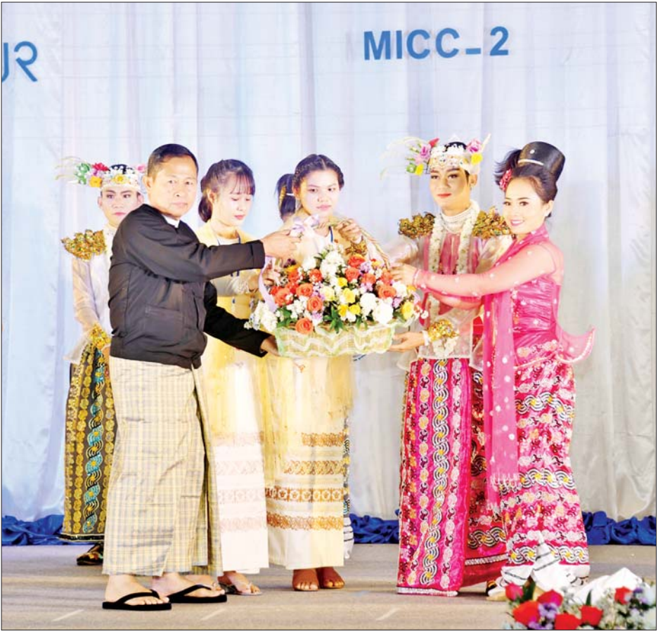
နိုင်ငံတော်စီမံအုပ်ချုပ်ရေးကောင်စီ ဒုတိယဥက္ကဋ္ဌ ဒုတိယဝန်ကြီးချုပ် ဒုတိယဗိုလ်ချုပ်မှူးကြီး စိုးဝင်းက ပြဖျော်ဖြေကြသည့် အနုပညာရှင်များအား ဂုဏ်ပြုပန်းခြင်း ပေးအပ်စဉ်။