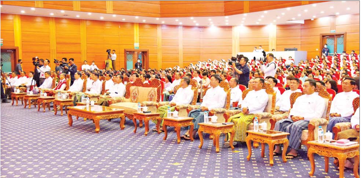
နိုင်ငံတော်စီမံအုပ်ချုပ်ရေးကောင်စီဥက္ကဋ္ဌ နိုင်ငံတော်ဝန်ကြီးချုပ် ဗိုလ်ချုပ်မှူးကြီး မင်းအောင်လှိုင် မြန်မာနိုင်ငံ ကျန်းမာရေးပညာရပ်ဆိုင်ရာနီးနောဖလှယ်ပွဲ (၂၀၂၃) ဖွင့်ပွဲအခမ်းအနားတွင် အမှာစကားပြောကြားစဉ်။