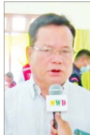
ဒေသခံပြည်သူများ

တဲ့အတွက် နုတ်ချင်လို့ပါ။ သွားရောဂါပေါ့။ ဒါကိုကုသချင်တဲ့ ဆန္ဒနဲ့ ဒီကိုလာခဲ့တယ်။ ကျွန်တော် တို့ မာန်အောင်မြို့နယ်အတွက် သွားဘက်ဆိုင်ရာကိစ္စနဲ့ပတ်သက် လို့ အခက်အခဲတွေ အများကြီး ရှိပါတယ်။ အခုလိုလာရောက်ပြီး ကုသပေးတာ၊ အခုလိုတကူးတက လာပြီး ဆောင်ရွက်ပေးတာ ကြောင့် ကျွန်တော်တို့အနေနဲ့ လည်း ကုသဖြစ်တယ်။ ကျွန်တော့် အနေနဲ့လည်း အထူးပဲဝမ်းသာ တယ်။ ကျွန်တော်တို့ မာန်အောင် မြို့မှာက အထွေထွေရောဂါဆေးကု ဌာန တစ်ခုပဲရှိပါတယ်။ ဒါပေမဲ့ အခုဒီနေရာမှာ နား၊ နှာခေါင်း၊ လည်ချောင်း၊ မျက်စိ၊ သွားဘက် ဆိုင်ရာရယ် အဘက်ဘက်က စုံလာတဲ့အတွက် ကုသမှုကလည်း သူ့ကဏ္ဍနဲ့သူ၊ သူ့ဌာနနဲ့သူ သီးခြားစီ ခွဲထားတော့ ပိုပြီး အဆင်ပြေတယ်လို့ မြင်မိပါတယ်။ အတတ်နိုင်ဆုံး ကြိုးစားပြီးတော့