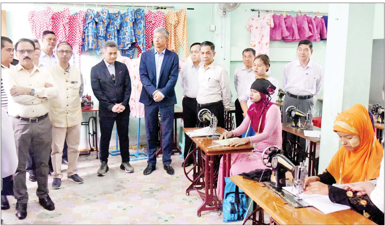
ပြည်ထောင်စုဝန်ကြီး ဦးကိုကိုလှိုင်နှင့်အဖွဲ့ အိမ်တွင်းမုသက်မွေးလုပ်ငန်းပညာသင်ကျောင်း၌ အခြေခံစက်ချုပ်သင်တန်းတွင် တက်ရောက်သင်ကြားလျက်ရှိသည့် IDP စခန်းများမှ အမျိုးသမီးများကို ရင်းရင်းနှီးနှီးတွေ့ဆုံစဉ်။

ထို့နောက်ပြည်ထောင်စုဝန်ကြီးနှင့် အဖွဲ့သည် စစ်တွေမြို့ရှိ အိမ်တွင်းမု သက်မွေးလုပ်ငန်းပညာသင်ကျောင်း၌ မတူကွဲပြားမှုများရှိသော်လည်း အတူတကွ ငြိမ်းချမ်းစွာ ယှဉ်တွဲနေထိုင်ရန်နှင့် ပြဿနာများကို အတူတကွ ပူးပေါင်းဖြေရှင်းနိုင်ရန် ရည်ရွယ်၍ ဖွင့်လှစ်သည့် လူမှုသဟဇာတနှင့် လူမှုပေါင်းစည်းရေးဆိုင်ရာ (ဆင့်ပွား)သင်တန်းသို့ ရောက်ရှိရာ သင်တန်းကျောင်းမှ တာဝန်ရှိသူတစ်ဦးက သင်တန်းနှင့် စပ်လျဉ်း၍ ရှင်းလင်းတင်ပြကာ သင်တန်းတွင် သင်ကြားနေမှုများကို ကြည့်ရှုအားပေးကြသည်။ ဆက်လက်၍ ပြည်ထောင်စုဝန်ကြီးနှင့်အဖွဲ့သည် အိမ်တွင်းမု သက်မွေးလုပ်ငန်း ပညာသင်ကျောင်း၌ စက်ချုပ်အတတ်ပညာဖြင့် လူမှုဘဝရပ်တည်နိုင်ရေးအတွက် ရည်ရွယ်၍ ဖွင့်လှစ်သည့်