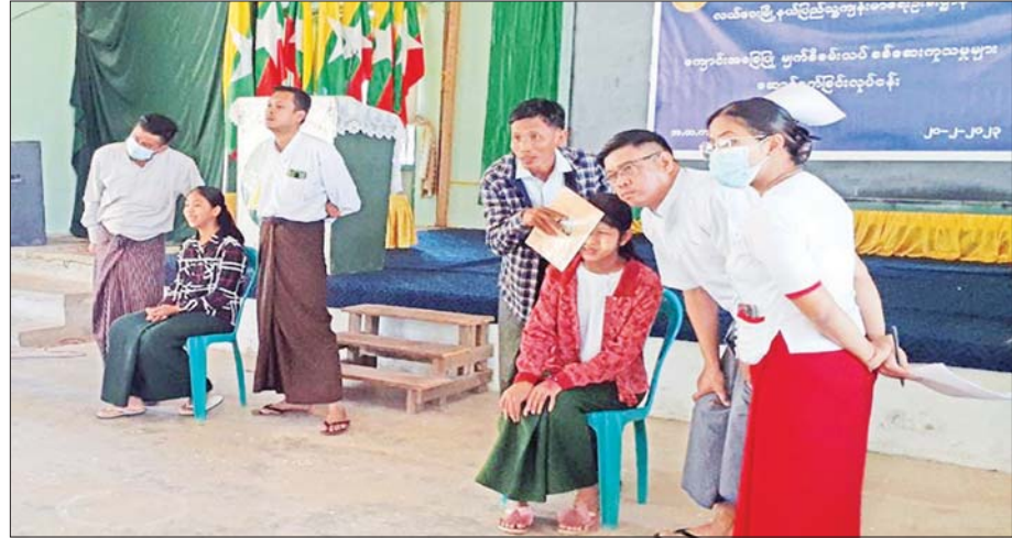
လယ်ဝေးမြို့နယ်၌ ကျောင်းအခြေပြု မျက်စိစစ်ဆေးဆောင်ရွက်စဉ်။

ထို့အပြင် နိုင်ငံ၏ ကျန်းမာရေးစောင့်ရှောက်မှု အဆင့်အတန်း တိုးတက်မြှင့်တင်ရေးနှင့် ပြည်သူ့တစ်ရပ်လုံး သက်တမ်းစေ့ အသက်ရှည်စွာ နေထိုင်နိုင်ရေး၊ ရောဂါဘယကင်းဝေးစေရေးအတွက် ဦးတည်ချက်ထားပြီး ကျန်းမာရေးဝန်ကြီးဌာန၏ နေ့ညမပြတ် ကြိုးပမ်းဆောင်ရွက်မှုများအပေါ် ၏ “မြန်မာနိုင်ငံ ကျန်းမာရေးပညာရပ်ဆိုင်ရာ နှီးနှောဖလှယ်ပွဲ”က ၎င်းရည်ရွယ်ချက်များကို အောင်မြင်စေရန် ကြိုးပမ်းဆောင်ရွက်အဖွဲ့ကောင်း တစ်ခု ဖြစ်စေမည်ဟု လေးလေးနက်နက်ယုံကြည်မိ ကြောင်း ရေးသားတင်ပြအပ်ပါသည်။ ။