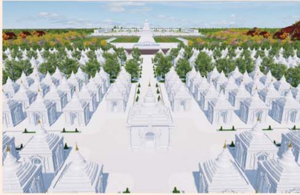
ကျောက်စာရုံစေတီ(၁၂ x ၁၂ x ၁၈)ပေ ၁ ဆူ တန်ဖိုး-၂၇၉ သိန်း