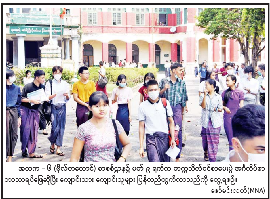
အထက - ၆ (ဗိုလ်တထောင်) စာစစ်ဌာန၌ မတ် ၉ ရက်က တက္ကသိုလ်ဝင်စာမေးပွဲ အင်္ဂလိပ်စာ ဘာသာရပ်ဖြေဆိုပြီး ကျောင်းသား ကျောင်းသူများ ပြန်လည်ထွက်လာသည်ကို တွေ့ရစဉ်။