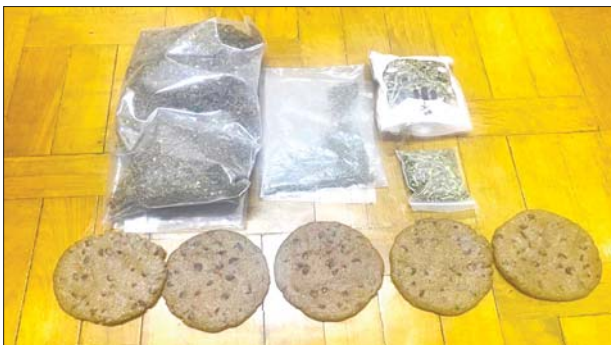
မတ် ၈ ရက်တွင် ရန်ကုန်တိုင်းဒေသကြီး လမ်းမတော်မြို့နယ်၌ Cookie မုန့်များတွင် ဆေးခြောက်များထည့်၍ ရောင်းချသည့် တရားခံများ ဖမ်းဆီးရမိမှု မှတ်တမ်းဓာတ်ပုံများ။