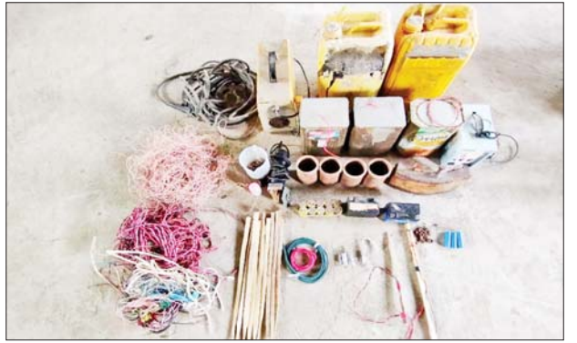
PDF အမည်ခံ အကြမ်းဖက်သမားများ သိုဝှက်သိမ်းဆည်းထားသည့်ပစ္စည်းများ သိမ်းဆည်းရမိမှု မှတ်တမ်းဓာတ်ပုံ။

ကျည်မျိုးစုံ ၈၈ တောင့်၊ လက်လုပ်ဗုံးသီး ၁၈ လုံး၊ ဝရိန်စက် တစ်လုံး၊ ကျောက်ဖြတ်စက်တစ်လုံး၊ လွန်စက်တစ်လုံး၊ ဒီတိုနေတာသုံးခု၊ ဆိုင်ကယ်မျိုးစုံ ခြောက်စီးနှင့် ဆက်စပ်ပစ္စည်းများ၊ ဆီ ၁၀ ပိဿာနှင့် ဆန်ခြောက်အိတ်တို့ကို တွေ့ရှိသိမ်းဆည်းရမိခဲ့သည်။