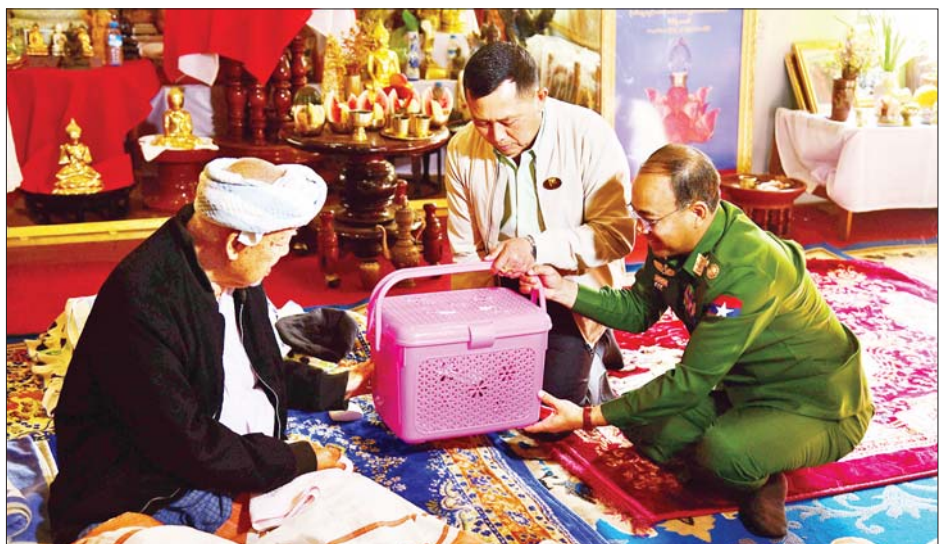
ဝန်ထမ်းများအား ထောက်ပံ့ငွေပေးအပ်ခဲ့သည်။ ဘဒ္ဒန္တတေဇနိယအား ဖူးမြော်ကြည့်ညိုကာ လှူဖွယ်ဝတ္ထုပစ္စည်းနှင့် နဝကမ္မအလှူငွေများ ဆက်ကပ်လှူဒါန်းခဲ့ကြောင်း သိရသည်။ ပြည်နယ်(ပြန်/ဆက်)

အတွင်း လှည့်လည်ကြည့်ရှုစစ်ဆေး၍ ဆေးကုသမှုခံယူနေသော ဒေသခံပြည်သူများကို အားပေးစကားပြောကြား၍ ထောက်ပံ့ပစ္စည်းများ ပေးအပ်ခဲ့ပြီး ဆေးရုံတွင် တာဝန်ထမ်းဆောင်နေသော ဝန်ထမ်းများအား ထောက်ပံ့ငွေပေးအပ်ခဲ့ကြောင်း သိရသည်။ ထို့နောက် ပြည်နယ်ဝန်ကြီးချုပ် ဦးအောင်ဇော်အေး၊ အရှေ့အလယ်ပိုင်းတိုင်းစစ်ဌာနချုပ်တိုင်းမှူး ဗိုလ်ချုပ်မှူးမင်းထွန်း၊ ပြည်နယ်ဝန်ကြီးများ၊ ပြည်နယ်အစိုးရအဖွဲ့အတွင်းရေးမှူး၊ ပြည်နယ်အဆင့် ဌာနဆိုင်ရာများနှင့် တာဝန်ရှိသူတို့သည် ရှမ်းပြည်နယ်(တောင်ပိုင်း) နမ့်စန်မြို့နယ် ပြည်သူ့ဆေးရုံသို့ သွားရောက်ကာ ဆေးကုသမှုခံယူနေသော ဒေသခံပြည်သူများအား စားသောက်ဖွယ်ရာများ ထောက်ပံ့ပေးအပ်ပြီး ဆေးရုံအတွင်း လှည့်လည်ကြည့်ရှုကာ တာဝန်ထမ်းဆောင်နေသော ကျန်းမာရေး