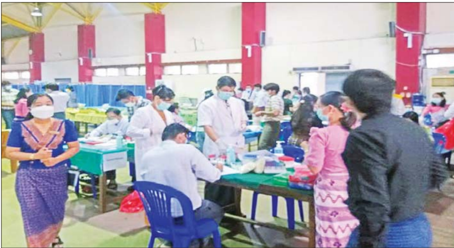
သက်ကြီးဆရာဝန်ကြီးများအား ကျန်းမာရေးစောင့်ရှောက်မှု ဆောင်ရွက်ပေးစဉ်။

ခေတ်နှင့်အညီ တိုးတက်ပြောင်းလဲလာနေသော ကမ္ဘာကြီးအနေဖြင့် စီးပွားရေးနှင့် လူမှုရေး မညီမျှမှု များ တိုးပွားလာခြင်း၊ မြို့ပြအလျင်အမြန်ဖွံ့ဖြိုးလာ ခြင်း၊ ရာသီဥတုနှင့် ပတ်ဝန်းကျင်ကို ခြိမ်းခြောက်မှု များ၊ အိပ်ချ်အိုင်ဗွီနှင့် အခြားကူးစက်ရောဂါများ၏ ဝန်ထုပ်ဝန်ပိုးများနှင့် သွေးတိုးနှင့် ဆီးချိုတို့ကဲ့သို့ သော မကူးစက်သည့်ရောဂါများ ဖြစ်ပွားမှုမြင့်မား လာခြင်း စသည်တို့ကိုလည်း ရင်ဆိုင်ဖြေရှင်းနေရ သည်။ ကျန်းမာရေးကဏ္ဍသည် နိုင်ငံဖွံ့ဖြိုးတိုးတက်