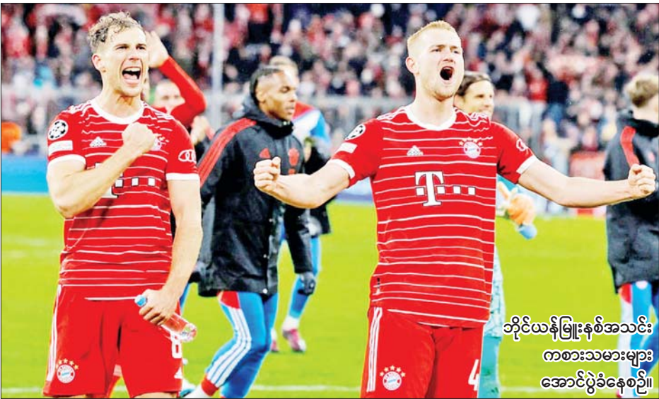
ဘိုင်ယန်မြူးနစ်အသင်း ကစားသမားများ အောင်ပွဲခံနေစဉ်။

ဘိုင်ယန်မြူးနစ်အသင်းနဲ့ ပီအက်စ်ဂျီအသင်းတို့ မတ် ၉ ရက် နံနက်ပိုင်းက ယှဉ်ပြိုင်ကစားခဲ့တဲ့ ချန်ပီယံလိဂ် ၁၆ သင်းအဆင့် ဒုတိယအကျော့ပွဲစဉ်မှာ ဘိုင်ယန်မြူးနစ်အသင်းက နှစ်ဂိုးပြတ်နဲ့ အနိုင်ရရှိခဲ့တာကြောင့် နှစ်ကျော့ပေါင်းရလဒ် သုံးဂိုးပြတ်နဲ့ အနိုင်ရရှိကာ ချန်ပီယံလိဂ်ကွာတားဖိုင်နယ်အဆင့်ကို တက်လှမ်းခွင့်ရရှိခဲ့ပြီဖြစ်ပါတယ်။ ဘိုင်ယန်မြူးနစ်အသင်းဟာ ပီအက်စ်ဂျီအသင်းရဲ့ အိမ်ကွင်းမှာ ယှဉ်ပြိုင်ကစားခဲ့တဲ့ ချန်ပီယံလိဂ် ၁၆ သင်းအဆင့် ပထမအကျော့ပွဲစဉ်မှာ တစ်ဂိုး-ဂိုးမရှိနဲ့ အနိုင်ရရှိခဲ့ပြီး ယခု ဒုတိယအကျော့မှာ ပွဲကစားချိန် ၆၁ မိနစ်မှာ ချိုပြိုင်တင်ရဲ့သွင်းဂိုး၊ ၈၉ မိနစ်မှာ ဂျီနာဘရီရဲ့ သွင်းဂိုးတို့ ရရှိခဲ့လို့ နှစ်ကျော့ပေါင်းရလဒ် သုံးဂိုးပြတ်နဲ့ အနိုင်ရရှိခဲ့တာဖြစ်ပါတယ်။ စာမျက်နှာ ၁၉ ကော်လံ ၁ သို့ ❖