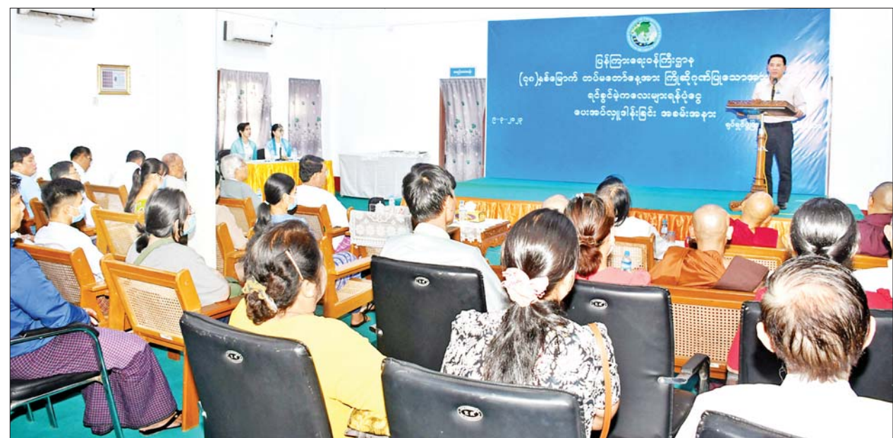
ပြည်ထောင်စုဝန်ကြီး ဦးမောင်မောင်အုန်း (၇၈)နှစ်မြောက် တပ်မတော်နေ့ကို ကြိုဆိုဂုဏ်ပြုသောအားဖြင့် ရင်ခွင်မဲ့ကလေးများ ရန်ပုံငွေပေးအပ်ခြင်းအခမ်းအနားတွင် အမှာစကားပြောကြားစဉ်။

ဆု စိစစ်ရွေးချယ်ရေးကော်မတီ ဥက္ကဋ္ဌ ဆရာဦးစိန်လှိုင်(သူရဇော်)၊ စာပေဗိမာန်စာမူဆု စိစစ်ရွေးချယ်ရေးကော်မတီဥက္ကဋ္ဌ ဦးအုန်းမောင် (မြင်းမူမောင်နိုင်မိုး)နှင့် တွေ့ဆုံပွဲသို့ တက်ရောက်လာကြသည့် စာပေ ပညာရှင်ကြီးများက ဆုရွေးချယ်မှုဆိုင်ရာ လုပ်ငန်းများ ပြင်ဆင်ထားရှိမှုများကို လည်းကောင်း၊ စာအုပ်များ လက်ခံရရှိမှု၊ ဆုရွေးချယ်ရေးဆိုင်ရာ လုပ်ငန်းများ စီစဉ်ထားရှိမှုများနှင့် စပ်လျဉ်း၍လည်းကောင်း ဆွေးနွေးကြသည်။ ထို့နောက်ပြည်ထောင်စုဝန်ကြီးက တင်ပြဆွေးနွေးချက်များအပေါ် ပေါင်းစပ်ညှိနှိုင်း ဆောင်ရွက်ပေးပြီး နိဂုံးချုပ်အမှာစကားပြောကြားခဲ့သည်။ ညနေပိုင်းတွင် ပြည်ထောင်စုဝန်ကြီးသည် ဗဟန်းမြို့နယ်ရှိ ပြန်ကြားရေးနှင့် ပြည်သူ့ဆက်ဆံရေးဦးစီးဌာန ရုပ်ရှင်ဖွံ့ဖြိုးတိုးတက်ရေးစင်တာ၌ ပြုလုပ်သည့် (၇၈)နှစ်မြောက် တပ်မတော်နေ့ကို ကြိုဆိုဂုဏ်ပြုသော အားဖြင့် ရင်ခွင်မဲ့ကလေးများ