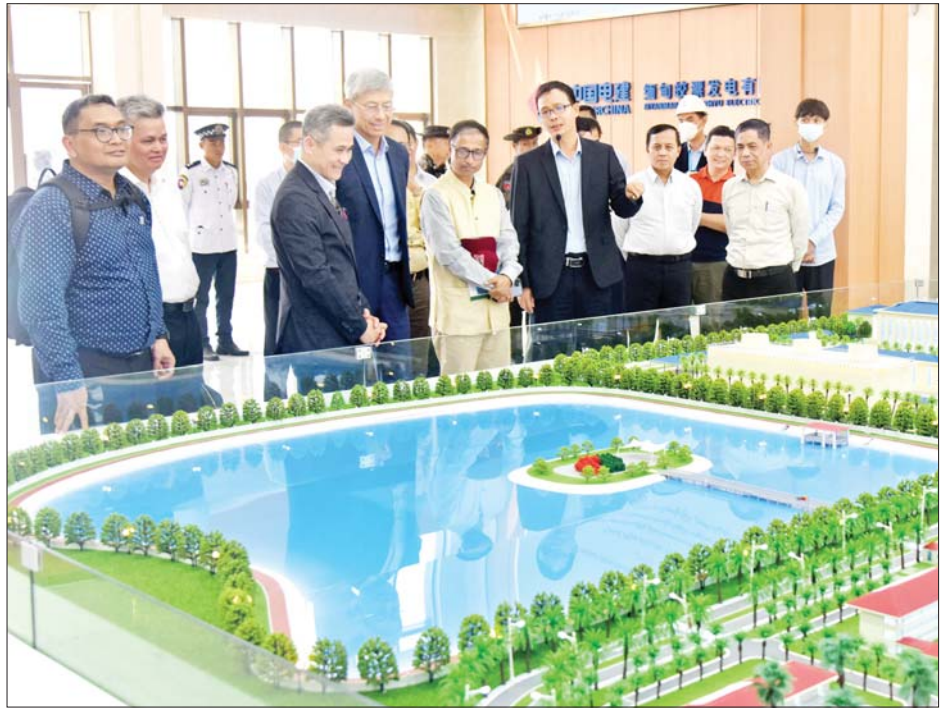
ပြည်ထောင်စုဝန်ကြီး ဦးကိုကိုလှိုင်နှင့်အဖွဲ့ ကျောက်ဖြူသဘာဝဓာတ်ငွေ့သုံး လျှပ်စစ်ဓာတ်အားပေးစက်ရုံစီမံကိန်း အဆောက်အအုံပုံစံငယ်ကို ကြည့်ရှုစဉ်။

ဆေးပေးခန်းအတွက် ဆေးရုံသုံးပစ္စည်းများကို ထောက်ပံ့ပေးအပ်ရာ အုန်းတောကျေးလက် ကျန်းမာရေးဌာနခွဲမှ တာဝန်ရှိသူတစ်ဦးက လက်ခံရယူသည်။ ယင်းနောက် ပြည်ထောင်စုဝန်ကြီးနှင့် အဖွဲ့သည် ကျောက်တစ်လုံး IDP စခန်းမှ ထွက်ခွာလာကြရာ ကျောက်ဖြူသဘာဝဓာတ်ငွေ့သုံး လျှပ်စစ်ဓာတ်အားပေးစက်ရုံစီမံကိန်းသို့ ရောက်ရှိကြပြီး စက်ရုံတာဝန်ရှိသူတစ်ဦးက ကျောက်ဖြူသဘာဝဓာတ်ငွေ့သုံး လျှပ်စစ်ဓာတ်အားပေးစက်ရုံစီမံကိန်းအဆောက်အအုံ ပုံစံငယ်ကို ရှင်းလင်းပြသပြီး စက်ရုံဝင်းအတွင်း လုပ်ငန်းဆောင်ရွက်မှုများကို လိုက်လံကြည့်ရှုကြသည်။ မွန်းလွဲပိုင်းတွင် ပြည်ထောင်စုဝန်ကြီးနှင့်အဖွဲ့သည် စစ်တွေမြို့ရှိ သက္ကေပြင် IDP စခန်း၌ လူဝင်မှုကြီးကြပ်ရေးနှင့် ပြည်သူ့အင်အားဝန်ကြီးဌာန မြို့နယ်ဦးစီးမှူးရုံးမှ နိုင်ငံသား စိစစ်ခံရမည့်သူ၏ သက်သေခံကတ်ပြား (NVC) ထုတ်ပေးနေမှုတို့ကို ကြည့်ရှုကြသည်။ ထို့နောက်ပြည်ထောင်စုဝန်ကြီးနှင့်အဖွဲ့သည် သက္ကေပြင် IDP စခန်းမှ ထွက်ခွာလာကြပြီး ကုလားတန်မြစ်ကြောင်းဘက်စုံသုံးစီမံကိန်းသို့ ရောက်ရှိကြရာ ရှင်းလင်းဆောင်၌ ရခိုင်ပြည်နယ် ဆိပ်ကမ်းအရာရှိချုပ် ဦးနေဦးက ကုလားတန်မြစ်ကြောင်းဘက်စုံသုံးဖြတ်သန်း သယ်ယူပို့ဆောင်ရေးစီမံကိန်း ဆောင်ရွက်နေမှုတို့ကို ရှင်းလင်းတင်ပြပြီး ဆိပ်ကမ်းကို လှည့်လည်ကြည့်ရှုကြသည်။ သတင်းစဉ်