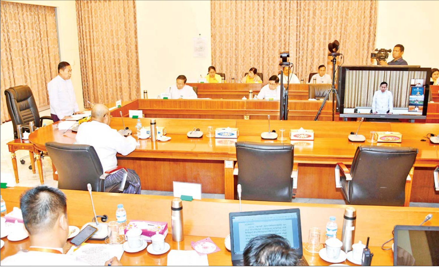
နိုင်ငံတော်စီမံအုပ်ချုပ်ရေးကောင်စီ ဒုတိယဥက္ကဋ္ဌ ဒုတိယဝန်ကြီးချုပ် ဒုတိယဗိုလ်ချုပ်မှူးကြီး စိုးဝင်း ၂၀၂၃-၂၀၂၄ ဘဏ္ဍာရေးနှစ် ပြည်ထောင်စု၏အရအသုံးခန့်မှန်းခြေငွေစာရင်းများတင်ပြခြင်းဆိုင်ရာ ညှိနှိုင်းအစည်းအဝေးတွင် အမှာစကားပြောကြားစဉ်။

နေပြည်တော် မတ် ၉ ၂၀၂၃ - ၂၀၂၄ ဘဏ္ဍာရေးနှစ် ပြည်ထောင်စု၏ အရအသုံးခန့်မှန်းခြေ ငွေစာရင်းများတင်ပြခြင်းဆိုင်ရာ ညှိနှိုင်း အစည်းအဝေးကို ယနေ့မွန်းလွဲပိုင်းတွင် နေပြည်တော်ရှိ နိုင်ငံတော်စီမံအုပ်ချုပ်ရေး ကောင်စီဥက္ကဋ္ဌရုံး၌ ကျင်းပရာ ဘဏ္ဍာရေး ဆိုင်ရာကော်မရှင် ဒုတိယဥက္ကဋ္ဌ နိုင်ငံတော် စီမံအုပ်ချုပ်ရေးကောင်စီ ဒုတိယဥက္ကဋ္ဌ ဒုတိယဝန်ကြီးချုပ် ဒုတိယဗိုလ်ချုပ် မှူးကြီးစိုးဝင်း တက်ရောက်အမှာစကား ပြောကြားသည်။