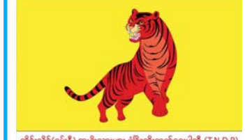
တိုင်းလိုင်(ရှမ်းနီ) အမျိုးသားများ ဖွံ့ဖြိုးတိုးတက်ရေးပါတီ (T.N.D.P) ပြည်ထောင်စုရွေးကောက်ပွဲကော်မရှင်