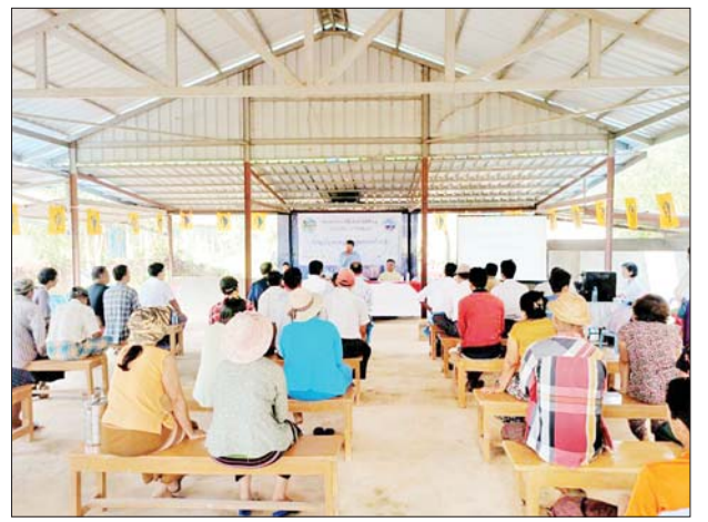
သင်တန်းမှ ငါးမွေးမြူရေးနည်းပညာပေး ဘာသာရပ်ဆိုင်ရာ စာအုပ်များ အမဲဖွဲ့ဖြန့်ဝေပေးခဲ့ကြောင်း သိရသည်။ မြင့်ဦး

အဆိုပါ ငါးမွေးမြူရေးနည်းပညာပေးသင်တန်းတွင် တိုက်ကြီးမြို့နယ် ငါးလုပ်ငန်းအဖွဲ့ချုပ်မှ တာဝန်ရှိသူများနှင့် ဥက္ကံရှမ်းစုကျေးရွာမှ ငါးမွေးတောင်သူ ၅၀ တို့ ညနေ ၄ နာရီထိ တက်ရောက်ကြကာ