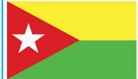
တိုင်းလိုင်(ရှမ်းနီ)အမျိုးသားများဖွံ့ဖြိုးတိုးတက်ရေးပါတီ [TAI-LENG NATIONALITIES DEVELOPMENT PARTY (T.N.D.P)] ၏ တံဆိပ်ပုံစံ

၁။ ကချင်ပြည်နယ်၊ မိုးညှင်းခရိုင်၊ မိုးညှင်းမြို့နယ်၊ ရွာသစ်ကုန်းကျေးရွာအုပ်စု၊ အာလဝီကုန်းရပ်၊ အလဝ-၁၃ တွင် ပါတီရုံးချုပ် တည်ရှိသော တိုင်းလိုင်(ရှမ်းနီ)အမျိုးသားများဖွံ့ဖြိုးတိုးတက်ရေးပါတီ [TAI-LENG NATIONALITIES DEVELOPMENT PARTY (T.N.D.P)] က နိုင်ငံရေးပါတီများမှတ်ပုံတင်ခြင်းဥပဒေ ပုဒ်မ ၂၅ အရ နိုင်ငံရေးပါတီအဖြစ် ဆက်လက်တည်ထောင်မှတ်ပုံတင်ခွင့် ပြုရန် ၈-၃-၂၀၂၃ ရက်နေ့တွင် လျှောက်ထားလာပါသည်။ ယင်းသို့ လျှောက်ထားရာတွင် ပါတီအမည်၊ အလံနှင့် တံဆိပ်တို့ကို ဖော်ပြပါအတိုင်း အသုံးပြုမည်ဖြစ်ကြောင်း တင်ပြလာပါသည်။ ၂။ ယင်းအဖွဲ့အစည်းက အသုံးပြုမည့် ပါတီအမည်၊ အလံနှင့် တံဆိပ်တို့ကို ကန့်ကွက်လိုက် ယခု ကြေညာသည့်နေ့မှစ၍ (၇) ရက်အတွင်း ခိုင်လုံသော အထောက်အထားများဖြင့် ပြည်ထောင်စုရွေးကောက်ပွဲကော်မရှင်သို့ ကန့်ကွက်နိုင်ပါကြောင်း၊ နိုင်ငံရေးပါတီများ မှတ်ပုံတင်ခြင်း နည်းဥပဒေ ၁၄ (ဃ) အရ အများသိစေရန် ကြေညာအပ်ပါသည်။ တိုင်းလိုင်(ရှမ်းနီ)အမျိုးသားများဖွံ့ဖြိုးတိုးတက်ရေးပါတီ [TAI-LENG NATIONALITIES DEVELOPMENT PARTY (T.N.D.P)] ၏ အလံပုံစံ