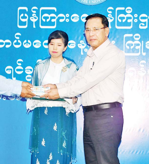
ပြည်ထောင်စုဝန်ကြီး ဦးမောင်မောင်အုန်း မင်္ဂလာလူငယ်ဖွံ့ဖြိုးရေးပရဟိတဂေဟာမှ ရင်ခွင်မဲ့ကလေးများအတွက် အလှူငွေများပေးအပ်လှူဒါန်းစဉ်။

ပြည်ထောင်စုဝန်ကြီး ဦးမောင်မောင်အုန်း (၇၈)နှစ်မြောက် တပ်မတော်နေ့ကို ကြိုဆိုဂုဏ်ပြုသောအားဖြင့် ရင်ခွင်မဲ့ကလေးများ ရန်ပုံငွေပေးအပ်ခြင်းအခမ်းအနားတွင် အမှာစကားပြောကြားစဉ်။