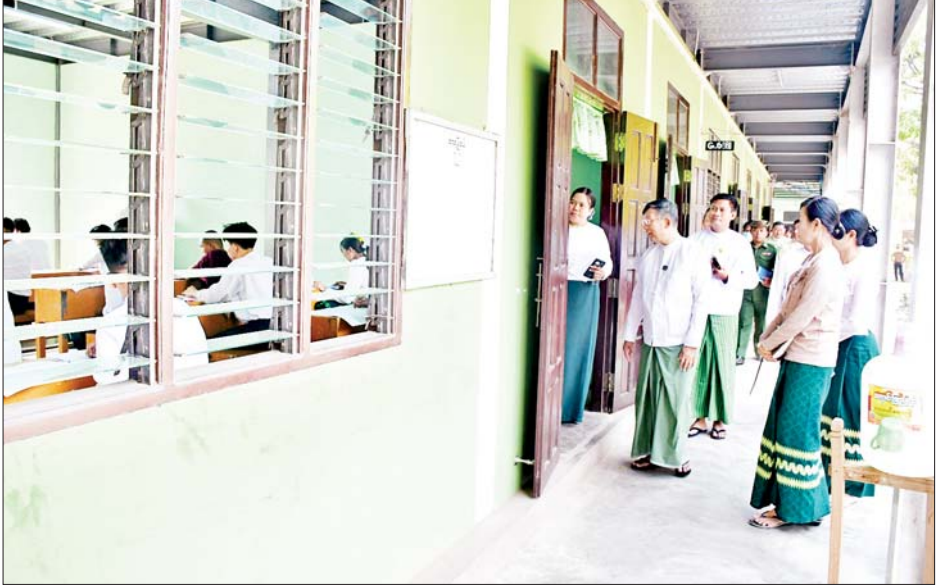
ပြည်ထောင်စုနယ်မြေ နေပြည်တော်၌ စာစစ် ဌာန စုစုပေါင်း ၃၉ ခုတွင် စာမေးပွဲဖြေဆိုရန် စုစုပေါင်း ၇၁၁၈ ဦး စာရင်းပေးသွင်းထားပြီး ယနေ့ အင်္ဂလိပ်စာဘာသာရပ်ကို ကျောင်းသား ကျောင်းသူစုစုပေါင်း ၆၄၂၃ ဦး ဝင်ရောက်ဖြေဆိုကြရာ ရာခိုင်နှုန်းအားဖြင့် ၉၀ ဒသမ ၂၄ ရာခိုင်နှုန်းရှိ ကြောင်း သိရသည်။ သတင်းစဉ်

ခုတင် (၁၀၀၀) စာစစ်ဌာန၊ အမှတ်(၁၄) အခြေခံပညာ အထက်တန်းကျောင်း စာစစ်ဌာန၊ ပျဉ်းမနားမြို့နယ် အတွင်းရှိ အမှတ်(၁) အခြေခံပညာအထက်တန်း ကျောင်း စာစစ်ဌာနနှင့် အမှတ်(၃) အခြေခံပညာ အထက်တန်းကျောင်းစာစစ်ဌာနများသို့ သွားရောက် ၍ ကျောင်းသား ကျောင်းသူများ တက္ကသိုလ်ဝင် စာမေးပွဲ ဒုတိယနေ့ အင်္ဂလိပ်စာဘာသာရပ် ဖြေဆို နေမှုကို လှည့်လည်ကြည့်ရှုအားပေးရာ သက်ဆိုင်ရာ တာဝန်ရှိသူများက စာစစ်ဌာနများအလိုက် ဆောင်ရွက်ထားရှိမှု အခြေအနေများကို ရှင်းလင်း တင်ပြကြပြီး နေပြည်တော်ကောင်စီဥက္ကဋ္ဌက တက္ကသိုလ်ဝင်စာမေးပွဲကို ဝင်ရောက်ဖြေဆိုသည့် ကျောင်းသား ကျောင်းသူများ စိတ်အေးချမ်းသာစွာ စာမေးပွဲဖြေဆိုနိုင်ရေး၊ တက္ကသိုလ်ဝင်စာမေးပွဲ အောင်မြင်စွာ ကျင်းပပြီးစီးနိုင်ရေးနှင့် လိုအပ်သည် များ မှာကြားသည်။