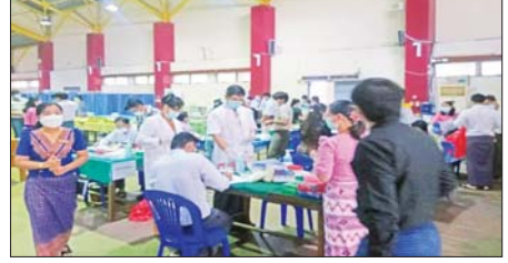
အရည်အသွေးရှေးရှု ကျန်းမာရေးစောင့်ရှောက်မှု ဆောင်းပါး စာမျက်နှာ » ၆

ပြည်သူ့ဆေးရုံကြီး ပျဉ်းမနားမြို့၌ ပြတ်တောက်သွားသော လက်အား ပြန်လည်ဆက်ပေးသည့် ခွဲစိတ်ကုသမှု အောင်မြင်စွာဆောင်ရွက် စာမျက်နှာ » ၇