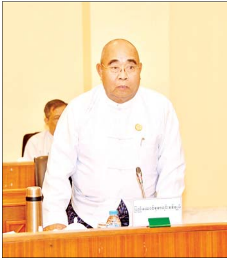
ပြည်ထောင်စုစာရင်းစစ်ချုပ် ဦးတင်ဦး ရှင်းလင်းတင်ပြစဉ်။

အခြေအနေကိုလည်း သင့်တင့်လျောက်ပတ်စွာ ထိန်းသိမ်းဆောင်ရွက်ရမည်ဖြစ်ကြောင်း၊ ထို့ကြောင့် သုံးသင့်သုံးထိုက်သည့် အသုံးစရိတ်များနှင့် မသင့်မသိုက်သည့် အသုံးစရိတ်များကို စီစဉ်ဆောင်ရွက်သွားကြရမည်ဖြစ်ကြောင်း။