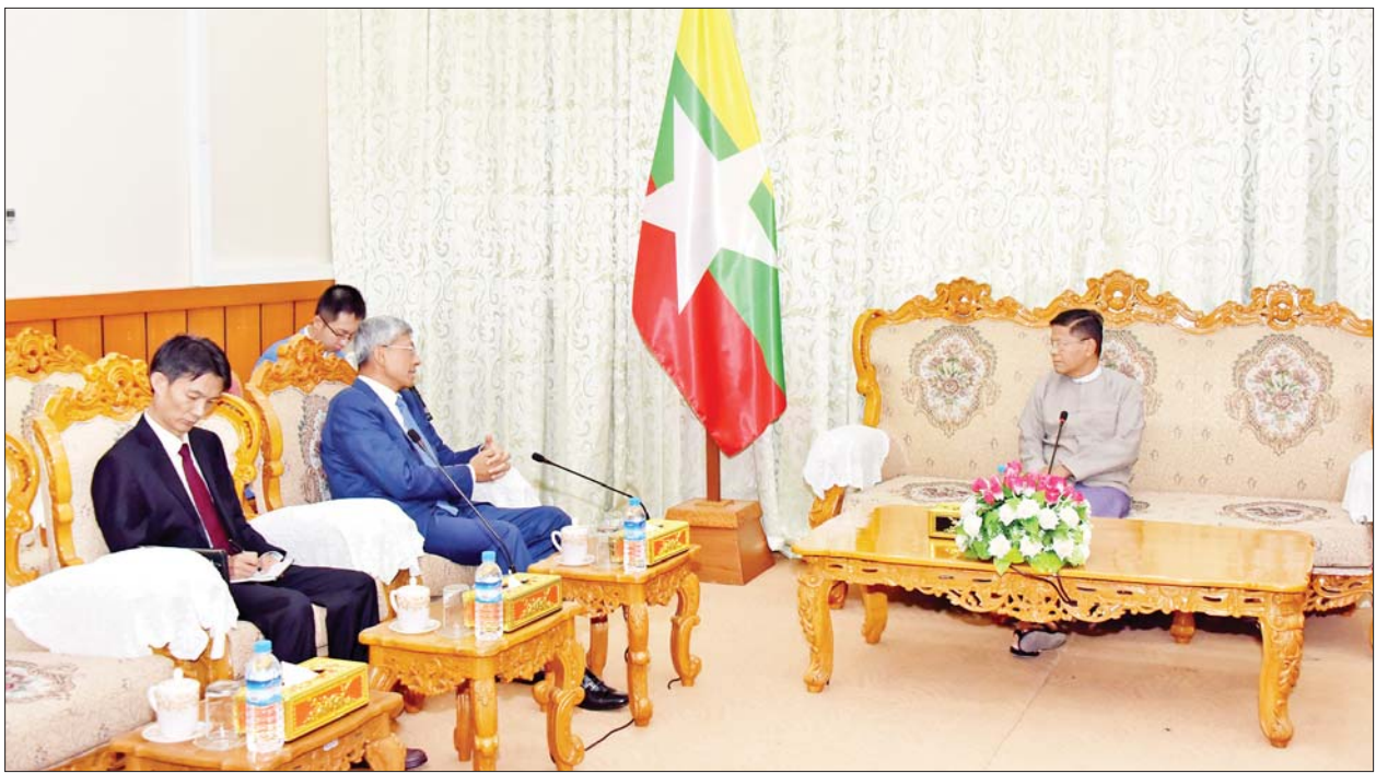
ဆောင်ရွက်နေမှုများကို ရှင်းလင်းပြောကြားခဲ့ပြီး နိုင်ငံရေးပါတီဆိုင်ရာ ကိစ္စရပ်များနှင့် ရွေးကော်မရှင်ပုဂ္ဂိုလ်ကို ရင်းနှီးပွင့်လင်းစွာ ဆွေးနွေးခဲ့ကြသည်။ တွေ့ဆုံပွဲသို့ ပြည်ထောင်စုရွေးကော်မရှင်အဖွဲ့ဝင်များနှင့် ကော်မရှင်ရုံးမှ တာဝန်ရှိသူများ တက်ရောက်ခဲ့ကြောင်း သိရသည်။ သတင်းစဉ်

ပြည်ထောင်စုရွေးကော်မရှင်ဥက္ကဋ္ဌက ကော်မရှင်အနေဖြင့် ရွေးကောက်ပွဲကျင်းပနိုင်ရေး ကြိုတင်ပြင်ဆင်ဆောင်ရွက်နေမှု၊ နိုင်ငံရေးပါတီများမှတ်ပုံတင်ခြင်းဥပဒေ၊ နည်းဥပဒေများပြဋ္ဌာန်းခဲ့မှု၊ နိုင်ငံရေးပါတီများ တည်ထောင်ခွင့်၊ မှတ်ပုံတင်ခွင့် လာရောက်လျှောက်ထားမှုနှင့် စိစစ်ဆောင်ရွက်နေမှု၊ လာမည့်ရွေးကောက်ပွဲများတွင် အီလက်ထရွန်နစ်မဲပေးစက် အသုံးပြုနိုင်ရေးဆောင်ရွက်နေမှု၊ အချိုးကျကိုယ်စားပြုစနစ် ကျင့်သုံးဆောင်ရွက်မည့်အခြေအနေ၊ ရွေးကောက်ပွဲတွင်ဝင်ရောက်ယှဉ်ပြိုင်မည့် နိုင်ငံရေးပါတီများနှင့် မဲဆန္ဒရှင်ပြည်သူများက လက်ခံသည့် မှန်ကန်မျှတသည့် ရွေးကောက်ပွဲကျင်းပနိုင်ရေး ဆောင်ရွက်နေမှု၊ ဆန္ဒမဲပေးခွင့်ရှိသူများ ဥပဒေနှင့်အညီ မဲပေးနိုင်ရေး