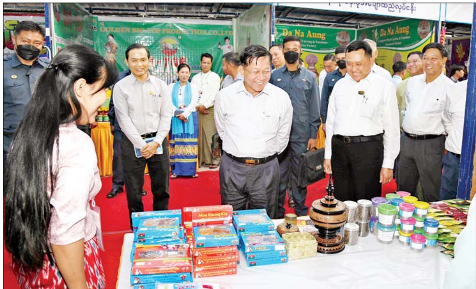
နိုင်ငံတော်စီမံအုပ်ချုပ်ရေးကောင်စီဥက္ကဋ္ဌ နိုင်ငံတော်ဝန်ကြီးချုပ် ဗိုလ်ချုပ်မှူးကြီးမင်းအောင်လှိုင် ထုတ်ကုန်ပစ္စည်းများ ခင်းကျင်းပြသထားမှုကို ကြည့်ရှုလေ့လာစဉ်။

စပါးစိုက်ပျိုးမှုများဆောင်ရွက်ရာတွင် ပန်းတိုင်ရည်မှန်းချက်များ ပြည့်မီအောင် စိုက်ပျိုးရန်လိုကြောင်း၊ တစ်ဧကချင်းအထွက်နှုန်းများ တိုးတက်အောင်ဆောင်ရွက်ပြီး စီးပွားရေးမြှင့်တင်မှုများ