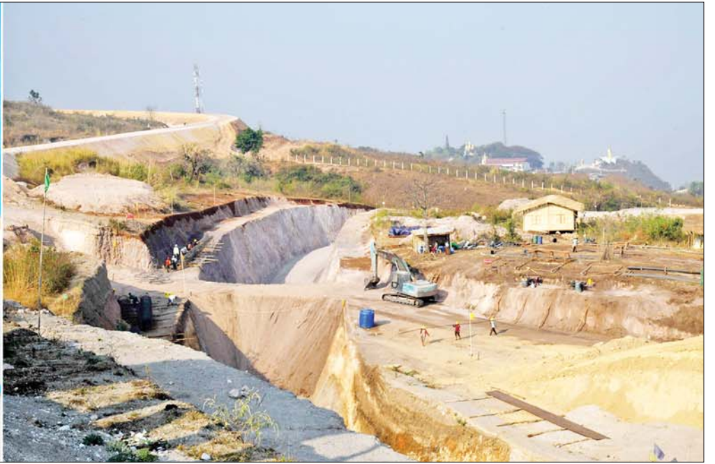
နိုင်ငံတော်စီမံအုပ်ချုပ်ရေးကောင်စီဥက္ကဋ္ဌ နိုင်ငံတော်ဝန်ကြီးချုပ် ဗိုလ်ချုပ်မှူးကြီးမင်းအောင်လှိုင်နှင့် တာဝန်ရှိသူများ ရွှေညောင်-တောင်ကြီး ရထားလမ်းပိုင်း အဆင့်မြှင့်တင်ရေးစီမံကိန်းဧရိယာအတွင်း လှည့်လည်ကြည့်ရှုစစ်ဆေးစဉ်။