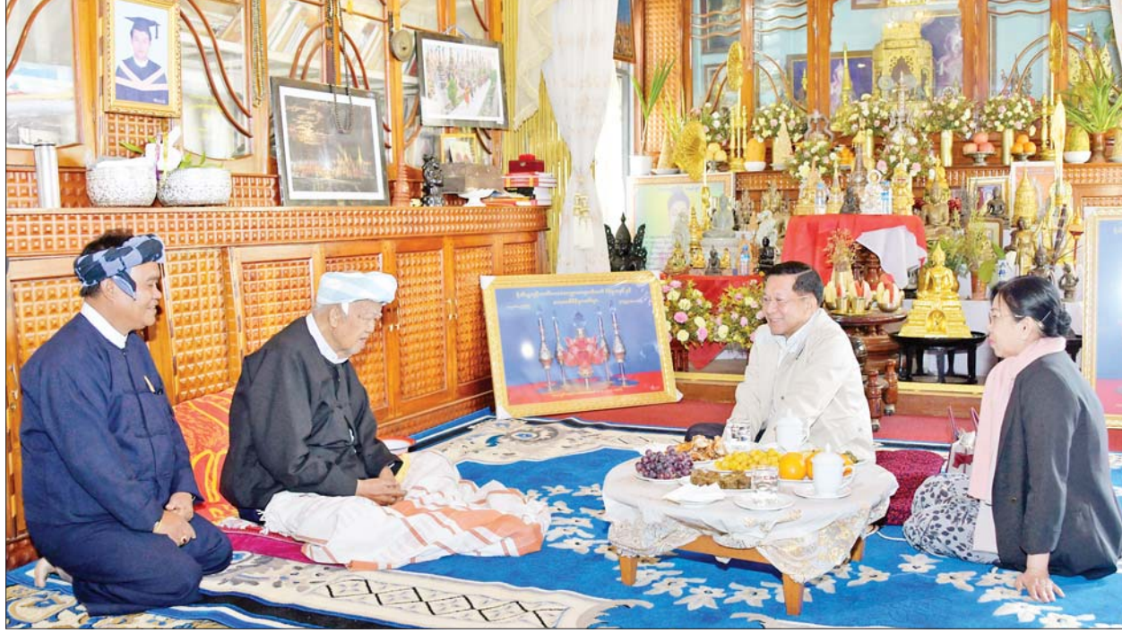
နိုင်ငံတော်စီမံအုပ်ချုပ်ရေးကောင်စီဥက္ကဋ္ဌ နိုင်ငံတော်ဝန်ကြီးချုပ် ဗိုလ်ချုပ်မှူးကြီး မင်းအောင်လှိုင်နှင့်ဇနီး ဒေါ်ကြူကြူလှတို့ ပအိုဝ်းအမျိုးသားခေါင်းဆောင် ပအိုဝ်းအမျိုးသားအဖွဲ့ချုပ်(PNO)နာယက ဦးအောင်ခမ်းထီ နေအိမ်သို့ သွားရောက်ပြီး ကျန်းမာရေးအခြေအနေများကို မေးမြန်း အားပေးစကားပြောကြားစဉ်။

ကြောင်း ဆွေးနွေးပြောကြားသည်။ လက်ဆောင်ပစ္စည်းများ ပေးအပ် ထိုနောက် နိုင်ငံတော်စီမံအုပ်ချုပ်ရေးကောင်စီ ဥက္ကဋ္ဌ နိုင်ငံတော်ဝန်ကြီးချုပ်က ပအိုဝ်းအမျိုးသားအဖွဲ့ချုပ် (PNO) နာယက ဦးအောင်ခမ်းထီ အား စားသောက်ဖွယ်ရာများနှင့် လက်ဆောင်ပစ္စည်းများ ပေးအပ် ရာ ဒေသထွက်လက်ဆောင်ပစ္စည်းများနှင့် ဓမ္မလက်ဆောင်များ ပြန်လည်ပေးအပ်သည်။