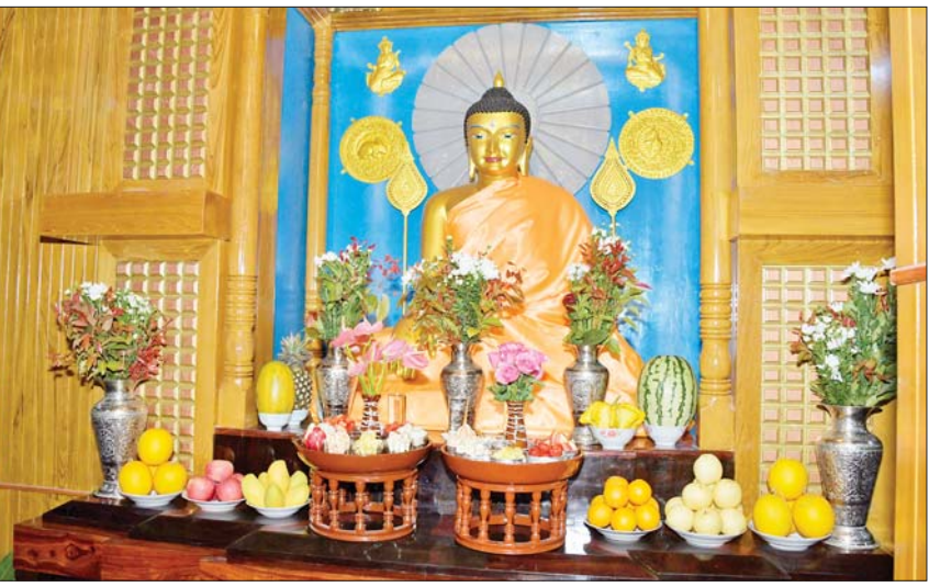
နိုင်ငံတော်စီမံအုပ်ချုပ်ရေးကောင်စီဥက္ကဋ္ဌ နိုင်ငံတော်ဝန်ကြီးချုပ် ဗိုလ်ချုပ်မှူးကြီး မင်းအောင်လှိုင်နှင့်ဇနီး ဒေါ်ကြူကြူလှနှင့် တာဝန်ရှိသူများ ကျောက်တလုံးကြီးမြို့ ဗိုလ်ပန္နကုန်းတော်တွင် တည်ထားကိုးကွယ်ထားရှိသည့် မဟာဝံသဗုဒ္ဓဂယာစေတီတော်ရှိ ဗုဒ္ဓရုပ်ပွားတော်မြတ်အား ပန်း၊ ရေချမ်း၊ ဆီမီး ကပ်လှူပူဇော်စဉ်။

ကြိုဆို ဦးစွာ နိုင်ငံတော်စီမံအုပ်ချုပ်ရေး ကောင်စီဥက္ကဋ္ဌ နိုင်ငံတော်ဝန်ကြီးချုပ်နှင့် အဖွဲ့ဝင်များသည် ကျောက်တလုံးကြီးမြို့သို့ ရောက်ရှိကြရာ ပအိုဝ်းအမျိုးသားအဖွဲ့ချုပ် (PNO)