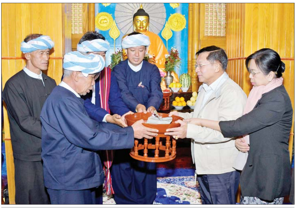
နိုင်ငံတော်စီမံအုပ်ချုပ်ရေးကောင်စီဥက္ကဋ္ဌ နိုင်ငံတော်ဝန်ကြီးချုပ် ဗိုလ်ချုပ်မှူးကြီး မင်းအောင်လှိုင်နှင့်ဇနီး ဒေါ်ကြူကြူလှတို့ မဟာဝံသဗုဒ္ဓဂယာစေတီတော်ကြီးအတွက် ဘက်စုံအလှူငွေများ ပေးအပ်လှူဒါန်းစဉ်။

အသွေးကောင်းမွန်သည့်အတွက် စိုက်ပျိုးမှုများကို ပိုမိုမြှင့်တင် ဆောင်ရွက်စေလိုကြောင်း၊ အလားတူ ဒေသတွင်း ကောင်းမွန်စွာ ထွက်ရှိသည့် ကြက်သွန်း၊ အာလူး၊ လက်ဖက် ကဲ့သို့သော စိုက်ပျိုးရေးထုတ်ကုန်များမှ တန်ဖိုးမြှင့်ထုတ်ကုန်များကို ထုတ်လုပ်နိုင်ရေး စဉ်းစားဆောင်ရွက်ကြစေလိုကြောင်း၊ ဒေသရှိ မြေပေါ်မြေအောက် သယံဇာတများကို လွယ်လွယ်ကူကူ ထုတ်ယူသုံးစွဲခြင်းများကို ရှောင်ရှားပြီး ရေရှည်အကျိုးရှိမည့် လုပ်ငန်းများကို လုပ်ဆောင်စေလိုကြောင်း၊ ဒေသတွင်းရှိ သစ်ပင်သစ်တောများကို လည်း ထိန်းသိမ်းရန်လိုအပ်ပြီး ရွှေ့ပြောင်းတောင်ယာများ စိုက်ပျိုးခြင်းထက် ကုန်းမြင့်လယ်ယာစနစ်ကို ပိုမိုအားပေးဆောင်ရွက်ကြစေလိုကြောင်း၊ ပအိုဝ်းဒေသအတွင်း