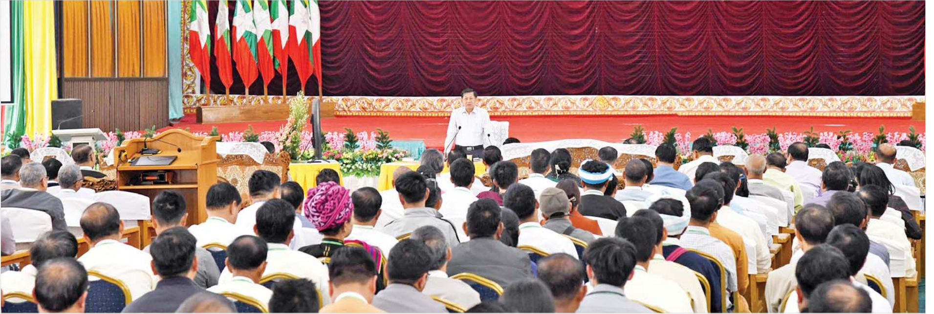
နိုင်ငံတော်စီမံအုပ်ချုပ်ရေးကောင်စီဥက္ကဋ္ဌ နိုင်ငံတော်ဝန်ကြီးချုပ် ဗိုလ်ချုပ်မှူးကြီးမင်းအောင်လှိုင် ရှမ်းပြည်နယ်အတွင်းရှိ အသေးစား၊ အငယ်စားနှင့် အလတ်စားစီးပွားရေး(MSME) လုပ်ငန်းရှင်များနှင့် တွေ့ဆုံဆွေးနွေးစဉ်။