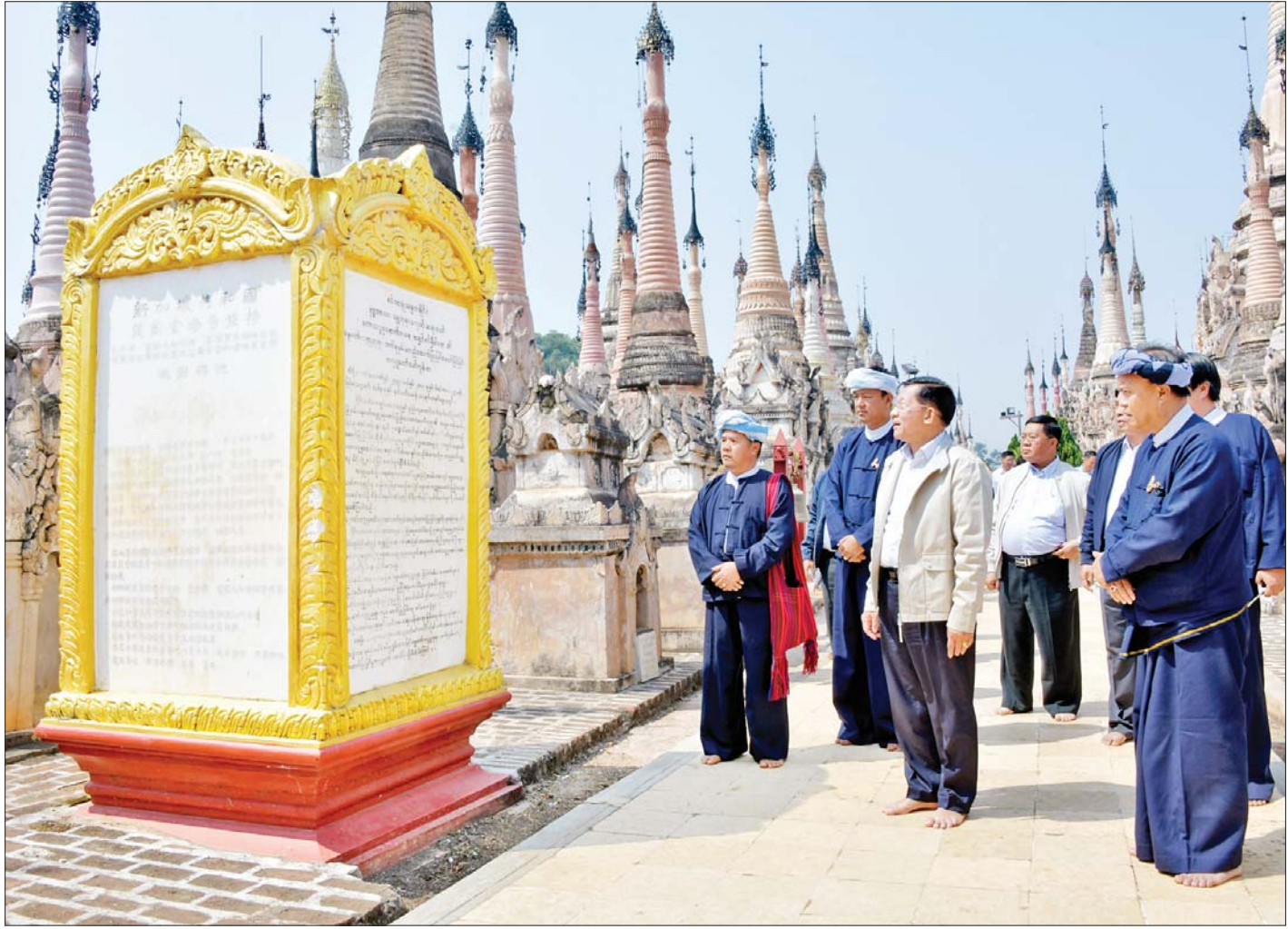
နိုင်ငံတော်စီမံအုပ်ချုပ်ရေးကောင်စီဥက္ကဋ္ဌ နိုင်ငံတော်ဝန်ကြီးချုပ် ဗိုလ်ချုပ်မှူးကြီး မင်းအောင်လှိုင်၊ ဇနီးဒေါ်ကြူကြူလှနှင့်အဖွဲ့ဝင်များ ရှေးဟောင်းသမိုင်းဝင် မွေတော်ကတ္တူဘုရားပရိဝုဏ်အတွင်း လှည့်လည်ကြည့်ရှုစဉ်။

ထို့နောက် နိုင်ငံတော်စီမံအုပ်ချုပ်ရေးကောင်စီ ဥက္ကဋ္ဌ နိုင်ငံတော်ဝန်ကြီးချုပ်နှင့် အဖွဲ့ဝင်များသည် ရှေးဟောင်းသမိုင်းဝင် မွေတော်ကတ္တူဘုရားသို့ လာရောက်ဖူးမြော်ကြည့်ရှု ဘုရားဖူးလာဒေသခံ တိုင်းရင်းသားပြည်သူများအား ရင်းရင်းနှီးနှီး နှုတ်ဆက်သည်။ ဆက်လက်၍ဘုရားပရိဝုဏ်အတွင်း လှည့်လည်ကြည့်ရှု၍ စေတီတော်များ ရေရှည်