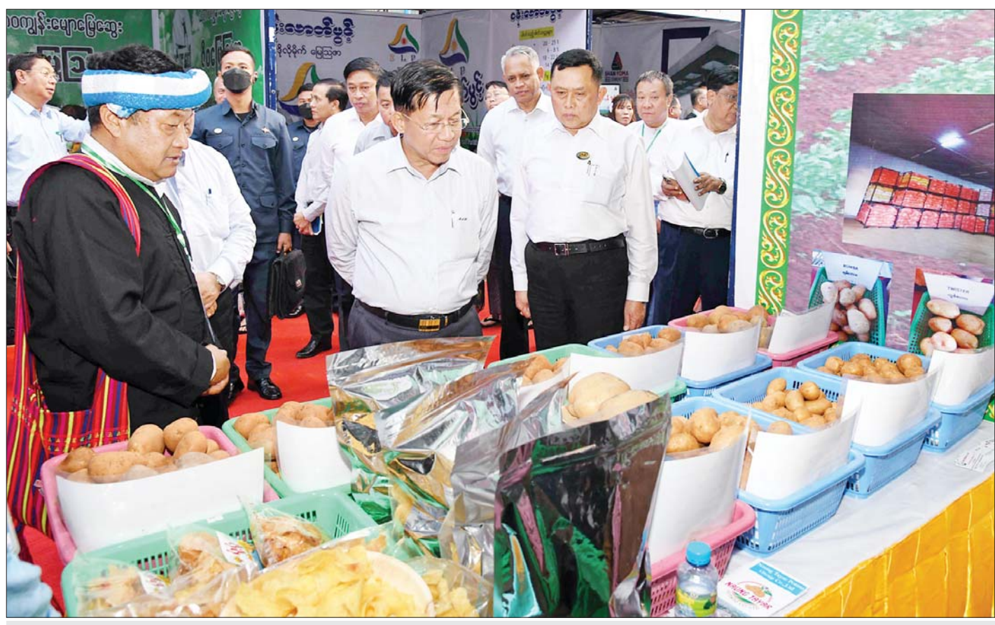
နိုင်ငံတော်စီမံအုပ်ချုပ်ရေးကောင်စီဥက္ကဋ္ဌ နိုင်ငံတော်ဝန်ကြီးချုပ် ဗိုလ်ချုပ်မှူးကြီးမင်းအောင်လှိုင် ထုတ်ကုန်ပစ္စည်းများ ခင်းကျင်းပြသထားမှုကို ကြည့်ရှုလေ့လာစဉ်။

နေပြည်တော် မတ် ၇ နိုင်ငံတော်စီမံအုပ်ချုပ်ရေးကောင်စီ ဥက္ကဋ္ဌ နိုင်ငံတော်ဝန်ကြီးချုပ် ဗိုလ်ချုပ်မှူးကြီး မင်းအောင်လှိုင် သည် ယနေ့မွန်းလွဲပိုင်းတွင် ရှမ်းပြည်နယ်အတွင်းရှိ အသေးစား၊ အငယ်စားနှင့် အလတ်စားစီးပွားရေး (MSME) လုပ်ငန်းရှင်များအား တောင်ကြီးမြို့၊ မြို့တော်ခန်းမ၌ တွေ့ဆုံ၍ ဒေသဖွံ့ဖြိုးတိုးတက်ရေးဆိုင်ရာ များနှင့် စီးပွားရေးလုပ်ငန်းဖွံ့ဖြိုးတိုးတက်ရေးဆိုင်ရာ များကို ဆွေးနွေးပြောကြားသည်။ တက်ရောက် အဆိုပါ တွေ့ဆုံပွဲသို့ နိုင်ငံတော်စီမံအုပ်ချုပ်ရေးကောင်စီဥက္ကဋ္ဌ နိုင်ငံတော်ဝန်ကြီးချုပ်နှင့်အတူ ကောင်စီတွဲဖက်အတွင်းရေးမှူး ဒုတိယဗိုလ်ချုပ်ကြီး ရဲဝင်းဦး၊ ကောင်စီဝင်များဖြစ်ကြသည့် ဗိုလ်ချုပ်ကြီး တင်အောင်စန်း၊ ဒေါက်တာကျော်ထွန်း၊ ပြည်ထောင်စုဝန်ကြီးများ၊ ရှမ်းပြည်နယ်ဝန်ကြီးချုပ် ဦးအောင်ဇော်အေး၊ ကာကွယ်ရေးဦးစီးချုပ်ရုံးမှ တပ်မတော်အရာရှိကြီးများ၊ အရှေ့ပိုင်းတိုင်းစစ်ဌာနချုပ် တိုင်းမှူး ဗိုလ်ချုပ်လှမိုး၊ ဒုတိယဝန်ကြီးများ၊ ပြည်နယ်အဆင့်ဌာနဆိုင်ရာ တာဝန်ရှိသူများ၊ မြို့မိ မြို့ဖများ၊ ရှမ်းပြည်နယ်အတွင်းရှိ အသေးစား၊ အငယ်စားနှင့် အလတ်စားစီးပွားရေး (MSME) လုပ်ငန်းရှင်များနှင့် တာဝန်ရှိသူများ တက်ရောက်ကြသည်။ စာမျက်နှာ ၃ ကော်လံ ၁ သို့ ☆