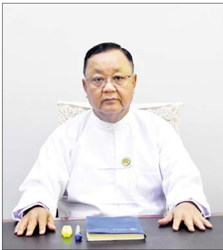
ဒုတိယဝန်ကြီး ဦးဝင်းဖေ

ဖြေ။ ။ နေပြည်တော်မှာဆိုရင် နေပြည်တော်စည်ပင်စည်ရိပ်သာ၊ သပြေကုန်းဈေး၊ သုခတော်ဝင်အိမ်ရာရှေ့နဲ့ ဘောကသီရိကားဝင်းအတွင်း စုစုပေါင်းလေးနေရာကို EV ယာဉ်တွေအတွက် Charging Station တွေ တည်ဆောက်လျက်ရှိရာ N.P.K Motors Co.,Ltd က တည်ဆောက်