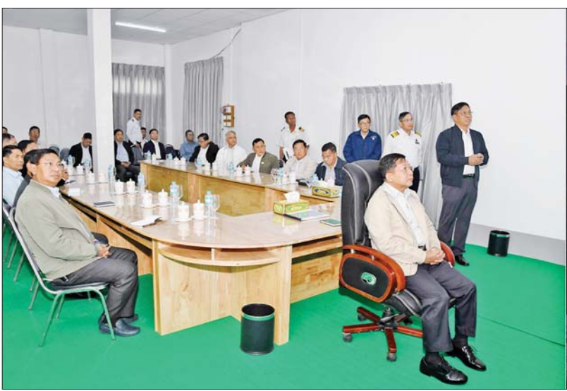
နိုင်ငံတော်စီမံအုပ်ချုပ်ရေးကောင်စီဥက္ကဋ္ဌ နိုင်ငံတော်ဝန်ကြီးချုပ် ဗိုလ်ချုပ်မှူးကြီးမင်းအောင်လှိုင်နှင့် တာဝန်ရှိသူများ ရေထွက်ဦး-တောင်ကြီးဘူတာကြား သံလမ်းခင်းခြင်း လုပ်ငန်း ဆောင်ရွက်နေမှုအခြေအနေများ ရှင်းလင်းတင်ပြမှုကို ကြည့်ရှုစစ်ဆေးစဉ်။

နေပြည်တော် မတ် ၇ နိုင်ငံတော် စီမံအုပ်ချုပ်ရေးကောင်စီဥက္ကဋ္ဌ နိုင်ငံတော်ဝန်ကြီးချုပ် ဗိုလ်ချုပ်မှူးကြီးမင်းအောင်လှိုင်သည် ယနေ့နံနက်ပိုင်းတွင် ခရီးစဉ်တွင်လိုက်ပါလာသည့် အဖွဲ့ဝင်များ၊ ရှမ်းပြည်နယ်ဝန်ကြီးချုပ်၊ အရှေ့ပိုင်းတိုင်းစစ်ဌာနချုပ် တိုင်းမှူးနှင့် တာဝန်ရှိသူများလိုက်ပါ၍ ရှမ်းပြည်နယ် (တောင်ပိုင်း) ရွှေညောင်-တောင်ကြီး ရထားလမ်းပိုင်း အဆင့်မြှင့်တင်ရေး စီမံကိန်း လုပ်ငန်းဆောင်ရွက်နေမှု အခြေအနေများကိုသွားရောက်ကြည့်ရှုစစ်ဆေးသည်။