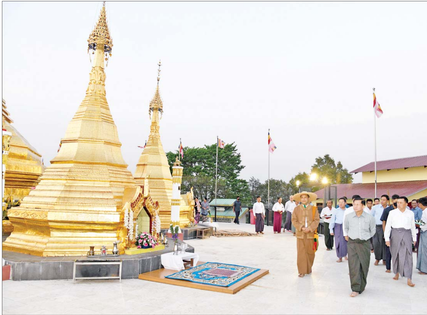
နိုင်ငံတော်စီမံအုပ်ချုပ်ရေးကောင်စီဥက္ကဋ္ဌ နိုင်ငံတော်ဝန်ကြီးချုပ် ဗိုလ်ချုပ်မှူးကြီး မင်းအောင်လှိုင်၊ ဇနီးဒေါ်ကြူကြူလှနှင့်အဖွဲ့ဝင်များ ရွှေဘုန်းပွင့်စေတီတော် မြတ်ကြီးအား လှည့်လည်ဖူးမြော်ကြည့်ရှုစဉ်။