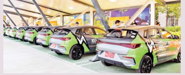
စာမျက်နှာ » ၅

လျှပ်စစ်သုံးယာဉ်များအတွက် မြန်မာနိုင်ငံ၏ ပထမဆုံးသော လျှပ်စစ်ဓာတ်အား ဖြည့်သွင်းရုံ စတင်ဖွင့်လှစ်