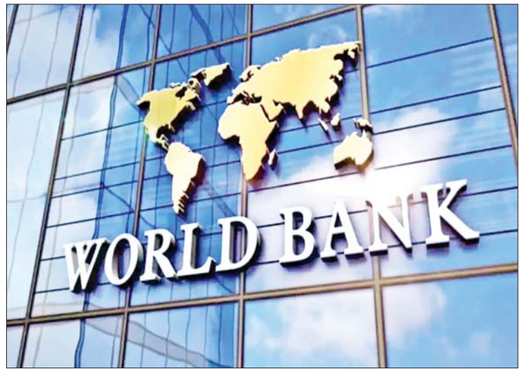
ခြင်းကို ဦးစားပေးလုပ်ဆောင်မည့် အိန္ဒိယ အစိုးရ၏ ကြိုးပမ်းမှုများကို ပံ့ပိုးပေးမည် ဖြစ်ကြောင်း သိရသည်။ ကိုးကား - ဆင်ယွာဘာသာပြန် - အလင်းသစ်

၌ ဖြစ်ပွားလာဖွယ်ရှိသည့် ကပ်ရောဂါများကို ရှာဖွေကာ အဆင့်မြှင့်တင်ပေးစေရန် အိန္ဒိယအစိုးရ၏ စောင့်ကြည့်ရေးစနစ်ကို ပြင်ဆင်ရန် ကြိုးပမ်းမှုများကို ပံ့ပိုးပေးမည်ဖြစ်ကြောင်း သိရသည်။ ပိုမိုကောင်းမွန်သော ကျန်းမာရေးဝန်ဆောင်မှုများပေးအပ်ခြင်းအစီအစဉ်အတွက် ပေးအပ်မည့် ဒေါ်လာသန်း ၅၀၀ အား အန်ဒရာပရာဒေရှ်၊ ကီရာလာ၊ မီဂါလာယာ၊ ဩရိသ၊ ပန်ဂျပ်၊ တမီလ်နာဒူး၊ ဥတာပရာဒေရှ် စသည့် ပြည်နယ် ခုနစ်ခုတွင် ကျန်းမာရေးဝန်ဆောင်မှုပေး