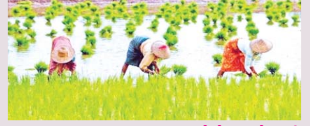
ဆောင်းပါး စာမျက်နှာ » ၆

မြန်မာ့တောင်သူလယ်သမားတို့ဘဝ အေးချမ်းရမည်