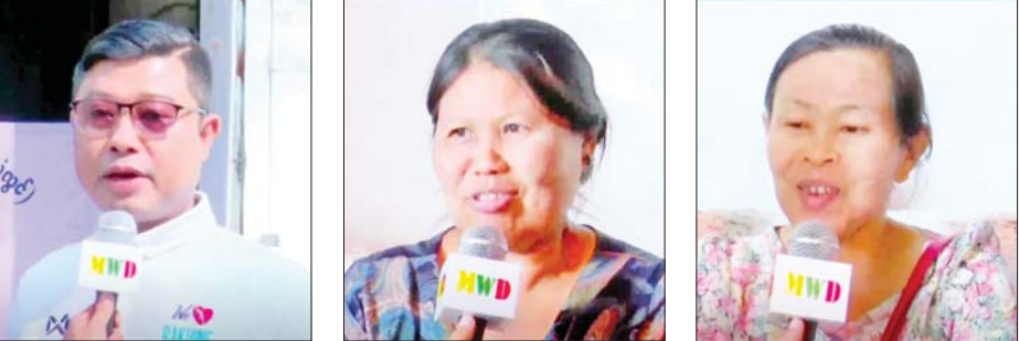
ဒေသခံပြည်သူများ

ရောက်ကုသရန်လိုအပ်သူ ၁၇ ဦးတို့ကို နီးစပ်ရာ တပ်မတော်ဆေးရုံများနှင့် ပြည်သူ့ဆေးရုံများသို့ တက်ရောက်ကုသနိုင်ရေး စီစဉ်ဆောင်ရွက်ပေးသည်။ ကြည့်ရှုအားပေး ယင်းသို့ ဆောင်ရွက်ပေးနေမှုများကို အနောက် ပိုင်းတိုင်းစစ်ဌာနချုပ်မှ တာဝန်ရှိသူများက သွားရောက် ကြည့်ရှုအားပေးပြီး လိုအပ်သည်များ ညှိနှိုင်းဆောင် ရွက်ပေးသည်။ ကျန်းမာရေးဆောင်ရွက်ပေးမှုအပေါ် ဒေသခံပြည်သူများ၏ စကားသံများကို ယခုကဲ့သို့ ကြားသိခဲ့ရသည်-