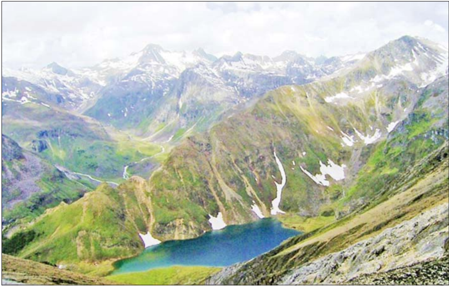
ခါကာဘိုရာဇီအမျိုးသားဥယျာဉ်၏အလှကို တွေ့ရစဉ်။

မြန်မာနိုင်ငံသည် အရှေ့တောင်အာရှကုန်းမြေ ဒေသတွင် အကြီးဆုံးနိုင်ငံဖြစ်သည်။ မြန်မာနိုင်ငံ၏ ဧရိယာ ၄၀ ရာခိုင်နှုန်းသည် တောင်တန်းများ ဖြစ်ပြီး ကချင်ပြည်နယ်တွင် ဟိမဝန္တာအရှေ့ဖျားမှ ဆင်းသက်လာသောတောင်တန်းများ၊ ချင်းတောင်တန်း၊ အနောက်ဘက်ကုန်းမြင့်ဒေသ၊ ပဲခူးရိုးမ၊ အရှေ့ဘက်ကုန်းမြင့်ဒေသနှင့် တနင်္သာရီတောင်တန်း တို့ရှိပြီး မြေမျက်နှာသွင်ပြင်အမျိုးမျိုးနှင့် များပြားသော မြစ်များ၊ ချောင်းများ၊ ကွဲပြားခြားနားသော ရာသီဥတုအခြေအနေတို့မှ မျိုးစိတ်အများအပြား ရှင်သန်မှုဖြင့် ဂေဟစနစ်အမျိုးမျိုးကို ရှင်သန်စေလျက်ရှိသည်။ ထိုသို့ ဂေဟစနစ်မျိုးစုံကိုပိုင်ဆိုင်ထားသော နိုင်ငံတစ်နိုင်ငံအနေဖြင့် ရုက္ခနှင့် ဇီဝသုတေသနလုပ်ငန်းများစွာ ဖော်ထုတ်မှုမှ နိုင်ငံအတွက် သိပ္ပံစွမ်းအင်ကို အထောက်အပံ့ဖြစ်စေသည်။