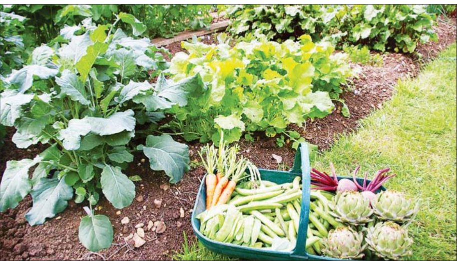
နွေကံ့ကော်(မြို့လှ)

နိုင်ငံတော်စီမံအုပ်ချုပ်ရေးကောင်စီ ဥက္ကဋ္ဌ တပ်မတော်ကာကွယ်ရေးဦးစီးချုပ် ဗိုလ်ချုပ်မှူးကြီး မင်းအောင်လှိုင် အနောက်ပိုင်းတိုင်းစစ်ဌာနချုပ် စစ်တွေတပ်နယ်မှ အရာရှိ၊ စစ်သည်၊ မိသားစုများ အား တွေ့ဆုံအမှာစကားပြောကြားခဲ့သည့် သတင်းကို ၂၆-၂-၂၀၂၃ ရက်က မြဝတီရုပ်မြင်သံကြားတွင် ကြည့်လိုက်ရပါသည်။ “မည်သည့်ကိစ္စတွင်မဆို လူသာလျှင် အရေးအကြီးဆုံးဖြစ်ကြောင်း၊ လူသာလျှင် ပစာနဟု ဆိုကြခြင်းဖြစ်ကြောင်း၊ နိုင်ငံ၏ နိုင်ငံရေး၊ စီးပွားရေး၊ လူမှုရေး စသည့်အရေးကိစ္စ အားလုံး၌ လူပီဝင်ဆောင်ရွက်ရပြီး လူ၏ဦးဆောင်မှု လူ၏လိုက်နာဆောင်ရွက်မှု လူ၏ပြုပြင်ဖန်တီးမှုတို့ သည် အဓိကကျကြောင်း၊ ထို့ကြောင့် လူတစ်ဦးချင်း အရည်အသွေး၊ အရည်အချင်းမြင့်မားနေစေရေး ဆောင်ရွက်ရမည်” ဟူသော လမ်းညွှန်ချက်ကို ရုပ်မြင်သံကြားမှတစ်ဆင့်နာခံရင်း အခုရက်ပိုင်း အတွင်း ကျွန်တော့်အာရုံထဲရှိနေသည့် အကြောင်း အရာလေးတစ်ခု ခေါင်းထဲပြန်ရောက်လာခဲ့သည်။ လက်ရှိ ကျွန်တော်နေရာသည့် အိမ်သစ်သို့ပြောင်းရွှေ့ခဲ့သည်မှာ လပိုင်းမျှသာရှိပါသေးသည်။