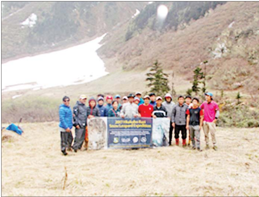
ပြည်ပပညာရှင်သုံးဦးနှင့် ခါကာဘိုရာဇီအမျိုးသားဥယျာဉ်ဝန်ထမ်းများ၏ နှင်းကျားသစ်သုတေသန ခရီးစဉ်။

မြန်မာပြည်မြောက်ပိုင်းရှိ နှင်းကျားသစ် လေ့လာရေးခရီးစဉ်တွင် ပူတာအိုမြို့ရှိ ခါကာဘိုရာဇီ အမျိုးသားဥယျာဉ်မှ ဝန်ထမ်းများနှင့် ပြည်ပ ပညာရှင်သုံးဦးပါသောအဖွဲ့သည် ဂန်လန်ရာဇီရေခဲ တောင်သို့ ၂၀၁၇ ခုနှစ် မေလမှ ဇွန်လအထိ စခန်း နှစ်နေရာပြောင်းရွှေ့ပြီး နှင်းကျားသစ်ပုံရိပ်ရန် Camera Trap (၇၁)လုံးတပ်ဆင်၍ သုတေသနပြု လုပ်ခဲ့ကြသည်။ စခန်းနှစ်နေရာတွင် စခန်း(၁)သည် အမြင့်ပေ ၁၁၆၄၈ ပေရှိပြီး ကင်မရာပျံ့တစ်ခုမှ တစ်ခုသို့ မီတာ ၅၀၀ အကွာတွင် ကင်မရာ ၄၆ လုံးကို တပ်ဆင်ခဲ့ကြသည်။ စခန်း(၂)သည် အမြင့်ပေ ၁၁၇၀၅ ပေရှိပြီး ကင်မရာ ၂၅ လုံးတပ်ဆင်ခဲ့ကြသည်။ ထိုကင်မရာများတပ်ဆင်ခဲ့သော ဂန်လန်ရာဇီ ရေခဲတောင်သည် အမြင့်ပေ ၁၇၀၀၀ အထိမြင့်ပြီး မိုးသည်းထန်စွာရွာသွန်းသည့်အပြင် ရေစီးသန်သော ကျောက်ချောင်းများကိုဖြတ်သန်း၍ မြေဆိုးများ အန္တရာယ်ကိုသတိပြုကာ သဘာဝအန္တရာယ်များ ကြားတွင် ကြမ်းတမ်းသောရာသီဥတုကိုဖြတ်သန်း ခဲ့ကြသည်။ လမ်းပန်းဆက်သွယ်ရေးခက်ခဲခြင်း၊ အဆက်အသွယ်ပြတ်တောက်ခြင်း၊ ရေခဲမြစ်ပျော် ကျလာချိန်တွင် အသက်အန္တရာယ်ရှိခြင်း၊ တောင် တက်ဝတ်စုံ၊ Field Equipmentနှင့် သုတေသန လုပ်ငန်းသုံး အထောက်အကူပစ္စည်းများ လိုအပ်မှု ကြောင့် ပြည်ပပညာရှင် သုံးဦးနှင့် အထမ်းသမားများ တောစခန်းမှ ပြန်လည်ဆုတ်ခွာသွားသော်လည်း ဒေသခံဝန်ထမ်းတို့သည် မီတာ ၅၀၀ တိုင်းတွင် ကင်မရာကိုလုံးကို ဆက်လက်တပ်ဆင်နိုင်ခဲ့ကြ သည်။ အဆိုပါကင်မရာ ကိုးလုံးကို တပ်ဆင်သော