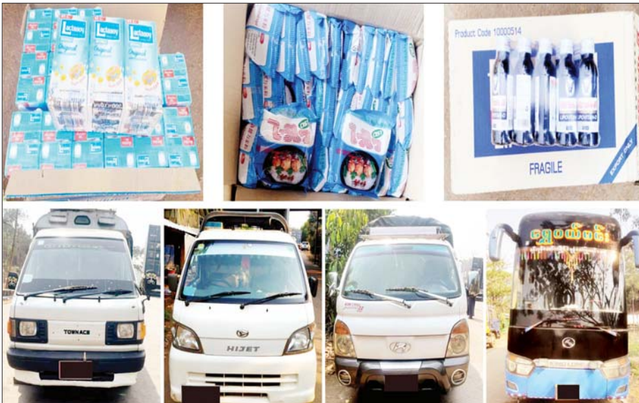
မွန်ပြည်နယ် မရမ်းချောင်းအမြဲတမ်းစစ်ဆေးရေးစခန်းမှ ပူးပေါင်းအဖွဲ့က သိမ်းဆည်းရမိမှု။

နေပြည်တော် မတ် ၄ တရားမဝင် ကုန်သွယ်မှု တိုက်ဖျက်ရေး ဦးဆောင်ကော်မတီ၏ ကြီးကြပ်ကွပ်ကဲမှုဖြင့် တရားမဝင် ကုန်သွယ်မှုများကို ဥပဒေနှင့်အညီ ထိရောက်စွာ တားဆီး အရေးယူနိုင်ရေး ဆောင်ရွက်လျက်ရှိရာ အကောက်ခွန်ဦးစီးဌာန၏ စီမံခန့်ခွဲမှုဖြင့် မတ် ၁ ရက်တွင် ရန်ကုန်အပြည်ပြည်ဆိုင်ရာလေဆိပ်၌ တာဝန်ကျ အကောက်ခွန်အဖွဲ့က စစ်ဆေးမှုများ ဆောင်ရွက်ခဲ့ရာ ခရီးသည် ဝန်စည်အတွင်းမှ တရားဝင် စာရွက်စာတမ်း အထောက်အထား တင်ပြနိုင်ခြင်းမရှိသည့် ကျောက်စိမ်းဟု ယူဆရသော လက်ကောက် ရှစ်ကွင်း အပါအဝင် ပစ္စည်း ငါးမျိုး (ခန့်မှန်းတန်ဖိုး ငွေကျပ် ၁၀၅၀၀၀၀) ကို လည်းကောင်း၊ မတ် ၂ ရက်တွင် မွန်ပြည်နယ်မရမ်းချောင်းအမြဲတမ်း စစ်ဆေးရေးစခန်းမှ ပူးပေါင်းအဖွဲ့က စစ်ဆေးမှုများ ဆောင်ရွက်ခဲ့ရာ ရန်ကုန်-မြဝတီ ပြည်ထောင်စုလမ်းမကြီး မိုင်တိုင်အမှတ် ၉၅ မိုင်လေးဖာလုံ ရွှေညောင်ပင်အနီး PUMA ဆီဆိုင်ဘေး ရှောင်ကွင်းလမ်းထိပ်တွင် ရပ်တန့်ထားသော ယာဉ်သုံးစီးပေါ်မှ တရားဝင် စာရွက်စာတမ်းအထောက်အထား တင်ပြနိုင်ခြင်းမရှိသည့် Lactasoy ၃၀၀ မီလီလီတာဘူးပါ ၂၂၅ ဖာနှင့် Wai Wai တံဆိပ်ပါ ကြာဆံထုပ် ၁၀၀ ဖာ (ခန့်မှန်းတန်ဖိုးငွေကျပ် ၈၆၀၀၀၀)နှင့် အဆိုပါပစ္စည်းများ တင်ဆောင်သော ယာဉ်သုံးစီး (ခန့်မှန်း တန်ဖိုးငွေကျပ် ၅၇၀၀၀၀၀) ကိုလည်းကောင်း၊ မရမ်းချောင်းအမြဲတမ်းစစ်ဆေးရေးစခန်း၌ ဝင်ရောက်အစစ်ဆေးခံသည့် ရေးမြို့မှ ရန်ကုန်မြို့သို့ ထွက်ခွာလာသော ယာဉ်တစ်စီးပေါ်မှ တရားဝင်စာရွက်စာတမ်း အထောက်အထား တင်ပြနိုင်ခြင်း မရှိသည့် Lactasoy ၁၂၅ မီလီလီတာ ဘူးပါ ၁၅၀ နှင့် Lipovitan-D ၅၂၀၀ (ခန့်မှန်း တန်ဖိုးငွေကျပ် ၄၃၅၀၀၀) နှင့် အဆိုပါပစ္စည်းများ တင်ဆောင်သောယာဉ်တစ်စီး (ခန့်မှန်းတန်ဖိုး ငွေကျပ် ၃၀၀၀၀၀၀) ကိုလည်းကောင်း စုစုပေါင်းခန့်မှန်း