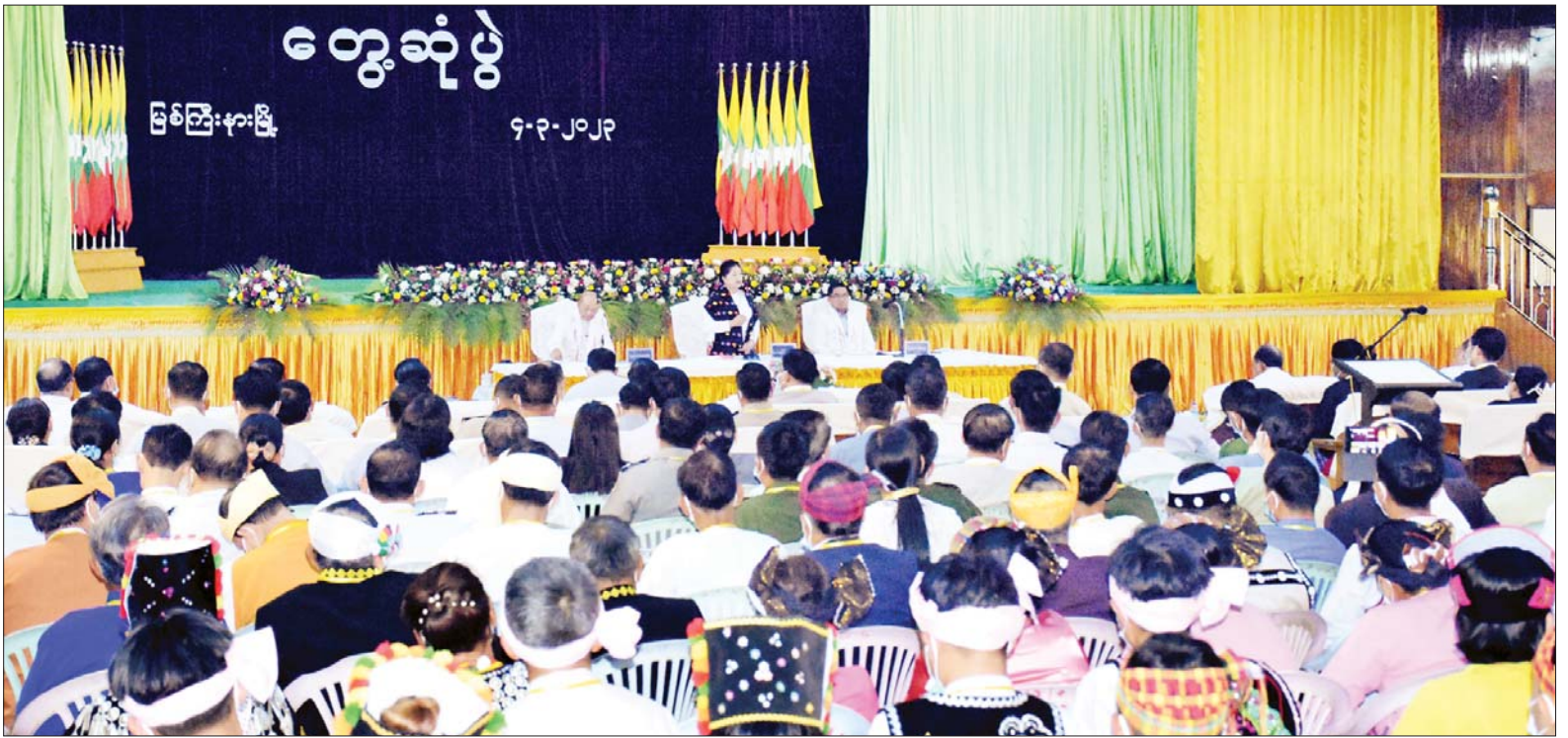
နိုင်ငံတော်စီမံအုပ်ချုပ်ရေးကောင်စီအဖွဲ့ဝင် ဒေါ်ခွဲဘူ မြစ်ကြီးနားမြို့ မြို့တော်ခန်းမ၌ ကျင်းပသည့် လူထုတွေ့ဆုံပွဲအခမ်းအနားတွင် အမှာစကားပြောကြားစဉ်။

ဆက်လက်၍ နိုင်ငံတော်စီမံ အုပ်ချုပ်ရေးကောင်စီအဖွဲ့ဝင်၊ ပြည်ထောင်စုဝန်ကြီး နှင့် ပြည်နယ် ဝန်ကြီးချုပ်တို့က ဘာသာရေးအသင်းအဖွဲ့ အသီးသီး အတွက် လက်ဆောင်ခြင်းနှင့်