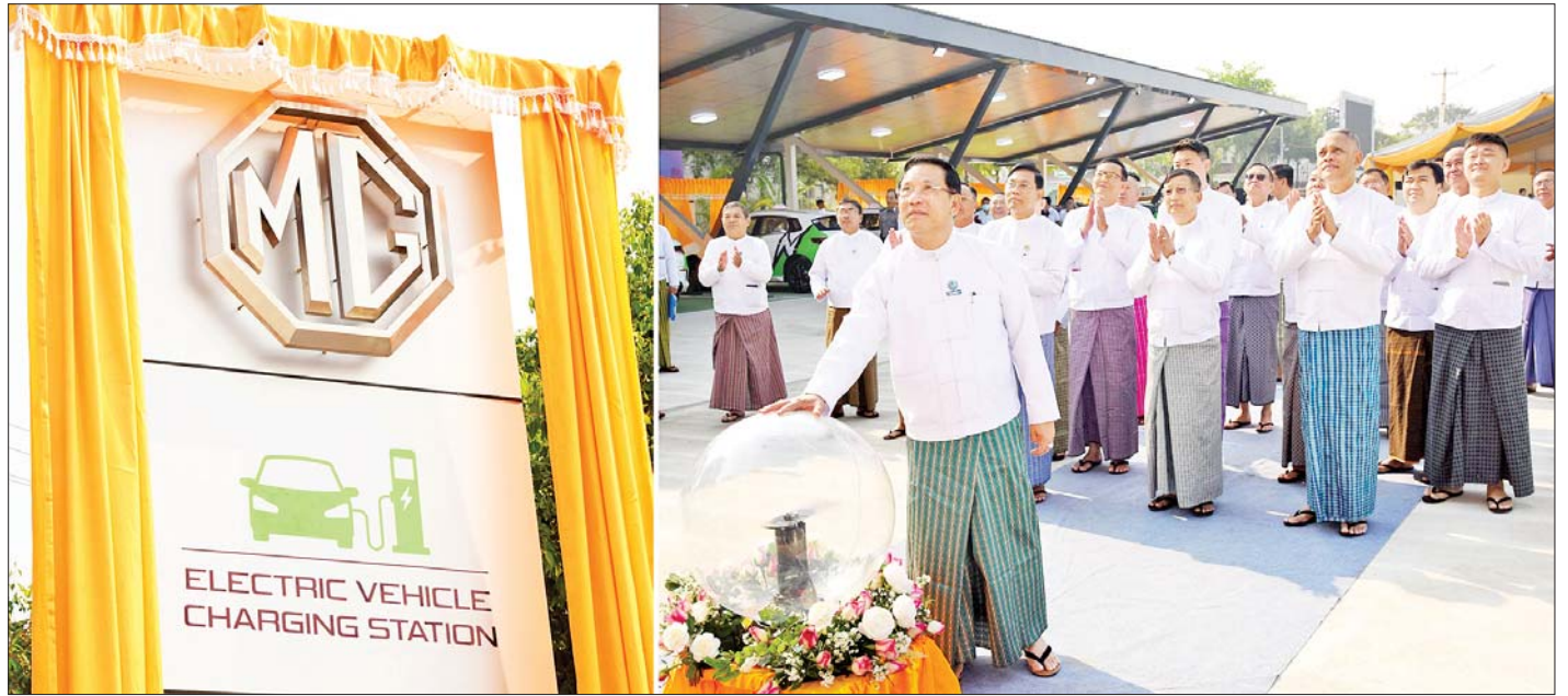
ပြည်ထောင်စုဝန်ကြီး ဦးမောင်မောင်အုန်းက Electric Vehicle Charging Station ဆိုင်းဘုတ်ကို စက်ခလုတ်နှိပ်ဖွင့်လှစ်ပေးစဉ်။

ထို့နောက် စီးပွားရေးနှင့်ကူးသန်းရောင်းဝယ်ရေးဝန်ကြီးဌာန ပြည်ထောင်စုဝန်ကြီး ဦးအောင်နိုင်ဦး၊ ဆောက်လုပ်ရေးဝန်ကြီးဌာန ပြည်ထောင်စုဝန်ကြီး ဦးမျိုးသန့်နှင့် နေပြည်တော်ကောင်စီဥက္ကဋ္ဌတို့က လျှပ်စစ်သုံးယာဉ်များအတွက် ပထမဦးဆုံး လျှပ်စစ်