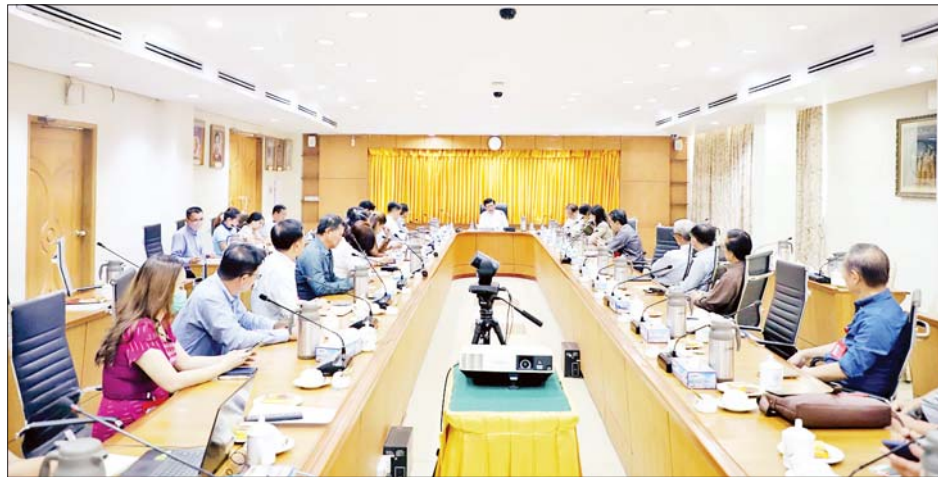
သယ်ယူပို့ဆောင်ရေးအပါအဝင် ပညာရေး၊ ကျန်းမာ ကျယ်ပြန့်စွာပါဝင်သည့်အတွက် ဦးစားပေးဆောင်ရွက် ရေး၊ ဖျော်ဖြေရေးအထိ ဝန်ဆောင်မှုကဏ္ဍများ လိုသည့်ကဏ္ဍအလိုက် ဆပ်ကော်မတီများ ထပ်မံ

အစည်းအဝေးတွင် အသေးစား၊ အငယ်စား၊ အလတ်စားလုပ်ငန်းများ ဖွံ့ဖြိုးတိုးတက်ရေးအတွက် ရှေ့ဆက်ဆောင်ရွက်မည့် လုပ်ငန်းစဉ်များ၊ အသေးစား၊ အငယ်စား၊ အလတ်စား လုပ်ငန်းများ တွင် စိုက်ပျိုးမွေးမြူရေးကဏ္ဍ၊ ကုန်ထုတ်လုပ်မှုကဏ္ဍ၊