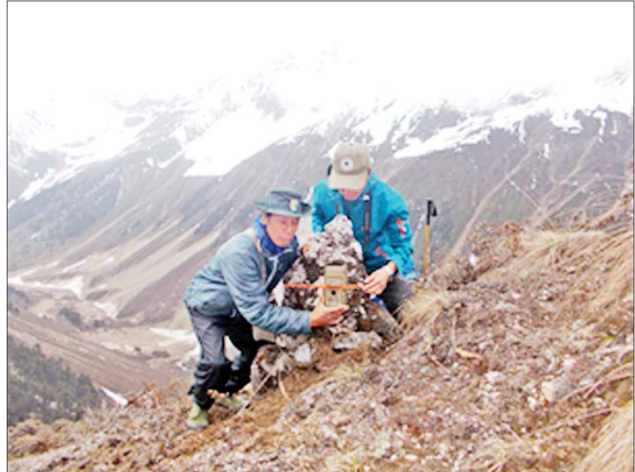
ခါကာဘိုရာဇီအမျိုးသားဥယျာဉ်ဝန်ထမ်းများ နှင်းကျားသစ်ထောင်ချောက်များကို တပ်ဆင်နေကြစဉ်။

ခါကာဘိုရာဇီအမျိုးသားဥယျာဉ်သည် ကချင်ပြည်နယ် နောင်မွန်မြို့နယ် ပန်နန်းဒင်မြို့တွင် တည်ရှိပြီး ၁၉၉၆ ခုနှစ် ဇန်နဝါရီလ ၃ ရက်နေ့တွင် သဘာဝထိန်းသိမ်းရေးနယ်မြေအဖြစ်လည်းကောင်း၊ ၁၉၉၈ ခုနှစ် နိုဝင်ဘာလ ၁၀ ရက်နေ့တွင် အမျိုးသားဥယျာဉ်အဖြစ်လည်းကောင်း၊ ၂၀၀၃ ခုနှစ်တွင် အာဆီယံအမွေအနှစ်ဥယျာဉ်အဖြစ်လည်းကောင်း သတ်မှတ်ခံထားရသော အမျိုးသားဥယျာဉ်တစ်ခုဖြစ်သည်။ ခါကာဘိုရာဇီ အမျိုးသားဥယျာဉ်သည် ၁၄၇၂