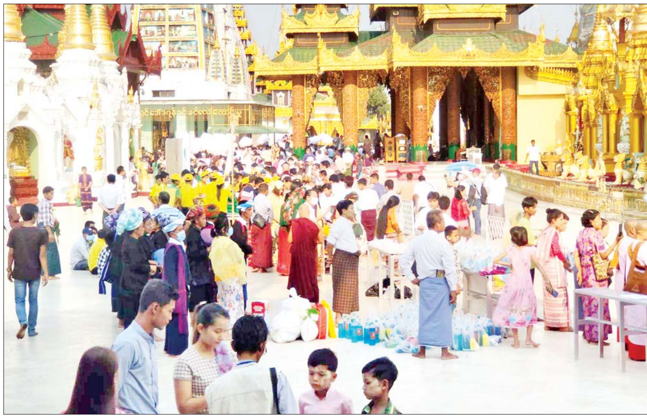
လေးဆူဓာတ်ပုံ ရွှေတိဂုံစေတီတော်မြတ်ကြီး၌ ဝင်ရောက်ဖူးမြော်ကြသော ဘုရားဖူးပြည်သူများကို တွေ့ရစဉ်။

ရန်ကုန်တိုင်းဒေသကြီး သီရိဗြဟ္မာရတနာတော်၌ တည်ထားတော်မူသည့် လေးဆူဓာတ်ပုံ ရွှေတိဂုံစေတီတော်မြတ်ကြီးသို့ ပြည်တွင်း ပြည်ပမှ ဘုရားဖူးဧည့်သည်များ လာရောက်ဖူးမြော်လျက်ရှိရာ ယခုနှစ် ဇန်နဝါရီလနှင့် ဖေဖော်ဝါရီလအတွင်း ပြည်တွင်း ပြည်ပမှ ဘုရားဖူးဧည့်သည်ဦးရေ ၁၈၄၅၀၇၅ ဦးကျော် ဝင်ရောက်ဖူးမြော်ကြည့်ညှိကုသိုလ်ယူခဲ့ကြကြောင်း သိရသည်။