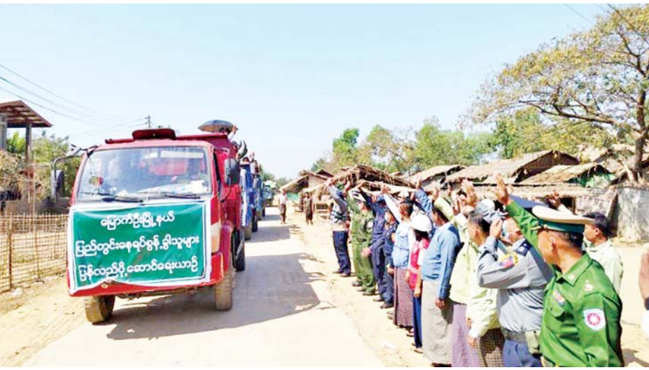
က ရခိုင်ပြည်နယ်အစိုးရအဖွဲ့က ထောက်ပံ့သည့် အိမ်ထောင်စု တစ်စုလျှင် ငွေကျပ် ၅၀၀၀၀ နှုန်းဖြင့် အိမ်ထောင်စု ၁၄၂ စုအတွက် ငွေကျပ် သိန်း ၇၁၀ ကို လည်းကောင်း၊ ဘေးအန္တရာယ်ဆိုင်ရာစီမံခန့်ခွဲမှု ဦးစီးဌာနမှ ထောက်ပံ့သည့် အိမ်ထောင်စု တစ်စုလျှင် ငွေကျပ် ၁၀၀၀၀ နှုန်းဖြင့် ငွေကျပ် ၁၄၂ သိန်း၊ ဘေးအန္တရာယ်ဆိုင်ရာ စီမံခန့်ခွဲမှုဦးစီးဌာနမှ ထောက်ပံ့သည့် ဆန်ရိက္ခာဖိုးငွေ တစ်လစာအတွက်

နေပြည်တော် မတ် ၄ ရခိုင်ပြည်နယ် မြောက်ဦးမြို့နယ်အတွင်းရှိ ရှေ့မယ်၊ လက်ကောက်ဈေး၊ ထမ္မရာဇာ၊ တောင်မြင့်၊ ဝက်လှ၊ မြို့သစ်၊ ကိုးနင်းနှင့် ပြလှယာယီခိုလှုံရာ စခန်းများ၌ ခေတ္တခိုလှုံနေထိုင်လျက်ရှိသော ယာယီ တိုက်ပွဲရှောင် အိမ်ထောင်စုဝင်မိသားစုများသည် ၎င်းတို့၏ သဘောဆန္ဒဖြင့် မူလနေရပ်ဒေသများသို့ ပြန်လည်နေထိုင်ကြမည်ဖြစ်ရာ အဆိုပါ အိမ်ထောင်စု ဝင်များ လတ်တလောစားသောက်နေထိုင်ရေး အဆင်ပြေစေရန်အတွက် ထောက်ပံ့ငွေနှင့် လူသုံးကုန် ပစ္စည်းများထောက်ပံ့ပေးအပ်ခြင်းကို ယနေ့နံနက် ပိုင်းတွင် မြောက်ဦးရခိုင် အထွေထွေအုပ်ချုပ်ရေးဦးစီး ဌာန အစည်းအဝေးခန်းမ၌ ပြုလုပ်ရာ အနောက်ပိုင်း တိုင်းစစ်ဌာနချုပ် မြောက်ဦးတပ်နယ်မှ တာဝန်ရှိသူ များ၊ ဌာနဆိုင်ရာတာဝန်ရှိသူများနှင့် နေရပ်ပြန် အိမ်ထောင်စုဝင်များ တက်ရောက်ကြသည်။