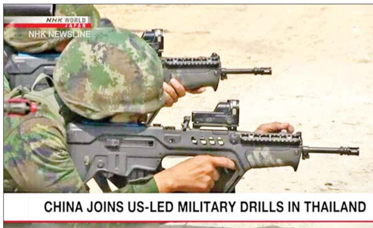
CHINA JOINS US-LED MILITARY DRILLS IN THAILAND