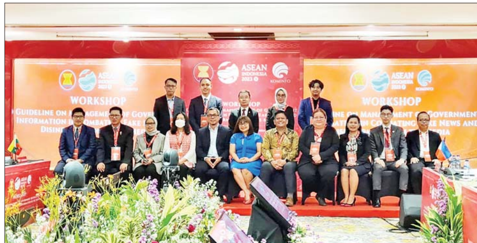
တက်ရောက်ကြသူများ အလုပ်ရုံဆွေးနွေးပွဲတွင် အာဆီယံအဖွဲ့ဝင် နိုင်ငံများမှ ကိုယ်စားလှယ်များက သတင်းတု၊ သတင်းမှား တိုက်ဖျက်ရေး လမ်းညွှန်ချက်များ ထုတ်ပြန်ရန် ရေးဆွဲထားသော မိမိတို့နိုင်ငံ အခြေ အနေများနှင့် ချိန်ထိုး၍ ဆွေးနွေးကြသည်။ မြန်မာ