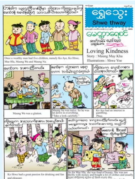
ရွှေသွေး Shwe thway မေတ္တာရောင် Loving Kindness Story: Maung May Kha Illustrations: Shwe Yoe