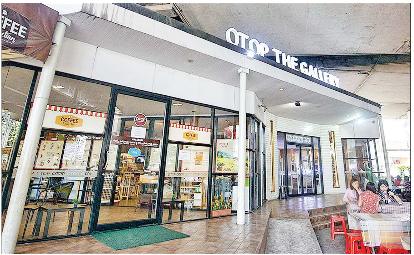
ထိုင်းနိုင်ငံမှ OTOP ထုတ်ကုန်များရောင်းချသည့် OTOP ဆိုင်ကြီးတစ်ဆိုင်။

စင်စစ်မှ ၁၉၆၀ ပြည့်လွန်နှစ်များမှစ၍ နိုင်ငံ၏