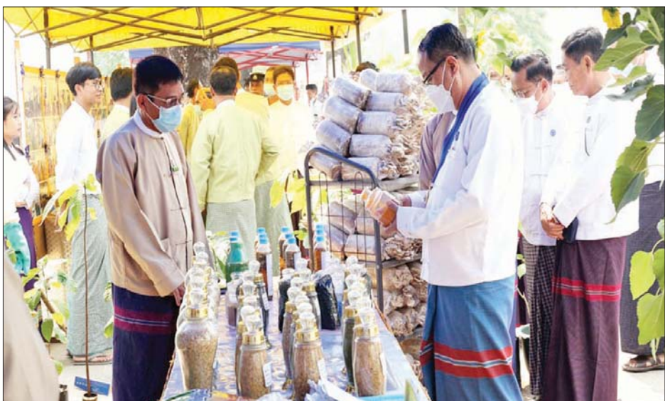
သက်ဆိုင်ရာတာဝန်ရှိသူများက ပြခန်းပြကွက်များ ဝန်ကြီးချုပ်က လိုအပ်သည်များကို လမ်းညွှန်မှာကြားနှင့် စပ်လျဉ်း၍ ရှင်းလင်းတင်ပြကြပြီး ပြည်နယ် ခွဲကြောင်း သိရသည်။ ပြည်နယ် (ပြန်/ဆက်)

အခမ်းအနားအပြီးတွင် ပြည်နယ်ဝန်ကြီးချုပ်နှင့် တက်ရောက်လာသူများသည် ပြန်ကြားရေးနှင့် ပြည်သူ့ဆက်ဆံရေးဦးစီးဌာနက ခင်းကျင်းပြသထားသော ကရင်ပြည်နယ်အစိုးရအဖွဲ့၏တောင်သူအကျိုးပြုစိုက်ပျိုးမွေးမြူရေးဆိုင်ရာ ဆောင်ရွက်မှုမှတ်တမ်းဓာတ်ပုံများ၊ ပြည်နယ်ငါးလုပ်ငန်းဦးစီးဌာန ပြခန်း၊ ပျားမွေးမြူမှုဖွံ့ဖြိုးရေးဌာနပြခန်း၊ မွေးမြူရေးနှင့် ကုသရေးဦးစီးဌာနပြခန်း၊ စိုက်ပျိုးရေးဦးစီးဌာနပြခန်းတို့ကို လှည့်လည်ကြည့်ရှု အားပေးခဲ့ကြရာ