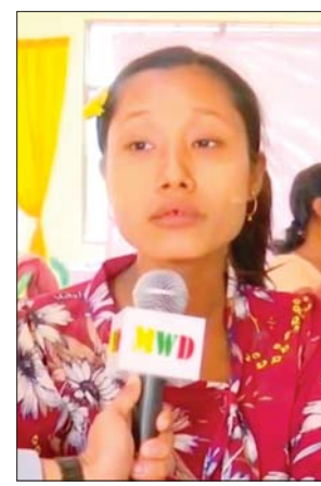
ဒေသခံပြည်သူများ

ရေယာဉ် (သံလွင်)ပေါ်ရှိ ခွဲစိတ်လူနာများနှင့် မျက်စိခွဲစိတ်လူနာများအား အာဟာရဖြည့်စားသောက်ဖွယ်ရာများ၊ လက်ဆောင်ပစ္စည်း