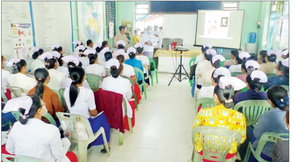
ကြပ်မတ်ကုသတိုးချဲ့ဆောင်သစ် တည်ဆောက်ပြီးစီး သည်များ ပေါင်းစပ်ညှိနှိုင်းဆောင်ရွက်ပေးခဲ့ကြောင်း နေမှုအခြေအနေများကို ကြည့်ရှုစစ်ဆေးပြီး လိုအပ် သိရသည်။ ခရိုင်(ပြန်/ဆက်)

မှု ခံယူလျက်ရှိသည့် နားနှင့် အကြားအာရုံ လူနာများအား ရင်းရင်းနှီးနှီး လိုက်လံအားပေးစကားပြောကြားပြီး လိုအပ်သည့် ဆေးဝါးများနှင့် အာဟာရဖြည့်စွက်စာများ၊ အလှူငွေများ ပေးအပ်လျှဒါန်းသည်။ ထို့နောက် ချောင်းဆုံမြို့နယ် ပြည်သူ့ဆေးရုံကြီးတွင် ကျေးလက်ကျန်းမာရေးဌာနမှ ကျန်းမာရေးဝန်ထမ်းများအား နားနှင့် အကြားအာရုံအကြောင်း သိကောင်းစရာများ သင်ကြားပို့ချပေးနေမှုအပေါ် ကြည့်ရှုအားပေးကာ ပြည်နယ်ဝန်ကြီးချုပ်က ကျန်းမာရေးစောင့်ရှောက်မှုလုပ်ငန်းများ အရည်အသွေးပြည့်မီစွာ ကုသနိုင်ရေး ဆောင်ရွက်ကြရန်နှင့် ပြည်သူများ ယုံကြည်အားကိုးရသော ကျန်းမာရေးဝန်ထမ်းကောင်းများ ပေါ်ထွန်းလာစေရေး ဆောင်ရွက်သွားကြရန် လမ်းညွှန်မှာကြားကာ လိုအပ်သည်များ ဖြည့်ဆည်းဆောင်ရွက်ပေးသည်။ ယင်းနောက် ပြည်နယ်ဝန်ကြီးချုပ်သည် အထူး