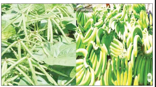
မြေထောက်ပဲ တစ်သျှူးငှက်ပျော

နေပြည်တော် မတ် ၁ လွယ်ဂျယ်ကုန်သွယ်ရေးစခန်းမှ ဖေဖော်ဝါရီ ၂၈ ရက်တွင် လယ်ယာထွက်ကုန်အနေဖြင့် ဆန်ကားစီးရေ ခြောက်စီး (တန်ချိန် ၁၉၈ ဒသမ ၅ တန်)၊ ဆန်ကွဲကားစီးရေ သုံးစီး (တန်ချိန် ၁၀၀)၊ တစ်သျှူး ငှက်ပျော ကားစီးရေ ၃၃ စီး (တန်ချိန် ၅၂၈ တန်)၊ မြေထောက်ပဲကားစီးရေ တစ်စီး (တန်ချိန် ၃၂ ဒသမ ၅ တန်)၊ ပဲယင်းသုံးစီး (၉၉ ဒသမ ၇၅ တန်)၊ ပဲတီစိမ်း နှစ်စီး (၆၄ တန်) တင်ပို့နိုင်ခဲ့သည်။ တစ်ဖက်နိုင်ငံမှ ကုန်စုံ ကားစီးရေ နှစ်စီး (တန်ချိန် ၁၄ ဒသမ ၄၅ တန်) တင်သွင်းနိုင်ခဲ့သည်။ ကုန်သွယ်မှုလမ်းကြောင်းမှာ ပုံမှန်အတိုင်း ကောင်းမွန်လျက်ရှိကြောင်း သိရသည်။