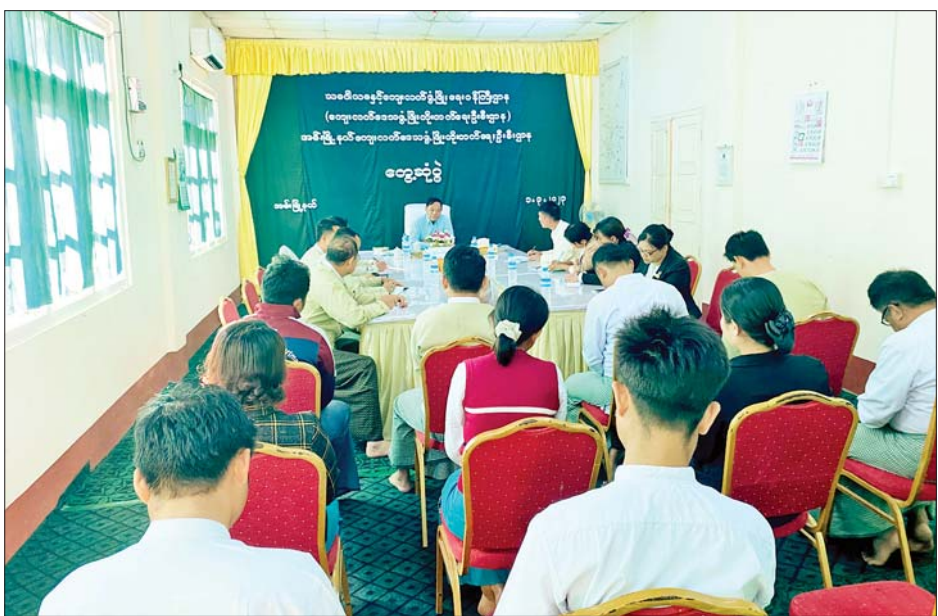
ပြည်ထောင်စုဝန်ကြီးက လိုအပ်သည်များ ဖြည့်စွက် မှာကြားခဲ့၍ ဝန်ထမ်းများ၏ လိုအပ်ချက်များ

ဆက်လက်ပြီး ဦးစီးဌာနများမှ တာဝန်ရှိသူများက လုပ်ငန်းဆောင်ရွက်နေမှုကို ရှင်းလင်းတင်ပြရာ