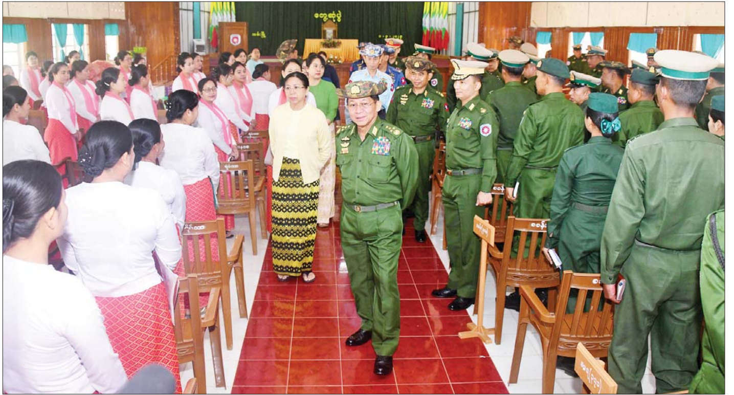
နိုင်ငံတော်စီမံအုပ်ချုပ်ရေးကောင်စီဥက္ကဋ္ဌ တပ်မတော်ကာကွယ်ရေးဦးစီးချုပ် ဗိုလ်ချုပ်မှူးကြီး မင်းအောင်လှိုင် အနောက်ပိုင်းတိုင်းစစ်ဌာနချုပ် အမ်းတပ်နယ်မှ အရာရှိ၊ စစ်သည်၊ မိသားစုများအား ရင်းရင်းနှီးနှီး နှုတ်ဆက်စဉ်။

တပ်မတော်အနေဖြင့် တိုင်းရင်းသားလက်နက်ကိုင်ပဋိပက္ခများ ချုပ်ငြိမ်းရေး၊ တရားဥပဒေစိုးမိုးရေးနှင့် ဖွံ့ဖြိုးတိုးတက်ရေးလုပ်ငန်းများကို ဆက်လက်ဆောင်ရွက်နေရမည် ဖြစ်သကဲ့သို့ ပြည်ပရန်ကာကွယ်ရေးအတွက်လည်း Standard Army တစ်ခုဖြစ်စေရေး လိုအပ်သည်များကို ကြိုတင်ပြင်ဆင်ဆောင်ရွက်လျက်ရှိကြောင်း၊ လက်နက်များ စွမ်းအားမြှင့်မားရေး၊ အရာရှိ၊ စစ်သည်များ၏ စွမ်းရည်မြှင့်မားရေးအတွက် အမြဲမပြတ် မြှင့်တင်ဆောင်ရွက်လျက်ရှိကြောင်း၊ တပ်မတော်(ကြည်း၊ ရေလေ)တပ်ဖွဲ့များ အားလုံး အဆင့်မြှင့်တင်ခြင်းများကို စဉ်ဆက်မပြတ် ဆောင်ရွက်ပေးလျက်ရှိသဖြင့် တပ်မတော်၏ စွမ်းပကားမြှင့်တင်ရန်အတွက် စစ်သည်တစ်ဦးချင်း၏ စွမ်းရည်မြှင့်မားစေရေး လေ့ကျင့်ရေးတာဝန်များကိုလည်း မှန်မှန်ကန်ကန်ဆောင်ရွက်ရမည်ဖြစ်ကြောင်း၊ စစ်မြေပြင်တွင် သင်ကြားပေးထားသည့် စစ်အတတ်ပညာများကို စနစ်တကျ အသုံးပြုဆောင်ရွက်ပေးရန်အတွက် ဝန်ထမ်းများ နည်းပါးစေမည်ဖြစ်ကြောင်း၊ ထို့ကြောင့် စစ်သည်တစ်ဦးချင်း၊ တပ်တစ်တပ်ချင်းမှအစပြု၍ တပ်မတော်တစ်ရပ်လုံး စစ်ရေးစွမ်းရည် ထက်မြက်စေရေး ယခုထက်ပိုမိုကြိုးပမ်းဆောင်ရွက်ကြစေလိုကြောင်း။