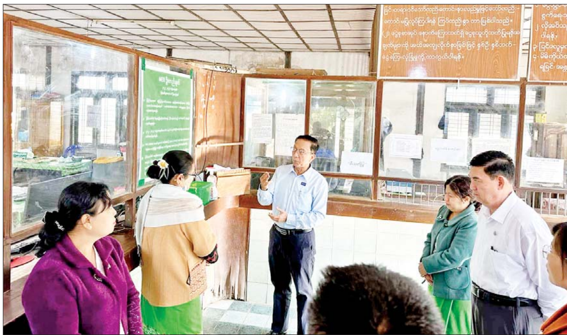
မြန်မာ့လယ်ယာဖွံ့ဖြိုးရေးဘဏ် (ခရိုင်ဘဏ်ခွဲ)နှင့် အကောက်ခွန်ဦးစီးဌာနရုံးများသို့လည်းကောင်း၊ ယနေ့တွင် အမ်းမြို့ရှိ မြန်မာ့စီးပွားရေးဘဏ် (မြို့နယ်ဘဏ်ခွဲ)၊ မြန်မာ့လယ်ယာဖွံ့ဖြိုးရေးဘဏ် (မြို့နယ်ဘဏ်ခွဲ)၊ ပြည်တွင်းအခွန်များဦးစီးဌာနနှင့် စီမံကိန်းရုံးများသို့ လည်းကောင်း ချုပ်နှောင် ပြည်ထောင်စုဝန်ကြီးက ဝန်ထမ်းများအနေဖြင့် နှစ်အလိုက် စီမံကိန်းများကို

ဒုတိယဝန်ကြီးချုပ်နှင့် စီမံကိန်းနှင့် ဘဏ္ဍာရေးဝန်ကြီးဌာန ပြည်ထောင်စုဝန်ကြီး ဦးဝင်းရှိန်သည် ရခိုင်ပြည်နယ် စီးပွားရေးရာဝန်ကြီး ဦးစံရွှေမောင်နှင့် အတူ ဖေဖော်ဝါရီ ၂၆ ရက်တွင် ရခိုင်ပြည်နယ်စစ်တွေမြို့ရှိ စီမံကိန်းရေးဆွဲရေးဦးစီးဌာန ဗဟိုစာရင်းအင်းအဖွဲ့၊ မြန်မာ့စီးပွားရေးဘဏ်၊ မြန်မာ့အာမခံလုပ်ငန်း၊ ရသုံးမှန်းခြေ ငွေစာရင်းဦးစီးဌာန၊ ပြည်တွင်းအခွန်များဦးစီးဌာန၊ အကောက်ခွန်ဦးစီးဌာန၊ ငွေရေးကြေးရေး ကြီးကြပ်စစ်ဆေးရေးဦးစီးဌာနနှင့် ပင်စင်ဦးစီးဌာနတို့မှ ဝန်ထမ်းများကို တွေ့ဆုံသည်။