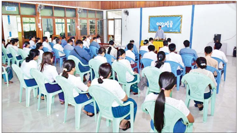
ဝန်ထမ်းများ၊ စစ်ကိုင်းခရိုင် ပြန်ကြားရေးနှင့် ပြည်သူ့ ဆက်ဆံရေးဦးစီးမှူး၊ စစ်ကိုင်းဇုန်ထပ်ဆင့်လွှင့်

မွန်းလွဲပိုင်းတွင် တိုင်းဒေသကြီး ပြန်ကြားရေးနှင့် ပြည်သူ့ဆက်ဆံရေးဦးစီးဌာနရုံး၌ တိုင်းဒေသကြီး ဦးစီးမှူး၊ ခရိုင်ဦးစီးမှူး၊ မြို့နယ်ဦးစီးမှူးများနှင့်