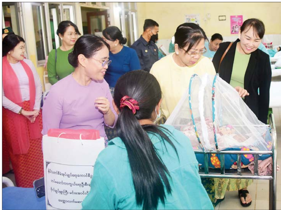
နိုင်ငံတော်စီမံအုပ်ချုပ်ရေးကောင်စီဥက္ကဋ္ဌ တပ်မတော်ကာကွယ်ရေးဦးစီးချုပ် ဗိုလ်ချုပ်မှူးကြီး မင်းအောင်လှိုင်၏ဇနီး ဒေါ်ကြူကြူလှ အမ်းမြို့ရှိ နယ်မြေခံတပ်မတော်ဆေးရုံ၌ တက်ရောက်ကုသမှုခံယူလျက်ရှိသည့် အရာရှိစစ်သည်မိသားစုဝင်များ၏ ကျန်းမာရေးအခြေအနေများကို ရင်းရင်းနှီးနှီး မေးမြန်း အားပေးစကားပြောကြားစဉ်။

ပြည်သူအပေါ် ရေလို လလို ကျင့်ကြံ၊ ဒေသနှင့် တိုင်းပြည်အကျိုးကိုကြည့်၍ တာဝန်ကို ကျေပွန်စွာထမ်းဆောင် ယခင်က ရခိုင်ပြည်နယ်သည် အကြောင်းအမျိုးမျိုးကြောင့် ဖွံ့ဖြိုးတိုးတက်မှု နည်းပါးခဲ့ပြီး လမ်းပန်းဆက်သွယ်မှု ခက်ခဲခြင်းများဖြစ်ပေါ်ခြင်းကြောင့် ဒေသခံများအနေဖြင့် ခေတ်အဆက်ဆက် အစိုးရများအပေါ် ရင်းနှီးနားလည်မှု နည်းပါးခဲ့ကြောင်း၊ ထို့ကြောင့် တပ်မတော်အစိုးရလက်ထက်တွင် ရခိုင်ပြည်နယ် ဖွံ့ဖြိုးတိုးတက်ရေးအတွက် ကနဦးအရေးအကြီးဆုံးဖြစ်သည့် လမ်းပန်းဆက်သွယ်မှုများ ကောင်းမွန်စေရေး ဆောင်ရွက်ပေးခဲ့ကြောင်း၊ စစ်တွေ-ရန်ကုန်လမ်းမကြီးကို ဖောက်လုပ်ပေးခဲ့ကြောင်း၊ ယခင်က သွားလာမှုခက်ခဲခြင်းကြောင့် ဒေသခံရခိုင်လူမျိုးများအနေဖြင့် မြေပြန့်ဒေသရှိ ပြည်သူများနှင့် ထိတွေ့ဆက်ဆံမှု နည်းပါးခဲ့ကြောင်း၊ တိုင်းရင်းသားစည်းလုံးညီညွတ်မှုပြုကြံ့ပြီး ပြည်ထောင်စုကြီး ပြုကြံ့စေရေးကို လိုလားသည့် အချို့သော အဖွဲ့အစည်းများ၏ သွေးထိုးလှုံ့ဆော်မှုများကြောင့် တိုင်းရင်းသားအချင်းချင်း အထင်အမြင်လွဲမှားမှုများကို ပိုမိုဖြစ်ပေါ်စေခဲ့ကြောင်း၊ ထို့ကြောင့် ဒေသတွင်း တာဝန်ထမ်းဆောင်နေကြသူများအနေဖြင့် နယ်မြေဒေသ၏