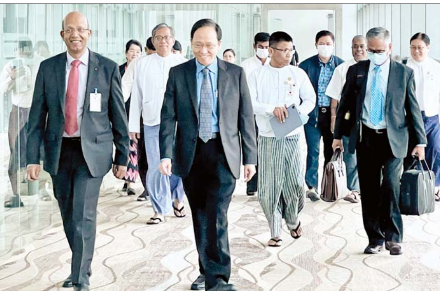
ပို့ဆောင် နှုတ်ဆက်ကြသည်။ ပြည်ထောင်စုဝန်ကြီးနှင့်အတူ အဖွဲ့ဝင်များအဖြစ် ညွှန်ကြားရေးမှူးချုပ်(တိုင်းရင်းဆေးပညာဦးစီးဌာန)၊ ပါမောက္ခချုပ် (မန္တလေးတိုင်းရင်းဆေးတက္ကသိုလ်) နှင့် မြန်မာနိုင်ငံမှ တိုင်းရင်းဆေးလုပ်ငန်းရှင်များ လိုက်ပါသွားကြသည်။ အဆိုပါ တိုင်းရင်းဆေးပညာရပ်ဆိုင်ရာ ညီလာခံနှင့် ပြပွဲကို ရှန်ဟိုင်း ပူးပေါင်းဆောင်ရွက်မှုဆိုင်ရာအဖွဲ့၏ အလှည့်ကျဥက္ကဋ္ဌ ဖြစ်သည့် အိန္ဒိယနိုင်ငံမှ အိမ်ရှင်အဖြစ် လက်ခံကျင်းပခြင်းဖြစ်ပြီး ညီလာခံနှင့် ပြပွဲတွင် ရှန်ဟိုင်း

ကျန်းမာရေး ဝန်ကြီးဌာန ပြည်ထောင်စုဝန်ကြီး ဒေါက်တာသက်ခိုင်ဝင်း ဦးဆောင်သော မြန်မာ့ကိုယ်စားလှယ်အဖွဲ့သည် မတ် ၂ ရက်မှ ၄ ရက်အထိ အိန္ဒိယနိုင်ငံ Guwahati မြို့တွင် ကျင်းပမည့် ရှန်ဟိုင်းပူးပေါင်းဆောင်ရွက်မှုဆိုင်ရာအဖွဲ့ (Shanghai Cooperation Organization)၏ တိုင်းရင်းဆေး ပညာရပ်ဆိုင်ရာ ညီလာခံနှင့် ပြပွဲသို့ တက်ရောက်ရန် ယနေ့နံနက်ပိုင်းတွင် ရန်ကုန်မြို့မှ အိန္ဒိယနိုင်ငံသို့ လေကြောင်းခရီးဖြင့် ထွက်ခွာသွားသည်။