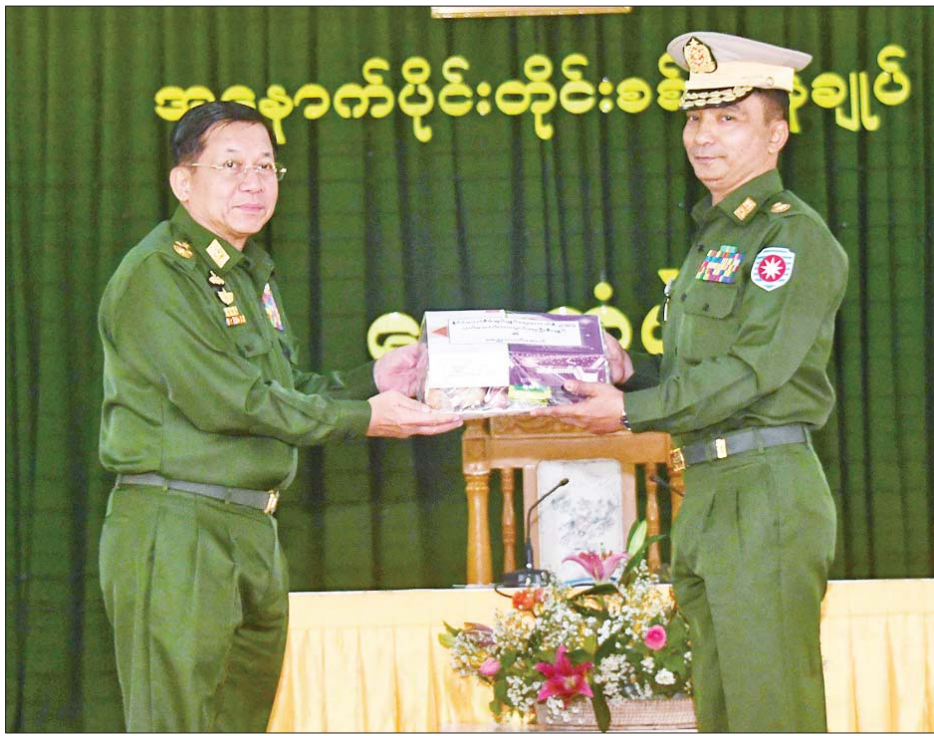
နိုင်ငံတော်စီမံအုပ်ချုပ်ရေးကောင်စီဥက္ကဋ္ဌ တပ်မတော်ကာကွယ်ရေးဦးစီးချုပ် ဗိုလ်ချုပ်မှူးကြီး မင်းအောင်လှိုင် အနောက်ပိုင်းတိုင်းစစ်ဌာနချုပ် အမ်းတပ်နယ်မှ အရာရှိ၊ စစ်သည်၊ မိသားစုများအတွက် စားသောက်ဖွယ်ရာပစ္စည်းများ ပေးအပ်စဉ်။

□ ပြည်သူ့ သမိုင်းအကျဉ်း၊ တိုင်းစစ်ဌာနချုပ်နယ်မြေအတွင်း လုံခြုံရေး၊ နယ်မြေစိုးမိုးရေးနှင့် တရားဥပဒေစိုးမိုးရေး ဆောင်ရွက်နေမှုအခြေအနေများ၊ နယ်စပ်ဒေသ လုံခြုံရေး၊ တည်ငြိမ်အေးချမ်းရေးဆိုင်ရာများ ဆောင်ရွက်ထားရှိမှု၊ မူးယစ်ဆေးဝါးများ ဖမ်းဆီး ရမိရေး ဆောင်ရွက်လျက်ရှိမှု၊ တရားမဝင်ကုန်သွယ်မှု များအား တားဆီးဆောင်ရွက်လျက်ရှိမှု၊ ယာယီနေရပ် စွန့်ခွာသူများအား ၎င်းတို့၏ နေရပ်အသီးသီးသို့ ပြန်လည်ပို့ဆောင်ပေးခြင်းနှင့် လိုအပ်သည့် ကူညီ ထောက်ပံ့မှုများ ဆောင်ရွက်ပေးလျက်ရှိမှု၊ ဒေသခံ ပြည်သူလူထုတို့အား ကျန်းမာရေးစောင့်ရှောက်ပေး နိုင်မှု၊ ပညာရေးရိပ်သာများ ဖွင့်လှစ်၍ ကျောင်းသား၊ ကျောင်းသူများ၏ စားဝတ်နေရေး အဆင်ပြေမှု ရှိအောင် ဆောင်ရွက်ပေးလျက်ရှိမှု၊ တပ်ပိုင်စိုက်ပျိုး မွေးမြူရေးလုပ်ငန်းများမှ သက်သာချောင်ချိရေး ဆောင်ရွက်ပေးနိုင်မှုတို့ကို ရှင်းလင်းတင်ပြသည်။ ရှင်းလင်းတင်ပြမှုများအပေါ် နိုင်ငံတော်စီမံ အုပ်ချုပ်ရေးကောင်စီဥက္ကဋ္ဌ တပ်မတော်ကာကွယ် ရေးဦးစီးချုပ်က တိုင်းစစ်ဌာနချုပ်နယ်မြေအတွင်း တာဝန်ထမ်းဆောင်နေသူများအနေဖြင့် မိမိတို့ တာဝန်ထမ်းဆောင်ရသည့် နယ်မြေဒေသ၏ သမိုင်း ကြောင်း အစဉ်အလာနှင့် ပတ်သက်အခြေအနေမှန်များ ကို သိရှိနားလည်ရမည်ဖြစ်ပြီး ဒေသတွင်း တည်ငြိမ်အေးချမ်းရေးနှင့် ဖွံ့ဖြိုးတိုးတက်ရေးလုပ်ငန်း များကို ဒေသခံများနှင့် အတူတကွ ပိုင်းဝန်း ဆောင်ရွက်ပေးရမည်ဖြစ်ကြောင်းဖြင့် ပြောကြား သည်။ ဆက်လက်ပြောကြားရာတွင် တိုင်းစစ်ဌာနချုပ် ကွပ်ကဲမှုအောက်ရှိ တပ်ရင်းတပ်ဖွဲ့များအနေဖြင့်