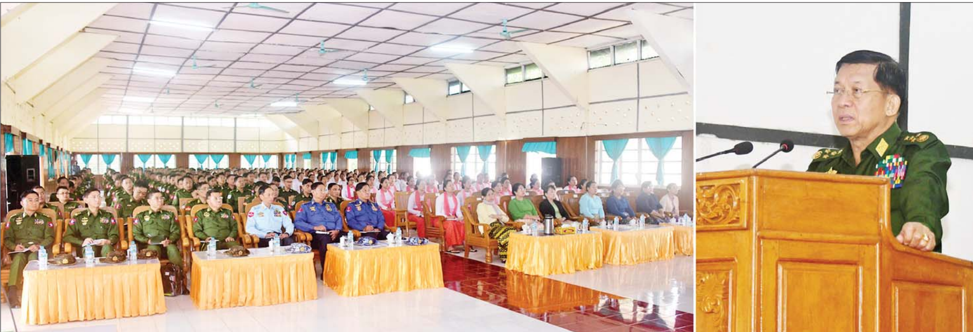
နိုင်ငံတော်စီမံအုပ်ချုပ်ရေးကောင်စီဥက္ကဋ္ဌ တပ်မတော်ကာကွယ်ရေးဦးစီးချုပ် ဗိုလ်ချုပ်မှူးကြီး မင်းအောင်လှိုင် အနောက်ပိုင်းတိုင်းစစ်ဌာနချုပ် အခမ်းအနားမှ အရာရှိ၊ စစ်သည်၊ မိသားစုများအား တွေ့ဆုံ အမှာစကားပြောကြားစဉ်။

ပြည်သူအပေါ် ရေလို လလို ကျင့်ကြံ၊ ဒေသနှင့် တိုင်းပြည်အကျိုးအတွက် တာဝန်ကို ကျေပွန်စွာထမ်းဆောင်ရမည်ဖြစ်ပြီး စွမ်းရည်စွမ်းအားရှိအောင် ကြိုးပမ်းဆောင်ရွက်