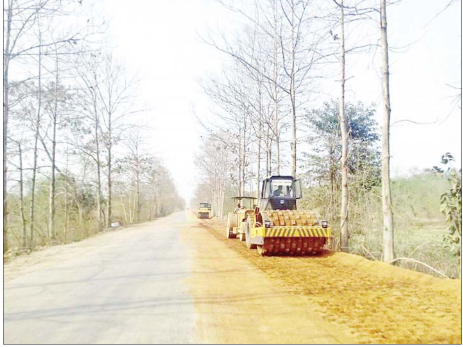
ပုသိမ်-မုံရွာကားလမ်းအား စက်ကြီးများဖြင့် နိုင်လွန်ကတ္တရာခင်းရန် လမ်းချဲ့နေစဉ်။

ပုသိမ်(ကံကလေး)-မုံရွာလမ်း၏ မိုင် (၁၀၂/၃) သည် ရော့ဘတ်တိုင်းဒေသကြီးနှင့်လည်းကောင်း၊ မိုင် (၁၄၅/၇) သည် မကွေးတိုင်းဒေသကြီးနှင့်လည်းကောင်း၊ မိုင် (၁၂၅/၄) (ဥသျှစ်ပင်လမ်းဆုံ)မှ ရခိုင်ပြည်နယ်သို့ ဆက်သွယ်သွားလာနိုင်ပြီး ရှေးဟောင်းသမိုင်းဝင် အကောက်တောင်စေတီတော်မြတ်ကြီးသည် ပုသိမ် (ကံကလေး)-မုံရွာလမ်း မိုင် (၁၁၁/၃) မှ ခွဲထွက်၍ အလွယ်တကူသွားလာနိုင်ပြီဖြစ်