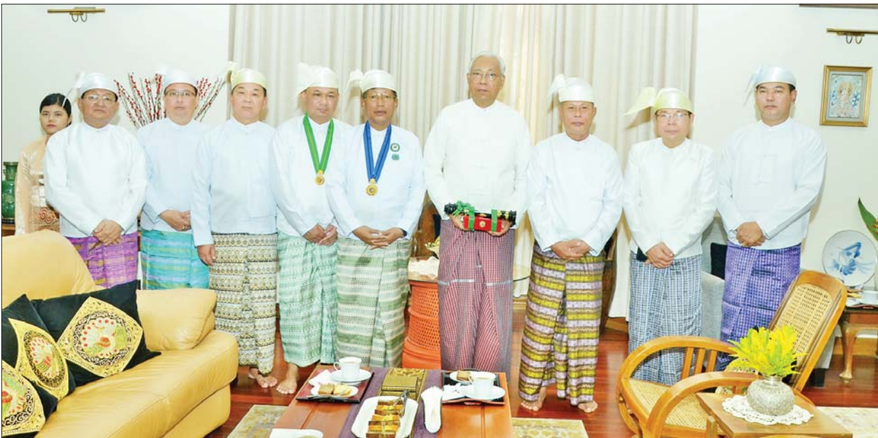
နေပြည်တော်ကောင်စီဥက္ကဋ္ဌ သီရိပျံချိုဦးတင်ဦးလွင်နှင့် နေပြည်တော်တိုင်းစစ်ဌာနချုပ်တိုင်းမှူး ဗိုလ်ချုပ်ဇေယျကျော်ထင် ဇော်ဟိန်းတို့က စည်သူဘွဲ့ရရှိကြသူ ဦးဝန်(မင်းသုဝဏ်)(စာရေးဆရာ)နှင့် ဦးလွင်(မွန်ပြည်နယ်) (နိုင်ငံတော်ကောင်စီဝင်)တို့ကိုယ်စား သား/သမက်ဖြစ်သူ နိုင်ငံတော်သမ္မတဟောင်း ဦးထင်ကျော်ထံ ဂုဏ်ထူးဆောင်ဘွဲ့များ ချီးမြှင့်အပ်နှင်းပြီး စုပေါင်းမှတ်တမ်းတင်ဓာတ်ပုံရိုက်စဉ်။

နေပြည်တော် ဖေဖော်ဝါရီ ၂၀ ၂၀၂၃ ခုနှစ် ဇန်နဝါရီ ၁ ရက်နှင့် ၂ ရက်တို့တွင် (၇၅)နှစ်မြောက် စိန်ရတုလွတ်လပ်ရေးနေ့ ဂုဏ်ထူးဆောင်ဘွဲ့များ ချီးမြှင့်အပ်နှင်းခြင်းအခမ်းအနားများကို အောင်မြင်စွာ ကျင်းပကာ အခမ်းအနားတက်ရောက်လာသည့် ဘွဲ့ခံပုဂ္ဂိုလ်များထံ ရရှိသည့်ဂုဏ်ထူးဆောင်ဘွဲ့များအား နိုင်ငံတော်စီမံအုပ်ချုပ်ရေးကောင်စီ ဥက္ကဋ္ဌက ကိုယ်တိုင် တစ်ဦးချင်းလက်ရောက်ချီးမြှင့်အပ်နှင်းခဲ့ပြီးဖြစ်သည်။ အဆိုပါ ဂုဏ်ထူးဆောင်ဘွဲ့များအပ်နှင်းခြင်း အခမ်းအနားသို့ အကြောင်း အမျိုးမျိုးကြောင့် ကိုယ်တိုင်သော် လည်းကောင်း၊ ကိုယ်စားသော် လည်းကောင်း တက်ရောက်ရယူနိုင်ခဲ့ခြင်းမရှိဘဲ စာမျက်နှာ ၁၇ ကော်လံ ၁ သို့ ၀