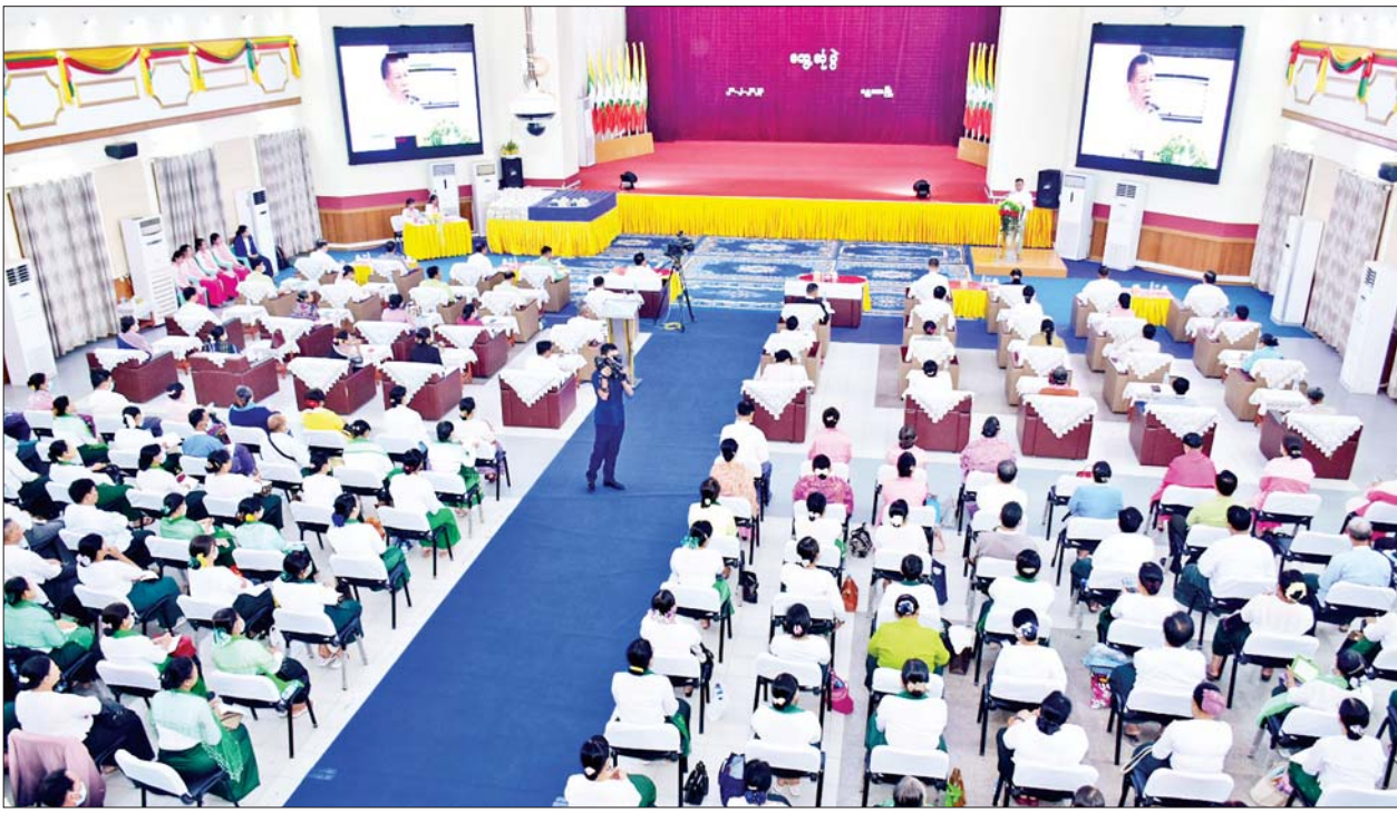
နိုင်ငံတော်စီမံအုပ်ချုပ်ရေးကောင်စီဝင် ဦးမောင်ကို မန္တလေးမြို့ မြို့တော်ခန်းမ၌ မြို့ပေါ်ရှိ တက္ကသိုလ်၊ ဒီဂရီကောလိပ်၊ ကျောင်းများမှ ပါမောက္ခချုပ်များ၊ ဒုတိယပါမောက္ခချုပ်များ၊ တိုင်းဒေသကြီး၊ ခရိုင်၊ မြို့နယ် ပညာရေးမှူးများ၊ အထက်တန်း၊ အလယ်တန်း ကျောင်းအုပ်ကြီးများနှင့် တွေ့ဆုံပွဲတွင် အမှာစကားပြောကြားစဉ်။

မန္တလေး ဖေဖော်ဝါရီ ၂၀ နိုင်ငံတော်စီမံ အုပ်ချုပ်ရေးကောင်စီဝင် ဦးမောင်ကို ပြန်ကြားရေးဝန်ကြီးဌာန ပြည်ထောင်စုဝန်ကြီး ဦးမောင်မောင်အုန်းနှင့် မန္တလေးတိုင်းဒေသကြီး ဝန်ကြီးချုပ် ဦးမျိုးအောင်တို့သည် ယနေ့ နံနက်ပိုင်းတွင် မန္တလေးမြို့ မဟာမုနိဘုရားကြီး ပိဋကတ်ပြတိုက် အဆင့်မြှင့်တင်ပြုပြင်ခြင်းလုပ်ငန်းအား ကြည့်ရှုစစ်ဆေးပြီး မန္တလေးမြို့ မြို့တော်ခန်းမ၌ မန္တလေးမြို့ပေါ်ရှိ တက္ကသိုလ်၊ ဒီဂရီကောလိပ်၊ ကျောင်းများမှ ပါမောက္ခချုပ်များ၊ ဒုတိယပါမောက္ခချုပ်များ၊ တိုင်းဒေသကြီး၊ ခရိုင်၊ မြို့နယ် ပညာရေးမှူးများ၊ အထက်တန်းနှင့် အလယ်တန်း ကျောင်းအုပ်ကြီးများနှင့် တွေ့ဆုံကာ အမှတ်တရစာအုပ်များနှင့် လက်ဆွဲအိတ်များ ပေးအပ်သည်။