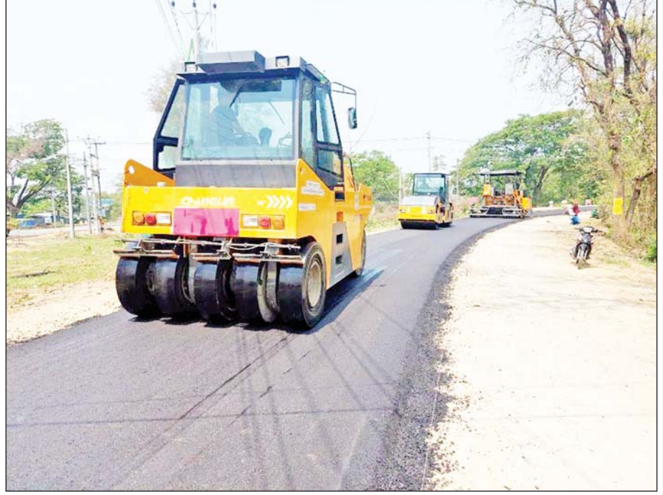
ပုသိမ်-မုံရွာကားလမ်း ပဲခူးတိုင်းဒေသကြီးအပိုင်း၌ နိုင်လွန်ကတ္တရာ AC ခင်းနေစဉ်။