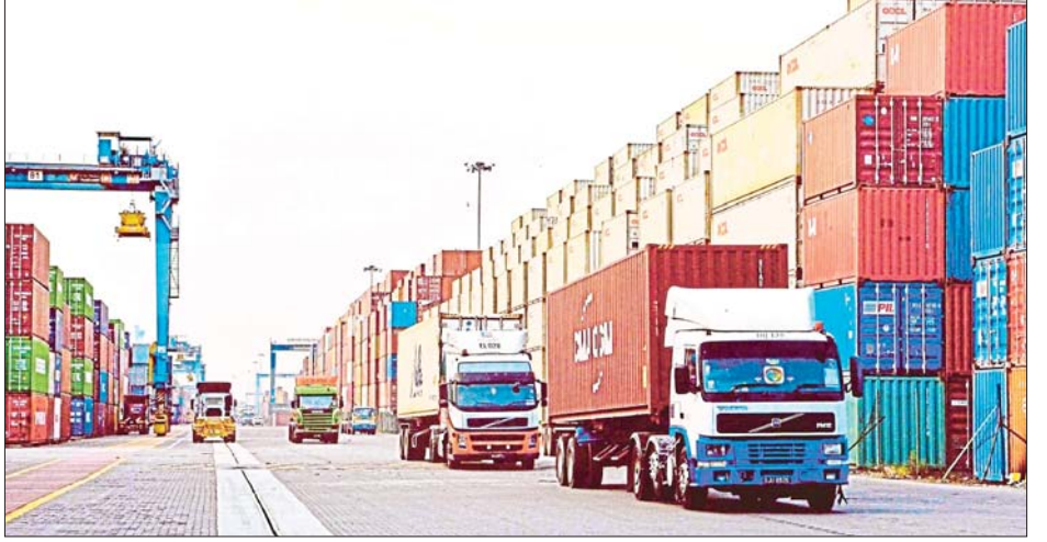
ဘီလီယံရှိခဲ့ခြင်းကြောင့် ယမန်နှစ်အလားတူ မြင့်တက်မှုရှိခဲ့ကြောင်း သိရသည်။ ကာလနှင့် နှိုင်းယှဉ်ပါက ၂ ဒသမ ၃ ရာခိုင်နှုန်း ကိုးကား-ဆင်ဟွာ၊ ဘာသာပြန်-အလင်းသစ်

နှင့် လျှပ်စစ်ထုတ်ကုန်များကို အဓိကတင်ပို့နိုင်ခဲ့ခြင်းဖြစ်ကြောင်း မလေးရှားနိုင်ငံ အပြည်ပြည်ဆိုင်ရာ ကုန်သွယ်ရေးနှင့် စက်မှုဝန်ကြီးဌာန၏ ထုတ်ပြန်ချက်အရ သိရသည်။ မလေးရှားနိုင်ငံ၏ အဓိကကုန်သွယ်ဖက် နိုင်ငံများမှာ အရှေ့တောင်အာရှနိုင်ငံများနှင့် ဂျပန် နိုင်ငံတို့ဖြစ်ကြောင်းနှင့် ဇန်နဝါရီလအတွင်းက မလေးရှားနိုင်ငံ၏ ကုန်သွယ်မှုတန်ဖိုးသည် ရင်းဂစ် ၂၀၇ ဒသမ ၅၁ ဘီလီယံရှိခဲ့ကြောင်း သိရသည်။ ထို့ပြင် မလေးရှားနိုင်ငံ၏ သွင်းကုန်တန်ဖိုးသည် ဇန်နဝါရီလအတွင်းက ရင်းဂစ် ၉၄ ဒသမ ၆၇