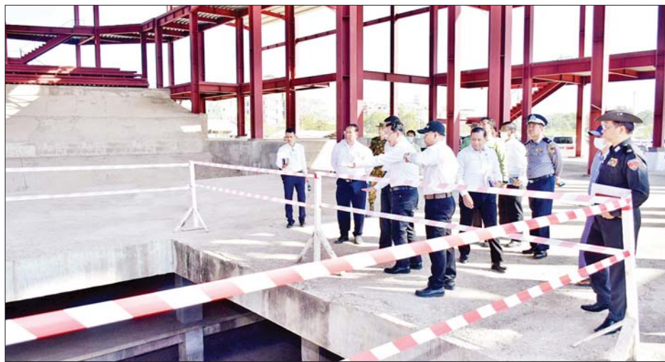
ထို့နောက် ပြည်ထောင်စုဝန်ကြီးနှင့် တိုင်းဒေသကြီး ဝန်ကြီးချုပ်တို့သည် နိုင်ငံတကာအဆင့်မီ အနုပညာဗဟိုဌာန၏ မြေပေါ်နှင့် မြေအောက်

ပြည်ထောင်စုဝန်ကြီးနှင့် တိုင်းဒေသကြီးဝန်ကြီးချုပ်တို့သည် နိုင်ငံတကာအဆင့်မီ အနုပညာဗဟိုဌာန တည်ဆောက်ရေးလုပ်ငန်းခွင်သို့ ရောက်ရှိကြရာ တာဝန်ရှိသူများ၏ အဆောက်အအုံဆောက်လုပ်ထားရှိမှုအခြေအနေအား ရှင်းလင်းတင်ပြမှုအပေါ် သိရှိလိုသည်များ မေးမြန်းဆွေးနွေးကြသည်။