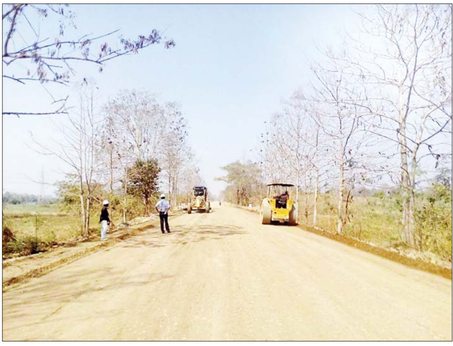
ပုသိမ်-မုံရွာကားလမ်း ပဲခူးတိုင်းဒေသကြီးအပိုင်းတွင် ၂၄ ပေ လမ်းချဲ့မြေညှိနေစဉ်။

ရော့ဘတ်တိုင်းဒေသကြီး ပုသိမ်(ကံကလေး) ပြည်ထောင်စုကားလမ်းမကြီးသည် ရော့ဘတ်တိုင်းဒေသကြီးမှ ပဲခူးတိုင်းဒေသကြီး၊ မကွေးတိုင်းဒေသကြီးတို့ကိုဖြတ်၍ စစ်ကိုင်းတိုင်းဒေသကြီး မုံရွာအထိ ဖောက်လုပ်ထားပြီး မိုင်အားဖြင့် စုစုပေါင်း ၄၅၀ မိုင် ၅ ဖာလုံရှိသည်။ လမ်းစီမံကိန်းကို ၁၉၆၉ ခုနှစ်ကတည်းက စတင်ရေးဆွဲခဲ့ပြီး ၂၀၂၂ ခုနှစ် ဇန်နဝါရီလ ၁၁ ရက်နေ့တွင် ဆောက်လုပ်ရေးဝန်ကြီးဌာနမှ ဆောက်လုပ်ရေးအဖွဲ့ ၂၃ ဖွဲ့၊ ကုမ္ပဏီများမှ ဆောက်လုပ်ရေးကုမ္ပဏီအဖွဲ့ ၁၈ ဖွဲ့၊ လမ်းအရည်