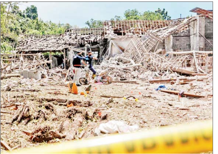
ဟု ရဲတပ်ဖွဲ့က သုံးသပ်ပြောကြားသည်။ ပစ္စည်းများရှိမရှိ ထပ်မံစစ်ဆေးလျက်ရှိ ကြောင်း ရဲတပ်ဖွဲ့က ပြောကြားသည်။ ကိုးကား-ဆင်ဟွာ၊ ဘာသာပြန်-စိုးသူရ

ဂျကာတာ ဖေဖော်ဝါရီ ၂၀ အင်ဒိုနီးရှားနိုင်ငံ အရှေ့ဂျာဗား ပြည်နယ် ဘလီတာမြို့အနီးရှိ ကျေးရွာ တစ်ရွာ၌ ယမန်နေ့ညနေပိုင်းက ပေါက်ကွဲမှုဖြစ်ပွားခဲ့ရာ လူလေးဦး သေဆုံးပြီး ၁၃ ဦး ဒဏ်ရာရရှိကြောင်း ဒေသန္တရရဲတပ်ဖွဲ့က ပြောကြားသည်။ အိမ်ခြေ ၂၀ ကျော် ထိခိုက်ပျက်စီး သေဆုံးသူများမှာ မိသားစုတစ်စုထဲမှ မိသားစုဝင်များဖြစ်ကြောင်းနှင့် ယင်း ဖြစ်စဉ်အတွင်း အိမ်ခြေ ၂၀ ကျော် ထိခိုက်ပျက်စီးခဲ့ကြောင်း ဘလီတာ မြို့ရဲတပ်ဖွဲ့တာဝန်ရှိသူ အာဂို ဝီယိုနီက ပြောကြားသည်။ အစ္စလာမာဘာသာဝင်များ၏ ဥပုသ်လ အတွက် မီးရှူးမီးပန်းများပစ်ဖောက်ရာ မှ ပေါက်ကွဲမှုဖြစ်ပွားခြင်းဖြစ်သည်