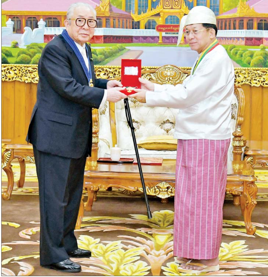
နိုင်ငံတော်စီမံအုပ်ချုပ်ရေးကောင်စီဥက္ကဋ္ဌ နိုင်ငံတော်ဝန်ကြီးချုပ် ဗိုလ်ချုပ်မှူးကြီး သတိုးမဟာသရေ စည်သူ သတိုးသီရိသုဓမ္မ မင်းအောင်လှိုင် ဂျပန်နိုင်ငံဝန်ကြီးချုပ်ဟောင်း Mr. Taro Aso အား သရေစည်သူ ဘွဲ့တံဆိပ်နှင့် အဆောင်အယောင်ကို ချီးမြှင့်အပ်နှင်းရာ Japan-Myanmar Association Chairman ဖြစ်သူ H.E. Mr. HIDEO WATANABE က ဂျပန်နိုင်ငံဝန်ကြီးချုပ်ဟောင်းကိုယ်စား လက်ခံရယူစဉ်။

HIDEO WATANABE နှင့် တာဝန် ရှိသူများ တက်ရောက်ကြသည်။ ဦးစွာ ဒုတိယဝန်ကြီးချုပ်နှင့် ပြည်ထဲရေး ဝန်ကြီးဌာန ပြည်ထောင်စုဝန်ကြီး ဒုတိယ ဗိုလ်ချုပ်ကြီး သီရိပျံချီ စည်သူ စိုးထွဋ်က ဘွဲ့တံဆိပ်ပေးအပ်သည့် အမိန့်များကို ဖတ်ကြားတင်ပြ သည်။ ထို့နောက် နိုင်ငံတော် စီမံအုပ်ချုပ်ရေးကောင်စီ ဥက္ကဋ္ဌ နိုင်ငံတော်ဝန်ကြီးချုပ် ဗိုလ်ချုပ်