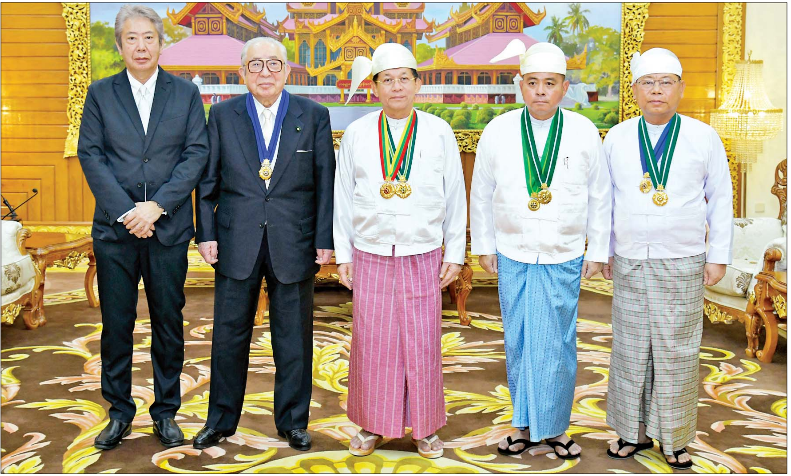
နိုင်ငံတော်စီမံအုပ်ချုပ်ရေးကောင်စီဥက္ကဋ္ဌ နိုင်ငံတော်ဝန်ကြီးချုပ် ဗိုလ်ချုပ်မှူးကြီး သတိုးမဟာသရေစည်သူ သတိုးသီရိသုဓမ္မ မင်းအောင်လှိုင်၊ Japan-Myanmar Association Chairman ဖြစ်သူ H.E. Mr. HIDEO WATANABE နှင့် အခမ်းအနား တက်ရောက်လာကြသူများ စုပေါင်းမှတ်တမ်းတင်ဓာတ်ပုံရိုက်စဉ်။

တက်ရောက် ယနေ့တွင် ဂုဏ်ထူးဆောင် တံဆိပ်နှင့် အဆောင်အယောင် များ ချီးမြှင့်ခြင်းကို နေပြည်တော်ရှိ ဘုရင့်နေောင်ရိပ်သာ ဧည့်ခန်းမ ဆောင်၌ ပြုလုပ်ရာ အခမ်းအနား သို့ နိုင်ငံတော်စီမံအုပ်ချုပ်ရေး ကောင်စီဥက္ကဋ္ဌ နိုင်ငံတော် ဝန်ကြီးချုပ် ဗိုလ်ချုပ်မှူးကြီး သတိုးမဟာသရေစည်သူ သတိုး သီရိသုဓမ္မ မင်းအောင်လှိုင်နှင့် တာဝန်ရှိသူများ၊ Japan-Myanmar Association Chairman ဖြစ်သူ H.E. Mr.