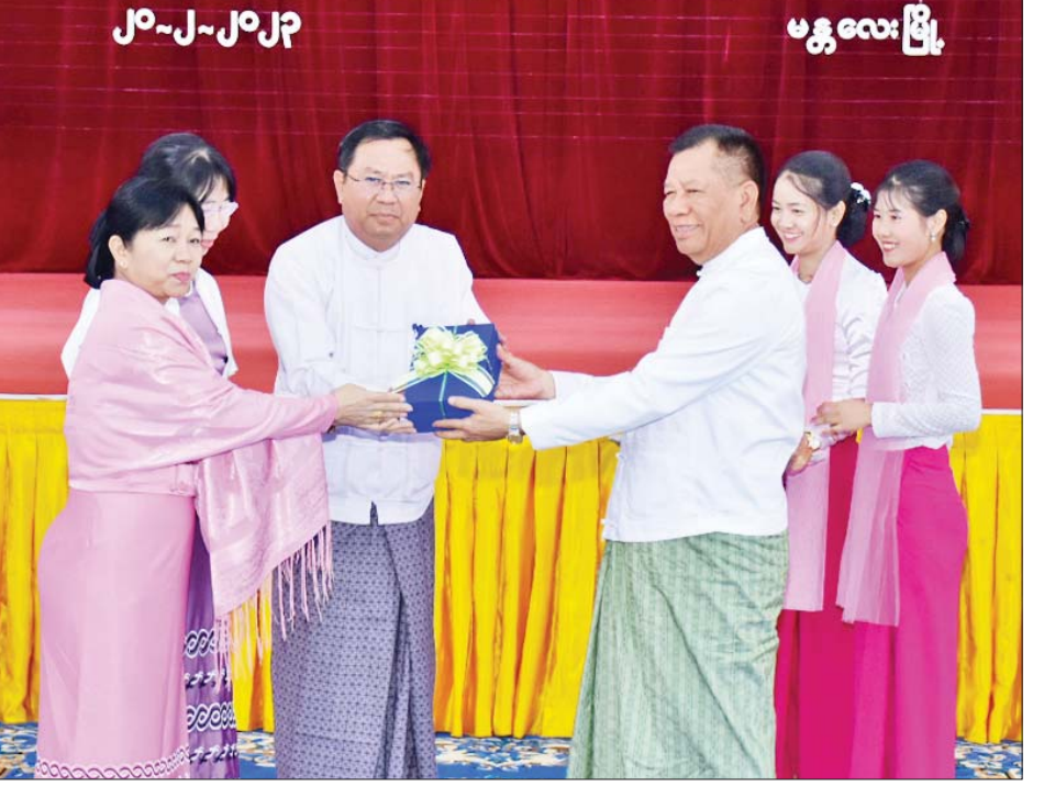
နိုင်ငံတော်စီမံအုပ်ချုပ်ရေးကောင်စီဝင် ဦးမောင်ကို နေ့စဉ်မှတ်တမ်းစာအုပ်များနှင့် လက်ဆွဲအိတ်များ ပေးအပ်ရာ တက္ကသိုလ်ကျောင်းများမှ ကိုယ်စားလှယ်များက လက်ခံရယူကြစဉ်။

တိုးတက်ရေးအတွက် မှာကြားကြသည်။ ယင်းနောက် နိုင်ငံတော်စီမံအုပ်ချုပ်ရေး ကောင်စီဝင်