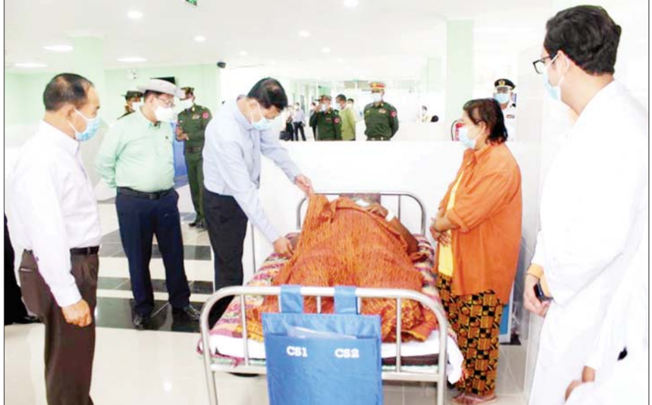
နိုင်ငံတော်စီမံအုပ်ချုပ်ရေးကောင်စီအဖွဲ့ဝင် ဒုတိယဝန်ကြီးချုပ်နှင့် ကာကွယ်ရေးဝန်ကြီးဌာန ပြည်ထောင်စုဝန်ကြီး ဗိုလ်ချုပ်ကြီးမြထွန်းဦးနှင့် တာဝန်ရှိသူများ မုံရွာမြို့ ခုတင်(၅၀၀)ဆုံ ပြည်သူ့ဆေးရုံ ကြီး၌ တက်ရောက်ကုသနေသော ဒေသခံပြည်သူများအား ကြည့်ရှုအားပေးစကား ပြောကြားစဉ်။

နိုင်ငံတော် စီမံအုပ်ချုပ်ရေး ကောင်စီအဖွဲ့ဝင် ဒုတိယဝန်ကြီး ချုပ်နှင့် ကာကွယ်ရေးဝန်ကြီး ဌာန ပြည်ထောင်စုဝန်ကြီး ဗိုလ်ချုပ်ကြီး မြထွန်းဦး၊ မုံရွာ တပ်နယ်မှ အရာရှိ၊ စစ်သည်၊ မိသားစုဝင်များအား ရင်းရင်း နီးနီး လိုက်လံနှုတ်ဆက်စဉ်။