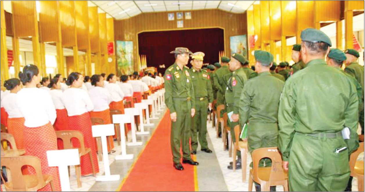
ဦးစွာ နိုင်ငံတော်စီမံအုပ်ချုပ်ရေးကောင်စီအဖွဲ့ဝင် ဒုတိယဝန်ကြီးချုပ်နှင့် ကာကွယ်ရေး ဝန်ကြီးဌာန ပြည်ထောင်စုဝန်ကြီး ဗိုလ်ချုပ်ကြီးမြထွန်းဦးက နိုင်ငံ တော် စီမံအုပ်ချုပ်ရေးကောင်စီ၏

နေပြည်တော် ဖေဖော်ဝါရီ ၂၀ စစ်ကိုင်းတိုင်းဒေသကြီး မုံရွာ မြို့၌ ရောက်ရှိနေကြသည့် နိုင်ငံ တော်စီမံအုပ်ချုပ်ရေး ကောင်စီ အဖွဲ့ဝင် ဒုတိယဝန်ကြီးချုပ်နှင့် ကာကွယ်ရေး ဝန်ကြီးဌာန ပြည်ထောင်စုဝန်ကြီး ဗိုလ်ချုပ်ကြီး မြထွန်းဦးနှင့်အဖွဲ့၊ တိုင်းဒေသကြီး ဝန်ကြီးချုပ် ဦးမြတ်ကျော်၊ အနောက်မြောက်တိုင်းစစ်ဌာနချုပ် တိုင်းမှူး ဗိုလ်ချုပ်သန်းထိုက်နှင့် တာဝန်ရှိသူများသည် ဖေဖော်ဝါရီ ၁၉ ရက် နံနက်ပိုင်းတွင် စစ်ကိုင်း တိုင်းဒေသကြီးအစိုးရအဖွဲ့၊ တိုင်း အဆင့် ဌာနဆိုင်ရာ အကြီးအကဲ များ၊ မုံရွာမြို့နယ် တက္ကသိုလ်၊ ကောလိပ်အသီးသီးနှင့် အခြေခံ ပညာကျောင်းများမှ ဆရာ ဆရာမ များအား စစ်ကိုင်းတိုင်းဒေသကြီး အစိုးရအဖွဲ့ရုံး ချင်းတွင်းခန်းမ၌ တွေ့ဆုံသည်။