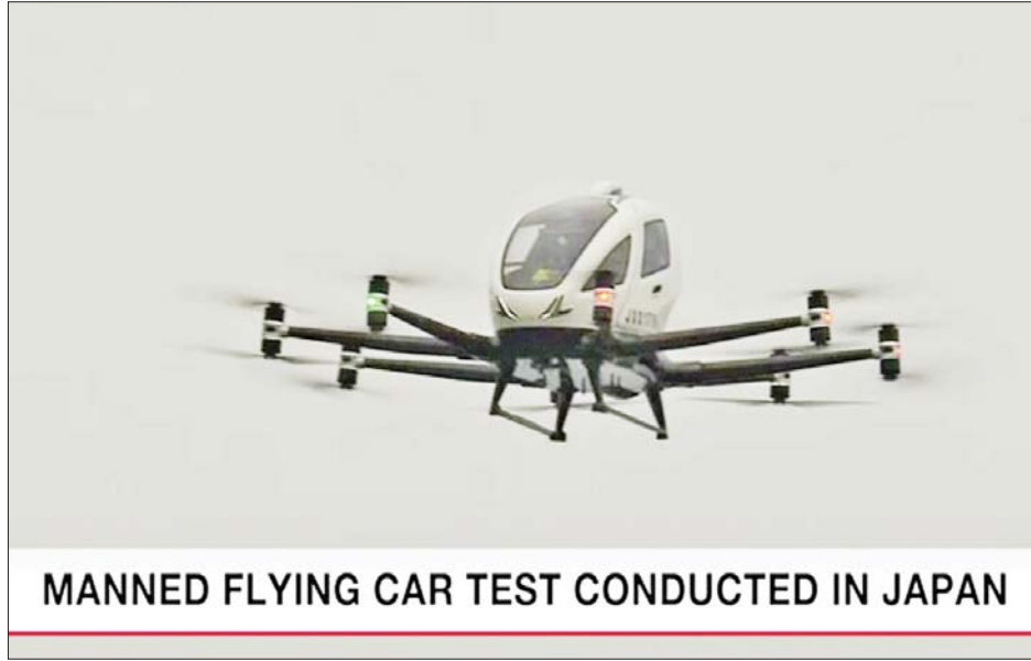
MANNED FLYING CAR TEST CONDUCTED IN JAPAN