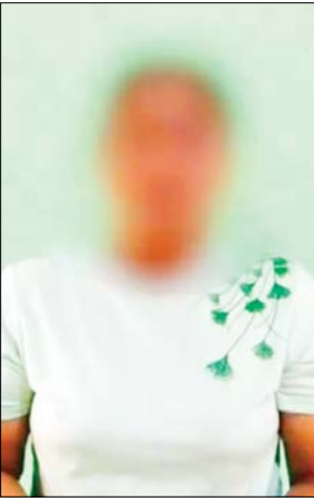
PDF အမည်ခံ အကြမ်းဖက်သမားများ၏ မတရားအနိုင်ကျင့် ဖမ်းဆီးချုပ်နှောင်ခံခဲ့ရသူများ။

အဲဒီခေါင်းဆောင်က ကြားလားလို့ သမီးကိုပြောတယ်။ သမီးက ဦးခန့်က စောင့်ကြည့်လျက်ရှိ ကြားတယ်ဆိုတော့ သူက အပိုတွေမထားဘူး အကုန်ရှင်းပစ်မှာလို့ သမီးကိုပြောတယ်။ သမီးကို မသတ်နဲ့လို့ ပြောချင်တယ်။ ဒါပေမဲ့ ကြောက်လို့ မပြောရဲဘူးလေ။ သူတို့မေးမှ ဖြေရတယ်။