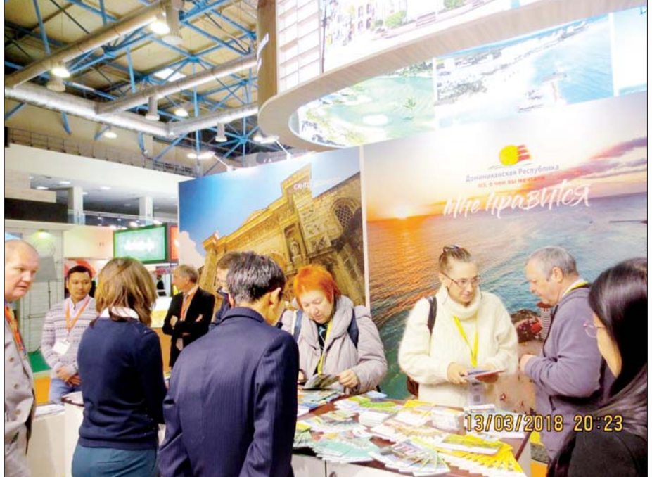
မော်စကိုနိုင်ငံတကာခရီးသွားပြပွဲတွင် မြန်မာနိုင်ငံကိုယ်စားပြု ခရီးသွားပြခန်းမှ မြန်မာနိုင်ငံ၏ ခရီးသွားလုပ်ငန်းဆိုင်ရာ အချက်အလက်များအား ရှုရှားဘာသာ၊ အင်္ဂလိပ်ဘာသာတို့ဖြင့် ထုတ်ဝေထားသော စာအုပ်စာစောင်များပြသခဲ့စဉ်။

၂၀၂၁ ခုနှစ် စက်တင်ဘာလခန့်မှစတင်၍ ကမ္ဘာလုံးဆိုင်ရာ ကပ်ရောဂါဖြစ်ပွားမှုများကို အတိုင်းအတာတစ်ခုအထိ ထိန်းချုပ်နိုင်ပြီးဖြစ်သည့် အတွက် ကမ္ဘာ့ခရီးစဉ်ဒေသအချို့မှ ခရီးသွားလုပ်ငန်းများနှင့် လေကြောင်းလိုင်းများ ပြန်လည်ဖွင့်လှစ်နိုင်ခဲ့သည့်အတွက် ခရီးသွားလုပ်ငန်း ပြန်လည်ဦးမော့လာစေရေး လုပ်ငန်းများဖြစ်သည့် နိုင်ငံတကာနှင့် ဒေသတွင်းနိုင်ငံများနှင့် ခရီးသွားလုပ်ငန်းများ ပြန်လည်စတင်ခြင်း Online & Offline