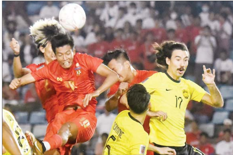
၂၀၂၂ AFF Cup ပြိုင်ပွဲတွင် မြန်မာနှင့် မလေးရှားအသင်း ယှဉ်ပြိုင်နေစဉ်။

မြန်မာ့လက်ရွေးစင်အသင်း ခြေစမ်းပွဲကစားနိုင်ရန် မြန်မာနိုင်ငံဘောလုံး အဖွဲ့ချုပ်က စီစဉ်ဆောင်ရွက်လျက်ရှိပြီး နှစ်ပွဲယှဉ်ပြိုင်ကစားမည်ဖြစ်သည်။ မြန်မာ့ လက်ရွေးစင်အသင်းသည် ၂၀၂၂ AFF Cup ပြိုင်ပွဲပြီးကတည်းက လေ့ကျင့်မှုရပ်နားထားပြီး နိုင်ငံတကာခြေစမ်းပွဲများ ယှဉ်ပြိုင်ကစားရန် စာမျက်နှာ ၁၈ ကော်လံ ၁ သို့ ၀