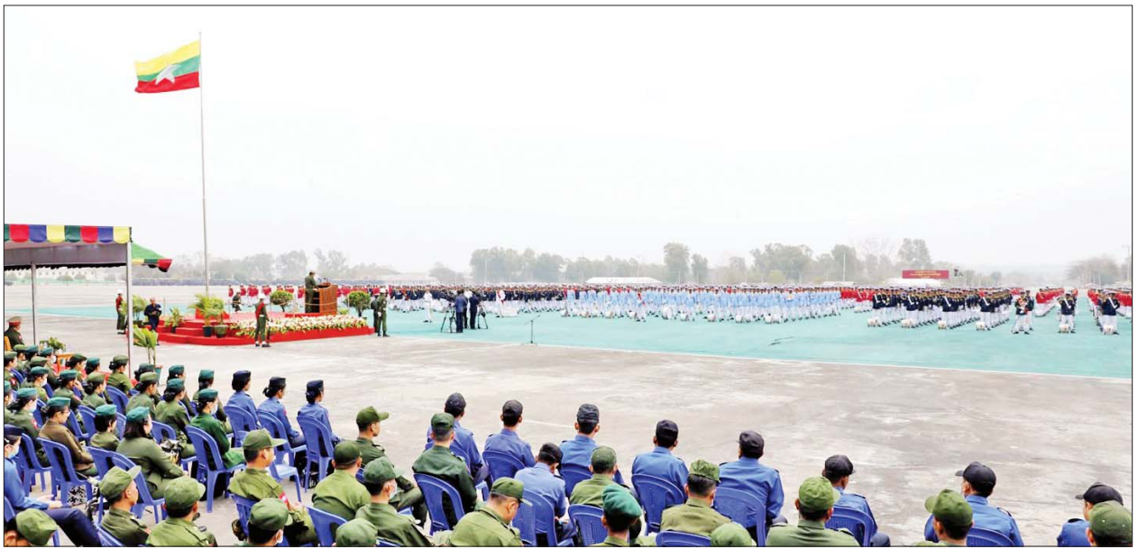
အား ညွှန်ကြားရေးမှူး (ကြည်း၊ ရေ၊ လေ) ဗိုလ်ချုပ်ကြီး မောင်မောင်အေးက ဂုဏ်ပြုဆုငွေများ ပေးအပ်ချီးမြှင့်သည်။ အဆိုပါ (၇၈)နှစ်မြောက်တပ်မတော်နေ့ အထိမ်းအမှတ် (၂၉)ကြိမ်မြောက် တပ်မတော်(ကြည်း၊ ရေ၊ လေ) စစ်တီးဝိုင်းပြိုင်ပွဲကို ဖေဖော်ဝါရီ ၂၀ ရက်အထိ ကျင်းပမည်ဖြစ်ပြီး ပြိုင်ပွဲဝင်စစ်တီးဝိုင်း အသင်းပေါင်း ၃၁ သင်း ပါဝင်ယှဉ်ပြိုင်ကြမည်ဖြစ်ကြောင်း သိရသည်။ သတင်းစဉ်

ထို့နောက် တပ်မတော်ဂုဏ်ပြုစစ်တီးဝိုင်းအဖွဲ့က သရုပ်ပြတီးခတ်ဖျော်ဖြေကြရာ ညွှန်ကြားရေးမှူး (ကြည်း၊ ရေ၊ လေ) ဗိုလ်ချုပ်ကြီး မောင်မောင်အေးနှင့် တက်ရောက်လာကြသည့် တပ်မတော်အရာရှိကြီးများက ကြည့်ရှုအားပေးခဲ့ကြပြီး တပ်မတော်ဂုဏ်ပြုစစ်တီးဝိုင်းအဖွဲ့