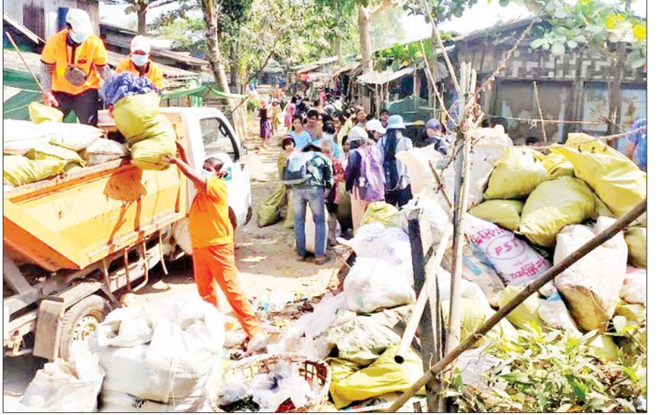
ပြင်ပအလင်းရောင်ကို အသုံးပြုပါ။ မလိုအပ်သော အိမ်တွင်းလျှပ်စစ်မီးများကို လျှော့သုံးပါ

»» စာမျက်နှာ ၁၇ မှ ဦးပုည၏ ဝတ္ထုများကို နှစ်သက်ရခြင်းအကြောင်းရင်းကို ဖော်ပြပါဆိုတဲ့ မေးခွန်းကိုတော့ “ဦးပုည၏ ဝတ္ထုများကို နှစ်သက်ရခြင်းအကြောင်းရင်းမှာ ပရိသတ် စိတ်ညွတ်နှိုးဖွယ် ဖွဲ့နွဲ့ရေးသားထားသောကြောင့်ဖြစ်သည်။” လို့ဖြေရပါမယ်။ “လောကဗျူဟာကျမ်း ရေးသူ၏အမည်သည် အင်ရုံဝန်ကြီးဖြစ်သည်။” “မဟာဆန်ချင်သူ ပြဇာတ်ကို မြန်မာမှုပြုပြန်ဆိုသူမှာ ဆရာဇော်ဂျီဖြစ်သည်။” စသည်ဖြင့် အတိအကျ ပြည့်ပြည့်စုံစုံ ဖြေရပါမယ်။ မေးခွန်း(၁) ကတော့ မြန်မာစာပေသမိုင်းနဲ့ ပတ်သက်ပြီး ခြုံငုံ