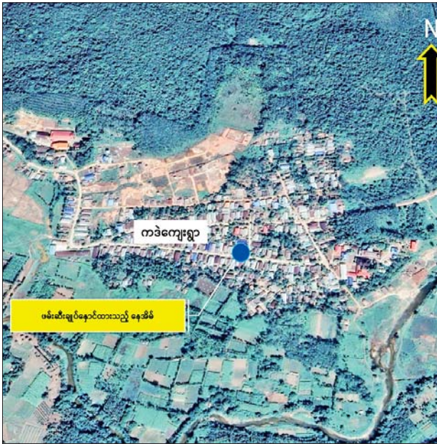
PDF အမည်ခံ အကြမ်းဖက်သမားများ၏ မတရားအနိုင်ကျင့် ဖမ်းဆီးချုပ်နှောင်ခံထားရသူများအား လုံခြုံရေးတပ်ဖွဲ့ဝင်များက ကောင်းမွန်စွာ ပြန်လည်ကယ်တင်နိုင်ခဲ့သည့် ဖြစ်စဉ်ပြပုံ။

နေပြည်တော် ဖေဖော်ဝါရီ ၁၇ အကြမ်းဖက် အဖွဲ့များဖြစ်သည့် NUG၊ CRPH တို့၏ လက်ဝေခံ PDF အမည်ခံ အကြမ်းဖက်သမားများ မတရားအနိုင်ကျင့် ဖမ်းဆီးချုပ်နှောင်ထားသည့် တနင်္သာရီတိုင်းဒေသကြီးအတွင်းရှိ မြို့ရွာအချို့မှ နိုင်ငံ့ဝန်ထမ်းများ၊ ကျေးရွာသူ ကျေးရွာသားများအား လုံခြုံရေးတပ်ဖွဲ့ဝင်များက ပုလောမြို့နယ်၊ ကဒဲကျေးရွာအတွင်းရှိ နေအိမ်အတွင်းမှ ကောင်းမွန်စွာ ပြန်လည် ကယ်တင်နိုင်ခဲ့ကြောင်း သိရသည်။