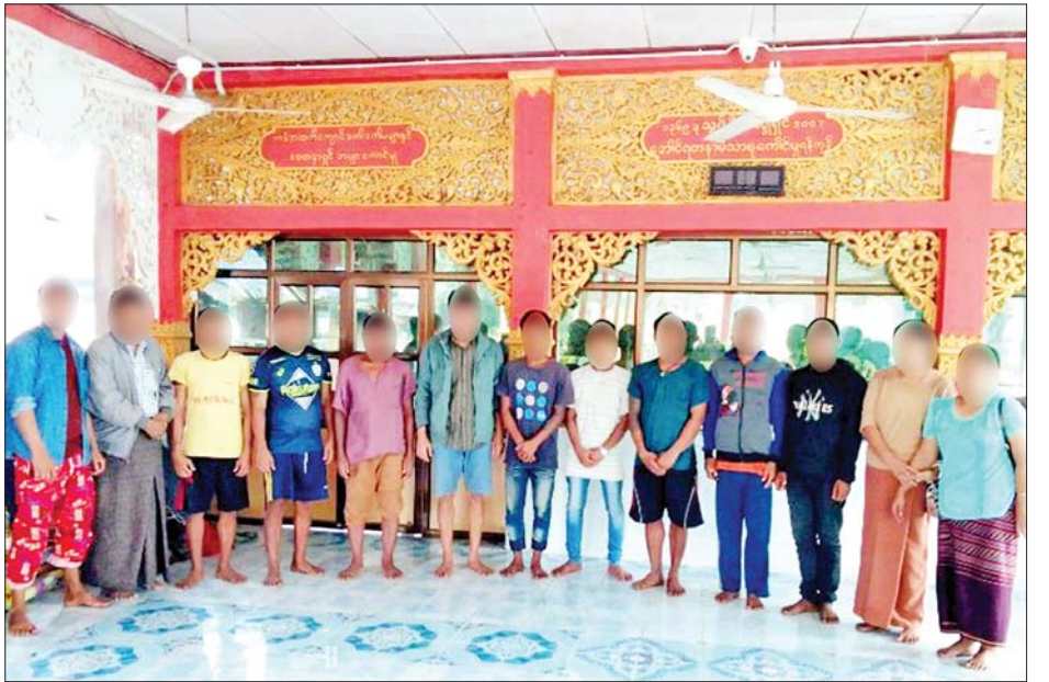
PDF အမည်ခံ အကြမ်းဖက်သမားများ၏ မတရားအနိုင်ကျင့် ဖမ်းဆီးချုပ်နှောင်ခံထားရသူများအား လုံခြုံရေးတပ်ဖွဲ့ဝင်များက ကောင်းမွန်စွာ ပြန်လည်ကယ်တင်နိုင်ခဲ့သည့် မှတ်တမ်းဓာတ်ပုံ။

သူခေါ်ထုတ်မှ ထွက်ရတယ်။ သမီးတို့ ဒီလိုမျိုးလွတ်မယ်လို့ မထင်ထားဘူး။ အခုလိုကယ်တဲ့ အတွက် ဝမ်းသာပါတယ် ကျေးဇူးလည်း အများကြီးတင်ပါတယ်။ အမျိုးသား (အင်္ကျီအညို) ကျွန်တော့်ကို ဖမ်းတဲ့နေရာကတော့ သင်္ကန်းတောချောင်းနားမှာ ကျွန်တော့်ကိုဖမ်းတဲ့လူအင်အားကတော့ ၁၅ ယောက်၊ အယောက် ၂၀ လောက်တော့ရှိတယ်။ ကျွန်တော့်ကို ဘာကြောင့်ဖမ်းလဲဆိုတော့ အဖေကဝန်ထမ်းဖြစ်သလို ဆည်မြောင်းဦးစီးလည်း ဖြစ်နေတယ်။ အဲဒီနေ့ဖြစ်တဲ့အချိန်မှာ မင်းအဖေက ဆည်မြောင်း