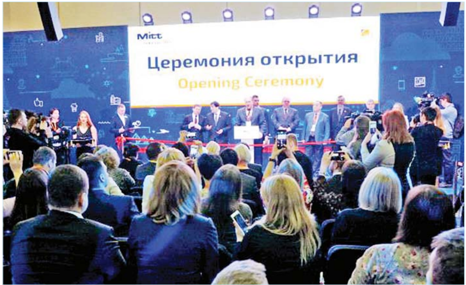
၂၀၁၈ ခုနှစ် မတ်လ ၁၃ ရက်နေ့မှ ၁၅ ရက်နေ့အထိကျင်းပသည့် (၂၅)ကြိမ်မြောက် မော်စကို နိုင်ငံတကာ ခရီးသွားပြပွဲ ဖွင့်ပွဲကျင်းပစဉ်။

ခရီးသွားလုပ်ငန်း ဈေးကွက်မြှင့်တင်ခြင်း၏ သမားရိုးကျနည်းလမ်းများမှာ ကြော်ငြာခြင်း၊ တိုက်ရိုက်ဆက်သွယ်ခြင်း၊ ရောင်းချခြင်းတို့ဖြစ်ပြီး နိုင်ငံတကာခရီးသွားပြပွဲများတွင် နိုင်ငံကိုယ်စားပြု ခရီးသွားပြခန်းများအား ဝင်ရောက်ပြသခြင်း၊ အဓိကခရီးသွားဈေးကွက်နိုင်ငံများတွင် မိမိတို့နိုင်ငံ ခရီးစဉ်ဒေသနှင့် ယှဉ်ကျေးမှုပြပွဲများ ကျင်းပပြုလုပ် ခြင်း၊ နိုင်ငံတကာမှ ခရီးသွားလုပ်ငန်းဆောင်ရွက် သူများ၊ မီဒီယာများ၊ ခရီးသွားဆောင်းပါးရေးသား