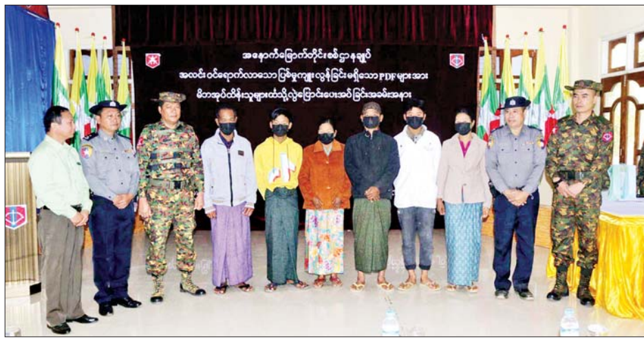
ဥပဒေဘောင်အတွင်း ဝင်ရောက်လာသည့် ပြစ်မှုကျူးလွန်ခြင်းမရှိခဲ့သော PDF အဖွဲ့ဝင်များကို မတူပီ တပ်နယ်မှ တာဝန်ရှိသူများက မိဘအုပ်ထိန်းသူများထံ ထပ်မံလွှဲပြောင်းပေးအပ်မှု မှတ်တမ်းဓာတ်ပုံ။

နေပြည်တော် ဖေဖော်ဝါရီ ၁၇ တိုင်းရင်းသား လက်နက်ကိုင်အဖွဲ့နယ်မြေ အတွင်း သင်တန်းများတက်ရောက်ခဲ့ပြီး ပြစ်မှု ကျူးလွန်ခြင်းမရှိခဲ့သည့် ဥပဒေဘောင်အတွင်း ဝင်ရောက်လာသော PDF အဖွဲ့ဝင်များကို ပြန်လည် ကြိုဆိုလက်ခံ၍ ၎င်းတို့၏ မိဘအုပ်ထိန်းသူများထံသို့ လွှဲပြောင်းပေးအပ်လျက်ရှိသည်။ ယနေ့နံနက်ပိုင်းတွင်လည်း တမူးမြို့၊ မတူပီမြို့၊ ပခုက္ကူမြို့၊ ရွှေဘိုမြို့နှင့် ပေါက်မြို့တို့ရှိ တပ်နယ်ခန်းမ များ၌ ပြန်လည်ကြိုဆိုလက်ခံခြင်းကို ပြုလုပ်ကြရာ သက်ဆိုင်ရာတပ်နယ်များမှ တာဝန်ရှိသူများ၊ ဥပဒေ ဘောင်အတွင်း ဝင်ရောက်လာသူများနှင့် ၎င်းတို့၏ မိဘအုပ်ထိန်းသူများ တက်ရောက်ကြသည်။ ဦးစွာ တာဝန်ရှိသူများက အမှာစကားများ ပြောကြားပြီး နယ်မြေဒေသတည်ငြိမ်အေးချမ်းရေး၊ တရားဥပဒေဆိုင်ရာပုဒ်မများနှင့် အသိပညာပေး စကားများကို ရှင်းလင်းဆွေးနွေးပြောကြားသည်။ ထို့နောက် ဥပဒေဘောင်အတွင်း ပြန်လည်ဝင်ရောက်