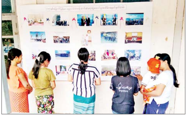
အဆိုပါ နံရံကပ်ပြဘုတ်တွင် နှစ်နိုင်ငံအစိုးရအကြီးအကဲများ အချင်းချင်း ပူးပေါင်းဆောင်ရွက်ခဲ့သည့် မှတ်တမ်းဓာတ်ပုံ ၂၀ ကို ပြသပေးခဲ့ကြောင်း သိရသည်။

ထိုသို့ဆောင်ရွက်ရာတွင် မြို့နယ်အတွင်းရှိ ဌာနဆိုင်ရာများ၊ ကျောင်းသား ကျောင်းသူများနှင့် ဒေသနေပြည်သူများအား ဖေဖော်ဝါရီ ၁၈ ရက်တွင် ကျရောက်မည့် (၇၅)နှစ်မြောက် မြန်မာနှင့်ရုရှားတို့၏ သံတမန်ဆက်ဆံရေး ထူထောင်မှုအထိမ်းအမှတ်အဖြစ် နှစ်နိုင်ငံချစ်ကြည်ရေးခရီးစဉ်မှတ်တမ်းများ၊ စီးပွားရေးပူးပေါင်းဆောင်ရွက်မှုမှတ်တမ်းများ၊ နိုင်ငံတော်စီမံအုပ်ချုပ်ရေးကောင်စီဥက္ကဋ္ဌနှင့် အဖွဲ့ဝင်များ အရှေ့ဖျား ရေငုပ်သင်္ဘောဌာနချုပ်၊ အာကာသလွှတ်တင်ရေးစခန်း၊ လေယာဉ်ထုတ်လုပ်ရေးစက်ရုံများ လေ့လာကြည့်ရှုခဲ့သည့် မှတ်တမ်းပုံများ ပြသဆောင်ရွက်ထားကြောင်း သိရသည်။