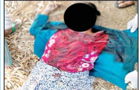
CDM မပြုလုပ်သည့်အတွက် PDF အမည်ခံ အကြမ်းဖက်သမားများက သတ်ဖြတ်ခဲ့သည့် ဆိပ်ဖြူမြို့နယ် ထမ္မကောက်ကျေးရွာ အခြေခံ ပညာအထက်တန်းကျောင်းခွဲမှ ကျောင်းအုပ် ဆရာမကြီး ဒေါ်လှလှ(သေဆုံး) မှတ်တမ်းဓာတ်ပုံ။