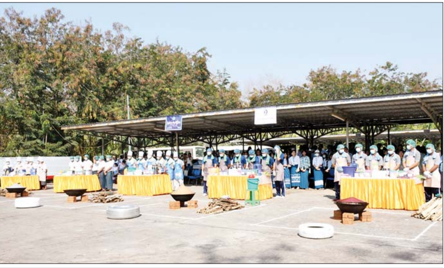
ပြည်ထောင်စုဝန်ကြီး ဦးမောင်မောင်အုန်း ပြန်ကြားရေးဝန်ကြီးဌာန၏ မြန်မာ့ရိုးရာ ထမနဲထိုးပြိုင်ပွဲအခမ်းအနားတွင် အမှာစကားပြောကြားစဉ်။

မဟုတ်ဘဲ ပြိုင်ပွဲဝင်များ၏ အားထည့်မှု၊ စေတနာပါမှု၊ ကျွမ်းကျင်မှုနှင့် အားပေးကြသူများ၏ ဝန်းရံမှုဖြင့်လည်းကောင်း ဆောင်ရွက်ရခြင်း ဖြစ်ကြောင်း၊ ထမနဲထိုးပြိုင်ပွဲသည် စုပေါင်းညီညွတ်မှုအပြင် ဉာဏ်ရည်