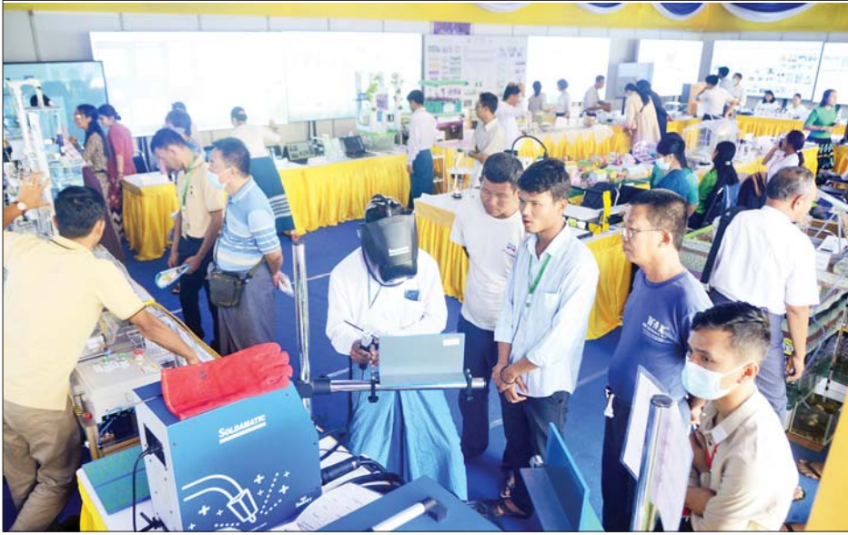
သိပ္ပံနှင့်နည်းပညာဝန်ကြီးဌာနပြခန်းတွင် လာရောက်ကြည့်ရှုသူများကို တွေ့ရစဉ်။