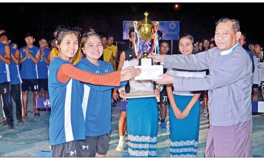
ညွှန်ကြားရေးမှူးချုပ်ဦးရဲနိုင် ပထမဆုရရှိသည့် တိုင်းရင်းသားလူမျိုးများ ရုပ်သံလိုင်း NRC ဌာနခွဲ (အမျိုးသမီး)အသင်းအား ဆုပေးအပ်ချီးမြှင့်စဉ်။

ပြိုင်ပွဲများအပြီးတွင် ဆုချီးမြှင့်ခြင်းအခမ်း အနားကို ကျင်းပရာ ညွှန်ကြားရေးမှူးချုပ်ဦးရဲနိုင်က ပထမဆုရရှိခဲ့ကြသည့် အသံလွှင့်ဌာနခွဲ (အမျိုးသား)