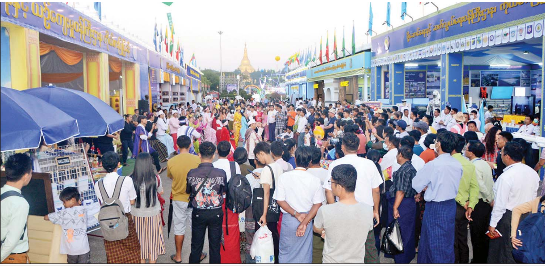
(၇၆)နှစ်မြောက် ပြည်ထောင်စုနေ့အထိမ်းအမှတ် ပြခန်းနှင့် ဈေးရောင်းပွဲတော်ကျင်းပရာ ပြည်သူ့ရင်ပြင်အတွင်း လာရောက်လည်ပတ်သူများဖြင့် စည်ကားလျက်ရှိသည်ကို တွေ့ရစဉ်။