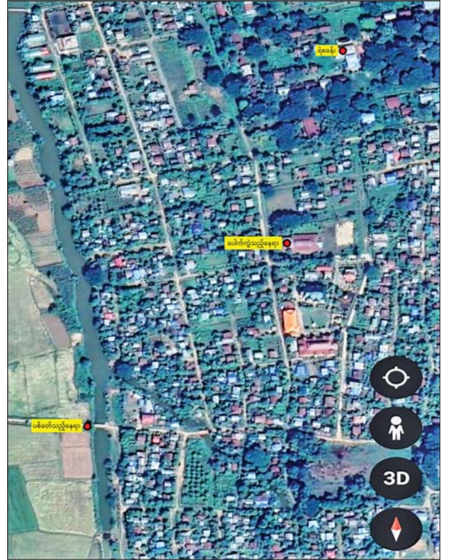
ကောလင်းမြို့ ကျော်ဇေယျာရပ်ကွက်ရှိ သုနန္ဒာရာမဘုန်းကြီး ကျောင်း၌ PDF အမည်ခံ အကြမ်းဖက်သမားများက ဗုံးပစ်လောင် ချာဖြင့် ပစ်ခတ်ခဲ့၍ ကိုရင်တစ်ပါးနှင့် ကျောင်းသားနှစ်ဦး ဒဏ်ရာရရှိ ခဲ့သည့် နေရာပြပုံ။