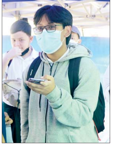
မောင်အဂ္ဂမာန်