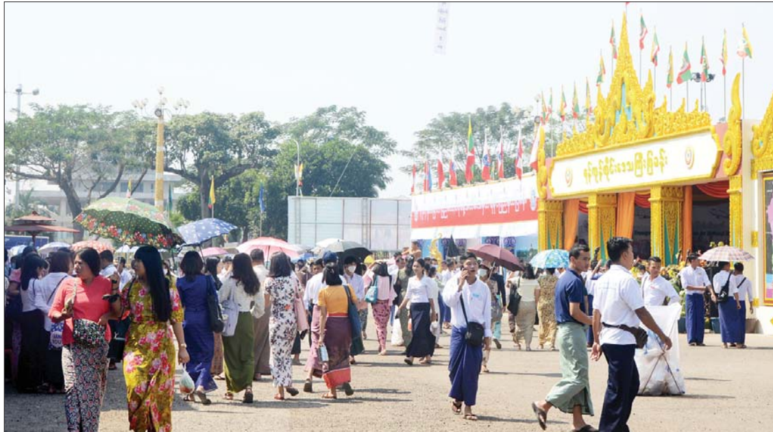
ပြည်သူ့ရင်ပြင်အတွင်း (၇၆)နှစ်မြောက် ပြည်ထောင်စုနေ့အထိမ်းအမှတ်ပြခန်းနှင့် ဈေးရောင်းပွဲတော်ကျင်းပရာ လာရောက်လည်ပတ်သူများဖြင့် စည်ကားလျက်ရှိသည်ကို တွေ့ရစဉ်။

ဘုရားစေတီတို့၊ ဟိုတယ်တို့ အပန်းဖြေခရီးသွားနိုင်တဲ့နေရာတွေ ရှိပါတယ်။ ဆည်မြောင်းနဲ့ ပတ်သက်တာတွေ၊ ရေအသုံးချမှုနဲ့ ပတ်သက်တာတွေ၊ ရေတိုင်းတာတဲ့စက်ကိရိယာတွေ၊ လေတိုင်းတာတဲ့ စက်ကိရိယာတွေရှိပါတယ်။ စီးပွားရေးဇုန်ပုံစံငယ်လေးတွေလည်း ပြသထားပါတယ်။ သစ်တောက စိမ်းလန်းစိုပြည်ရေးအတွက် ဆောင်ရွက်တဲ့ ဗီဒီယိုတွေ၊ သူတို့ရဲ့အပန်းဖြေစခန်းတွေ၊ ငလိုက်ဆည်စခန်း စတာတွေကို ပုံစံငယ်လေးတွေနဲ့ ပြထားပါတယ်။ နောက်ဒေသက ထွက်ကုန်တွေဖြစ်တဲ့ ဝါးလက်မှုပစ္စည်းတွေကို လာရောက်ပြသပြီး ပြည်သူတွေကို ရောင်းချပေးနေတာရှိပါတယ်။ နောက် MSME လုပ်ငန်းတွေ ပြထားပါတယ်။ ကျွန်တော်တို့ နေပြည်တော်ကိုယ်စားပြု