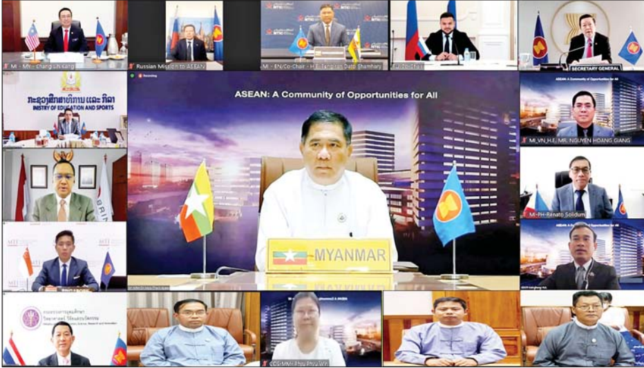
နေပြည်တော် ဖေဖော်ဝါရီ ၁၄