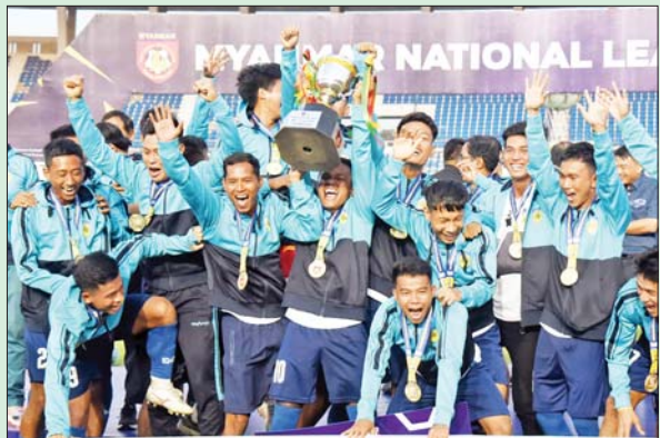
၂၀၂၂ ရာသီ MNL-2 ချန်ပီယံ တက္ကသိုလ်အသင်းကို တွေ့ရစဉ်။

မြန်မာနေရှင်နယ်လိဂ်သည် ယခုနှစ်တွင် ဒုတိယမြောက် ပြည်တွင်းလိဂ်ပြိုင်ပွဲအဖြစ် MNL-2 ပြိုင်ပွဲ ကျင်းပမည်ဖြစ်ပြီး အသင်း စုစုပေါင်း ရှစ်သင်း သို့မဟုတ် ကိုးသင်းဖြင့် ကျင်းပမည်ဖြစ်သည်။ မြန်မာနေရှင်နယ်လိဂ်သည် ၂၀၂၂ ရာသီ MNL ပြိုင်ပွဲကို အသင်း ၁၀ သင်း၊ MNL-2 ပြိုင်ပွဲကို အသင်းခုနစ်သင်းဖြင့် ကျင်းပခဲ့သော်လည်း ယခု ၂၀၂၃ ရာသီတွင် အသင်းအရေအတွက် တိုးမြှင့်ကျင်းပမည်ဖြစ်ပြီး MNL ပြိုင်ပွဲကို အသင်း ၁၂ သင်း စာမျက်နှာ ၂၀ ကော်လံ ၁ သို့ ၀