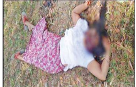
CDM မပြုလုပ်သည့်အတွက် PDF အမည်ခံ အကြမ်းဖက်သမားများက သတ်ဖြတ်ခဲ့သည့် စဉ့်ကူးမြို့နယ် ရွှေကျင်ကျေးရွာ အလယ်တန်း ကျောင်းမှ ကျောင်းအုပ်ဆရာမကြီး ဒေါ်မြမြစိုး(သေဆုံး) မှတ်တမ်းဓာတ်ပုံ။