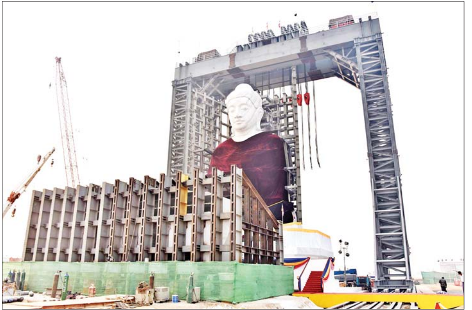
မာရဝိဇယ ဗုဒ္ဓရုပ်ပွားတော်တည် ကမ္မည်းမော်ကွန်းကျောက်စာတော်ကို တွေ့ရစဉ်။