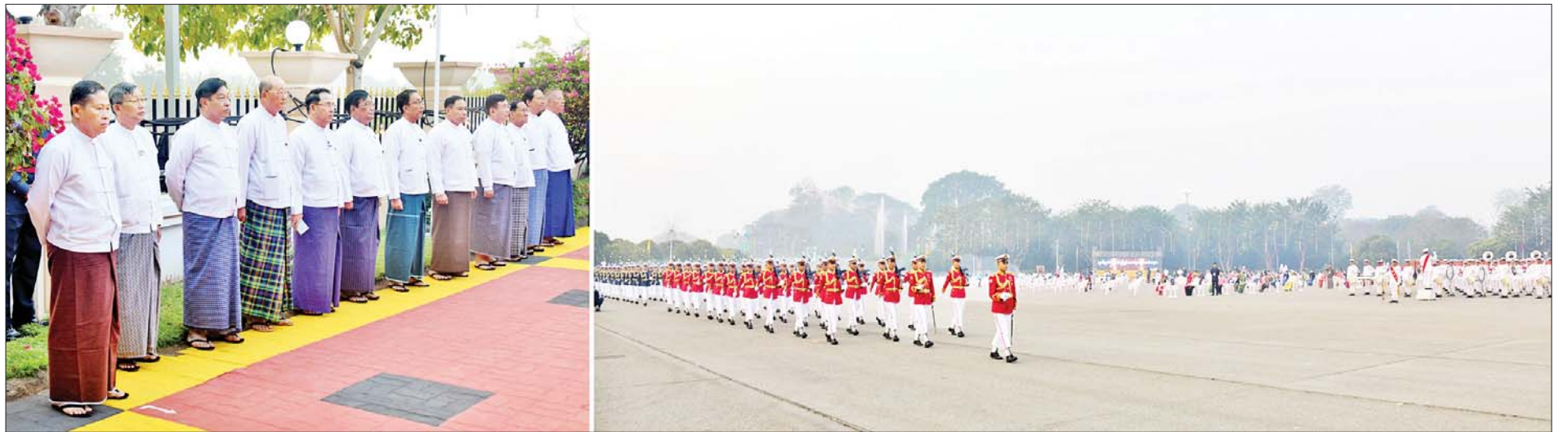
နိုင်ငံတော်စီမံအုပ်ချုပ်ရေးကောင်စီ ဒုတိယဥက္ကဋ္ဌ ဒုတိယဝန်ကြီးချုပ် ဒုတိယဗိုလ်ချုပ်မှူးကြီးစိုးဝင်းနှင့် တာဝန်ရှိသူများ (၇၆)နှစ်မြောက် ပြည်ထောင်စုနေ့အခမ်းအနား အောင်မြင်စွာကျင်းပနိုင်ရေး ဝတ်စုံပြည့်အစမ်းလေ့ကျင့်နေမှုများကို ကြည့်ရှုစစ်ဆေးစဉ်။

ထိုသို့ လေ့ကျင့်ဆောင်ရွက်နေမှုများကို (၇၆)နှစ်မြောက် ပြည်ထောင်စုနေ့ကျင်းပရေးဗဟိုကော်မတီဥက္ကဋ္ဌ နိုင်ငံတော်စီမံအုပ်ချုပ်ရေးကောင်စီ ဒုတိယဥက္ကဋ္ဌ ဒုတိယဝန်ကြီးချုပ်နှင့်အတူ အခမ်းအနားကျင်းပရေး ဗဟိုကော်မတီဝင် ပြည်ထောင်စုဝန်ကြီးများ၊ နေပြည်တော်ကောင်စီဥက္ကဋ္ဌ၊ ဆပ်ကော်မတီအသီးသီးမှ ဥက္ကဋ္ဌများဖြစ်ကြသည့် ဒုတိယဝန်ကြီးများနှင့် တာဝန်ရှိသူများက ကြည့်ရှုခဲ့ကြပြီး လိုအပ်သည်များ ညှိနှိုင်းဆောင်ရွက်ပေးခဲ့ကြောင်း သိရသည်။ သတင်းစဉ်