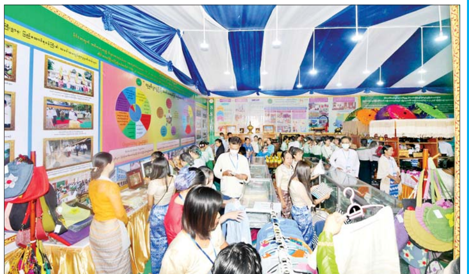
သမဝါယမနှင့် ကျေးလက်ဖွံ့ဖြိုးရေးဝန်ကြီးဌာန ပြခန်းတွင် လေ့လာကြည့်ရှုသူများကို တွေ့ရစဉ်။