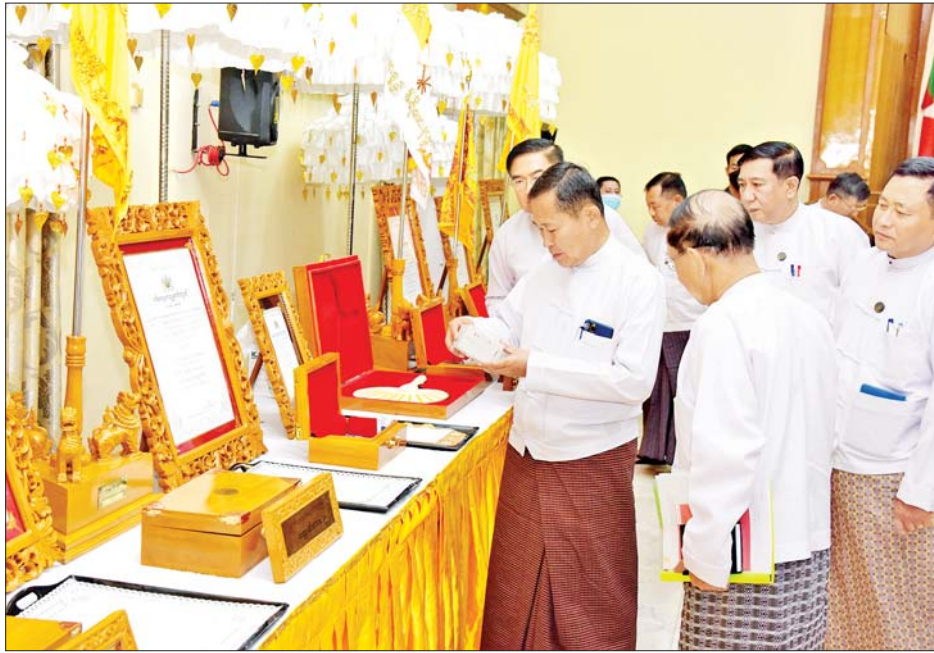
နိုင်ငံတော်စီမံအုပ်ချုပ်ရေးကောင်စီ ဒုတိယဥက္ကဋ္ဌ ဒုတိယဝန်ကြီးချုပ် ဒုတိယဗိုလ်ချုပ်မှူးကြီး စိုးဝင်း သာသနာတော်ဆိုင်ရာဘွဲ့တံဆိပ်တော်များ ခင်းကျင်းပြသထားမှုကို ကြည့်ရှုစဉ်။

လုပ်ငန်းတာဝန်များ လစ်ဟင်းမှုမရှိစေရန် သက်ဆိုင်ရာ ဆပ်ကော်မတီများအလိုက် စနစ်တကျ စီမံခန့်ခွဲခြင်းနှင့် ပေါင်းစပ်ညှိနှိုင်းခြင်း ဆောင်ရွက်ရမည်ဖြစ်၍ ကြိုတင် ဇာတ်တိုက်လေ့ကျင့်သွားကြ