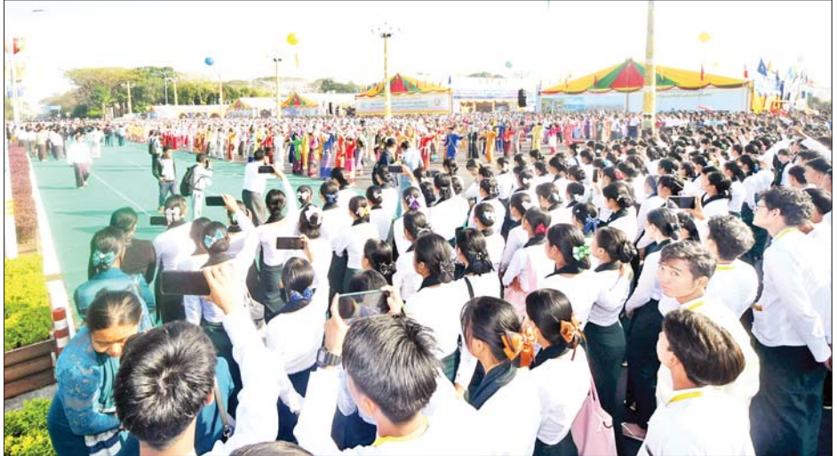
တိုင်းရင်းသား တိုင်းရင်းသူများ၊ ကျောင်းသား ကျောင်းသူများက တေးသီချင်းများဖြင့် စုပေါင်း ဂုဏ်ပြုဖျော်ဖြေတင်ဆက်စဉ်။