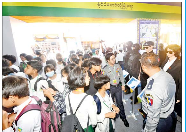
ပြည်ထဲရေးဝန်ကြီးဌာန ပြခန်းတွင် လေ့လာကြည့်ရှုသူများကို တွေ့ရစဉ်။