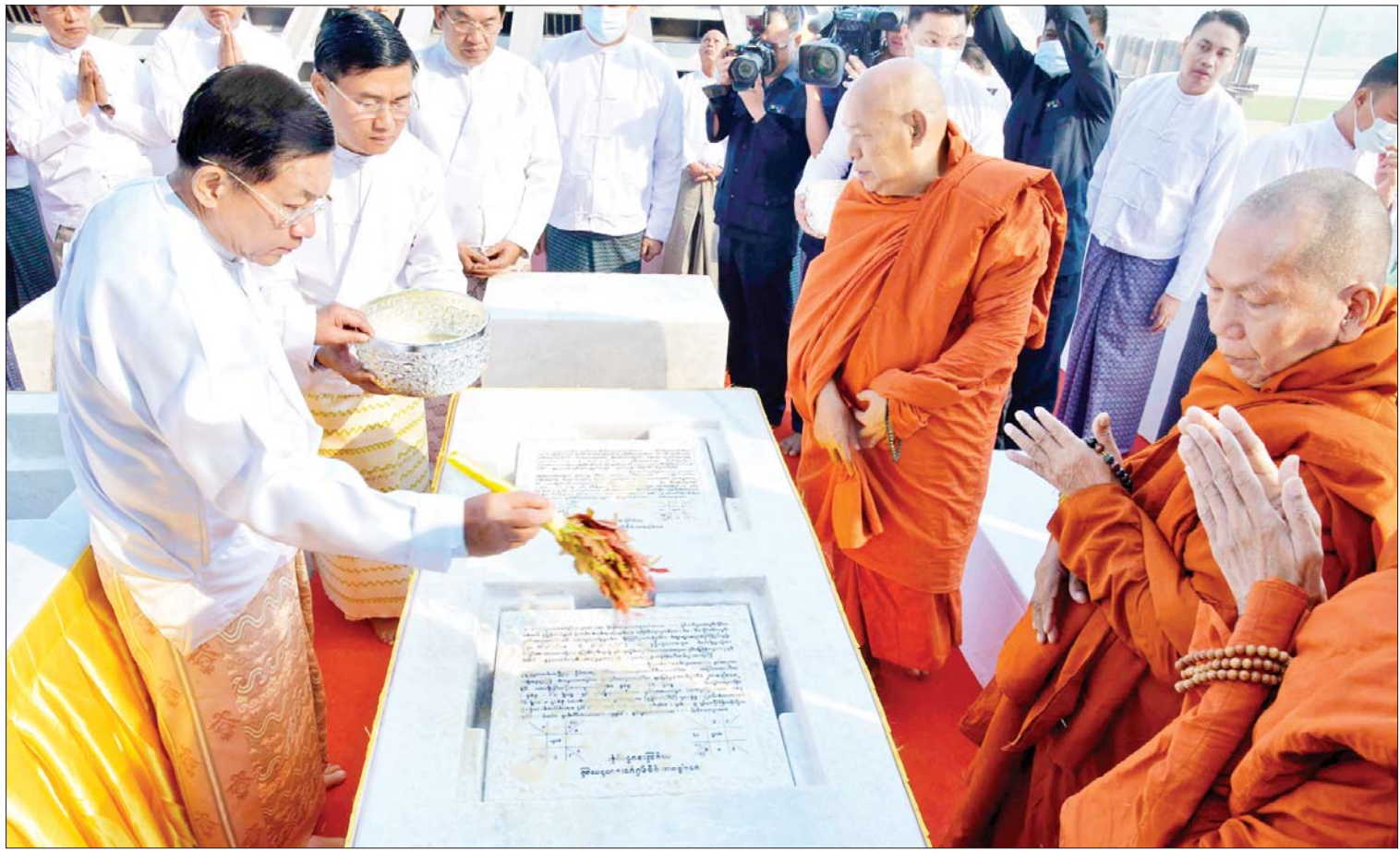
ဦးဆောင်ဘုရားဒါယကာ နိုင်ငံတော်စီမံအုပ်ချုပ်ရေးကောင်စီဥက္ကဋ္ဌ နိုင်ငံတော်ဝန်ကြီးချုပ် ဗိုလ်ချုပ်မှူးကြီးမင်းအောင်လှိုင် ဌာပနာတော်တိုက်များအား နံ့သာရည်များ ပက်ဖျန်းပူဇော်စဉ်။

နေပြည်တော် ဖေဖော်ဝါရီ ၁၀ ပြည်ထောင်စုနယ်မြေ နေပြည်တော် ဒက္ခိဏသီရိမြို့နယ်ရှိ မာရဝိဇယဗုဒ္ဓ ဥယျာဉ်တော်အတွင်း တည်ထားကိုးကွယ် ရန် ဆောင်ရွက်လျက်ရှိသည့် မာရဝိဇယ ဗုဒ္ဓရုပ်ပွားတော်မြတ်ကြီး ရတနာပလ္လင် တော်ထက် အလယ်ပဟိုဠာနမ္ပုဒ်များတွင် ဦးဆောင်ဘုရားဒါယကာ နိုင်ငံတော်စီမံ အုပ်ချုပ်ရေးကောင်စီဥက္ကဋ္ဌ နိုင်ငံတော် ဝန်ကြီးချုပ် ဗိုလ်ချုပ်မှူးကြီးမင်းအောင်လှိုင် အမှူးပြုသည့် ပြည်ထောင်စုသမ္မတ မြန်မာနိုင်ငံတော်တစ်ဝန်းလုံးမှ ဌာပနာ တော်ကုသိုလ်ရှင်များ လှူဒါန်းထားသည့် ဌာပနာတော်များ သွင်းလှူပူဇော်ခြင်း မဟာမင်္ဂလာအခမ်းအနားကို ယနေ့နံနက် ပိုင်းတွင် အဆိုပါ ဗုဒ္ဓဥယျာဉ်တော်အတွင်း ရှိ မာရဝိဇယဗုဒ္ဓရုပ်ပွားတော်မြတ်ကြီး တည်ထားကိုးကွယ်သည့် ရတနာပလ္လင် တော်ထက်၌ ကျင်းပပြုလုပ်သည်။ အဆိုပါ ဌာပနာတော်သွင်းလှူပူဇော် ခြင်း မဟာမင်္ဂလာအခမ်းအနားသို့ မာရဝိဇယ ရုပ်ပွားတော်မြတ်ကြီး တည်ဆောက်ရေး ဩဝါဒါစရိယဆရာ တော် နေပြည်တော် ပျဉ်းမနားမြို့ စာမျက်နှာ ၃ ကော်လံ ၁ သို့ ။