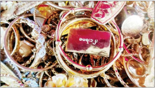
စေတနာရှင် အလှူရှင်များ စုပေါင်းလှူဒါန်းထားသည့် အဖိုးတန် ရတနာရွှေငွေ ကျောက်သံပတ္တမြားများကို တွေ့ရစဉ်။