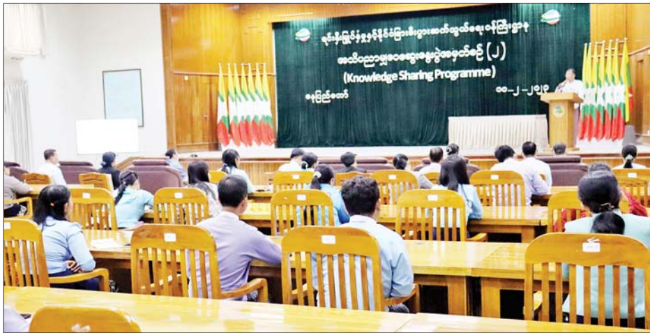
ဌာန၏ လုပ်ငန်းဆောင်ရွက်ချက်များ ပြီးမြောက် ပြုကြောင်း၊ ထို့ကြောင့် ဝန်ကြီးဌာနအနေဖြင့် ဝန်ထမ်းများ၏ Capacity တိုးတက်လာစေရေးကို

ဆွေးနွေးပွဲတွင် ပြည်ထောင်စုဝန်ကြီး ဒေါက်တာ ကံဇော်က ဝန်ထမ်းတစ်ဦးချင်းစီ၏ စွမ်းဆောင်ရည် သည် အလွန်အရေးကြီးကြောင်း၊ ဝန်ထမ်းတစ်ဦးစီ ၏ စွမ်းဆောင်ရည်တိုးတက်လာခြင်းသည် ဝန်ကြီး