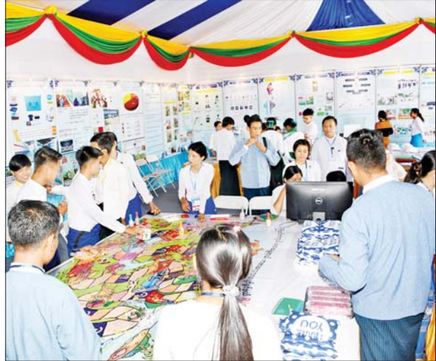
လူမှုဝန်ထမ်း၊ ကယ်ဆယ်ရေးနှင့် ပြန်လည်နေရာချထားရေး ဝန်ကြီးဌာနပြခန်းတွင် လေ့လာကြည့်ရှုသူများကို တွေ့ရစဉ်။