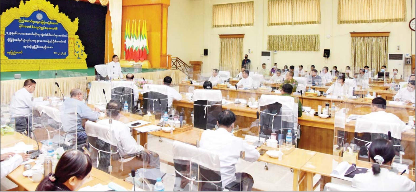
နိုင်ငံတော်စီမံအုပ်ချုပ်ရေးကောင်စီ ဒုတိယဥက္ကဋ္ဌ ဒုတိယဝန်ကြီးချုပ် ဒုတိယဗိုလ်ချုပ်မှူးကြီး စိုးဝင်း ၂၀၂၃ ခုနှစ် သာသနာတော်ဆိုင်ရာဘွဲ့တံဆိပ်တော်များ ဆက်ကပ်ချီးမြှင့်အပ်နှင်းပွဲ ကျင်းပရေးနာယကအဖွဲ့နှင့် ဦးစီးကော်မတီ လုပ်ငန်းညှိနှိုင်းအစည်းအဝေးတွင် အမှာစကားပြောကြားစဉ်။

နေပြည်တော် ဖေဖော်ဝါရီ ၁၀ ပြည်ထောင်စုသမ္မတ မြန်မာနိုင်ငံတော် နိုင်ငံတော်စီမံအုပ်ချုပ်ရေးကောင်စီ ၂၀၂၃ ခုနှစ် သာသနာတော်ဆိုင်ရာ ဘွဲ့တံဆိပ်တော်များ ဆက်ကပ် ချီးမြှင့်အပ်နှင်းပွဲ ကျင်းပရေးနာယကအဖွဲ့နှင့် ဦးစီးကော်မတီ လုပ်ငန်းညှိနှိုင်းအစည်းအဝေးကို ယနေ့ဖွန်းလွှဲ ၁ နာရီခွဲတွင် နေပြည်တော်ရှိ သာသနာရေးနှင့် ယဉ်ကျေးမှုဝန်ကြီးဌာန အစည်းအဝေးခန်းမ၌ ကျင်းပရာ သာသနာတော်ဆိုင်ရာ ဘွဲ့တံဆိပ်တော်များ ဆက်ကပ်ချီးမြှင့်အပ်နှင်းပွဲကျင်းပရေး နာယကအဖွဲ့ဥက္ကဋ္ဌ နိုင်ငံတော်စီမံအုပ်ချုပ်ရေးကောင်စီ ဒုတိယဥက္ကဋ္ဌ ဒုတိယဝန်ကြီးချုပ် ဒုတိယဗိုလ်ချုပ်မှူးကြီး စိုးဝင်း တက်ရောက်အမှာစကား ပြောကြားသည်။ စာမျက်နှာ ၅ ကော်လံ ၁ သို့ ☸