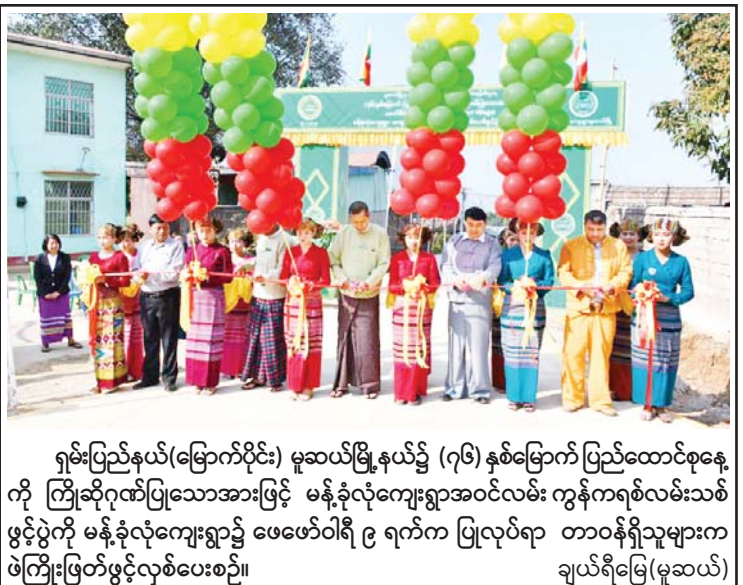
ရှမ်းပြည်နယ်(မြောက်ပိုင်း) မူဆယ်မြို့နယ်၌ (၇၆) နှစ်မြောက် ပြည်ထောင်စုနေ့ ကို ကြိုဆိုဂုဏ်ပြုသောအားဖြင့် မန်နိုလုံကျေးရွာအဝင်လမ်း ကွန်ကရစ်လမ်းသစ် ဖွင့်ပွဲကို မန်နိုလုံကျေးရွာ၌ ဖေဖော်ဝါရီ ၉ ရက်က ပြုလုပ်ရာ တာဝန်ရှိသူများက ဖဲကြိုးဖြတ်ဖွင့်လှစ်ပေးစဉ်။ ချယ်ရီမြေ(မူဆယ်)

မန်ဂြိုဟ်မှန်းတည့်ချိန်အထိ ခန့်မှန်းချက် နေပြည်တော် ဖေဖော်ဝါရီ ၁၀ တနင်္သာရီတိုင်း ဒေသကြီးတွင် နေရာကျကျနှင့် စစ်ကိုင်းတိုင်းဒေသကြီး အထက်ပိုင်းနှင့် ကချင်ပြည်နယ်တို့တွင် နေရာကွက်ကျား မိုးအနည်းငယ်ထစ်ချရန် ရွာနိုင်သည်။ ရွာရန်ရာနွန်း ၆၀ ဖြစ်သည်။ ကရင်ပြည်နယ်နှင့် မွန်ပြည်နယ်တို့တွင် တိမ်အသင့်အတင့် ဖြစ်ထွန်းပြီး ကျန်တိုင်းဒေသကြီးနှင့် ပြည်နယ်တို့တွင် အများအားဖြင့် သာယာမည်။ မိုး/ဇလ