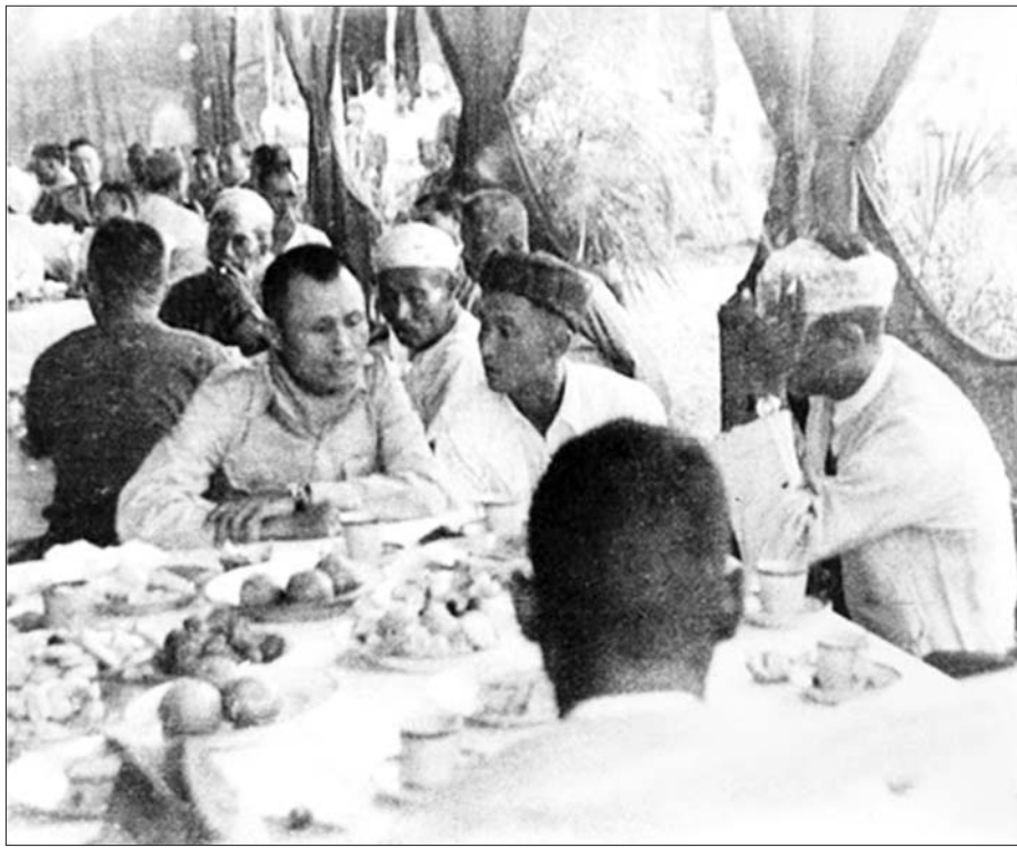
၁၉၄၇ ခုနှစ် ဖေဖော်ဝါရီလ ၁၁ ရက်နေ့ ညပိုင်းက (ပင်လုံစာချုပ် မချုပ်ဆိုမီ) ပင်လုံမြို့စော်ဘွားများ ညစားစားပွဲ၌ ဗိုလ်ချုပ်အောင်ဆန်း တက်ရောက်စဉ်။

ပင်လုံစာချုပ် မချုပ်ဆိုမီ ၁၉၄၇ ခုနှစ် ဖေဖော် ဝါရီလ ၁၁ ရက်နေ့ည ပင်လုံမြို့ စော်ဘွားများ ထမင်းစားပွဲတွင် ဗိုလ်ချုပ်အောင်ဆန်းက “ကျွန်တော် ဒီကိုရောက်လာတဲ့ကိစ္စ နားလည်တာ တစ်ခုရှိပါတယ်။ ဘာလဲဆိုရင် မြန်မာပြည်ကြီး လွတ်လပ်စေချင်တယ်။ ညီညွတ်စေချင်တယ်။