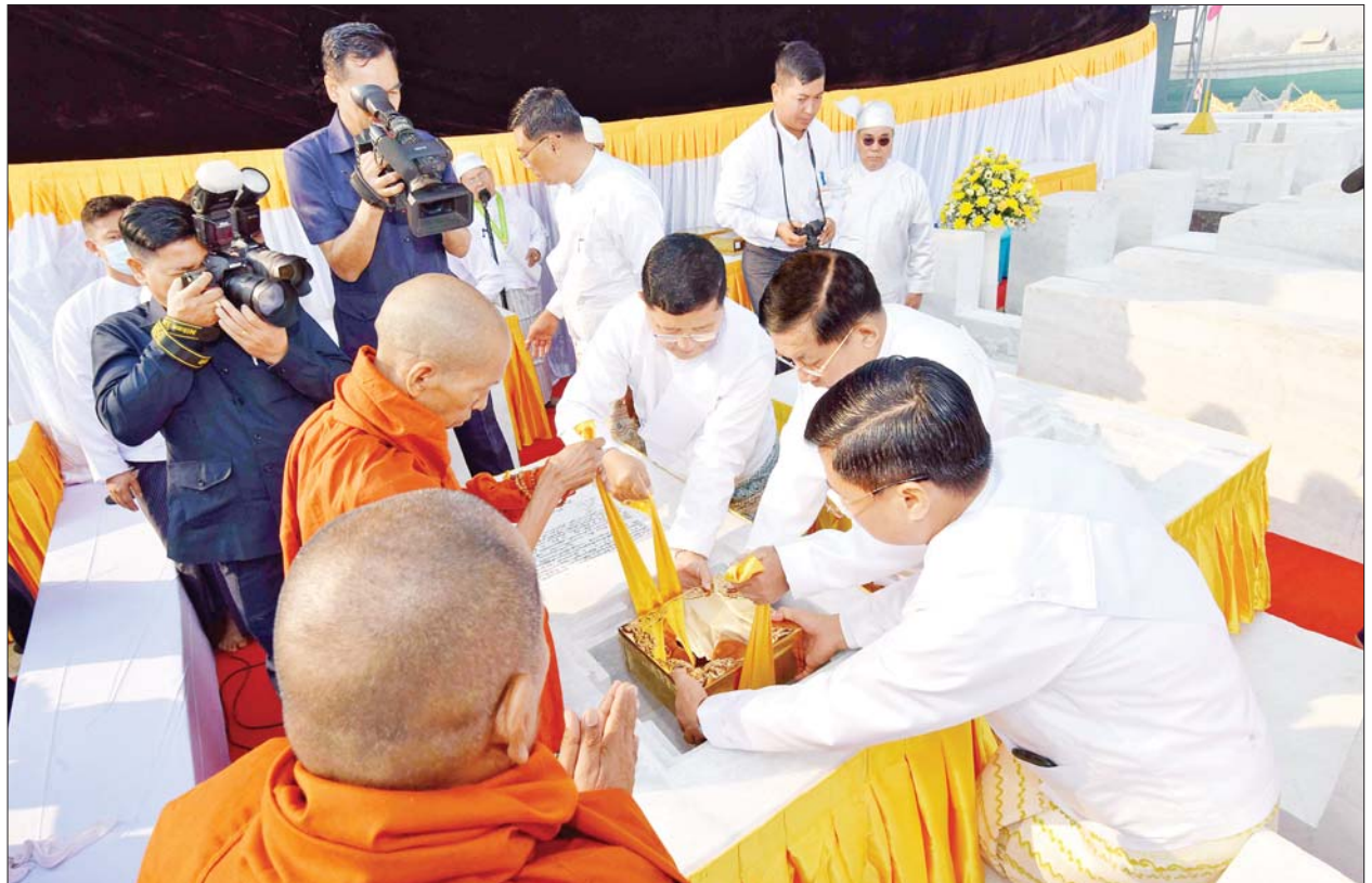
ပါဠိတက္ကသိုလ် မင်္ဂလာဇေယျူကျောင်းတိုက် ပဓာနနာယက အဂ္ဂမဟာပဏ္ဍိတ အဂ္ဂမဟာသဒ္ဓမ္မဇောတိကဓဇ ဘဒ္ဒန္တ ဝိမလဗုဒ္ဓိနှင့် ဦးဆောင်ဘုရားဒါယကာ နိုင်ငံတော်စီမံအုပ်ချုပ်ရေးကောင်စီဥက္ကဋ္ဌ နိုင်ငံတော်ဝန်ကြီးချုပ် ဗိုလ်ချုပ်မှူးကြီး မင်းအောင်လှိုင်တို့ မာရဝိဇယ ဗုဒ္ဓရုပ်ပွားတော်မြတ်ကြီး ရတနာပလ္လင်တော်ထက် ဗဟိုဌာနနေရာရှိ ဌာပနာတိုက်တော်အတွင်း ဌာပနာတော်ပစ္စည်းများ ထည့်သွင်းထားသည့် ရွှေသေတ္တာတော်ကို ထုံးတမ်းစဉ်လာများနှင့်အညီ သွင်းလှူပူဇော်စဉ်။