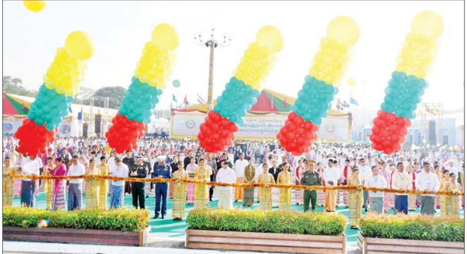
ရန်ကုန်တိုင်းဒေသကြီး ဝန်ကြီးချုပ် ဦးစိုးသိန်းနှင့် တာဝန်ရှိသူများ (၇၆)နှစ်မြောက် ပြည်ထောင်စုနေ့ အထိမ်းအမှတ် ပြခန်းနှင့် ဈေးရောင်းပွဲတော် ဖွင့်ပွဲအခမ်းအနားကို ဖဲကြိုးဖြတ်ဖွင့်လှစ်ပေးစဉ်။

(၇၆)နှစ်မြောက် ပြည်ထောင်စုနေ့ အထိမ်း အမှတ် ပြခန်းများနှင့် ဈေးရောင်းပွဲတော်ကို ယနေ့မှ ဖေဖော်ဝါရီ ၁၄ ရက်အထိ နေ့စဉ် နံနက် ၉ နာရီမှ ည ၁၀ နာရီအထိ ခင်းကျင်းပြသသွားမည်ဖြစ်ပြီး ပွဲတော်ရက်အတွင်း တိုင်းရင်းသားရိုးရာအကများ၊ ရုပ်ရှင်နှင့် ဂီတမှအနုပညာရှင်များက ဖျော်ဖြေတင် ဆက်ကာ ညပိုင်း၌ မီးရှူးမီးပန်းများ ပစ်ဖောက်၍ ပြည်ထောင်စုနေ့ကို ဂုဏ်ပြုသွားမည်ဖြစ်ရာ အများ ပြည်သူ့လာရောက်ကြည့်ရှုလေ့လာနိုင်ကြောင်း သိရ သည်။