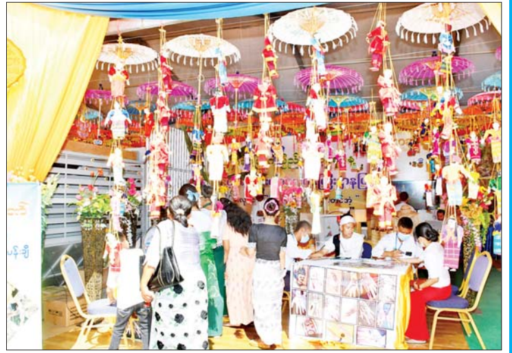
ဟိုတယ်နှင့်ခရီးသွားလာရေးဝန်ကြီးဌာန ပြခန်းတွင် လေ့လာကြည့်ရှုသူများ ကို တွေ့ရစဉ်။