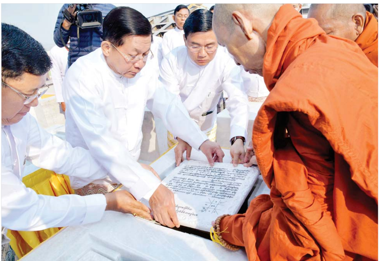
ဦးဆောင်ဘုရားဒါယကာ နိုင်ငံတော်စီမံအုပ်ချုပ်ရေးကောင်စီဥက္ကဋ္ဌ နိုင်ငံတော်ဝန်ကြီးချုပ် ဗိုလ်ချုပ်မှူးကြီးမင်းအောင်လှိုင် မာရဝိဇယ ဗုဒ္ဓရုပ်ပွားတော်တည် ကမ္မည်းမော်ကွန်းကျောက်စာတော်ကို သတ်မှတ်ဌာပနာတော်နေရာတွင် ထုံးတမ်းစဉ်လာများနှင့်အညီ သွင်းလှူပူဇော်စဉ်။

လှူဒါန်းကုသိုလ်ပြု ထိုပြင် မိဘပြည်သူများ ထပ်မံ၍ ကုသိုလ်ယူလှူဒါန်းနိုင်ရေး ဗုဒ္ဓရုပ်ပွားတော်မြတ်ကြီး၏ ရတနာပလ္လင်တော်ထက် အလယ်ဗဟိုဌာနများတွင် ဌာပနာတော်များကို ထပ်မံထည့်သွင်း လှူဒါန်းပူဇော်မည်ဖြစ်ကြောင်း၊ ကုသိုလ်တော် ရေရှည်တည်တံ့ ခိုင်မြဲနိုင်မည့် အဖိုးတန် ကျောက်မျက်ရတနာ