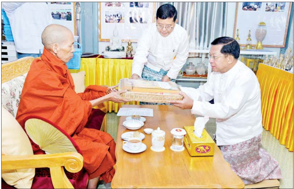
ဦးဆောင်ဘုရားဒါယကာ နိုင်ငံတော်စီမံအုပ်ချုပ်ရေးကောင်စီဥက္ကဋ္ဌ နိုင်ငံတော်ဝန်ကြီးချုပ် ဗိုလ်ချုပ်မှူးကြီး မင်းအောင်လှိုင် ပါဠိတက္ကသိုလ် မင်္ဂလာဇေယျူကျောင်းတိုက် ပဓာနနာယက အဂ္ဂမဟာပဏ္ဍိတ အဂ္ဂမဟာသဒ္ဓမ္မဇောတိကဓဇ ဘဒ္ဒန္တ ဝိမလဗုဒ္ဓိထံ လှူဖွယ်ပစ္စည်းများ ဆက်ကပ်လှူဒါန်းစဉ်။

လင်္ကာနှစ်ပိုဒ်ကို သံပြိုင်ညီညာသုံးကြိမ် ရွတ်ဆိုပွားများ ပူဇော်ကြသည်။ ဆက်လက်၍ ဦးဆောင်ဘုရားဒါယကာ နိုင်ငံတော်စီမံအုပ်ချုပ်ရေးကောင်စီဥက္ကဋ္ဌ နိုင်ငံတော်ဝန်ကြီးချုပ်နှင့် ဘုရားဒါယကာများက ဆရာတော်ကြီးများရွတ်ပွားသရဇ္ဈာယ်တော်မူကြသည့် ဇယမင်္ဂလာဂါထာတော်ကို နာယူကြည့်ညိကြသည်။ သွင်းလှူပူဇော် ထို့နောက် အခမ်းအနားမှူးက မင်္ဂလာအခါတော်စာတမ်းကို ဖတ်ကြားသည်။ မင်္ဂလာအချိန်တော်တွင် ပါဠိဆရာတော်ကြီးနှင့် ဦးဆောင်ဘုရားဒါယကာ နိုင်ငံတော်စီမံအုပ်ချုပ်ရေးကောင်စီဥက္ကဋ္ဌ နိုင်ငံတော်ဝန်ကြီးချုပ် ဗိုလ်ချုပ်မှူးကြီး မင်းအောင်လှိုင်တို့သည် မာရဝိဇယ ဗုဒ္ဓရုပ်ပွားတော်မြတ်ကြီး ရတနာပလ္လင်တော်ထက် ဗဟိုဌာနနေရာရှိ ဌာပနာတိုက်တော်များအတွင်းသို့ နိုင်ငံတော်စီမံအုပ်ချုပ်ရေးသုံးစရိတ် သားသမီး ဘုရားဒါယကာ ဒါယိကာမများ၊ စေတနာရှင် အလှူရှင်များ စုပေါင်းလှူဒါန်း