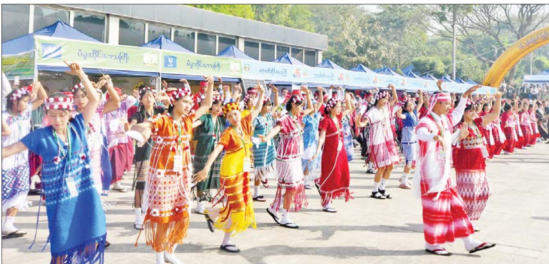
တိုင်းရင်းသားရိုးရာအကများဖြင့် ဖျော်ဖြေတင်ဆက်နေသည်ကို တွေ့ရစဉ်။