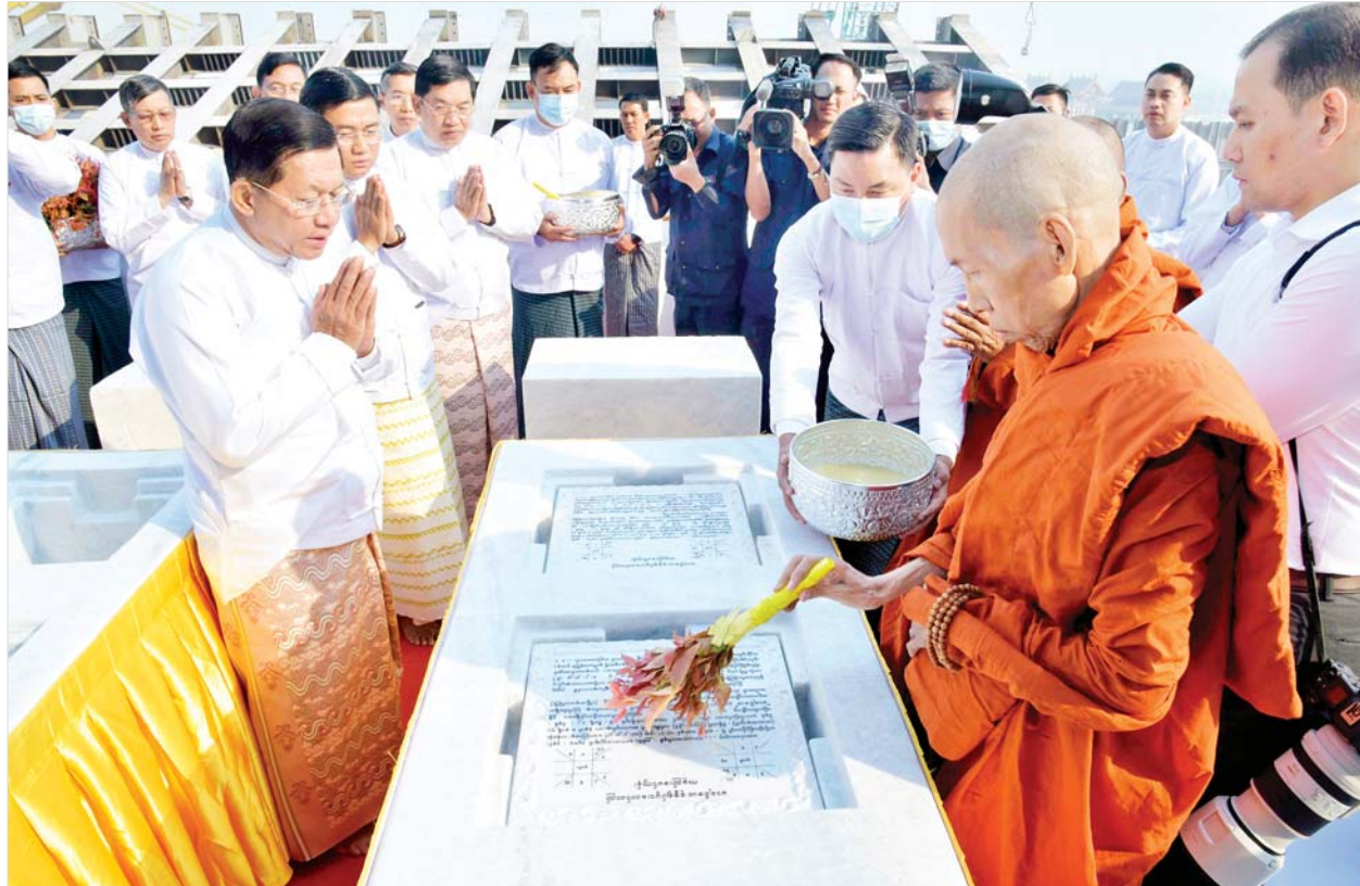
နေပြည်တော် ပျဉ်းမနားမြို့ ပါဠိတက္ကသိုလ် မင်္ဂလာဇေယျကျောင်းတိုက် ပဓာနနာယက အဂ္ဂမဟာပဏ္ဍိတ အဂ္ဂမဟာသဒ္ဓမ္မဇောတိကဇော ဘဒ္ဒန္တ ဝိမလဗုဒ္ဓိ ဌာပနာတော်တိုက်များအား နံ့သာရည်များ ပက်ဖျန်းပူဇော်စဉ်။

များ ဌာပနာတော် ကုသိုလ်ပြုနိုင်ရန်အတွက် ဆက်သွယ်လှူဒါန်းနိုင်ကြောင်း နိဗ္ဗာန်အကျိုးမျှော်၍ အသိပေးနှိုးဆော်ခဲ့ရာ နိုင်ငံတစ်ဝန်းလုံးရှိ ခုနစ်ရက် သား၊ သမီး၊ ဘုရားဒါယကာ၊ ဒါယိကာမများ၊ စေတနာရှင်၊ အလှူရှင်များက နေပြည်တော်ကောင်စီပြည်ထောင်စု နယ်မြေအပါအဝင် တိုင်းဒေသကြီးနှင့် ပြည်နယ်အသီးသီးမှ တာဝန်ရှိသူများထံသို့ ဝမ်းပန်းတသာ ဆက်သွယ်၍ အဖိုးတန် ကျောက်မျက်ရတနာဌာပနာတော် ကုသိုလ်ပစ္စည်းများကို ထည့်ဝင်လှူဒါန်း ကုသိုလ်ပြုခဲ့ကြသည်။ ထိုကဲ့သို့ နိုင်ငံတစ်ဝန်းလုံးရှိ မိဘပြည်သူများ ဝမ်းပန်းတသာ ဆက်သွယ် လှူဒါန်းခဲ့ကြသည့် ရွှေထည် ၁၃၆၀ ကျပ်သား ၅ ဒသမ ၄ ရွှေ၊ ကျောက်မျက်ရတနာပါ ရွှေထည်ပစ္စည်း ၁၆၈၄ ကျပ်သား ၁၅ ပဲ ၁ ဒသမ ၆ ရွှေ၊ ကျောက်မျက်ရတနာပါ ငွေထည် ပစ္စည်း ၁၂၆ ပဲ ၅ ဒသမ ၁ ရွှေ၊ ကျောက်မျိုးစုံ၊ ပုလဲမျိုးစုံ အပါအဝင် နိုင်ငံတကာမှ ငွေဒင်္ဂါးပြားများ၊ အဖိုးတန် ရွှေ ငွေ၊ ကျောက်သံပတ္တမြားများကို ယနေ့တွင် မာရဝိဇယဗုဒ္ဓရုပ်ပွားတော်မြတ်ကြီး၏ ရတနာပလ္လင်တော်ထက် အလယ်ဗဟိုဌာနများတွင် ဌာပနာသွင်းလှူ ပူဇော်နိုင်ခဲ့ကြောင်းနှင့် ဘုရားကြီး ဘက်စုံအလှူငွေအဖြစ် ငွေကျပ်သိန်းပေါင်း ၈၁၀၀ ကျော်ကိုလည်း လက်ခံရရှိခဲ့သည်။ အလင်းပေးပူဇော်ထားရှိ ထိုပြင် မာရဝိဇယဗုဒ္ဓဥယျာဉ်တော်အတွင်း၌ ကျောက်စာရုံ စေတီတော်များ၊ ရေပန်းရင်ပြင်တော်များ၊ ဘုရားကြီးရင်ပြင်တော်၊ သုဓမ္မာဇရပ်များနှင့် ပင်မအဝင်လမ်းတို့တွင် အများပြည်သူ ကြည့်ညှိသွယ်ဖွယ်ဖြစ်အောင် မီးထွန်းညှိ၍ အလင်းပေးပူဇော်ထားရှိကြောင်း သိရသည်။ သတင်းစဉ်