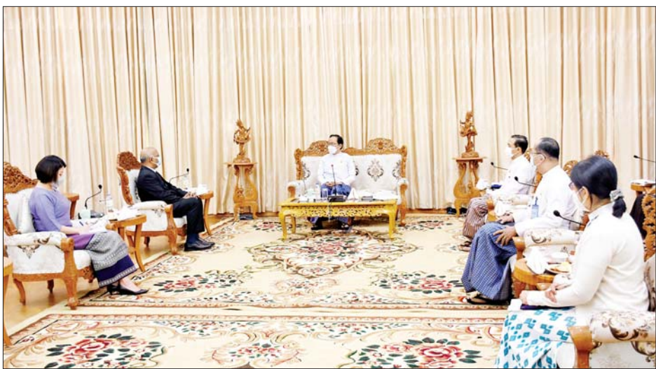
စေရေးအတွက် ပူးပေါင်းဆောင်ရွက်မည့် ကိစ္စ၊ နည်းပညာပိုင်းဆိုင်ရာ အကူအညီများ ပိုမိုပံ့ပိုးပေး နိုင်ရေးကိစ္စ၊ ရှေ့ဆက်လက် ပူးပေါင်းဆောင်ရွက်မည့် ကိစ္စရပ်များကို အမြင်ချင်းဖလှယ်ဆွေးနွေးခဲ့ကြ သည်။

ဝန်ကြီးဌာန၏ခုခံကျ/ကာလသားရောဂါတိုက်ဖျက်ရေး ရည်မှန်းချက်များပြည့်မီစေရန် နည်းပညာပိုင်းဆိုင်ရာ အကူအညီများ ပိုမိုပံ့ပိုးပေးရေးဆွေးနွေးပြောကြား ခဲ့ရာ UNAIDS ညွှန်ကြားရေးမှူးက မြန်မာနိုင်ငံ၏ ကိုဗစ်-၁၉ ရောဂါ ကာကွယ်၊ ထိန်းချုပ်ရေးလုပ်ငန်း အောင်မြင်မှုများကို ချီးကျူးပါကြောင်း၊ ကိုဗစ်-၁၉ ကပ်ရောဂါဖြစ်ပွားမှုနှင့် ကျန်းမာရေးလူ့စွမ်းအား စိန်ခေါ်မှုများရှိခဲ့သော်လည်း ဝန်ကြီးဌာနအနေဖြင့် HIV/AIDS ရောဂါဝေဒနာခံစားနေရသည့် လူနာများ အတွက် ART ဆေးဝါးများ ပြတ်လပ်မှုမရှိစေရေး ဆောင်ရွက်ပေးခဲ့မှုများကို အသိအမှတ်ပြုချီးကျူးပါ ကြောင်း၊ ဝန်ကြီးဌာန၏ ခုခံကျ/ ကာလသားရောဂါ ကာကွယ်တိုက်ဖျက်ရေးလုပ်ငန်းများကို ဆက်လက် ပံ့ပိုးပေးသွားမည်ဖြစ်ပါကြောင်း ပြန်လည်ဆွေးနွေး ပြောကြားခဲ့ပြီး ၂၀၂၁-၂၀၂၆ ခုနှစ် ကမ္ဘာလုံးဆိုင်ရာ အေအိုင်ဒီအက်စ် မဟာဗျူဟာ (Global AIDS Strategy 2021-2026)ဖြစ်သည့် “မညီမျှမှုအဆုံးသတ်စေရေး၊ အေအိုင်ဒီအက်စ်ရောဂါပပျောက်ရေး (End Inequalities, End AIDS.)” ရည်မှန်းချက်ပြည့်မီ