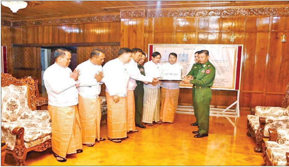
မာရဝိဇယရုပ်ပွားတော်မြတ်ကြီး တည်ထားကိုးကွယ်ရာတွင် အသုံးပြုနိုင်ရေးအတွက် ရန်ကုန်တိုင်းဒေသကြီးအစိုးရအဖွဲ့က အလှူငွေကျပ်သိန်း ၅၅၅၀ ကို ပေးအပ်လှူဒါန်းစဉ်။