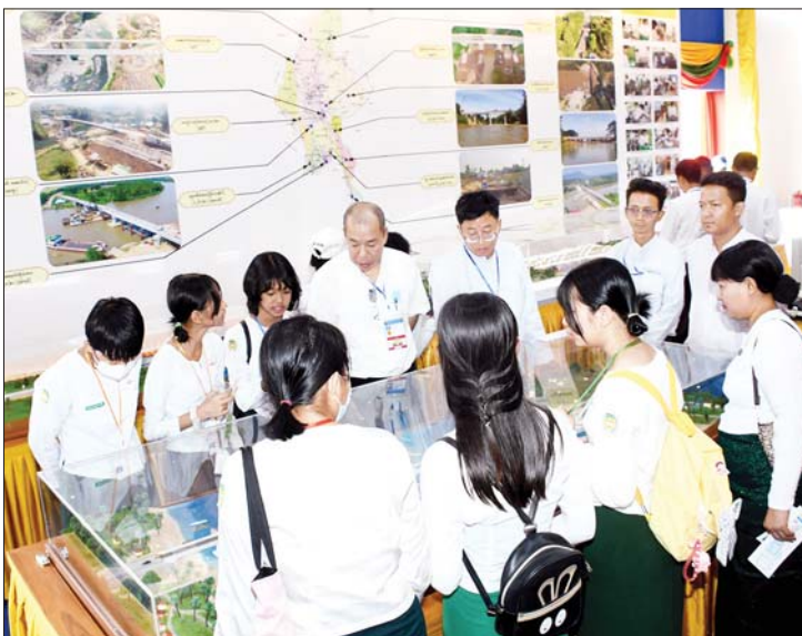
ဆောက်လုပ်ရေးဝန်ကြီးဌာန ပြခန်းတွင် လေ့လာကြည့်ရှုသူများကို တွေ့ရစဉ်။