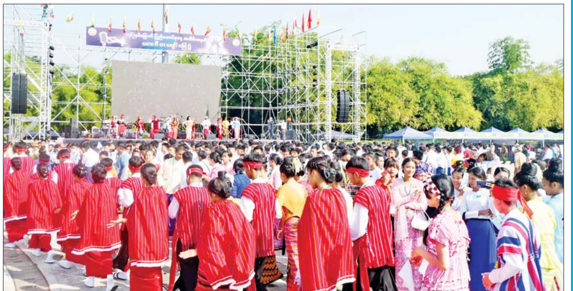
(၇၆)နှစ်မြောက် ပြည်ထောင်စုနေ့အထိမ်းအမှတ် တေးဂီတဖျော်ဖြေပွဲတွင် အားပေးကြည့်ရှုသူများကို တွေ့ရစဉ်။