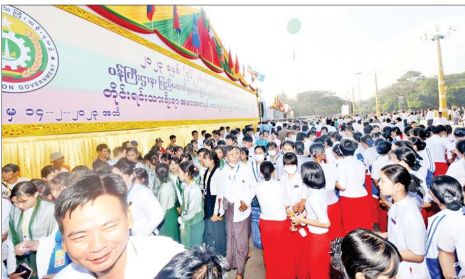
တိုင်းရင်းသားရိုးရာအစားအစာပြခန်းများတွင် လှည့်လည်ကြည့်ရှုအားပေးကြသူများကို တွေ့ရစဉ်။