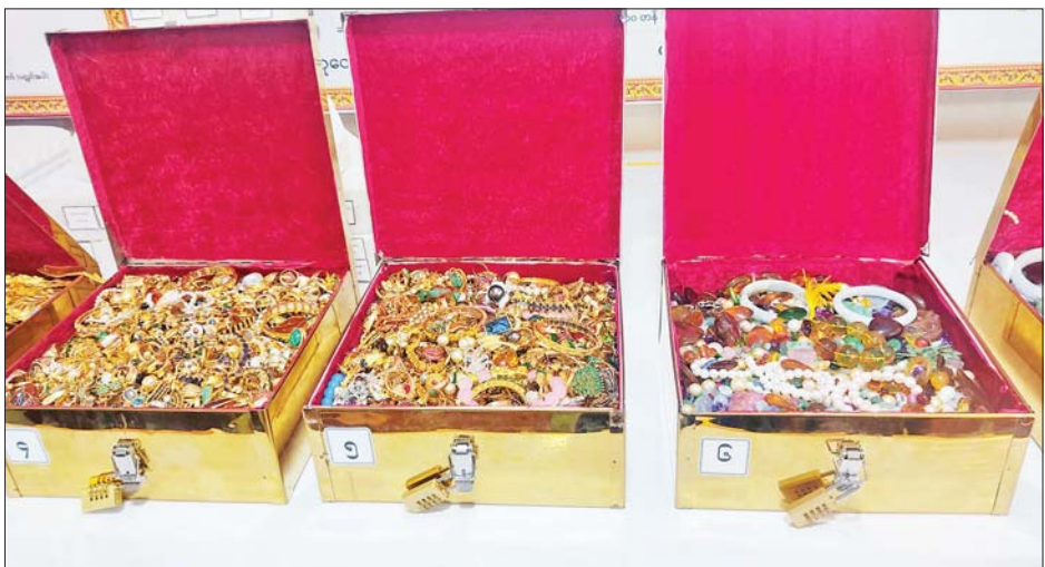
ခုနစ်ရက်သားသမီး ဘုရားဒါယကာ ဒါယိကာမများ၊ စေတနာရှင် အလှူရှင်များ စုပေါင်းလှူဒါန်းထားသည့် အဖိုးတန်ရတနာရွှေငွေ ကျောက်သံပတ္တမြားများ၊ နိုင်ငံတော်မှ ငွေဒင်္ဂါးပြားများ အပါအဝင် ဌာပနာတော်ပစ္စည်းများ ထည့်သွင်းထားသည့် ရွှေသေတ္တာတော်များကို တွေ့ရစဉ်။