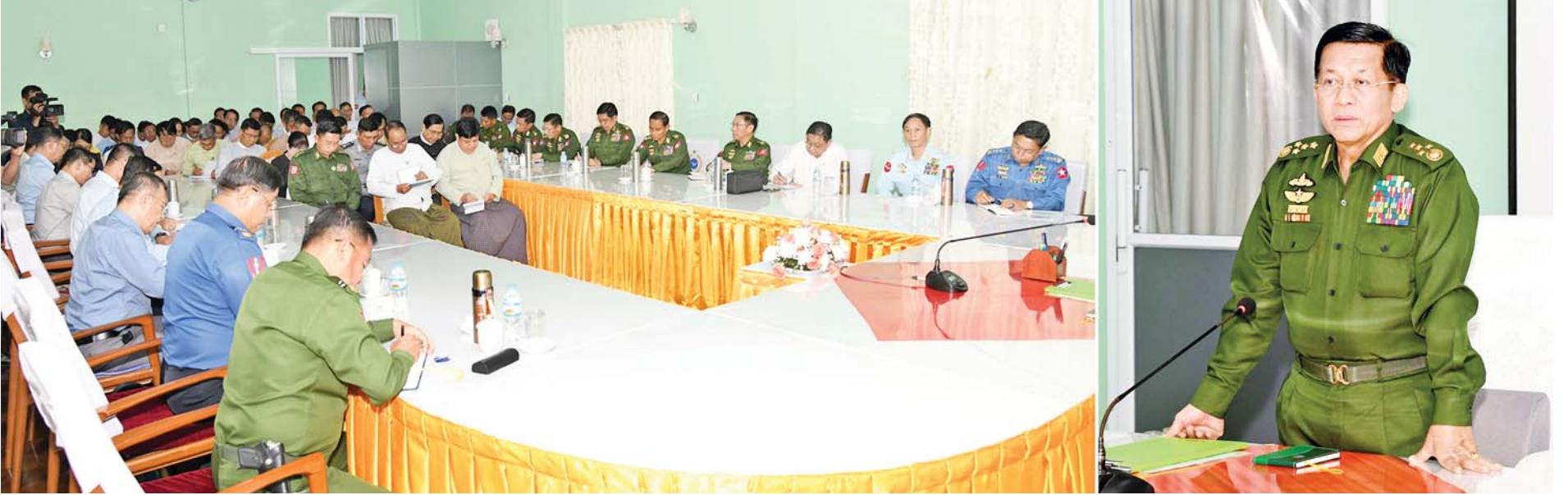
နိုင်ငံတော်စီမံအုပ်ချုပ်ရေးကောင်စီဥက္ကဋ္ဌ နိုင်ငံတော်ဝန်ကြီးချုပ် ဗိုလ်ချုပ်မှူးကြီးမင်းအောင်လှိုင် ဧရာဝတီတိုင်းဒေသကြီးအစိုးရအဖွဲ့ ဌာနဆိုင်ရာတာဝန်ရှိသူများအား တွေ့ဆုံအမှာစကားပြောကြားစဉ်။