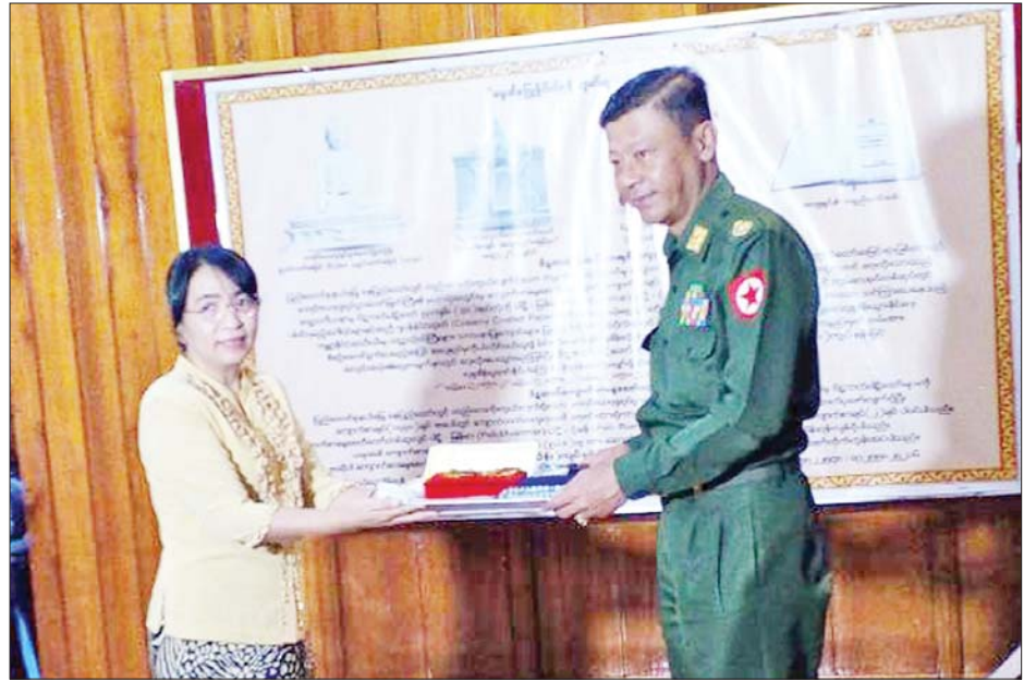
မာရဝိဇယဗုဒ္ဓရုပ်ပွားတော်မြတ်ကြီး ရတနာပလ္လင်တော်ထက် အလယ်ဗဟိုဌာနများတွင် ဌာပနာတော် ထပ်မံထည့်သွင်း သွင်းလှူပူဇော်နိုင်ရေး စေတနာရှင်၊ အလှူရှင်များ လာရောက်လှူဒါန်းစဉ်။