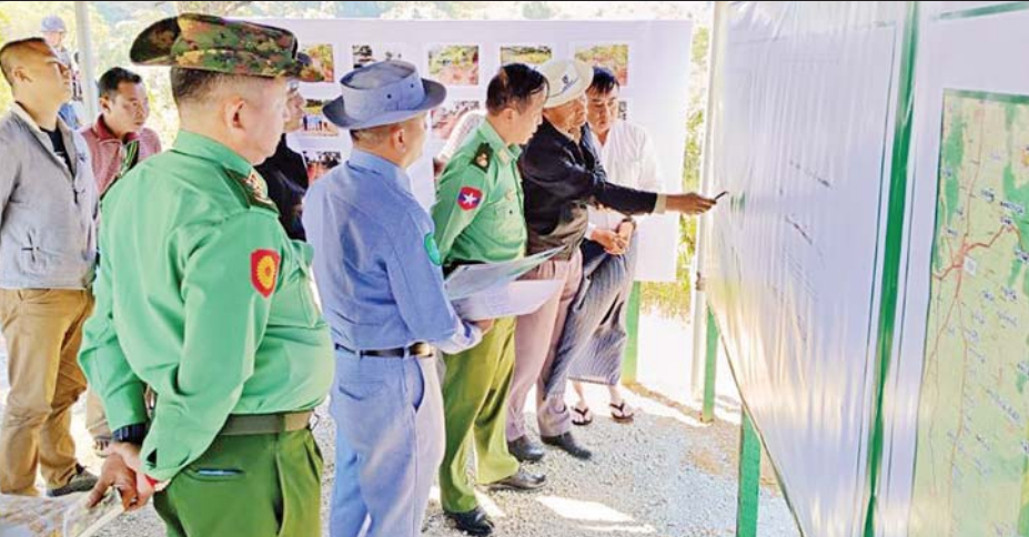
ဒုတိယဝန်ကြီး ဗိုလ်ချုပ်ခွန်သန့်ဇော်ထူး ဟိုပုံးမြို့ မဲနယ်တောင်ဒေသအတွင်းရှိ ဒေသဖွံ့ဖြိုးရေး လုပ်ငန်းများ ကြည့်ရှုစစ်ဆေးစဉ်။

နေပြည်တော် ဖေဖော်ဝါရီ ၈ နယ်စပ်ရေးရာဝန်ကြီးဌာန ဒုတိယဝန်ကြီး ဗိုလ်ချုပ်ခွန်သန့်ဇော်ထူးသည် ယနေ့နံနက်ပိုင်းတွင် ပညာရေးနှင့်လေ့ကျင့်ရေးဦးစီးဌာန ရှမ်းပြည်နယ် ဦးစီးမှူးရုံး ဝန်ထမ်းများအား အဆိုပါရုံး၌ တွေ့ဆုံ၍ လိုအပ်သည်များကို ပေါင်းစပ်ညှိနှိုင်းဆောင်ရွက်ပေး ပြီး ဝန်ထမ်းများအတွက် ထောက်ပံ့ငွေများပေးအပ် သည်။ ထို့နောက် တောင်ကြီးမြို့ အေးသာယာရှိ နယ်စပ်ဒေသနှင့် တိုင်းရင်းသားလူမျိုးများဖွံ့ဖြိုး တိုးတက်ရေးဦးစီးဌာန ပြည်နယ်ဖွံ့ဖြိုးမှုကြီးကြပ် ရေးရုံး ဝန်ထမ်းများအား သွားရောက်တွေ့ဆုံပြီး ရှမ်းပြည်နယ်(တောင်ပိုင်း)အတွင်း ဖွံ့ဖြိုးရေးလုပ်ငန်း ဆောင်ရွက်နေမှုနှင့်စပ်လျဉ်း၍ လိုအပ်သည်များကို လမ်းညွှန်မှာကြားကာ ဝန်ထမ်းများအတွက် ထောက်ပံ့ငွေများ ပေးအပ်သည်။ ယင်းနောက် ဒုတိယဝန်ကြီးနှင့်အဖွဲ့သည် စွယ်တော်ကျောင်းတိုက်သို့ သွားရောက်၍ ဆွမ်း ဆန်တော်နှင့်အလှူငွေများ ဆက်ကပ်လှူဒါန်းသည်။ ဆက်လက်၍ ဟိုတယ်ဝန်ဆောင်မှုဆိုင်ရာ သင်တန်းတက်ရောက်လျက်ရှိသည့် သင်တန်းသား များနှင့် ဝန်ထမ်းများကို အောင်ပန်းမြို့ နယ်စပ်ဒေသ တိုင်းရင်းသားလူငယ်များ စက်မှုလက်မှုပညာ သင်တန်းကျောင်း၌ တွေ့ဆုံ၍ လိုအပ်သည်များ ပေါင်းစပ်ညှိနှိုင်းဆောင်ရွက်ပေးပြီး ဟိုတယ်သင်တန်း သားများနှင့် ဝန်ထမ်းများအတွက် ထောက်ပံ့ငွေများ ပေးအပ်ကာ သင်တန်းကျောင်းအတွင်း ကြည့်ရှု စစ်ဆေးသည်။ ယင်းနောက် ဒုတိယဝန်ကြီးနှင့်အဖွဲ့သည်