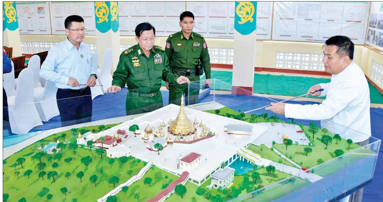
နိုင်ငံတော်စီမံအုပ်ချုပ်ရေးကောင်စီဥက္ကဋ္ဌ နိုင်ငံတော်ဝန်ကြီးချုပ် ဗိုလ်ချုပ်မှူးကြီးမင်းအောင်လှိုင် သမိုင်းဝင် မဟာမက္ခန္ဓာရံသီ ဆံတော် ရှင်မြတ်မော်တင်စွန်းစေတီတော်ကြီး ပုံစံငယ်ပြုလုပ်ထားရှိမှုကို ကြည့်ရှုစဉ်။

ထို့နောက် နိုင်ငံတော်စီမံ အုပ်ချုပ်ရေးကောင်စီ ဥက္ကဋ္ဌ နိုင်ငံတော်ဝန်ကြီးချုပ်က ဆံတော် ရှင်မြတ်မော်တင်စွန်းစေတီတော် ကြီးအတွက် ဘက်စုံအလှူငွေများ ပေးအပ်လှူဒါန်းရာ ဂေါပကအဖွဲ့မှ တာဝန်ရှိသူများက လက်ခံရယူခဲ့ ကြောင်း သိရသည်။ သတင်းစဉ်