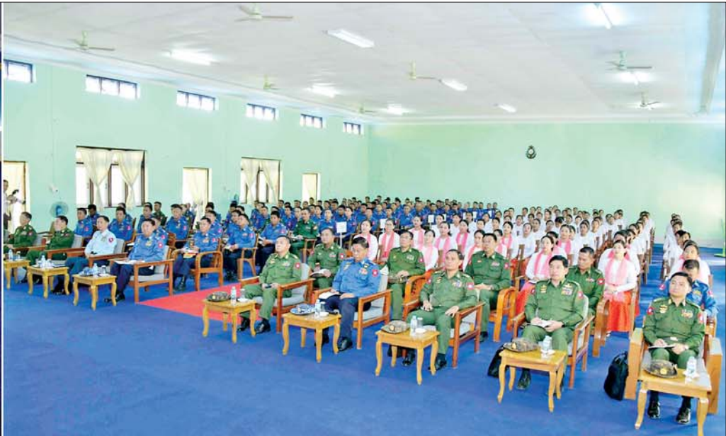
နိုင်ငံတော်စီမံအုပ်ချုပ်ရေးကောင်စီဥက္ကဋ္ဌ တပ်မတော်ကာကွယ်ရေးဦးစီးချုပ် ဗိုလ်ချုပ်မှူးကြီး မင်းအောင်လှိုင် ဟိုင်းကြီးကျွန်းတပ်နယ်မှ အရာရှိ၊ စစ်သည်၊ မိသားစုများအား တွေ့ဆုံအမှာစကားပြောကြားစဉ်။