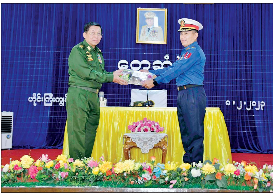
နိုင်ငံတော်စီမံအုပ်ချုပ်ရေးကောင်စီဥက္ကဋ္ဌ တပ်မတော်ကာကွယ်ရေးဦးစီးချုပ် ဗိုလ်ချုပ်မှူးကြီး မင်းအောင်လှိုင် ဟိုင်းကြီးကျွန်းတပ်နယ်မှ အရာရှိ၊ စစ်သည်၊ မိသားစုများအတွက် စားသောက်ဖွယ်ရာ ပစ္စည်းများ ပေးအပ်စဉ်။

အရာရှိ၊ စစ်သည်များအနေဖြင့် မိမိတို့တစ်ဦး ချင်းစီ၏ ကိုယ်ရည်ကိုယ်သွေးများကို မြှင့်တင်နေရ မည်ဖြစ်ပြီး တပ်မတော်မှ တာဝန်ထမ်းဆောင်မှု အလိုက်၊ အဆင့်အလိုက် တက်ရောက်ရမည့်သင်တန်း များ၌လည်း အမြဲမပြတ် ကြိုးပမ်းအားထုတ်ခြင်းဖြင့် မိမိဘဝတိုးတက်ရေးကို ဆောင်ရွက်ရမည်ဖြစ် ကြောင်း၊ အသိပညာဗဟုသုတများ ရရှိစေရေးအတွက် လည်း သက်ဆိုင်သည့် စာပေများကို ဖတ်မှတ်လေ့လာ နေရမည်ဖြစ်ကြောင်း၊ ထို့ပြင် ဘဝတိုးတက်ရေး အတွက် မဖြစ်မနေလိုအပ်သည့် စာပေဖတ်မှတ် ခြင်းများကို လုပ်ဆောင်နေရမည်ဖြစ်ကြောင်း၊ စာဖတ်ခြင်းမှ ရရှိလာသည့် အသိပညာဗဟုသုတနှင့် အတတ်ပညာများသည် မိမိတို့ တစ်ဦးတစ်ယောက် ချင်း၏ ဘဝတိုးတက်ရေးကို များစွာအထောက်အကူ ဖြစ်စေမည်ဖြစ်ကြောင်း၊ မိမိတို့ သိရှိထားသည့် အသိပညာဗဟုသုတများကိုလည်း အချင်းချင်း ပြန်လည်မျှဝေပေးခြင်းဖြင့် တပ်တွင်း စည်းလုံးညီညွတ်