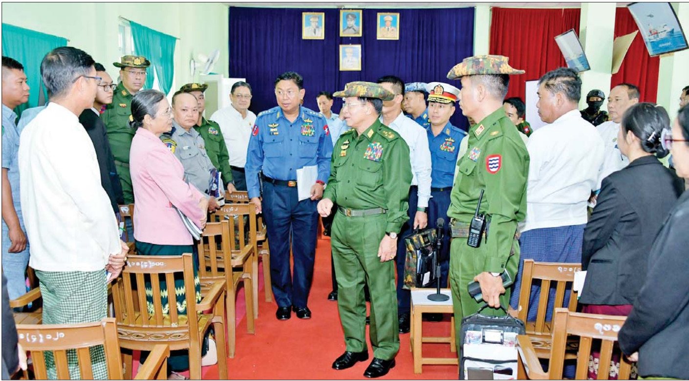
နိုင်ငံတော်စီမံအုပ်ချုပ်ရေးကောင်စီဥက္ကဋ္ဌ ရင်းရင်းနှီးနှီးနှုတ်ဆက်စဉ်။ နိုင်ငံတော်ဝန်ကြီးချုပ် ဗိုလ်ချုပ်မှူးကြီးမင်းအောင်လှိုင် တွေ့ဆုံပွဲသို့ တက်ရောက်လာကြသူများအား

ရှေ့ဖုံးမှ ဦးစွာ နိုင်ငံတော်စီမံအုပ်ချုပ်ရေးကောင်စီ ဥက္ကဋ္ဌ နိုင်ငံတော်ဝန်ကြီးချုပ်က အမှာစကား ပြောကြားရာတွင် ဟိုင်းကြီးကျွန်းဒေသသည် သမိုင်းကြောင်းအတိုင်းအလာရှိသည့် ဒေသတစ်ခုဖြစ်ပြီး ဖွံ့ဖြိုးတိုးတက်ရေးအတွက် အလားအလာကောင်းများစွာကို ပိုင်ဆိုင်ထားသည့် ဒေသတစ်ခုလည်း ဖြစ်ကြောင်း၊ ပုသိမ်ဆိပ်ကမ်းတွင် ယခင်က ပင်လယ်ကူးသင်္ဘောကြီးများ ဝင်ထွက်သွားလာခဲ့ကြပြီး နောက်ပိုင်းတွင် အကြောင်းအမျိုးမျိုးကြောင့် ရေကြောင်းတိမ်ကောသွားခဲ့ပြီး ဝင်ထွက်မှု မရှိခဲ့ခြင်းဖြစ်ကြောင်း၊ မိမိအနေဖြင့် ဟိုင်းကြီးကျွန်းဒေသ ဖွံ့ဖြိုးတိုးတက်ရေးနှင့် သွားလာမှုအဆင်ပြေစေရေးအတွက် များစွာဆောင်ရွက်ပေးခဲ့ကြောင်း၊ ကျန်းမာရေးဆိုင်ရာ အဆောက်အအုံများကို ဆောင်ရွက်ပေးခဲ့ပြီး ပညာရေးပိုင်းဆိုင်ရာများကိုလည်း ဆောင်ရွက်