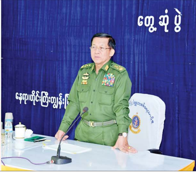
နိုင်ငံတော်စီမံအုပ်ချုပ်ရေးကောင်စီဥက္ကဋ္ဌ နိုင်ငံတော်ဝန်ကြီးချုပ် ဗိုလ်ချုပ်မှူးကြီးမင်းအောင်လှိုင် ဧရာဝတီတိုင်းဒေသကြီး ဟိုင်းကြီးကျွန်းမြို့နှင့် ငပုတောမြို့နယ်တို့ရှိ ခရိုင်၊ မြို့နယ်အဆင့် ဌာနဆိုင်ရာတာဝန်ရှိသူများ၊ မြို့မိ မြို့ဖများအား တွေ့ဆုံ၍ ဒေသဖွံ့ဖြိုးတိုးတက်ရေးဆိုင်ရာများကို ဆွေးနွေးပြောကြားစဉ်။

နေပြည်တော် ဖေဖော်ဝါရီ ၈ နိုင်ငံတော်စီမံအုပ်ချုပ်ရေးကောင်စီဥက္ကဋ္ဌ နိုင်ငံတော်ဝန်ကြီးချုပ် ဗိုလ်ချုပ်မှူးကြီးမင်းအောင်လှိုင်သည် ယနေ့မွန်းလွဲပိုင်းတွင် ဧရာဝတီတိုင်းဒေသကြီး ဟိုင်းကြီးကျွန်းမြို့နှင့် ငပုတောမြို့နယ်တို့ရှိ ခရိုင်၊ မြို့နယ်အဆင့် ဌာနဆိုင်ရာတာဝန်ရှိသူများ၊ မြို့မိ မြို့ဖများအား ဟိုင်းကြီးကျွန်းရှိ နယ်မြေခံရေတပ်စခန်းဌာနချုပ်၌ တွေ့ဆုံ၍ ဒေသ