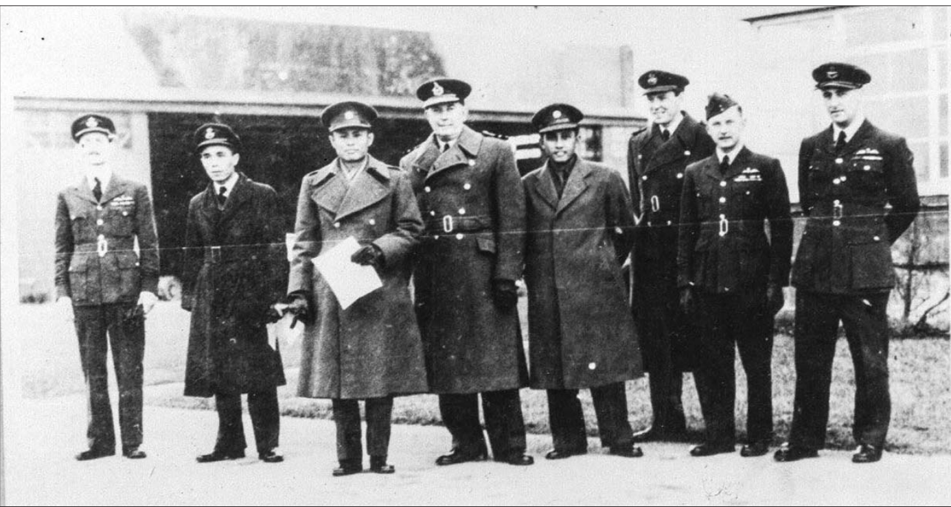
၁၉၄၆ ခုနှစ်က ဗိုလ်ချုပ်အောင်ဆန်း လွတ်လပ်ရေးအတွက် အရေးဆိုရန် လန်ဒန်ရောက်ရှိချိန် ဗြိတိသျှစစ်အရာရှိများနှင့်အတူ တွေ့ရစဉ်။

“စက္ကူဖြူ စီမံကိန်း” (သို့) “ဆင်းမလားစီမံကိန်း” ၁၉၄၅ ခုနှစ် ဧပြီလတွင် မြန်မာနိုင်ငံသို့ ပြန်လာ သည့် ဘုရင်ခံဒေါ်မန်စစ်နှင့်အတူ စစ်ပြီးခေတ် မြန်မာနိုင်ငံကို အုပ်ချုပ်ရန် စစ်ရှောင်ဆင်းမလား မြို့၌ ရေးဆွဲခဲ့သည့် “စက္ကူဖြူ စီမံကိန်း” (သို့) “ဆင်းမလားစီမံကိန်း” ကို ယူဆောင်လာပါသည်။ ထိုစီမံကိန်းတွင် “မြန်မာနိုင်ငံထူထောင်ရေးကာလ” ကို ငါးနှစ် (သို့) ခုနစ်နှစ် သတ်မှတ်ထားသည်။ ထိုကာလကုန်ဆုံးမှ လွတ်လပ်သော ပါလီမန် ဖွဲ့စည်းခွင့်ပေးရန်၊ တစ်နည်းအားဖြင့် ငါးနှစ် သို့မဟုတ် ခုနစ်နှစ်အတွင်း လွတ်လပ်ရေးမပေးရန် အဆိုပြုခဲ့သည်။