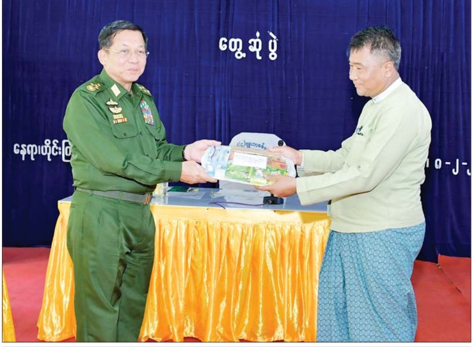
နိုင်ငံတော်စီမံအုပ်ချုပ်ရေးကောင်စီဥက္ကဋ္ဌ နိုင်ငံတော်ဝန်ကြီးချုပ် ဗိုလ်ချုပ်မှူးကြီးမင်းအောင်လှိုင် ဟိုင်းကြီးကျွန်းမြို့နှင့် ငပုတောမြို့နယ်တို့ရှိ ခရိုင်၊ မြို့နယ်အဆင့် ဌာနဆိုင်ရာတာဝန်ရှိသူများ၊ မြို့မမြို့ဖများအတွက် စားသောက်ဖွယ်ရာပစ္စည်းများ ပေးအပ်စဉ်။

ဧရာဝတီတိုင်းဒေသကြီးသည် ရေခဲမြေခဲများကောင်းမွန်ပြီး ငါးမွေးမြူရေးလုပ်ငန်းများ အပါအဝင် စိုက်ပျိုးမွေးမြူရေးလုပ်ငန်းများကို အောင်မြင်ဖြစ်ထွန်းအောင် ဆောင်ရွက်နိုင်သည်ကို တွေ့ရှိရကြောင်း၊ MSME လုပ်ငန်းများကိုလည်း ခရိုင်အားလုံး၌ အောင်မြင်စွာ ဆောင်ရွက်လျက်ရှိသည်ကို တွေ့ရှိရ