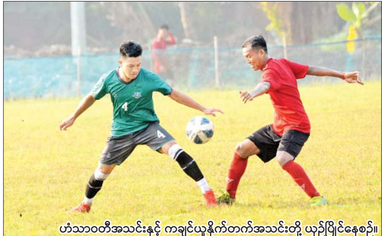
ဟံသာဝတီအသင်းနှင့် ကချင်ယူနိုက်တက်အသင်းတို့ ယှဉ်ပြိုင်နေစဉ်။

အဲဒီပွဲမှာ အဲဗာတန်အသင်းအတွက် တစ်လုံးတည်းသော အမှတ်မှာ ၂၃ ကော်လံ ၁ သို့ ❖