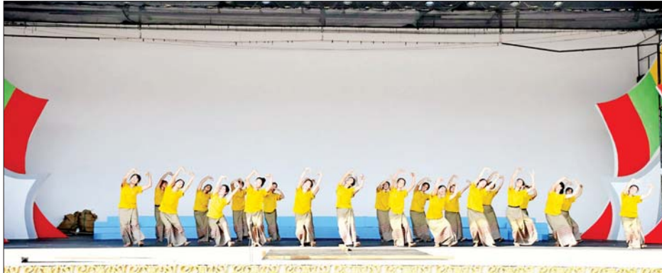
ခန်းမ လေဟာပြင်ကဇာတ်ရုံတွင် အကလေ့ကျင့်ကြသည်။

နေပြည်တော် ဖေဖော်ဝါရီ ၄ (၇၆)နှစ်မြောက် ပြည်ထောင်စု နေ့ ဂုဏ်ပြုညစာစားပွဲ အခမ်း အနားတွင် ကပြဖျော်ဖြေကြမည့် သာသနာရေးနှင့် ယဉ်ကျေးမှု ဝန်ကြီးဌာန အနုပညာဦးစီးဌာနမှ အနုပညာရှင် ဝန်ထမ်းများ၊ မန္တလေးတိုင်းဒေသကြီးနှင့် ပြည် နယ်များမှ တိုင်းရင်းသားရိုးရာ ယဉ်ကျေးမှုအဖွဲ့ဝင်များသည် ယနေ့မွန်းလွဲပိုင်းက ပြည်ထောင်စု နယ်မြေ နေပြည်တော် မြို့တော်