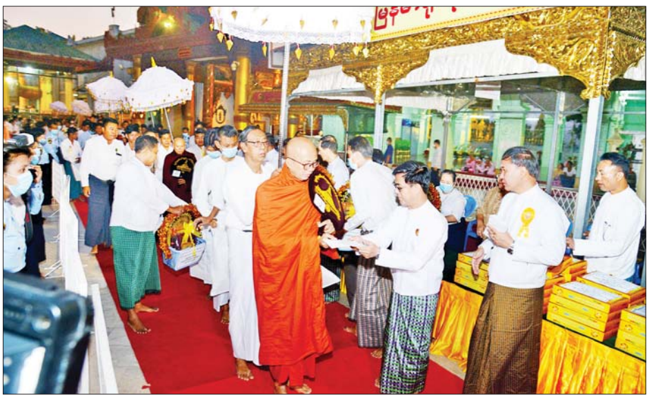
ဝတ္ထုပစ္စည်းများ လောင်းလှူကြသည်။ ယင်းနောက် (၁၅)ကြိမ်မြောက် မြန်မာ့ရိုးရာ ထမနဲလှူဒါန်းပွဲ ရေစက်ချအနုမောဒနာအခမ်းအနား

ထို့နောက် စေတီတော်ရင်ပြင်တောင်ဘက်ဗဟို မဏ္ဍပ်စုရပ်မှ စတင်၍ ထမနဲဆွမ်းလောင်းလှူပွဲ အခမ်းအနားကျင်းပရာ ဂေါပကအဖွဲ့ဝင်များ၊ အလှူရှင်များ၊ ဘာသာရေးဝတ်အသင်းအဖွဲ့များနှင့် ရွှေတိဂုံ စေတီတော်သို့ ဘုရားဖူးလာပြည်သူများက ဘုရား အမှူးပြုသော ရွှေတိဂုံစေတီတော် ဘဏ္ဍာတော်ထိန်း ဂေါပကအဖွဲ့ ဩဝါဒါစရိယဆရာတော်ကြီးများ၊ ပင့်သံဃာတော် ၆၂ ပါးတို့ကို ထမနဲဆွမ်းနှင့် လှူဖွယ်