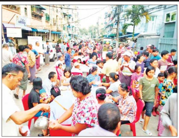
ရန်ကုန်တိုင်းဒေသကြီး မရမ်းကုန်းမြို့နယ် အမှတ် (၁) ရပ်ကွက် မြို့ဟောင်း(၄)လမ်းမိသားစုများ စုပေါင်း၍ စတုဒိသာ ထမနဲ၊ ငါးခြောက်၊ ဘူးသီးကြော်နှင့် လက်ဖက်ရည်တို့ဖြင့် စည်ကားသိုက်မြိုက် စွာ ဧည့်ခံကျွေးမွေးနေသည်ကို ဖေဖော်ဝါရီ ၄ ရက် (တပို့တွဲလပြည့်နေ့) နံနက်ပိုင်းက တွေ့ရစဉ်။