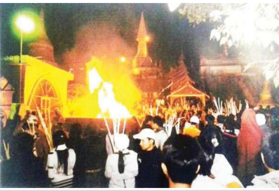
ပြည်မြို့ရှိ ရွှေဆံတော်စေတီမြတ်ကြီး၌ ညံ့ရိုးမီးပူဇော်ပွဲကျင်းပနေသည်ကို တွေ့ရစဉ်။

ထမနဲပွဲကို အစောဆုံးတွေ့ရသောခေတ်ကား ညောင်ရမ်း၊ ဒုတိယအင်းဝခေတ်နောက်ပိုင်း ဖြစ်သည်။ ဒုတိယအင်းဝခေတ် တနင်္ဂနွေမင်း လက်ထက်၌ ထင်ရှားသည့် စာဆိုတော်တစ်ဦး ဖြစ်သော ဆီသည်ရွာစား ဦးအောင်ကြီး၏ တပို့တွဲ လတွဲ လူးတားတွင် 'ရပ်ရှစ်မျက်နှာ၊ သံဃာတို့