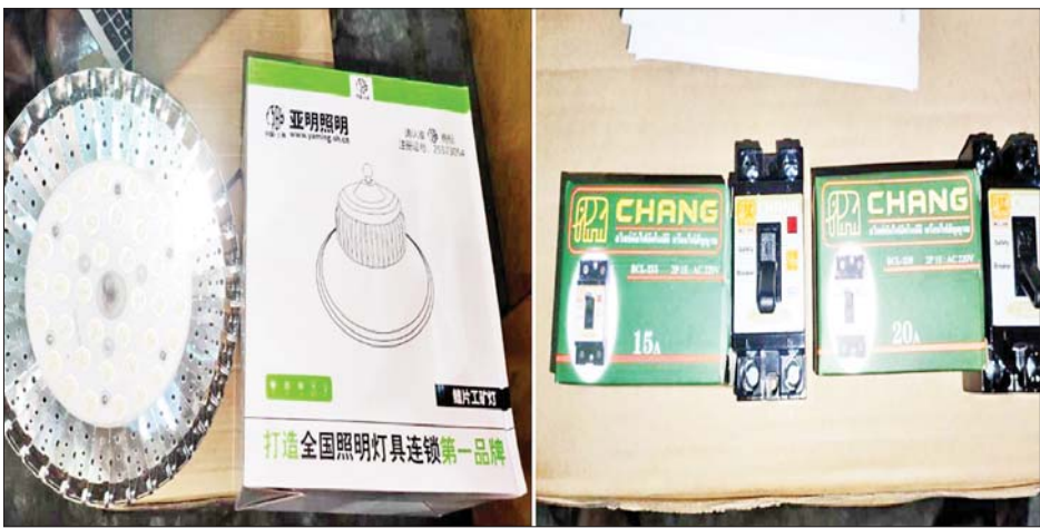
မြန်မာစက်မှုဆိပ်ကမ်းကုန်သေတ္တာစစ်ဆေးရေးစခန်း၌ ဖမ်းဆီးရမိမှု။

နေပြည်တော် ဖေဖော်ဝါရီ ၄ တရားမဝင် ကုန်သွယ်မှုတိုက် ဖျက်ရေး ဦးဆောင်ကော်မတီ၏ ကြီးကြပ်ကွပ်ကဲမှုဖြင့် တရားမဝင် ကုန်သွယ်မှုများကို ဥပဒေနှင့်အညီ ထိရောက်စွာ တားဆီးအရေးယူ နိုင်ရေး ဆောင်ရွက်လျက်ရှိရာ အကောက်ခွန်ဦးစီးဌာန၏ စီမံခန့်ခွဲမှုဖြင့် တာဝန်ကျအကောက်ခွန်အဖွဲ့များက စစ်ဆေးမှုများ ဆောင်ရွက်ခဲ့ရာ ဖေဖော်ဝါရီ ၁ ရက်တွင် အေးရှားဝေါလ်ကုန်သေတ္တာ စစ်ဆေးရေးစခန်း၌ ကုန်သေတ္တာတစ်လုံး အတွင်းမှ သွင်းကုန်ကြေညာလွှာ(ID)တွင် ကြေညာထားသည်နှင့်ကိုက်ညီမှု မရှိသော Aqua အမျိုးအစား Engine Oil ၃၈၄၄ လီတာ အပါအဝင် ကုန်ပစ္စည်းသုံးမျိုး (ခန့်မှန်းတန်ဖိုး ငွေကျပ် ၈၄၀၄၂၀၀) ကိုလည်းကောင်း၊ ဖေဖော်ဝါရီ ၂ ရက်တွင် မြန်မာစက်မှုဆိပ်ကမ်း ကုန်သေတ္တာ စစ်ဆေးရေးစခန်း၌ ကုန်သေတ္တာ တစ်လုံးအတွင်းမှ သွင်းကုန် ကြေညာလွှာ(ID)တွင် ကြေညာထားခြင်းမရှိသော 200 W လျှပ်စစ်မီးသီး အလုံး ၆၀ အပါအဝင် ကုန်ပစ္စည်းသုံးမျိုး (ခန့်မှန်းတန်ဖိုးငွေကျပ် ၃၅၀၇၀၀၀) ကိုလည်းကောင်း၊ ရန်ကုန်အပြည်ပြည်ဆိုင်ရာလေဆိပ်၊ လေဆိပ်(သွင်းကုန်)၌ သွင်းကုန်လိုင်စင် တင်ပြနိုင်ခြင်းမရှိသော SEAL KIT ငါးစုံအပါအဝင် ကုန်ပစ္စည်းလေးမျိုး (ခန့်မှန်းတန်ဖိုးငွေကျပ် ၈၆၉၃၆၉၆) ကိုလည်းကောင်း၊