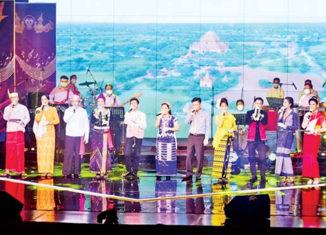
ပြည်ထောင်စုဝန်ကြီး ဦးမောင်မောင်အုန်း (၇၆) နှစ်မြောက် ပြည်ထောင်စုနေ့ကို ကြိုဆိုဂုဏ်ပြုသောအားဖြင့် ရိုက်ကူးထုတ်လွှင့်နေသည့် “ညီညွတ်ရေးသံစဉ်” တေးဂီတဖျော်ဖြေပွဲ ပွဲစဉ်(၂)၏ တိုက်ရိုက် (Live) ရိုက်ကူးထုတ်လွှင့်နေမှုကို ကြည့်ရှုအားပေးစဉ်။

ခြင်းသင်တန်းကိုလည်း ဝန်ထမ်းများအား အခြေခံ ပိုင်းအနေဖြင့် ပို့ချထားပါကြောင်း။ ယခု အခြေအနေအရ ဖလင်များကို ဆေးကြော သန့်စင်ခြင်း၊ Scan ဖတ်ခြင်း၊ အစွန်းအထင်းများ သန့်စင်ခြင်း၊ Digital Format တစ်ခုခုဖြင့် ထိန်းသိမ်း ခြင်း စသည့်လုပ်ငန်းများ ဆောင်ရွက်နိုင်ပြီဖြစ်ပါ