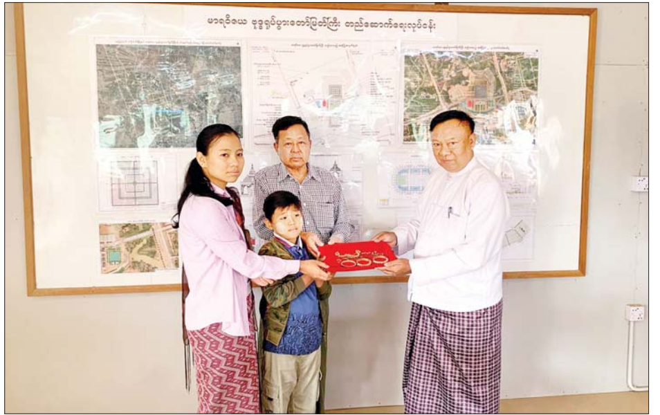
မာရဝိဇယဗုဒ္ဓရုပ်ပွားတော်မြတ်ကြီး ရတနာပလ္လင်တော်ထက် အလယ်ဗဟိုဌာနများတွင် ဌာပနာတော် ထပ်မံထည့်သွင်း သွင်းလှူပူဇော်နိုင်ရေး စေတနာရှင်၊ အလှူရှင်များ လာရောက်လှူဒါန်းစဉ်။

နေပြည်တော် ဖေဖော်ဝါရီ ၄ နိုင်ငံတော် စီမံအုပ်ချုပ်ရေး ကောင်စီဥက္ကဋ္ဌ နိုင်ငံတော် ဝန်ကြီးချုပ် ဗိုလ်ချုပ်မှူးကြီး မင်းအောင်လှိုင် ဦးဆောင်သည့် (၇) ရက် သား၊ သမီး၊ ဘုရား ဒါယကာ၊ ဒါယိကာမတို့က မာရဝိဇယ ဗုဒ္ဓရုပ်ပွားတော်မြတ် ကြီးအား မြန်မာနိုင်ငံတွင် ထေရဝါဒ ဗုဒ္ဓသာသနာတော် ထွန်းလင်းတောက်ပလျက်ရှိသည် ကို ကမ္ဘာကိုပြသရန်၊ တိုင်းပြည် အေးချမ်း သာယာမှုရှိစေ ရန်၊ ရုပ်ပွားတော်မြတ်ကြီးအား ပြည်တွင်း၊ ပြည်ပ ဘုရားဖူးများ လာရောက်ခြင်းဖြင့် ဒေသ တိုးတက်စည်ကားမှုကို အထောက် အကူဖြစ်စေရန်၊ နိုင်ငံတော် ဖွံ့ဖြိုးတိုးတက်မှုအား အထောက် အကူဖြစ်စေရန် ရည်သန်လျက် ပြည်ထောင်စုနယ်မြေ နေပြည်တော် ဒက္ခိဏသီရိမြို့နယ် အတွင်း၌ သာသနာတော်ထုံး၊ ရုပ်ပွား ဆင်းတုတော်ထုံး၊ မြန်မာ့ရိုးရာ တည်ထုံးများ၊ ဌာပနာပုံကျမ်း၊ ဗိသုကာကျမ်း၊ မဟာဗုဒ္ဓဝင်ကျမ်း အစရှိသော စာပေကျမ်းဂန်များ နှင့်အညီ တည်ဆောက်ပူဇော် လျက်ရှိသည်။