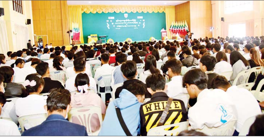
ပထမဆုရရှိသူများကို ပြည်နယ်ဝန်ကြီးချုပ် ဒေါက်တာကျော်ထွန်းက လည်းကောင်း၊ တတိယနှစ်၊ စတုတ္ထနှစ် မြို့ပြအင်ဂျင်နီယာသင်တန်းတွင် ပထမဆု

တောင်ကြီး ဇန်နဝါရီ ၃၁ နည်းပညာတက္ကသိုလ်(တောင်ကြီး) ၂၀၂၂-၂၀၂၃ ပညာသင်နှစ် မောင်မယ်သစ်လွင်ကြိုဆိုပွဲနှင့် ရှမ်းပြည်နယ်နေ့အကြို Project ပြပွဲကို ယမန်နေ့ နံနက် ၉ နာရီက အေးသာယာမြို့ နည်းပညာတက္ကသိုလ် (တောင်ကြီး)၌ ကျင်းပသည်။ ကြိုဆိုနှုတ်ခွန်းဆက် အခမ်းအနားတွင် နည်းပညာတက္ကသိုလ် (တောင်ကြီး) ကျောင်းသား ကျောင်းသူနှင့် ဆရာ ဆရာမများက “မြကွန်းညိုညို” တေးသီချင်းဖြင့် ကြိုဆိုနှုတ်ခွန်းဆက် သီဆိုဖျော်ဖြေကြသည်။ ဆက်လက်၍ ရှမ်းပြည်နယ်ဝန်ကြီးချုပ် ဒေါက်တာ ကျော်ထွန်းက အမှာစကားပြောကြားသည်။ ထို့နောက် သင်တန်းနှစ်အလိုက် ထူးချွန် ကျောင်းသား ကျောင်းသူများအား ဆုချီးမြှင့်ရာ ပထမနှစ် ဒုတိယမြို့ပြအင်ဂျင်နီယာသင်တန်းတွင်