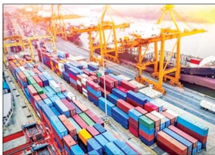
စာမျက်နှာ » ၁၃

ပီယက်နမ်နိုင်ငံ၏ ကုန်သွယ်မှုတန်ဖိုး ယခုနှစ် ဇန်နဝါရီလ အတွင်း ၂၅ ရာခိုင်နှုန်း ကျဆင်း