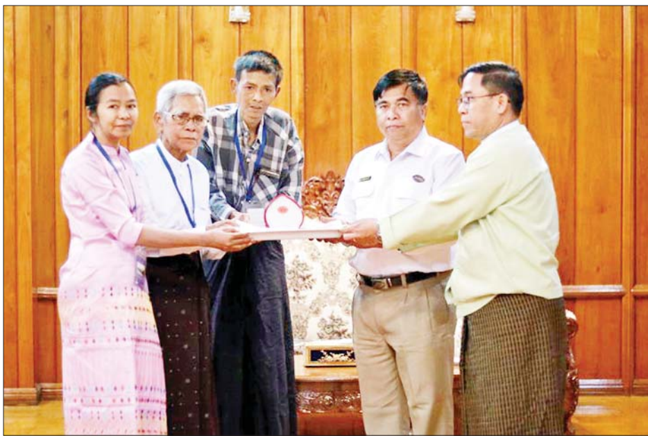
မာရဝိဇယဗုဒ္ဓရုပ်ပွားတော်မြတ်ကြီး ရတနာပလ္လင်တော်ထက် အလယ်ဗဟိုဌာနများတွင် ဌာပနာတော် ထပ်မံထည့်သွင်း သွင်းလှူပူဇော်နိုင်ရေး စေတနာရှင် အလှူရှင်များက လာရောက်လှူဒါန်းစဉ်။