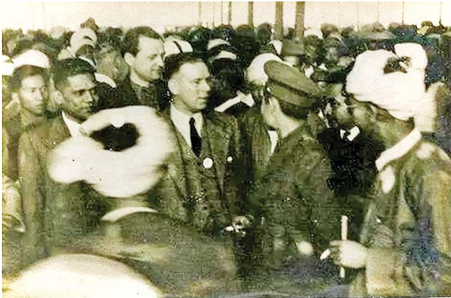
ပင်လုံညီလာခံသို့ တက်ရောက်လာကြသည့် ဗိုလ်ချုပ်အောင်ဆန်းနှင့် ကိုယ်စားလှယ်များကို တွေ့ရစဉ်။

“ငြိမ်းချမ်း” ကို ဆူပူလှုပ်ရှားထကြွခြင်း၊ နှောင့်ယှက်ခြင်း ကင်းသည်ဟုလည်းကောင်း၊ “ငြိမ်းချမ်းရေး”ကို ဆူပူလှုပ်ရှားထကြွခြင်း၊ စစ်မက် စသည်တို့ ကင်းမဲ့သောအဖြစ်ဟုလည်းကောင်း မြန်မာအဘိဓာန်က ဖွင့်ဆိုသည်။ စင်စစ် ရန်လိုမှုနှင့် အကြမ်းဖက်မှုကင်းစင်လျက် လူမှုအသိုက်အဝန်း၌