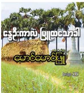
စာမျက်နှာ » ၁၈