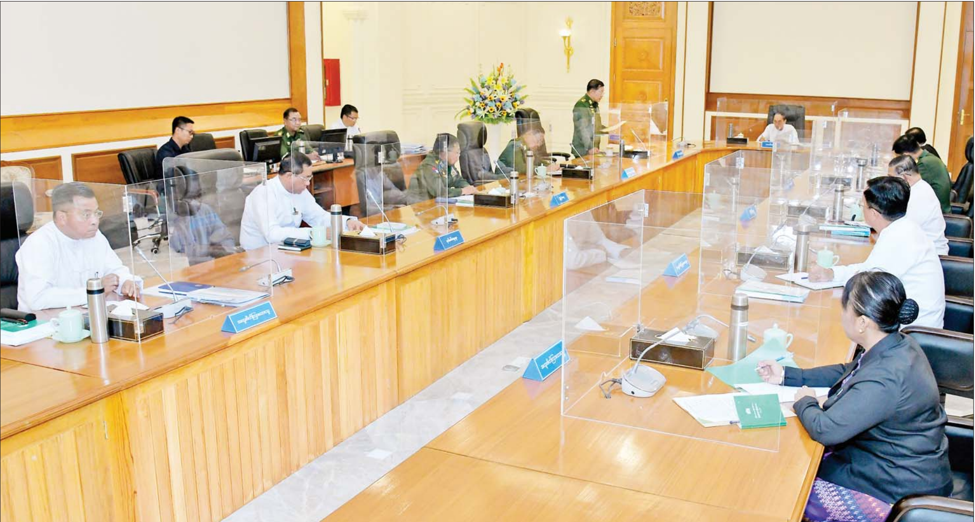
ပြည်ထောင်စုသမ္မတမြန်မာနိုင်ငံတော် အမျိုးသားကာကွယ်ရေးနှင့် လုံခြုံရေးကောင်စီအစည်းအဝေး(၁/၂၀၂၃) ကျင်းပစဉ်။

နေပြည်တော် ဇန်နဝါရီ ၃၁ ပြည်ထောင်စုသမ္မတမြန်မာနိုင်ငံတော် အမျိုးသားကာကွယ်ရေး နှင့် လုံခြုံရေးကောင်စီအစည်းအဝေး(၁/၂၀၂၃)ကို ယနေ့နံနက်ပိုင်းတွင် နေပြည်တော်ရှိ နိုင်ငံတော်စီမံအုပ်ချုပ်ရေးကောင်စီဥက္ကဋ္ဌရုံး အစည်း အဝေးခန်းမ၌ ကျင်းပသည်။ အစည်းအဝေးသို့ ယာယီသမ္မတ ဦးမြင့်ဆွေ၊ ပြည်သူ့လွှတ်တော် ဥက္ကဋ္ဌ ဦးတီခွန်မြတ်၊ တပ်မတော်ကာကွယ်ရေးဦးစီးချုပ် ဗိုလ်ချုပ်မှူးကြီး မင်းအောင်လှိုင်၊ ဒုတိယတပ်မတော်ကာကွယ်ရေးဦးစီးချုပ် ကာကွယ်ရေး ဦးစီးချုပ်(ကြည်း) ဒုတိယဗိုလ်ချုပ်မှူးကြီး စိုးဝင်း၊ ကာကွယ်ရေးဝန်ကြီး ဌာန ပြည်ထောင်စုဝန်ကြီး ဗိုလ်ချုပ်ကြီးမြထွန်းဦး၊ ပြည်ထဲရေးဝန်ကြီး ဌာန ပြည်ထောင်စုဝန်ကြီး ဒုတိယဗိုလ်ချုပ်ကြီးစိုးထွဋ်၊ နိုင်ငံခြားရေး ဝန်ကြီးဌာန ပြည်ထောင်စုဝန်ကြီး ဦးဝဏ္ဏမောင်လွင်၊ နယ်စပ်ရေးရာ ဝန်ကြီးဌာန ပြည်ထောင်စုဝန်ကြီး ဒုတိယဗိုလ်ချုပ်ကြီး ထွန်းထွန်းနောင်၊ အထူးဖိတ်ကြားထားသည့် နိုင်ငံတော်စီမံအုပ်ချုပ်ရေးကောင်စီ အတွင်းရေးမှူး ဒုတိယဗိုလ်ချုပ်ကြီးအောင်လင်းခွေး၊ တွဲဖက်အတွင်း ရေးမှူး ဒုတိယဗိုလ်ချုပ်ကြီး ရဲဝင်းဦး၊ ဥပဒေရေးရာဝန်ကြီးဌာန ပြည်ထောင်စုဝန်ကြီး ပြည်ထောင်စုရှေ့နေချုပ် ဒေါက်တာသီတာဦးတို့ တက်ရောက်ကြပြီး ဒုတိယသမ္မတ ဦးဟင်နရီဗန်ထီးယူအနေဖြင့် ကျန်းမာရေးအခြေအနေအရ အစည်းအဝေးမတက်ရောက်နိုင်ကြောင်း ခွင့်ပန်ကြားခဲ့သည်။