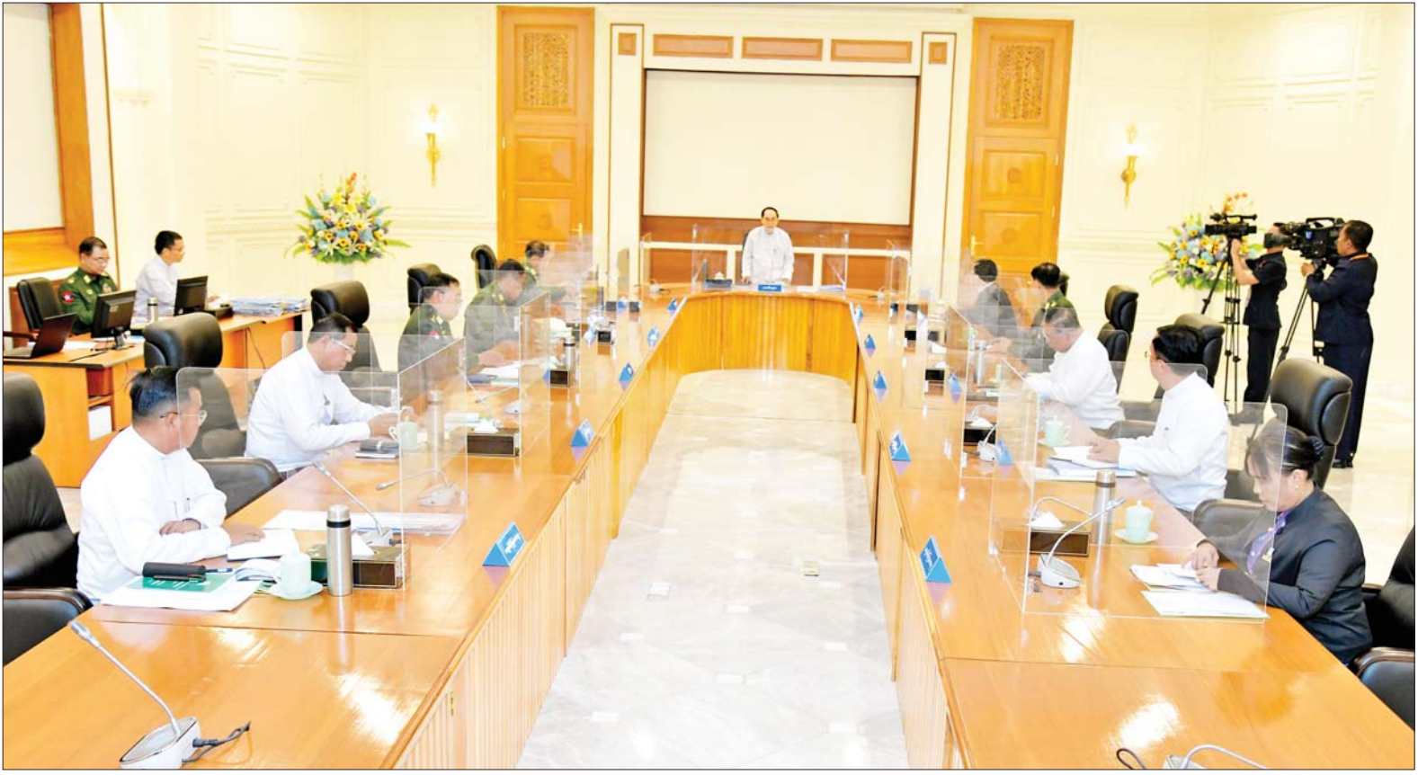
ပြည်ထောင်စုသမ္မတမြန်မာနိုင်ငံတော် အမျိုးသားကာကွယ်ရေးနှင့် လုံခြုံရေးကောင်စီအစည်းအဝေး(၁/၂၀၂၃) ကျင်းပစဉ်။

★ ရှေ့ဖို့မှ ဦးစွာ နိုင်ငံတော်စီမံအုပ်ချုပ်ရေး ကောင်စီဥက္ကဋ္ဌ တပ်မတော် ကာကွယ်ရေးဦးစီးချုပ်က ၂၀၂၀ ပြည့်နှစ်ပါတီစုံဒီမိုကရေစီအထွေထွေရွေးကောက်ပွဲတွင် ဖြစ်ပွားခဲ့သည့် မဲမသမာမှုများနှင့် အဆိုပါ မဲမသမာမှုများကို တာဝန်ရှိသူများက ဖြေရှင်းပေးခဲ့ခြင်းမရှိဘဲ နိုင်ငံတော်အာဏာကို အမွေနည်းဖြင့် ရယူရန် ကြိုးပမ်းဆောင်ရွက်ခဲ့မှုများကြောင့် နိုင်ငံတော်တစ်ဝန်းလုံးကို အရေးပေါ်အခြေအနေကြေညာခဲ့ရသည်အထိ ဖြစ်ပွားခဲ့သည့် အခြေအနေများ၊ နိုင်ငံတော်စီမံအုပ်ချုပ်ရေးကောင်စီ၏ ရှေ့လုပ်ငန်းစဉ် (၅) ရပ် အကောင်အထည်ဖော် ဆောင်ရွက်ခဲ့မှုများနှင့် စပ်လျဉ်းပြီး ပြည်ထောင်စုရွေးကောက်ပွဲကော်မရှင်အသစ် ဖွဲ့စည်း၍ မဲစာရင်းစစ်ဆေးခဲ့မှုနှင့် စစ်ဆေးတွေ့ရှိမှု အခြေအနေများ၊ မဲမသမာမှုတွင် တာဝန်ရှိသူများကို အရေးယူဆောင်ရွက်ခဲ့မှု အခြေအနေများ၊ NLD ပါတီဥက္ကဋ္ဌနှင့် သမ္မတဟောင်းတို့က ပြည်ထောင်စုရွေးကောက်ပွဲကော်မရှင်အပေါ် တိုက်ရိုက်နှင့် သွယ်ဝိုက်ဖိအားပေးဆောင်ရွက်မှု အခြေအနေများ၊ ကိုဗစ်-၁၉ ရောဂါ ကာကွယ်ရေး၊ ကုသရေးနှင့် ကာကွယ်ဆေးထိုးနှံပေးမှုအခြေအနေများ၊ နိုင်ငံ့စီးပွားရေး ဖွံ့ဖြိုးတိုးတက်စေရေးနှင့် ထာဝရ ငြိမ်းချမ်းရေးအတွက် ကြိုးပမ်းဆောင်ရွက်ခဲ့သည့် အခြေအနေများ၊ ပြစ်ဒဏ်လွတ်ငြိမ်းချမ်းသာခွင့်နှင့် လွတ်ငြိမ်းသက်သာ