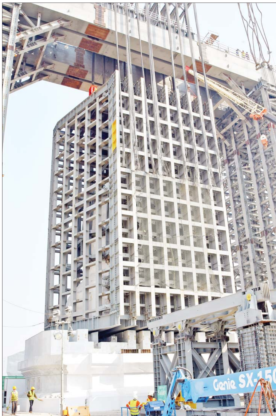
မာရဝိဇယဗုဒ္ဓရုပ်ပွားတော်မြတ်ကြီး၏ ဆင်းတုတော် အပိုင်း(၁/၂/၃)တို့ကို တွဲဆက်ထားသည့် ဆင်းတုတော်အစိတ်အပိုင်းကြီးအား ရတနာပလ္လင်တော်ထက်သို့ အောင်မြင်စွာ ပင့်ဆောင်ပြီးစီးမှုကို ဖူးတွေ့ရစဉ်။

ရှိရာ ဇန်နဝါရီ ၂၆ ရက်တွင် ဆင်းတုတော်ကြီး လဲလျောင်း နေရာ သုည ဒီဂရီမှ ၂၆ ဒီဂရီအထိ အမြင့်အားဖြင့် ၃၁ ပေအထိ လည်းကောင်း၊ ဇန်နဝါရီ ၂၇ ရက်တွင် ၂၆ ဒီဂရီမှ ၅၁ ဒီဂရီအထိ အမြင့်အားဖြင့် ၅၂ ပေအထိလည်းကောင်း၊ ဇန်နဝါရီ ၂၈ ရက်တွင် ၅၁ ဒီဂရီမှ ၆၈ ဒီဂရီအထိ အမြင့်အားဖြင့် ၆၃ ပေအထိ လည်းကောင်း၊ ဇန်နဝါရီ ၂၉ ရက်နံနက် ၉ နာရီတွင် ၉၀ ဒီဂရီအထိ အမြင့်အားဖြင့် ၇၅ ဒေသမ ၅ ပေအထိ ပင့်ဆောင်ပူဇော်ခဲ့ပြီး ဆင်းတုတော် အစိတ်အပိုင်းကြီးအား ပင့်ဆောင်ခြင်းလုပ်ငန်းများ ဆောင်ရွက်ရာတွင် ကြာမြင့်ချိန်အားဖြင့် ၇၂ နာရီ မိနစ် ၅၀ ကြာမြင့်ခဲ့သည်။ ကြာမြင့်ခဲ့ အထက်ပါ ပင့်ဆောင်ပြီးစီးသည့် မာရဝိဇယဗုဒ္ဓရုပ်ပွားတော် မြတ်ကြီး၏ အစိတ်အပိုင်းကြီးအား ရတနာပလ္လင်တော်ထက်သို့ ပင့်ဆောင်ရေး လုပ်ငန်းများကို ဇန်နဝါရီ ၂၉ ရက် ည ၁၁ နာရီ ၁၆ မိနစ်ခန့်တွင် ဆက်လက် ဆောင်ရွက်ခဲ့ရာ ဇန်နဝါရီ ၃၀ ရက် နံနက် ၁၀ နာရီ ၁၇ မိနစ်ခန့်တွင် ရတနာပလ္လင်တော်အနီး နေရာအထိ ပင့်ဆောင်နိုင်ခဲ့ပြီး စုစုပေါင်း ပင့်ဆောင်ခဲ့သည့် အကွာအဝေးမှာ ၈၁ ပေ ဖြစ်ကာ ကြာမြင့်ချိန် ၁၁ နာရီ ၁ မိနစ်ခန့် ကြာမြင့်ခဲ့သည်။ အဆိုပါ ရတနာပလ္လင်တော် အနီးနေရာအထိ ပင့်ဆောင်ထားသည့် မာရဝိဇယ ဗုဒ္ဓရုပ်ပွားတော် မြတ်ကြီး၏ ဆင်းတုတော်အပိုင်း (၁/၂/၃)တို့ကို တွဲဆက်ထားသည့် ဆင်းတုတော် အစိတ်အပိုင်းကြီးအား ယနေ့နံနက် ၁ နာရီ ၃၅ မိနစ်တွင် အမြင့် ၉ လက်မ ပင့်တင်ပြီး ပလ္လင်ပေါ်သို့ဆက်လက် ပင့်ဆောင်ခဲ့ရာ နံနက် ၁၁ နာရီ ၃၄ မိနစ်တွင် ရတနာပလ္လင်တော် ထက်သို့ အောင်မြင်စွာ ပင့်ဆောင် နေရာ ချထားနိုင်ခဲ့ကြောင်းနှင့်