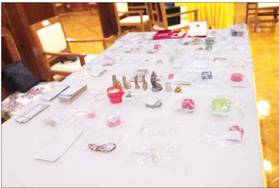
စေတနာရှင် အလှူရှင်များလှူဒါန်းထားသည့် ဘုရားဆင်းတုတော်၊ ကျောက်မျက်ရတနာနှင့် လှူဒါန်း ငွေများကို တွေ့ရစဉ်။

နေပြည်တော် ဇန်နဝါရီ ၃၁ နိုင်ငံတော်စီမံ အုပ်ချုပ်ရေးကောင်စီဥက္ကဋ္ဌ နိုင်ငံတော်ဝန်ကြီးချုပ် ဗိုလ်ချုပ်မှူးကြီး မင်းအောင်လှိုင် ဦးဆောင်သည့် ခုနစ်ရက် သား၊ သမီး၊ ဘုရားဒါယကာ၊ ဒါယကာမတို့က မာရဝိဇယဗုဒ္ဓရုပ်ပွားတော်မြတ်ကြီးအား မြန်မာနိုင်ငံတွင် ထေရဝါဒဗုဒ္ဓသာသနာတော် ထွန်းလင်းတောက်ပလျက်ရှိသည်ကို ကမ္ဘာကို ပြသရန်၊ တိုင်းပြည်အေးချမ်း သာယာမှုရှိစေရန်၊ ရုပ်ပွားတော် မြတ်ကြီးအား ပြည်တွင်း၊ ပြည်ပ ဘုရားဖူးများ လာရောက်ခြင်းဖြင့် ဒေသတိုးတက်စည်ကားမှုကို အထောက်အကူဖြစ်စေရန်၊ နိုင်ငံတော်ဖွံ့ဖြိုးတိုးတက်မှုအား အထောက်အကူဖြစ်စေရန် ရည်သန်လျက် ပြည်ထောင်စုနယ်မြေ နေပြည်တော် ဒက္ခိဏသီရိ မြို့နယ်အတွင်း၌ သာသနာတော်ထုံး၊ ရုပ်ပွားဆင်းတု တော်ထုံး၊ မြန်မာ့ရိုးရာတည်ထုံးများ၊ ဌာပနာပုံကျမ်း၊ ဗိသုကာကျမ်း၊ မဟာဗုဒ္ဓဝင်ကျမ်းအစရှိသော စာပေ ကျမ်းဂန်များနှင့်အညီ တည်ဆောက်ပူဇော်လျက် ရှိသည်။