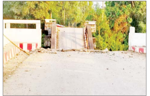
KNLA အဖွဲ့နှင့် PDF အမည်ခံ အကြမ်းဖက်သမားများ မိုင်းထောင်ဖောက်ခွဲခဲ့သည့် ဒါလီချောင်း သံကူကွန်ကရစ်တံတားပုံ။