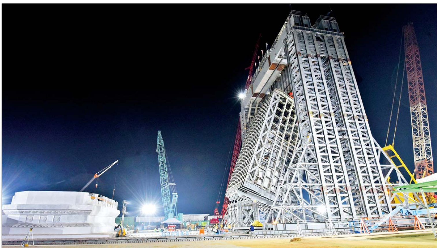
မာရဝိဇယဗုဒ္ဓရုပ်ပွားတော်မြတ်ကြီးအား သံဃဏီမျှော်စင် ဝန်ချီစက် အသုံးပြု၍ ရတနာပလ္လင်တော်ထက်သို့ ပင့်ထောင်ပူဇော်လျက်ရှိရာ ဇန်နဝါရီ ၂၈ ရက် ည ၁၂ နာရီတိတိတွင် ၆၈ ဒသမ ၆ ဒီဂရီအထိ ရောက်ရှိနေမှုကို ဖူးတွေ့ရစဉ်။

နေပြည်တော် ဇန်နဝါရီ ၂၈ ပြည်ထောင်စုနယ်မြေ နေပြည်တော် ဒက္ခိဏသီရိမြို့နယ်ရှိ မာရဝိဇယဗုဒ္ဓဥယျာဉ်တော်အတွင်း တည်ထားကိုးကွယ်ရန် ဆောင်ရွက်လျက်ရှိသည့် မာရဝိဇယ ဗုဒ္ဓရုပ်ပွားတော်မြတ်ကြီးအား ရတနာပလ္လင်တော်ထက်သို့ စတင်ပင့်ထောင်ပူဇော်ခြင်း မဟာမင်္ဂလာအခမ်းအနားကို ဇန်နဝါရီ ၂၆ ရက် နံနက်ပိုင်းတွင် အဆိုပါ ဗုဒ္ဓဥယျာဉ်တော်အတွင်း၌ နိုင်ငံတော်သံဃမဟာနာယကအဖွဲ့ဥက္ကဋ္ဌ မန္တလေးမြို့ ဗန်းမော်ကျောင်းတိုက် ဆရာတော်အဘိဓမ္မမဟာရဋ္ဌဂုရု အဘိဓမ္မအဂ္ဂမဟာ သဒ္ဓမ္မဇောတိက ဒေါက်တာ ဘဒ္ဒန္တကုမာရာဘိဝံသနှင့် သီတဂူကမ္ဘာ့ဗုဒ္ဓတက္ကသိုလ်များ၏ အဓိပတိ အဘိဓမ္မမဟာရဋ္ဌဂုရု အဘိဓမ္မအဂ္ဂမဟာသဒ္ဓမ္မဇောတိက မဟာဓမ္မကထိက ဗဟုဇနဟိတဓရ ရွှေကျင်နိကာယဥက္ကဋ္ဌ ရွှေကျင်သာသနာပိုင် သီတဂူဆရာတော်ကြီး ဒေါက်တာဘဒ္ဒန္တ ဉာဏိဿရတို့ အမှူးပြုသော ဆရာတော်၊ သံဃာတော်များ ကြွရောက် ချီးမြှင့်တော်မူကြပြီး စာမျက်နှာ ၃ ကော်လံ ၁ သို့ *