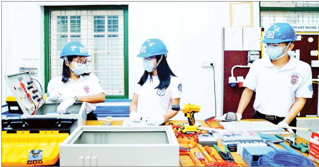
အစိုးရစက်မှုလက်မှုသိပ္ပံကျောင်း၌ ကျောင်းသား ကျောင်းသူများ ဘာသာရပ်အလိုက် လက်တွေ့သင်ကြားနေစဉ်။

အင်္ဂလိပ်စာ၊ သင်္ချာ ရမှတ်ပေါ်မူတည်၍ရွေးချယ် သင်တန်းအောင်မြင်ပြီး ထူးချွန်သည့် ကျောင်းသား ကျောင်းသူများအား အစိုးရ နည်းပညာကောလိပ်တတိယနှစ်သင်တန်း သို့လည်းကောင်း၊ နည်းပညာတက္ကသိုလ် တတိယနှစ်သင်တန်းသို့ လည်းကောင်း ဆက်လက်တက်ရောက်ခွင့်ရရန် လမ်းဖွင့် ပေးထားပါသည်။ တက္ကသိုလ်ဝင်စာမေးပွဲ တွင် သင်္ချာ၊ ရူပဗေဒ၊ စာတုဗေဒဘာသာ တွဲများပါဝင်သော ဘာသာတွဲများဖြင့် အောင်မြင်ပြီးသူများကို အင်္ဂလိပ်စာ၊ သင်္ချာရမှတ်ပေါ်မူတည်၍ ရွေးချယ် ခေါ်ယူပါသည်။ လျှောက်ထားလိုသည့် ကျောင်းသား ကျောင်းသူများသည် မိမိ တက်ရောက်လိုသော အစိုးရစက်မှု လက်မှုသိပ္ပံသို့ တိုက်ရိုက်လျှောက်ထား ရသည်။ ထိုကျောင်းများတွင်လည်း ပညာသင်ကြားနေစဉ် ကာလအတွင်း ပညာသင်ထောက်ပံ့ကြေး လျှောက်ထား လာပါက တစ်ဦးလျှင် တစ်လ သုံးသောင်း ကျပ် ချီးမြှင့်သည့်အစီအစဉ် ထားရှိပါ သည်။ စာမျက်နှာ ၁၁ သို့ □