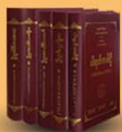
ဝိဇ္ဇာသုတ်(၁)၊ (၄၀) ခုနှင့် (ပါဠိနိဒါန်းအင်္ဂါ/ပါဠိနိဒါန်း)