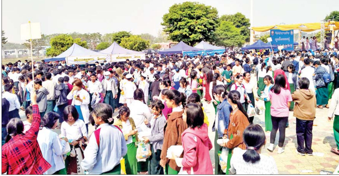
မန္တလေးတိုင်းဒေသကြီးအစိုးရအဖွဲ့က ကြီးမှူးကျင်းပသော လူငယ်ရေးရာကော်မတီစုံညီပွဲတော်သို့ တက်ရောက်လာကြသူများကို တွေ့ရစဉ်။

ဆောင်ရွက်ရာတွင် ကျရာအခန်းကဏ္ဍကနေ ပါဝင်ကြရန် တိုက်တွန်းနှိုးဆော်ကြောင်း ပြောကြားခဲ့သည်။ ကပြဖျော်ဖြေ တင်ဆက် ယင်းနောက် နိုင်ငံတော်စီမံအုပ်ချုပ်ရေးကောင်စီက ကြီးမှူးကျင်းပသော ငြိမ်းချမ်းရေးဆွေးနွေးပွဲများကို ကြိုဆိုသောအားဖြင့် မန္တလေးတိုင်းဒေသကြီးအတွင်းရှိ တက္ကသိုလ်အသီးသီး၌ အသိပညာ၊ အတတ်ပညာများ သင်ယူနေကြသည့် တိုင်းရင်းသား တိုင်းရင်းသူ၊ ကျောင်းသား ကျောင်းသူများက ၎င်းတို့ ပြည်နယ်နှင့် နိုင်ငံမတိုးတက်ခြင်းသည် ငြိမ်းချမ်းမှု မရရှိခြင်းကြောင့်ဖြစ်သည် အတွက် ငြိမ်းချမ်းရေးရရှိပါက ခံစားရမည့်အသီးအပွင့်များ၊ အကျိုးကျေးဇူးများကို တိုင်းရင်းသားလူမျိုးအလိုက် ဆွေးနွေးပြောကြား၍ ၎င်းတို့၏ တိုင်းရင်းသားရိုးရာအကများဖြင့် အဖွဲ့လိုက် ကပြဖျော်ဖြေ တင်ဆက်ကြသည်။ ထို့နောက် ကျောင်းသား ကျောင်းသူများသည် တက္ကသိုလ်များ တက်ရောက်ရာတွင် မှန်ကန်စွာ ရွေးချယ်တက်ရောက်နိုင်ရန်နှင့် ဗဟုသုတကြွယ်ဝစေရန်အတွက် ဖွင့်လှစ်ထားသော ဆေးတက္ကသိုလ်နှင့် ဆေးဘက်နီးနွယ်တက္ကသိုလ်များ၊ သိပ္ပံနည်းပညာဆိုင်ရာ နီးနွယ်တက္ကသိုလ်များ၊ အဆင့်မြင့်ပညာ တက္ကသိုလ်များမှ ပြခန်းများကို စိတ်ဝင်စားစွာ လေ့လာကြည့်ရှုမေးမြန်းကြရာ သက်ဆိုင်ရာပြခန်းများမှ ဆရာ ဆရာမများ၊ ကျောင်းသား ကျောင်းသူများက ရှင်းလင်းပြောကြားသည်။ အဆိုပါ အခမ်းအနားတွင် မြို့မတေးဂီတအဖွဲ့မဏ္ဍပ်၊ ဆေးဘက်ဆိုင်ရာ နီးနွယ်တက္ကသိုလ်များမဏ္ဍပ်၊ နည်းပညာဆိုင်ရာ နီးနွယ်တက္ကသိုလ်များမဏ္ဍပ်၊ ဝိဇ္ဇာသိပ္ပံတက္ကသိုလ်များမဏ္ဍပ်၊ အခြေခံပညာမဏ္ဍပ်များမှ ကျောင်းသား ကျောင်းသူများက အငြိမ့် အကများဖြင့် ဖျော်ဖြေ တင်ဆက်ပြီး မြို့မိမြို့ဖများနှင့် ပြည်သူများက စတုဒိသာမဏ္ဍပ်များထားရှိ၍ ကျောင်းသား ကျောင်းသူများအား ဧည့်ခံကျွေးမွေးခဲ့ကြကြောင်း သိရသည်။ သတင်းစဉ်