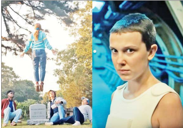
ကြည့်ရှုမှုရှိခဲ့ပြီး ထုတ်လွှင့်ခဲ့ရတဲ့ အချိန်အများဆုံး ဇာတ်လမ်းတွဲနဲ့ ရုပ်သံအစီအစဉ်အဖြစ် မှတ်တမ်းဝင်ထားတာလည်း ဖြစ်ပါတယ်။

မိနစ်ပေါင်း ၅၂ ဘီလီယံ ကြည့်ရှုမှုရှိ နက်ဖ်လစ်စ်က ထုတ်လွှင့်ပြီး သဘာဝလွန် ဖြစ်ရပ်တွေအကြောင်း ပုံဖော်ထားတဲ့ အဆိုပါ ဇာတ်လမ်းတွဲမှာ မင်းသမီး မီလီဘော်ဘီဘရောင်းက အဓိကဇာတ်ဆောင်အဖြစ် ပါဝင်ထားတာပါ။ အဆိုပါဇာတ်လမ်းတွဲဟာ နယ်လ်ဆန်က ထုတ်ပြန်ခဲ့တဲ့ နှစ်ကုန်စာရင်းမှာ မိနစ်ပေါင်း ၅၂ ဘီလီယံ