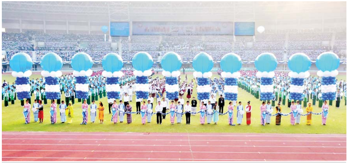
မန္တလေးတိုင်းဒေသကြီးဝန်ကြီးချုပ် ဦးမောင်ကို၊ အလယ်ပိုင်းတိုင်းစစ်ဌာနချုပ် တိုင်းမှူး ဗိုလ်ချုပ်ကိုကိုဦးနှင့် တက္ကသိုလ်/အခြေခံပညာကျောင်းများမှ ထူးချွန်တိုင်းရင်းသား ကျောင်းသား ကျောင်းသူများက မန္တလေးတိုင်းဒေသကြီး လူငယ်ရေးရာကော်မတီ စုံညီပွဲတော်အခမ်းအနားကို ဖဲကြိုးဖြတ် ဖွင့်လှစ်ပေးကြစဉ်။

မန္တလေး ဇန်နဝါရီ ၂၀ (၇၆) နှစ်မြောက်ပြည်ထောင်စုနေ့ကို ကြိုဆိုရက်ပြုခြင်းနှင့် နိုင်ငံတော်မှ ကျင်းပလျက်ရှိသော တစ်နိုင်လုံး ပစ်ခတ်မှုရပ်စဲရေး ငြိမ်းချမ်းရေးဆွေးနွေးပွဲများကို ကြိုဆိုထောက်ခံသောအားဖြင့် မန္တလေးတိုင်းဒေသကြီးအစိုးရအဖွဲ့က ကြီးမှူးကျင်းပသော လူငယ်ရေးရာကော်မတီစုံညီပွဲတော်ကို ယနေ့နံနက် ၈ နာရီတွင် မန္တလေးမြို့ မန္တလာသီရိအားကစားကွင်း၌ ကျင်းပရာ အခြေခံပညာကျောင်းများမှ ကျောင်းသား ကျောင်းသူ ၂၅၀၀၀ ကျော်နှင့် တက္ကသိုလ်၊ ဒီဂရီကောလိပ်များမှ ဆရာ ဆရာမများနှင့် ကျောင်းသား ကျောင်းသူများ၊ စာရေးဆရာများ၊ တိုင်းရင်းသားယဉ်ကျေးမှုအသင်းအဖွဲ့များ၊ လူမှုအသင်းအဖွဲ့အစည်းများ၊ မြို့မိမြို့ဖများနှင့် ဖိတ်ကြားထားသူများ စုစုပေါင်း အင်အား ၃၀၀၀၀ ခန့် တက်ရောက်ကြသည်။ လူငယ်ရေးရာကော်မတီစုံညီပွဲတော်ကို လူငယ်များ၏ ပညာရေး၊ ကျန်းမာရေး၊ လူမှုရေးကဏ္ဍများ မြှင့်တင်ဆောင်ရွက်ပေးနိုင်ရန်၊ အမျိုး၊ ဘာသာ၊ သာသနာ၊ ယဉ်ကျေးမှု၊ စာပေတို့ကို ထိန်းသိမ်းမြှင့်တင်ရန်နှင့် ဗလငါးတန်ဖွံ့ဖြိုးလာစေရန်၊