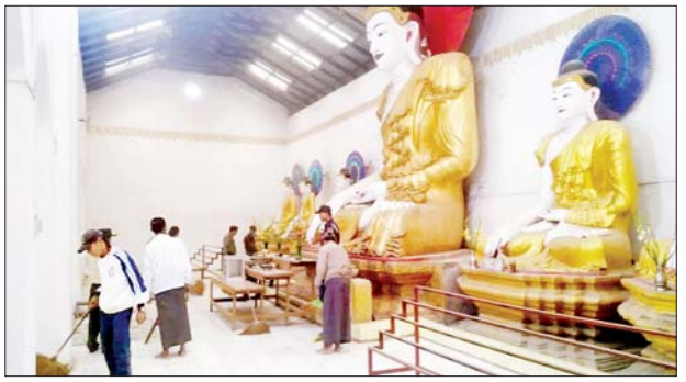
ညောင်တုန်းမြို့ နိုင်ငံအေးဘုရားကြီး၌ ကုသိုလ်ယူစုပေါင်းသန့်ရှင်းရေးဆောင်ရွက်ခြင်းနှင့် ဓဇဂ္ဂသုတ်ပရိတ်တော်များ ရွတ်ဖတ်ပူဇော်

ပါဠိကို ရွတ်ဖတ်ခဲ့ကြပြီး ဝတ်အသင်းသူများက ဓဇဂ္ဂသုတ်ကို ရွတ်ဖတ်ပူဇော်ခဲ့ကြကာ အခမ်းအနားကို ဗုဒ္ဓ သာသနံ စိရိတိဋ္ဌတု သုံးကြိမ်ရွတ်ဆို ရုပ်သိမ်းခဲ့ကြောင်း သိရသည်။ ထို့အတူ အမှတ်(၁)ရပ်ကွက် မိုးယားကောင်းပရိယတ္တိစာသင်တိုက်၌ ရွတ်ဖတ်ပူဇော်ခဲ့ကြကြောင်း သိရသည်။ မြို့နယ် (ပြန်/ဆက်)