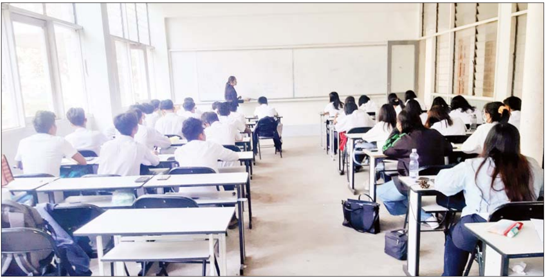
အစိုးရစက်မှုလက်မှုသိပ္ပံကျောင်း၌ ကျောင်းသား ကျောင်းသူများ ဘာသာရပ်အလိုက် စာတွေ့သင်ကြားနေစဉ်။

ဆက်လက်ပညာသင်ယူနိုင်ရန် လမ်းဖွင့်ပေးထား သိပ္ပံနှင့် နည်းပညာဝန်ကြီးဌာနတွင် ဦးစီးဌာန ခုနစ်ခုရှိပြီး နည်းပညာ၊ သက်မွေး ပညာနှင့် လေ့ကျင့်ရေးဦးစီးဌာနအောက် တွင် အသက်မွေးဝမ်းကျောင်းပညာရပ် များကို တက်ရောက်သင်ကြားနိုင်ရန် ဆောင်ရွက်ထားသည်။ အခြေခံပညာ အလယ်တန်း (KG + 9) ပြီးမြောက် အောင်မြင်ပြီးပါက အစိုးရနည်းပညာ အထက်တန်းကျောင်း (GTHS) များသို့ တက်ရောက်ရန် လျှောက်ထားနိုင်ပြီး တက်ရောက်ခွင့်ရပါက သင်တန်းကာလ သုံးနှစ် တက်ရောက်သင်ကြားရပါသည်။ သင်တန်းအောင်မြင်ပြီးဆုံးပါက GTHS Certificate ချီးမြှင့်ပါသည်။ ပညာ သင်ကြားနေစဉ်ကာလအတွင်း ပညာ သင်ထောက်ပံ့ကြေး လျှောက်ထားလာ ပါက တစ်ဦးလျှင် တစ်လ သုံးသောင်းကျပ် နှုန်းဖြင့် နိုင်ငံတော်က ပံ့ပိုးချီးမြှင့်ပေး ထားပါသည်။ ထိုကျောင်းများမှသင်တန်း ပြီးဆုံးအောင်မြင်ပြီး ပညာထူးချွန်သူများ ကို အစိုးရစက်မှုလက်မှုသိပ္ပံ၊ အစိုးရ နည်းပညာကောလိပ်နှင့် နည်းပညာ တက္ကသိုလ်များသို့ ဆက်လက်တက် ရောက်ပညာသင်ယူနိုင်ရန် လမ်းဖွင့်ပေး ထားပါသည်။