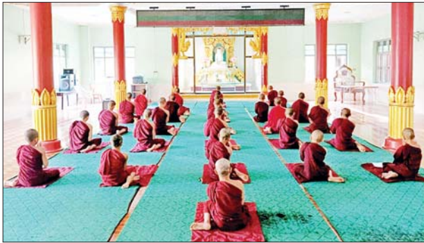
သုံးကြိမ်ရွတ်ဆို ဘုရားကန်တော့ တော်များက အတွင်းအောင်ခြင်း ရှစ်ပါးနှင့် အပြင်အောင်ခြင်း ရှစ်ပါး ဖြင့်လှူပူဆရာတော်၊ သံဃာ

ကျောင်းကုန်း ဇန်နဝါရီ ၂၈ ဧရာဝတီ တိုင်းဒေသကြီး ကျောင်းကုန်းမြို့နယ် အမှတ်(၂) ရပ်ကွက်ရှိ ဒက္ခိဏာရာမ (ရွှေကျင်) ပရိယတ္တိစာသင်တိုက်၌ ယမန်နေ့ နံနက် ၈ နာရီတွင် ဆရာတော်၊ သံဃာတော်များက အောင်ခြင်း ရှစ်ပါး ပါဠိနှင့် ဓဇဂ္ဂသုတ် ပရိတ်တော်မြတ်ကို ရွတ်ဖတ်ပူဇော်ခဲ့ကြသည်။ အခမ်းအနားကို နမောတဿ