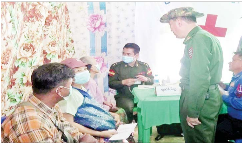
အနောက်တောင်တိုင်းစစ်ဌာနချုပ် ဒုတိယတိုင်းမှူး ဗိုလ်မှူးချုပ် အောင်ခင်ဇော်နှင့် တာဝန်ရှိသူများက မြောင်းမြမြို့နယ် စကားမြားကျေးရွာနှင့် ပတ်ဝန်းကျင်ကျေးရွာများမှ ပြည်သူများအား ကျန်းမာရေး စောင့်ရှောက်မှုလုပ်ငန်းများ ဆောင်ရွက်ပေးနေမှုကို ကြည့်ရှုအားပေးစဉ်။

ယင်းသို့ ဆောင်ရွက်ပေးနေမှုများကို အနောက် တောင်တိုင်းစစ်ဌာနချုပ် ဒုတိယတိုင်းမှူး ဗိုလ်မှူးချုပ် အောင်ခင်ဇော်နှင့် တာဝန်ရှိသူများက သွားရောက် ကြည့်ရှုအားပေးခဲ့ကြကြောင်း သိရသည်။ သတင်းစဉ်