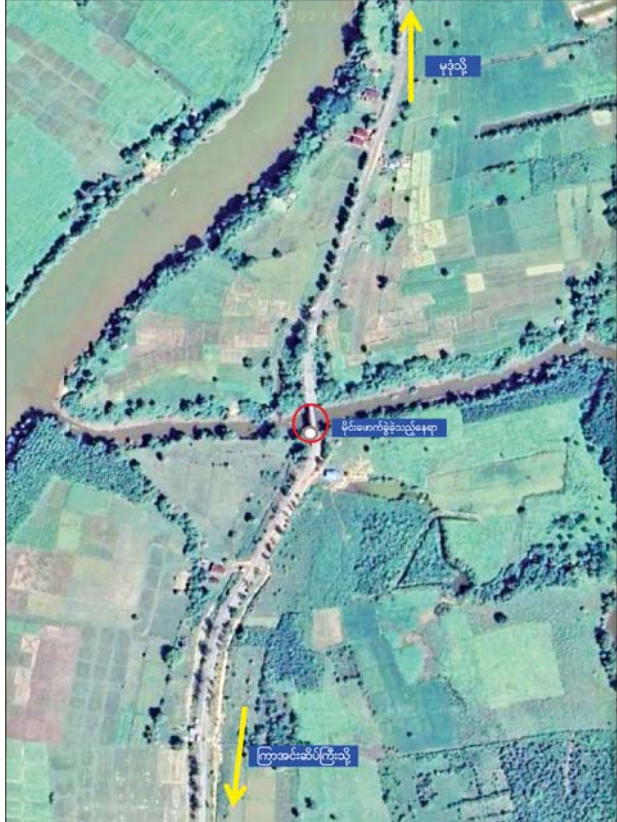
KNLA အဖွဲ့နှင့် PDF အမည်ခံအကြမ်းဖက်သမားများ မိုင်းထောင် ဖောက်ခွဲခဲ့သည့် ဒါလီချောင်းသံကူကွန်ကရစ်တံတား နေရာပြပုံ။

က စုံစမ်းဖော်ထုတ်လျက်ရှိကြောင်းနှင့် နယ်မြေ လုပ်ငန်းများ ဆက်လက်ဆောင်ရွက်လျက်ရှိကြောင်း တည်ငြိမ်အေးချမ်းရေးအတွက် လိုအပ်သည့်လုံခြုံရေး သိရသည်။ သတင်းစဉ်