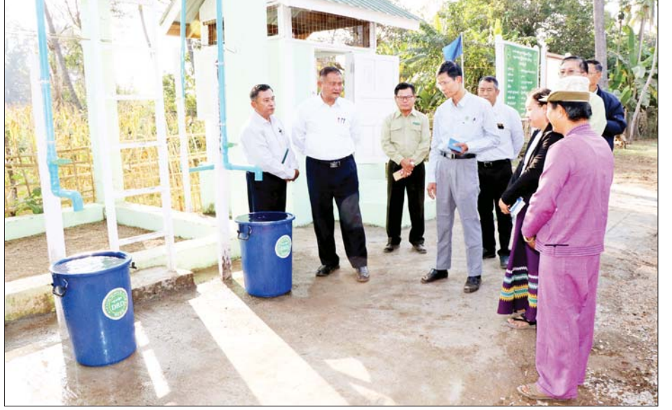
ထို့နောက် ဒုတိယဝန်ကြီးသည် ပန်ကျိုင်း ကျေးရွာနှင့် ဝမ်ကွန်ကျေးရွာ စိုက်ခင်းများအတွက် ရေရဟတ်များဖြင့် ချောင်းရေတင်နိုင်ရေး လိုအပ်သည်များ ညှိနှိုင်းပေါင်းစပ်ပေးခဲ့ကြောင်း သိရသည်။ သတင်းစဉ်

ယင်းနောက် ဒုတိယဝန်ကြီးသည် လင်းခေးခရိုင် ကျေးလက်ဒေသ ဖွံ့ဖြိုးတိုးတက်ရေးဦးစီးဌာနရုံး၌ ဝန်ထမ်းများနှင့်တွေ့ဆုံကာ လုပ်ငန်းဆိုင်ရာများ မှာကြားဖြည့်ဆည်းဆောင်ရွက်ပေးသည်။