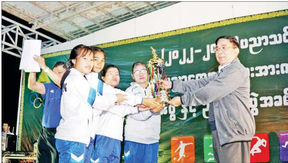
ပြည်ထောင်စုဝန်ကြီး ဒေါက်တာညွန့်ဖေ ဘောလုံးပြိုင်ပွဲ(အမျိုးသမီး)တွင် ဆုရရှိခဲ့ကြသည့် အသင်းများကို ဆုများချီးမြှင့်စဉ်။

၂၀၂၂-၂၀၂၃ ပညာသင်နှစ် အခြေခံပညာ ကျောင်းသားအားကစားပွဲတော် ဆုချီးမြှင့်ပွဲ၊ ပိတ်ပွဲ နှင့် ညစာစားပွဲအခမ်းအနားကို ယမန်နေ့ ညနေ ၆ နာရီခွဲတွင် နေပြည်တော် အားကစားလေ့ကျင့်ရေး စခန်း Social Zone ၌ ကျင်းပရာ ပညာရေးဝန်ကြီးဌာန ပြည်ထောင်စုဝန်ကြီးဒေါက်တာညွန့်ဖေ၊ ဒုတိယ ဝန်ကြီးဦးဇော်ဝင်းနှင့် ဒေါက်တာဇော်မြင့်၊ အားကစား နှင့် လူငယ်ရေးရာဝန်ကြီးဌာန ဒုတိယဝန်ကြီး ဦးမျိုးလှိုင်၊ ဒုတိယအမြဲတမ်းအတွင်းဝန်များနှင့် တာဝန်ရှိသူများ၊ တိုင်းဒေသကြီးနှင့် ပြည်နယ်များမှ အားကစားနည်းအလိုက်အုပ်ချုပ်သူ၊ နည်းပြများ၊ အားကစားမောင်မယ် ကျောင်းသား ကျောင်းသူများ တက်ရောက်ကြသည်။