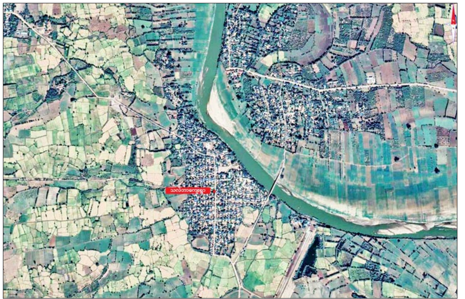
PDF အမည်ခံ အကြမ်းဖက်သမားများက မီးရှို့ဖျက်ဆီးပြီး ကျေးရွာအတွင်း လက်နက်ကြီး၊ လက်နက်ငယ်များဖြင့် ပစ်ခတ်ခဲ့သည့် အရာတော်မြို့နယ် သလဲဘာကျေးရွာနေရာပြပုံ။

လက်နက်ကြီး၊ လက်နက်ငယ်များဖြင့် လာရောက် ပစ်ခတ်တိုက်ခိုက်ခဲ့သဖြင့် လုံခြုံရေးတပ်ဖွဲ့ဝင်များက ပြန်လည်ပစ်ခတ်တိုက်ခိုက်ခဲ့ရာ အကြမ်းဖက်သမား များ ည ၁၁ နာရီ မိနစ် ၅၀ ခန့်တွင် ကျေးရွာ၏ တောင်ဘက်ရှိ လူနေအိမ်များအား ဝင်ရောက်မီးရှို့ ဖျက်ဆီးပြီးပြန်လည်ဆုတ်ခွာထွက်ပြေးသွားခဲ့ကြောင်း၊ အဆိုပါအကြမ်းဖက်သမားများ၏ မီးရှို့မှုကြောင့် နေအိမ် အလုံး ၈၀ မီးကူးစက်လောင်ကျွမ်းပျက်စီး ခဲ့ကြောင်း၊ ဆင်ခြင်တုံတရားမဲ့စွာ ကျေးရွာအတွင်း လက်နက်ကြီး၊ လက်နက်ငယ်များဖြင့် ပစ်ခတ်မှု ကြောင့်သက်တော် ၈၃ နှစ် ဝါတော် ၁၀ ဝါရှိဘုန်းတော် ကြီးတစ်ပါး ပျံလွန်တော်မူခဲ့ပြီး ကျေးရွာနေ အပြစ်မဲ့ အမျိုးသားငါးဦးနှင့် အမျိုးသမီးသုံးဦး သေဆုံးခဲ့ကာ အမျိုးသားနှစ်ဦး ထိခိုက်ဒဏ်ရာရရှိခဲ့ကြောင်း သိရသည်။ အဆိုပါ PDF အမည်ခံ အကြမ်းဖက်သမားများ၏ မီးရှို့ဖျက်ဆီးခြင်းခံခဲ့ရသည့် မီးဘေးသင့်ပြည်သူများ သည် နီးစပ်ရာကျေးရွာဘုန်းတော်ကြီးကျောင်းများ၊ စာသင်ကျောင်းများ၊ ဆွေမျိုးများ၏ နေအိမ်များ၌ နေထိုင်လျက်ရှိကြောင်းနှင့် ဖြစ်စဉ်တွင် ပါဝင်ပတ်သက် သူများအား ဖော်ထုတ်ဖမ်းဆီး၍ ဥပဒေနှင့်အညီ ထိရောက်စွာအရေးယူနိုင်ရေး လုံခြုံရေးတပ်ဖွဲ့ဝင်များ