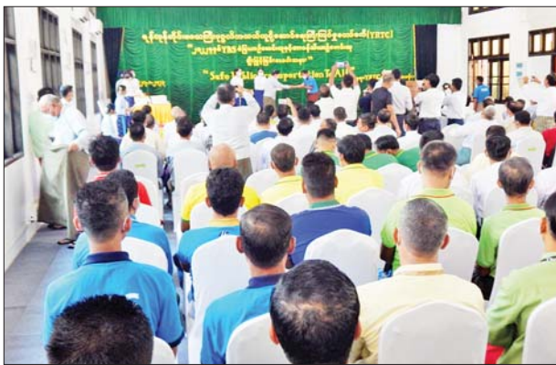
ပေးအပ်ချီးမြှင့်ခြင်းဖြစ်ကြောင်း သိရသည်။

ရန်ကုန်တိုင်းဒေသကြီးအတွင်း ပြေးဆွဲနေသည့် YBS ခရီးသည်တင်ယာဉ်လိုင်းကုမ္ပဏီများမှ စည်းကမ်းလိုက်နာပြီး ကိုယ်ကျင့်တရားကောင်းမွန်သော YBS ယာဉ်မောင်းများအား ရန်ကုန်တိုင်းဒေသကြီးပုဂ္ဂလိကသယ်ယူပို့ဆောင်ရေးကြီးကြပ်မှုကော်မတီ (YRTC)က ၂၀၂၂ ခုနှစ် YBS စံပြုယာဉ်မောင်းဆွဲနှင့် တာဝန်သိယာဉ်မောင်းဆွဲချီးမြှင့်ခြင်း အခမ်းအနားကို ယမန်နေ့နံနက်ပိုင်းက ရန်ကုန်တိုင်းဒေသကြီး တာမွေမြို့နယ် လေးထောင့်ကန်လမ်းရှိ YRTC ရုံးချုပ်၌ ကျင်းပကြောင်း သိရသည်။