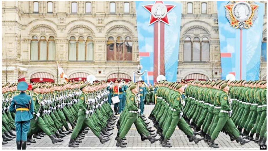
နာဇီဂျာမနီကို အောင်နိုင်ခြင်းအထိမ်းအမှတ်စစ်ရေးပြအခမ်းအနားတွင် ချီတက်နေသည့် ရုရှားစစ်သည်များ။

ကမ္ဘာ့ရေးရာများနှင့်ပတ်သက်၍ ကမ္ဘာ့ထိပ်တန်း နိုင်ငံတစ်နိုင်ငံ၏ ရပ်တည်မှုဆိုသည်မှာ နိုင်ငံကြီး တစ်နိုင်ငံဖြစ်သည်နှင့်အညီ အလေးအနက် ထားရသည်သာဖြစ်သည်။ အင်အားကြီးနိုင်ငံအဖြစ် ထင်ရှားသည့်သာဓကများဖြစ်သော ခေတ်မီမှု၊ နိုင်ငံရေး၊ စီးပွားရေးတည်ငြိမ်မှုနှင့် အချုပ်အခြာအာဏာ တည်တံ့ခိုင်မြဲမှု၊ နိုင်ငံသားများ၏ ပညာရေးနှင့် လူမှုစီးပွားဘဝများ ဖွံ့ဖြိုးတိုးတက်မှု၊ စစ်အင်အား တောင့်တင်းမှု စသည်များအားလုံး ယနေ့ ရုရှား ဖက်ဒရေးရှင်းနိုင်ငံကြီးက ပိုင်ဆိုင်ထားသည်။ ပြိုကွဲ ပြိုလဲခဲ့ရသည့် ယခင် ဆိုဗီယက်နိုင်ငံတော်ကြီး နှစ် ၃၀ အတွင်း ရုရှားနိုင်ငံတော်ကြီးအဖြစ် တစ်ဖန် ပြန်လည်ခေတ်မီဖွံ့ဖြိုးတိုးတက်လာခြင်း၏ လျှို့ဝှက် သော့ချက်များကား အဘယ်နည်း။ ဖွံ့ဖြိုးဆဲနိုင်ငံ ဘဝတွင် ရုန်းကန်နေရသည့် နိုင်ငံများအနေဖြင့်ရော ဘက်စုံခေတ်မီဖွံ့ဖြိုးတိုးတက်လိုသည့် နိုင်ငံတစ်နိုင်ငံ အနေဖြင့်ပါ ကောင်းစွာလေ့လာစေလိုပါသည်။