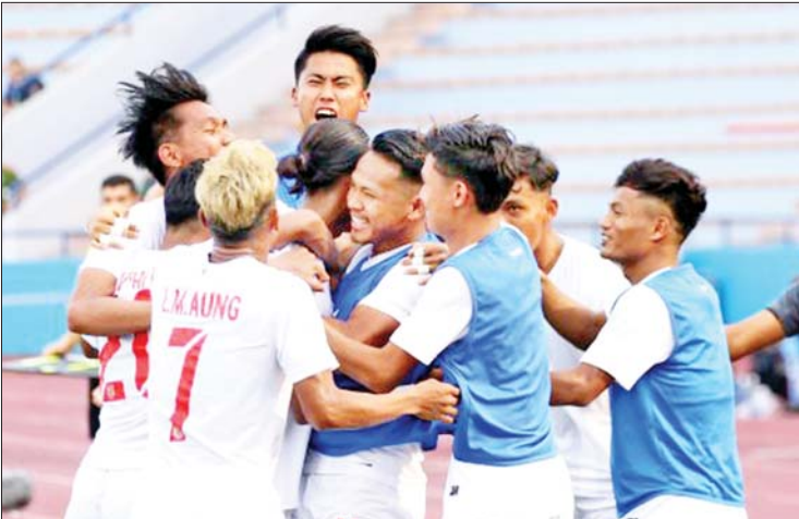
၂၀၂၂ ခုနှစ်က ဖွဲ့စည်းခဲ့သည့် မြန်မာ ယူ-၂၂ အသင်း ကစားသမားများကို တွေ့ရစဉ်။

မန်စီးတီးအသင်းနဲ့ အာဆင်နယ် အသင်းတို့ ဇန်နဝါရီ ၂၇ ရက် ညပိုင်းက ယှဉ်ပြိုင်ကစားခဲ့တဲ့ အက်ဖ်အေဖလား စတုတ္ထအဆင့်ပွဲစဉ်မှာ မန်စီးတီးအသင်းက အာဆင်နယ်အသင်းကို တစ်ဂိုး-ဂိုးမရှိ အနိုင်ရခဲ့တာကြောင့် မန်စီးတီးအသင်းဟာ နောက်တစ်ဆင့်ကို တက်လှမ်းခွင့် ရရှိခဲ့ပြီ ဖြစ်ပါတယ်။ ခွဲဘဲ ဒုတိယပိုင်း ပွဲကစားချိန် ၆၄ မိနစ်မှာ မန်စီးတီးအသင်းက နက်သန်အကဲရဲ့ သွင်းဂိုးရရှိခဲ့လို့ တစ်ဂိုး-ဂိုးမရှိနဲ့ အနိုင်ရရှိခဲ့တာ ဖြစ်ပါတယ်။ စာမျက်နှာ ၂၅ ကော်လံ ၅ သို့ ၀