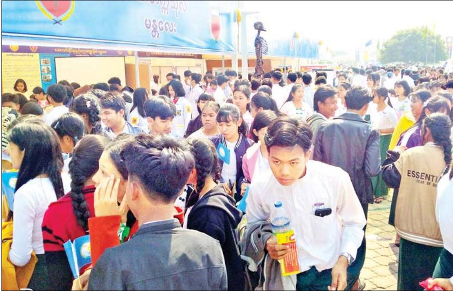
လူငယ်ရေးရာကော်မတီစုံညီပွဲတော်တွင် ကျောင်းသား ကျောင်းသူများ ခင်းကျင်းပြသထားသည့် ပြခန်းများကို ကြည့်ရှုလေ့လာကြစဉ်။

စာမျက်နှာ ၈ မှ ဒါကြောင့် ငြိမ်းချမ်းရေး ဆောင်ရွက်တဲ့အခါမှာ လူတစ်ဦး တစ်ယောက်ထဲက လုပ်ဆောင်၍ မရပါဘူး။ တိုင်းရင်းသားအားလုံး နိုင်ငံကြီးသားစိတ်ဓာတ် မွေးမြူ နိုင်မှသာလျှင် တစ်နိုင်ငံလုံး နေရာ ဒေသအလိုက် ဖွံ့ဖြိုးတိုးတက်မှာ ဖြစ်ပါတယ်။ ကျွန်တော်တို့ရဲ့ လက်ငါးချောင်းတန်ဖိုးကို သိကြ သလို မတူကွဲပြားတဲ့ တိုင်းရင်းသား အားလုံးရဲ့ စည်းလုံးညီညွတ်မှုရဲ့ တန်ဖိုးကို သိကြစေလိုပါတယ်” ဟု ဆွေးနွေးတင်ပြပြီး မန္တလေး ပညာရေးဒီဂရီကောလိပ်မှ ချင်း တိုင်းရင်းသား၊ တိုင်းရင်းသူ ကျောင်းသား ကျောင်းသူများက “မင်းဘမ်ပရမ်းနာဇန်ဂမ် တေး သီချင်း”အကဖြင့် ဖျော်ဖြေ