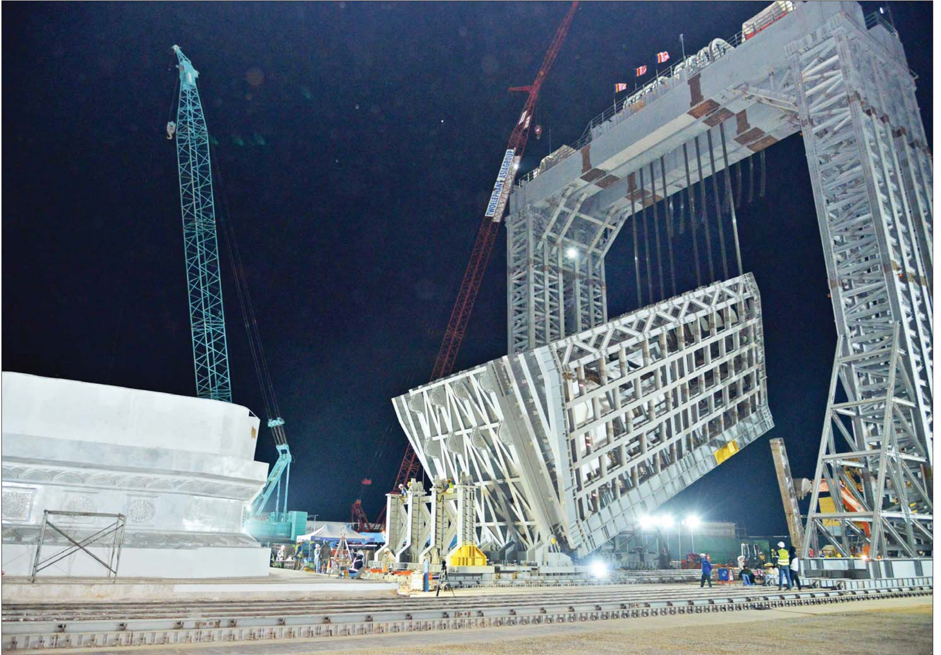
မာရဝိယေဗုဒ္ဓရုပ်ပွားတော်မြတ်ကြီးအား သံမဏိမျှော်စင်ဝန်ချီစက်အသုံးပြု၍ ရတနာပလ္လင်တော်ထက်သို့ ပင့်ဆောင်ပူဇော်လျက်ရှိရာ ဇန်နဝါရီ ၂၆ ရက် ည ၁၂ နာရီတိတိတွင် ၂၆ ဒီဂရီအထိ ရောက်ရှိနေမှုကို ဖူးတွေ့ရစဉ်။

စာမျက်နှာ ၄ မှ နေပြည်တော်သို့ ရောက်ရှိလာ သည့် ကျောက်တုံးတော်ကြီးများ ကို အဆင့်မြင့် နည်းပညာဖြစ်သည့် CNC Machine များဖြင့် ပုံဖော် ထုဆစ်ခြင်း လုပ်ငန်းများကို ကျွမ်းကျင်ပညာရှင်များ၊ ခေတ်မီ စက်ကိရိယာများဖြင့် နေ့မအား၊ ညမနား ကြိုးပမ်းဆောင်ရွက်ခဲ့ ကြောင်း။