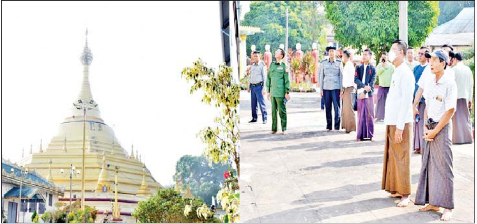
အသီးသီးတွင်လည်း ဘုရားကျောင်းကန်များ အား ထုံးသင်္ကန်းကပ်ခြင်းများ ဆောင်ရွက်လျက် သန့်ရှင်းရေးဆောင်ရွက်ခြင်းနှင့် စေတီပုထိုးများ ရှိကြောင်း သိရသည်။ တိုင်းဒေသကြီး(ပြန်/ဆက်)

များ သန့်ရှင်းရေးဆောင်ရွက်ခြင်းနှင့် စေတီပုထိုးများအား ထုံးသင်္ကန်းကပ်ခြင်းများ ဆောင်ရွက်လျက်ရှိရာ ပုသိမ်မြို့ရှိ လေးကျွန်းရန်အောင်ဖောင်တော်ဦးစေတီတော်မြတ်၊ တဂေါင်းမင်္ဂလာမဟာစေတီတော်မြတ်၊ လောကနန္ဒာစေတီတော်မြတ်နှင့် ပုသိမ်မြို့ပေါ်ရှိဘုရားစေတီများအား ရေသပ္ပာယ်ခြင်း၊ ထုံးသင်္ကန်းကပ်ခြင်း၊ ရောင်တော်ဖွင့်ခြင်း၊ စေတီတော်ရင်ပြင်တော်များအား တံမြက်လှည်းသန့်ရှင်းရေး ကုသိုလ်ယူခြင်းများဆောင်ရွက်နေမှုများကို သွားရောက်ကြည့်ရှုအားပေးသည်။ ထို့အတူ တိုင်းဒေသကြီးအတွင်းရှိ မြို့နယ်