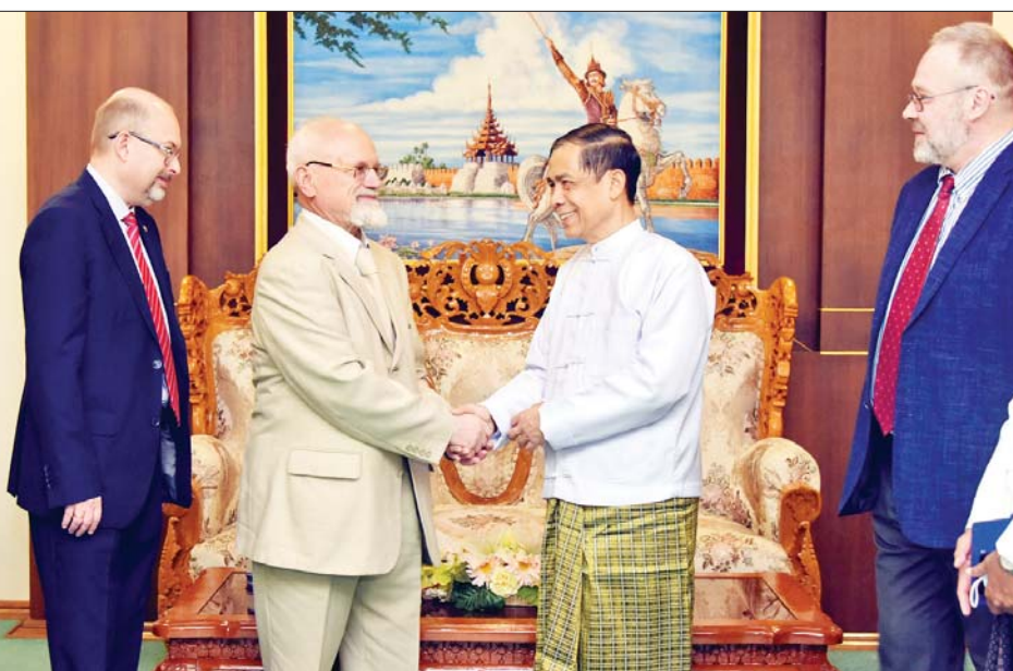
များနှင့် ရုရှား-မြန်မာ ချစ်ကြည်ရေးနှင့်ပူးပေါင်းဆောင်ရွက်ရေးအသင်းမှ ကိုယ်စားလှယ်များ တက်ရောက်ကြကြောင်း သိရသည်။ သတင်းစဉ်

နေပြည်တော် ဇန်နဝါရီ ၂၆ အပြည်ပြည်ဆိုင်ရာ ပူးပေါင်းဆောင်ရွက်ရေးဝန်ကြီးဌာန ပြည်ထောင်စုဝန်ကြီး ဦးကိုကိုလှိုင်သည် ရုရှား-မြန်မာ ချစ်ကြည်ရေးနှင့်ပူးပေါင်းဆောင်ရွက်ရေးအသင်း ဒုတိယဥက္ကဋ္ဌ မစ္စတာ အန်နာသိုလီ ဘူးလော့ချိန်ကော့ ဦးဆောင်သော ကိုယ်စားလှယ်အဖွဲ့အား ယနေ့နံနက် ၁၀ နာရီခွဲတွင် နေပြည်တော်ရှိ အပြည်ပြည်ဆိုင်ရာ ပူးပေါင်းဆောင်ရွက်ရေးဝန်ကြီးဌာန၌ လက်ခံတွေ့ဆုံသည်။ တွေ့ဆုံစဉ် ပြည်ထောင်စုဝန်ကြီးက မြန်မာ-ရုရှား နှစ်နိုင်ငံ သံတမန်ဆက်ဆံရေးထူထောင်မှုသည် ယခုနှစ်တွင် စိန်ရတနာပတ်လည်တိုင်ခဲ့ပြီဖြစ်ကြောင်း၊ ၁၉၅၀ ပြည့်လွန်ကာလများတွင် နှစ်နိုင်ငံအကြားဆက်ဆံရေး အထူးကောင်းမွန်ခဲ့ပြီး ယခုတစ်ဖန် နှစ်နိုင်ငံဆက်ဆံရေးမှာ စာမျက်နှာသစ်တစ်ခု ဖွင့်လှစ်နိုင်ခဲ့ပြီဖြစ်ကြောင်း ပြောကြားသည်။ ထို့နောက် ပြည်ထောင်စုဝန်ကြီးက ပညာရေး၊ ပို့ဆောင်ရေး၊ ခရီးသွားလာရေး၊ လျှပ်စစ်၊ စွမ်းအင်၊ ဘဏ္ဍာရေး အစရှိသည့် ကဏ္ဍများတွင် ပူးပေါင်းဆောင်ရွက်မှုများ မြှင့်တင်နိုင်ရေး၊ နှစ်နိုင်ငံအကြား ကုန်သွယ်မှုလမ်းကြောင်းများ ရှာဖွေဖော်ထုတ်ရေးနှင့် ရုရှားကုမ္ပဏီများ မြန်မာနိုင်ငံတွင် ရင်းနှီးမြှုပ်နှံမှုများ တိုးမြှင့်လုပ်ဆောင်ရန် ကိစ္စတို့နှင့်စပ်လျဉ်း၍ ဆွေးနွေးပြောကြားသည်။ တွေ့ဆုံပွဲသို့ အပြည်ပြည်ဆိုင်ရာပူးပေါင်းဆောင်ရွက်ရေးဝန်ကြီးဌာနမှ အဆင့်မြင့်အရာရှိကြီး