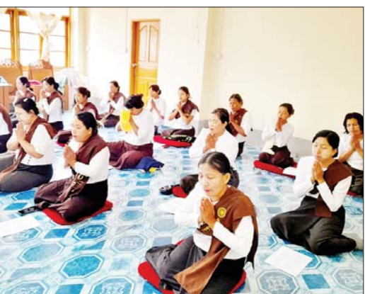
ဗုဒ္ဓရုပ်ပွားတော် မြတ်ကြီးအား ရတနာပလ္လင်တော်ထက်သို့ စတင်ပင့်ဆောင်ချိန်တွင် နမ္မတူမြို့ တန်ခိုးကြီး စေတီဘုရားများ၌ အပြင်အောင်ခြင်း ရှစ်ပါး၊ အတွင်းအောင်ခြင်း ရှစ်ပါး ပါဠိတော်နှင့်

နမ္မတူ ဇန်နဝါရီ ၂၆ ရှမ်းပြည်နယ် (မြောက်ပိုင်း) ကျောက်မဲခရိုင် နမ္မတူမြို့နယ်တွင် တန်ခိုးကြီး စေတီဘုရားများ၌ အပြင်အောင်ခြင်းရှစ်ပါး၊ အတွင်းအောင်ခြင်းရှစ်ပါး ပါဠိတော်နှင့် လင်္ကာ၊ ဓဇဂ္ဂသုတ်ပရိတ်တရားတော် ရွတ်ဖတ်ပူဇော်ခြင်းကို ဇန်နဝါရီ ၂၆ ရက် နံနက် ၈ နာရီက ဆောင်ရွက်ခဲ့ကြောင်း သိရသည်။ ထိုသို့ ရွတ်ဖတ်ပူဇော်ရာတွင် ဇန်နဝါရီ ၂၆ ရက် နံနက် ၈ နာရီတွင် နေပြည်တော်၌ တည်ထားကိုးကွယ်မည့် မာရဝိဇယ