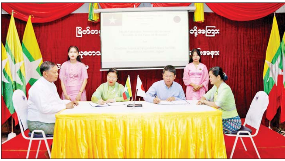
Workshop၊ Conference များ ပူးပေါင်းဆောင်ရွက်၍ ပညာရပ်ဆိုင်ရာကဏ္ဍများ တိုးတက်လာစေခြင်း၊ ကျောင်းသား ကျောင်းသူများ ဖလှယ်၍ သင်ကြား၊ သင်ယူမှုကဏ္ဍ တိုးတက်လာစေခြင်း၊ တက္ကသိုလ်ဌာနများရှိ သုတေသနပညာရှင်များဖလှယ်၍ သုတေသနအရည်အသွေးများ မြင့်တက်လာစေခြင်း၊ နိုင်ငံတကာ သုတေသနဂျာနယ်များတွင် ပူးပေါင်း သုတေသနများ ဆောင်ရွက်ထုတ်ဝေနိုင်ခြင်း၊ နိုင်ငံတကာပူးပေါင်းဆောင်ရွက်မှုအရှိန်အဟုန်မြှင့်တင်စေခြင်း စသည့် အကျိုးကျေးဇူးများစွာကို ရရှိနိုင်မည် ဖြစ်ကြောင်း သိရသည်။ ကောင်းကောင်း(မြိတ်)

ပူးပေါင်းဆောင်ရွက်ရေးဆိုင်ရာ လုပ်ငန်းများနှင့် ပတ်သက်၍ ရှင်းလင်းပြောကြားသည်။ ဆက်လက်၍ ဟီရိုရှီးမားတက္ကသိုလ်မှ ပါမောက္ခ Dr. Kazuiko Koike ကလည်း တက္ကသိုလ်နှစ်ခုအကြား ကျောင်းသား ကျောင်းသူ ဖလှယ်ရေးအစီအစဉ်နှင့် အဏ္ဏဝါသိပ္ပံဘာသာရပ်ဆိုင်ရာ အသိပညာများ မျှဝေပေးသွားမည့်အကြောင်း ဆွေးနွေးသည်။ ထို့နောက် တက္ကသိုလ် နှစ်ခုအကြား နားလည်မှုစာချုပ်လွှာ ရေးထိုးကြပြီး စုပေါင်းမှတ်တမ်းတင်ဓာတ်ပုံ ရိုက်ကူးကြသည်။ ယင်းကဲ့သို့ နားလည်မှုစာချုပ်လွှာ ရေးထိုးနိုင်ခြင်းကြောင့် မြိတ်တက္ကသိုလ်နှင့် ဟီရိုရှီးမားတက္ကသိုလ်တို့အကြား နားလည်မှုစာချုပ်လွှာ ရေးထိုးခြင်းအားဖြင့် နှစ်ဖက်အဖွဲ့အစည်းမှ ပညာရှင်များ အသိပညာများ ဖလှယ်နိုင်ခြင်း၊ Seminars