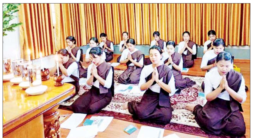
အောင်ခြင်းရှစ်ပါးနှင့် ပရိတ်ကြီး(၁၁)သုတ်မှ ရွတ်ဆို ပူဇော်ပေးခဲ့ကြကြောင်း သိရသည်။ ဓဇဂ္ဂသုတ်တော် မြန်မာပြန်ကို ဆက်လက် မြို့နယ်(ပြန်/ဆက်)

ထားဝယ် ဇန်နဝါရီ ၂၆ တနင်္သာရီတိုင်းဒေသကြီး ထားဝယ်မြို့နယ်အတွင်းဘေးအန္တရာယ်ကင်းရှင်းစေရေး ရည်ရွယ်၍ ယနေ့နံနက်ပိုင်းက တိုင်းဒေသကြီး/ခရိုင်/မြို့နယ်အထွေထွေအုပ်ချုပ်ရေးဦးစီးဌာနရုံးများနှင့် ပန်းသုံးဘုန်းတော်ကြီးကျောင်းတွင် အန္တရာယ်ကင်းပရိတ်တရားတော်များ ရွတ်ဖတ်ပူဇော်ခဲ့ကြောင်း သိရသည်။ ထို့နောက် သံဃာတော်များ၊ ဌာနဆိုင်ရာ ဝန်ထမ်းများ၊ ဝတ်ရွတ်အသင်းများနှင့် ရုပ်မိရပ်ဖများက အပြင်အောင်ခြင်းရှစ်ပါး၊ အတွင်းအောင်ခြင်းရှစ်ပါး၊ ပါဠိတော်များနှင့် ပရိတ်ကြီး(၁၁)သုတ်မှ ဓဇဂ္ဂသုတ်အား ရွတ်ဆိုပူဇော်ပေးကြပြီး ဝတ်အသင်းများက အပြင်