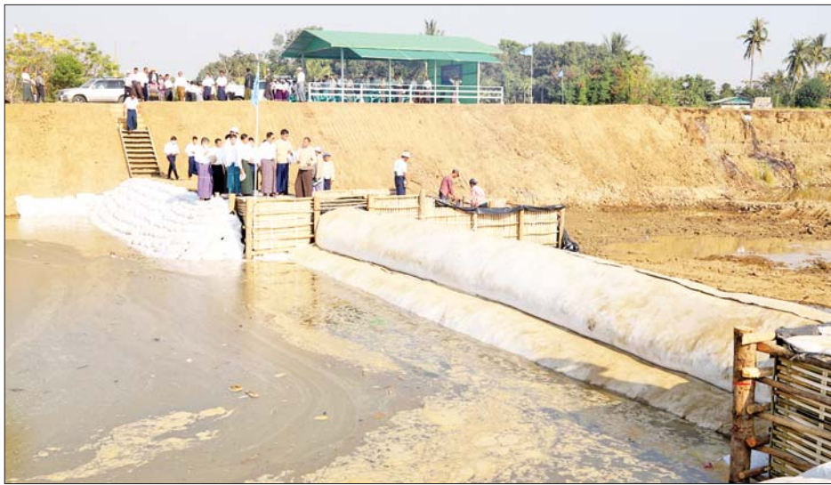
ရေအသုံးချမှု စီမံခန့်ခွဲရေးဦးစီးဌာန တာဝန်ရှိသူများ က လုပ်ငန်းအကောင်အထည်ဖော် ဆောင်ရွက်နေမှု များကို ရှင်းလင်းတင်ပြကြသည်။

နေပြည်တော် ဇန်နဝါရီ ၂၆ ကျေးလက်နေပြည်သူများ၏ ဝင်ငွေနှင့် လူနေမှု ဘဝမြှင့်တင်ရေးအတွက် နိုင်ငံတော်အစိုးရ၏ စီမံကိန်းညွှန်ကြားမှုနှင့် မိမိတို့ဝန်ကြီးဌာနက ကြိုးပမ်း အကောင်အထည်ဖော်လျက်ရှိရာ ဒေသနေပြည်သူ များအနေဖြင့် လုံလောက်မှုမရှိသည့် ရာစုပေါင်း ဆောင်ရွက်ကြရန်လိုကြောင်း ယနေ့ ညနေပိုင်းက လယ်ဝေးမြို့နယ် ဝတ္တမူကျေးရွာအုပ်စုနှင့် ညီပင် ကျေးရွာအုပ်စုတို့မှ ဒေသနေပြည်သူများနှင့် တွေ့ဆုံ စဉ်စိုက်ပျိုးရေး၊ မွေးမြူရေးနှင့် ဆည်မြောင်းဝန်ကြီး ဌာနနှင့် သမဝါယမနှင့် ကျေးလက်ဖွံ့ဖြိုးရေးဝန်ကြီး ဌာန ပြည်ထောင်စုဝန်ကြီး ဦးလှမိုးက ပြောကြား သည်။