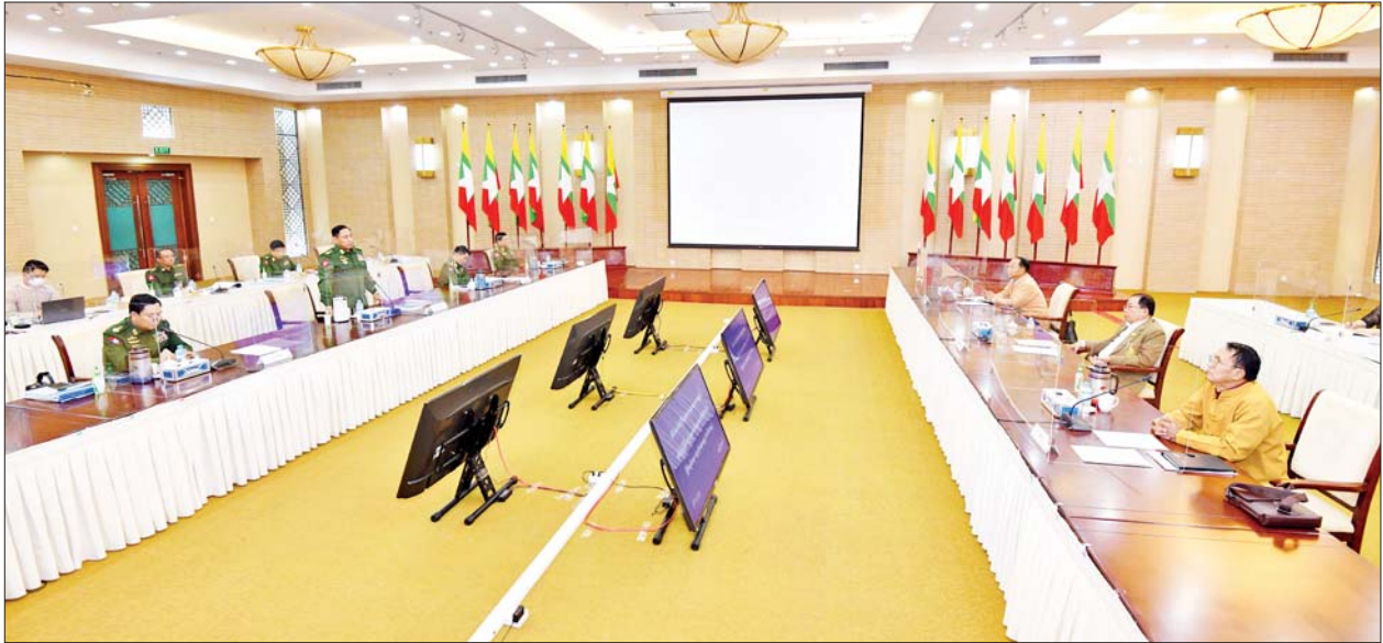
တွေ့ဆုံဆွေးနွေးပွဲတွင် သုံးရက်တာ ဆွေးနွေးညှိနှိုင်းချက်များအရ နှစ်ဖက်သဘောထားတူညီပြီး အပြီးသတ်ရရှိလာသည့် သဘောတူ ညီချက်များကို အတည်ပြု လက်မှတ်ရေးထိုးပြီး အပြန်အလှန် လဲလှယ် ခဲ့ကြသည်။ ယင်းနောက် တက်ရောက်လာကြသည့် သျှမ်းပြည်ပြန်လည် ထူထောင်ရေးကောင်စီ (RCSS) ဥက္ကဋ္ဌ ဗိုလ်ချုပ်ကြီးယွက်စစ်နှင့် ငြိမ်းချမ်းရေးဆွေးနွေးရေးအဖွဲ့ခေါင်းဆောင် ဒုတိယဗိုလ်ချုပ်ကြီး ရာပြည့်တို့က နိဂုံးချုပ်အမှာစကားပြောကြားခဲ့ကြကာ လက်ဆောင် ပစ္စည်းများ အပြန်အလှန်ပေးအပ်ခဲ့ကာ အမှတ်တရ မှတ်တမ်းတင် ဓာတ်ပုံရိုက်ကူးခဲ့ကြောင်း သိရသည်။ သတင်းစဉ်

နေပြည်တော် ဇန်နဝါရီ ၂၆ နိုင်ငံတော်၏ငြိမ်းချမ်းရေးဆွေးနွေးရေးအဖွဲ့နှင့် သျှမ်းပြည်ပြန်လည် ထူထောင်ရေးကောင်စီ (RCSS) ဥက္ကဋ္ဌ ဦးဆောင်သော ငြိမ်းချမ်းရေး ကိုယ်စားလှယ်အဖွဲ့တို့ တွေ့ဆုံဆွေးနွေးပွဲ တတိယနေ့ကို ယနေ့ နံနက်ပိုင်းတွင် နေပြည်တော်ရှိ အမျိုးသားစည်းလုံးညီညွတ်ရေးနှင့် ငြိမ်းချမ်းရေး ဖော်ဆောင်မှုဗဟိုဌာန၌ ကျင်းပသည်။ တက်ရောက် တွေ့ဆုံဆွေးနွေးပွဲသို့ နိုင်ငံတော်စီမံအုပ်ချုပ်ရေးကောင်စီ အဖွဲ့ဝင်၊ ပြည်ထောင်စုအစိုးရအဖွဲ့ရုံးဝန်ကြီးဌာန ပြည်ထောင်စုဝန်ကြီး၊ အမျိုးသားစည်းလုံးညီညွတ်ရေးနှင့် ငြိမ်းချမ်းရေး ဖော်ဆောင်မှုညွှန်ကြား ရေးကော်မတီဥက္ကဋ္ဌ၊ ငြိမ်းချမ်းရေးဆွေးနွေးရေးအဖွဲ့ ခေါင်းဆောင် ဒုတိယ ဗိုလ်ချုပ်ကြီး ရာပြည့်၊ အဖွဲ့ဝင်များဖြစ်ကြသည့် နိုင်ငံတော်စီမံ အုပ်ချုပ်ရေးကောင်စီအဖွဲ့ဝင် ဒုတိယဗိုလ်ချုပ်ကြီး မိုးမြင့်ထွန်း၊ အမျိုးသားစည်းလုံးညီညွတ်ရေးနှင့် ငြိမ်းချမ်းရေး ဖော်ဆောင်မှု ညွှန်ကြား ရေးကော်မတီ အတွင်းရေးမှူး ဒုတိယဗိုလ်ချုပ်ကြီး မင်းနောင်၊ ညွှန်ကြား ရေးကော်မတီအဖွဲ့ဝင် ဒုတိယဗိုလ်ချုပ်ကြီး ဝင်းဗိုလ်ရှိန်နှင့် သျှမ်းပြည် ပြန်လည်ထူထောင်ရေးကောင်စီ (RCSS) ဥက္ကဋ္ဌ ဗိုလ်ချုပ်ကြီး ယွက်စစ်၊ ဗဟိုအလုပ်အမှုဆောင်ကော်မတီဝင်များ ဖြစ်ကြသည့် စစ်ဆောင်းဟန်၊ စစ်အုခခေနှင့် ငြိမ်းချမ်းရေးဆွေးနွေးရေး ကိုယ်စားလှယ်များ တက်ရောက် ကြသည်။