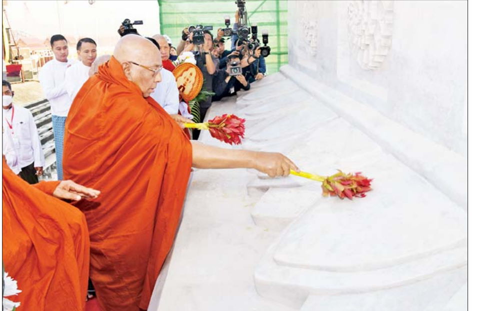
သီတဂူကမ္ဘာ့ဗုဒ္ဓတက္ကသိုလ်များ၏ အိမ်ပတိ အဘိဓဇမဟာရဋ္ဌဂုရု အဘိဓဇအဂ္ဂမဟာသဒ္ဓမ္မဇောတိက မဟာဓမ္မကထိက ဗဟုဇနဟိတဓရ ရွှေကျင်နိကာယဥက္ကဋ္ဌ ရွှေကျင်သာသနာပိုင် သီတဂူဆရာတော်ကြီး ဒေါက်တာဘဒ္ဒန္တဉာဏိဿရ ရတနာပလ္လင်တော်အား ပရိတ်နံ့သာရည်များ ပက်ဖျန်းပူဇော်၍ သိဒ္ဓိမင်္ဂလာ ဆင်ယင်စဉ်။

ဇရိုးဖုံးမှ ဦးစွာ အခမ်းအနားကို နမောတဿ သုံးကြိမ်ရွတ်ဆို ဘုရားကန်တော့ ဖွင့်လှစ်ပြီး မာရဝိဇယ ဗုဒ္ဓပူဇာဘွဲ့သီချင်းဖြင့် သီကျုံးပူဇော်၍ မင်္ဂလာဓဋ္ဌခရူ၊ အောင်စည် အောင်မောင်းတို့ကို အောင်ကြောင်း မင်္ဂလာအဖြစ် သုံးကြိမ် တီးခတ်ပူဇော်ကြသည်။ ထို့နောက် တက်ရောက်လာကြ သည့် ဧည့်ပရိသတ်များက ဆရာတော်ကြီးများ ရွတ်ပွား သရဇ္ဈာယ်တော် မူကြသည့် သမန္တာမှစ၍ မေတ္တာသုတ်၊ အာဇ္ဇာနာဠိယသုတ်၊ ဓဇဂ္ဂသုတ်၊ ပုဗ္ဗဏှသုတ် ပရိတ်တော်များနှင့် ဇယမင်္ဂလာ ဂါထာတော်များကို နာယူကြည်ညိုကြပြီး ဘုရား ဒါယကာ၊ ဒါယိကာမများက ရတနာပလ္လင်တော်နှင့် သဗ္ဗသင်္ဂါဟက မေတ္တာပိုလင်္ကာ တို့ကို သံပြိုင်ညီညာ ရွတ်ဆိုပွား များ ပူဇော်ကြသည်။ ယင်းနောက် ဆရာတော်ကြီး များ အမျိုးပြု၍ ဦးဆောင်ဘုရား ဒါယကာ နိုင်ငံတော်စီမံအုပ်ချုပ် ရေးကောင်စီဥက္ကဋ္ဌ နိုင်ငံတော် ဝန်ကြီးချုပ်နှင့် အဖွဲ့ဝင်များ က ရတနာပလ္လင်တော်အနီးရှိ