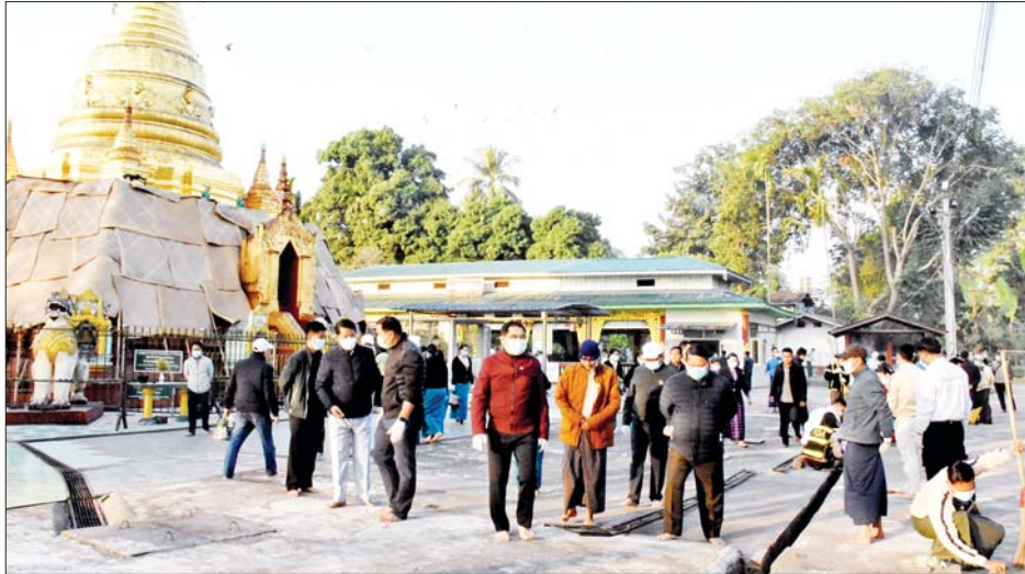
အဖွဲ့အစည်းများ၊ စည်ပင်သာယာရေး ဝန်ထမ်းများ၊ စုပေါင်း၍ ဘုရားဝန်းကျင် သန့်ရှင်းသာယာလှပစေရန် သစ်ပင်ချုံ့ဖြတ်မှုများ ခုတ်ထွင်ရှင်းလင်းခြင်း။

မြစ်ကြီးနား ဇန်နဝါရီ ၂၆ ကချင်ပြည်နယ်အစိုးရအဖွဲ့က ဦးဆောင်၍ မြစ်ကြီးနားမြို့ရှိ သမိုင်းဝင်စေတီပုထိုးများတွင် ဘုရားဖူးလာရောက်ကြမည့် ရဟန်း၊သံဃာတော်များနှင့် အများပြည်သူများ စိတ်အေးချမ်းသာစွာ တရားဘာဝနာပွားများ၍ ဖူးမြော်ကြည့်နိုင်စေရန်နှင့် ဘုရားဝန်းကျင် သန့်ရှင်းသာယာလှပစေရန်အတွက် ဇန်နဝါရီ ၂၆ ရက် နံနက် ၇ နာရီခွဲက စုပေါင်းသန့်ရှင်းရေး ဆောင်ရွက်ကြသည်။ ထိုသို့ စုပေါင်းသန့်ရှင်းရေးလုပ်ငန်းများကို ပြည်နယ်ဝန်ကြီးချုပ် ဦးခက်ထိန်နန်နှင့် ဇနီးဒေါ်နန်းဆိုင်၊ ပြည်နယ်တရားလွှတ်တော်တရားသူကြီးချုပ်၊ ပြည်နယ်ဝန်ကြီးများနှင့် ၎င်းတို့၏ ဇနီးများ၊ ဌာနဆိုင်ရာတာဝန်ရှိသူများက မြစ်ကြီးနားမြို့လောကမာရ်အောင် ဆုတောင်းပြည့်စေတီတော်ဘုရားပရိဝုဏ်အတွင်းနှင့် အပြင်တို့တွင် ဌာနဆိုင်ရာ