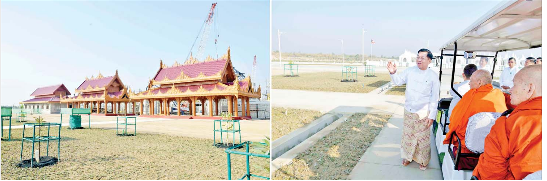
ဆရာတော်ကြီးများ အမှူးပြု၍ မာရဝိဇယဗုဒ္ဓဥယျာဉ်တော်အတွင်း တည်ဆောက်ပြီးစီးမှုအခြေအနေများကို လှည့်လည်ကြည့်ရှုခဲ့ရာ နိုင်ငံတော်စီမံအုပ်ချုပ်ရေးကောင်စီဥက္ကဋ္ဌ နိုင်ငံတော်ဝန်ကြီးချုပ် ဗိုလ်ချုပ်မှူးကြီးမင်းအောင်လှိုင် ဆရာတော်ကြီးများ၏ သိရှိလိုသည်များကို ရှင်းလင်းလျှောက်ထားပြီး ဆရာတော်ကြီးများ၏ ဩဝါဒကို ခံယူစဉ်။