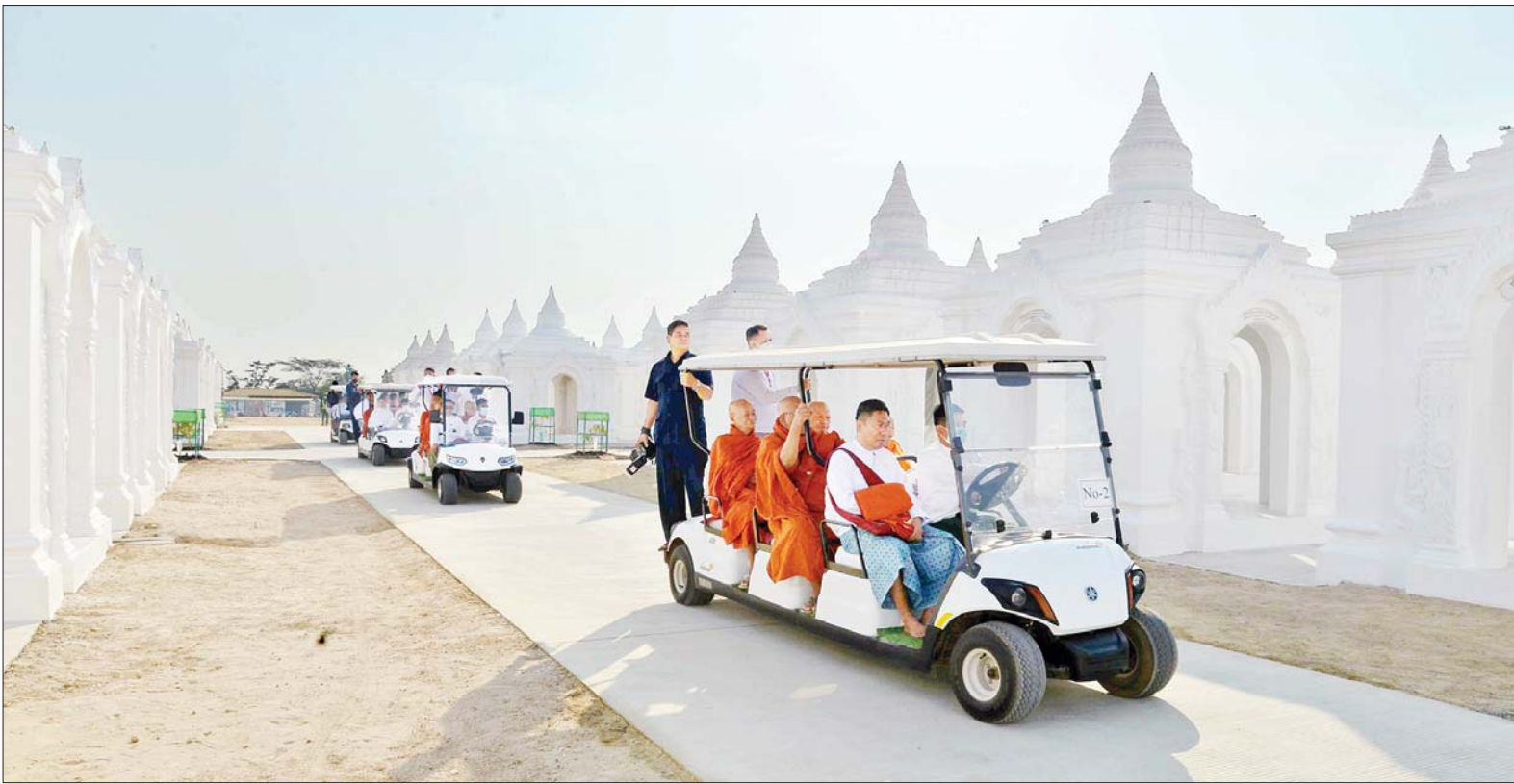
ဆရာတော်ကြီးများ အမှူးပြု၍ မာရဝိဇယဗုဒ္ဓဥယျာဉ်တော်အတွင်း တည်ဆောက်ပြီးစီးမှုအခြေအနေများကို လှည့်လည်ကြည့်ရှုစဉ်။

ဆရာတော်ဘုရားကြီး၊ သီတဂူ ဆရာတော်ဘုရားကြီးတို့ အမှူးပြု သည့် သံဃာတော်များထံမှ ဩဝါဒ များကို ခံယူသည်။