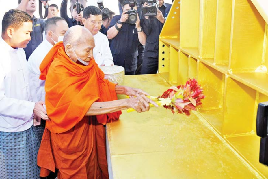
နိုင်ငံတော်သံဃမဟာနာယကအဖွဲ့ဥက္ကဋ္ဌ မန္တလေးမြို့ ဗန်းမော်ကျောင်းတိုက်ဆရာတော် အဘိဓဇ မဟာရဋ္ဌဂုရု အဘိဓဇ အဂ္ဂမဟာ သဒ္ဓမ္မဇောတိက ဒေါက်တာဘဒ္ဒန္တကုမာရာဘိဝံသ ရတနာပလ္လင်တော် အထောက်အကူပြု သံမဏိစင်အား ပရိတ်နံ့သာရည်များ ပက်ဖျန်းပူဇော်၍ သိဒ္ဓိမင်္ဂလာ ဆင်ယင်စဉ်။