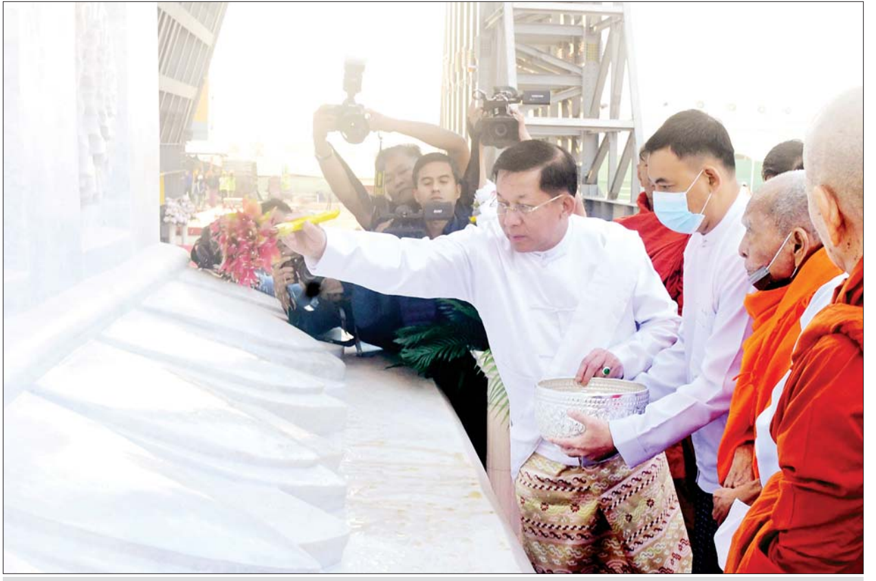
နိုင်ငံတော်စီမံအုပ်ချုပ်ရေးကောင်စီဥက္ကဋ္ဌ နိုင်ငံတော်ဝန်ကြီးချုပ် ဗိုလ်ချုပ်မှူးကြီး မင်းအောင်လှိုင် ရတနာပလ္လင်တော်အား ပရိတ်နံ့သာရည် များ ပက်ဖျန်းပူဇော်၍ သိဒ္ဓိမင်္ဂလာ ဆင်ယင်စဉ်။

သတ်မှတ်နေရာများတွင် နေရာ ယူကြပြီး ရတနာပလ္လင်တော်၊ ရတနာပလ္လင်တော် အထောက် အကူပြုသံမဏိစင်၊ ဆင်းတုတော် ထည့်သွင်းထားသည့် သံမဏိ ပန်းတောင်း၊ ဆင်းတုတော် အား ရတနာပလ္လင်တော်ထက်သို့ ပင့်ဆောင်ပူဇော်မည့် သံမဏိ မျှော်စင်ကရိန်း နေရာလေးခုတို့ အား ပရိတ်နံ့သာရည်များ ပက်ဖျန်းပူဇော်၍ သိဒ္ဓိမင်္ဂလာ ဆင်ယင်သည်။ စတင် ပင့်ဆောင်ပူဇော် ဆက်လက်၍ အခမ်းအနားမှူး က မင်္ဂလာအခါတော်စာတမ်းကို ဖတ်ကြားပြီး မင်္ဂလာအချိန်တော် တွင် ဦးဆောင်ဘုရားဒါယကာ နိုင်ငံတော် စီမံအုပ်ချုပ်ရေး ကောင်စီဥက္ကဋ္ဌ နိုင်ငံတော်ဝန်ကြီး ချုပ်က မာရဝိဇယဗုဒ္ဓရုပ်ပွားတော် မြတ်ကြီးအား ရတနာပလ္လင်တော် ထက်သို့ စက်ခလုတ်နှိပ်၍ မင်္ဂလာ စက်ယန္တရားများဖြင့် စတင် ပင့်ဆောင်ပူဇော်သည်။ ထို့နောက်မာရဝိဇယဗုဒ္ဓရုပ်ပွား တော်မြတ်ကြီးအား ရတနာပလ္လင် တော်ထက်သို့ ပင့်ဆောင်ခြင်း လုပ်ငန်းများကို လုပ်ငန်းစဉ် အလိုက် ဆက်လက်ဆောင်ရွက်ရာ