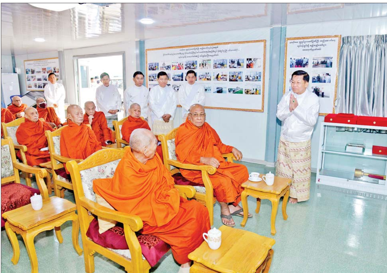
နိုင်ငံတော်စီမံအုပ်ချုပ်ရေးကောင်စီဥက္ကဋ္ဌ နိုင်ငံတော်ဝန်ကြီးချုပ် ဗိုလ်ချုပ်မှူးကြီးမင်းအောင်လှိုင် ဗုဒ္ဓဥယျာဉ်တော်အတွင်းရှိ ရှင်းလင်း ဆောင်၌ ဗန်းမော်ဆရာတော်ကြီး၊ သီတဂူဆရာတော်ကြီးတို့ အမှူးပြုသည့် သံဃာတော်များထံမှ ဩဝါဒများ ခံယူစဉ်။

ယင်းနောက် နိုင်ငံတော်စီမံ အုပ်ချုပ်ရေးကောင်စီ ဥက္ကဋ္ဌ နိုင်ငံတော်ဝန်ကြီးချုပ်နှင့် အခမ်း အနား တက်ရောက်လာကြသူများ သည် ဗုဒ္ဓဥယျာဉ်တော်အတွင်းရှိ ရှင်းလင်းဆောင်၌ မာရဝိဇယဗုဒ္ဓ ရုပ်ပွားတော်မြတ်ကြီးတည်ဆောက် ခြင်း၊ ဗုဒ္ဓဥယျာဉ်တော်အတွင်း ရှိ သာသနိကအဆောက်အအုံများ ထည့်သွင်း တည်ဆောက်ခြင်း၊ ပိဋကတ်ကျမ်းစာအုပ်များကို ပါဠိ အက္ခရာနှင့် Romanize Language တို့ဖြင့် ရိုက်နှိပ်ရန် စီမံဆောင်ရွက် ခြင်းတို့နှင့်ပတ်သက်၍ ဗန်းမော်