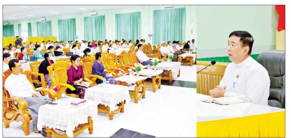
ဆောင်ရွက်ရမည့်လုပ်ငန်းစဉ်များကို လည်းကောင်း လိုအပ်သည်များ ပေါင်းစပ်ညှိနှိုင်းပေးခဲ့သည်။ ဆွေးနွေးတင်ပြခဲ့ကြပြီး ပြည်ထောင်စုဝန်ကြီးက သတင်းစဉ်

ဆွေးနွေးတင်ပြ ယင်းအစည်းအဝေးတွင် ဒုတိယဝန်ကြီး ဒေါက်တာဇော်မြင့်က သတ်မှတ်ကာလအတွင်း ရှေ့ဆက်ဆောင်ရွက်ရမည့်လုပ်ငန်းစဉ်ကို လည်း ကောင်း၊ စာစစ်မျိုးချုပ်များက ဘာသာရပ်အလိုက်