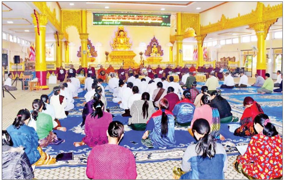
အလေးထားဆောင်ရွက်ရန်နှင့် စိုက်ပျိုးထားသည့် အရိပ်ရအပင်များ ပျက်စီးမှုမရှိ ရှင်သန်ထိန်းသိမ်း ရေးတို့ကို အလေးထားဆောင်ရွက်ရန် မှာကြားခဲ့ ကြောင်း သိရသည်။ သတင်းစဉ်

၎င်းနောက် တိုင်းဒေသကြီးဝန်ကြီးချုပ်နှင့်အဖွဲ့ သည် မဟာလောကမာရဇိန်စေတီကုသိုလ်တော် မြတ်စွာဘုရားပရိဂုဏ်တွင်စုပေါင်းသန့်ရှင်းရေးဆောင် ရွက်နေမှုများနှင့် ထုံးသင်္ကန်းဆက်ကပ်နေမှုများကို လိုက်လံကြည့်ရှုကာ ဘုရားဖူးများစိတ်ချမ်းမြေ့စွာ ဖူးမြော်ရေး၊ အမြဲသန့်ရှင်းသပ်ရပ်ရေးတို့ကို