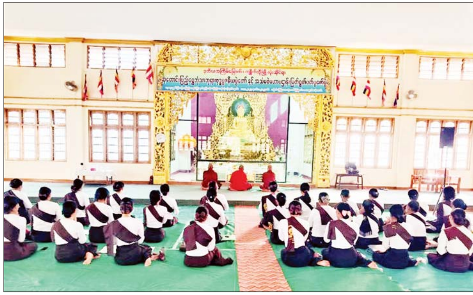
တော်ကြီးများက ဦးစီးအမှူးပြု၍ အတွင်းအောင်ခြင်း(၈) ပါး၊ အပြင်အောင်ခြင်း (၈)ပါး (ပါဠိတော်)၊ ပရိတ်ကြီး (၁၁)သုတ်မှ ဓဇဂ္ဂသုတ္တ တရားတော်များကို ပါဠိတော် ရွတ်ဖတ်ပူဇော်ခြင်းကို နာယူကြည့်သို့ခဲ့ကြပြီး စေတီတော်မြတ်ကြီး၏ စောင်းတန်းများတွင် ဝတ် အသင်းအဖွဲ့များက အတွင်းအောင်ခြင်း(၈)ပါး၊ အပြင်အောင်ခြင်း (၈)ပါး (ဘာသာပြန်)၊ ပရိတ်ကြီး(၁၁) သုတ်မှဓဇဂ္ဂသုတ္တတရားတော်များကို တစ်ပြိုင်တည်း ရွတ်ဖတ်ပူဇော်ခဲ့ကြကြောင်း သိရသည်။ အလားတူ မွန်ပြည်နယ်အတွင်းရှိ စေတီတော်