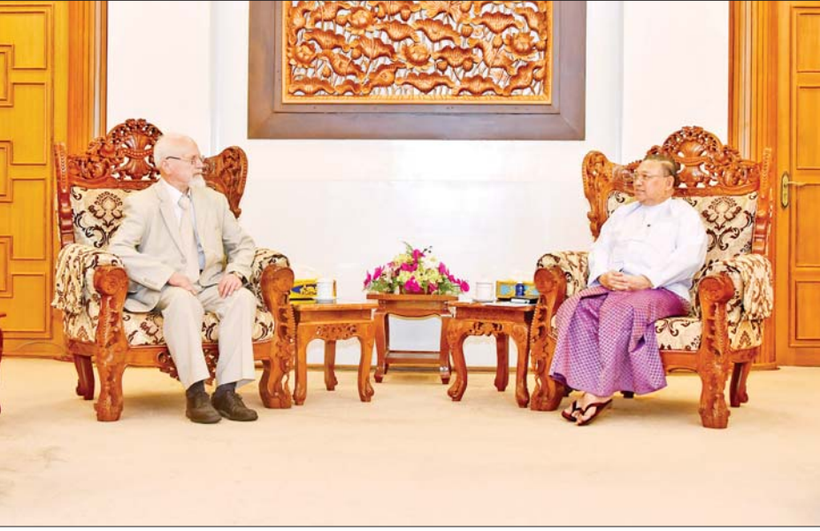
ဘဏ္ဍာရေးကဏ္ဍများတွင် ပူးပေါင်းဆောင်ရွက်မှုများ တိုးမြှင့်နိုင်မည့်အခြေအနေများနှင့် စပ်လျဉ်း၍ နှစ်ဖက်အမြင်ချင်းဖလှယ် ဆွေးနွေးခဲ့ကြသည်။ တွေ့ဆုံပွဲသို့ နိုင်ငံခြားရေးဝန်ကြီးဌာနမှ အမြဲတမ်း အတွင်းဝန်နှင့် အဆင့်မြင့်အရာရှိကြီးများနှင့် ရုရှား- မြန်မာချစ်ကြည်ရေးနှင့် ပူးပေါင်းဆောင်ရွက်ရေး အသင်းမှ ကိုယ်စားလှယ်များ တက်ရောက်ကြသည်။ သတင်းစဉ်

နေပြည်တော် ဇန်နဝါရီ ၂၆ နိုင်ငံခြားရေးဝန်ကြီးဌာန ပြည်ထောင်စုဝန်ကြီး ဦးဝဏ္ဏမောင်လွင်သည် ရုရှား-မြန်မာ ချစ်ကြည်ရေး နှင့်ပူးပေါင်းဆောင်ရွက်ရေးအသင်း ဒုတိယဥက္ကဋ္ဌ မစ္စတာ အန်နာသိုလီ ဘူးလော့ချ် နီကော့ ဦးဆောင် သော ကိုယ်စားလှယ်အဖွဲ့အား ယနေ့နံနက် ၁၁ နာရီခွဲတွင် နေပြည်တော်ရှိ နိုင်ငံခြားရေးဝန်ကြီး ဌာန၌ လက်ခံတွေ့ဆုံသည်။ တွေ့ဆုံစဉ် ပြည်ထောင်စုဝန်ကြီးက မြန်မာ- ရုရှားနှစ်နိုင်ငံ သံတမန်ဆက်ဆံရေးထူထောင်မှုသည် (၇၅)နှစ် စိန်ရတနာပတ်လည်သို့ ရောက်ရှိပြီ ဖြစ်ကြောင်း၊ ၂၀၂၂ ခုနှစ် စက်တင်ဘာလ အတွင်းက ရုရှားနိုင်ငံ ဗလာဒီဗော့စတော့မြို့၌ ပြုလုပ်ခဲ့သည့် အရှေ့ဖျား စီးပွားရေးဖိုရမ် ကာလအတွင်း နှစ်နိုင်ငံ အကြီးအကဲများ တွေ့ဆုံခဲ့မှုမှတစ်ဆင့် စီးပွားရေး ဆိုင်ရာ ပူးပေါင်းဆောင်ရွက်မှုများ အရှိန်မြှင့် ဆောင်ရွက်လျက်ရှိကြောင်း စသည်ဖြင့် ဆွေးနွေး ပြောကြားခဲ့သည်။ ဆက်လက်၍ နှစ်နိုင်ငံအကြား ပို့ဆောင်ရေး၊ ခရီးသွားလုပ်ငန်း၊ လျှပ်စစ်၊ စွမ်းအင်၊ ကုန်သွယ်ရေးနှင့်