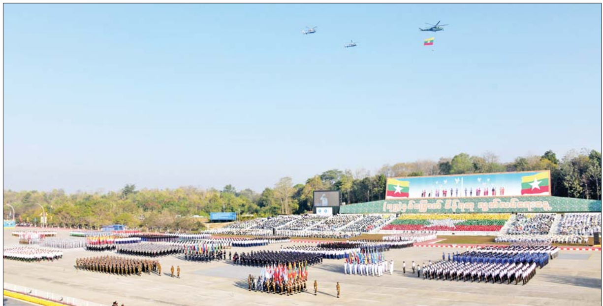
(၇၅)နှစ်မြောက် စိန်ရတုလွတ်လပ်ရေးနေ့အခမ်းအနားတွင် ချီတက်အလေးပြုကြသည့် ဂုဏ်ပြုစစ်ကြောင်းများကို တွေ့ရစဉ်။

မြန်မာပြည်ကြီးကား လွတ်လပ်ရေးရခဲ့ပေပြီ။ သို့ရာတွင် လွတ်လပ်သောမြန်မာပြည်သည် ညီညွတ် ငြိမ်းချမ်းပါ၏လော။ အမှန်စင်စစ် ညီညွတ်ငြိမ်းချမ်း မှုမရှိသည့်အပြင် အယူဝါဒအမျိုးမျိုးကိုအခြေခံ၍ ပြည်တွင်းလက်နက်ကိုင် သောင်းကျန်းသူများ ပေါ်ပေါက်လာကာ တိုင်းပြည်သည် ဖရိုဖရဲနှင့် ပြိုကွဲ လုမတတ်ယိုင်နဲ့ခဲ့ရသည်မှာ အကြိမ်ကြိမ်အခါခါ ကြုံကြိုက်ခဲ့ရပြီဖြစ်