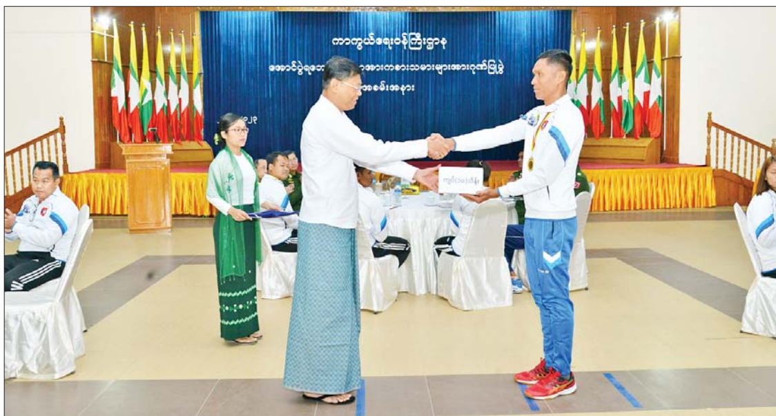
နိုင်ငံတော်စီမံအုပ်ချုပ်ရေးကောင်စီအဖွဲ့ဝင် ပြည်ထောင်စုဝန်ကြီး ဗိုလ်ချုပ်ကြီး မြထွန်းဦးက အောင်ပွဲရ ကာကွယ်ရေးဝန်ကြီးဌာန ကိုယ်စားပြု အမျိုးသားဘော်လီဘောအသင်းနှင့် အမျိုးသမီးဘော်လီဘောအသင်းကို ဂုဏ်ပြုချီးမြှင့်ငွေများ ပေးအပ်ချီးမြှင့်စဉ်။

ဝမ်းသာပီတိဖြစ် ဦးစွာ ကာကွယ်ရေးဝန်ကြီးဌာန ပြည်ထောင်စုဝန်ကြီး ဗိုလ်ချုပ်ကြီး မြထွန်းဦးက ဂုဏ်ပြုအမှာစကားပြောကြားရာတွင် တစ်မျိုးသားလုံး ကျန်းမာကြံ့ခိုင်မှု အဆင့်အတန်းမြင့်မားလာစေရန်နှင့် ဝန်ကြီးဌာနပေါင်းစုံ အားကစားပြိုင်ပွဲမှတစ်ဆင့် နိုင်ငံ့ဂုဏ်ဆောင်နိုင်သည့် ဘော်လီဘောအားကစားသမားကောင်းများ ပေါ်ထွက်လာစေရန် နိုင်ငံတော်က ရည်ရွယ်ကျင်းပပေးခဲ့သည့် ပြိုင်ပွဲတွင် မိမိတို့ဝန်ကြီးဌာနမှ အားကစားမောင်မယ်များ အနေဖြင့် ထိုက်ထိုက်တန်တန် ဆုဖလားများကို ဆွတ်ခူးနိုင်ခဲ့သည့်အတွက် ဝမ်းသာဂုဏ်ယူပီတိဖြစ်ရပါကြောင်း၊ ကာကွယ်ရေးဝန်ကြီးဌာနကိုယ်စားပြု အားကစားသမားများ အနေဖြင့် ဘော်လီဘောပြိုင်ပွဲတွင်သာမက အခြားသောပြိုင်ပွဲများတွင် ဝင်ရောက်ယှဉ်ပြိုင်ခဲ့ပြီး ဆုတံဆိပ်များရယူခဲ့ရာ နိုင်ငံ့ဂုဏ်၊ ဌာန၏ဂုဏ်တို့ကို မြှင့်တင်ပေးခဲ့သည်ကို ဂုဏ်ယူစွာတွေ့ရှိခဲ့ရပါကြောင်း၊ အားကစားသမားကောင်းများ