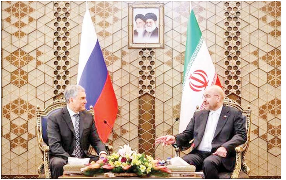
ထို့ပြင် အမေရိကန်၏ အရေးယူပိတ်ဆို့မှုများကြောင့် ရုရှားနှင့် အီရန်အကြား ဆက်ဆံရေးပိုမိုခိုင်မာလာကြောင်း ၎င်းကပြောကြားသည်။ ကိုးကား-ဆင်ဟွာ၊ ဘာသာပြန်-စိုးသူရ

နှင့် သဘာဝဓာတ်ငွေ့ကဏ္ဍတွင် ပူးပေါင်းဆောင်ရွက်မှုနှင့် ရင်းနှီးမြှုပ်နှံမှုများ တိုးမြှင့်ဆောင်ရွက်ရေး ဆွေးနွေးခဲ့ကြသည်။ ထို့ပြင် နှစ်နိုင်ငံအကြား စိုက်ပျိုးရေး၊ ခေတ်မီနည်းပညာများဖလှယ်ရေး၊ ဘဏ်လုပ်ငန်းနှင့် ငွေကြေးကဏ္ဍတွင် ပူးပေါင်းဆောင်ရွက်ရေး အမြင်ချင်းဖလှယ် ဆွေးနွေးခဲ့ကြသည်။ ထို့ပြင် ရုရှားနှင့် အီရန်နိုင်ငံရှိဘဏ်များအနေဖြင့် နှစ်နိုင်ငံစလုံးတွင် ဘဏ်များအပြန်အလှန်ဖွင့်လှစ်ခြင်းဖြင့် ငွေကြေးသုံးစွဲမှု အဆင်ပြေလာမည်ဖြစ်ပြီး ကုန်သွယ်ရေးလုပ်ငန်းများ တိုးတက်လာနိုင်သောကြောင့် ဘဏ်များအပြန်အလှန် ဖွင့်လှစ်ဆောင်ရွက်ကြရေးအတွက် ကွာလီဘတ်က တိုက်တွန်းပြောကြားခဲ့သည်။ ရုရှားနှင့် အီရန်အကြား ဆက်ဆံရေးသည် လက်ရှိတွင် တိုးတက်လျက်ရှိပြီး ကဏ္ဍစုံပူးပေါင်းဆောင်ရွက်မှုများ မြှင့်တင်လျက်ရှိကြောင်း ရုရှားနူးမား လွတ်တော်ဥက္ကဋ္ဌ Volodin ကပြောကြားသည်။