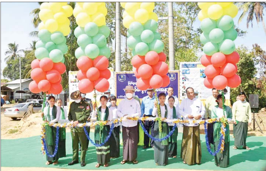
စုပေါင်းမှတ်တမ်းဓာတ်ပုံများ ရိုက်ကူးကြပြီး စစ်ဆေးသည်။ အဆိုပါကျေးရွာ၌ လှုပ်စစ်မီးဖွင့်လှစ်ပေးခြင်းကြောင့် အိမ်ခြေ ၆၉ အိမ်၊ အိမ်ထောင်စု ၆၉ စုတို့ လှုပ်စစ်မီးများ စတင်သုံးစွဲ

ဦးစွာ တိုင်းဒေသကြီးဝန်ကြီးချုပ်နှင့် တာဝန်ရှိသူများက ငွေဆောင်မြို့ ကြက်တူရွေးကျေးရွာ၌ ၂၀၂၀-၂၀၂၁ တိုင်းဒေသကြီးဘဏ္ဍာရန်ပုံငွေဖြင့် ၁၁/၀.၄ ကေဗွီ၊ ၂၀၀ ကေဗွီအေ ထရန်စဖော်မာ တည်ဆောက်ပေးပြီး ကျေးရွာမှကိုယ်တူကိုယ်ထုဖြင့် ၄၀၀ ဗို့ဓာတ်အားလိုင်း သွယ်တန်းဆောင်ရွက်သည့် ကျေးရွာလှုပ်စစ်မီး ဖွင့်ပွဲအခမ်းအနားကို ဖဲကြိုးဖြတ်ဖွင့်လှစ်ပေးကာ လှုပ်စစ်မီးအား မီးခလုတ်နှိပ်ဖွင့်လှစ်ပြီး ကမ္ဘာ့မော်ကွန်းအား အမွှေးနံ့သာရည်များ ပက်ဖျန်းပေးခဲ့သည်။ ယင်းနောက် လှုပ်စစ်မီးဖွင့်ပွဲအခမ်းအနားသို့ တက်ရောက်လာသူများနှင့်အတူ