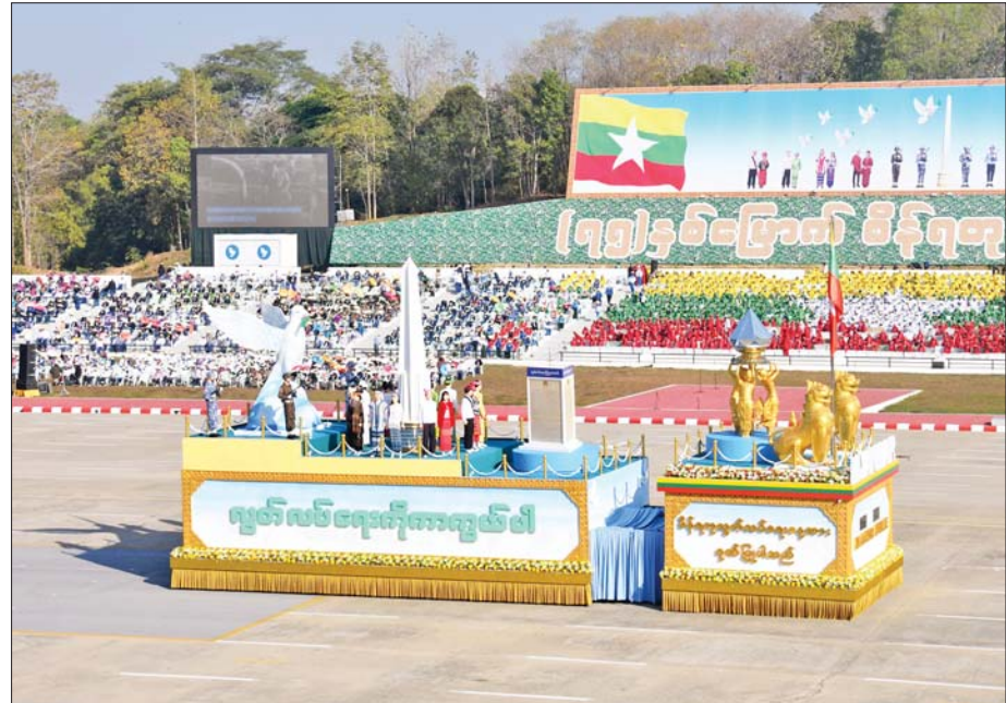
(၇၅)နှစ်မြောက် စိန်ရတုလွတ်လပ်ရေးနေ့အထိမ်းအမှတ် ဂုဏ်ပြုယာဉ်ကိုတွေ့ရစဉ်။

လွတ်လပ်ရေးဆိုသည်မှာ ရှိနေစဉ်မသိသာလှသော်လည်း လွတ်လပ်ရေး မရှိသည့်အခါ အလွန်ပင်သိသာလှပေသည်။ ကိုယ့်ခြံ ကိုယ့်အရိပ် ကိုယ့်အိမ်တွင် ကိုယ်မနားရခြင်း၊ ကိုယ်ဆန် ကိုယ်ထမင်း ကိုယ်ဟင်းကိုပင် ကိုယ်မစားရခြင်း၊ သူတစ်ပါးပြုသမျှ နှလေးခြင်းဟူသောအဖြစ်အပျက်များ ပေါ်ပေါက်လာပေလိမ့် မည်။ လွတ်လပ်ရေးဟူသည် ဆုံးရှုံးဖို့လွယ်ကူသလောက် ပြန်လည်ရရှိဖို့ ခက်ခဲလှ ပေသည်။ မြန်မာနိုင်ငံသည် ဆုံးရှုံးခဲ့ရသော လွတ်လပ်ရေးရရှိဖို့အတွက် တိုင်းရင်း သားပြည်သူတစ်ရပ်လုံး နှစ်ပေါင်းများစွာ တိုက်ပွဲဝင်တော်လှန်ခဲ့ရသည်။ အသက် ပေါင်းများစွာ ပေးဆပ်ခဲ့ကြရသည်။ ထို့ကြောင့် လွတ်လပ်ရေး၏တန်ဖိုး၊ လွတ်လပ် ရေး၏အနှစ်သာရကို မြန်မာပြည်သူတိုင်း အလေးဂရုပြုကာ အမြတ်တနိုးရှိနေပါမူ တော်ကတန်ကာကျပေလိမ့်မည်။