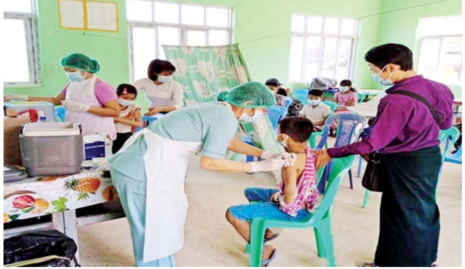
ရောဂါတိုင်းဒေသကြီး ကန်ကြီးထောင့်မြို့နယ်၌ ဇန်နဝါရီ ၂၃ ရက်က ကိုဗစ်-၁၉ ရောဂါ ကာကွယ် ဆေး ထိုးနှံပေးစဉ်။

အမေရိကန်ပြည်ထောင်စုတွင် အိုမီခရွန်ဗီဇ ပြောင်းလဲမှုရပ်စဲ XBB 1.5 သည် လျင်မြန်စွာ ကူးစက် ပျံ့နှံ့လျက်ရှိပြီး ကမ္ဘာ့ကျန်းမာရေးအဖွဲ့ကြီးကလည်း ကမ္ဘာတစ်ဝန်းလုံးတွင် ဆိုးရွားသည့် ကိုဗစ် - ၁၉ ကပ်ရောဂါလှိုင်းသစ်တစ်ခုအသွင် ဖြစ်ပေါ်မလာစေ ရေး ရောဂါ ကာကွယ်ထိန်းချုပ်ရေးလုပ်ငန်းများကို အရှိန်အဟုန်ဖြင့် ဆက်လက်ဆောင်ရွက်ကြရန် သတိပေးပြောဆိုလျက်ရှိသည်။