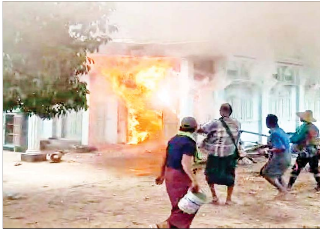
စစ်ကိုင်းတိုင်းဒေသကြီးရှိ မီးရှို့ခံရသည့် နေအိမ်များအား လုံခြုံရေးတပ်ဖွဲ့ဝင်များ၊ မီးသတ်တပ်ဖွဲ့ဝင်များနှင့် ကျေးရွာ ပြည်သူများ ပူးပေါင်း၍ မီးငြိမ်းသတ်နေစဉ်။

အကြမ်းဖက် အဖွဲ့အစည်းအဖြစ် သတ်မှတ်ထားသည့် NUG/PDF အဖွဲ့များ သည် နိုင်ငံတော်တည်ငြိမ်အေးချမ်းရေး နှင့် တရားဥပဒေစိုးမိုးရေး ပျက်ပြားစေရန် ရည်ရွယ်ချက်ဖြင့် စစ်ဘက်ပစ်မှတ် မဟုတ်သည့် အရပ်ဘက်ပစ်မှတ်များအား တိုက်ခိုက်ဖျက်ဆီးလျက်ရှိခြင်း၊ အပြစ်မဲ့ ပြည်သူများအား ဒလန်ဟုစွပ်စွဲပြီး အကြောင်းမဲ့ သတ်ဖြတ်ခြင်းများကို ပြုလုပ်လျက်ရှိသည့်အပြင် စစ်ကိုင်းတိုင်း ဒေသကြီးနှင့် ကချင်ပြည်နယ် ဆက်စပ် နယ်မြေအတွင်းရှိ ကျေးရွာများအား KIA သောင်းကျန်းသူအဖွဲ့များနှင့် ပူးပေါင်းပြီး မီးရှို့ဖျက်ဆီးမှုများကို ရည်ရွယ်ချက်ရှိရှိ ဆောင်ရွက်လျက်ရှိပါသည်။