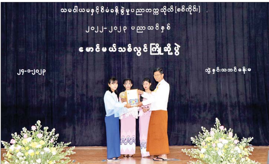
သမဝါယမနှင့် စီမံခန့်ခွဲမှုပညာတက္ကသိုလ် (စစ်ကိုင်း) ၂၀၂၂-၂၀၂၃ ပညာသင်နှစ် မောင်မယ်သစ်လွင်ကြိုဆိုပွဲ ၂၄-၀၂-၂၀၂၃ ထိုနေ့ည ၈ နာရီခန့်

ထူးချွန်စွာအောင်မြင်ခဲ့သော ကျောင်းသား ကျောင်းသူ များကို ဂုဏ်ပြုချီးမြှင့်ပေးအပ်ကြသည်။ ယင်းနောက် ဒုတိယဝန်ကြီးသည် သမဝါယမနှင့် စီမံခန့်ခွဲမှုပညာတက္ကသိုလ်(စစ်ကိုင်း)မှ ကျောင်းသား ကျောင်းသူများ၏ အကအလှများဖြင့် ဖျော်ဖြေ တင်ဆက်မှုများကို အားပေးကြည့်ရှုပြီး ဂုဏ်ပြုချီးမြှင့် များ ပေးအပ်သည်။ ထို့နောက် ဒုတိယဝန်ကြီးသည် သမဝါယမနှင့် စီမံခန့်ခွဲမှုပညာတက္ကသိုလ်(စစ်ကိုင်း)၏ စာသင်ဆောင် များ၊ ကျောင်းဆောင်များကို ကြည့်ရှုစစ်ဆေးသည်။ ဆက်လက်၍ ဒုတိယဝန်ကြီးသည် တာဝန်ရှိ သူများနှင့်အတူ ရွှေကမ္ဘာငွေစုငွေချေးသမဝါယမ အသင်း၊ စမ်းဝတ်မွေးမြူရေးနှင့် သဘာဝမြေဩဇာ ထုတ်လုပ်ရေးသမဝါယမအသင်း၊ မန္တလေးတိုင်းဒေသ ကြီးသမဝါယမအသင်းစုချုပ်တို့ အကျိုးတူပူးပေါင်း ဆောင်ရွက်နေသော မန္တလေးတိုင်းဒေသကြီး ပြည်ကြီး တံခွန်မြို့နယ်ရှိ နို့နှင့် နို့ထွက်ပစ္စည်းစက်ရုံသို့ ရောက် ရှိပြီး တာဝန်ရှိသူများအား လိုအပ်သည်များ မှာကြား ကာ သဘာဝမြေဩဇာထုတ်လုပ်ရေး လုပ်ငန်းခွင်သို့ သွားရောက်ကြည့်ရှုသည်။ ယင်းနောက် ဒုတိယဝန်ကြီးသည် မန္တလေးတိုင်း ဒေသကြီး အမရပူရမြို့နယ်ရှိ ကျေးလက်ဒေသဖွံ့ဖြိုး တိုးတက်ရေးဦးစီးဌာနရုံး၌ ဝန်ထမ်းများနှင့် တွေ့ဆုံ ပြီး လိုအပ်သည်များ မှာကြားခဲ့ကြောင်း သိရသည်။ သတင်းစဉ်