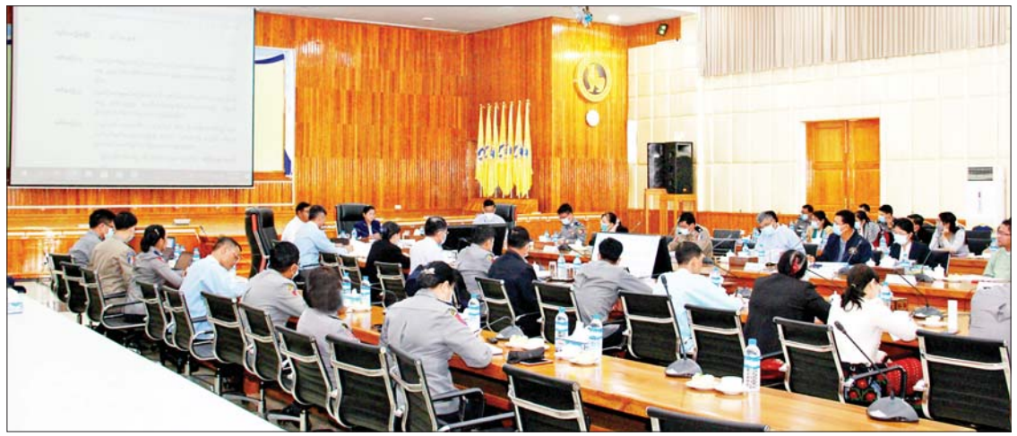
တင်ပြကြရာ မြန်မာနိုင်ငံတော်ဗဟိုဘဏ် ဥက္ကဋ္ဌနှင့် တာဝန်ရှိသူများက ဆက်လက် ဆောင်ရွက်ရန် လိုအပ်သည့်အချက်များ ကို ပြန်လည်ဆွေးနွေးခဲ့သည်။ ဆက်လက်၍ ၂၀၂၂ ခုနှစ် ဖေဖော် ဝါရီ ၁ ရက်တွင် အာရှ-ပစိဖိတ်ဒေသ ငွေကြေးခဝါချမှု တိုက်ဖျက်ရေးအဖွဲ့ (APG)သို့ မြန်မာနိုင်ငံ၏ အကဲဖြတ်ချက် အစီရင်ခံစာပါ စံနှုန်းနိမ့်သည့် အကြံပြု ချက်များအတွက် စံနှုန်းတိုးမြှင့်တောင်း ခံမည့်နည်းပညာပိုင်းဆိုင်ရာ လိုက်နာမှု အပေါ် အကောင်အထည်ဖော်ဆောင်ရွက် မည့် အစီအမံများနှင့်စပ်လျဉ်း၍ လိုအပ် သည့် ညွှန်ကြားချက်များကို သတ်မှတ် ရက်တွင် ထည့်သွင်းပေးပို့နိုင်ရန်အတွက် မြန်မာနိုင်ငံတော်ဗဟိုဘဏ် ဒုတိယဥက္ကဋ္ဌ ဒေါက်တာလင်းအောင်က မြန်မာနိုင်ငံ တော်ဗဟိုဘဏ်နှင့်သက်ဆိုင်သည့် ကိစ္စ ရပ်များကိုလည်းကောင်း၊ လုပ်ငန်းအဖွဲ့၏ ဒုတိယဥက္ကဋ္ဌ၊ အတွင်းရေးမှူးနှင့်အဖွဲ့ဝင် များက အကောင်အထည်ဖော်ရမည့် သက်ဆိုင်ရာဌာနအလိုက် ဆက်လက် ဆောင်ရွက်ရမည့်အချက်များကိုလည်း ကောင်း ဆွေးနွေးတင်ပြကြရာ မြန်မာ

နေပြည်တော် ဇန်နဝါရီ ၂၄ မြန်မာနိုင်ငံတော် ဗဟိုဘဏ် ရုံးအမှတ်(၅၅)တွင် ယနေ့နံနက်ပိုင်းက ကျင်းပသည့် ငွေကြေးခဝါချမှုနှင့် အကြမ်း ဖက်မှုကို ငွေကြေးထောက်ပံ့မှုတိုက်ဖျက် ရေးလုပ်ငန်းအဖွဲ့၏ တစ်ပတ်လျှင် နှစ်ကြိမ်ပြုလုပ်သည့် ပုံမှန်အစည်းအဝေး တွင် လုပ်ငန်းအဖွဲ့၏ဥက္ကဋ္ဌ မြန်မာနိုင်ငံ တော်ဗဟိုဘဏ်ဥက္ကဋ္ဌ ဒေါ်သန်းသန်းဆွေ က အဖွဲ့အမှာစကားပြောကြားသည်။ အစည်းအဝေးတွင် ကမ္ဘောဒီးယား နိုင်ငံ၌ ဇန်နဝါရီ ၁၆ ရက်က ကျင်းပခဲ့သည့် အာရှပစိဖိတ်ပူးတွဲအဖွဲ့ (Asia Pacific Joint Group-APJG) ၏ မျက်နှာစုံညီ အစည်းအဝေးသို့ တက်ရောက်ခဲ့သည့် မြန်မာကိုယ်စားလှယ်အဖွဲ့ ခေါင်းဆောင် နှင့် အဖွဲ့ဝင်များက မျက်နှာစုံညီအစည်း အဝေးတွင် မြန်မာနိုင်ငံ၏ တိုးတက်မှု အစီရင်ခံစာနှင့်စပ်လျဉ်း၍ အကဲဖြတ်သူ များ၏ မေးခွန်းများအပေါ် မြန်မာအဖွဲ့က ပြန်လည်ဖြေကြားချက်များကို ရှင်းလင်း