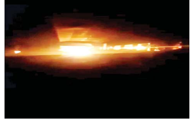
မဲ့အကြပ်ကိုင်ခြိမ်းခြောက်မှုများနှင့် အကြမ်းဖက်မှုများကြောင့် နီးစပ်ရာဆွေမျိုးများရှိရာသို့ ပြောင်းရွှေ့နေထိုင်လျက်ရှိကြောင်း သိရသည်။ အထက်ပါဖြစ်စဉ်များမှ အကြမ်းဖက်မှုလုပ်ရပ်များကို ကျူးလွန်သူများအား ဥပဒေနှင့်အညီ ထိရောက်စွာအရေးယူနိုင်ရေးနှင့် နယ်မြေ

ဖြစ်စဉ်မှာ KNDO တပ်ရင်း(၆)မှ အကြမ်းဖက်မှုကိုလိုလားသည့် အဖွဲ့နှင့် PDF အမည်ခံ အကြမ်းဖက်သမားများသည် ယနေ့နံနက် ၃ နာရီခန့်တွင် ကော့ကရိတ်မြို့နယ် တံတားဦးကျေးရွာဘက်မှ ကမ်းနီးကျေးရွာဘက်သို့ မော်တော်ယာဉ် နှစ်စီးဖြင့်ရောက်ရှိလာပြီး ကမ်းနီးကျေးရွာရှိ ကျေးရွာအုပ်ချုပ်ရေးမှူးရုံးအား အကြောင်းမဲ့မီးရှို့ဖျက်ဆီးခဲ့ကြောင်း၊ မီးရှို့ဖျက်ဆီးမှုကြောင့် အလျား ၁၅ ပေ၊ အနံ ပေ ၃၀၊ အမြင့် ၁၅ ပေရှိ ရုံးအဆောက်အအုံ ဖိလောင်ပျက်ဆီးခဲ့ကြောင်းနှင့် အဆိုပါ ကျေးရွာရှိ ဒေသခံပြည်သူများအနေဖြင့် အကြမ်းဖက်အဖွဲ့များ၏ ဥပဒေ