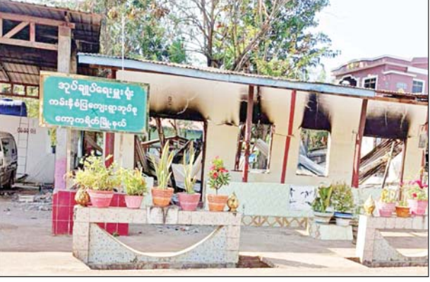
ဒေသတည်ငြိမ်အေးချမ်းရေးအတွက် လုံခြုံရေးတပ်ဖွဲ့ဝင်များအနေဖြင့် လိုအပ်သည့်လုံခြုံရေးလုပ်ငန်းများ ဆက်လက်ဆောင်ရွက်လျက်ရှိကြောင်း သိရသည်။ သတင်းစဉ်