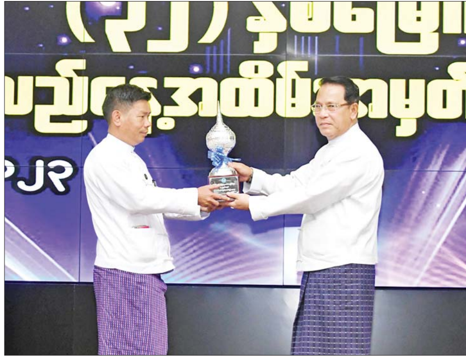
ပြည်ထောင်စုဝန်ကြီး ဦးမောင်မောင်အုန်း ခရိုင်အဆင့် လုပ်ငန်းစွမ်းဆောင်ရည် ပထမဆုရရှိသည့် လားရှိုးခရိုင်ရုံးမှ တာဝန်ရှိသူတစ်ဦးကို ဆုပေးအပ်ချီးမြှင့်စဉ်။