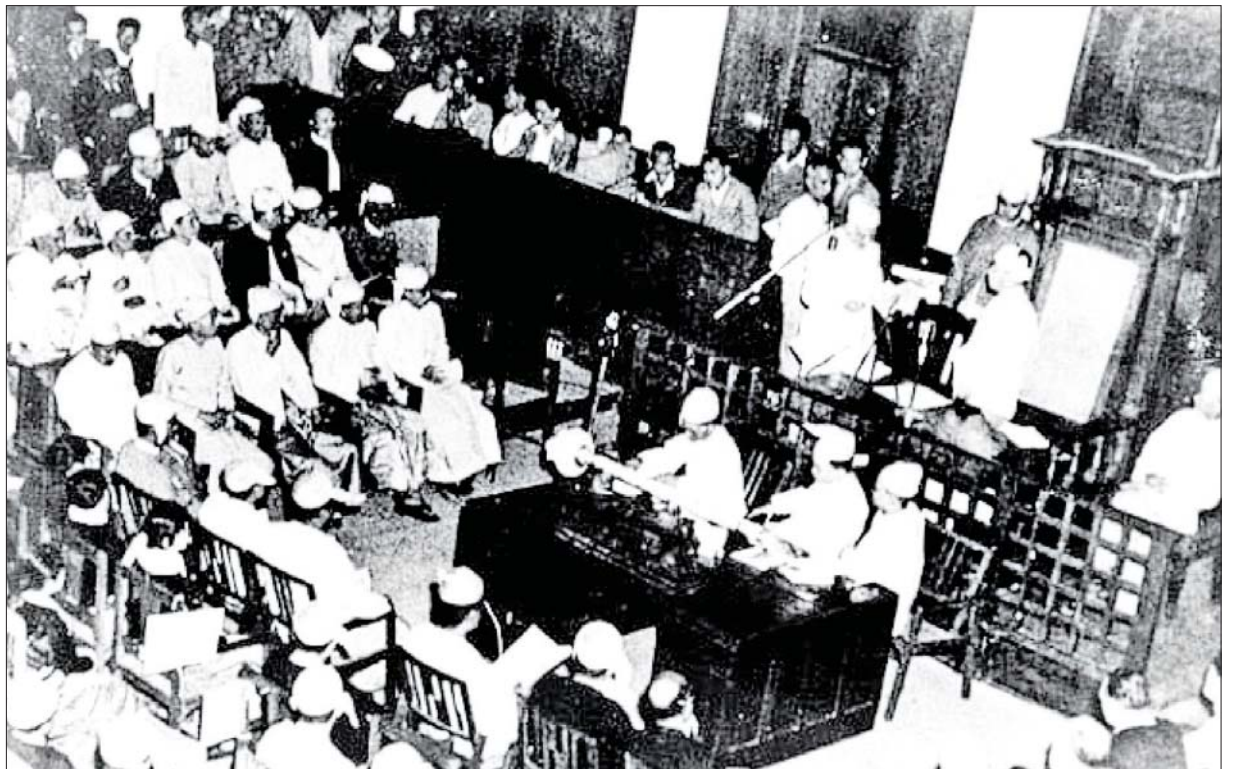
ပထမအကြိမ် လွတ်လပ်ရေးနေ့အခမ်းအနားအပြီးတွင် မြန်မာအစိုးရအဖွဲ့သစ် ကတိသစ္စာခံယူပွဲပြုလုပ်စဉ်။

လွတ်လပ်သောနိုင်ငံ၊ လွတ်လပ်သောလူမျိုးဘဝမှ သူ့ကျွန်ဘဝ ကျရောက်ခဲ့ကြသော မြန်မာနိုင်ငံသူ မြန်မာနိုင်ငံသားအပေါင်းသည် နယ်ချဲ့လက်အောက်တွင် လောကီငရဲမျိုးစုံကို ကြိတ်မှိတ်ခံစားခဲ့ကြ ရသည်။ ထို့ကြောင့် နယ်ချဲ့ဆန့်ကျင်ရေး၊ ဖက်ဆစ်တော်လှန်ရေး၊ အမျိုးသားလွတ်မြောက်ရေး လှုပ်ရှားမှုများတွင် တစ်ဗိုလ်တက်