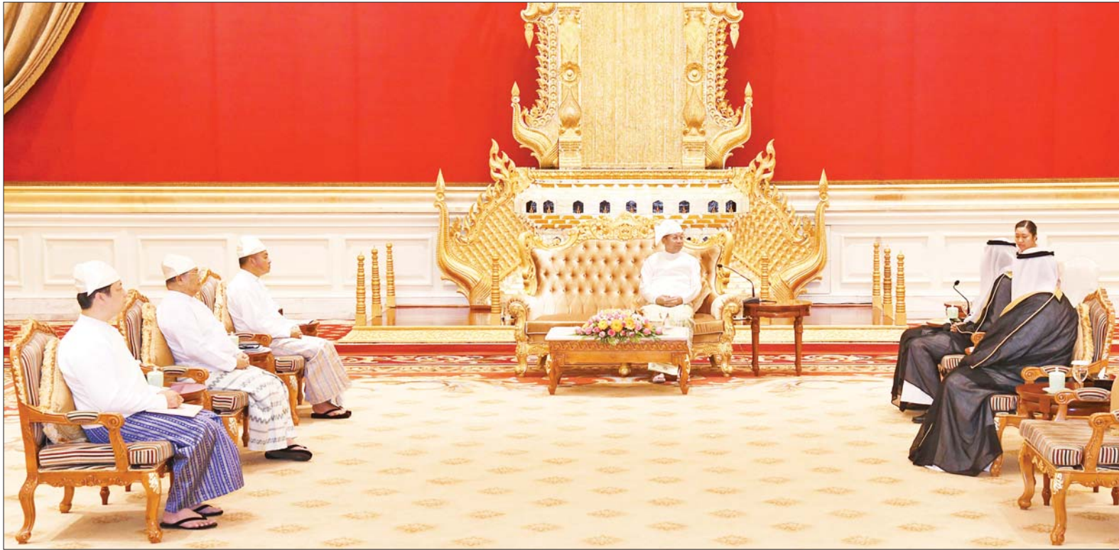
နိုင်ငံတော်စီမံအုပ်ချုပ်ရေးကောင်စီဥက္ကဋ္ဌ နိုင်ငံတော်ဝန်ကြီးချုပ် ဗိုလ်ချုပ်မှူးကြီးမင်းအောင်လှိုင် မြန်မာနိုင်ငံဆိုင်ရာ ကူဝိတ်နိုင်ငံ သံအမတ်ကြီး H.E. Mr. Mubarak M A Aladwani အား လက်ခံတွေ့ဆုံစဉ်။

☆ ရှေ့ဖုံးမှ တိုးတက်ရေးအတွက် နှစ်နိုင်ငံပူးပေါင်းဆောင်ရွက်ရေးဆိုင်ရာ ကိစ္စရပ်များ၊ မြန်မာနိုင်ငံ၏ လက်ရှိနိုင်ငံရေးဆိုင်ရာဖြစ်ပေါ်တိုးတက်နေမှုများနှင့် ပတ်သက်၍ ရင်းရင်းနှီးနှီး ဆွေးနွေးကြသည်။ စုပေါင်းမှတ်တမ်းတင်ဓာတ်ပုံရိုက် တွေ့ဆုံပွဲအပြီးတွင် နိုင်ငံတော်စီမံအုပ်ချုပ်ရေးကောင်စီဥက္ကဋ္ဌ နိုင်ငံတော်ဝန်ကြီးချုပ်နှင့် မြန်မာနိုင်ငံဆိုင်ရာ ကူဝိတ်နိုင်ငံသံအမတ်ကြီး တို့သည် စုပေါင်းမှတ်တမ်းတင်ဓာတ်ပုံရိုက်ကြသည်။ အဆိုပါ သံအမတ်ခန့်အပ်လွှာပေးအပ်ပွဲသို့ ကောင်စီတွဲဖက်အတွင်းရေးမှူး ဒုတိယဗိုလ်ချုပ်ကြီး ရဲဝင်းဦး၊ နိုင်ငံခြားရေးဝန်ကြီးဌာန ပြည်ထောင်စုဝန်ကြီး ဦးဝဏ္ဏမောင်လွင်နှင့် သံတမန်ရေးရာဦးစီးဌာန ညွှန်ကြားရေးမှူးချုပ် ဦးဝဏ္ဏဟန်တို့ တက်ရောက်ခဲ့ကြကြောင်း သိရသည်။