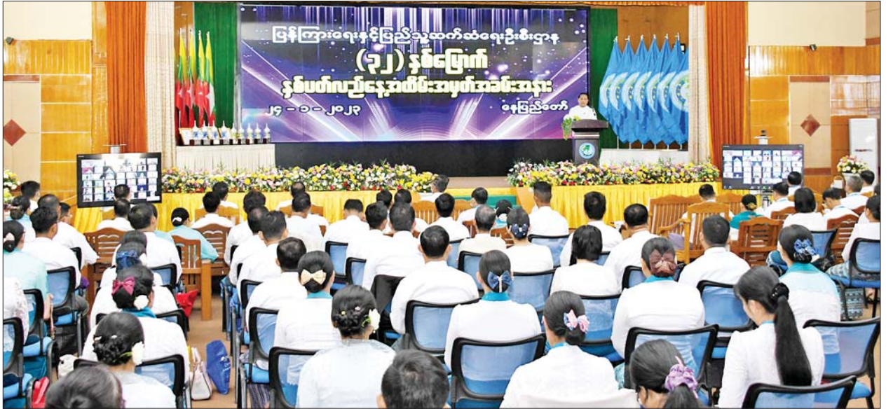
ပြည်ထောင်စုဝန်ကြီး ဦးမောင်မောင်အုန်း ပြန်ကြားရေးနှင့် ပြည်သူ့ဆက်ဆံရေးဦးစီးဌာန၏ (၃၂) နှစ်မြောက် နှစ်ပတ်လည်နေ့အခမ်းအနားတွင် အမှာစကားပြောကြားစဉ်။

ပြန်ကြားရေးနှင့် ပြည်သူ့ဆက်ဆံရေးဦးစီးဌာန၏ (၃၂) နှစ်မြောက် နှစ်ပတ်လည်နေ့အခမ်းအနားကို ယနေ့နံနက် ၁၀ နာရီတွင် နေပြည်တော် ရှိ ပြန်ကြားရေးဝန်ကြီးဌာန စုဝေးခန်းမ၌ ကျင်းပသည်။ အခမ်းအနားသို့ ပြန်ကြားရေးဝန်ကြီးဌာန ပြည်ထောင်စုဝန်ကြီး ဦးမောင်မောင်အုန်း၊ ဒုတိယဝန်ကြီး ဦးရဲတင့်၊ အမြဲတမ်းအတွင်းဝန် ဦးမျိုးမြင့်မောင်၊ ဌာနဆိုင်ရာအကြီးအကဲများ၊ တာဝန်ရှိသူများ၊ တိုင်းဒေသကြီးနှင့် ပြည်နယ်ဦးစီးမှူးများ၊ ခရိုင်ဦးစီးမှူးများနှင့် ထူးချွန်ဆုရဝန်ထမ်းများ တက်ရောက်ကြသည်။ အခမ်းအနားတွင် ပြည်ထောင်စုဝန်ကြီး ဦးမောင်မောင်အုန်းက အမှာစကားပြောကြားရာ၌ ပြီးခဲ့သည့်နှစ်အတွင်း ဆောင်ရွက်ပြီးစီးခဲ့သည့် လုပ်ငန်းများ၏ အားသာချက်၊ အားနည်းချက်များကို ပြန်လည်ညှိနှိုင်းသုံးသပ်၍ လုပ်ငန်းများကို ဆက်လက်အကောင်အထည်ဖော်သွားကြမည်ဖြစ်ကြောင်း၊ ပြန်ကြားရေးနှင့် ပြည်သူ့ဆက်ဆံရေးဦးစီးဌာနသည် တိုင်းဒေသကြီး၊ ပြည်နယ်၊ ခရိုင်၊ မြို့နယ်နှင့် မြို့ရုံးပေါင်း ၄၃၇ ရုံးဖြင့် ဖွဲ့စည်းထားပြီး မီဒီယာအခန်းကဏ္ဍမှ ပြည်သူများနှင့် တိုက်ရိုက်ထိတွေ့ဆက်ဆံလျက်ရှိသည့် ဌာနတစ်ခုဖြစ်ကြောင်း။ ၂၀၂၂ ခုနှစ်တွင် ပြန်ကြားရေးနှင့် ပြည်သူ့ဆက်ဆံရေးဦးစီးဌာန၏