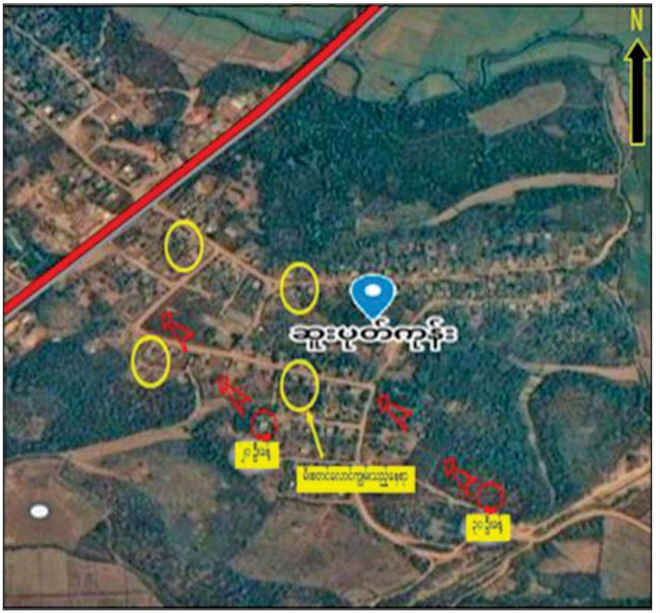
၂၀၂၂ ခုနှစ် ဒီဇင်ဘာလ ၁၇ ရက်နေ့တွင် လုံခြုံရေးတပ်ဖွဲ့ဝင်များနှင့် KIA/PDF အကြမ်းဖက်ပူးပေါင်းသောင်းကျန်းသူများ တိုက်ပွဲဖြစ်စဉ်၌ သောင်းကျန်းသူများက ဆုတ်ခွာစဉ် စစ်ကိုင်းတိုင်းဒေသကြီးကသာမြို့နယ် ဆူးပုတ်ကုန်းကျေးရွာအား မီးရှို့ဖျက်ဆီးသွားသည့်ဖြစ်စဉ် နေရာပြမြေပုံ။