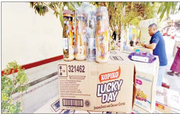
မန္တလေးတိုင်းဒေသကြီးအတွင်း၌ သိမ်းဆည်းရမိမှု။

တရားမဝင်ကုန်သွယ်မှုတိုက်ဖျက်ရေး ဦးဆောင်ကော်မတီ၏ ကြီးကြပ်ကွပ်ကဲမှုဖြင့် တရားမဝင်ကုန်သွယ်မှုများကို ဥပဒေနှင့်အညီ ထိရောက်စွာ တားဆီးအရေးယူနိုင်ရေး ဆောင်ရွက်လျက်ရှိရာ ဇန်နဝါရီ ၁၉ ရက်တွင် ရှမ်းပြည်နယ် တရားမဝင်ကုန်သွယ်မှုတိုက်ဖျက်ရေး အထူးအဖွဲ့၏ စီမံခန့်ခွဲမှုဖြင့် တောင်ကြီးမြို့နယ် အကောက်ခွန်ဦးစီးဌာန မှူးရုံးမှ လှုပ်ရှားစစ်ဆေးရေးအထူးကင်းအဖွဲ့ ဦးဆောင်သော ပူးပေါင်း စစ်ဆေးရေးအဖွဲ့က စစ်ဆေးမှုများ ဆောင်ရွက်ခဲ့ရာ ကျိုင်းတုံ-တောင်ကြီး-မိတ္ထီလာလမ်းမကြီး မိုင်တိုင် ၁၂၃ မိုင် ၃ ဖာလုံ ဟိုပုံး တိုးလ်ဂိတ်အနီး တွင် တရားဝင်စာရွက်စာတမ်းအထောက်အထား တင်ပြနိုင်ခြင်းမရှိသည့် ပုစွန်နှစ်ကောင်တံဆိပ် စားသုံးဆီများ (ခန့်မှန်းတန်ဖိုးငွေကျပ် ၃၅၀၀၀၀)နှင့် အဆိုပါစားသုံးဆီများ တင်ဆောင်လာသည့် မော်တော်ယာဉ် တစ်စီး(ခန့်မှန်းတန်ဖိုးငွေကျပ် ၂၀၀၀၀၀၀) စုစုပေါင်း(ခန့်မှန်းတန်ဖိုးငွေကျပ် ၂၃၅၀၀၀၀)ကို သိမ်းဆည်းရမိခဲ့ပြီး အကောက်ခွန် လုပ်ထုံးလုပ်နည်းနှင့်အညီ အရေးယူဆောင်ရွက်လျက်ရှိသည်။