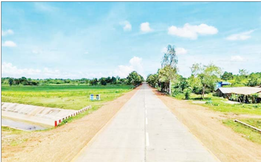
ပုသိမ်-မုံရွာကားလမ်း ရော့တီတိုင်းဒေသကြီးအပိုင်းတွင် ကွန်ကရစ်လမ်းခင်းထားစဉ်။

ရော့တီတိုင်းဒေသကြီးတွင် ပုသိမ်ခရိုင်၊ ကျိုပျော်ခရိုင်၊ ဟင်္သာတခရိုင်၊ မြန်အောင်ခရိုင်၊ မြောင်းမြခရိုင်၊ မအူပင်ခရိုင်၊ ဖျာပုံခရိုင်၊ လပွတ္တာခရိုင်ဟူ၍ ရှစ်ခရိုင်၊ မြို့နယ်ပေါင်း ၂၆ မြို့နယ်နှင့် မြို့နယ်ခွဲပေါင်း ခုနစ်မြို့နယ်ရှိသည်ဖြစ်ရာ ကျိုပျော်ခရိုင် ကျောင်းကုန်းမြို့နယ် လမ်းဦးစီးဌာနမှ ၃ မိုင် ၃ ဖာလုံ တာဝန်ယူဆောင်ရွက်နေသည့်အနက် ၃ ဖာလုံနှင့် ရေကြည်မြို့နယ် လမ်းဦးစီးဌာနမှ တာဝန်ယူဆောင်ရွက်နေသည့်အနက် ၁၇ မိုင်တို့ကို ခွင့်ပြုချက်ဖြင့် ကွန်ကရစ်လမ်းခင်းခဲ့သည်။ ဘဏ္ဍာနှစ်အလိုက် အသုံးပြုခဲ့သော ဘဏ္ဍာငွေစာရင်းမှာ ၂၀၁၄ - ၂၀၁၅ ဘဏ္ဍာနှစ်မှ ၂၀၂၂-၂၀၂၃ ဘဏ္ဍာနှစ်အထိ ငွေလုံးငွေရင်းရန်ပုံငွေကျပ် ၃၆၉၆ ဒသမ ၄၉၅ သန်းဖြင့် နှစ်အလိုက်အဆင့်မြှင့်တင်ဆောင်ရွက်ခဲ့ရာ ယခုအချိန်တွင် ၂၄ ပေအကျယ်