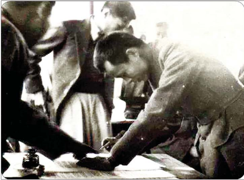
၁၉၄၇ ခုနှစ် ဖေဖော်ဝါရီလ ၁၂ ရက်နေ့က ပင်လုံမြို့တွင် ဗိုလ်ချုပ်အောင်ဆန်းခေါင်းဆောင်ပြီး တိုင်းရင်းသားခေါင်းဆောင်များပါဝင်သော ပင်လုံစာချုပ်လက်မှတ်ရေးထိုးစဉ်။

ယခုနှစ် ၂၀၂၃ ခုနှစ် ဖေဖော်ဝါရီလ ၁၂ ရက်နေ့ သည် (၇၆)နှစ်မြောက် ပြည်ထောင်စုနေ့ဖြစ်သည်။ တစ်နည်းအားဖြင့် လွန်ခဲ့သည့် (၇၆) နှစ် ၁၉၄၇ ခုနှစ် ဖေဖော်ဝါရီလ ၁၂ ရက်နေ့တွင် ရှမ်းပြည်နယ် တောင်ပိုင်းပင်လုံမြို့၌ အမျိုးသားခေါင်းဆောင်ကြီး ဗိုလ်ချုပ်အောင်ဆန်းနှင့် တိုင်းရင်းသား ခေါင်းဆောင်များသည် တောင်ပေါ်မြေပြန့်မကျန် ပြည်ထောင်စုကို တည်ထောင်ပြုရန်အတွက် ပင်လုံစာချုပ်ကို လက်မှတ်ရေးထိုးခဲ့သော သမိုင်းဝင်နေ့ထူးနေ့ဖြစ်တစ်နေ့ဖြစ်ပါသည်။