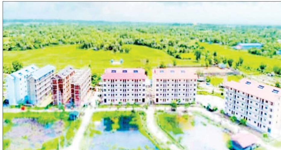
ရန်ကုန်တိုင်းဒေသကြီး သန်လျင်-ကျောက်တန်းမြို့နယ် သီလဝါအိမ်ရာစီမံကိန်းကို တွေ့ရစဉ်။

ရန်ကုန် ဇန်နဝါရီ ၂၃ ဆောက်လုပ်ရေးဝန်ကြီးဌာန မြို့ပြနှင့်အိမ်ရာဖွံ့ဖြိုးရေးဦးစီးဌာနမှ အိမ်ခန်းများကို အတိုးနှုန်းသက်သာသောချေးငွေစနစ်ဖြင့် ဇန်နဝါရီလအတွင်း ရောင်းချပေးသွားမည်ဖြစ်ရာ ရန်ကုန်တိုင်းဒေသကြီး ဒဂုံမြို့သစ်(တောင်ပိုင်း)မြို့နယ်ရှိ အောင်မြင်မြိုင်အိမ်ရာစီမံကိန်းနှင့် သီလဝါစက်မှုဇုန်အနီးရှိ သီလဝါအိမ်ရာစီမံကိန်းတို့မှ အိမ်ခန်းပေါင်း ၂၀၀ ကျော်အား ရောင်းချပေးသွားမည်ဖြစ်ကြောင်း သိရသည်။ ရောင်းချပေးသွားမည့် ဒဂုံမြို့သစ်(တောင်ပိုင်း)မြို့နယ်ရှိ အောင်မြင်မြိုင်အိမ်ရာစီမံကိန်းမှ ခြောက်ခန်းတွဲလေးထပ် အခန်း ၇၂ ခန်း၊ လေးခန်းတွဲသုံးထပ် ၁၂ ခန်းနှင့် သန်လျင်-ကျောက်တန်းမြို့နယ် သီလဝါစက်မှုဇုန်နှင့် TSEZ စက်မှုဇုန်အနီး(သန်လျင်နည်းပညာတက္ကသိုလ်အနီး) ရှိ သီလဝါအိမ်ရာမှ ခြောက်ခန်းတွဲငါးထပ် အခန်း ၁၂၀ တို့ဖြင့် စုစုပေါင်း အခန်း ၂၀၄ ခန်းကို ရောင်းချပေးသွားမည်ဖြစ်ကြောင်း သိရသည်။