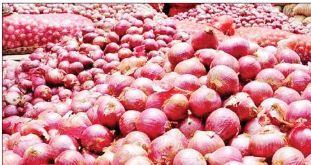
(၇၀၀၊ ၆၀၀၊ ၅၀၀) ပေါက်ဈေးရှိခဲ့ကြောင်း သိရသည်။

သီးနှံပေါ်စီဒင်ဘာလတွင် ဒေသတွင်းဈေးကွက်၌ တစ်ပင်ပေါင်း ၂၉၅၀ မှ အနိမ့်ဈေး ၄၅၀၀ ပေါက်ဈေးရှိခဲ့ပြီး ဇန်နဝါရီလဆန်းပိုင်းတွင် တစ်ပင်ပေါင်း ၂၉၅၀ မှ အနိမ့်ဈေး ၄၅၀၀ ပေါက်ဈေးရှိကြောင်း၊ ယခင်နှစ် မိုးကြက်သွန်နီပေါ်ချိန်တွင် တစ်ပင်ပေါင်း ၂၉၅၀ မှ အနိမ့်ဈေး ၄၅၀၀ ပေါက်ဈေးရှိကြောင်း သိရသည်။