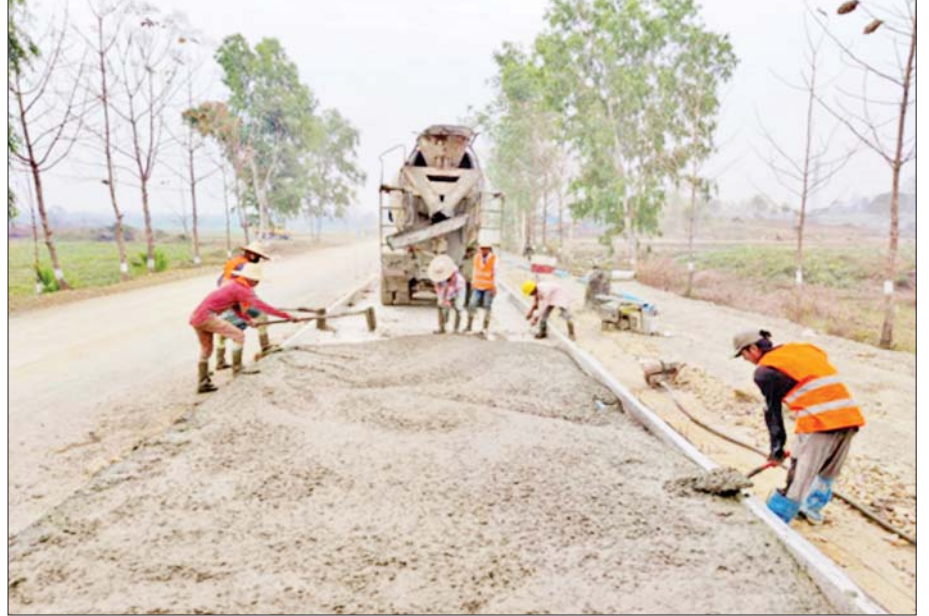
ပုသိမ်-မုံရွာကားလမ်း ရော့တီတိုင်းဒေသကြီးအပိုင်းတွင် ကွန်ကရစ်လမ်းအဖြစ် ဆောင်ရွက်နေစဉ်။

လမ်းကွန်ရက်များနှင့်အတူ ရော့တီတိုင်းဒေသကြီးအတွင်း မြစ်ချောင်းများပေါ်၌ ပေ ၁၉၀၀ ရှိ ရွှေလောင်းမြစ်ကူးတံတား၊ ပေ ၃၀၂၀ ရှိ ဝါးခယ်မ မြစ်ကူးတံတား၊ မြောင်းမြတံတား၊ ညောင်တုန်း တံတား၊ ဗိုလ်မြတ်ထွန်းတံတား၊ ပုသိမ်တံတား အမှတ် (၁)၊ (၂) အပါအဝင် ပေ ၁၈၀ အထက် တံတားကြီး ၉၃ စင်း၊ ပေ ၁၈၀ အောက်ကွန်ကရစ် တံတား ၉၄၂ စင်း၊ ဘေလီတံတား ပေ ၁၈၀ အထက်