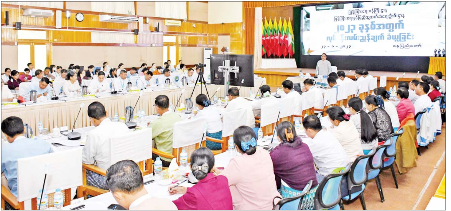
ပြည်ထောင်စုဝန်ကြီး ဦးမောင်မောင်အုန်း ပြန်ကြားရေးနှင့်ပြည်သူ့ဆက်ဆံရေးဦးစီးဌာန ၂၀၂၃ ခုနှစ်အတွက် လုပ်ငန်းလမ်းညွှန်ချက်ခံယူခြင်း အခမ်းအနားတွင် အမှာစကားပြောကြားစဉ်။

နေပြည်တော် ဇန်နဝါရီ ၂၃ ပြန်ကြားရေးဝန်ကြီးဌာန ပြည်ထောင်စုဝန်ကြီးထံမှ ပြန်ကြားရေးနှင့်ပြည်သူ့ဆက်ဆံရေးဦးစီးဌာနက ၂၀၂၃ ခုနှစ်အတွက် လုပ်ငန်းလမ်းညွှန်ချက်ခံယူခြင်း အခမ်းအနားကို ယနေ့ မွန်းလွဲ ၁ နာရီတွင် နေပြည်တော်ရှိ ပြန်ကြားရေးဝန်ကြီးဌာန စုဝေးခန်းမ၌ ကျင်းပသည်။ အစည်းအဝေးသို့ ပြန်ကြားရေးဝန်ကြီးဌာန ပြည်ထောင်စုဝန်ကြီး ဦးမောင်မောင် အုန်း၊ ဒုတိယဝန်ကြီး ဦးရဲတင့်၊ အမြဲတမ်းအတွင်းဝန် ဦးမျိုးမြင့်မောင်၊ ဌာနဆိုင်ရာ အကြီးအကဲများ၊ တိုင်းဒေသကြီး/ပြည်နယ်များမှ ဦးစီးမှူးများ၊ ခရိုင်နှင့် မြို့နယ်ဦးစီးမှူးများ၊ တာဝန်ရှိသူများ တက်ရောက်ကြသည်။