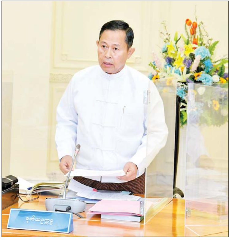
နိုင်ငံတော်စီမံအုပ်ချုပ်ရေးကောင်စီ ဒုတိယဥက္ကဋ္ဌ ဒုတိယဝန်ကြီးချုပ် ဒုတိယဗိုလ်ချုပ်မှူးကြီးစိုးဝင်း အကြံပြုဆွေးနွေးတင်ပြစဉ်။

ပါတီများပြားပြီး ပါတီဝင်များအစုအဖွဲ့ တစ်ခုအနေဖြင့်သာ လုပ်ဆောင်နိုင်သည်ကို တွေ့ရကြောင်း၊ အဆိုပါအစုအဖွဲ့မှာ ငယ်နေမည်ဆိုပါက ဧရိယာအားဖြင့်၊ အရေအတွက်အားဖြင့်၊ နယ်ပယ်အားဖြင့် ကြီးမားကျယ်ပြန့်စွာ စုစည်းနိုင်မှုမရှိသည်ကို တွေ့ရကြောင်း၊ ထို့ကြောင့် ပါတီများအားလုံး ယခုထက်ပိုမို၍ ကျစ်လျစ်ခိုင်မာစွာ စည်းစနစ်ကျစွာနှင့် ထုထည်ဖြင့် ဖွဲ့စည်းနိုင်ရန်လိုကြောင်း၊ နိုင်ငံရေးပါတီများ မှတ်ပုံတင်ခြင်းဥပဒေကို ပြန်လည်သုံးသပ်ခြင်းများကို ဆောင်ရွက်ခဲ့ပြီး ပြင်ဆင်သင့်သည်များကို ပြင်ဆင်ပြဋ္ဌာန်းရန်ဖြစ်ကြောင်း၊ ရှေ့လုပ်ငန်းစဉ်တွင်ပါရှိသည့်အတိုင်း ရွေးကောက်ပွဲကျင်းပနိုင်ရေးအတွက် နိုင်ငံရေးပါတီများမှတ်ပုံတင်ခြင်းဥပဒေကို အတည်ပြုနိုင်ရန်အတွက် သုံးသပ်ဆွေးနွေး အကြံပြုကြစေလိုကြောင်း ပြောကြားသည်။