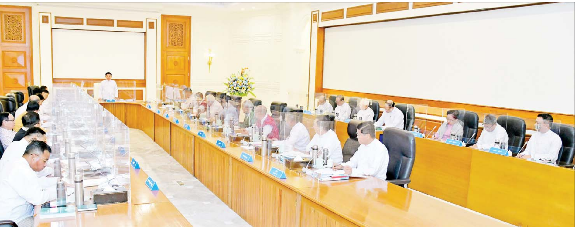
နိုင်ငံတော်စီမံအုပ်ချုပ်ရေးကောင်စီဥက္ကဋ္ဌ နိုင်ငံတော်ဝန်ကြီးချုပ် ဗိုလ်ချုပ်မှူးကြီးမင်းအောင်လှိုင် နိုင်ငံတော်စီမံအုပ်ချုပ်ရေးကောင်စီအစည်းအဝေး(၁/၂၀၂၃)တွင် အမှာစကားပြောကြားစဉ်။

နိုင်ငံအဝန်း အကြားအလပ်မရှိ ရွေးကောက်ပွဲကျင်းပနိုင်ရေး၊ ပြည်သူအားလုံး ခြိမ်းခြောက်မှု၊ အကျပ်ကိုင်မှုမရှိဘဲ လွတ်လပ်စွာ ဆန္ဒဖော်ထုတ်မဲပေးနိုင်ရေး ဦးတည်ဆောင်ရွက်ရမည်