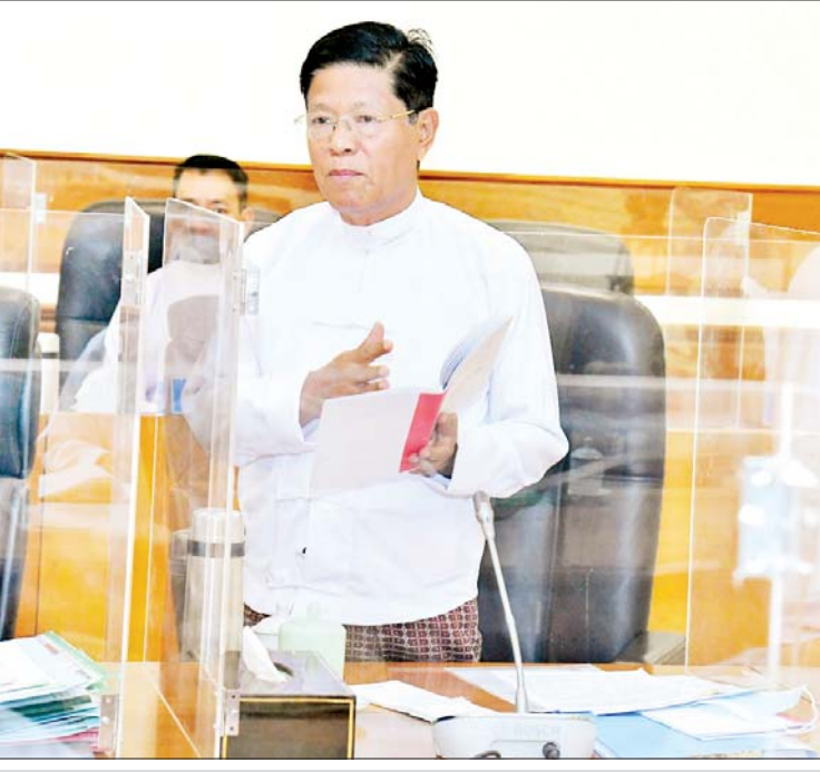
ပြည်ထောင်စုရွေးကောက်ပွဲကော်မရှင်ဥက္ကဋ္ဌ ဦးသိန်းစိုး ရှင်းလင်းတင်ပြစဉ်။

ကိုယ်စားပြုနိုင်မှုမှာ အားနည်းနေသည်ကို တွေ့နိုင်ကြောင်း၊ ဖြစ်သင့်သည်မှာ နိုင်ငံရေးပါတီများသည် မိမိကိုထောက်ခံသည့် ပြည်သူများကို စုစုစည်းစည်း အင်အားရှိရှိဖြင့် ကိုယ်စားပြုနိုင်ရန် လိုကြောင်း၊ ပြည်သူတို့၏ စုပေါင်းစွမ်းအားဖြင့် နိုင်ငံကို ဦးဆောင်ရန်လိုကြောင်း။ မိမိတို့နိုင်ငံ၌ ၁၉၆၂ ခုနှစ်မှ ၁၉၈၈ ခုနှစ်အထိ ဗဟိုဦးစီးစနစ်၊ တစ်ပါတီစနစ်ဖြင့် သွားခဲ့ကြောင်း၊ ထို့ကြောင့် ဒီမိုကရေစီစနစ်ကိုဖော်ဆောင်ရာတွင် ၁၉၉၀ ပြည့်နှစ်ရွေးကောက်ပွဲ ဆောင်ရွက်ရန်အတွက် နိုင်ငံရေးပါတီများ မှတ်ပုံတင်ခြင်း ဆောင်ရွက်ရာတွင် ပါတီစုံဒီမိုကရေစီစနစ် အမြန်ဖြစ်ထွန်းနိုင်ရေး နိုင်ငံရေးပါတီများ ဖွဲ့စည်းခွင့်ကို လျှော့ပေါ့ပေးသကဲ့သို့ နိုင်ငံတော်အေးချမ်းသာယာရေးနှင့် ဖွံ့ဖြိုးရေးကောင်စီအစိုးရလက်ထက်တွင်လည်း နိုင်ငံသူ နိုင်ငံသားအားလုံး ဒီမိုကရေစီအတွေ့အကြုံကို ပိုမိုရရှိစေရန်အတွက် ပါတီများ မှတ်ပုံတင်ခြင်းဥပဒေနှင့် ပတ်သက်၍ လျှော့ပေါ့ဆောင်ရွက်ခဲ့ကြောင်း။ ယခင်ကျင်းပခဲ့သည့် ပါတီစုံဒီမိုကရေစီ အထွေထွေရွေးကောက်ပွဲ အတွေ့အကြုံများအရ ပါတီများပြားသော်လည်း လွှတ်တော်၌ ပါဝင်ခွင့်ရသည့်ပါတီမှာ နည်းပါးသည်ကို တွေ့ရကြောင်း၊ နိုင်ငံရေး