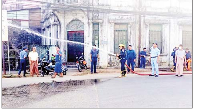
ဦးဆောင်သော ဝန်ထမ်းများ ပူးပေါင်းပါဝင်ဆောင်ရွက်ခဲ့ကြကြောင်း သိရသည်။ မြို့နယ်( ပြန်/ဆက်)

အမှတ်(၂၄) အခြေခံပညာမူလတန်းကျောင်းအနီးရှိ ရေငုတ်နှင့် အမှတ်(၅)ရပ်ကွက်၊ အောင်ဇရာဈေးအနီးရှိ ရေငုတ်များမှ ရေကို သွယ်ယူကာ အရေးပေါ်မီးငြိမ်းသတ်ခြင်းနှင့် ရေသယ်ယာဉ်များအတွင်း ရေဖြည့်ခြင်းများကို မြို့နယ်စည်ပင်သာယာရေးကော်မတီနှင့် မီးသတ်ဦးစီးဌာနတို့ ပူးပေါင်းကာ ဇာတ်တိုက်လေ့ကျင့်ဆောင်ရွက်ခဲ့ကြသည်။ အဆိုပါ ဇာတ်တိုက်လေ့ကျင့်မှုကို ပုသိမ်မြို့နယ် စည်ပင်သာယာရေးကော်မတီဥက္ကဋ္ဌ၊ မြို့နယ် စည်ပင်သာယာရေးအဖွဲ့အမှုဆောင် အရာရှိနှင့်ဝန်ထမ်းများ၊ ခရိုင်မီးသတ်ဦးစီးဌာနမှ ဒုတိယဦးစီးမှူး