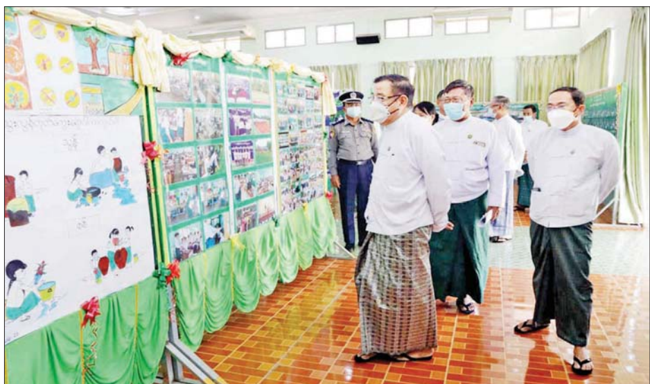
နေမှုအားလည်းကောင်း၊ ခန်းမအတွင်း ပြသထား ကြည့်ရှုအားပေးခဲ့ကြကြောင်း သိရသည်။ သောပညာရေးစုံညီပွဲတော်ပြခန်းအားလည်းကောင်း တိုင်းဒေသကြီး (ပြန်/ဆက်)

၎င်းနောက် တိုင်းဒေသကြီးဝန်ကြီးချုပ်၊ တရားလွှတ်တော်တရားသူကြီးချုပ်၊ တိုင်းဒေသကြီးဝန်ကြီးများ၊ ဌာနဆိုင်ရာတာဝန်ရှိသူများနှင့် ကျောင်းသား မိဘများက ဆုရရှိသူများနှင့် ကျောင်းသား ကျောင်းသူများ၏ အကပဒေသာများဖြင့် သီဆိုကပြ ဖျော်ဖြေ