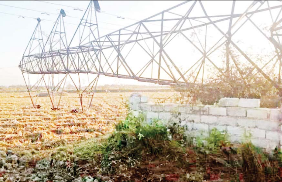
၁၃၂ ကေစီ ဘီလူးချောင်း(၂) တိကျစွာ နှစ်ထပ်ဓာတ်အားလိုင်း တာဝါတိုင်တစ်တိုင် ဖြိုလဲနေသည့် မှတ်တမ်းဓာတ်ပုံ။

၁။ လျှပ်စစ်စွမ်းအားဝန်ကြီးဌာနသည် ပြည်သူလူထု၏ လိုအပ်လျက်ရှိသော လျှပ်စစ်ဓာတ်အားကို နည်းမျိုးစုံဖြင့် တိုးမြှင့်ထုတ်လုပ်နိုင်ရန် စီမံဆောင်ရွက် လျက်ရှိပါသည်။ ထိုသို့ စီမံဆောင်ရွက်နေ သော်လည်း ယခုကာလများတွင် ပြည်သူ လူထု၏လိုအပ်ချက်ကို လုံလောက်အောင် ဖြည့်ဆည်းပေးနိုင်မှုမရှိသဖြင့် ထုတ်လုပ် ပေးနိုင်မှုကိုအခြေခံ၍ မျှတစွာခွဲဝေ ခံစားရရှိနိုင်ရန် စီမံဆောင်ရွက်ဖြန့်ဖြူး လျက်ရှိပါသည်။ ၂။ ထိုသို့ဆောင်ရွက်နေသည့်ကာလ တွင် NUG လက်ဝေခံ PDF အမည်ခံ အကြမ်းဖက်သမားများမှ ပြည်သူများ၏ လျှပ်စစ်ဓာတ်အား လိုအပ်ချက်ကို ထုတ်လုပ်၊ ပို့လွှတ်၊ ဖြန့်ဖြူးပေးလျက်ရှိ သော လျှပ်စစ်ပိုင်းဆိုင်ရာ အခြေခံ အဆောက်အအုံများအား ဖောက်ခွဲ ဖျက်ဆီးမှုများ ရည်ရွယ်ချက်ရှိရှိဖြင့် ပြုလုပ်လျက်ရှိရာ ၂၂-၁-၂၀၂၃ ရက်နေ့ တွင် စာမျက်နှာ ၁၈ ကော်လံ ၁ သို့ ☆