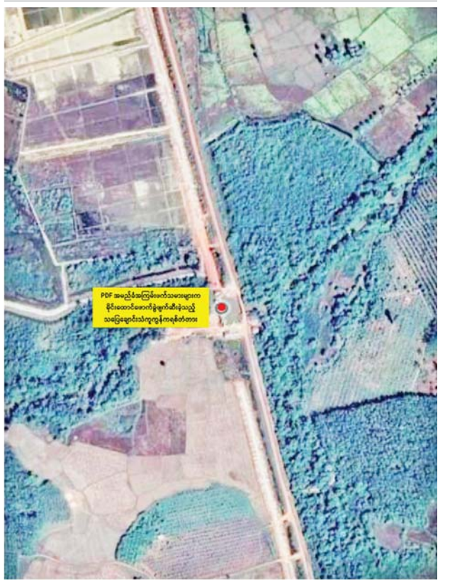
PDF အမည်ခံအကြမ်းဖက်သမားများက မိုင်းထောင်ဖောက်ခွဲဖျက်ဆီးခဲ့သည့် သပြေချောင်းသံကူ ကွန်ကရစ်တံတား နေရာပြပုံ

ဖြစ်စဉ်မှာ ဇန်နဝါရီ ၂၁ ရက် ည ၇ နာရီခန့်တွင် သံဖြူဇရပ်မြို့နယ် နှစ်ကရင်ကျေးရွာ-သာဂရကျေးရွာသွား ကားလမ်း၊ သာဂရကျေးရွာ၏ အနောက်တောင်ဘက် မီတာ ၁၀၀၀ ခန့် အကွာရှိအရှည်ပေ ၁၃၀၊ အကျယ်ပေ ၂၀ ရှိ သပြေချောင်းသံကူကွန်ကရစ်တံတားအား PDF အမည်ခံ အကြမ်းဖက်သမားများက မိုင်းထောင်ဖောက်ခွဲဖျက်ဆီးသွားခဲ့ကြောင်း၊ ထိုသို့ ဖောက်ခွဲဖျက်ဆီးမှုကြောင့် တံတား၏ တောင်ဘက်ခြမ်းမှ ကမ်းကပ်ခံ ထိုသို့ အများပြည်သူများ အနီးတွင် အချင်း ၁၀ ပေပတ်လည် သွားလာရေး အဆင်ပြေချောမွေ့