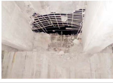
PDF အမည်ခံ အကြမ်းဖက်သမားများက မိုင်းထောင်ဖောက်ခွဲဖျက်ဆီးခဲ့သည့် သပြေချောင်း သံကူကွန်ကရစ်တံတား ပျက်စီးနေမှု မှတ်တမ်းဓာတ်ပုံ။