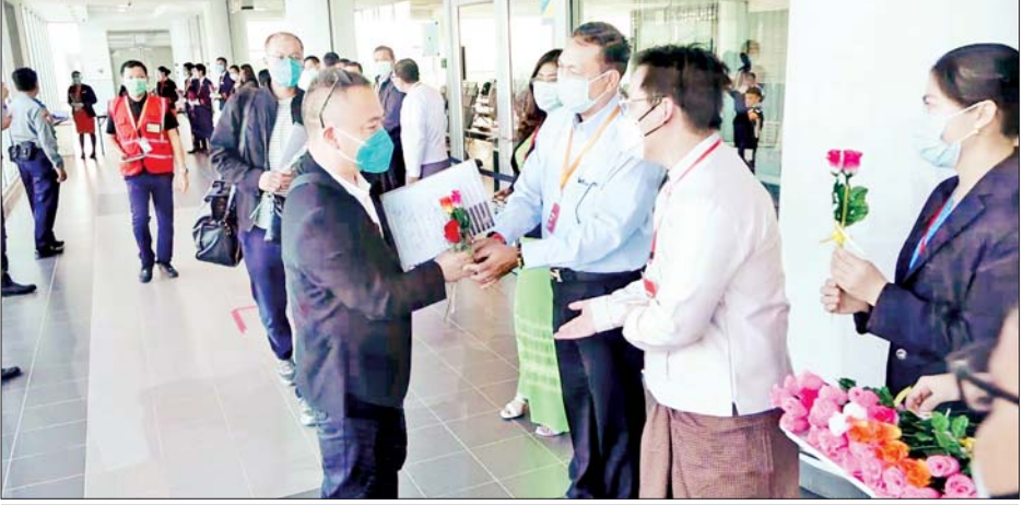
Ruili လေကြောင်းလိုင်း၏ မန္တလေး-မန်စီ-မန္တလေး ခရီးစဉ်လေယာဉ်ဖြင့် လိုက်ပါလာသော ခရီးသွားဧည့်သည်များကို မန္တလေးအပြည်ပြည်ဆိုင်ရာလေဆိပ်၌ တာဝန်ရှိသူများက ကြိုဆိုနှုတ်ဆက်စဉ်။

စားအုန်းဆီ အခြေခံလက်ကား ရည်ညွှန်းဈေးနှုန်း တစ်ပိဿာ ငွေကျပ် ၄၄၄၀ ဖြစ်ကြောင်း ထုတ်ပြန်ကြေညာ စာမျက်နှာ » ၈