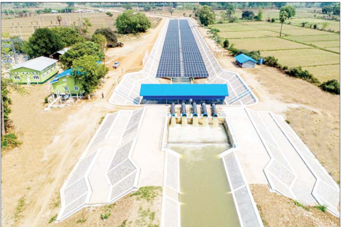
ငါးရောက်မြစ်ရေတင်လုပ်ငန်း ရေတင်အဆင့်(၂) တွင် ဆိုလာစနစ်(567 k W) တွဲဖက်တပ်ဆင်၍ ရေပေးဝေစဉ်။

အကျိုးပြုဧက ၁၆၄၅၅ ဧကရှိ ညောင်ဦးခရိုင်အတွင်း ဆည်မြောင်း နှင့် ရေအသုံးချမှုစီမံခန့်ခွဲရေးဦးစီးဌာန လက်ထောက်ညွှန်ကြားရေးမှူးရုံး (ရေ အရင်းအမြစ်) က စိုက်ပျိုးရေး ပေးဝေနိုင် ရန် အကောင်အထည်ဖော်ဆောင်ရွက် ပြီးစီးသည့် လက်ပံခြေပေါ် မြစ်ရေတင်၊ သူကောင်းတည်မြစ်ရေတင်၊ ငါးရောက် မြစ်ရေတင်၊ ကျောက်ကူးမြစ်ရေတင်နှင့် လောကနန္ဒာမြစ်ရေတင်ဟူ၍ ရေတင် လုပ်ငန်းငါးခုရှိရာ ငါးရောက်မြစ်ရေ တင်တွင် အကျိုးပြုဧက ၂၁၅၅ ဧက၊ လက်ပံခြေပေါ် မြစ်ရေတင်တွင် အကျိုး ပြုဧက ၁၀၀၀၊ သူကောင်းတည် မြစ်ရေ တင်တွင် အကျိုးပြုဧက ၄၃၀၀၊ ကျောက် ကူးမြစ်ရေတင်တွင် အကျိုးပြုဧက ၁၈၀၀ နှင့် လောကနန္ဒာမြစ်ရေတင်တွင် အကျိုးပြုဧက ၇၂၀၀ စုစုပေါင်းအကျိုးပြု ဧက ၁၆၄၅၅ ဧကရှိကြောင်း သိရသည်။