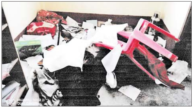
တိုင်းဒေသကြီးနှင့် ပြည်နယ်အသီးသီးရှိ ရွေးကောက်ပွဲကော်မရှင်အဖွဲ့ခွဲရုံး အဆောက်အအုံနှင့် ရုံးသုံးပစ္စည်းများ မီးလောင်ပျက်စီးခဲ့မှု မှတ်တမ်းဓာတ်ပုံများ။