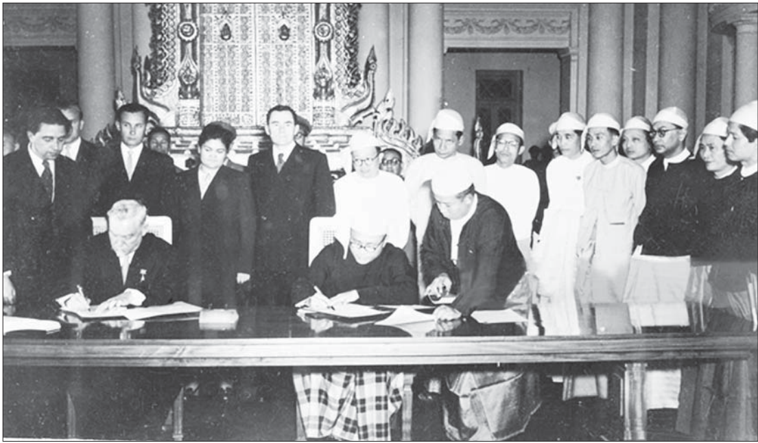
၁၉၅၅ ခုနှစ်တွင် မြန်မာနိုင်ငံဝန်ကြီးချုပ်နှင့် ရုရှားနိုင်ငံ (ယခင် ဆိုဗီယက်) ခေါင်းဆောင်တို့ နိုင်ငံတည်ဆောက်ရေးလုပ်ငန်း များအတွက် လက်မှတ်ရေးထိုးစဉ်။

ရုရှားနိုင်ငံ (ယင်းအချိန်က ဆိုဗီယက် ပြည်ထောင်စု) သည် မြန်မာနိုင်ငံနှင့် သံတမန်ဆက်ဆံရေး အစောဆုံး တည်ထောင်ခဲ့သည့် နိုင်ငံတစ်နိုင်ငံလည်း ဖြစ်သည်။ မြန်မာနိုင်ငံ လွတ်လပ်ရေး ရပြီးနောက် ၁၉၄၈ ခုနှစ် ဖေဖော်ဝါရီလ ၁၈ ရက်နေ့တွင် ရုရှားနိုင်ငံနှင့် သံတမန် ဆက်ဆံရေး ထူထောင်ချိန်မှစကာ နှစ်နိုင်ငံစလုံးက အပြန်အလှန် ဆက်ဆံရေးကို ထိန်းသိမ်းမြှင့်တင်ခဲ့ကြ သည်။ မြန်မာနိုင်ငံ၏ သံတမန် ဆက်ဆံရေးတွင် ရုရှားနိုင်ငံသည် ဆဋ္ဌမ မြောက်နိုင်ငံ ဖြစ်ပါသည်။ မြန်မာနှင့် ရုရှားနိုင်ငံတို့သည် ပထဝီအနေအထား အရ သမုဒ္ဒရာများနှင့် တိုက်ကြီးများဖြင့် ခြားထားသော်လည်း နှစ်နိုင်ငံ အပြန် အလှန်နားလည်မှု၊ စီးပွားရေးအခွင့် အလမ်းနှင့် မဟာဗျူဟာဆိုင်ရာ ထည့်သွင်းစဉ်းစားမှုများအပေါ် အခြေခံ ၍ နီးကပ်သော ဆက်ဆံရေး တည်ဆောက်ခဲ့ကြသည်မှာ စိန်ရတုပင် တိုင်ပြီဖြစ်သည်။