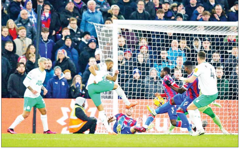
နယူးကာဆယ်အသင်းနှင့် ခရစ္စတယ်ပဲလေ့စ်အသင်းတို့ ယှဉ်ပြိုင်ကစားစဉ်။

ခရစ္စတယ်ပဲလေ့စ်အသင်းကတော့ နယူးကာဆယ် အသင်းနဲ့ ပွဲစဉ်မှာ သရေရလဒ်မှတ် ရယူနိုင်ခဲ့တာ ကြောင့် ပရီမီယာလိဂ်ပွဲစဉ် ၂၀ ကစားပြီးချိန်မှာ ရမှတ် ၂၄ မှတ်နဲ့ အမှတ်ပေးဇယား အဆင့် ၁၂ နေရာ မှာ ရပ်တည်နေတာဖြစ်ပါတယ်။