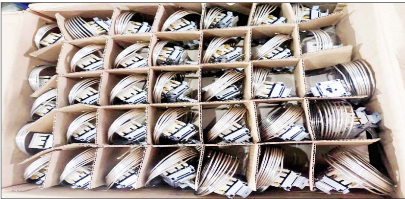
ရန်ကုန်အပြည်ပြည်ဆိုင်ရာလေဆိပ် လေဆိပ်ကုန်လှောင်ရုံ၌ သိမ်းဆည်းရမိမှုအား တွေ့ရစဉ်။

ရက်တွင် မူဆယ်မြို့မှ မန္တလေးမြို့သို့ မောင်းနှင် လာသော ယာဉ်တစ်စီးပေါ်မှ သွင်းကုန် ကြေညာလွှာ (ID) တွင် ကြေညာထားခြင်း မရှိသော မော်တော်ကား အရှေ့လေကာမှန် အချပ် ၉၀ အပါအဝင် ကုန်ပစ္စည်း ကိုးမျိုး (ခန့်မှန်းတန်ဖိုးငွေကျပ် ၁၇၂၄၀၀၀) နှင့် အဆိုပါပစ္စည်းများ တင်ဆောင်သော DONGFENG အမျိုးအစားယာဉ် တစ်စီးနှင့် နောက်တွဲယာဉ်တစ်စီး (ခန့်မှန်းတန်ဖိုးငွေကျပ် ၇၀၀၀၀၀)ကိုလည်းကောင်း၊ ဇန်နဝါရီ ၂၁ ရက်တွင် မူဆယ်မြို့မှ မန္တလေးမြို့သို့ မောင်းနှင် လာသော ယာဉ်တစ်စီးပေါ်မှ တင်သွင်းခွင့် အထောက်အထား တင်ပြနိုင်ခြင်းမရှိသည့် Pudding Cabin Table Lamp ငါးခု၊ Nongfu Spring Water ဘူး ၂၀ အပါအဝင် ကုန်ပစ္စည်း အမျိုး ၂၀ (ခန့်မှန်းတန်ဖိုးငွေကျပ် ၂၅၉၀၀၀) နှင့် အဆိုပါပစ္စည်းများ တင်ဆောင်သော HIGER Bus အမျိုးအစားယာဉ်တစ်စီး (ခန့်မှန်း တန်ဖိုးငွေကျပ် ၁၀၀၀၀၀၀) ကိုလည်း ကောင်း စုစုပေါင်း ခန့်မှန်းတန်ဖိုးငွေကျပ် ၂၀၉၈၃၀၀၀ ကို သိမ်းဆည်းရမိခဲ့ပြီး အကောက်ခွန် လုပ်ထုံးလုပ်နည်းနှင့်အညီ အရေးယူဆောင်ရွက်လျက်ရှိသည်။ ထို့ပြင် ဇန်နဝါရီ ၂၀ ရက်တွင် ကရင် ပြည်နယ် တရားမဝင်ကုန်သွယ်မှု တိုက်ဖျက် ရေးအထူးအဖွဲ့၏ စီမံခန့်ခွဲမှုဖြင့် ဘားအံမြို့နယ် အကောက်ခွန်ဦးစီးဌာနမှူးရုံးမှ အကောက်ခွန် အဖွဲ့က စစ်ဆေးမှုများ ဆောင်ရွက်ခဲ့ရာ မြဝတီ မြို့မှ ပဲခူးမြို့သို့ သွားရောက်မည့် ယာဉ်တစ်စီး ပေါ်မှ စာရွက်စာတမ်း အထောက်အထား တင်ပြနိုင်ခြင်းမရှိသည့် Lactasoy Soymilk ဖာ ၄၀၊ 26 လက်မ TV နှစ်လုံး အပါအဝင် ကုန်ပစ္စည်း ခြောက်မျိုး (ခန့်မှန်းတန်ဖိုးငွေကျပ် ၃၀၆၈၀၀)နှင့် အဆိုပါပစ္စည်းများ တင်ဆောင် သော Mitsubishi Canter အမျိုးအစား ယာဉ်