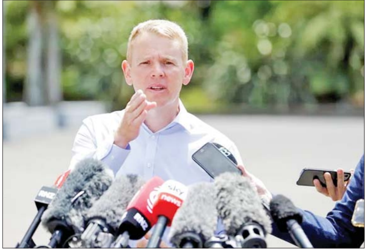
ခရစ်ဟစ်ကင်းစ်သည် အောက်တိုဘာလ ရွေးကောက်ပွဲမတိုင်မီ မဲဆန္ဒရှင် များ၏ ထောက်ခံမှုကိုရရှိရန် ကြိုးပမ်း သွားမည်ဖြစ်ကြောင်း သိရသည်။ ကိုးကား- အင်န်အိတ်ချ်ကေ ဘာသာပြန်- အောင်ကျော်ကျော်

ကောင်းမွန်စွာ ကိုင်တွယ်ဖြေရှင်းပေး ခဲ့သည့်အတွက် ချီးကျူးစကားဆိုခဲ့သည်။ အသက် ၄၄ နှစ်အရွယ် ခရစ်ဟစ် ကင်းစ်သည် ၂၀၀၈ ခုနှစ်တွင် ပါလီမန်တွင် ပညာရေးဝန်ကြီးအဖြစ် ပထမဆုံး ရွေးချယ်ခံခဲ့ရသည်။ ၂၀၂၀ မှ ၂၀၂၂ ခုနှစ်အထိ ၎င်းသည် ကိုဗစ်-၁၉ ရောဂါ တုံ့ပြန်ရေးဝန်ကြီးအဖြစ် ဝန်ကြီးချုပ် အာဒန်နှင့်အတူ ကပ်ရောဂါကို ထိန်းချုပ် ရန် ကြိုးပမ်းဆောင်ရွက်ခဲ့သည်။ နိုင်ငံအတွင်း ငွေကြေးဖောင်းပွမှုနှင့် ရာဇဝတ်မှုများ မြင့်တက်လာခြင်းကြောင့် ဝန်ကြီးချုပ်အာဒန်၏ အစိုးရအဖွဲ့အတွက် စိန်ခေါ်မှုများ မြင့်တက်လျက်ရှိသည်။