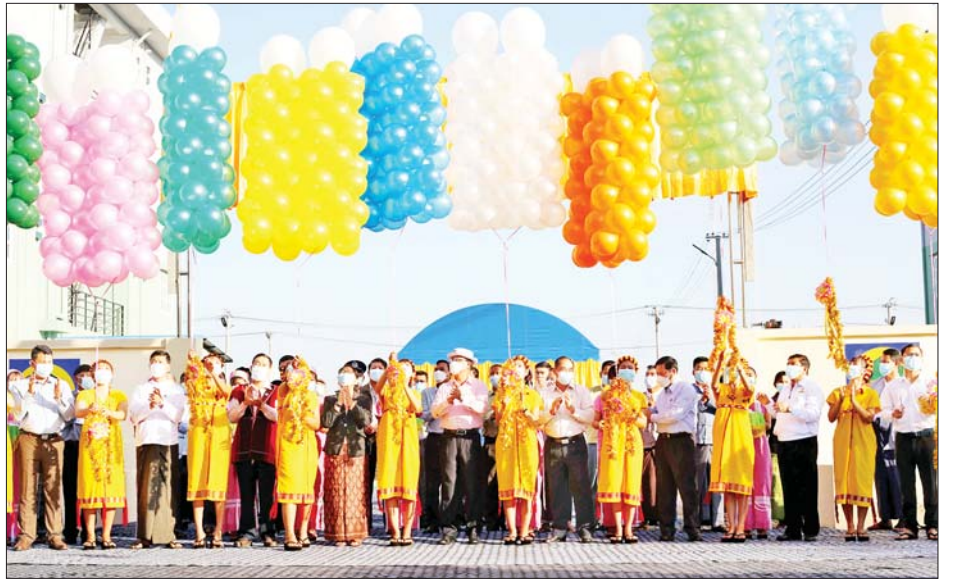
ကရင်ပြည်နယ်အတွင်း ဝန်ထမ်းအိမ်ရာ ၁၈၂ လုံး (အိမ်ခန်းပေါင်း ၆၄၇ ခန်း)၊ အငှားအိမ်ရာ ၇၆ လုံး (အိမ်ခန်းပေါင်း ၁၄၂ ခန်း)၊ အရောင်းအိမ်ရာ သုံးလုံး

ကရင်ပြည်နယ် မြို့ပြနှင့် အိမ်ရာဖွံ့ဖြိုးတိုးတက် ရေးဦးစီးဌာနအနေဖြင့် ၂၀၂၂-၂၀၂၃ ဘဏ္ဍာနှစ်အထိ