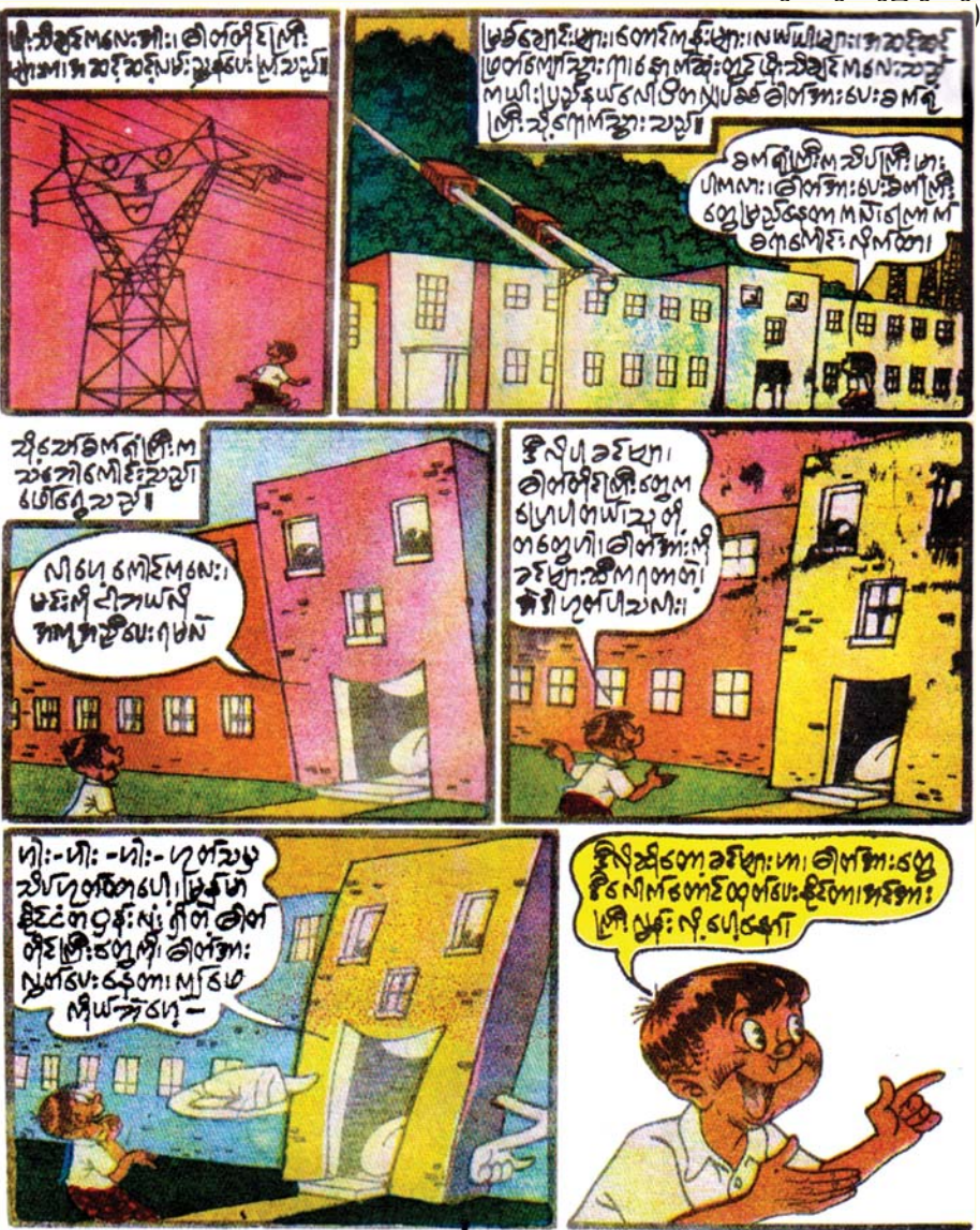
(ဆက်လက်ဖော်ပြပါမည်)

ဆရာမငွေတာရီ၏ ငွေတာရီကဗျာပေါင်းချုပ်မှကဗျာကို စာရေးသူမိသားစု၏ ခွင့်ပြုချက်ဖြင့် ကူးယူဖော်ပြပါသည်။