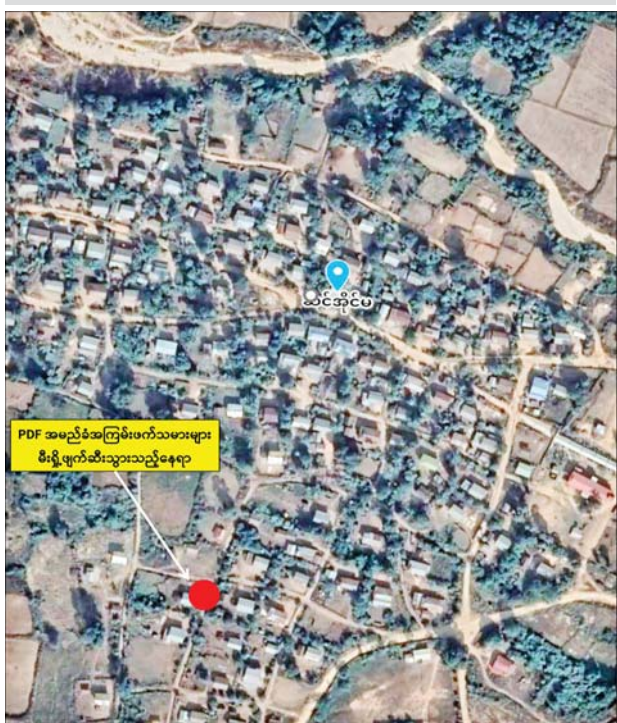
PDF အမည်ခံ အကြမ်းဖက်သမားများ မီးရှို့ဖျက်ဆီးခဲ့သည့် ကလေးဝမြို့နယ် ဆင်အိုင်မကျေးရွာပြပုံ

နေပြည်တော် ဇန်နဝါရီ ၂၂ စစ်ကိုင်းတိုင်းဒေသကြီး ကလေးဝမြို့နယ် ဆင်အိုင်မကျေးရွာအတွင်းရှိ နေအိမ်များအား PDF အမည်ခံ အကြမ်းဖက်သမားများက အကြောင်းမဲ့မီးရှို့ဖျက်ဆီးခဲ့ကြောင်း သိရသည်။ ဖြစ်စဉ်မှာ PDF အမည်ခံ အကြမ်းဖက်သမား အင်အား ၇၀ ခန့်သည် ဇန်နဝါရီ ၂၁ ရက် ညနေ ၃ နာရီ ၄၅ မိနစ်ခန့်တွင် စစ်ကိုင်းတိုင်းဒေသကြီး ကလေးဝမြို့နယ် ဆင်အိုင်မကျေးရွာရှိ ရောက်ရှိလာပြီး နေအိမ်များအား အကြောင်းမဲ့မီးရှို့ဖျက်ဆီးခဲ့သဖြင့် လူနေအိမ် ၁၅ လုံး မီးလောင်ပျက်စီးခဲ့ပြီး အပြစ်မဲ့ပြည်သူ အမျိုးသားသုံးဦးနှင့် အမျိုးသမီး တစ်ဦး မီးလောင်ဒဏ်ရာများဖြင့် သေဆုံးခဲ့ကြောင်း သိရသည်။ အထက်ပါဖြစ်စဉ်များမှ အကြမ်းဖက်မှုလုပ်ရပ်များကို ကျူးလွန်သူများအား ဥပဒေနှင့်အညီ ထိရောက်စွာ အရေးယူနိုင်ရေး လုံခြုံရေးတပ်ဖွဲ့ဝင်များက ဆက်လက်ဆောင်ရွက်လျက်ရှိကြောင်း သိရသည်။ သတင်းစဉ်