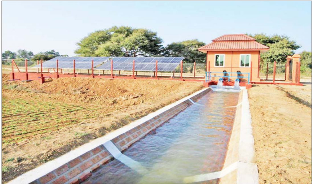
လောကနန္ဒာမြစ်ရေတင်လုပ်ငန်းဧရိယာအတွင်းရှိ Upland Area များကို ဆိုလာစနစ်သုံး အနိမ့်တင်ပန်များတပ်ဆင်၍ ဆောင်းသီးနှံရေပေးဝေစဉ်။

လယ်ကြားရေးသွင်းမြောင်းတစ်ခုမှ မြစ်ရေတင် ရေသောက်တောင်သူ အချင်းချင်း အဖွဲ့အစည်းစိတ်ဓာတ်ဖြင့် အလေ့အကျင့်ကောင်းများ ရရှိစေရေး၊ မြစ်ရေပေးဝေမှု စီမံခန့်ခွဲခြင်း လုပ်ငန်းစဉ်များနှင့် မြစ်ရေတင်မြောင်း အဆောက်အအုံများ ပြုပြင်ထိန်းသိမ်းမှု လုပ်ငန်းစဉ်များကို မြစ်ရေတင်ရေဖြင့် အသုံးပြုတောင်သူများ ကောင်းစွာသိရှိ နားလည်စေပြီး ဌာနနှင့်အတူ စာမျက်နှာ ၁၁ သို့ *