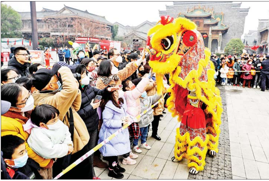
ကျင်းပခွင့်ပြုခြင်းဖြစ်သည်။ နိုင်ငံတစ်ဝန်း၌ တင်းကျပ်သော ကိုဗစ်-၁၉ ရောဂါ ကျန်းမာရေး စည်းမျဉ်းများကို ရုပ်သိမ်းလိုက်ပြီး ဖြစ်သည့်အတွက် နှစ်သစ်ကူး အားလပ်ရက်အတွင်း ခရီးစဉ် ပေါင်း ၂ ဒသမ ၁ ဘီလီယံနီးပါး ရှိနိုင်ရန် မျှော်မှန်းထားကြောင်း သိရသည်။ အဆိုပါခရီးစဉ် အရ အတွက်သည် ယမန်နှစ်ထက် နှစ်ဆ ပိုမိုများပြားသည်။

ပေကျင်း ဇန်နဝါရီ ၂၂ တရုတ်နိုင်ငံ၌ ကိုဗစ်-၁၉ ရောဂါ ကျန်းမာရေးစည်းမျဉ်းများ ဖြေလျှော့ပြီးနောက် ပထမဆုံး အကြိမ် နှစ်သစ်ကူးပွဲတော်ကို ပြည်သူများက ပျော်ရွှင်စွာ ကျင်းပ လျက်ရှိကြောင်း ယနေ့သတင်း များအရ သိရသည်။ ယခုနှစ် ဇန်နဝါရီ ၂၂ ရက်တွင် ကျရောက်သည့် နှစ်သစ်ကူးနေ့ မတိုင်မီ ဇန်နဝါရီ ၂၁ ရက် နေ့ဦး ပွဲတော် အားလပ်ရက် စတင်ချိန်မှ စပြီး တရုတ်ပြည်သူများသည် မွေးရပ်မြေ သို့မဟုတ် လည်ပတ် စရာ နေရာများသို့ အလည်အပတ် ခရီးများ စတင်ထွက်ခွာလျက် ရှိသည်။ တရုတ်အစိုးရသည် ကိုဗစ်-၁၉ ရောဂါ ကျန်းမာရေးစည်းမျဉ်း များကို ယခုလ အစောပိုင်းတွင် အဆုံးသတ်ပြီးနောက် ယခုနှစ်သစ် ကူးပွဲတော်ကို နိုင်ငံတစ်ဝန်း၌