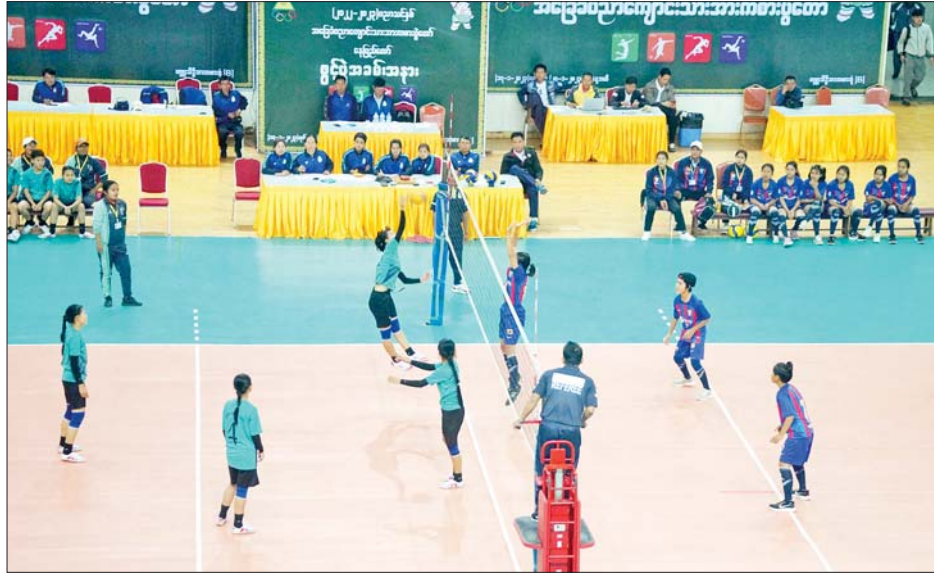
အမျိုးသမီး ဘော်လီဘောပြိုင်ပွဲ ကျင်းပစဉ်။