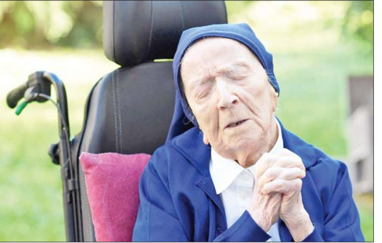
ကောင်းမွန်လာခဲ့ကြောင်း သိရသည်။ ဂျပန်အမျိုးသမီး တာနာကာ ကာနို ကွယ်လွန်ပြီးနောက် ကမ္ဘာပေါ်တွင် အသက်အကြီးဆုံး သက်ရှိထင်ရှားပုဂ္ဂိုလ် အဖြစ် အသိအမှတ်ပြုခံခဲ့ရသည်။ အဘွားအို ရန်ဒွန်သည် ပြင်သစ် နိုင်ငံတောင်ပိုင်းရှိ သက်ကြီးစောင့်ရှောက်ရေးဂေဟာတွင် ဇန်နဝါရီ ၁၇ ရက်က သေဆုံးသွားခဲ့ကြောင်း ပြင်သစ်မီဒီယာ များက သတင်းဖော်ပြသည်။ ကိုးကား - အင်န်အိတ်ချီကော ဘာသာပြန် - အောင်ကျော်ကျော်

ပါရီ ဇန်နဝါရီ ၁၈ ကမ္ဘာ့အသက်အကြီးဆုံး အဖြစ် အသိအမှတ်ပြုခံထားရသည့် အသက် ၁၁၈ နှစ်အရွယ် ပြင်သစ်အဘွားအို ယမန်နေ့က ကွယ်လွန်ခဲ့ကြောင်း သိရသည်။ အဘွားအို လူဆီလီရန်ဒွန်ကို ဂရင်းနစ် ကမ္ဘာ့စံချိန်မှတ်တမ်းများအရ ၁၉၀၄ ခုနှစ် တွင် မွေးဖွားခဲ့သည်။ သူ၏ဘဝတစ်လျှောက်လုံး ဆရာမ တစ်ဦးအဖြစ် အသက်မွေးဝမ်းကျောင်းပြု ခဲ့ပြီးနောက် ၁၉၄၄ ခုနှစ်တွင် Sister Andre အမည်ဖြင့် ကက်သလစ်သီလရှင် ဖြစ်လာခဲ့သည်။ ထိုအချိန်မှစ၍ သူ၏ဘဝ အများစုကို ဘာသာရေးတွင် မြှုပ်နှံခဲ့သည်။ အဘွားအို ရန်ဒွန်သည် ၂၀၂၁ ခုနှစ် ဇန်နဝါရီလတွင် အသက် ၁၁၆ နှစ်အရွယ် ၌ ကိုရိုနာဗိုင်းရပ်စ်ကူးစက်ခံစားရ ကြောင်း စစ်ဆေးတွေ့ရှိခဲ့သော်လည်း သုံးပတ်ခန့်အကြာတွင် ပြန်လည်