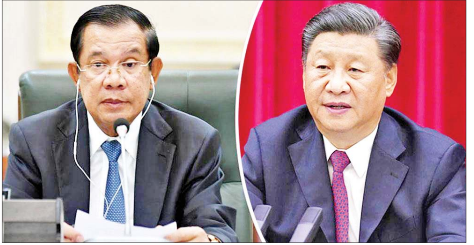
သည် စီမံကိန်းအများအပြားကို ဆောင်ရွက်လျက် ရှိသည်။ ကမ္ဘောဒီးယားနိုင်ငံက ၎င်း၏ ရင်းနှီးမြှုပ်နှံမှု အများဆုံးဖြစ်သည့် တရုတ်နိုင်ငံနှင့် ဆက်ဆံရေး ပိုမိုခိုင်မာစေရန် ရည်မှန်းထားကြောင်းလည်း နိုင်ငံရေးလေ့လာသူများက ဆိုသည်။ ကိုးကား - အင်န်အိတ်ချီကော ဘာသာပြန် - အောင်ကျော်ကျော်

မည်ဖြစ်သည်။ တရုတ်နိုင်ငံသည် အရှေ့တောင်အာရှနိုင်ငံများ တွင် ၎င်း၏ ပါဝင်ပတ်သက်မှုကို အရှိန်မြှင့်လှုပ်ဆောင် လျက်ရှိသည်။ မြို့တော် ဖေဖော်ပင်နှင့် တရုတ်နိုင်ငံတောင်ပိုင်း ဆိပ်ကမ်းမြို့ Sihanoukville နှင့် ဆက်သွယ်ပေးသည့် ကိုလိုမီတာ ၁၉၀ ရှည်သော အမြန်လမ်းကို ပြီးခဲ့သည့် နိုဝင်ဘာလတွင် ဖွင့်လှစ်ခဲ့သည်။ တရုတ်ကုမ္ပဏီတစ်ခုသည် အဆိုပါ အမြန်လမ်း ဖောက်လုပ်ရေးလုပ်ငန်းအတွက် အမေရိကန်ဒေါ်လာ နှစ်ဘီလီယံခန့် ထောက်ပံ့ခဲ့သည်။ စီးပွားရေးတိုးတက်မှု အရှိန်အဟုန်ရရှိနေသည့် ကမ္ဘောဒီးယားနိုင်ငံ၌ တရုတ်ကုမ္ပဏီအများအပြား