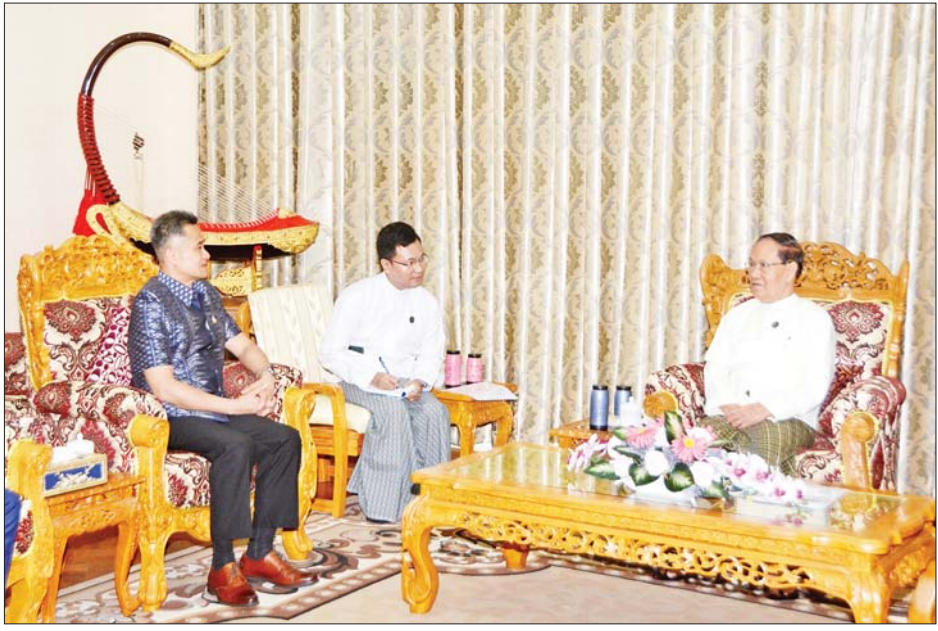
ကြောင်းနှင့် ခရီးသွားလာရေး ဖွံ့ဖြိုးတိုးတက်ရေး အတွက်လည်း ပူးပေါင်းဆောင်ရွက်လိုကြောင်း ပြောကြားသည်။ တွေ့ဆုံပွဲသို့ သာသနာရေးနှင့် ယဉ်ကျေးမှုဝန်ကြီး ဌာန ဒုတိယဝန်ကြီး (သာသနာရေး) ဦးအေးထွန်းနှင့် ဒုတိယဝန်ကြီး (ယဉ်ကျေးမှု) ဒေါက်တာမိုးဇော်ထွန်း၊ ဒုတိယအမြဲတမ်းအတွင်းဝန်များ တက်ရောက်ကြ သည်။ သတင်းစဉ်

သံအမတ်ကြီးက မြန်မာနိုင်ငံမှ ၂၀၂၃ ခုနှစ် ဇန်နဝါရီ ၁၉ ရက်တွင် ကျင်းပမည့် မဲခေါင်-လန်ချန်း ဒေသရိုးရာအကပွဲတော်သို့ တက်ရောက်မည် ဖြစ်ကြောင်း၊ မြန်မာနိုင်ငံမှ ကျင်းပမည့် အလားတူ ပွဲတော်များတွင်လည်း ထိုင်းနိုင်ငံမှ ပါဝင်ဆင်နွှဲရန် ဆန္ဒရှိကြောင်း၊ အဆိုပါကဏ္ဍများတွင် ပူးပေါင်း ပါဝင်ခြင်းဖြင့် နှစ်နိုင်ငံအကြား ရင်းနှီးချစ်ခင်မှုကို ပိုမိုရရှိမည်ဖြစ်ကြောင်း၊ ကိုဗစ်-၁၉ ကပ်ရောဂါ အား ထိန်းချုပ်နိုင်ပြီးဖြစ်သည့်အတွက် နှစ်နိုင်ငံ ပူးပေါင်း၍ ပွဲတော်များ ပူးပေါင်းဆောင်ရွက်လိုပါ