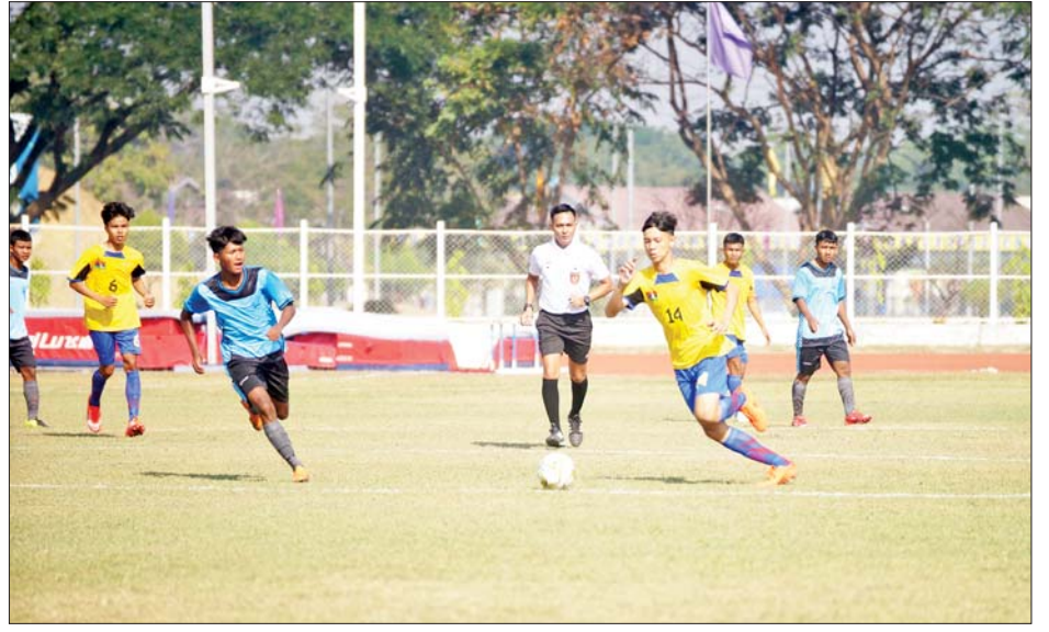
အမျိုးသား ဘောလုံးပြိုင်ပွဲ ကျင်းပစဉ်။