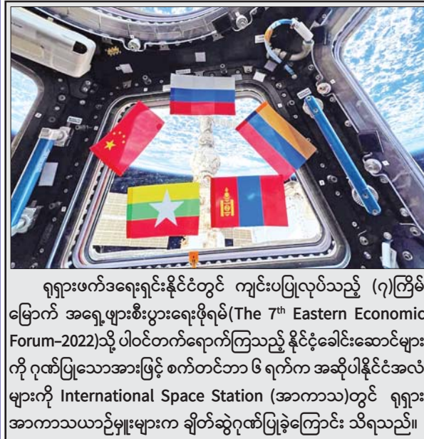
ရုရှားဖက်ဒရေရှင်းနိုင်ငံတွင် ကျင်းပပြုလုပ်သည့် (၇)ကြိမ်မြောက် အရှေ့ပွားစီးပွားရေးဖိုရမ်(The 7th Eastern Economic Forum-2022)သို့ ပါဝင်တက်ရောက်ကြသည့် နိုင်ငံခြားသားများကို ဂုဏ်ပြုသောအားဖြင့် စက်တင်ဘာ ၆ ရက်က အဆိုပါနိုင်ငံအလံများကို International Space Station (အာကာသ)တွင် ရုရှားအာကာသယာဉ်မှူးများက ချိတ်ဆွဲရန်ပြုခဲ့ကြောင်း သိရသည်။