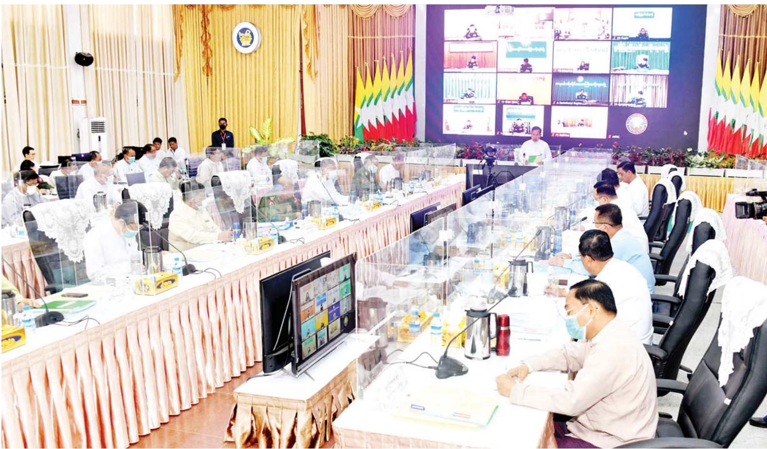
နိုင်ငံတော်စီမံအုပ်ချုပ်ရေးကောင်စီဒုတိယဥက္ကဋ္ဌ ဒုတိယဝန်ကြီးချုပ် ဒုတိယဗိုလ်ချုပ်မှူးကြီးစိုးဝင်း တရားမဝင်ကုန်သွယ်မှုတိုက်ဖျက်ရေးဦးဆောင်ကော်မတီ လုပ်ငန်းညှိနှိုင်း အစည်းအဝေး(၁/၂၀၂၃)တွင် အမှာစကားပြောကြားစဉ်။

နေပြည်တော် ဇန်နဝါရီ ၁၈ တရားမဝင် ကုန်သွယ်မှု တိုက်ဖျက်ရေးဦးဆောင်ကော်မတီ လုပ်ငန်းညှိနှိုင်း အစည်းအဝေး (၁/၂၀၂၃) ကို ယနေ့မနန်းလွဲ ၂ နာရီ တွင် နေပြည်တော်ရှိ စီးပွားရေးနှင့် ကူးသန်းရောင်းဝယ်ရေးဝန်ကြီးဌာန အစည်းအဝေးခန်းမ၌ ကျင်းပရာ တရားမဝင်ကုန်သွယ်မှု တိုက်ဖျက်ရေးဦးဆောင်ကော်မတီ ဥက္ကဋ္ဌ နိုင်ငံတော်စီမံအုပ်ချုပ်ရေးကောင်စီ ဒုတိယဥက္ကဋ္ဌ ဒုတိယဝန်ကြီးချုပ် ဒုတိယဗိုလ်ချုပ်မှူးကြီး စိုးဝင်း တက်ရောက်အမှာစကား ပြောကြားသည်။