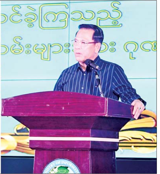
ပြည်ထောင်စုဝန်ကြီး ဦးမောင်မောင်အုန်း စိန်ရတုလွတ်လပ်ရေးနေ့ ဂုဏ်ပြုအခမ်းအနားတွင် ပါဝင်ဆောင်ရွက်ခဲ့ကြသည့် ပြန်ကြားရေးဝန်ကြီးဌာနမှ ဝန်ထမ်းများအား ဂုဏ်ပြုပွဲအခမ်းအနားတွင် အမှာစကားပြောကြားစဉ်။

အခမ်းအနားသို့ ပြည်ထောင်စုဝန်ကြီး ဦးမောင်မောင်အုန်းနှင့် ဇနီးဒေါ်ခင်ဆွေဝင်း၊ ဒုတိယဝန်ကြီး ဦးရဲတင့်နှင့်ဇနီးဒေါ်ဝင်းရီ၊ အမြဲတမ်းအတွင်းဝန်နှင့် ဇနီး၊ ညွှန်ကြားရေးမှူးချုပ်များ၊ ဒုတိယ ညွှန်ကြားရေးမှူးချုပ်များနှင့် ဝန်ထမ်းများ တက်ရောက်ကြသည်။