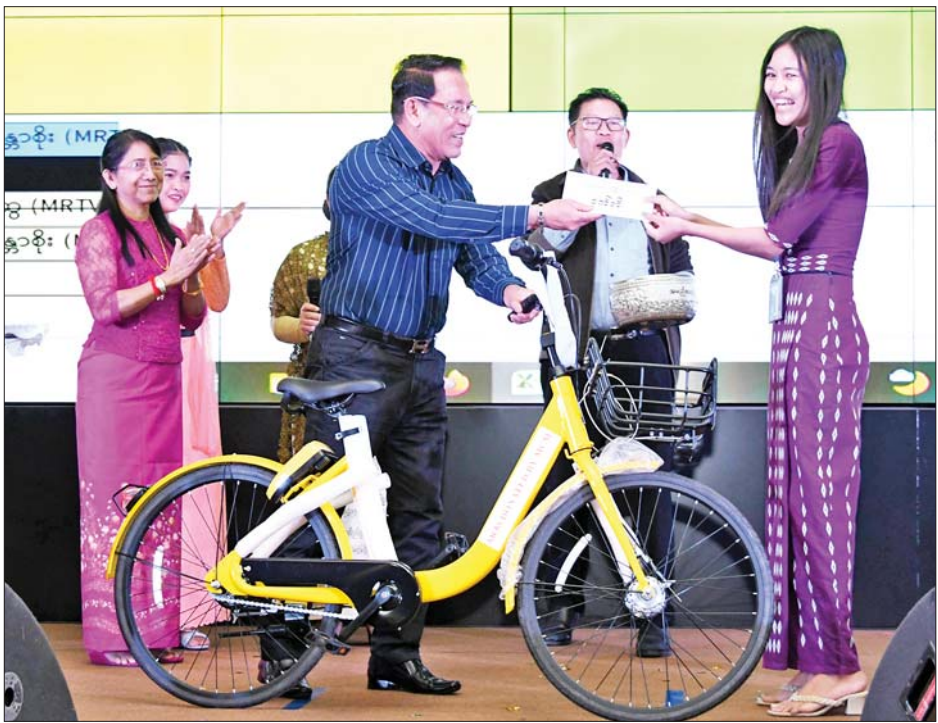
ပုံနှိပ်ရေးနှင့် ထုတ်ဝေရေးဦးစီးဌာန၊ သတင်းနှင့်စာနယ်ဇင်းလုပ်ငန်းတို့မှ ဝန်ထမ်းနှစ်ဦးစီတို့က လက်ခံရယူကြသည်။ ပေးအပ်ယင်းနောက် ပြည်ထောင်စု

သမိုင်းတွင်မည့် ဂုဏ်ယူဖွယ် အခမ်းအနားကြီး အောင်မြင်စွာ ကျင်းပနိုင်ခဲ့ခြင်းသည် ဝန်ထမ်းများ၏ စွမ်းဆောင်ချက်ကြောင့် ဖြစ်ပါကြောင်း၊ အဘက်ဘက်မှ ဝိုင်းဝန်းပံ့ပိုးပေးခဲ့သည့် ဝန်ထမ်းများကို မှတ်တမ်းတင်ဂုဏ်ပြုအပ်ပါကြောင်း ပြောကြားသည်။ မှတ်တမ်းဗီဒီယိုကို ပြသ ထို့နောက် (၇၅) နှစ်မြောက် စိန်ရတုလွတ်လပ်ရေးနေ့ အထိမ်းအမှတ် ဂုဏ်ပြုအခမ်းအနားများ၊ ပွဲတော်များ၊ ပဒေသာကပွဲ ကျင်းပခဲ့ပုံများနှင့် ပတ်သက်သည့် မှတ်တမ်းဗီဒီယိုကို ပြသသည်။ ဆက်လက်၍ ဒုတိယဝန်ကြီး ဦးရဲတင့်က စစ်ရေးပြတပ်ခွဲတွင် ပါဝင်ခဲ့သည့် ဝန်ထမ်း ၁၆၅ ဦးအတွက် ဂုဏ်ပြုမှတ်တမ်းလွှာများ ပေးအပ်ရာ ဝန်ထမ်းများကိုယ်စား ဝန်ကြီးရုံး၊ မြန်မာ့အသံနှင့် ရုပ်မြင်သံကြား၊ ပြန်ကြားရေးနှင့် ပြည်သူ့ဆက်ဆံရေးဦးစီးဌာန၊