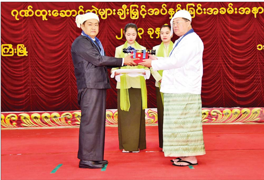
ရှမ်းပြည်နယ် ဝန်ကြီးချုပ် ဒေါက်တာကျော်ထွန်း သီရိပျံချီဘွဲ့ရရှိသူ "ဝ" အမျိုးသားပါတီ ဥက္ကဋ္ဌ ဦးခွန်ထွန်းလူ(ခ)ဦးဒီကီ ကိုယ်စား သားဖြစ်သူ ဦးခွန်စောမင်းခေါင် ကို ဂုဏ်ထူးဆောင်ဘွဲ့ ချီးမြှင့်အပ်နှင်းစဉ်။