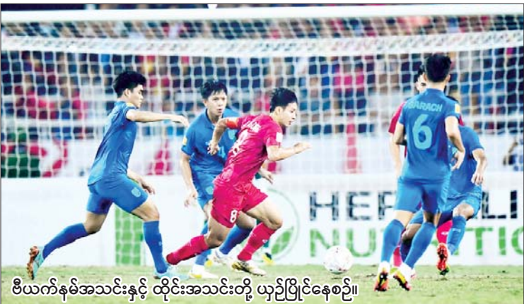
ဗီယက်နမ်အသင်းနှင့် ထိုင်းအသင်းတို့ ယှဉ်ပြိုင်နေစဉ်။