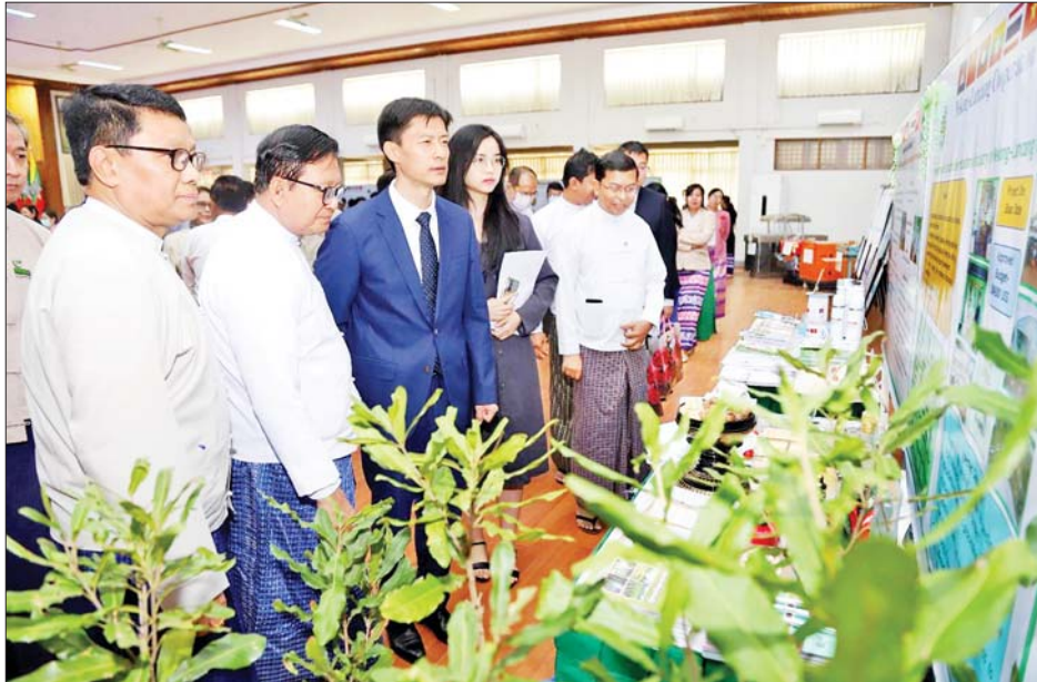
အစီအစဉ်အရ မဲခေါင်-လန်ချန်း ပူးပေါင်း ဆောင်ရွက်မှုအထူးရန်ပုံငွေအဖွဲ့ ဒုတိယဥက္ကဋ္ဌ ဦးဝင်းဇေယျာထွန်းနှင့် မြန်မာနိုင်ငံဆိုင်ရာ တရုတ် ပြည်သူ့သမ္မတနိုင်ငံ သံမှူးကြီး Dr. Zheng Zhihong တို့က အမှာစကားပြောကြားကြပြီး မဲခေါင်-လန်ချန်း

မဲခေါင်-လန်ချန်း ပူးပေါင်းဆောင်ရွက်ရေး ဆိုင်ရာ အထူးရန်ပုံငွေ အထောက်အပံ့ဖြင့် စီမံကိန်း များ အကောင်အထည်ဖော် ဆောင်ရွက်ခွင့်ရရှိသည့် အတွက် မြန်မာ့ကျေးလက်နေ ပြည်သူများ၏ လူမှု စီးပွားဘဝနှင့် လူနေမှုအဆင့်အတန်း မြှင့်တင်ရေး ကို များစွာအထောက်အကူဖြစ်စေနိုင်သဖြင့် အကျိုး ကျေးဇူးများစွာရှိသော စီမံကိန်းလုပ်ငန်းဖြစ် ကြောင်း၊ မဲခေါင်-လန်ချန်း ပူးပေါင်းဆောင်ရွက်ရေး ဆိုင်ရာ အထူးရန်ပုံငွေ အထောက်အပံ့ဆိုင်ရာစီမံကိန်း ၃၁ ခုကို နယ်ပယ်အလိုက် ရည်မှန်းထားသော ရည်ရွယ်ချက်များ ပြည့်ဝသည်အထိ အကောင် အထည်ဖော်ဆောင်ရွက်သွားမည်ဖြစ်ကြောင်း ယနေ့ နံနက်ပိုင်းက စိုက်ပျိုးရေး၊ မွေးမြူရေးနှင့် ဆည်မြောင်း ဝန်ကြီးဌာန စုဝေးဆောင်ခန်းမ၌ ကျင်းပသည့် မဲခေါင်-လန်ချန်း ပူးပေါင်းဆောင်ရွက်မှု အထူး ရန်ပုံငွေ(၂၀၂၂)ဖြင့် စိုက်ပျိုးရေး၊ မွေးမြူရေးနှင့် ဆည်မြောင်းဝန်ကြီးဌာနက အကောင်အထည်ဖော် ဆောင်ရွက်ခွင့်ရရှိခဲ့သည့် ပဉ္စမအသုတ်စီမံကိန်းများ စတင်ကြောင်း အသိပေးကြေညာခြင်းအခမ်းအနား တွင် ဒုတိယဝန်ကြီး ဒေါက်တာအောင်ကြီးက ပြောကြားသည်။