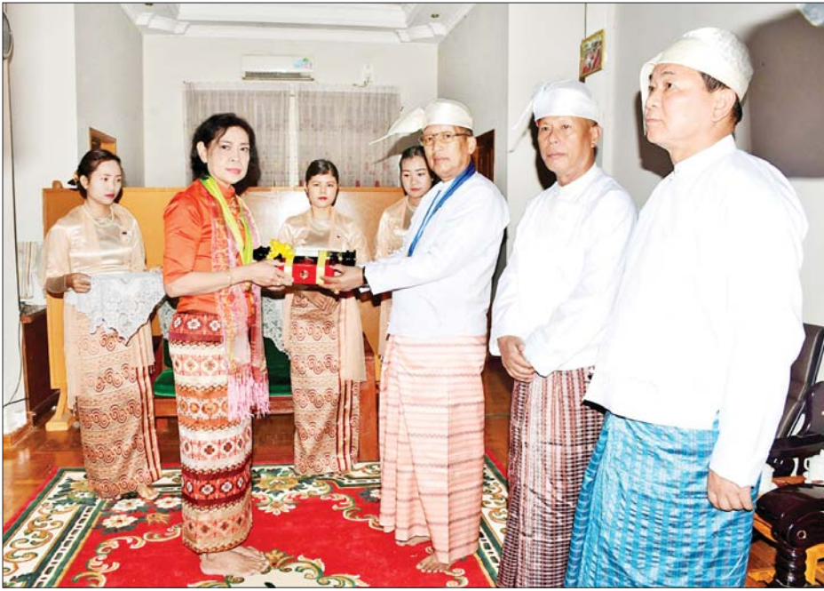
နေပြည်တော်ကောင်စီဥက္ကဋ္ဌ ဦးတင်ဦးလွင် ဝဏ္ဏကျော်ထင်ဘွဲ့ရရှိသူ အမှတ်(၁) စက်မှုဝန်ကြီးဌာန ဒုတိယဝန်ကြီး (ငြိမ်း) ဦးသိန်းအောင် ကိုယ်စား ဇနီး ဒေါ်စန်းစန်းလွင် ကို ဂုဏ်ထူးဆောင်ဘွဲ့ ချီးမြှင့်အပ်နှင်းစဉ်။