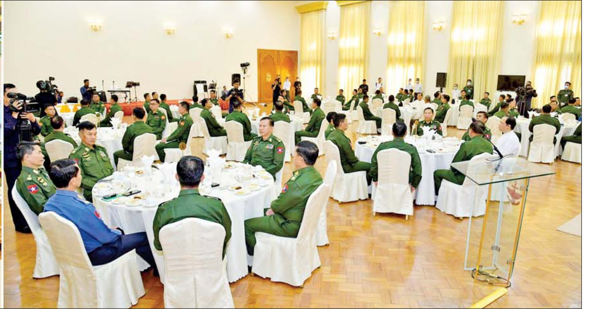
နိုင်ငံတော်စီမံအုပ်ချုပ်ရေးကောင်စီဥက္ကဋ္ဌ တပ်မတော်ကာကွယ်ရေးဦးစီးချုပ် ဗိုလ်ချုပ်မှူးကြီးမင်းအောင်လှိုင် စစ်ကိုင်းတိုင်းဒေသကြီး၊ ချင်းပြည်နယ်နှင့် နာဂကိုယ်ပိုင်အုပ်ချုပ်ခွင့်ရဒေသများမှ ဝေးလံခေါင်ဖျား၍ လမ်းပန်းဆက်သွယ်ရေးခက်ခဲသည့် မြို့နယ်၊ တိုက်နယ်ဆေးရုံများတွင် တာဝန်ထမ်းဆောင်ခဲ့သည့် တပ်မတော်သားဆရာဝန်များအား ဂုဏ်ပြုပွဲအခမ်းအနားသို့ တက်ရောက်အမှာစကားပြောကြားစဉ်။

★ ရှေးဖွဲ့မှ ကာကွယ်ရေးဦးစီးချုပ်(ရေ) ဗိုလ်ချုပ်ကြီး မိုးအောင်၊ ကာကွယ်ရေးဦးစီးချုပ်(လေ) ဗိုလ်ချုပ်ကြီး ထွန်းအောင်၊ ကျန်းမာရေးဝန်ကြီးဌာန ပြည်ထောင်စု ဝန်ကြီး ဒေါက်တာသက်ခိုင်ဝင်း၊ ကာကွယ်ရေးဦးစီးချုပ်ရုံးမှ တပ်မတော်အရာရှိကြီးများ၊ မြန်မာနိုင်ငံ စစ်မှုထမ်းဟောင်းအဖွဲ့ ဗဟိုအမှုဆောင်ဥက္ကဋ္ဌ၊ ချင်းပြည်နယ်နှင့် နာဂကိုယ်ပိုင်အုပ်ချုပ်ခွင့်ရဒေသ များရှိ ဝေးလံခေါင်ဖျားဒေသများတွင် တာဝန်ထမ်းဆောင်ခဲ့ကြသည့် တပ်မတော်သားဆရာဝန်များ တက်ရောက်ကြသည်။