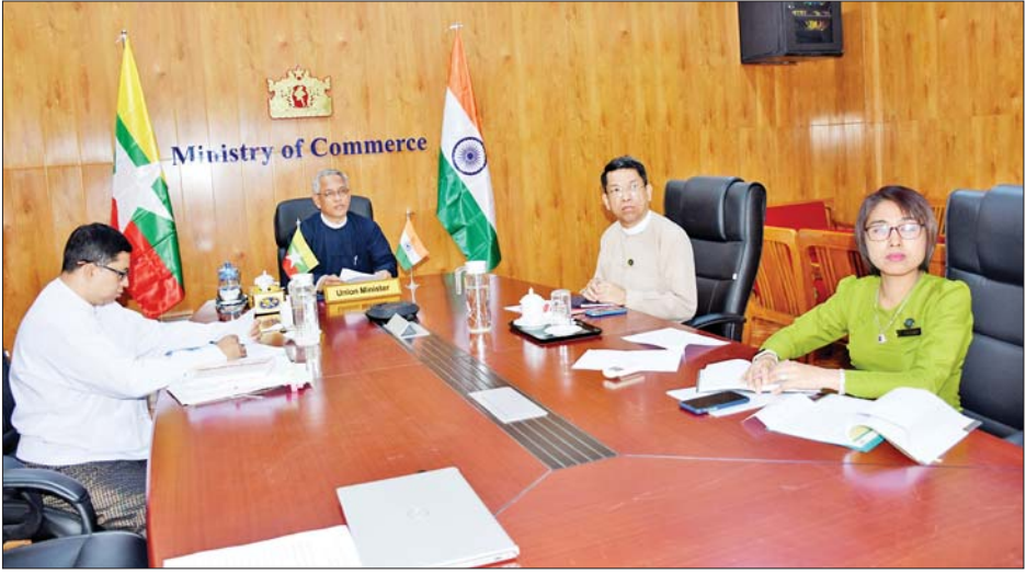
နှစ်နိုင်ငံ၊ နိုင်ငံစုံနှင့် ဒေသတွင်း ပူးပေါင်းဆောင်ရွက်မှုများတွင် တက်ကြွစွာ ပူးပေါင်းချိတ်ဆက်ရေးဆောင်ရွက်လျက်ရှိသည့် အခြေအနေများကို ပြောကြားသည်။ အဆိုပါ ဆွေးနွေးပွဲကို ဇန်နဝါရီ ၁၂ ရက်မှ ၁၃

ကုန်သွယ်ရေးနှင့် ရင်းနှီးမြှုပ်နှံမှုများ ပိုမိုမြှင့်တင်စေရေး ပူးပေါင်းဆောင်ရွက်သွားရန် ဒေသတွင်းရှိ အခြားမိတ်ဖက်နိုင်ငံများကိုလည်း တိုက်တွန်းပြောကြားလိုကြောင်း၊ ကုန်သွယ်ရေးနှင့် ရင်းနှီးမြှုပ်နှံမှုများမြှင့်တင်ရေးနှင့် ပိုမိုအားကောင်းစေရေးအပြင် စီးပွားရေးအလားအလာကောင်းများ ရှာဖွေရန်၊ ဆက်သွယ်ဆောင်ရွက်မှုများ ပိုမိုကောင်းမွန်စေရန်နှင့် ခရီးသွားလုပ်ငန်းများ ကောင်းမွန်စေရန် တိုက်တွန်းဆောင်ရွက်သွားရေးနှင့် ပတ်သက်၍ အမြင်ချင်းဖလှယ်ရေး၊ စားနပ်ရိက္ခာဖူလုံရေးအတွက် စိုက်ပျိုးရေးနှင့် မွေးမြူရေးလုပ်ငန်းများ၊ ထုတ်လုပ်မှုနည်းပညာ၊ သယ်ယူပို့ဆောင်ရေးလုပ်ငန်းများနှင့် လူ့စွမ်းအားအရင်းအမြစ်များ ဖွံ့ဖြိုးတိုးတက်ရန် ပူးပေါင်းဆောင်ရွက်ရေးနှင့် မြန်မာနိုင်ငံအနေဖြင့် ကမ္ဘာတောင်ဘက်ပိုင်းရှိ နိုင်ငံများအားလုံးနှင့်