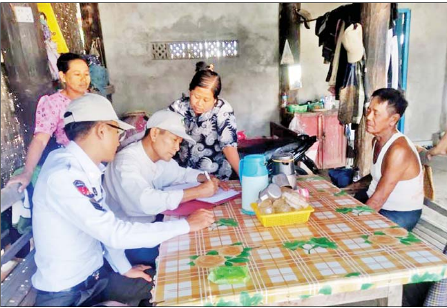
ကွင်းဆင်းစာရင်းကောက်ယူရေးအဖွဲ့ဝင်များ လုပ်ငန်းဆောင်ရွက်နေစဉ်။

ယင်းကဲ့သို့မြေပြင်တစ်အိမ်တက်ဆင်း ကွင်းဆင်း ကောက်ယူရေးအဖွဲ့သည် အခြေခံအကျဆုံးနှင့် အရေးအကြီးဆုံးအဖွဲ့ဖြစ်ပြီး အဖွဲ့၏ ဖြစ်တည်မှု ကလည်း နိုင်ငံတော်၏အနာဂတ်အတွက် နိုင်ငံတော် အကြီးအကဲများ ကြိုးပမ်းပုံဖော်အားထုတ်မှုများမှ အစပြုခဲ့ခြင်းဖြစ်သည်။ ရွေးကောက်ပွဲအတွက် မဲစာရင်းပြုစုရေးဆိုင်ရာအစည်းအဝေးကို ၂၀၂၂ ခုနှစ် နိုဝင်ဘာ ၁၀ ရက်က နေပြည်တော်၌ ကျင်းပခဲ့ရာ ယင်းအစည်းအဝေးသို့ နိုင်ငံတော်စီမံအုပ်ချုပ်ရေး ကောင်စီဒုတိယဥက္ကဋ္ဌ ဒုတိယဝန်ကြီးချုပ် ဒုတိယ ဗိုလ်ချုပ်မှူးကြီးစိုးဝင်း တက်ရောက်အမှာစကား ပြောကြားရာ၌ ၂၀၂၀ ပြည့်နှစ် ရွေးကောက်ပွဲတွင် အဓိကမှားယွင်းသည်များမှာ နိုင်ငံသားစိစစ်ရေး ကတ်များ စနစ်တကျမရှိခြင်း၊ နိုင်ငံသားစိစစ်ရေး ကတ်များဖောင်းပွခြင်းနှင့် တစ်ဦးတည်းဆွဲပွားပုံစံ ဖြင့် ဆောင်ရွက်သည့်ကိစ္စရပ်များကြောင့် မဲစာရင်း များမမှန်မကန်ဖြစ်ပြီး ရလဒ်အဖြေများ မှားယွင်းခဲ့ သည့်ကိစ္စရပ်များဖြစ်ကြောင်း၊ လွတ်လပ်ပြီးတရား မျှတသည့် ပါတီစုံဒီမိုကရေစီ အထွေထွေ ရွေးကောက်ပွဲ အောင်မြင်စွာကျင်းပနိုင်ရေးအတွက် ပြီးခဲ့သည့် ၂၀၂၀ ပြည့်နှစ် ရွေးကောက်ပွဲနှင့် ပတ်သက်သည့် အမှားများကဲ့သို့ မဖြစ်စေရေး အဓိကထား ဆောင်ရွက်နိုင်ရန် သက်ဆိုင်ရာ တိုင်းဒေသကြီးနှင့် ပြည်နယ်ဝန်ကြီးချုပ်များ၏ ဦးဆောင်မှုဖြင့် တိုင်းဒေသကြီးနှင့်ပြည်နယ်များရှိ လူဦးရေစာရင်းတိကျမှန်ကန်ရေး အမြန်ဆုံးမြေပြင် ကွင်းဆင်းစာရင်းကောက်ယူ ဆောင်ရွက်ကြရမည် ဖြစ်ကြောင်း၊ ထိုသို့ တိကျမှန်ကန်စွာ စာရင်း ကောက်ယူနိုင်မှသာ ရွေးကောက်ပွဲမဲစာရင်းများ အမှန်တကယ်ပြုစုနိုင်မည်ဖြစ်ကြောင်း ထည့်သွင်း ပြောကြားခဲ့ပါသည်။