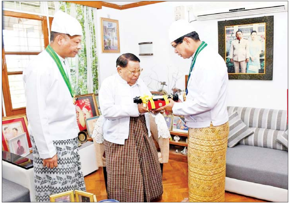
ရန်ကုန်တိုင်းဒေသကြီးဝန်ကြီးချုပ် ဦးစိုးသိန်း ဝဏ္ဏကျော်ထင်ဘွဲ့ရရှိသူ ပို့ဆောင်ရေးဝန်ကြီးဌာန ဒုတိယဝန်ကြီး ဦးစန်းဝေ(ငြိမ်း) ကို ဂုဏ်ထူးဆောင်ဘွဲ့ ချီးမြှင့်အပ်နှင်းစဉ်။