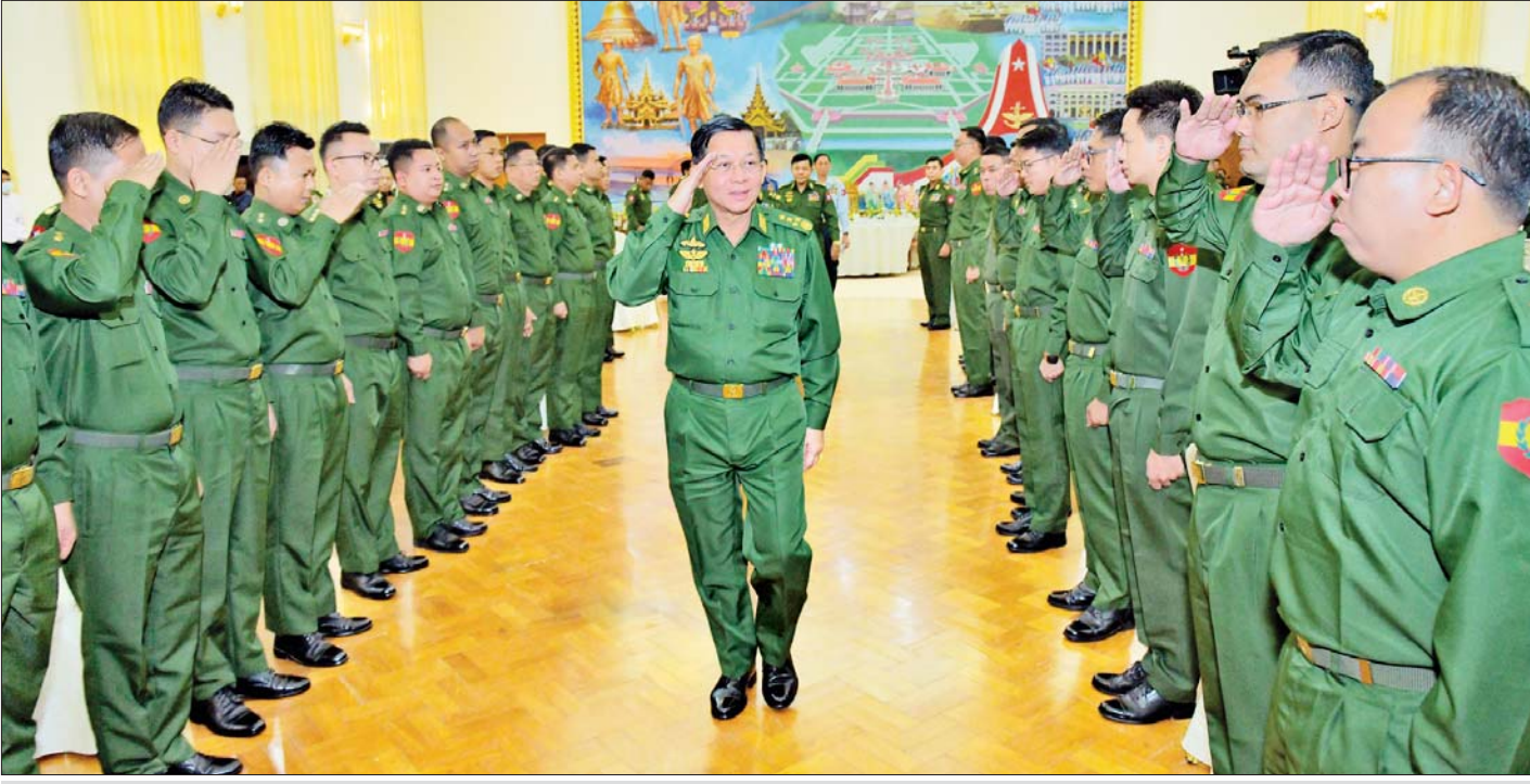
နိုင်ငံတော်စီမံအုပ်ချုပ်ရေးကောင်စီဥက္ကဋ္ဌ တပ်မတော်ကာကွယ်ရေးဦးစီးချုပ် ဗိုလ်ချုပ်မှူးကြီးမင်းအောင်လှိုင် ဝေးလံခေါင်ဖျားဒေသများတွင် တာဝန် ထမ်းဆောင်ခဲ့ကြသည့် တပ်မတော်သားဆရာဝန်များအား ရင်းရင်းနှီးနှီးနှုတ်ဆက်စဉ်။

တပ်မတော်အနေဖြင့် ယခုကဲ့သို့ ချင်းပြည်နယ် နှင့် နာဂကိုယ်ပိုင်အုပ်ချုပ်ခွင့်ရ ဒေသများတွင်ရှိသည့် တိုင်းရင်းသားများကို ကျန်းမာရေးစောင့်ရှောက်မှု ပေးခဲ့ရာတွင် ပထမအကြိမ်အနေဖြင့် ဒေသခံပြည်သူ လူထု ၂၀၂၃ ဦး၊ ဒုတိယအကြိမ်အနေဖြင့် ၁၇၀၀၈ ဦး၊ တတိယအကြိမ်အနေဖြင့် ၉၃၆၀၀ စုစုပေါင်း ၄၆၇၀၁၆ ဦးတို့ကို ပြုစုစောင့်ရှောက် မှုများ ပေးနိုင်ခဲ့သည်ကို တွေ့ရှိရမည်ဖြစ်ပါကြောင်း၊ ကျန်းမာရေးစောင့်ရှောက်မှုများအနေဖြင့် ဆေးကုသ မှုဆိုင်ရာရောဂါ၊ ခွဲစိတ်ရောဂါ၊ ကလေးနှင့် သားဖွား မီးယပ်ရောဂါ၊ မျက်စိနှင့် နား၊ နှာခေါင်းရောဂါ၊ အစာ အိမ်နှင့် အူလမ်းကြောင်းရောဂါ အစရှိသည့် ရောဂါ များခံစားနေရသည့် ဒေသခံပြည်သူလူထုကို ပြုစု စောင့်ရှောက်မှုပေးနိုင်ခဲ့ခြင်းဖြစ်ကြောင်း၊ ယင်းသည် မိမိတို့တပ်မတော်အနေဖြင့် တိုင်းရင်းသားပြည်သူများ ၏ အရေးနှင့်ပတ်သက်ပါက အစဉ်အမြဲဦးထိပ်ထား ဆောင်ရွက်ပေးလျက်ရှိသည်ကို ဖော်ပြလျက်ရှိသည့် အချက်များပင်ဖြစ်ကြောင်း။ စာမျက်နှာ ၄ သို့ ☆