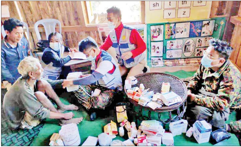
တပ်မတော်သား ဆရာဝန်များက ဒေသခံတိုင်းရင်းသားပြည်သူများအား ကျန်းမာရေးစောင့်ရှောက်မှုလုပ်ငန်းများ ဆောင်ရွက်ပေးစဉ်။