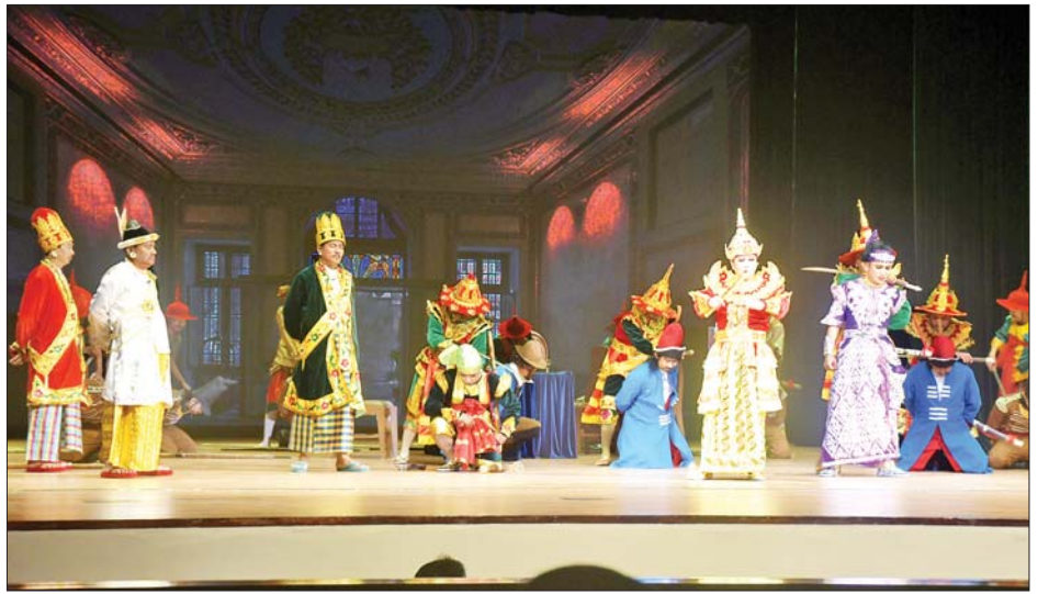
တာဝန်ထမ်းဆောင်နေကြသော ဌာနဆိုင်ရာဝန်ထမ်းများ၊ တပ်ရင်းတပ်ဖွဲ့အသီးသီးမှ တပ်မတော်သားများနှင့် မိသားစုများ၊ ရဲတပ်ဖွဲ့ဝင်များနှင့် မိသားစုများ၊

ဇန်နဝါရီ ၁၂ ရက်နှင့် ၁၄ ရက်တို့တွင် အဆိုပါဇာတ်တော်ကြီးကို အမျိုးသားဇာတ်ရုံကြီး၌ တင်ဆက်မည် ဖြစ်သည်။