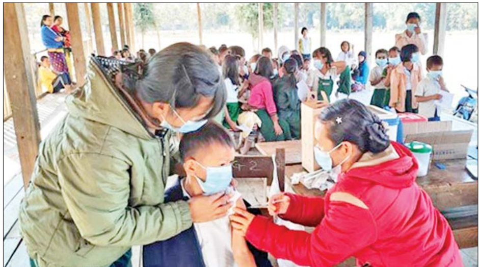
ဝိုင်းမော်မြို့နယ် အထက ဝေထု၌ ကျောင်းသား ကျောင်းသူများအား ထပ်ဆောင်းကာကွယ်ဆေး ထိုးနှံပေးစဉ်။