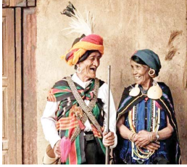
“ပင်း” ခေါ် ဓားညှပ်လွယ်ပလိင်းကို အမြဲတမ်းဆောင်ကာ လွယ်ထားသည့် ချိုချင်းအမျိုးသားကြီးနှင့် သူ၏ဇနီး။

ပင်း (ဓားညှပ်လွယ်ပလိင်း)ကို လွယ်သိုင်းဝတ်ဆင်ရာတွင် အမျိုးသားများသည် တင်းကျပ်သောစည်းကမ်းတစ်ခုကို လိုက်နာကြရသည်။