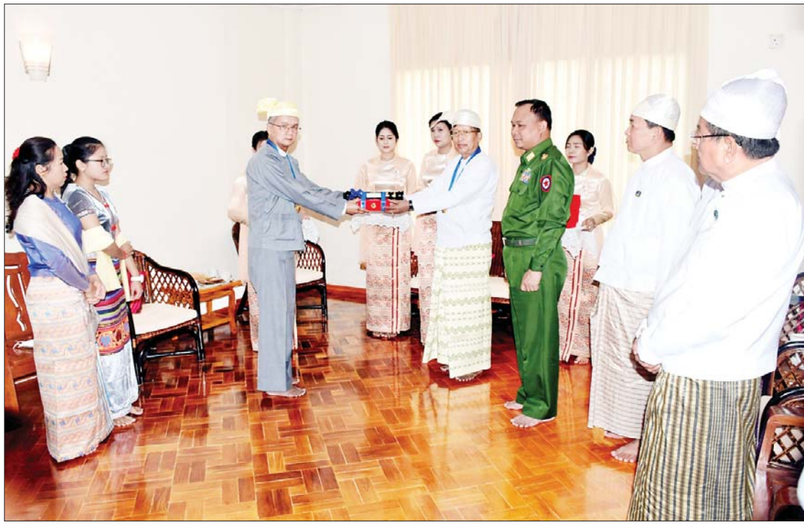
နေပြည်တော်ကောင်စီဥက္ကဋ္ဌ သီရိပျံချီဦးတင်ဦးလွင် သီရိပျံချီဘွဲ့ရရှိသူ ဟိုတယ်နှင့်ခရီးသွားလာရေးဝန်ကြီးဌာန ပြည်ထောင်စုဝန်ကြီး(ငြိမ်း) ဦးအုန်းမောင် ကို ဂုဏ်ထူးဆောင်ဘွဲ့ ချီးမြှင့်အပ်နှင်းစဉ်။

နေပြည်တော် ဇန်နဝါရီ ၁၁ (၇၅)နှစ်မြောက် စိန်ရတုလွတ်လပ်ရေးနေ့ ဂုဏ်ထူးဆောင်ဘွဲ့များ ချီးမြှင့်အပ်နှင်းခြင်း အခမ်းအနားကို ၂၀၂၃ ခုနှစ် ဇန်နဝါရီ ၁ ရက်နှင့် ၂ ရက်တို့တွင် အောင်မြင်စွာကျင်းပခဲ့ပြီး နိုင်ငံတော်စီမံအုပ်ချုပ်ရေးကောင်စီဥက္ကဋ္ဌ နိုင်ငံတော်ဝန်ကြီးချုပ်က ဘွဲ့ခံပုဂ္ဂိုလ်များထံ ဂုဏ်ထူးဆောင်ဘွဲ့များကို ကိုယ်တိုင်တစ်ဦးချင်းလက်ရောက်ချီးမြှင့်အပ်နှင်းခဲ့ပြီးဖြစ်သည်။ ချီးမြှင့်အပ်နှင်းအဆိုပါ ဂုဏ်ထူးဆောင်ဘွဲ့များ အပ်နှင်းခြင်းအခမ်းအနားသို့ အကြောင်းအမျိုးမျိုးကြောင့် ကိုယ်တိုင်သော်လည်းကောင်း၊ ကိုယ်စားသော်လည်းကောင်း တက်ရောက်ရယူနိုင်ခဲ့ခြင်းမရှိဘဲ အဝေးရောက်လက်ခံရယူမည့် ဘွဲ့ခံပုဂ္ဂိုလ်များရှိသည့်အတွက် ယနေ့တွင် နေပြည်တော်ကောင်စီ အပါအဝင် သက်ဆိုင်ရာတိုင်းဒေသကြီးနှင့် ပြည်နယ်တို့မှ တာဝန်ရှိသူများက ဂုဏ်ထူးဆောင်ဘွဲ့များ စာမျက်နှာ ၉ ကော်လံ ၁ သို့ ၂