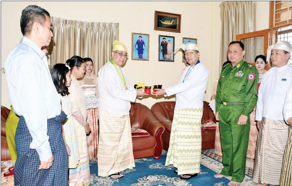
နေပြည်တော်ကောင်စီဥက္ကဋ္ဌ သီရိပျံချီ ဦးတင်ဦးလွင် ဝဏ္ဏကျော်ထင်ဘွဲ့ ရရှိသူ အမှတ် (၂) စက်မှုဝန်ကြီးဌာန ဒုတိယဝန်ကြီး (ငြိမ်း) ဦးမျိုးအောင် ကို ဂုဏ်ထူးဆောင်ဘွဲ့ ချီးမြှင့်အပ်နှင်းစဉ်။