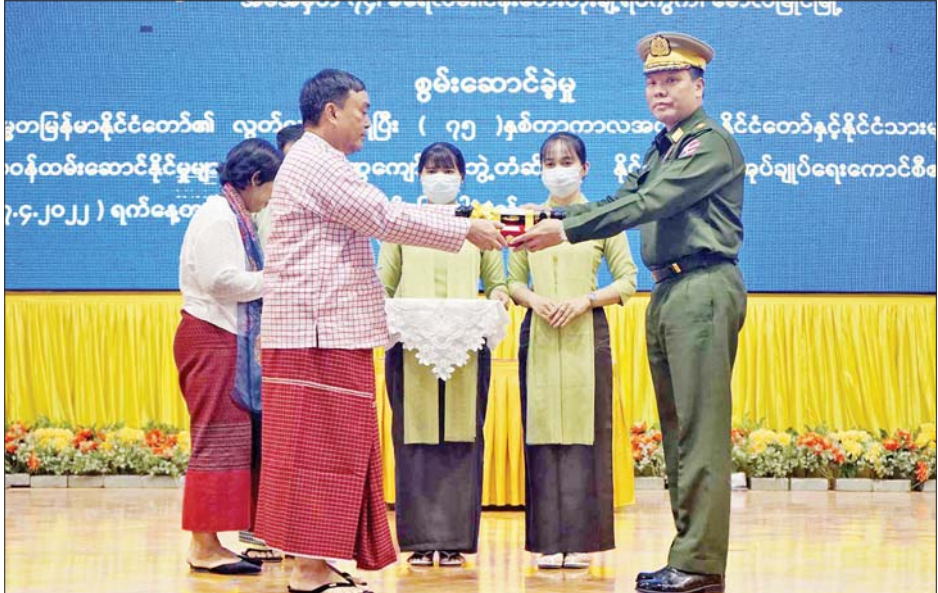
အရှေ့တောင်တိုင်းစစ်ဌာနချုပ် တိုင်းမှူးဗိုလ်ချုပ် မြတ်သက်ဦး ဝဏ္ဏကျော်ထင်ဘွဲ့ ရရှိသူ မွန်ပြည်သစ်ပါတီဥက္ကဋ္ဌ နိုင်ရွှေကျင် (ကိုယ်စား) သားဖြစ်သူ ဦးကိုကိုဦး ကို ဂုဏ်ထူးဆောင်ဘွဲ့ ချီးမြှင့်အပ်နှင်းစဉ်။

★ ကျောမိုးမှ လက်ခံယူမည့် ကာယကံရှင်နှင့် မိသားစုဝင်များကို လက်ရောက်ချီးမြှင့်အပ်နှင်းကြသည်။ ထိုသို့ ချီးမြှင့်အပ်နှင်းရာတွင် နေပြည်တော်ကောင်စီဥက္ကဋ္ဌ သီရိပျံချီ ဦးတင်ဦးလွင်နှင့် နေပြည်တော်တိုင်းစစ်ဌာနချုပ်တိုင်းမှူး ဗိုလ်ချုပ် ဇေယျကျော်ထင် ဇော်ဟိန်းတို့က သီရိပျံချီဘွဲ့ ရရှိသူ ဟိုတယ်နှင့်ခရီးသွားလာရေးဝန်ကြီးဌာန ပြည်ထောင်စုဝန်ကြီး (ငြိမ်း) ဦးအုန်းမောင်၊ ဝဏ္ဏကျော်ထင်ဘွဲ့ ရရှိသူ အမှတ် (၂) စက်မှုဝန်ကြီးဌာန ဒုတိယဝန်ကြီး (ငြိမ်း) ဦးမျိုးအောင်၊ ဝဏ္ဏကျော်ထင်ဘွဲ့ ရရှိသူ နိုင်ငံခြားရေးဝန်ကြီးဌာန သံအမတ်ကြီး (ငြိမ်း) ဦးစောလှမင်း၊ ဝဏ္ဏကျော်ထင်ဘွဲ့ ရရှိသူ နိုင်ငံခြားရေးဝန်ကြီးဌာန သံအမတ်ကြီး ဒေါ်မော်မော် (ကိုယ်စား) မောင်ဖြစ်သူ