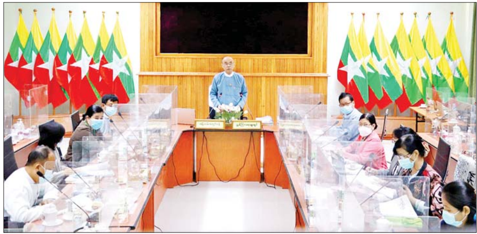
ပတ်ဝန်းကျင်ထိန်းသိမ်းရေးဦးစီးဌာန ရုံးချုပ်၊ တိုင်းဒေသကြီး/ပြည်နယ်များမှ ကိုယ်စားလှယ်များနှင့် ဂျပန်-အာဆီယံပူးပေါင်းဆောင်ရွက်ရေး ရန်ပုံငွေ

အစည်းအဝေးသို့ သယံဇာတနှင့်သဘာဝပတ်ဝန်းကျင် ထိန်းသိမ်းရေးဝန်ကြီးဌာန ပတ်ဝန်းကျင်ထိန်းသိမ်းရေးဦးစီးဌာန ညွှန်ကြားရေးမှူးချုပ်နှင့် နည်းပညာလုပ်ငန်းအဖွဲ့ဝင်များ ဖြစ်သည့် ဆက်စပ်ဌာနများမှ ကိုယ်စားလှယ်များ၊ တိုင်းဒေသကြီး/ပြည်နယ်အစိုးရအဖွဲ့များမှ ကိုယ်စားလှယ်များ၊ နေပြည်တော်၊ ရန်ကုန်နှင့် မန္တလေးမြို့တော် စည်ပင်သာယာရေးကော်မတီမှ ကိုယ်စားလှယ်များ၊ ပုဂ္ဂလိက လုပ်ငန်းရှင်အသင်းများမှ ကိုယ်စားလှယ်များ၊