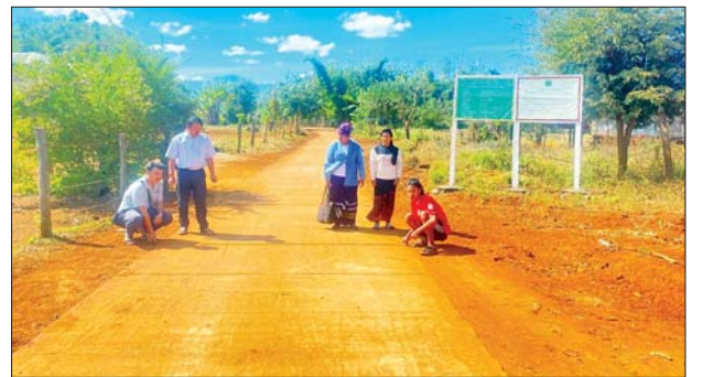
အထည်ဖော်ဆောင်ရွက်ခဲ့ရာ ယခုအခါလုပ်ငန်းအားလုံး ရာနှုန်းပြည့် ဆောင်ရွက်ပြီးစီးပြီဖြစ်ကြောင်း သိရသည်။

ကုန်းဆာ(လီဆူ)ကျေးရွာနှင့် ကြယ်ပဲကျေးရွာတို့တွင် အဆိုပါ ဖွံ့ဖြိုးရေးလုပ်ငန်းများကို ကျေးရွာဖွံ့ဖြိုးတိုးတက်ရေးလုပ်ငန်း စီမံကိန်း ပံ့ပိုးရန်ပုံငွေကျပ် သန်း ၂၀၊ ကျေးရွာပြည်သူထည့်ဝင်ငွေကျပ် ၁၀ ဒသမ ၄၄ သန်း၊ ကျေးရွာလူထုလုပ်အားများ၊ ဦးစီးဌာနဝန်ထမ်းများ၏ နည်းပညာပံ့ပိုးမှု၊ အနီးကပ်ကြီးကြပ်မှုတို့ဖြင့် ကျေးရွာသူ ကျေးရွာသား များကိုယ်တိုင် ၂၀၂၂ ခုနှစ် ဇူလိုင်လ တတိယပတ်မှ စတင်အကောင်