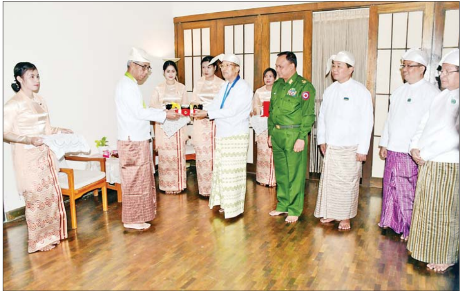
နေပြည်တော်ကောင်စီဥက္ကဋ္ဌ သီရိပျံချီ ဦးတင်ဦးလွင် ဝဏ္ဏကျော်ထင်ဘွဲ့ ရရှိသူ နိုင်ငံခြားရေးဝန်ကြီးဌာန သံအမတ်ကြီး (ငြိမ်း) ဦးစောလှမင်း ကို ဂုဏ်ထူးဆောင်ဘွဲ့ ချီးမြှင့်အပ်နှင်းစဉ်။