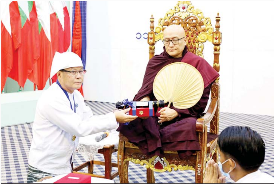
ကရင်ပြည်နယ်ဝန်ကြီးချုပ် သီရိပျံချီ ဦးစောမြင့်ဦး သီရိပျံချီဘွဲ့ ရရှိသည့် တောင်ကလေးဆရာတော်ထံ ဂုဏ်ထူးဆောင်ဘွဲ့ ဆက်ကပ်စဉ်။