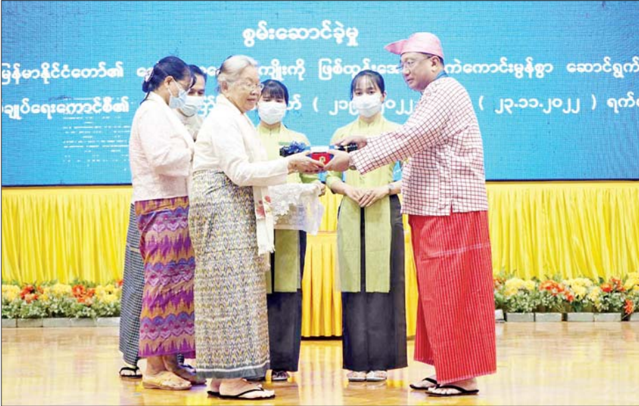
မွန်ပြည်နယ်ဝန်ကြီးချုပ် သီရိပျံချီ ဦးစော်လင်းထွန်း သီရိပျံချီဘွဲ့ ရရှိသူ ဦးအုန်းကျော်၊ ဝန်ကြီး (လူမှုဝန်ထမ်းဌာန၊ အလုပ်သမားဌာန) ကိုယ်စား ဇနီးဖြစ်သူ ဒေါ်သက်ညာဏ် ကို ဂုဏ်ထူးဆောင်ဘွဲ့ ချီးမြှင့်အပ်နှင်းစဉ်။