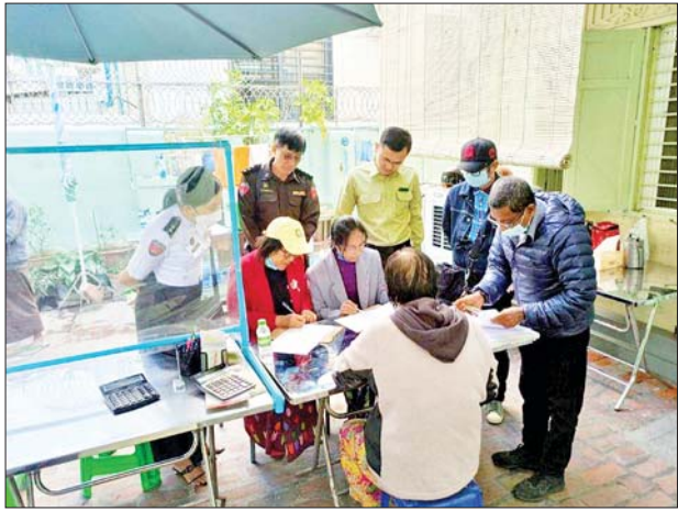
ချမ်းအေးသာစံမြို့နယ်၌ မြေပြင်တစ်အိမ်တက်ဆင်း ကွင်းဆင်းကောက်ယူရေးအဖွဲ့ ၉၈ ဖွဲ့ဖြင့် မြေပြင် လူဦးရေစာရင်း ကွင်းဆင်းတိုက်ဆိုင်စစ်ဆေးခြင်းလုပ်ငန်း ဆောင်ရွက်လျက်ရှိကြောင်း သိရသည်။