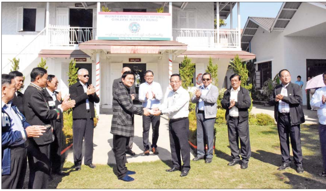
ပြည်ထောင်စုဝန်ကြီး ဦးမောင်မောင်အုန်း ကချင်အနုပညာရှင်များအသင်းအတွက် ထောက်ပံ့ငွေများ ပေးအပ်စဉ်။