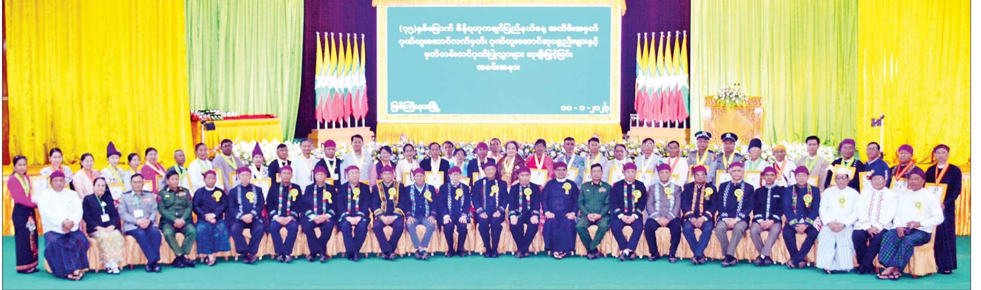
နိုင်ငံတော်စီမံအုပ်ချုပ်ရေးကောင်စီအဖွဲ့ဝင်များ၊ ပြည်ထောင်စုဝန်ကြီးများ၊ ပြည်နယ်ဝန်ကြီးချုပ်နှင့် အဖွဲ့ဝင်များ ဆုရရှိသူများနှင့် စုပေါင်းမှတ်တမ်းတင်ဓာတ်ပုံရိုက်စဉ်။