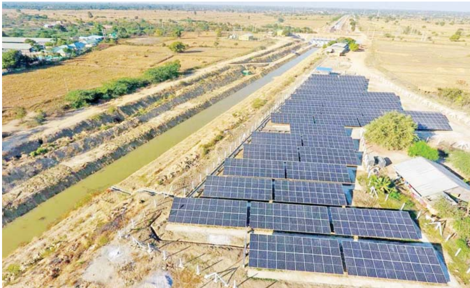
ဆင်တပ်ရေတင်အဆင့်-၂ ရှိ ၁၆၀ ကီလိုဝပ်မော်တော်နှစ်စုံအား ဆိုလာစနစ်ဖြင့် ရေမောင်းနှင်ရန် အတွက် ၅၄၅ ဝပ်ဆိုလာပြား (2.274 m x 1.134m x 0.035m) ၇၈၄ ချပ်တပ်ဆင်ထားမှုကို တွေ့ရစဉ်။

၂၀၂၁ ခုနှစ် အောက်တိုဘာလ ၂၅ ရက်နေ့တွင် ကျင်းပသည့် ပြည်ထောင်စုသမ္မတမြန်မာနိုင်ငံတော် ပြည်ထောင်စုအစိုးရအဖွဲ့ အစည်းအဝေးအမှတ်စဉ် (၂/၂၀၂၁) တွင် နိုင်ငံတော်စီမံအုပ်ချုပ်ရေးကောင်စီ ဥက္ကဋ္ဌ နိုင်ငံတော်ဝန်ကြီးချုပ်က “မြစ်ချောင်း များအနီး စိုက်ပျိုးရေးလုပ်ငန်းများတွင် ရာသီမရွေး စိုက်ပျိုးရေးလုံလောက်စွာရရှိရေးအတွက် မြစ်ရေတင် စီမံကိန်းများအား ထိထိရောက်ရောက်အကောင် အထည်ဖော်ဆောင်ရွက်ရန်လိုကြောင်း၊ ထိုသို့ ဆောင်ရွက်ရာတွင် ပြန်လည်ပြည့်ဖြိုးမြဲစွမ်းအင် ဖြစ်သည့် နေရောင်ခြည်စွမ်းအင်သုံးမြစ်ရေတင် စီမံကိန်းများဆောင်ရွက်နိုင်မည်ဆိုပါက စိုက်ပျိုး ရေးများလုံလောက်စွာရရှိပြီး အကျိုးဖြစ်ထွန်းစေ