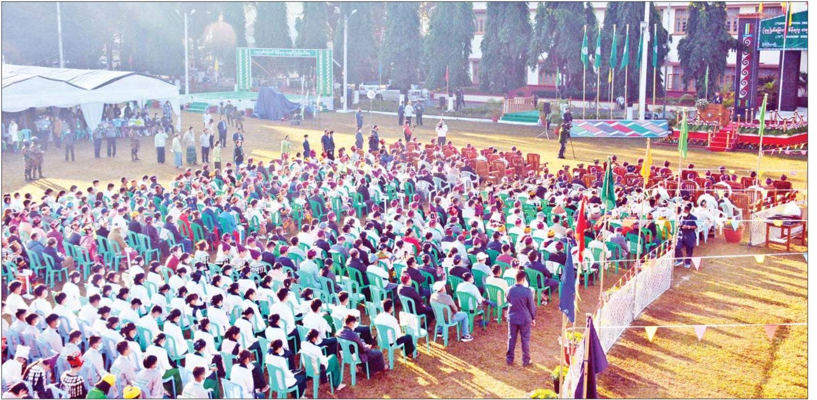
(၇၅)နှစ်မြောက် စိန်ရတု ကချင်ပြည်နယ်နေ့အခမ်းအနား ကျင်းပစဉ်။

ထို့နောက် နယ်စပ်ရေးရာဝန်ကြီးဌာန ပြည်ထောင်စုဝန်ကြီး ဒုတိယဗိုလ်ချုပ်ကြီး ထွန်းထွန်းနောင်က ကချင်ပြည်နယ် အစိုးရအဖွဲ့အတွက် နေရောင်ခြည်စွမ်းအင်သုံးဆိုင်ရာ (Solar Home System Panels 120 W) အစုံ ၁၀၀ ကို ပေးအပ်လှူဒါန်းရာ ပြည်နယ်ဝန်ကြီးချုပ်က လက်ခံရယူသည်။