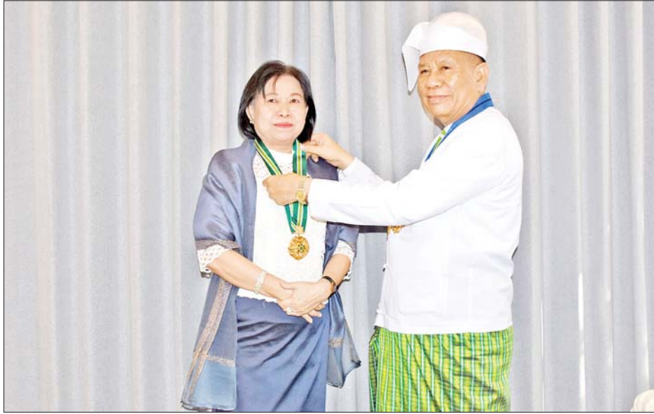
ဝန်ကြီးချုပ် ဝဏ္ဏကျော်ထင် သီရိပျံချီဦးမောင်ကိုနှင့် ဇေယျကျော်ထင် ကိုကိုဦးတို့က ဂုဏ်ထူးဆောင်ဘွဲ့များအား အဝေးရောက်လက်ခံယူသည့် ပုဂ္ဂိုလ်များရှိ

အဆိုပါ ဂုဏ်ထူးဆောင်ဘွဲ့များအပ်နှင်းခြင်းအခမ်းအနားသို့ အကြောင်းအမျိုးမျိုးကြောင့် ကိုယ်တိုင်သော်လည်းကောင်း၊ ကိုယ်စားသော်လည်းကောင်း တက်ရောက်ရယူနိုင်ခဲ့ခြင်းမရှိဘဲ အဝေးရောက်လက်ခံယူမည့် ဘွဲ့ခံပုဂ္ဂိုလ်များရှိခဲ့ပြီး မန္တလေးတိုင်းဒေသကြီးအတွင်းရှိ ကျန်းမာရေးအခြေအနေအရ အဝေးရောက်လက်ခံယူသည့် ဘွဲ့ခံပုဂ္ဂိုလ်များထံ နိုင်ငံတော်စီမံအုပ်ချုပ်ရေးကောင်စီဥက္ကဋ္ဌ နိုင်ငံတော်ဝန်ကြီးချုပ်ကိုယ်စား မန္တလေးတိုင်းဒေသကြီး