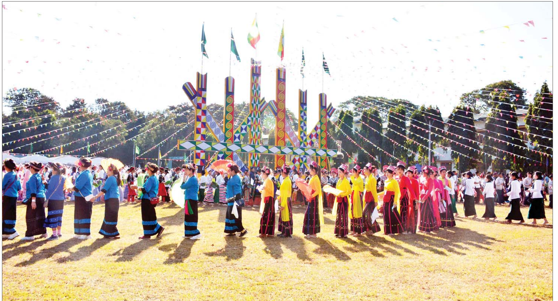
(၇၅)နှစ်မြောက် စိန်ရတု ကချင်ပြည်နယ်နေ့အခမ်းအနားကို ကချင်ပြည်နယ်အစိုးရအဖွဲ့ရုံးရှေ့ မြက်ခင်းပြင်၌ စည်ကားသိုက်မြိုက်စွာ ကျင်းပစဉ်။