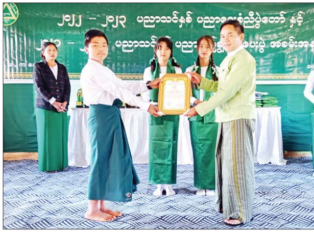
မိုးနဲမြို့နယ် နောင်ခမ်း အခြေခံပညာမူလတန်းကျောင်း၌ ပညာရေးစုံညီပွဲတော် ကျင်းပ