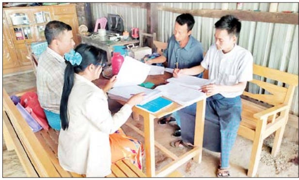
မိုးညို ဇန်နဝါရီ ၁၀ ပဲခူးတိုင်းဒေသကြီး မိုးညိုမြို့နယ်အတွင်းရှိ ရပ်ကွက်/ ကျေးရွာ အုပ်စုများတွင် အိမ်ထောင်စုလူဦးရေစာရင်းနှင့် မြေပြင်ရှိလူဦးရေ စာရင်းများ တိုက်ဆိုင်စစ်ဆေးရေးအတွက် တိုက်ဆိုင်စစ်ဆေးခြင်း

လုပ်ငန်းကို ကွင်းဆင်းဆောင်ရွက်လျက်ရှိကြောင်း သိရသည်။ ထိုသို့ဆောင်ရွက်ရာတွင် မြို့နယ်စီမံအုပ်ချုပ်ရေးအဖွဲ့၏ လမ်းညွှန် မှုဖြင့် မြို့နယ်အဆင့်ဌာနဆိုင်ရာအကြီးအကဲများက မြေပြင်ကွင်းဆင်း စာရင်းကောက်ယူရေးအဖွဲ့များကို အိမ်ထောင်စုလူဦးရေစာရင်းများ ကောက်ယူရာတွင် တိုက်ဆိုင်စစ်ဆေးရေးအတွက် ကြီးကြပ်ဆောင်ရွက် ပေးလျက်ရှိပြီး မြေပြင်ကွင်းဆင်းစာရင်းကောက်ယူရေးအဖွဲ့တွင် ပါဝင် သော လူဝင်မှုကြီးကြပ်ရေးနှင့် ပြည်သူ့အင်အားဝန်ကြီးဌာန မြို့နယ် ဦးစီးမှူးရုံးမှဝန်ထမ်းများ၊ အထွေထွေအုပ်ချုပ်ရေးဦးစီးဌာနမှ ဝန်ထမ်း များနှင့် ဌာနဆိုင်ရာဝန်ထမ်းများ၊ ရပ်ကွက်/ကျေးရွာအုပ်ချုပ်ရေးမှူး များနှင့် အဖွဲ့ဝင်များက အိမ်ထောင်စုလူဦးရေစာရင်းနှင့် မြေပြင်ရှိ လူဦးရေစာရင်းများ တိုက်ဆိုင်စစ်ဆေးရေးအတွက် မြေပြင်ကွင်းဆင်း စာရင်းကောက်ယူခြင်းကို အုပ်စုအလိုက်အဖွဲ့များခွဲ၍ ဆောင်ရွက်လျက် ရှိရာ မြို့နယ်စီမံအုပ်ချုပ်ရေးအဖွဲ့က လိုအပ်သည်များကို ပေါင်းစပ်ညှိနှိုင်း ဆောင်ရွက်ပေးလျက်ရှိကြောင်း သိရသည်။ ကိုမင်း(ပြန်/ဆက်)