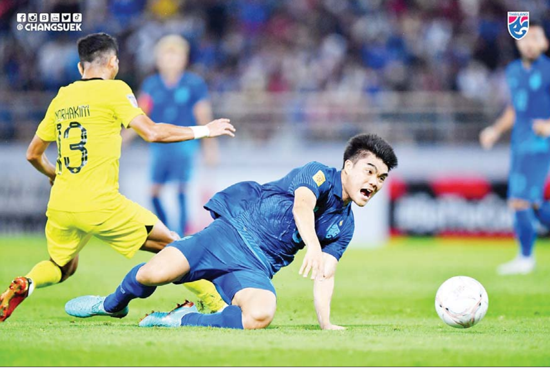
ထိုင်းအသင်းနှင့် မလေးရှားအသင်းတို့ ယှဉ်ပြိုင်နေစဉ်။

ရန်ကုန် ဇန်နဝါရီ ၁၀ 2022 AFF Cup ပြိုင်ပွဲ ဆိမ်းဖိုင်နယ် ဒုတိယအကျော့ (ဒုတိယနေ့)ကို ဇန်နဝါရီ ၁၀ ရက်က ထိုင်းနိုင်ငံ၌ ကျင်းပရာ ထိုင်းအသင်းက မလေးရှားအသင်းကို သုံးဂိုးပြတ်အနိုင်ရပြီး ဗိုလ်လုပွဲ တက်ရောက်သွားသည်။ ပထမအကျော့ အဝေးကွင်းပွဲတွင် အရေးနိမ့်ထားသည့် လက်ရှိချန်ပီယံ ထိုင်းအသင်းသည် ဒုတိယအကျော့ အိမ်ကွင်းပွဲတွင် ဂိုးပြတ်အနိုင်ယူကာ နှစ်ကျော့ပေါင်းရလဒ် သုံးဂိုး-တစ်ဂိုးဖြင့် ဗိုလ်လုပွဲတက်ရောက်သွားသည်။ ထိုင်းအသင်းသည် အိမ်ကွင်း၌ နှစ်ဂိုး နှင့်အထက် အနိုင်ရရန် လိုအပ်နေသဖြင့် ပွဲစကတည်းက တိုက်စစ်ဖွင့်ကစားခဲ့ပြီး ၁၉ မိနစ်တွင် ဝါရင့်တိုက်စစ်မှူး ဒန်ဒါက အဖွင့်ဂိုးစတင်သွင်းယူခဲ့သည်။ ယင်းနောက် ပိုင်းတွင် ပွဲမှာအပြန်အလှန်ရှိလာသော် လည်း ပထမပိုင်းအပြီးတွင် ထိုင်းအသင်း က တစ်ဂိုးအသာဖြင့် ဦးဆောင်နေသည်။ စာမျက်နှာ ၁၅ ကော်လံ ၁ သို့ ၀