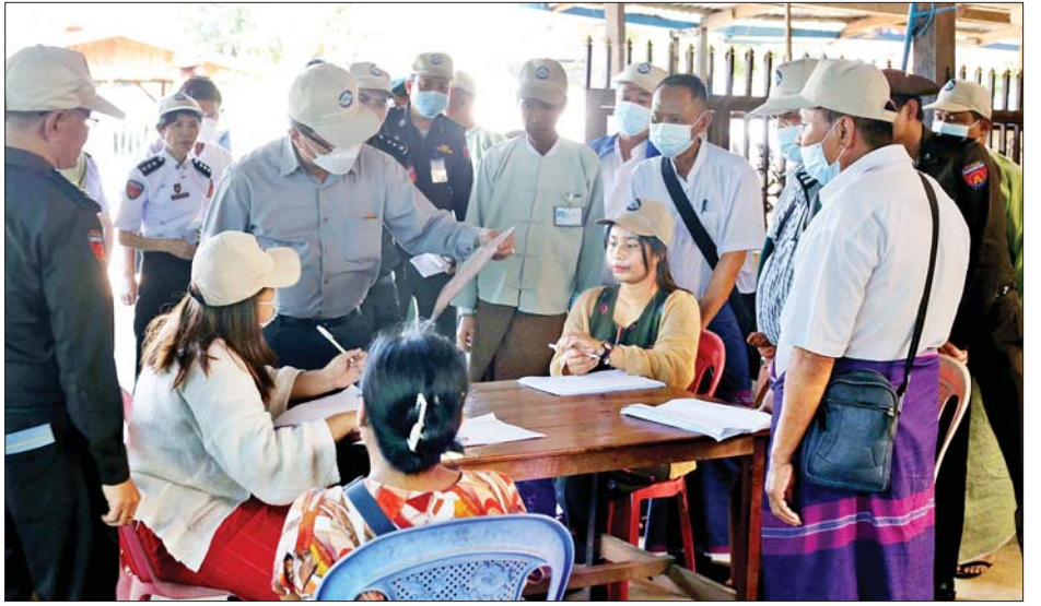
အဆင့်ဆင့်ပို့ချပေးခဲ့ကာ စာရင်းကောက်တစ်ဖွဲ့ စာရင်းအပါအဝင်) မြေပြင်ကွင်းဆင်းစာရင်းကောက် တစ်ရက်လျှင် အနည်းဆုံး အိမ်ထောင်စု ၂၅ စုနှုန်းဖြင့် ယူသွားမည်ဖြစ်ကြောင်း သိရသည်။ ဇန်နဝါရီ ၉ ရက်မှ ၃၁ ရက်အထိ (မသန်စွမ်း ငါးမျိုး ပြည်နယ်(ပြန်/ဆက်)

အထည်ဖော်ဆောင်ရွက်လျက်ရှိပြီး အဆင့်(၁)နှင့်(၂) ကို ပြည်နယ်အတွင်း ဆောင်ရွက်ပြီးဖြစ်သည့်အတွက် အဆင့်(၃)အနေဖြင့် အိမ်ထောင်စုလူဦးရေစာရင်းပုံစံ (၆၆/၆)ရှိ လူဦးရေအချက်အလက်များနှင့် မြေပြင် တိုက်ဆိုင်စစ်ဆေးခြင်းလုပ်ငန်းကို ဆောင်ရွက်နေခြင်းဖြစ်သည်။ ကရင်ပြည်နယ်အတွင်းရှိ မြို့နယ်ခုနစ် မြို့နယ်တွင် မြေပြင်တစ်အိမ်တက်ဆင်းစာရင်း ကောက်ယူခြင်းလုပ်ငန်းကို ဇန်နဝါရီ ၉ ရက်တွင် စတင်ဆောင်ရွက်လျက်ရှိသည်။ စာရင်းကောက်ယူရေးအဖွဲ့ ၇၂၂ ဖွဲ့ ပြည်နယ်အတွင်း မြေပြင်တစ်အိမ်တက်ဆင်း ကွင်းဆင်းကောက်ယူရေးအဖွဲ့(Working Group) များကို တစ်ဖွဲ့လျှင် ငါးဦးနှုန်းဖြင့် စာရင်းကောက်ယူ ရေးအဖွဲ့ ၇၂၂ ဖွဲ့ကို ဖွဲ့စည်းခဲ့ပြီး သင်တန်းများ