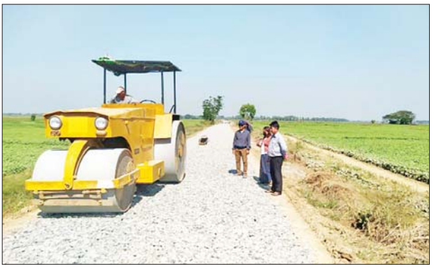
နှစ် ရန်ပုံငွေကျပ် သန်း ၁၃၄ ဒသမ ခြင်းဖြစ်ပြီး ဂုန်မင်း-ဇီးချောင် ၃၀၀ ဖြင့် Pan Capital Co.,Ltd. လမ်းသည် လမ်းအရှည် သုံးမိုင်၊ က တင်ဒါအောင်မြင် ဆောင်ရွက် ၂ ဒသမ ၅ ဖာလုံ၊ အကျယ် ၁၂

ကျောင်းကုန်း ဇန်နဝါရီ ၁၀ ဧရာဝတီ တိုင်းဒေသကြီး ကျောင်းကုန်းမြို့နယ် ဂုန်မင်း-ဇီးချောင် ကွန်ကရစ်လမ်းလုပ်ငန်း ဆောင်ရွက်နေမှု အခြေအနေကို ယနေ့ နံနက်ပိုင်းက ပုသိမ်ခရိုင် ကျေးလက်လမ်း ဖွံ့ဖြိုးရေးဦးစီးဌာနမှ လက်ထောက်ညွှန်ကြားရေးမှူးနှင့် တာဝန်ရှိသူများက အရည်အသွေး ပြည့်မီစေရေး ကွင်းဆင်းစစ်ဆေးခဲ့သည်။ ထိုသို့ ကွန်ကရစ်လမ်းခင်းခြင်း လုပ်ငန်းအား ၂၀၂၂-၂၀၂၃ ဘဏ္ဍာ