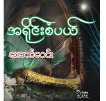
အခန်းဆက်ဝတ္ထုရှည် စာမျက်နှာ » ၁၇

ရန်ကုန် ဇန်နဝါရီ ၁၀ ၂၀၂၄ ပါရီအိုလံပစ် အာရှဇန်နဝါရီ သမီးဘောလုံးခြေစစ် ပွဲ ပထမအဆင့်အုပ်စုမဲခွဲပွဲကို ဇန်နဝါရီ ၁၂ ရက်တွင် ကျင်းပ မည်ဖြစ်သည်။ အာရှဇန်နဝါရီပွဲကို အဆင့်သုံးဆင့်ခွဲ၍ ကျင်းပမည် ဖြစ်ပြီး ပထမအဆင့်တွင် အသင်းစုစုပေါင်း ၂၆ သင်း ဝင်ရောက် ယှဉ်ပြိုင်မည်ဖြစ်သည်။ အာရှဘောလုံးအဖွဲ့ချုပ်သည် ခြေစစ်ပွဲ အုပ်စုမဲခွဲရန် ဆီဒင်သတ်မှတ်ချက်များကို ပြီးခဲ့သည့်ရက်ပိုင်းက ထုတ်ပြန်ခဲ့ပြီး မြန်မာအသင်းသည် Pot-1 တွင် ပါဝင်ခဲ့သည်။ Pot-1 တွင် မြန်မာ၊ ဗီယက်နမ်၊ ထိုင်း၊ တရုတ်(တိုင်ပေ)၊ ဥဘောက် ကစွာတန်၊ အိန္ဒိယ၊ ဖိလစ်ပိုင်၊ Pot-2 တွင် ဂျော်ဒန်၊ အီရန်၊ အင်ဒိုနီးရှား၊ နီပေါ၊ စာမျက်နှာ ၁၅ ကော်လံ ၄ သို့ ❖