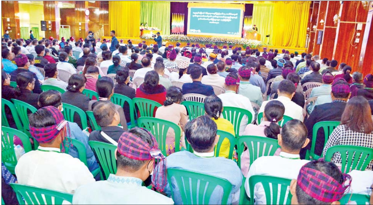
ပြည်နယ်ဖွံ့ဖြိုးတိုးတက်ရေးနှင့် အေးချမ်းတည်ငြိမ်ရေးအတွက် ဘက်စုံ၊ ထောင့်စုံ၊ ကဏ္ဍစုံမှ စွမ်းစွမ်းတမ်းတမ်းဆောင်ရွက်ခဲ့ကြသည့် လူပုဂ္ဂိုလ်များအဖွဲ့အစည်းများအား ဂုဏ်ထူးဆောင်ဆုများနှင့် မှတ်တမ်းတင်ဂုဏ်ပြုလွှာများ ချီးမြှင့်ပေးအပ်ပွဲအခမ်းအနား ကျင်းပစဉ်။

ထို့နောက် ပြည်နယ်လိုခြံရေးနှင့် နယ်စပ်ရေးရာဝန်ကြီးဗိုလ်မှူးကြီး အောင်ကြည်လင်းက စာမျက်နှာ ၄ သို့ ★