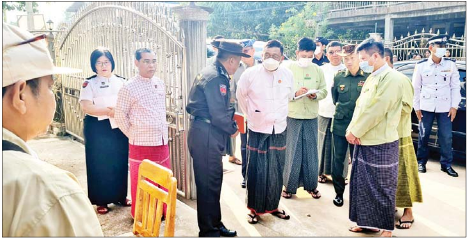
စာရင်းကောက်ယူရန် အိမ်ထောင်စုပေါင်း ၅၅၅၆၉၅ စာရင်းကောက်ယူခဲ့ပြီး ယနေ့အထိ အိမ်ထောင်စု စုရရှိရာ ဇန်နဝါရီ ၉ ရက်မှစတင်၍ မြေပြင်တစ်အိမ် တက်ဆင်းစာရင်းကောက်ယူရေးအဖွဲ့ ၁၀၉၃ ဖွဲ့ဖြင့် ၁၇၀၀၀ ကျော် ကောက်ယူပြီးစီးခဲ့ကြောင်း သိရ သည်။

လူဦးရေစာရင်းများ တိကျမှန်ကန်မှုရှိစေရေး အထူး အလေးထားဆောင်ရွက်ရန်၊ မြေပြင်ကွင်းဆင်း စာရင်းကောက်ယူရေးလုပ်ငန်းစဉ်အား ပြည်သူများ ကျယ်ကျယ်ပြန့်ပြန့်သိရှိပြီး ပူးပေါင်းပါဝင်လာစေရန် နှင့် သတ်မှတ်အချိန်အတွင်း အချိန်မီပြီးစီးနိုင်ရေး တစိုက်မတ်မတ်ဆောင်ရွက်ကြရန် လမ်းညွှန်မှာကြား သည်။ ထို့နောက် ပြည်နယ်ဝန်ကြီးချုပ်နှင့် တာဝန်ရှိသူ များသည် မော်လမြိုင်မြို့နယ် ဈေးကြိုရပ်ကွက် အတွင်း မြေပြင်ကွင်းဆင်း စာရင်းကောက်ယူနေမှု များအား ကြည့်ရှုစစ်ဆေးခဲ့ကြသည်။ မွန်ပြည်နယ်အနေဖြင့် မြေပြင်ကွင်းဆင်း