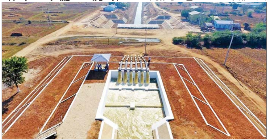
ဆင်တပ်လျှပ်စစ်မြစ်ရေတင်စီမံကိန်းကို တွေ့ရစဉ်။

ဆင်တပ်လျှပ်စစ်မြစ်ရေတင် အဆင့် (၂) ရှိ ၁၆၀ ကီလိုဝပ် မော်တာနှစ်စုံအား ဆိုလာစနစ်တွဲဖက်တပ်ဆင်လုပ်ငန်း ဆောင်ရွက်ပေးနိုင်ခြင်းအားဖြင့် စိုက်ပျိုးမြေဧက ၄၀၀ အား လျှပ်စစ်မီးမလိုဘဲ ဆိုလာစနစ်ဖြင့် စိုက်ပျိုးရေးလုံစွာပေးဝေ နိုင်မည်