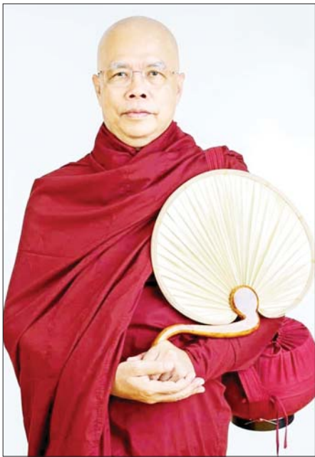
ဓမ္မဒူတ ဒေါက်တာအရှင်ဆေကိန္ဒ ခန့်တုံစိတ်နဲ့ နေပါမယ် စာအုပ်မှ ဆရာတော်၏ခွင့်ပြုချက်ဖြင့် ကူးယူဖော်ပြပါသည်။ မေးတဲ့သဘောပါ။ သူတို့ဆိုတာကလည်း တရားအားထုတ် ထား ကြသူတွေ၊ ယခုလည်း အားထုတ်နေသူတွေ၊ တရား အားထုတ်နည်းဆိုတာတွေကိုလည်း အမျိုးစုံအောင် သိထားကြသူတွေပါ။ “ဟ ဘာဖြစ်လို့မေးတာလဲ၊ ကိုယ်ကိုယ်တိုင် အားထုတ်နေကြတာပဲ မဟုတ်လား၊ အခုအထိ ဝိပဿနာဉာဏ်ကို မရကြသေးဘူးလား” (ဆက်လက်ဖော်ပြပါမည်)

မျက်မှောက်သာသနာမှာလူဖြစ်ကြလို့ဘယ်လောက် များ သူတော်ကောင်းအားအစွမ်းတွေ ရှိနေခဲ့ကြ သလဲဆိုတာ မှန်းဆကြည့်တတ်ပါလိမ့်မယ်။ သူတို့ကို အတုယူအားကျမိတာက တစ်ပိုင်းပါ။ ကိုယ့်ရဲ့စွမ်းအားကိုလည်း ချင်ချင်ချိန်ချိန်ကြည့်တတ် ရမှာကလည်း တစ်ပိုင်းပါ။ အဲဒီတော့ ကိုယ့်ရဲ့ ပါရမီတွေ၊ ကိုယ့်ရဲ့ပင်ကိုအခံစွမ်းအားတွေကိုလည်း မြင်နိုင်၊ တွေ့နိုင်လောက်ပြီပေါ့။ လှေကားထစ်တက်သလိုပါပဲ၊ ကိုယ့်မှာရှိတဲ့ အားနဲ့ ချက်ချင်းဆိုသလို အထွတ်အထိပ်ရောက် အောင် ခုန်ကျော်နိုင်ရင် ခုန်ကျော်လိုက်ပါ။ မခုန် ကျော်နိုင်သေးဘူးဆိုရင်တော့ တစ်ထစ်ချင်း၊ တစ်ထစ်ချင်းလှမ်းပြီး တက်ကြစေချင်ပါတယ်။ တစ်ထစ်ချင်းသာတက်ပါ။ မခုန်ပါနဲ့လို့လည်း မပြောလိုပါဘူး။ ခုန်သာ မြန်မြန်ခုန်လိုက်စမ်းပါ။ တစ်ထစ်ချင်းတက်မနေပါနဲ့လို့လည်း မတားလို ပါဘူး။ ကိုယ့်စွမ်းအားကို ကိုယ်ကြည့် ကိုယ့်အခြေ အနေကို ကိုယ်သိပြီး တက်လှမ်းကြရမှာပါ။ ပြောချင်တာကတော့ ခုန်လည်းခုန်တက်ပါ။ တစ်ထစ်ချင်းလည်း အမြဲမပြတ်လှမ်းနေကြပါ ဆိုတာပါပဲ။ အချိန်တွေကို အလဟဿမဖြစ်စေချင် ပါဘူး။ ခုန်လည်းခုန် လှမ်းလည်းလှမ်းကြပေါ့။ “အရှင်ဘုရား၊ ဝိပဿနာဉာဏ်ဖြစ်ဖို့က ဘယ်လောက်ကြာကြာ အားထုတ်ရပါသလဲဘုရား” တစ်ဦးတည်းက မေးသည်မဟုတ်၊ အများက မေးကြသည့်မေးခွန်းပါ။ နေရာဒေသတိုင်းလိုလို မကြာခဏဆိုသလို အမေးခံရပါတယ်။ အခုမေးနေကြတာကလည်း သူတို့အဖွဲ့ ခုနစ် ယောက်ပါ။ တစ်ယောက်ကသာ ဦးဆောင်ပြီး