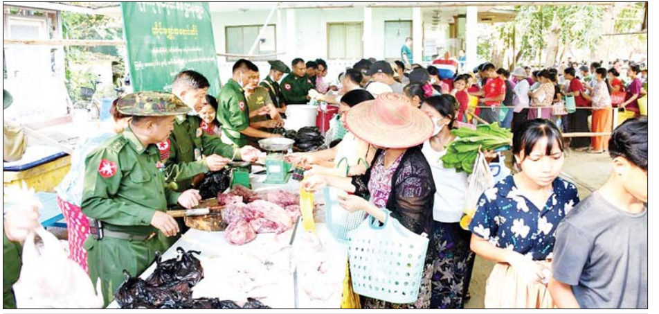
မရမ်းကုန်းမြို့နယ်၌ အခြေခံစားသောက်ကုန်ပစ္စည်းများကို ရောင်းချပေးစဉ်။