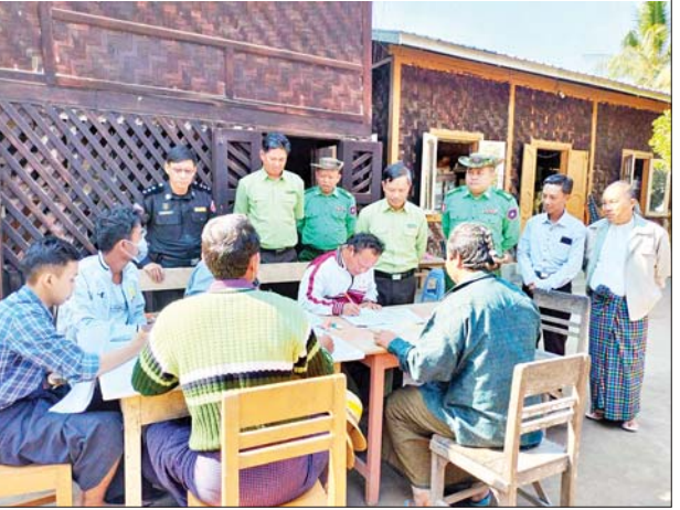
လိုက်လံကြည့်ရှု ဆိုင်ရာဝန်ထမ်းများ၊ ရပ်ကွက်/ ကျေးရွာ အုပ်ချုပ်ရေးမှူးများ၊ ရပ်/ကျေးစာရေးများ၊ ရာအိမ်မှူး

စဉ့်ကူး ဇန်နဝါရီ ၁၀ မန္တလေးတိုင်းဒေသကြီး စဉ့်ကူး မြို့နယ်တွင် နိုင်ငံသားများ၏ ကိုယ်ရေး အချက်အလက်နှင့် အိမ်ထောင်စု လူဦးရေစာရင်း မှန်ကန်စေရေး တစ်အိမ်တက် ဆင်း မြေပြင်ကွင်းဆင်းကောက် ယူခြင်းလုပ်ငန်းများကို စဉ့်ကူး မြို့နယ်အတွင်းရှိ မြို့ပေါ်ရပ်ကွက် များနှင့် ကျေးရွာများတွင် ဇန်နဝါရီ ၉ ရက်မှစ၍ စတင်ဆောင်ရွက် လျက်ရှိသည်။