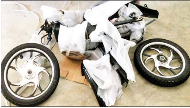
ရှမ်းပြည်နယ်အတွင်း၌ သိမ်းဆည်းရမိမှုမှတစ်ဆင့်ဖော်ပြပါ။

ထို့အတူ ရှမ်းပြည်နယ် တရားမဝင်ကုန်သွယ်မှုတိုက်ဖျက်ရေး အထူးအဖွဲ့၏ စီမံခန့်ခွဲမှုဖြင့် မူဆယ်မြို့ နမ့်အွမ်ကျေးရွာနှင့် ကောင်းခါးကျေးရွာအကြား မိုင်တိုင်အမှတ်(၁၆၅/၁)အနီး ပြည်ထောင်စုလမ်းမကြီးတွင် ပူးပေါင်းစစ်ဆေးရေးအဖွဲ့က စစ်ဆေးမှုများဆောင်ရွက်ခဲ့ရာ မူဆယ်ဘက်မှ မန္တလေးဘက်သို့ မောင်းနှင်လာသော ခရီးသည်တင်ယာဉ်တစ်စီးပေါ်၌ တရားဝင်စာရွက်စာတမ်းအထောက်အထား တင်ပြနိုင်ခြင်းမရှိသည့် လူသုံးကုန်ပစ္စည်းများ၊ လုပ်ငန်းသုံးပစ္စည်းများ၊ စားသောက်ကုန်ပစ္စည်းများ၊ စိုက်ပျိုးရေးလုပ်ငန်းသုံးဆေးများ (ခန့်မှန်းတန်ဖိုးငွေကျပ် ၆၄၀၇၄၀)၊ Kenbo အမျိုးအစား ဆိုင်ကယ်လေးစီးနှင့် Canda အမျိုးအစား ဆိုင်ကယ်ခြောက်စီး (ခန့်မှန်းတန်ဖိုးငွေကျပ် ၁၂၀၀၀၀) နှင့် အဆိုပါကုန်စည်များ တင်ဆောင်လာသည့် မော်တော်ယာဉ်တစ်စီး (ခန့်မှန်းတန်ဖိုး ငွေကျပ် ၂၀၀၀၀၀) စုစုပေါင်း ခန့်မှန်းတန်ဖိုးငွေကျပ် ၉၆၀၇၄၀၀ ကို သိမ်းဆည်းရမိခဲ့ပြီး အကောက်ခွန်လုပ်ထုံးလုပ်နည်းနှင့်အညီ အရေးယူဆောင်ရွက်လျက်ရှိသည်။