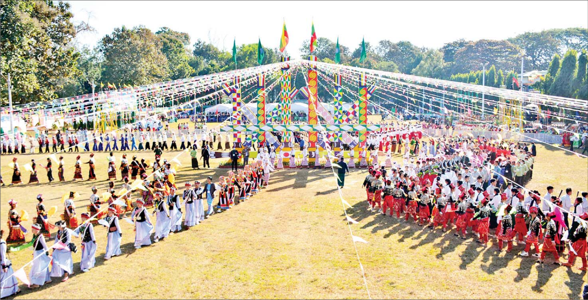
(၇၅)နှစ်မြောက် စိန်ရတု ကချင်ပြည်နယ်နေ့အခမ်းအနားကို ကချင်ပြည်နယ်အစိုးရအဖွဲ့ရုံးရှေ့ မြက်ခင်းပြင်၌ စည်ကားသိုက်မြိုက်စွာ ကျင်းပစဉ်။

မြစ်ကြီးနား ဇန်နဝါရီ ၁၀ (၇၅)နှစ်မြောက် စိန်ရတု ကချင်ပြည်နယ်နေ့အခမ်းအနားကို ယနေ့ နံနက် ၈ နာရီတွင် ကချင်ပြည်နယ်အစိုးရအဖွဲ့ရုံးရှေ့ မြက်ခင်းပြင်၌ စည်ကားသိုက်မြိုက်စွာ ကျင်းပသည်။ အခမ်းအနားသို့ နိုင်ငံတော်စီမံအုပ်ချုပ်ရေးကောင်စီအဖွဲ့ဝင် Jeng Phang နော်တောင်၊ ဦးမောင်းဟာ၊ ဦးစိုင်းလုံးဆိုင်၊ ဦးရွှေကြိမ်းတို့နှင့် အတူ ပြည်ထောင်စုဝန်ကြီး ဒုတိယဗိုလ်ချုပ်ကြီး ထွန်းထွန်းနောင်၊ ဦးမောင်မောင်အုန်း၊ ဦးလှမိုး၊ ဦးသောင်းဟန်၊ ဦးအောင်နိုင်ဦး၊ ဒေါက်တာညွန့်ဖေ၊ ဦးမင်းသိန်း၊ ဦးမျိုးသန့်၊ ဦးစောထွန်းအောင်မြင့်၊ ဒုတိယဝန်ကြီး ဗိုလ်ချုပ်ဖြိုးသန့်နှင့် ဦးဇော်အေးမောင်တို့ တက်ရောက် ကြရာ ပြည်နယ်ဝန်ကြီးချုပ် ဦးခက်ထိန်နန်၊ မြောက်ပိုင်းတိုင်းစစ် ဌာနချုပ်တိုင်းမှူးနှင့် စာမျက်နှာ ၃ ကော်လံ ၁ သို့ ။