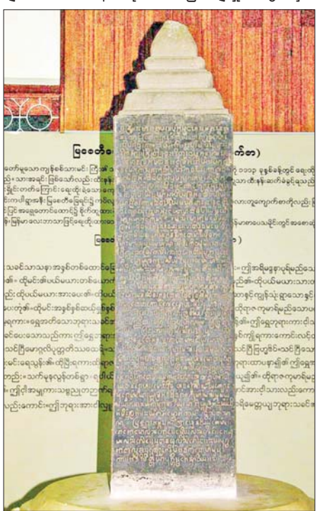
ကမ္ဘာ့မှတ်တမ်း အမွေအနှစ်စာရင်းဝင် မြစေတီကျောက်စာ။