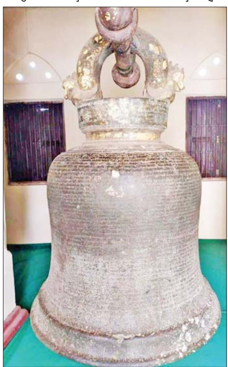
ကမ္ဘာ့မှတ်တမ်း အမွေအနှစ်စာရင်းဝင် ဘုရင့်နောင်မင်းတရားကြီး၏ ခေါင်းလောင်းစာ။