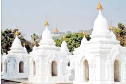
ဆောင်းပါး စာမျက်နှာ » ၆

မြန်မာနိုင်ငံမှ ကမ္ဘာ့မှတ်တမ်း အမွေအနှစ်များ (Memory of the World)