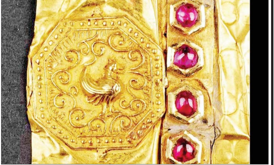
မြန်မာဘုရင် အလောင်းဘုရားမှ ဗြိတိသျှဘုရင် ဂျော့ချ်ဘုရင် (၂)ထံသို့ ပေးပို့သောရွှေပေလွှာ။

ကျောက်စာနှင့် ၁၉၃၄ ခုနှစ်တွင် ရိုက်ကူးခဲ့သော မြန်မာနိုင်ငံရုပ်ရှင်တို့မှာလည်း ၂၀၁၈ ခုနှစ် မေလ ၂၉ ရက်နေ့မှ ဇွန်လ ၁ ရက်နေ့အထိ တောင်ကိုရီးယားနိုင်ငံ ဝမ်ဂျူးမြို့၌ ပြုလုပ်ကျင်းပခဲ့သည့် (၈) ကြိမ်မြောက် မှတ်တမ်းအမွေအနှစ်များဆိုင်ရာ အာရှ-ပစိဖိတ် ကော်မတီအစည်းအဝေးတွင် ဒေသတွင်း မှတ်တမ်းအမွေအနှစ် အဖြစ် သတ်မှတ်ခံခဲ့ရပြီး ဖြစ်ပါသည်။