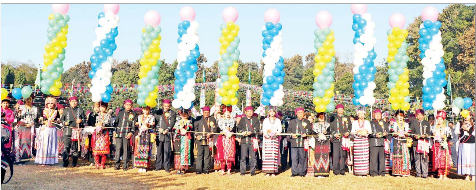
ပြည်ထောင်စုဝန်ကြီးများနှင့် ဒုတိယဝန်ကြီးများက (၇၅)နှစ်မြောက် စိန်ရတုကချင်ပြည်နယ်နေ့ ဖွင့်ပွဲအခမ်းအနားနှင့် မနောပွဲအား ဖဲကြိုးဖြတ်ဖွင့်လှစ်ပေးကြစဉ်။

မြစ်ကြီးနား ဇန်နဝါရီ ၉ ၂၀၂၃ ခုနှစ် ဇန်နဝါရီ ၁၀ ရက် တွင် ကျရောက်မည့် (၇၅) နှစ်မြောက် စိန်ရတုကချင် ပြည်နယ်နေ့ ဖွင့်ပွဲအခမ်းအနားကို ယနေ့ နံနက် ၈ နာရီတွင် ကချင် ပြည်နယ် အစိုးရအဖွဲ့ရုံးဝင်းရှေ့ မြက်ခင်းပြင်၌ ဌာနေတိုင်းရင်းသား တို့၏ စည်းလုံးညီညွတ်ခြင်းကို ဖော်ထုတ်ပြသသည့် မနောအက ဖြင့် စည်ကားသိုက်မြိုက်စွာ ကျင်းပသည်။