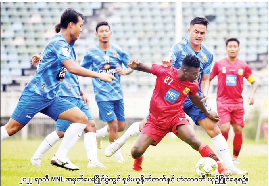
၂၀၂၂ ရာသီ MNL အမှတ်ပေးပြိုင်ပွဲတွင် ရှမ်းယူနိုက်တက်နှင့် ဟံသာဝတီ ယှဉ်ပြိုင်နေစဉ်။

ရန်ကုန် ဇန်နဝါရီ ၉ မြန်မာနေရှင်နယ်လိဂ်သည် လာမည့် ၂၀၂၃ ရာသီတွင် ပြည်တွင်းလိဂ်ပြိုင်ပွဲ သုံးခုစလုံး ကျင်းပသွားမည်ဖြစ်သည်။ ထုတ်ပြန်ထား မြန်မာနေရှင်နယ်လိဂ်သည် ၂၀၂၃ ရာသီတွင် ကျင်းပမည့် လိဂ်ပြိုင်ပွဲများကို ထုတ်ပြန်ထား ပြီး MNL အမှတ်ပေးပြိုင်ပွဲကို ၂၀၂၃ ခုနှစ် ဖေဖော်ဝါရီ ဒုတိယ ပတ်မှ စက်တင်ဘာလ၊ MNL-2 (ပထမတန်း) အမှတ်ပေးပြိုင်ပွဲကို ၂၀၂၃ ခုနှစ် ဖေဖော်ဝါရီလကုန် သို့မဟုတ် မတ်လမှ ဩဂုတ်/ စက်တင်ဘာလ၊မြန်မာအမျိုးသမီး စာမျက်နှာ ၂၇ ကော်လံ ၁ သို့ ၀