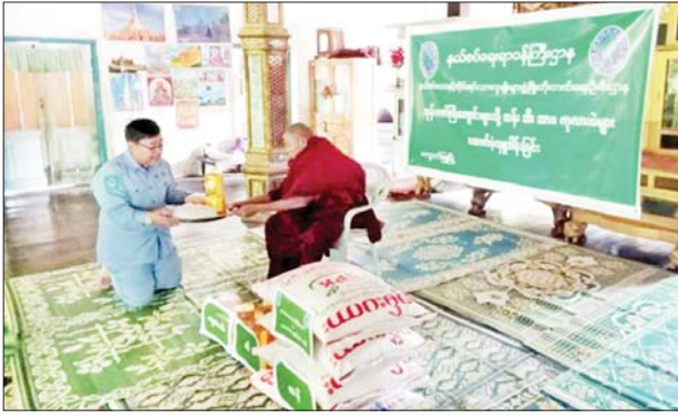
မြို့ အုတ်ကျောင်းနှင့် ဘုရားကြီး တော်၊ ဆီ၊ ဆားနှင့် ကုလားပဲများ ကျောင်းတိုက်ရှိ သံဃာတော်များ၊ ဆက်ကပ် လှူဒါန်းကြကြောင်း သာမဏေများအတွက် ဆွမ်းဆန် သိရသည်။