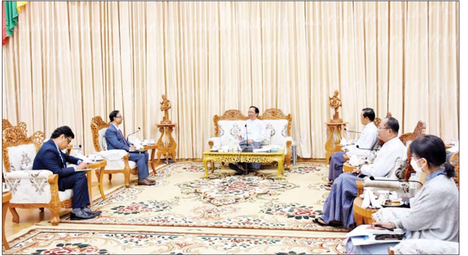
(ပြည်ထောင်စု ဝန်ကြီးရုံး)၊ ရေးမှူးချုပ် (ကုသရေးဦးစီးဌာန)၊ တာဝန်ရှိသူများ တက်ရောက်ခဲ့ ညွှန်ကြားရေးမှူးချုပ် (ပြည်သူ့ ဒုတိယ အမြတ်အစားအတွင်းဝန် ကြကြောင်း သိရသည်။

ရေးဆိုင်ရာ ကိုယ်စားလှယ်များကို နှစ်နိုင်ငံ အပြန်အလှန်စေလွှတ် နိုင်ရေးကိစ္စနှင့် ကိုဗစ်-၁၉ ကပ် ရောဂါ ကာကွယ်၊ ထိန်းချုပ်၊ ကုသ ရေး လုပ်ငန်းများဆိုင်ရာ ကိစ္စရပ် များကို နှစ်နိုင်ငံ ရင်းနှီးခင်မင်စွာ အမြင်ချင်းဖလှယ် ဆွေးနွေး ပြောကြားသည်။