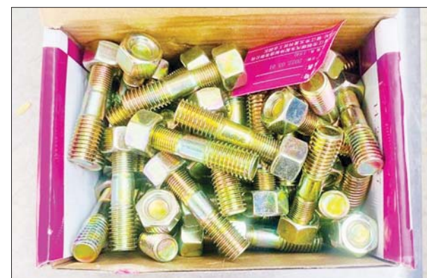
မန္တလေးတိုင်းဒေသကြီး (၁၆)မိုင်ကျောက်ချောစစ်ဆေးရေးစခန်း၌ ဖမ်းဆီးရမိမှု။

ဦးဆောင်သော ပူးပေါင်းစစ်ဆေးရေးအဖွဲ့များက စစ်ဆေးမှုများ ဆောင်ရွက်ခဲ့ရာ ပဲခူးခရိုင်နှင့် တောင်ငူခရိုင်တို့အတွင်း တရားမဝင် ကျွန်းသစ်နှင့်သစ်မာ ၅၂ ဒဿမ ၇၆၀၂ တန် (ခန့်မှန်းတန်ဖိုးငွေကျပ် ၂၈၆၅၅၉၆၈)ကို သိမ်းဆည်းရမိခဲ့ပြီး သစ်တောဥပဒေနှင့်အညီ အရေးယူဆောင်ရွက်လျက်ရှိသည်။ ယင်းအပြင် ဇန်နဝါရီ ၉ ရက်တွင် ကရင်ပြည်နယ် တရားမဝင်ကုန်သွယ်မှုတိုက်ဖျက်ရေး အထူးအဖွဲ့၏ စီမံခန့်ခွဲမှုဖြင့် ကော့ကရိတ် (တံတားကျိုး) စုပေါင်းစစ်ဆေးရေးစခန်း၌ တာဝန်ကျပူးပေါင်းအဖွဲ့က စစ်ဆေးမှုများဆောင်ရွက်ခဲ့ရာ မြဝတီမြို့မှ ရန်ကုန်မြို့သို့ မောင်းနှင်လာသော မော်တော်ယာဉ်တစ်စီးပေါ်၌ တရားဝင်စာရွက်စာတမ်းအထောက်အထား တင်ပြနိုင်ခြင်းမရှိသည့် ဟင်းချက်ဒယ်နီအိုအလုံး ၇၀ (ခန့်မှန်းတန်ဖိုးငွေကျပ် ၂၄၅၀၀၀)ကို ဖမ်းဆီးရမိခဲ့ပြီး အကောက်ခွန်လုပ်ထုံးလုပ်နည်းနှင့်အညီ အရေးယူဆောင်ရွက်လျက်ရှိသည်။ သို့ဖြစ်ပါ၍ ဇန်နဝါရီ ၇ ရက် ၊ ၈ ရက် နှင့် ၉ ရက်တို့တွင် ဖမ်းဆီးရမိမှု စုစုပေါင်းမှာ အမှုတွဲ ၁၂ မှု (ခန့်မှန်းတန်ဖိုးငွေကျပ် ၂၃၇၃၀၃၆၈) ဖြစ်ကြောင်း တရားမဝင်ကုန်သွယ်မှု တိုက်ဖျက်ရေးဦးဆောင်ကော်မတီမှ သိရသည်။ သတင်းစဉ်