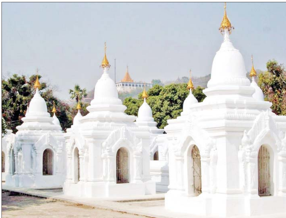
ကမ္ဘာ့မှတ်တမ်းအမွေအနှစ်စာရင်းဝင် မဟာလောကမာရဇိန် သို့မဟုတ် ကုသိုလ်တော်ကျောက်စာ။

ကမ္ဘာ့အမွေအနှစ် (World Heritage) ဆိုသည်မှာ နောင်လာနောက်သားများ မိမိတို့၏ ယဉ်ကျေးမှုအမွေအနှစ်များကို တန်ဖိုးထား ကာကွယ်စောင့်ရှောက်ရန်အတွက် ကမ္ဘာလုံးဆိုင်ရာ စံတန်ဖိုးကြီးသောနေရာများကို ကမ္ဘာ့အမွေအနှစ်နေရာများအဖြစ် သတ်မှတ်ခြင်း ဖြစ်ပါသည်။ ထိုသို့သတ်မှတ်ရာတွင် ကမ္ဘာ့အမွေအနှစ်စာရင်း(ယဉ်ကျေးမှု) အတွက် စံသတ်မှတ်ချက် ခြောက်ခုရှိပြီး ကမ္ဘာ့အမွေအနှစ် စာရင်းဝင်နိုင်ရန်အတွက် စာရင်းတင်သွင်းထားသောဒေသ သို့မဟုတ် နေရာသည် လူသားအားလုံးအသိအမှတ်ပြုနိုင်သော တန်ဖိုးရှိရန်လိုအပ်သကဲ့သို့ သတ်မှတ်ထားသော စံနှုန်းများနှင့်လည်း အနည်းဆုံး တစ်ချက်ကိုကိုင်ညီရန် လိုအပ်ပါသည်။ တရုတ်နိုင်ငံရှိ Great Wall၊ အိန္ဒိယနိုင်ငံရှိ Taj Mahal၊ မြန်မာနိုင်ငံရှိ ပျူမြို့ဟောင်း သုံးမြို့ (ဟန်လင်း၊ ဗိဿနိုး၊ သရေခေတ္တရာ)နှင့် ပုဂံယဉ်ကျေးမှုအမွေအနှစ်ဒေသတို့ကဲ့သို့သော ကြီးမားသော အဆောက်အအုံများ၊ ကျယ်ဝန်းသော အမွေအနှစ်နေရာဒေသများစသည်တို့ကို ကမ္ဘာ့အမွေအနှစ်စာရင်း(ယဉ်ကျေးမှု)များအဖြစ် သတ်မှတ်ခြင်း ဖြစ်ပါသည်။ ကမ္ဘာ့အမွေအနှစ်စာရင်း(သဘာဝ) အတွက် သတ်မှတ်ထားသော စံသတ်မှတ်ချက်