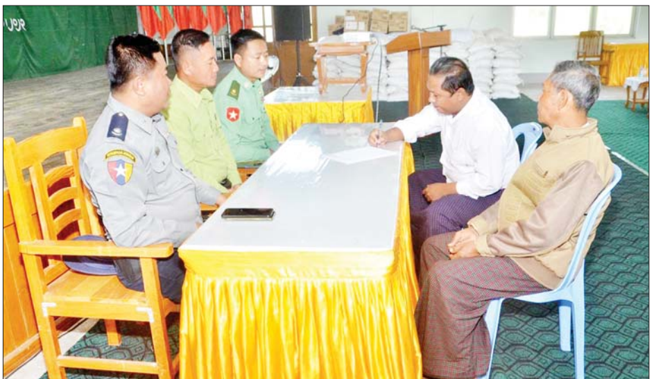
တိုင်းဒေသကြီးနှင့် ပြည်နယ်အသီးသီး၌ ဥပဒေ အုပ်ထိန်းသူများထံသို့ လွှဲပြောင်းအပ်နှံပေးလျက် တောင်အတွင်း ပြန်လည်ဝင်ရောက်လျက်ရှိကြသဖြင့် ရှိကြောင်း သိရသည်။ သက်ဆိုင်ရာတာဝန်ရှိသူများက ၎င်းတို့၏ မိဘ သတင်းစဉ်

ဦးစွာတာဝန်ရှိသူများက နယ်မြေဒေသတည်ငြိမ် အေးချမ်းရေးနှင့် တရားဥပဒေဆိုင်ရာပုဒ်မများကို ရှင်းလင်းဆွေးနွေးပြောကြားသည်။ ထို့နောက် ဥပဒေဘောင်အတွင်း ပြန်လည်ဝင်ရောက်ခဲ့သည့် ပြစ်မှုကျူးလွန်ခြင်းမရှိခဲ့သော ပုဗ္ဗသီရိမြို့နယ်အတွင်း မှ PDF အဖွဲ့ဝင် အမျိုးသမီး လေးဦးကို ဝန်ခံကတိ လက်မှတ်ရေးထိုးစေကာ ထောက်ပံ့ပစ္စည်းများ ပေးအပ်ပြီး ၎င်းတို့၏ မိဘအုပ်ထိန်းသူများထံသို့ လွှဲပြောင်းအပ်နှံပေးကြသည်။ PDF အပါအဝင် အဖွဲ့အစည်းအမျိုးမျိုးတို့ အနေဖြင့် နိုင်ငံတော်၏ ရှေ့လုပ်ငန်းစဉ်များတွင် ပါဝင်ပူးပေါင်းဆောင်ရွက်နိုင်ရေး သတ်မှတ်စည်းကမ်း ချက်များနှင့်အညီ ဥပဒေဘောင်အတွင်းသို့ လက်နက် အပ်နှံပြီး ပြည်သူ့ဘဝသို့ ပြန်လည်ဝင်ရောက်ခြင်း ပြုမည်ဆိုပါက ကြိုဆိုလက်ခံသွားမည်ဖြစ်ကြောင်း နိုင်ငံတော်အစိုးရက ထုတ်ပြန်ထားပြီးဖြစ်ရာ ပြစ်မှု ကျူးလွန်ခဲ့ခြင်းမရှိသော PDF အဖွဲ့ဝင်များက