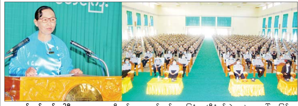
ရန်ကုန် ဇန်နဝါရီ ၉ - နိုင်ငံဝန်ထမ်း တက္ကသိုလ် (အောက်မြန်မာပြည်) ရတနာသိင်္ဃာနန်းမြို့နယ် ဝန်ထမ်း ၈ နာရီတွင် စာရေးဝန်ထမ်းအခြေခံ သင်တန်းအမှတ်စဉ် (၂၀၃) သင်တန်းဖွင့်ပွဲ အခမ်းအနားကို ကျင်းပရာ ဒုတိယပိမောက္ခချုပ်

ဒုတိယပိမောက္ခချုပ် (သင်ကြားရေး)၊ ဌာနကြီးမှူးများ၊ ပညာဌာနများမှ ပါမောက္ခများ၊ သင်ကြားပို့ချမည့် ဆရာ ဆရာမများနှင့် သင်တန်းသား သင်တန်းသူများ တက်ရောက်ကြသည်။ စာရေးဝန်ထမ်း အခြေခံ သင်တန်းအမှတ်စဉ်(၂၀၃) သို့ ဝန်ကြီးဌာနနှင့် အဖွဲ့အစည်းများမှ သင်တန်းသား ၁၈၉ ဦး၊ သင်တန်းသူ ၂၈၁ ဦး စုစုပေါင်း ၄၇၀ တို့ တက်ရောက်ကြောင်းနှင့် သင်တန်းကာလမှာ ဇန်နဝါရီ ၉ ရက်မှ မတ် ၁၇ ရက်အထိ ရက်သတ္တ ၁၀ ပတ်ကြာ တက်ရောက်ရမည်ဖြစ်ကြောင်း သိရသည်။ သတင်းစဉ်