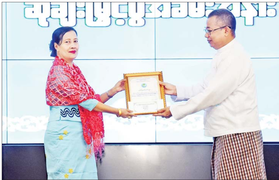
ဒုတိယဝန်ကြီး ဦးဇော်ဝင်း (၇၅)နှစ်မြောက် စိန်ရတုလွတ်လပ်ရေးနေ့အထိမ်းအမှတ် ဆောင်းပါးပြိုင်ပွဲတွင် ဒုတိယဆုရရှိသည့် ငြိမ်းချမ်းမေအား ဆုချီးမြှင့်စဉ်။