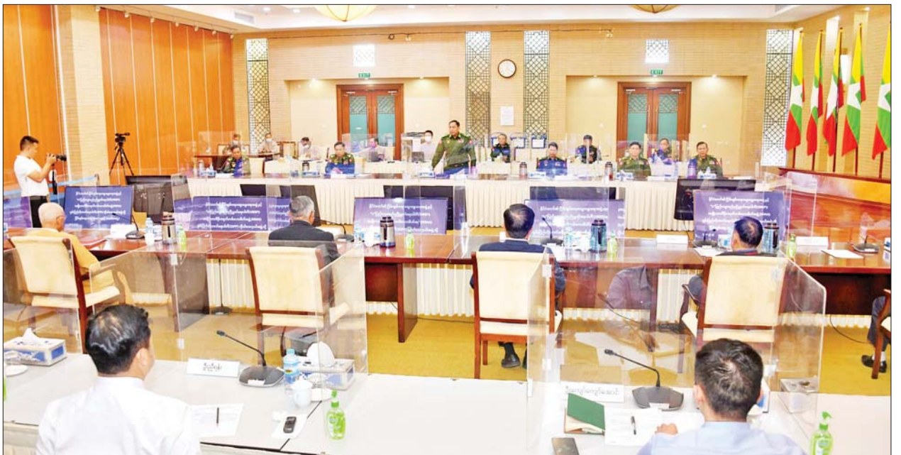
နိုင်ငံတော်၏ငြိမ်းချမ်းရေးဆွေးနွေးရေးအဖွဲ့နှင့် “ဝ” ပြည်သွေးစည်းညီညွတ်ရေးပါတီ(UWSP)၊ အမျိုးသားဒီမိုကရက်တစ်မဟာမိတ် အဖွဲ့(NDAA)နှင့် ရှမ်းပြည်တိုးတက်ရေးပါတီ(SSPP) ကိုယ်စားလှယ်အဖွဲ့တို့ တတိယနေ့ တွေ့ဆုံဆွေးနွေးစဉ်။

တွေ့ဆုံဆွေးနွေးပွဲတွင် သုံးရက်တာ ဆွေးနွေးညှိနှိုင်းချက်များအရ