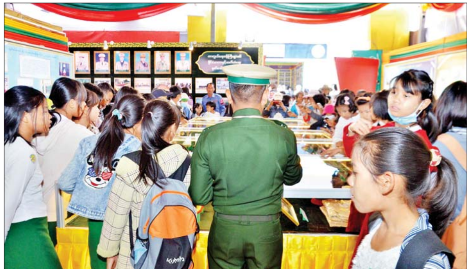
ကာကွယ်ရေးဝန်ကြီးဌာန ကိုယ်စားပြုပြခန်း၌ ကျောင်းသား ကျောင်းသူများ လာရောက်ကြည့်ရှုလေ့လာစဉ်။