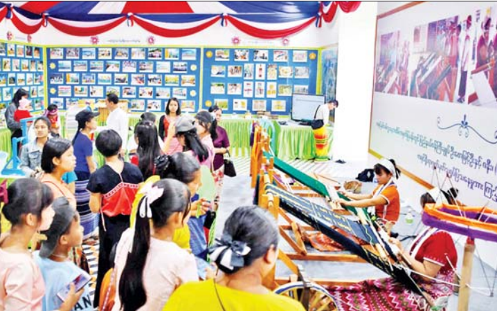
ကရင်ပြည်နယ် ကိုယ်စားပြု ပြခန်း၌ လာရောက်ကြည့်ရှုသူများကို တွေ့ရစဉ်။

(၇၅)နှစ်မြောက် စိန်ရတုလွတ်လပ်ရေးနေ့ အထိမ်းအမှတ်ပြခန်းများ၊ တိုင်းရင်းသားရိုးရာအစားအစာပြခန်းများ စုစုပေါင်း ၅၅ ခန်းနှင့် ဂုဏ်ပြုယာဉ် စုစုပေါင်း ၄၈ စီးကို ဇန်နဝါရီ ၄ ရက်မှ ၈ ရက်အထိ နေပြည်တော် ဥပျာတသန္တိဇေတီတော်ရှေ့ တပေါင်းကွင်း၌ ခင်းကျင်းပြသလျက်ရှိရာ ဇန်နဝါရီ ၇ ရက်တွင် ပြည်သူများ တစ်ခဲနက်လာရောက်လေ့လာကြည့်ရှုနေမှု များကို ဖော်ပြအပ်ပါသည်။