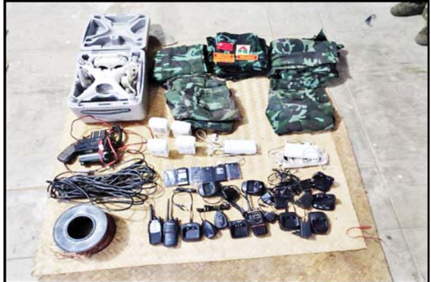
၂၀၂၃ ခုနှစ် ဇန်နဝါရီ ၃ ရက်တွင် ညောင်ရွှေမြို့နယ် တောင်ခြားပြင်ကျေးရွာအနီး၌ PDF အကြမ်းဖက်အဖွဲ့ထံမှ သိမ်းဆည်းရမိသည့် လက်နက်/ခဲယမ်းနှင့် ဆက်စပ်ပစ္စည်းများ၏ မှတ်တမ်းဓာတ်ပုံများ။