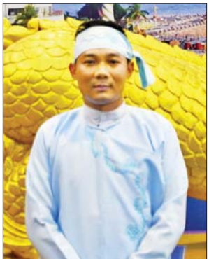
ဦးထွန်းထွန်းဦး