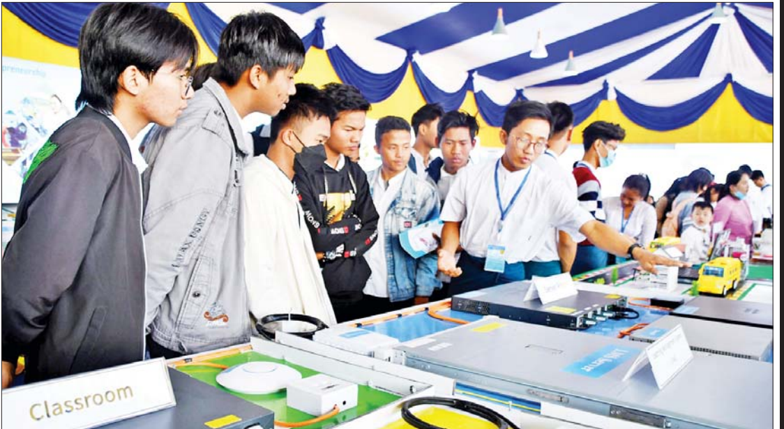
သိပ္ပံနှင့်နည်းပညာဝန်ကြီးဌာန ကိုယ်စားပြု ပြခန်း၌ ကျောင်းသား ကျောင်းသူများ ကြည့်ရှုလေ့လာစဉ်။