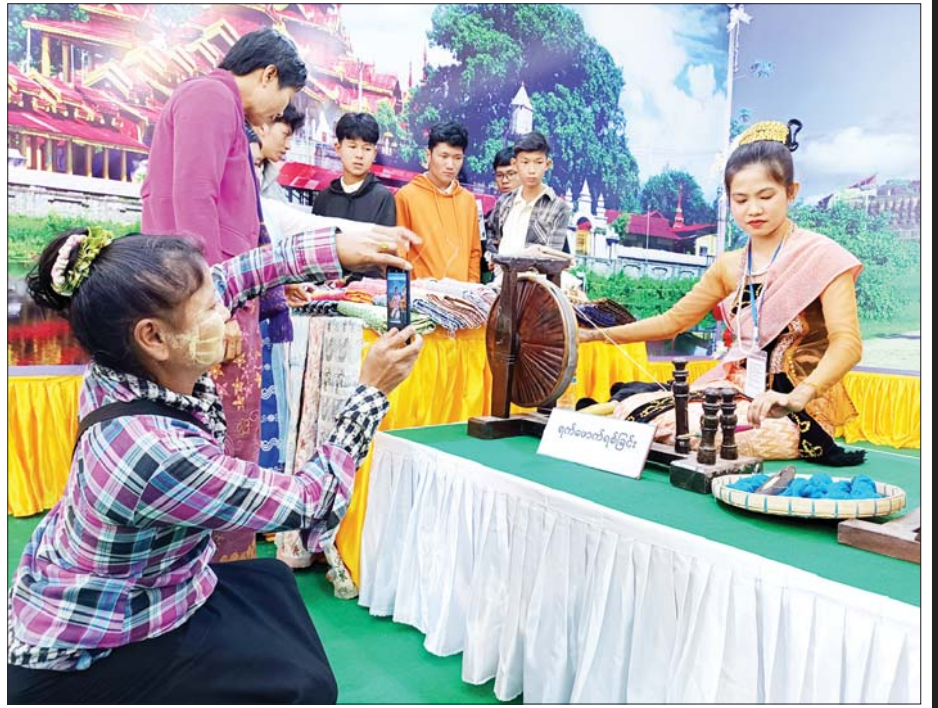
ရခိုင်ပြည်နယ်ကိုယ်စားပြု ပြခန်း၌ အမှတ်တရဓာတ်ပုံရိုက်ကူးနေသူတစ်ဦးကို တွေ့ရစဉ်။