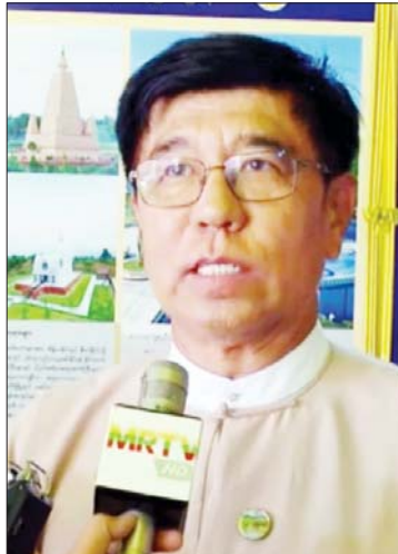
ဦးခင်ဇော်