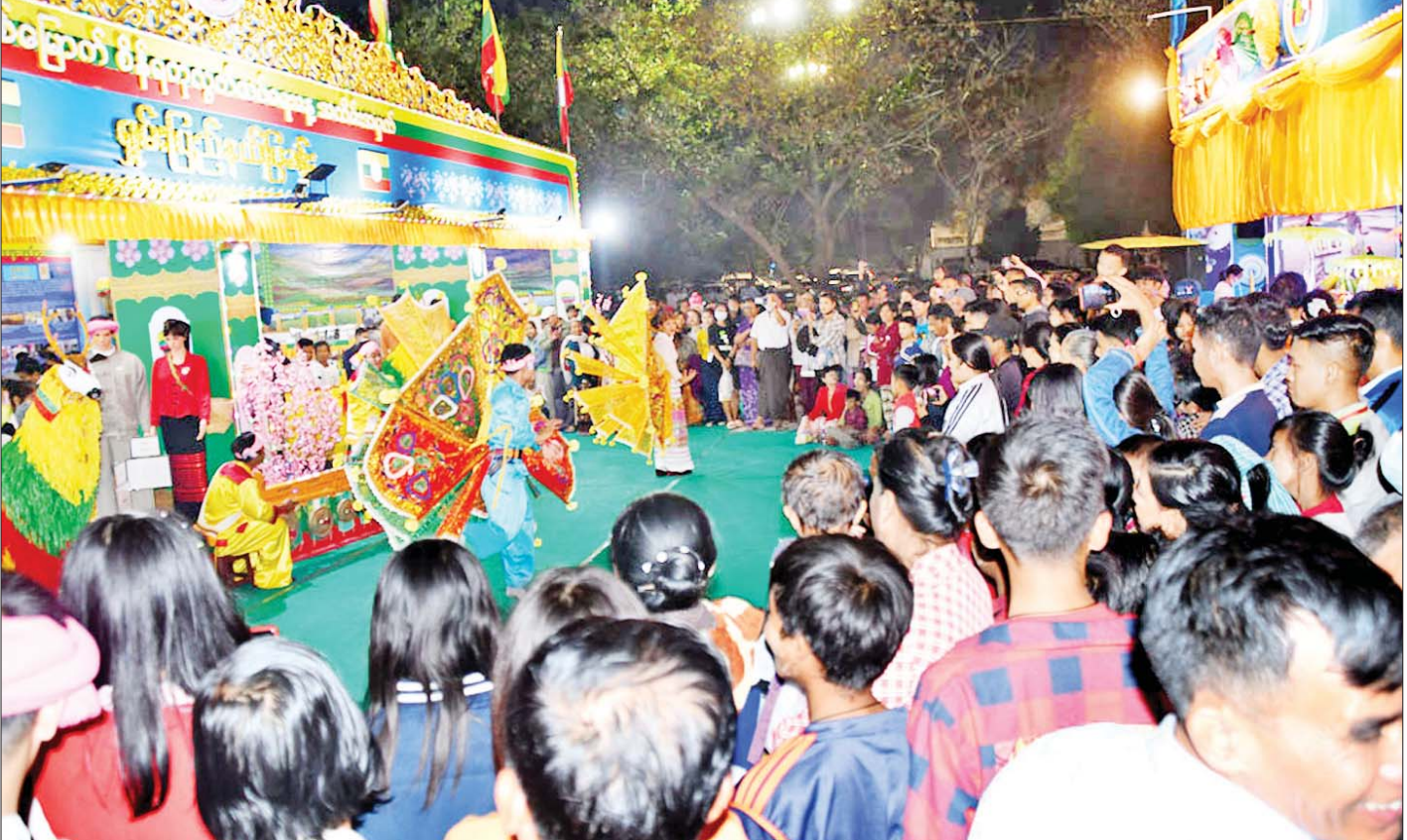
ရှမ်းပြည်နယ်ကိုယ်စားပြုပြခန်းတွင် တိုင်းရင်းသားရိုးရာအကများဖြင့် ဖျော်ဖြေတင်ဆက်မှုကို လာရောက်ကြည့်ရှုသူများအား တွေ့ရစဉ်။

ဒါ့အပြင် ချင်းတွင်း၊ ဧရာဝတီ၊ မိုးမြစ်တွေရဲ့ ရေအရင်းအမြစ်တွေကို အလဟဿမဖြစ်အောင် လျှပ်စစ်မြစ်ရေတံခွန် ဆိုလာမြစ်ရေတံခွန်တွေ အကောင်အထည်ဖော် ဆောင်ရွက်နေတဲ့အခြေအနေ တွေနဲ့ စစ်ကိုင်းတိုင်းဒေသကြီးရဲ့ လမ်းပန်းဆက်သွယ် ရေးကောင်းမွန်မှုအခြေအနေကို ဖော်ညွှန်းတဲ့ စစ်ကိုင်းတံတားကြီးကိုလည်း မြန်မာ့ရိုးရာလက်မှု ဖောင်းကြွပန်းချီနဲ့ ဖော်ကျူးပြီးတော့ ပြခန်းယာဉ်မှာ ပြသထားပါတယ်။ နောက်တစ်ခုက ပြည်ပသွင်းကုန် တွေကို အစားထိုးနိုင်တဲ့ ကိုယ်ပြည့်တွင်းထွက်ကုန် ပစ္စည်းဖြစ်တဲ့ လက်ရက်ကန်းဆိုရင်လည်း စစ်ကိုင်း တိုင်းဒေသကြီးမှာ အခုထိ ထွန်းကားနေတာဖြစ်တဲ့ အတွက် ဒေသထွက်ကုန်ကြမ်းပစ္စည်းနဲ့ ကုန်ချော အထည်တွေကို ပြသထားပါတယ်။ ဒါ့အပြင် အခု လက်ရှိ ဆောင်ရွက်နေဆဲလုပ်ငန်းတွေဖြစ်တဲ့ လေရိုး မြို့နယ်အထိ သွားရောက်နိုင်မယ့်လမ်းပေါ်မှာရှိတဲ့ ချင်းတွင်းမြစ်ကူး ထပ်သီတံတားကြီးဆောင်ရွက်နေမှု နဲ့ တိုင်းဒေသကြီးရဲ့ သဘာဝအရင်းအမြစ်တွေဖြစ်တဲ့ သတ္တုတူးဖော်ရေးလုပ်ငန်းတွေကိုလည်း ပြသထားပါတယ်။ စစ်ကိုင်းတိုင်းဒေသကြီးဟာ မြန်မာနိုင်ငံမှာ အကြီးဆုံးတိုင်းဒေသကြီးဖြစ်တဲ့အတွက် ဒီတိုင်း ဒေသကြီးအတွင်းမှာရှိတဲ့ သဘာဝအရင်းအမြစ် တွေကို အသုံးချပြီး ပြည်သူလူထုပူးပေါင်းမှုနဲ့ နိုင်ငံတော်ဖွံ့ဖြိုးတိုးတက်ဖို့အတွက် ဘယ်လောက် အထိ ဆောင်ရွက်နိုင်မလဲဆိုတာ သိရှိနိုင်အောင် (၇၅)နှစ်မြောက် လွတ်လပ်ရေးနေ့ အခမ်းအနားမှာ ပြည်သူတွေသိအောင် မိတ်ဆက်ချပြခြင်းပဲ ဖြစ်ပါ တယ်။