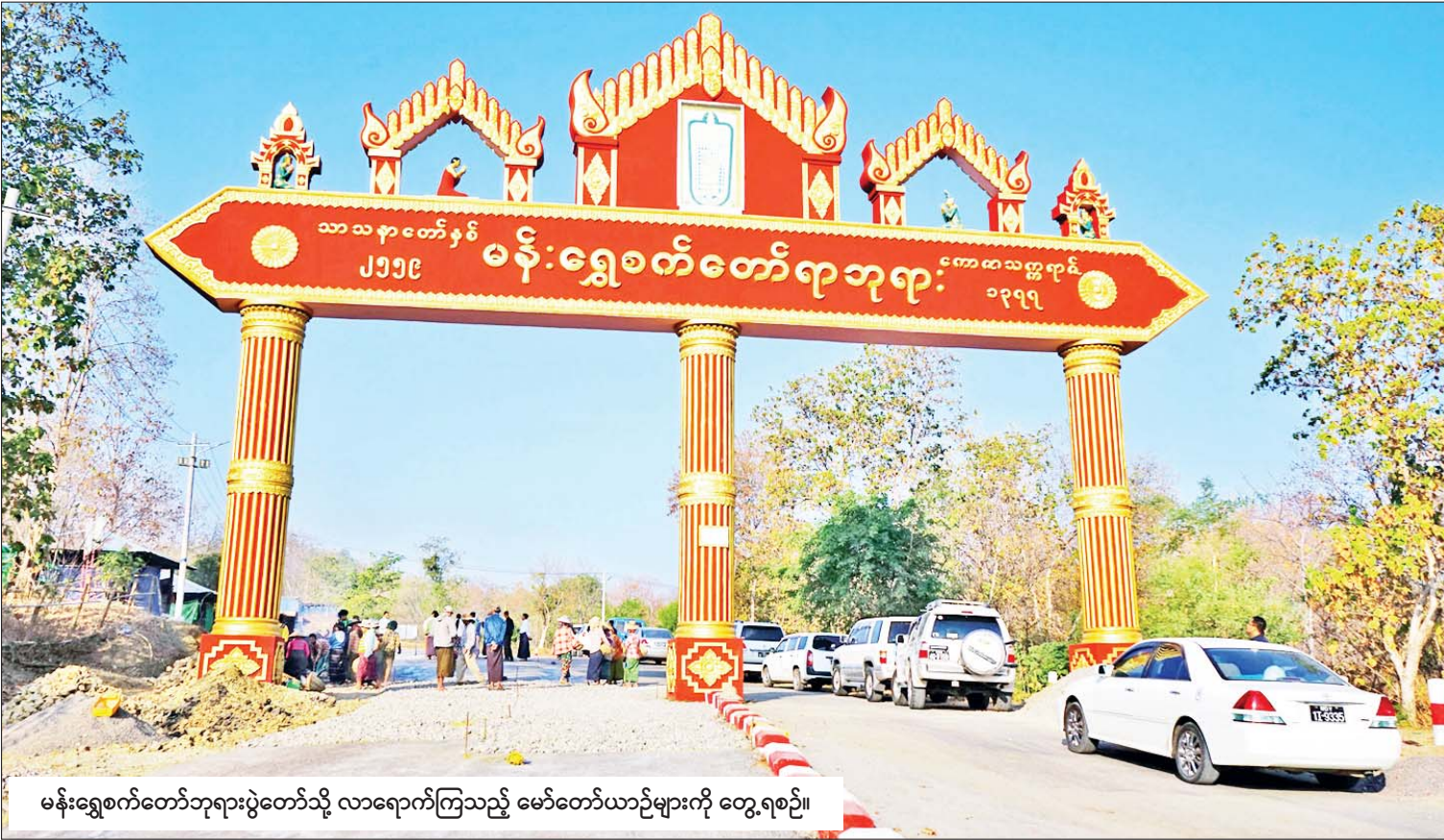
မန်းရွှေစက်တော်ဘုရားပွဲတော်သို့ လာရောက်ကြသည့် မော်တော်ယာဉ်များကို တွေ့ရစဉ်။

မင်းဘူး ဇန်နဝါရီ ၇ မကွေးတိုင်းဒေသကြီး မင်းဘူး(စက) မြို့နယ်ရှိ မန်းရွှေစက်တော်ဘုရားပွဲတော် သို့ ဘုရားဖူးလာရောက်ကြသူများ သွားလာရေး လွယ်ကူချောမွေ့အဆင်ပြေ စေရန်အတွက် မင်းဘူး-ရွှေစက်တော် ခရီးသည်တင် မော်တော်ယာဉ်လိုင်းကို ဘုရားပွဲတော်ကာလအတွင်း ပြေးဆွဲပေး သွားမည်ဖြစ်ကြောင်း မင်းဘူးခရိုင် ပုဂ္ဂလိကပိုင်လုပ်ငန်းသုံး မော်တော်ယာဉ် လိုင်းများ ကြီးကြပ်ရေးကော်မတီမှ သိရ သည်။ မန်းရွှေစက်တော် ဘုရားပွဲတော်ကို တပို့တွဲလဆန်း ၅ ရက်(ဇန်နဝါရီ ၂၅ ရက်) မှ မြန်မာနှစ်ဆန်းတစ်ရက်နေ့အထိ စည်ကားသိုက်မြိုက်စွာ ကျင်းပသွားမည် ဖြစ်ပြီး အနယ်နယ်အရပ်ရပ်မှ ဘုရားဖူး ရဟန်းရှင်လူ မိဘပြည်သူများနှင့် ဈေးရောင်း ဈေးဝယ်များ သွားလာရေး လွယ်ကူချောမွေ့ အဆင်ပြေစေရန် ပွဲတော်ကာလအတွင်း မင်းဘူးမြို့ မြောက်လှည်းကောက် အပိုင်းပတ်ဂိတ်၌ စာမျက်နှာ ၅ ကော်လံ ၄ သို့ ❖