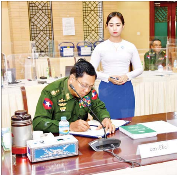
အမျိုးသားစည်းလုံးညီညွတ်ရေးနှင့် ငြိမ်းချမ်းရေးဖော်ဆောင်မှု ညွှန်ကြားရေးကော်မတီအဖွဲ့ဝင် ဒုတိယဗိုလ်ချုပ်ကြီးမိုးမြင့်ထွန်း လက်မှတ်ရေးထိုးစဉ်။