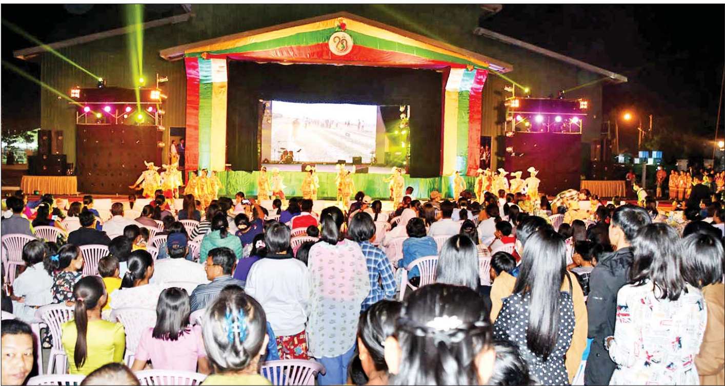
ရိုးရာအကအဖွဲ့များ၏ ဖျော်ဖြေတင်ဆက်မှုအား လာရောက်ကြည့်ရှုသူများကို တွေ့ရစဉ်။

ထို့ပြင် သတ်မှတ်နေရာများအလိုက် ခင်းကျင်းပြသထားကြသည့် နေပြည်တော်ကောင်စီအပါအဝင် တိုင်းဒေသကြီးနှင့် ပြည်နယ်အသီးသီးမှ ပြခန်းများနှင့် ဝန်ကြီးဌာနများအလိုက် ပြခန်းများမှ တာဝန်ရှိသူများကလည်း ပြခန်းတွင် ပြသထားသည့် တိုင်းရင်းသားများ၏ အထိမ်းအမှတ်များ၊ လူနေမှုစရိုက်များ၊ ဓလေ့ထုံးတမ်းအစဉ်အလာများ၊ အပန်းဖြေလည်ပတ်နိုင်သည့် အထင်ကရနေရာများ၊ ဒေသထုတ်ကုန်များ၊ နိုင်ငံတော်၏ သယံဇာတအရင်းအမြစ်