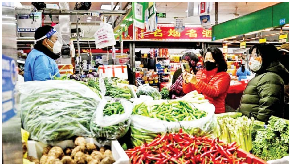
ကိုးကား - ဆင်ဟွာ ဘာသာပြန် - အလင်းသစ်

သို့ရာတွင် ကုလသမဂ္ဂစားနပ်ရိက္ခာနှင့် စိုက်ပျိုးရေး အဖွဲ့၏ စားနပ်ရိက္ခာဈေးနှုန်းအညွှန်းကိန်းသည် ၂၀၂၂ ခုနှစ်၏ ပထမလများတွင် သိသိသာသာမြင့် တက်မှုရှိခဲ့သော်လည်း ဒီဇင်ဘာလအတွင်းကမူ ယခင်လများထက် ၁ ဒသမ ၉ ရာခိုင်နှုန်း လျော့ကျမှု ရှိခဲ့ကြောင်း သိရသည်။