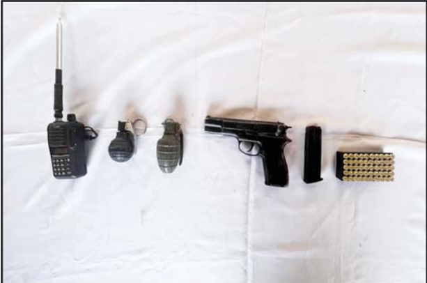
၂၀၂၂ ခုနှစ် ဒီဇင်ဘာ ၂၉ ရက်တွင် ကလေးမြို့နယ် ဟဲဟိုးမြို့ ရပ်ကွက်(၅)ရှိ “နန္ဒဝန်” စားသောက်ဆိုင်၌ တရားခံနှစ်ဦးနှင့်အတူ ဖမ်းဆီးရမိသည့် လက်နက်/ခဲယမ်းများ၏ မှတ်တမ်းဓာတ်ပုံ။