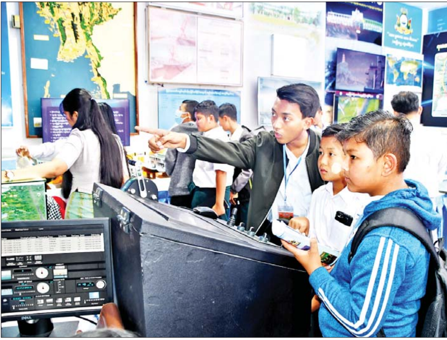
ပို့ဆောင်ရေးနှင့် ဆက်သွယ်ရေးဝန်ကြီးဌာနကိုယ်စားပြုပြခန်း၌ ကျောင်းသား ကျောင်းသူများ ကြည့်ရှုလေ့လာစဉ်။