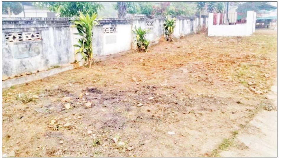
မိုင်းခတ်မြို့ အမှတ်(၁)ရပ်ကွက်ရှိ ကမ္ဘာ့ဌာနကျောင်းလမ်းဘေး၌ သန့်ရှင်းရေးမဆောင်ရွက်မီနှင့် ဆောင်ရွက်ပြီးစီးမှုကို တွေ့ရစဉ်။