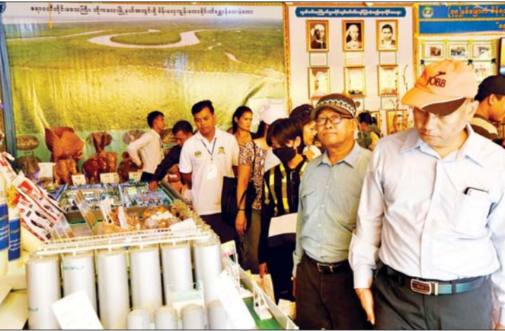
ဧရာဝတီတိုင်းဒေသကြီး ကိုယ်စားပြု ပြခန်း၌ လာရောက်ကြည့်ရှုသူများကို တွေ့ရစဉ်။