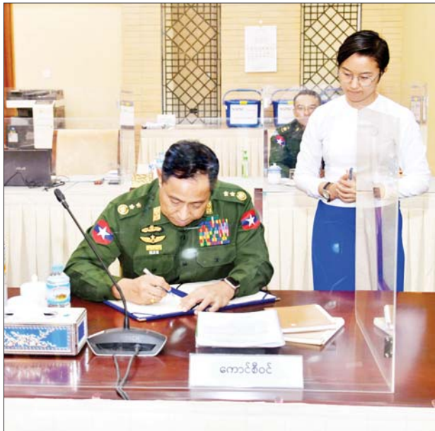
အမျိုးသားစည်းလုံးညီညွတ်ရေးနှင့် ငြိမ်းချမ်းရေးဖော်ဆောင်မှု ညွှန်ကြားရေးကော်မတီဥက္ကဋ္ဌ ဒုတိယဗိုလ်ချုပ်ကြီးရာပြည့် လက်မှတ် ရေးထိုးစဉ်။