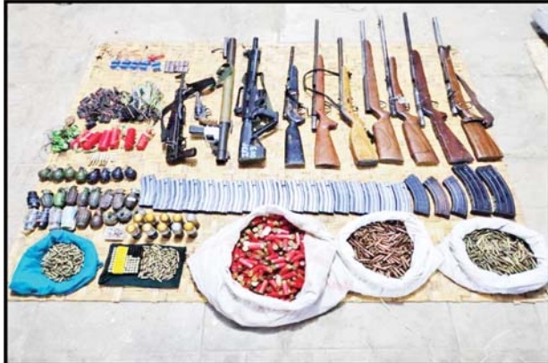
၂၀၂၃ ခုနှစ် ဇန်နဝါရီ ၃ ရက်တွင် ညောင်ရွှေမြို့နယ် တောင်ခြားပြင်ကျေးရွာအနီး၌ PDF အကြမ်းဖက်အဖွဲ့ထံမှ သိမ်းဆည်းရမိသည့် လက်နက်/ခဲယမ်းနှင့် ဆက်စပ်ပစ္စည်းများ၏ မှတ်တမ်းဓာတ်ပုံများ။