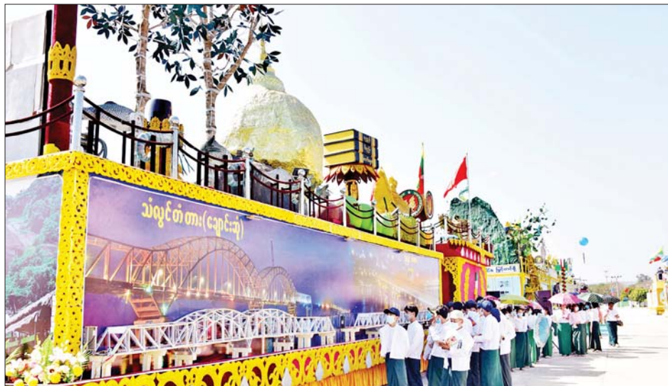
မွန်ပြည်နယ်ကိုယ်စားပြု ဂုဏ်ပြုယာဉ်ကို ကျောင်းသား ကျောင်းသူများနှင့် ဆရာ ဆရာမများ လာရောက်ကြည့်ရှုလေ့လာစဉ်။