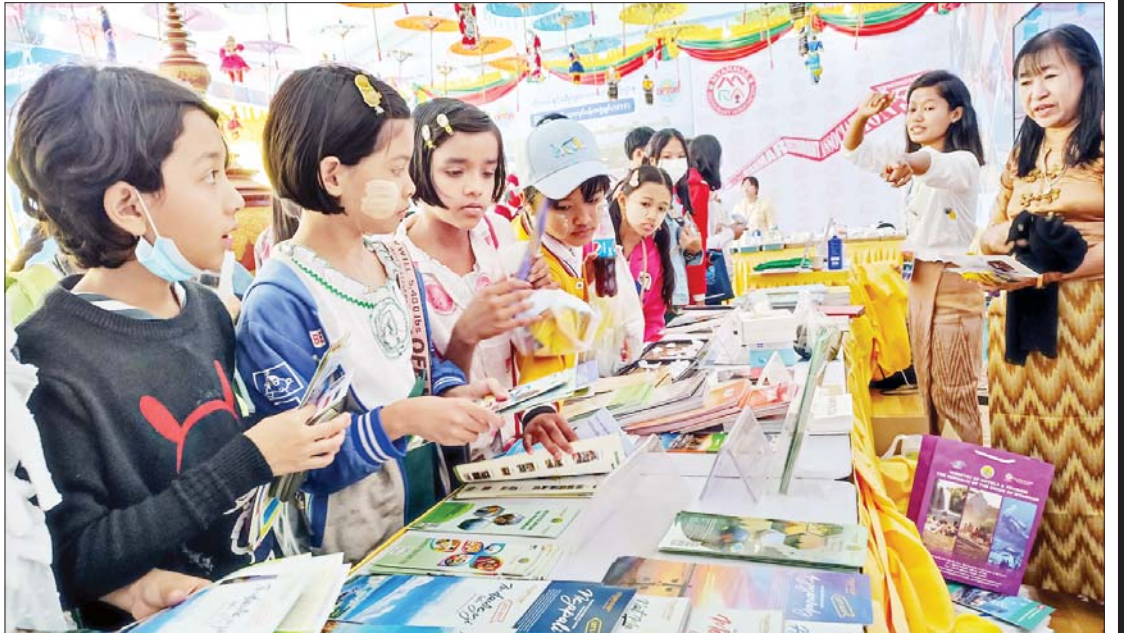
ဟိုတယ်နှင့်ခရီးသွားလာရေးဝန်ကြီးဌာန ကိုယ်စားပြု ပြခန်း၌ ကျောင်းသား ကျောင်းသူများ ကြည့်ရှုလေ့လာစဉ်။