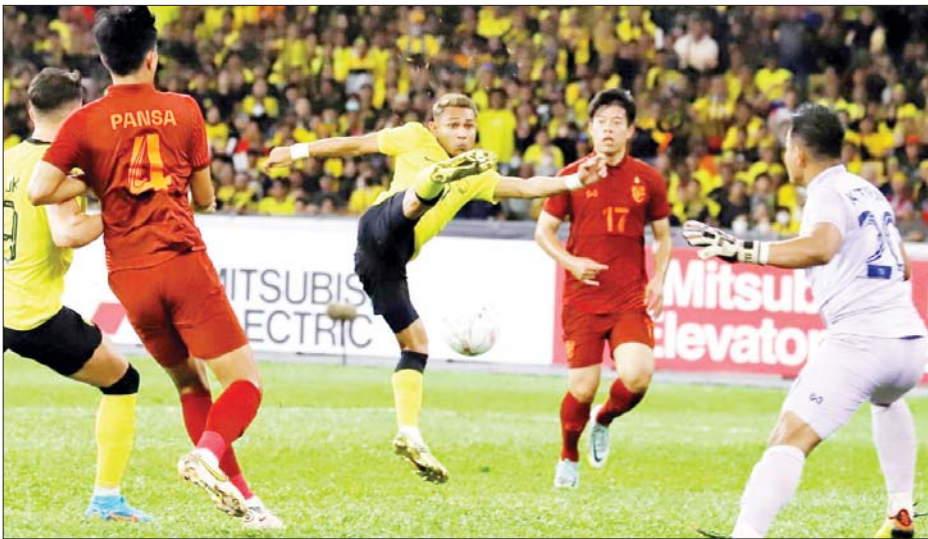
မလေးရှားအသင်းနှင့် ထိုင်းအသင်းတို့ ယှဉ်ပြိုင်နေစဉ်။

ရန်ကုန် ဇန်နဝါရီ ၇ 2022 AFF Cup ပြိုင်ပွဲ ဆီမီးဖိုင်နယ် ပထမအကျော့ (ဒုတိယနေ့) ကို ဇန်နဝါရီ ၇ ရက်က မလေးရှားနိုင်ငံ ကွာလာလမ်ပူ မြို့ရှိ ဘူကစ်ဂျာလီကွင်း၌ ကျင်းပရာ မလေးရှားအသင်းက လက်ရှိ ချန်ပီယံ ထိုင်းအသင်းကို တစ်ဂိုး-ဂိုးမရှိဖြင့် အနိုင်ရရှိခဲ့သည်။ မလေးရှားအသင်းသည် ပထမအကျော့ အိမ်ကွင်းပွဲတွင် ထိုင်းအသင်းကို အနိုင်ကစားနိုင်ခဲ့သဖြင့် ဗိုလ်လုပွဲ တက်ရောက်ခွင့်ရရန် မျှော်လင့်ချက်ရှိလာသည်။ ထိုင်းအသင်းမှာမူ အဝေးကွင်းပွဲကြောင့် စာမျက်နှာ ၂၅ ကော်လံ ၄ သို့ ၂