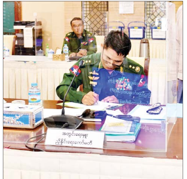
အမျိုးသားစည်းလုံးညီညွတ်ရေးနှင့် ငြိမ်းချမ်းရေးဖော်ဆောင်မှု ညွှန်ကြားရေးကော်မတီ အတွင်းရေးမှူး ဒုတိယဗိုလ်ချုပ်ကြီးမင်းနောင် လက်မှတ်ရေးထိုးစဉ်။