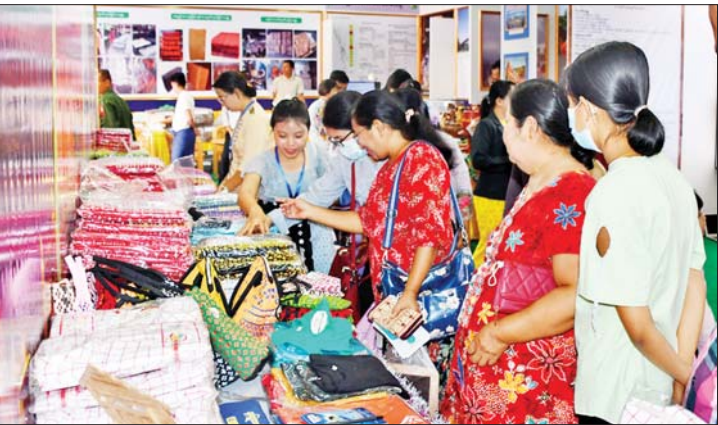
မွန်ပြည်နယ်ကိုယ်စားပြုပြခန်း၌ ဒေသထွက်ကုန်များကို လာရောက်ကြည့်ရှု လေ့လာဝယ်ယူသူများကို တွေ့ရစဉ်။