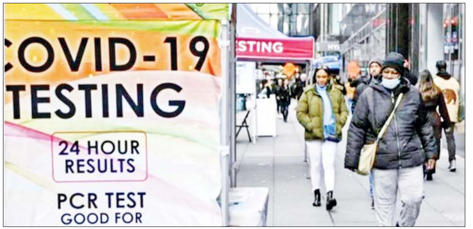
သည့် အောက်တိုဘာလလယ်မှစပြီး လျော့ကျလျက် ရှိကြောင်း သိရသည်။

အမေရိကန်နိုင်ငံအတွင်း ဇန်နဝါရီ ၄ ရက်အထိ ကိုဗစ်-၁၉ ရောဂါကူးစက်ခံရသူပေါင်း ၆၅၀၀ သည် ဆေးရုံများ၌ ဆေးဝါးကုသမှုခံယူနေရပြီး အဆိုပါ အရေအတွက်သည် လွန်ခဲ့သောလကထက် ၃၀ ရာခိုင်နှုန်းခန့် ပိုမိုမြင့်တက်လာသည်။ သို့သော် တစ်ရက်လျှင် သေဆုံးသူ အရေအတွက်သည် လွန်ခဲ့