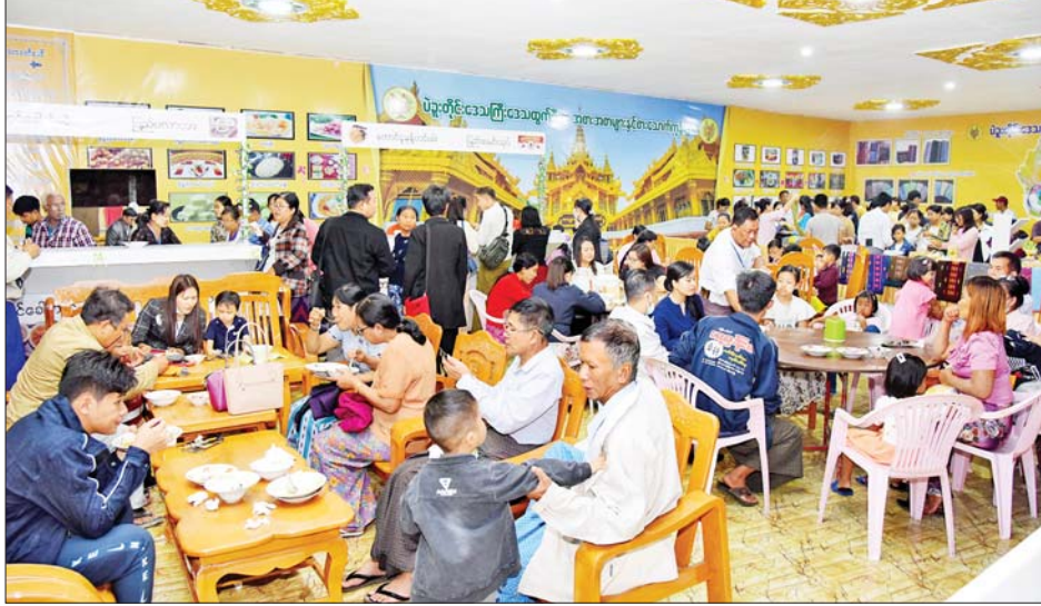
ပဲခူးတိုင်းဒေသကြီး ဒေသထွက်ရိုးရာအစားအစာများကို ဝယ်ယူစားသုံးကြသူများဖြင့် စည်ကားနေသည်ကို တွေ့ရစဉ်။

သတင်း - ဟိန်းမင်းစိုး၊ ဂျိုင်းလော