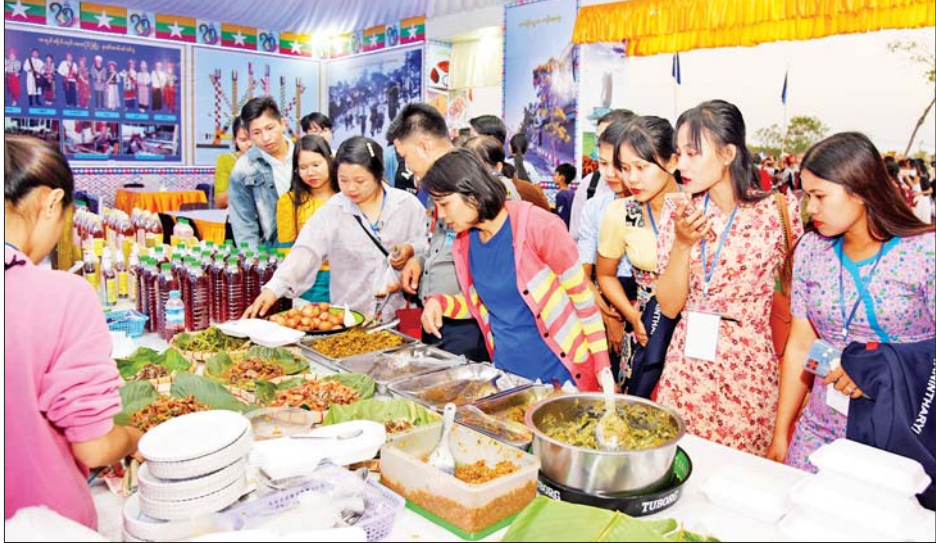
ကချင်ပြည်နယ်ပြခန်းတွင် ရိုးရာအစားအစာများကို လာရောက်ဝယ်ယူသူများဖြင့် စည်ကားနေသည်ကို တွေ့ရစဉ်။