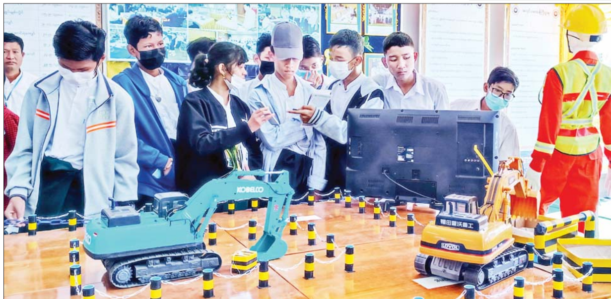
နိုင်ငံခြားရေးဝန်ကြီးဌာနနှင့် အပြည်ပြည်ဆိုင်ရာ ပူးပေါင်းဆောင်ရွက်ရေးဝန်ကြီးဌာန ကိုယ်စားပြုပြခန်း၌ ကျောင်းသား ကျောင်းသူများ ကြည့်ရှုလေ့လာစဉ်။