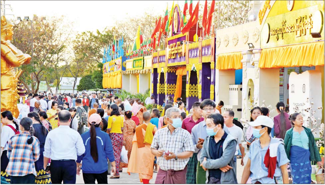
(၇၅)နှစ်မြောက် စိန်ရတုလွတ်လပ်ရေးနေ့အထိမ်းအမှတ်ပြခန်းများတွင် လာရောက်လေ့လာကြည့်ရှုသူများအား တွေ့ရစဉ်။

ထို့ပြင် ပြွဲသို့ လှပတင့်တယ်ခမ်းနားစွာ ခင်းကျင်းပြသထားသည့် ဂုဏ်ပြုယာဉ်ကြီးများ၊ ရိုးသားဖြူစင်ဖော်ရွေလှသည့် တိုင်းရင်းသားရိုးရာယဉ်ကျေးမှုအဖွဲ့များနှင့်အတူ အမှတ်တရ ဓာတ်ပုံရိုက်ကြသူများကို