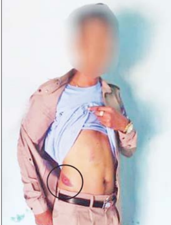
ပုသိမ်မြို့အကျဉ်းထောင်ဆူပူအကြမ်းဖက်မှုတွင် ဒဏ်ရာရရှိခဲ့သည့် အကျဉ်း ဦးစီးဌာနဝန်ထမ်းများကို တွေ့ရစဉ်။