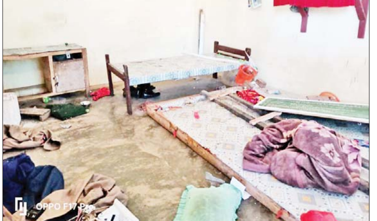
ပုသိမ်မြို့အကျဉ်းထောင်ဆူပူအကြမ်းဖက်မှုမှ အပျက်အစီးများကို တွေ့ရစဉ်။

ထို့နောက် အခြားအိပ်ဆောင်တစ်ခုမှ အကျဉ်းသား၊ အချုပ်သားအချို့ကလည်း ၎င်းတို့၏အိပ်ဆောင်များရှိ တံခါးများကို ဖျက်ဆီးခြင်း၊ CCTV များကို ဖျက်ဆီး ခြင်း၊ အကျဉ်းထောင်အတွင်းရှိ စည်းကမ်း ထိန်းရုံးသို့ သွားရောက်ရန်မူရန် ကြိုးစား လာကြပြီး ပထမဆူပူမှု ဖြစ်ပွားနေသည့် အဆောင်ရှိ အကျဉ်းသား၊ အချုပ်သားများ နှင့် ပူးပေါင်းကာ ဖျက်ဆီးမှုများကို အရှိန် မြှင့် ဆောင်ရွက်လာကြသည်။ ထိုသို့ ဆူပူအကြမ်းဖက်ဖြစ်စဉ် များကြောင့် အခြေအနေကို ထိန်းသိမ်း ဆောင်ရွက်နိုင်ရန်အတွက် နံနက် ၉ နာရီ ၄၅ မိနစ်ခန့်တွင် ရောဂါတိုင်းဒေသကြီး အကျဉ်းဦးစီးဌာန ညွှန်ကြားရေးမှူး ဦးစီး၍ တာဝန်ရှိသူဝန်ထမ်းများနှင့် မြန်မာနိုင်ငံရဲတပ်ဖွဲ့မှ ခရိုင်ရဲတပ်ဖွဲ့မှူး