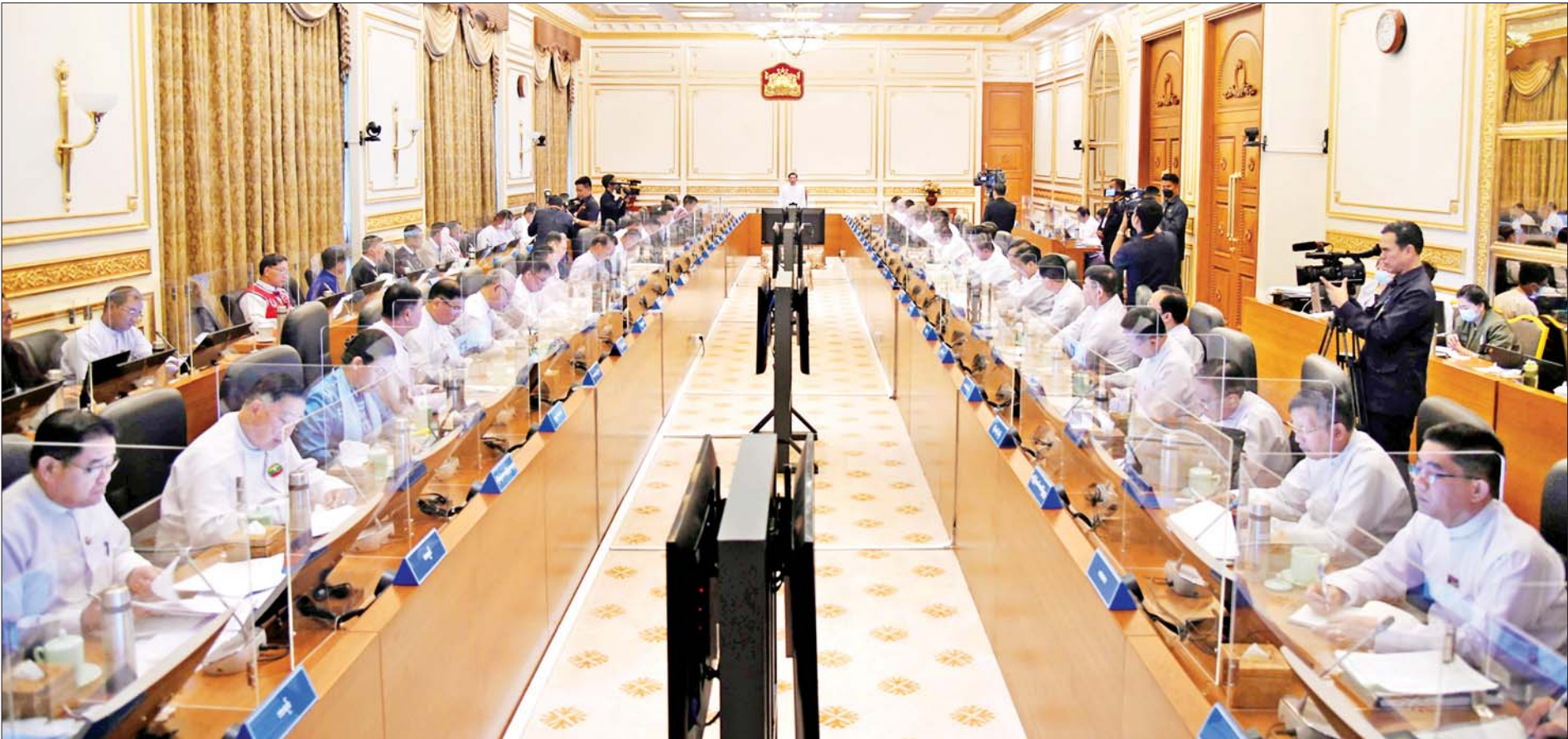
နိုင်ငံတော်စီမံအုပ်ချုပ်ရေးကောင်စီဥက္ကဋ္ဌ နိုင်ငံတော်ဝန်ကြီးချုပ် ဗိုလ်ချုပ်မှူးကြီးမင်းအောင်လှိုင် ပြည်ထောင်စုဝန်ကြီးများ၊ နေပြည်တော်ကောင်စီဥက္ကဋ္ဌ၊ တိုင်းဒေသကြီးနှင့် ပြည်နယ်ဝန်ကြီးချုပ်များ၊ ကိုယ်ပိုင်အုပ်ချုပ်ခွင့်ရဒေသနှင့် တိုင်းဥက္ကဋ္ဌများအား တွေ့ဆုံလမ်းညွှန် အမှာစကားပြောကြားစဉ်။

နေပြည်တော် ဇန်နဝါရီ ၆ နိုင်ငံတော်စီမံအုပ်ချုပ်ရေးကောင်စီဥက္ကဋ္ဌ နိုင်ငံတော်ဝန်ကြီးချုပ် ဗိုလ်ချုပ်မှူးကြီး မင်းအောင်လှိုင်သည် ယနေ့နံနက်ပိုင်းတွင် နေပြည်တော်ရှိ နိုင်ငံတော်စီမံအုပ်ချုပ်ရေးကောင်စီဥက္ကဋ္ဌရုံး အစည်းအဝေးခန်းမ၌ ပြည်ထောင်စုဝန်ကြီးများ၊ နေပြည်တော်ကောင်စီဥက္ကဋ္ဌ၊ တိုင်းဒေသကြီးနှင့် ပြည်နယ်ဝန်ကြီးချုပ်များ၊